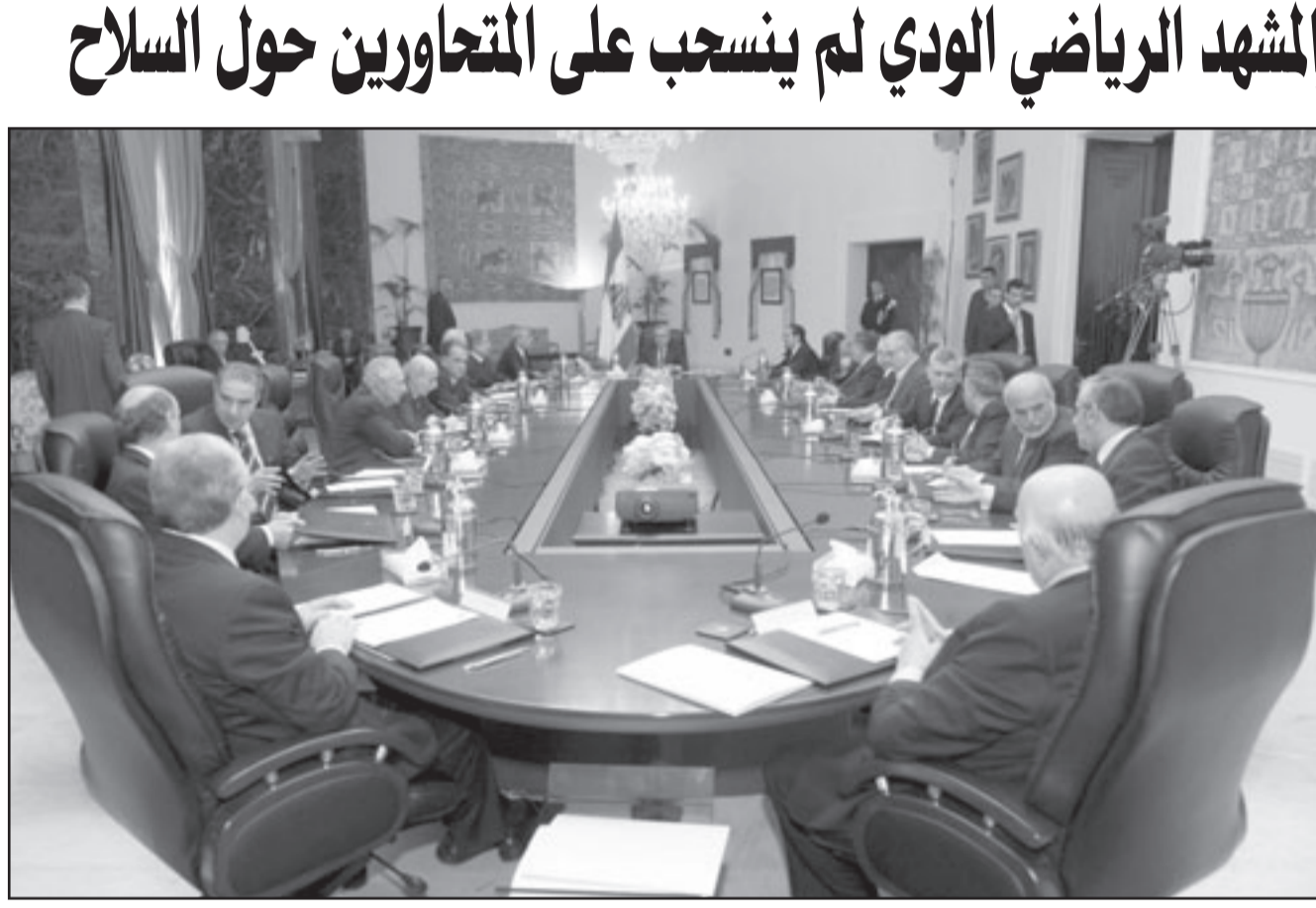
جانبا من طاولة الحوار في بيروت امس