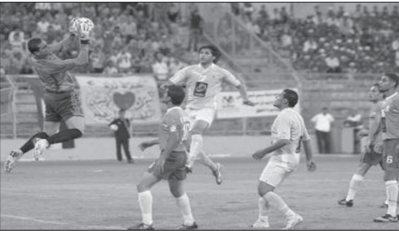
لقطة من مباريات دوري الاردن بين فريق الوحدات والفيصلي