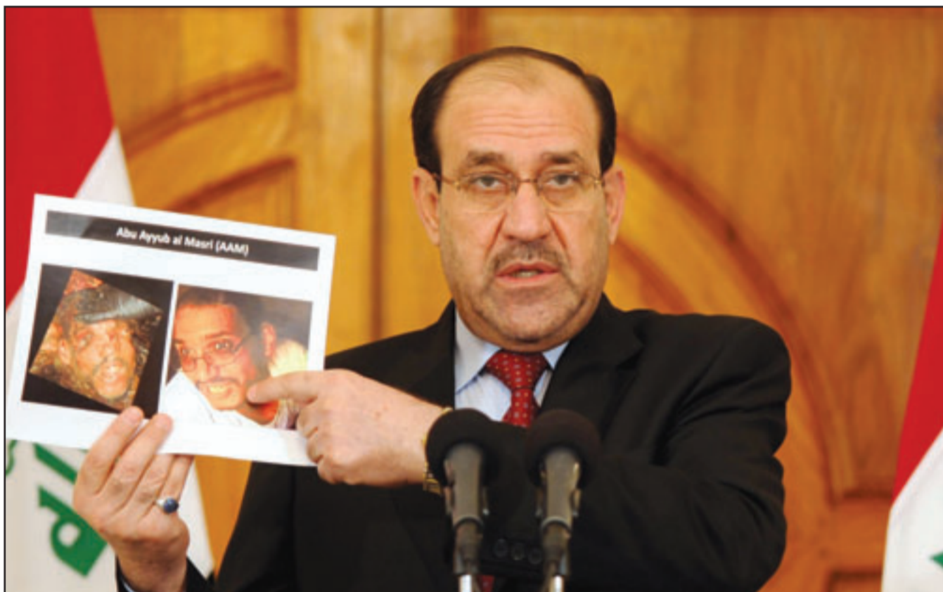
صورة مزعومة لتعاقد تنظيم القاعدة في العراق عرضها رئيس الوزراء المنتهية ولايته نوري المالكي كدليل على مقتله امس