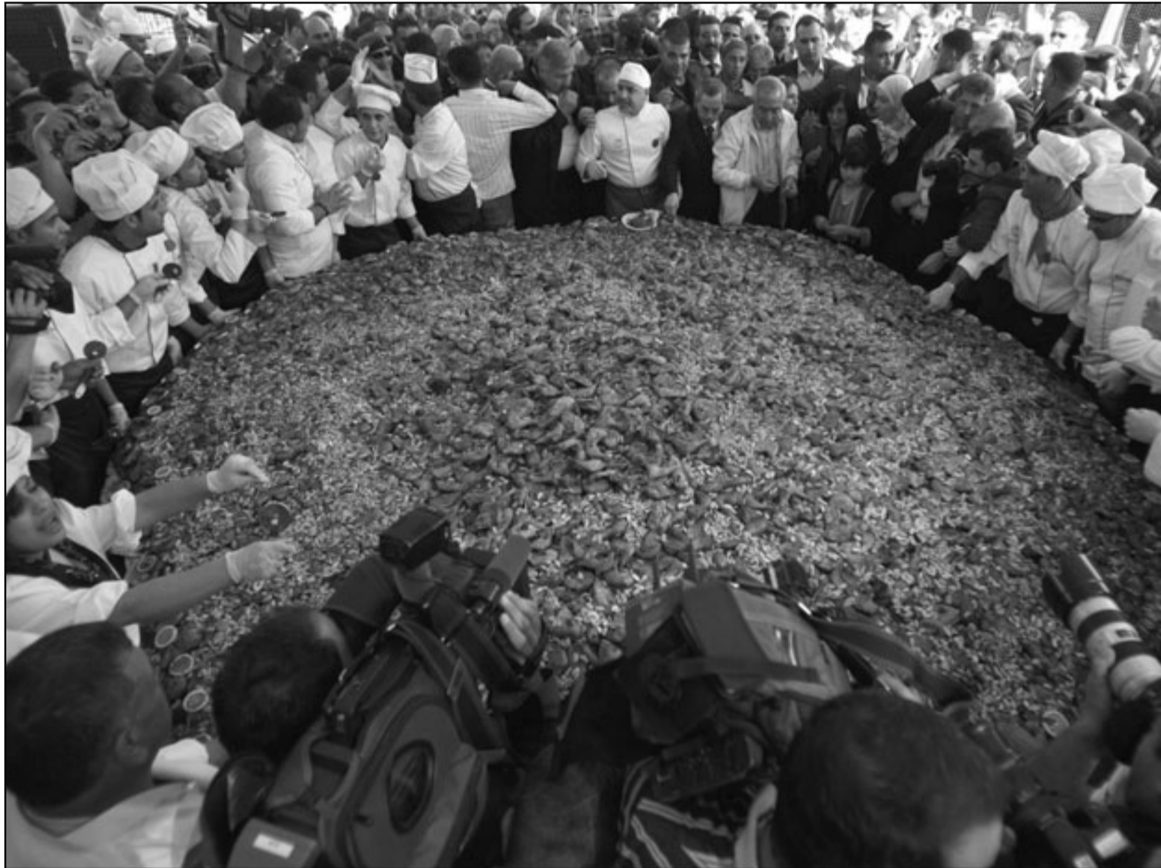
رئيس الوزراء سلام فياض وطهارة و اعلاميون فلسطينيون يلتقون حول طبل المسخن الذي تم اعداده في قرية عارورة امس

وتسبب هذا الاضطراب في تعطيل سفر نحو 30 ألف شخص في الرحلات المنظمة والشارتر، منهم نحو 12 ألف سائح، ما دفع السلطات التونسية المعنية بقطاع السياحة إلى تشكيل فرق متابعة لهذا الأمر. ويشار إلى أن الرماد البركاني الناتج عن ثوران بركان آيسلندا ما زال يثير الفوضى في حركة الطيران في أنحاء أوروبا، وشل حركة المسافرين في غالبية المطارات الأوروبية.