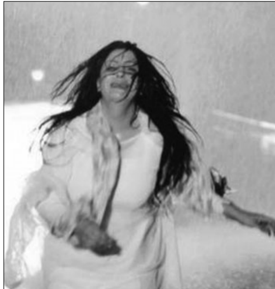
لقطة من مسلسل «للخفايا ثمن»