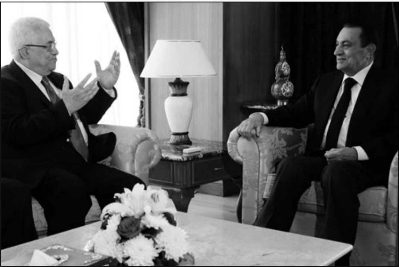
الرئيس المصري حسني مبارك لدى استقباله نظيره الفلسطيني محمود عباس في منتجع شرم الشيخ أمس

القاهرة - يوبي اي - د ب أ: لوح الرئيس الفلسطيني محمود عباس امس الاثنين باللجوء الى مجلس الامن الدولي اذا فشلت مساعي اعادة اطلاق مفاوضات السلام بين الفلسطينيين واسرائيل.