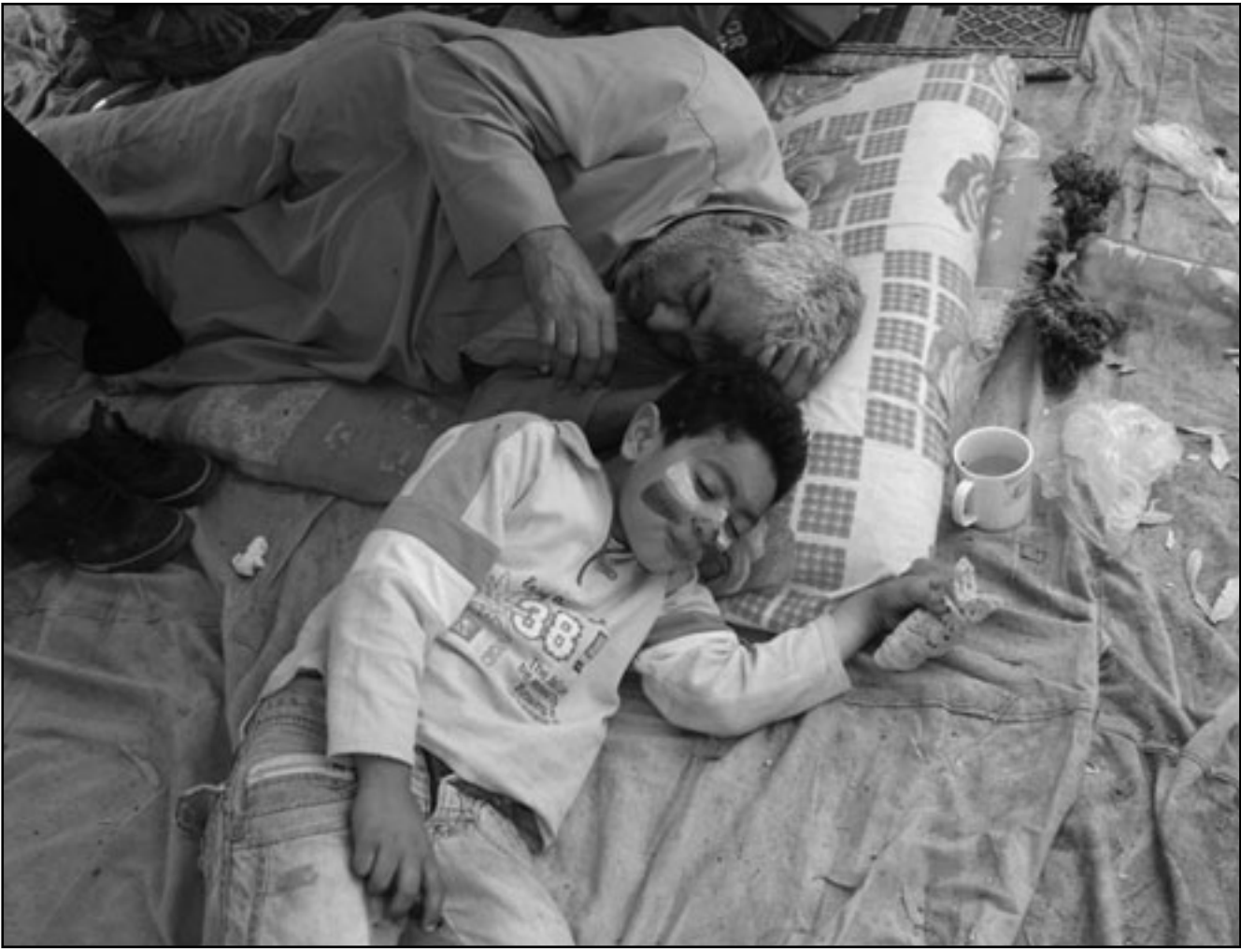
مصريان على الرصيف ضمن اعتصام بالقاهرة أمس (1 أيار)

سنوات وبعد ذلك لم يعد يرغب في تشغيلها، وهي تطلب مثل زملائها إعادة تشغيل الشركة وترفض اقتراح الحكومة بتشغيلهم «بعقود مؤقتة في الهيئة المصرية للاتصالات».