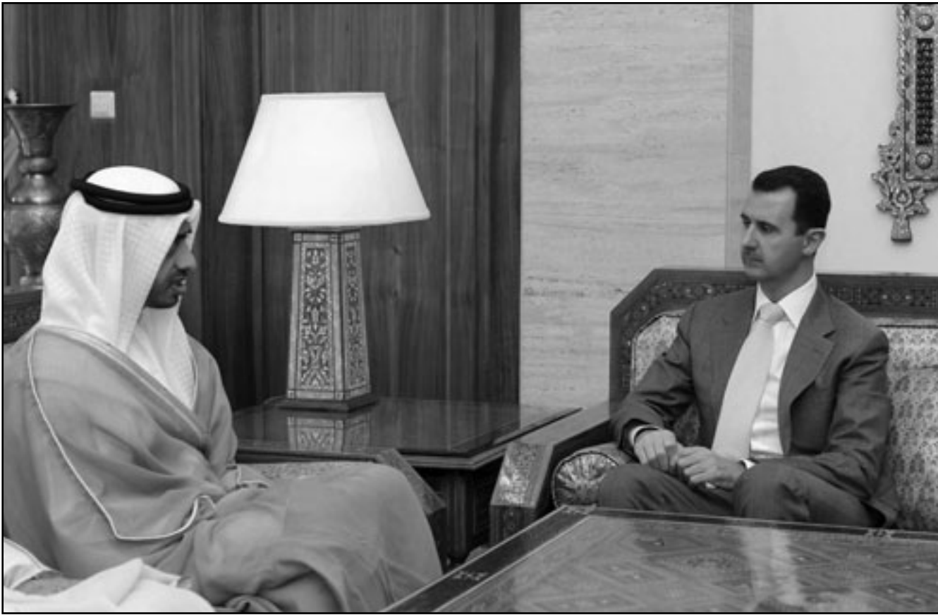
الرئيس السوري بشار الأسد لدى استقباله وزير الخارجية الإماراتي الشيخ عبد الله بن زايد في دمشق

وكانت سورية بدأت جهودها الأولى في قضية الجزر الإماراتية الثلاث من خلال زيارة قام بها في العام 1992م وزير الخارجية السوري آنذاك فاروق الشرع حاملاً رسالة من الراحل حافظ الأسد إلى نظيره الإيراني حينها هاشم رفسنجاني يعرض فيها الأسد وساطة سورية بين إيران ودولة الإمارات بعد أن كانت ذات الفكرة عرضت قبل ذلك على الجانب الإماراتي، وأعلنت سورية حينها أن إيران قبلت الوساطة السورية وأبدت في تسوية بالطرق السلمية دون استماع إلى النزاع. وتشير معلومات القدس العربي إلى أن الوزير عبد الله بن زايد آل نهيان وضع الأسد في صورة الأجزاء المستجدة على خط إيران-الإمارات