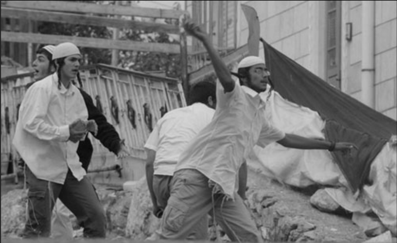
مستوطنون يرفشون الاحياء العربية

جميع المنظمات التي تكافح فعالها. أمانا تعبيرا عن ايديولوجية لا يمكن أن نسميها يسارية، بل يصعب أن نسميها يسارا متطرفا، ويخيل إلي أن اسم بعد صهيوني أو ضد صهيوني لا يلائمها. اسمها ايديولوجية كراهية دولة إسرائيل واليهود في إسرائيل، واسمي اصحاب هذه الآراء كراهي الإسرائيلي. هكذا ببساطة، بغير نفاق وبغير تيه مع تعريفات دور حول كلمة «يسار». سيقولون: الحديث عن قلة، لا يجب التآثر. أجل الحديث عن قلة، نكعب صغيرة جدا من المسم في الجسم خطر. وليس هذا فقط، فهذا اسم موجود في