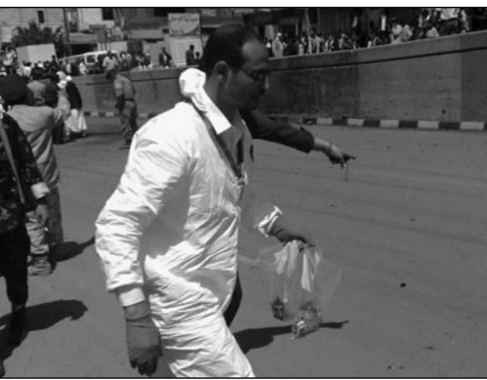
رجل أمن يجمع ائلة في موقع الهجوم على السفير البريطاني بصنعاء أمس

وقال ابو الغيط، في بيان إن إجراء الانتخابات مثل خطوة مهمة على صعيد تنفيذ اتفاق السلام الشامل.