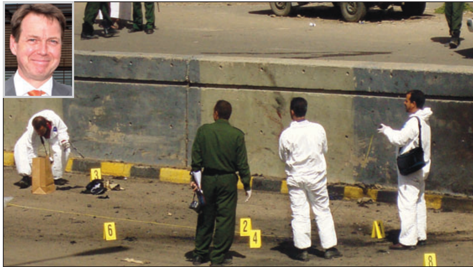
موقع الهجوم في صنعاء امس.. وفي الاطار السفير البريطاني تيم تورلوت