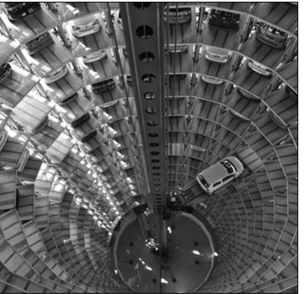
برج تخزين السيارات في مصنع فولكس فاغن الرئيسي في مدينة ولغسبيرغ بألمانيا

اما الدول الخاسرة فهي خصوصا اعضاء مجموعة السبع، وفي الدرجة الاولى اليابان (من 7.62% إلى 6.84%) وفرنسا وبريطانيا (اللتين انتقلتا كلتاهما من 4.17% إلى 3.75%) او ألمانيا ايضا (من 4.35% إلى 4.00%) وكندا (من 2.71% إلى 2.43%)، في حين لم تتغير حصص الولايات المتحدة (16.85%).