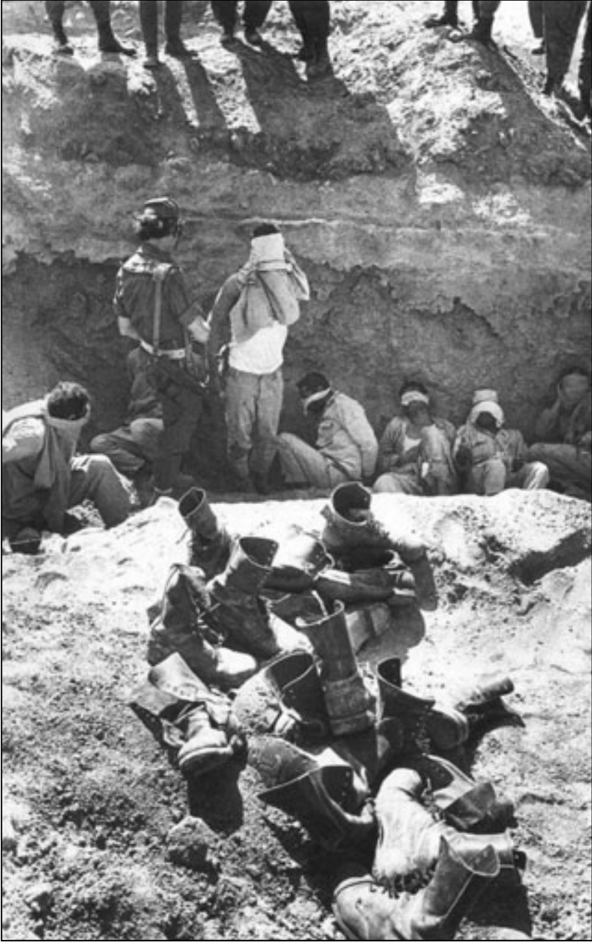
أسرى مصريون في حرب 73

بالكاميرا إلى عنان السماء هابطاً تدريجياً إلى الأرض في محاولة اجتهادية لإيجاد علاقة بين موطن جثث الشهداء في الأرض وأرواحهم الملحة على السماء، حيث الإشارة الرمزية إلى جنة الخلد، مضيئاً إلى ذلك التصور الإيماني الطرقي، قداسة الأرض وخلودها وقوران البحر وغضبه قياساً على المعنى المتضمن في اقتران السماء بالجنة، على اعتبار أن الأرض والبحر مرداناً للبقاء وثمناً غالباً للتضحية، أو ربما يتوارى المعنى بين طبقات الصورة الكلية ووجه الذاكرة حيث يسكن الشهداء على السماء، حيث الإقتران الرمزية التي يتاجر بها بعض المرتزة متناسين أن هناك أبطال شرفاء دفعوا أرواحهم سخاءً لاوطانهم قبل أن يريها أولئك الطامعين - الطامحين في التطبيع!