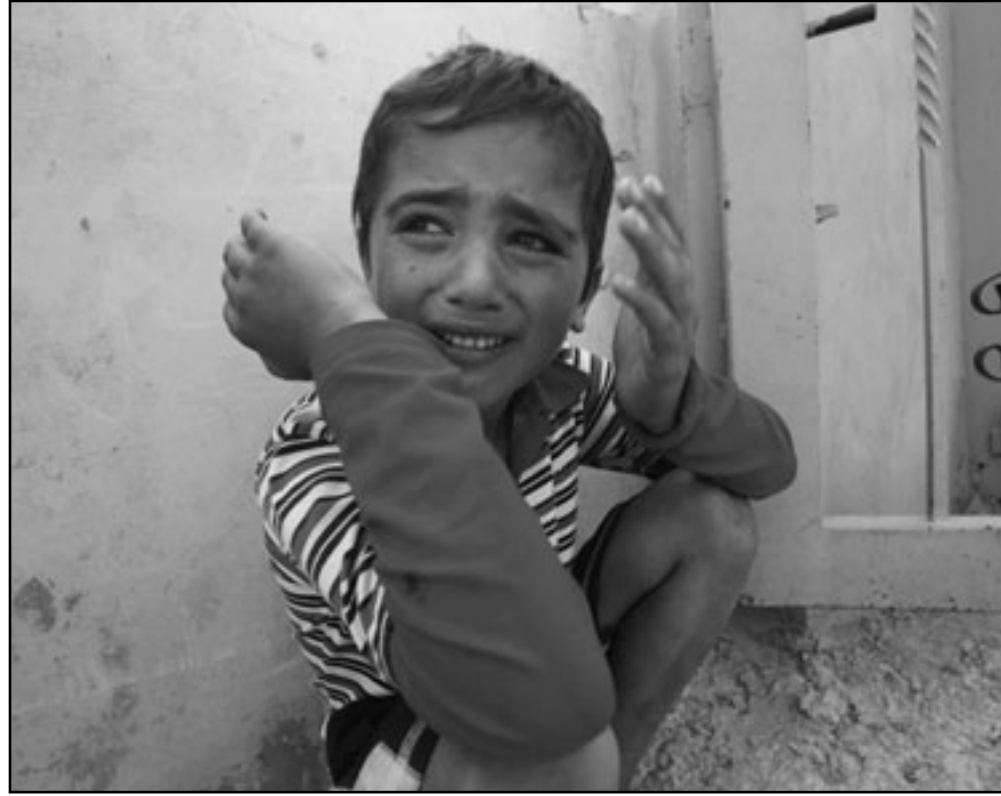
طفل فلسطيني يبكي خلال تشييع جثمان الشهيد