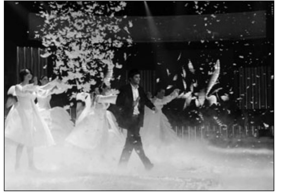
من حفل الاسبوع العاشر من «ستار اكاديمي»