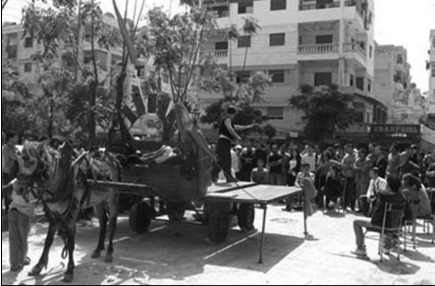
من عروض عربة المسرح (القدس العربي)