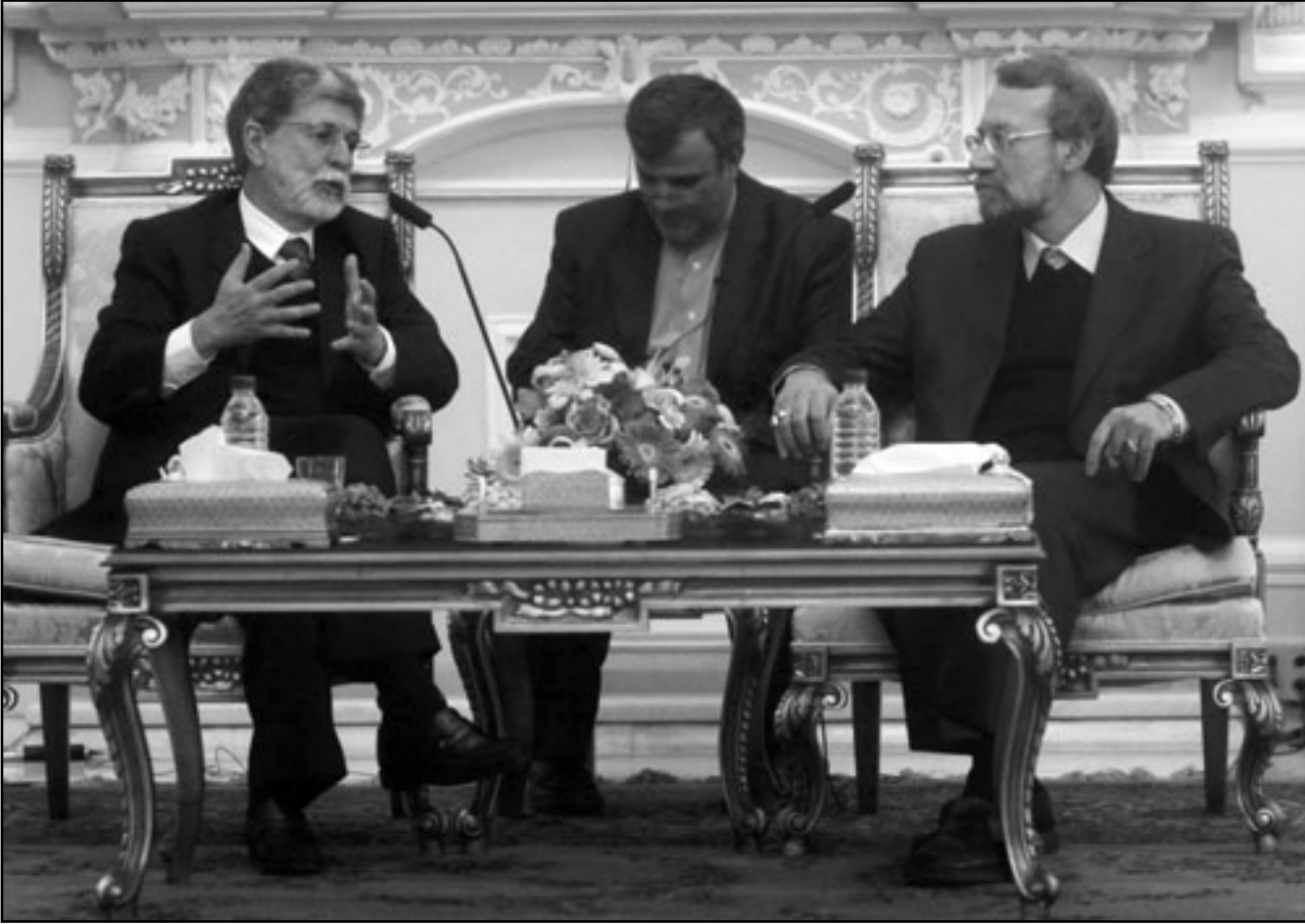
رئيس البرلمان الإيراني علي لاريجاني خلال اجتماعه بوزير الخارجية البرازيلي سيلسو أموريو في طهران أمس