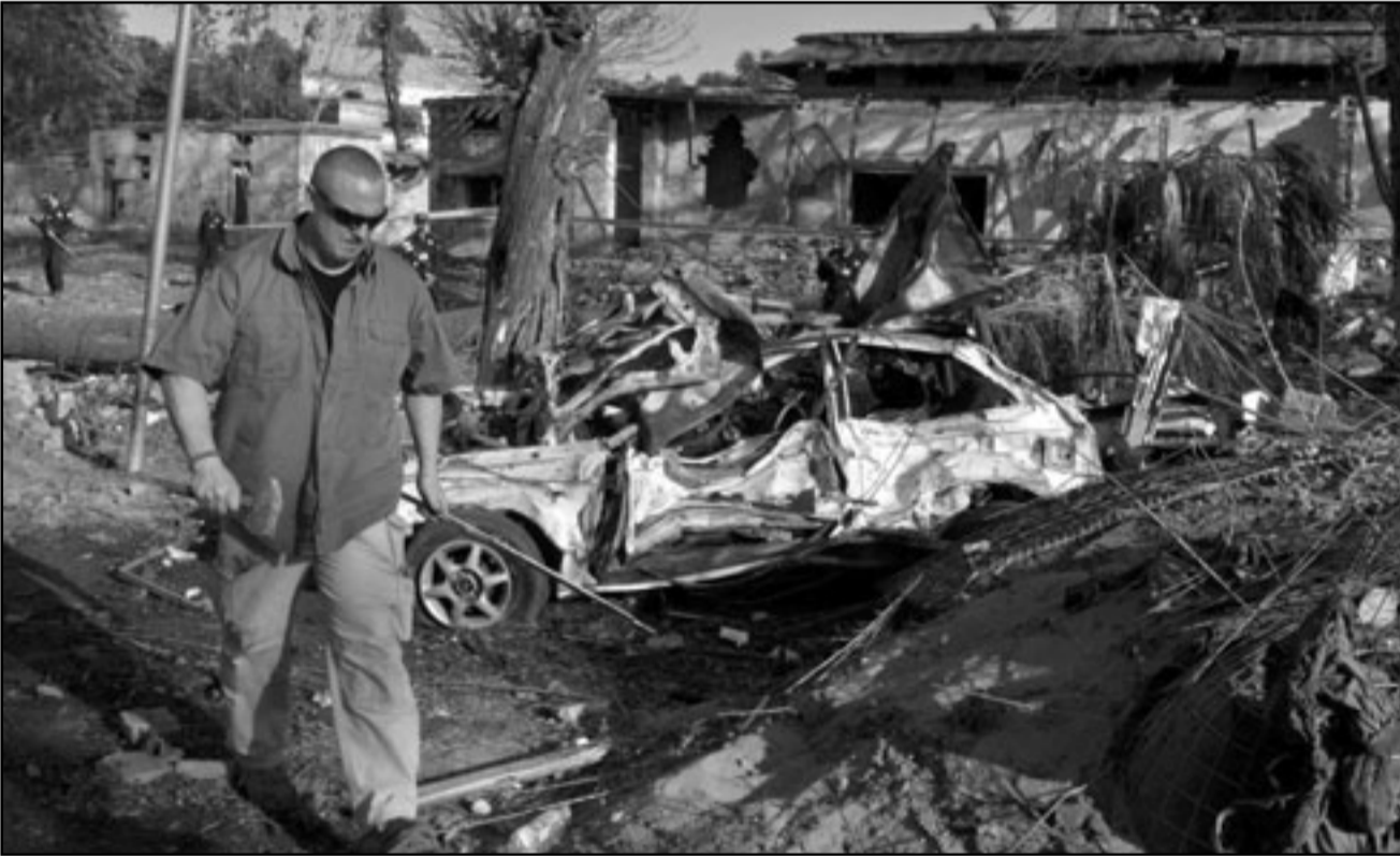
امريكا تدفع ثمنا دمويا لشراكتها مع اسرائيل

إن العمليات الكبيرة في ايلول/سبتمبر 2001 في نيويورك صورت احدث امريكية من حلقة، مهم تكن قريبة، الى دولة لحظ الامريكيون فيها قدرا من العداة من المصور. إن الجمهور، بتشجيع نشيط من عدد من كبار مسؤولي الحكومتين في القدس وواشنطن، حصر عنايته في التشابه بين الحركة الاسرائيلية مع الارهاب الفلسطيني الذي فوي في تلك الايام، وبين الحرب الامريكية التي كانت قد بدأت فقط، لشبكات الارهاب العالمية، بيد ان هذا القياس المكنن هو نتيجة