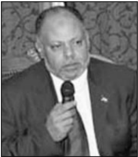
اسماعيل محفوظ وكيل وزارة المالية