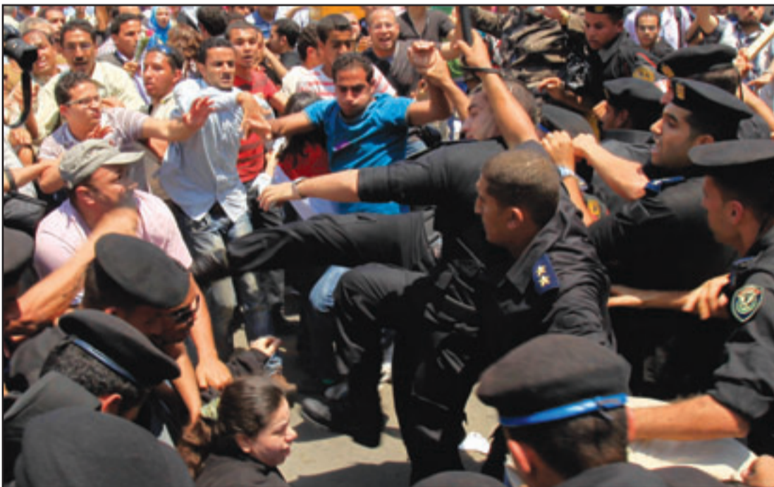
رجال شرطة مصريون يضربون ناشطين في مظاهرة الامس

رسالة إلى ممثلي القوى السياسية المشاركة في مسيرة 3 مايو هذا نصها: «أود أن أعرب لكم عن تقديري الصادق لحرصكم السلمي من أجل المطالبة بإنهاء حالة الطوارئ الجاثمة على صدورنا منذ عام 1981 والتي تحرم الشعب المصري من معظم حقوقه الأصلية في الحرية والكرامة. وقد وجه البرادعي المتواجد في واشنطن