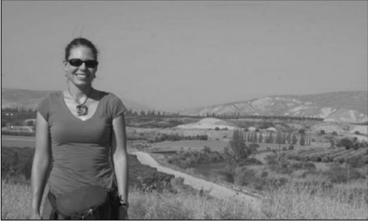
سائحة اجنبية في مضية الجولان

وذكرت وكالة الأنباء الرسمية «سانا» ان الجبهة استعرضت في اجتماع لها أمس الاثنين برئاسة سليمان قذاف نائب رئيس الجبهة السياسات المعادية للسلام التي تعتمد على توسيع الاستيطان وتهويد القدس وتهجير الفلسطينيين من أراضيهم ووجدت في الرهان على الوعد التي تتفق الى الصدفية وراها على اوهام خادعة علمتنا التجارب انها غير قابلة