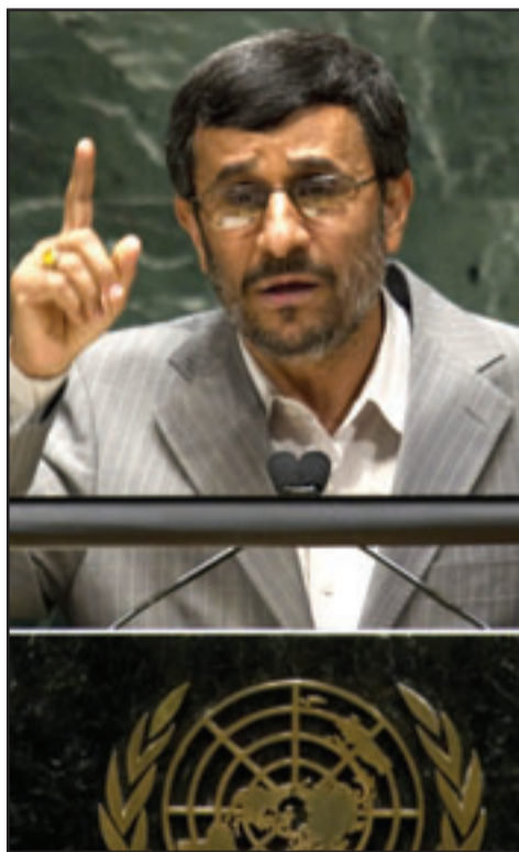
الرئيس الإيراني حمدي نجاد

النووي، وهو الذي من شأنه أن يزيد بلاده بالوقود لمفاعل بحثي في طهران. وأضاف: «إن الذين استخدموا القنبلة النووية وقتلوا مئات الآلاف وجعلوا مدينتين ناقضا وركاما هم اليوم الاناس الأكثر كراهية في التاريخ». وغادر مندوبو الولايات المتحدة وفرنسا وبريطانيا قاعة المؤتمر الخاص ببعاهدة الحد من الانتشار النووي بمقر الامم المتحدة أثناء اللقاء الذي حضره الرئيس الإيراني كلفته. وقد أثنى البيت الأبيض على مغادرة النديبين قاعة المؤتمر وقال ان المجتمع الدولي كان ينتظر من إيران أن تحترم التزاماتها الدولية. وقال البيت الأبيض أمس الإثنين إن الوفد الأمريكي انسحب أثناء كلمة الرئيس الإيراني محمود حمدي نجاد في الامم المتحدة بسبب «الاتهامات الجرافية». وقال روبرت غيبز المتحدث باسم البيت الأبيض إن الولايات المتحدة أرادت أن تتسرع بعهدا إيرانيا بتنفيذ التزاماتها النووية ولكن بدلاً من ذلك «اعتقد أن وفودنا وفودا أخرى كانت محقة بالمغادرة حيث لقيت سلسلة من الاتهامات الجرافية خلال الكلمة». وكان الأمين العام للأمم المتحدة بان كي مون قد دعا إلى عالم خال من الأسلحة النووية في كلمته خلال افتتاح أعمال المؤتمر. وطالب بان كي مون في افتتاح المؤتمر إيران بالامتثال بشكل كامل لقرارات مجلس الأمن والتعاون الكامل مع الوكالة الدولية للطاقة الذرية. من جانبه دعا المدير العام للوكالة الدولية للطاقة الذرية يوكيو أمانو إيران وسورية إلى التعاون مع الوكالة التي قال انها مازالت غير قادرة على التأكد من سلمية جميع الأنشطة النووية الإيرانية.