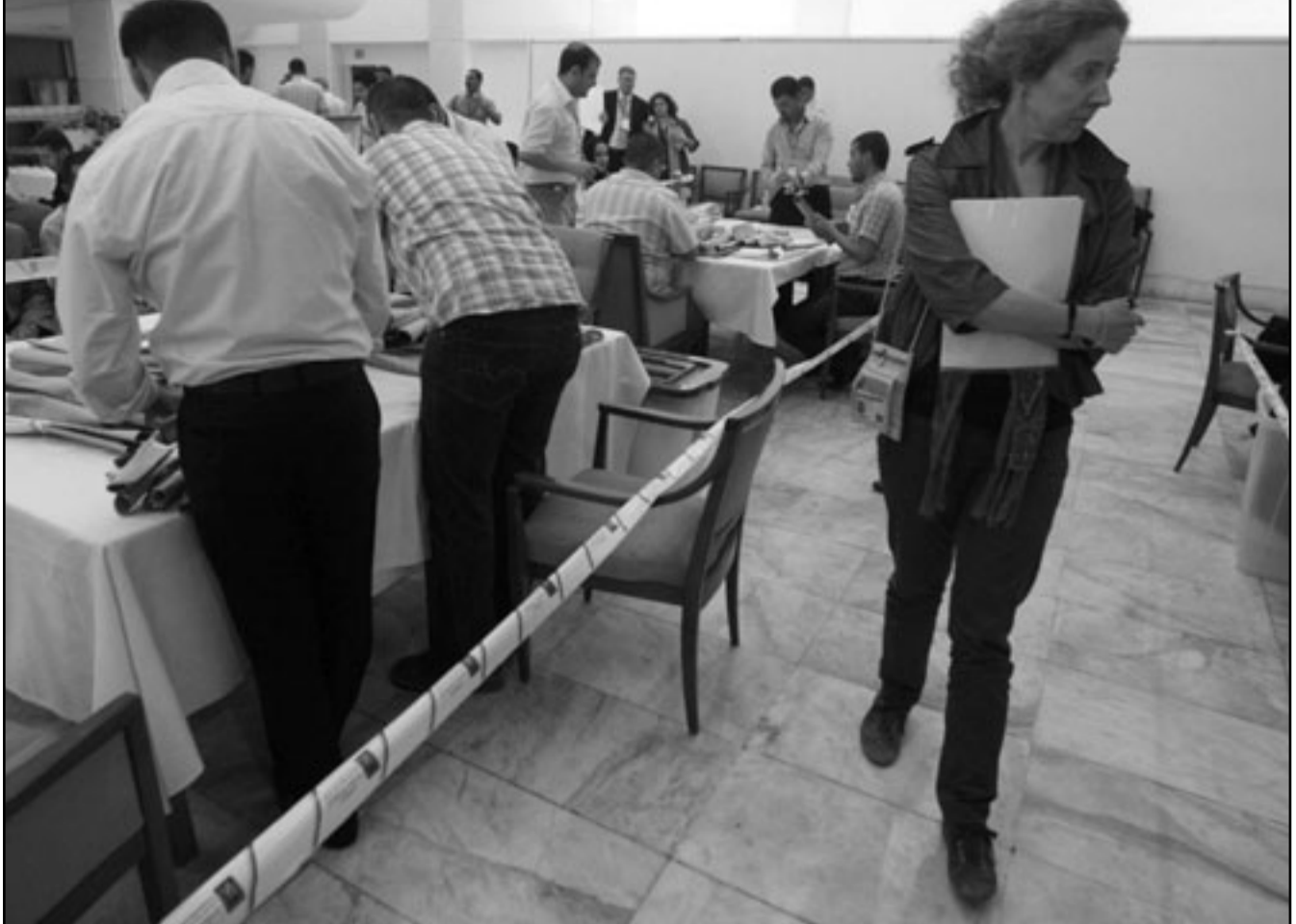
مراقبة دولية تتابع عملية اعادة فرز الاصوات في فندق الرشيد ببغداد امس