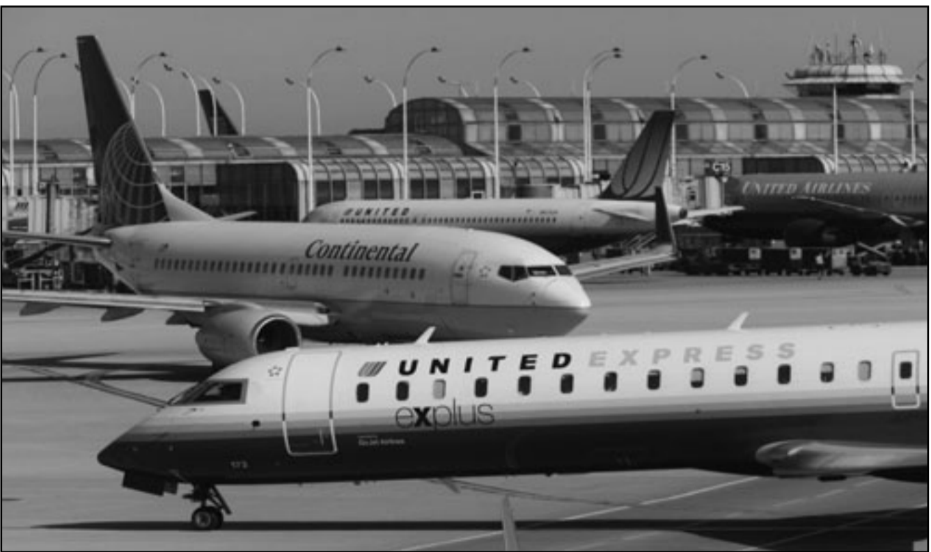
ثلاث طائرات تابعة لشركتي يونايتد وكونتنتال في مطار اوهرير في شيكاغو

الدولية للشركتين. وسيكون للشركة المندمجة عشرة مراكز عمليات أكبرها في هيوستون وقوة عمل قوامها نحو 90 ألف فرد. وقالت الرابطة الدولية للغربيين وموظفي الطيران في بيان انها قلقة بشأن أثر الاندماج على الأجور والأمن الوظيفي لأكثر من 26 ألف عضو لها في الشركتين.