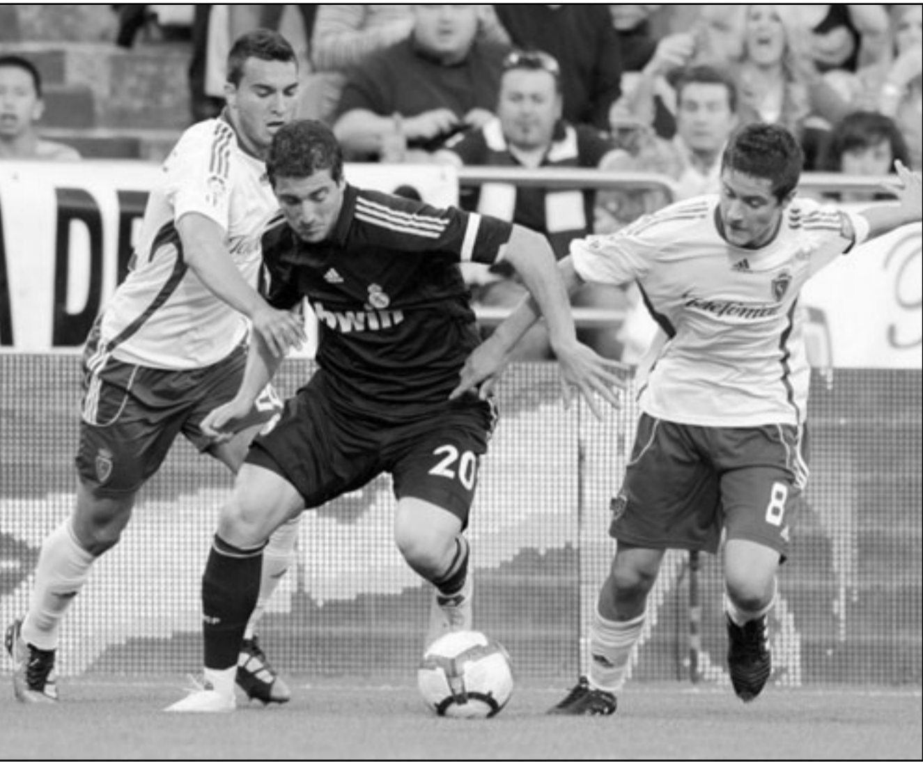
جوانزالو هيجونيان نجم ريال مدريد (وسط) يحاول الفوز بالكرة من بين اقدم لاعبي زاراغوزا

عادت السيطرة لاشبيلية بفضل ركنتي جزاء مثيرين للجدل نفذهما الفارو نيجريديو بنجاح في الدقيقتين 12 و 39 على الترتيب ليحصل الفريق على دفعة معنوية قبل مواجهة اشبيلية في الدقيقة الخامسة ثم أدرك البرتغالي تياجو التعادل لاشبيلية من ركلة حرة سريعة.