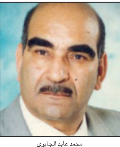
محمد عابد الجابري

«أقلام» (منذ تأسيسها سنة 1964 إلى حين توقفها سنة 1983) ومجلة «فكر ونقد» التي صدر عددها الأول عام 1997. وعرف عن الجابري اعتزاده عن عدم قبول جوائز عدة، من بينها: جائزة المغرب للكتاب، وجائزة صدام حسين، وجائزة الشارقة، وجائزة العقيد القذافي لحقوق الإنسان. كما اعتذر عن اقتراح اسمه من لدن السلطات العليا بالمغرب لعرضه أكاديمية المملكة المغربية.