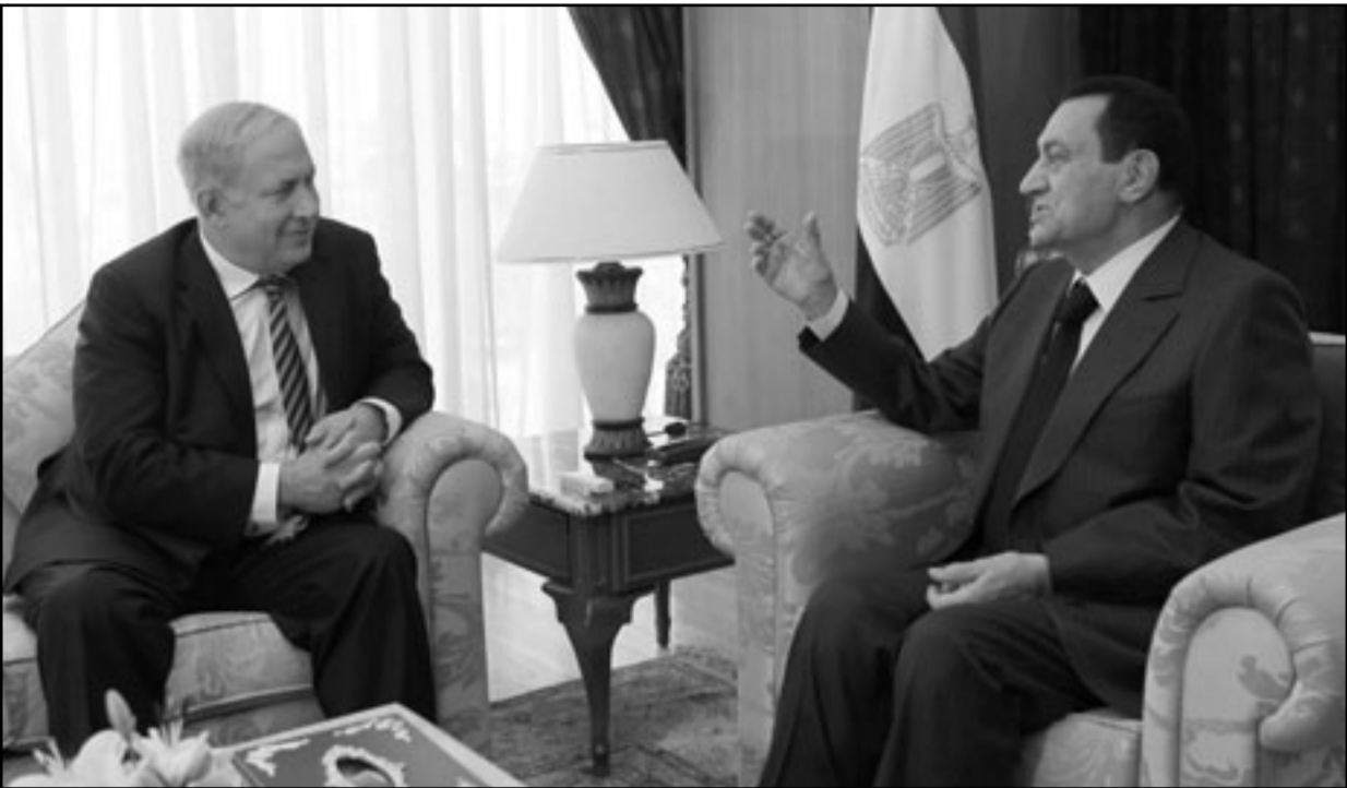
الرئيس المصري حسني مبارك لدى اجتماعه برئيس الوزراء الاسرائيلي بنيامين نتنياهو في شرم الشيخ امس