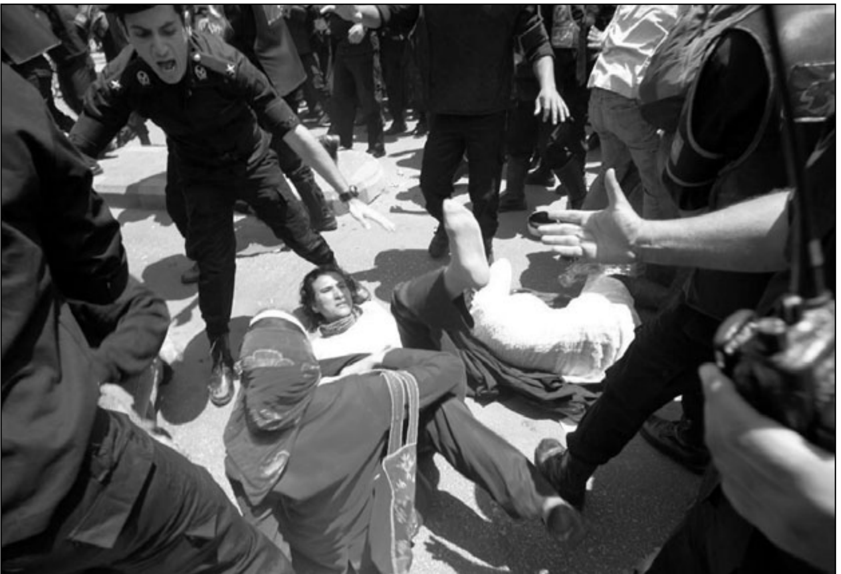
عناصر من الشرطة المصرية تضرب متظاهرا في القاهرة أمس