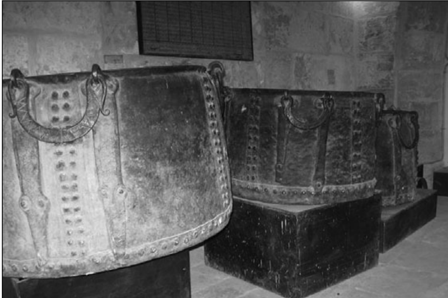
بعض القدر الوضحة

أقراص منقوشة ومفوس حجرية وكؤوس، و آثار من الحضارة الواقعة بين «يافا والقدس» كما كان من نتائج التنقيبات الأثرية «تنقيبات مجدو»، تل المنسل - التي تعود إلى العصر البرونزي القديم، كما عرضت أوان حجرية عليها تأريخات أثرية، وأوان فخارية وقالب لسكب الحلي العدينية، وصعود ذات لون رمادي، وهناك عدد كبير من الفول، ومن آثار العصر البرونزي الحديث، هناك كؤوس ذهبية وقصبة من «تل العجول» بالقرب من مدينة غزة ومخبر من «بيسان»، كما عرض في القاعة الثامنة الجنوبية نصب من البازلت التي الفرسون المصري ستي الأول يعود إلى عام 1313 ق.م وهي النصب الأولى من حكمه، كما عرض كتابه جيري غولفيلد وقد وجد هذا النصب في بيسان، كما عرض تمثال رمسيس الثالث (1177-1198 ق.م)، كذلك عرضت في الجناح الجنوبي نماذج من المواد الأثرية ولوجية منها جمجمة من الجليل وتعتبر هذه الجمجمة من أقدم النماذج للعرافة لجنس جيل الكرميل قريبا يعود إلى ما قبل حوالي 20000 عام قبل الميلاد، كما عرضت بقايا إنسان الكرميل الذي يعود إلى ما قبل 10000 عام قبل الميلاد، وكذلك عرضت في الجناح الجنوبية خشبيات إسلامية محفورة من القرن الثامن من الجاهلية الأخرى، وفي الغرفة الأثرية عرضت نماذج من منحوتات على طين عليها من التنقيبات التي جرت في قصر هشام بن عبد الملك في خربة المجر، وعرضت حلي عثر عليها في غزة ومنطقها وحلي من عهد الهكسوس في القرن الثامن عشر قبل الميلاد، وحلي من الفترة الرومانية وأخيرا حلي القرنين البيزنطية والعربية، أما في الغرفة الشمالية والجناح الشمالي فقد عرض بعض الزخارف التي تلتفت من قبضة القبر المقدس، «أعداد المشاة ودخول القدس»، وبعض الآثار التي تعود إلى العصر البرونزي وهي فخار خشن ردي الصنعة، عاجيات