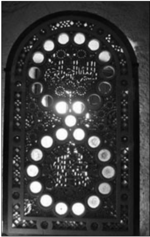
نافذة زجاجية ملونة - المتحف الإسلامي

من تنقيبات مجدو، صندوق عاجي مزين بأسود وأبي الهول، وعناصر زيبائية على شكل شجرة الخليل، وقطعة عاجية عليها مشهد يستعرض فيه المصريون أسراهم من الآسيويين، تعود هذه العجايات إلى عهد رمسيس الثالث (القرن الثاني عشر ق.م)، وجزء من تمثال برونزي يعود إلى رمسيس الرابع عليه كتابات هيروغليفية.