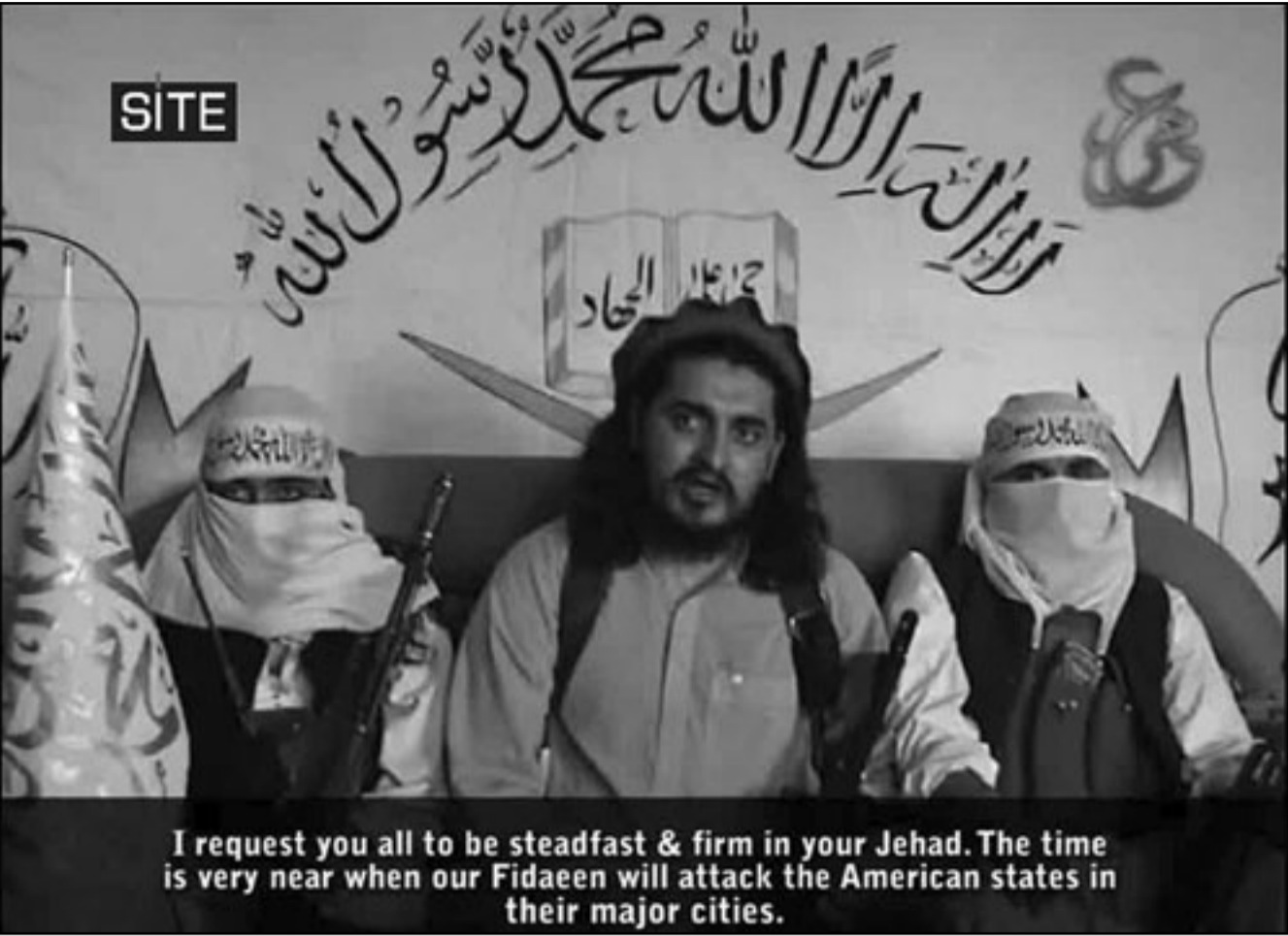
زعيم طالبان باكستان حكيم الله محسود في شريط الفيديو الذي بث اخيرا

موريل «ليس لدي بالتأكيد اي دليل على ان الشخص الذي تحدثون عنه لا يزال يقوم باي تحرك اليوم او بنفذ او يمارس سلطة على حركة طالبان باكستان كما فعل في السابق». و اضاف «لا اعلم ما اذا كان ذلك يعني انه حي او ميت لكن من الواضح انه لم يعد يتولى قيادة حركة طالبان الباكستانية».