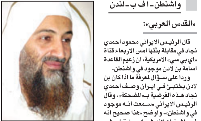
الشيخ اسامة بن لادن

القدس العربي: قال الرئيس الايراني محمود احمدي نجاد في مقابلة بثتها امس الاربعاء قناة «اي بي سي» الأمريكية، ان زعيم القاعدة اسامة بن لادن موجود في واشنطن. وردا على سؤال معرفة ما اذا كان بن لادن يختبئ في إيران وصف احمدي نجاد هذه الفرضية بـ«المضحكة»، وقال الرئيس الايراني «سمعت انه موجود في واشنطن»، وواضح «هذا صحيح انه موجود في واشنطن لأنه شريك سابق لبوش. كانا زميلين. تعاونوا في مجال النفط وعلا معا، ولم يتعاون بن لادن يوما مع إيران لكنه تعاون مع بوش» من دون ان يحدد ما اذا كان يتحدث عن الرئيس الأمريكي السابق جورج بوش الاب او جورج بوش الابن (1993-2001). وتابع بجدي «كونوا اكديين انه في واشنطن. هناك احتمالات كثيرة ان يكون هناك...». وتناولت وسائل اعلام غربية أخيراً خبراً عن وجود زعيم تنظيم القاعدة في العاصمة الإيرانية طهران، ونشرت صحيفة «الغارديان» تقريراً مصوراً يؤكد اتخاذ اسامة بن لادن العاصمة الإيرانية مقراً له، ويتابع هناك حياته اليومية ويقوم بممارسة هوايته المفضلة، أي الصيد بين الحين والآخر.