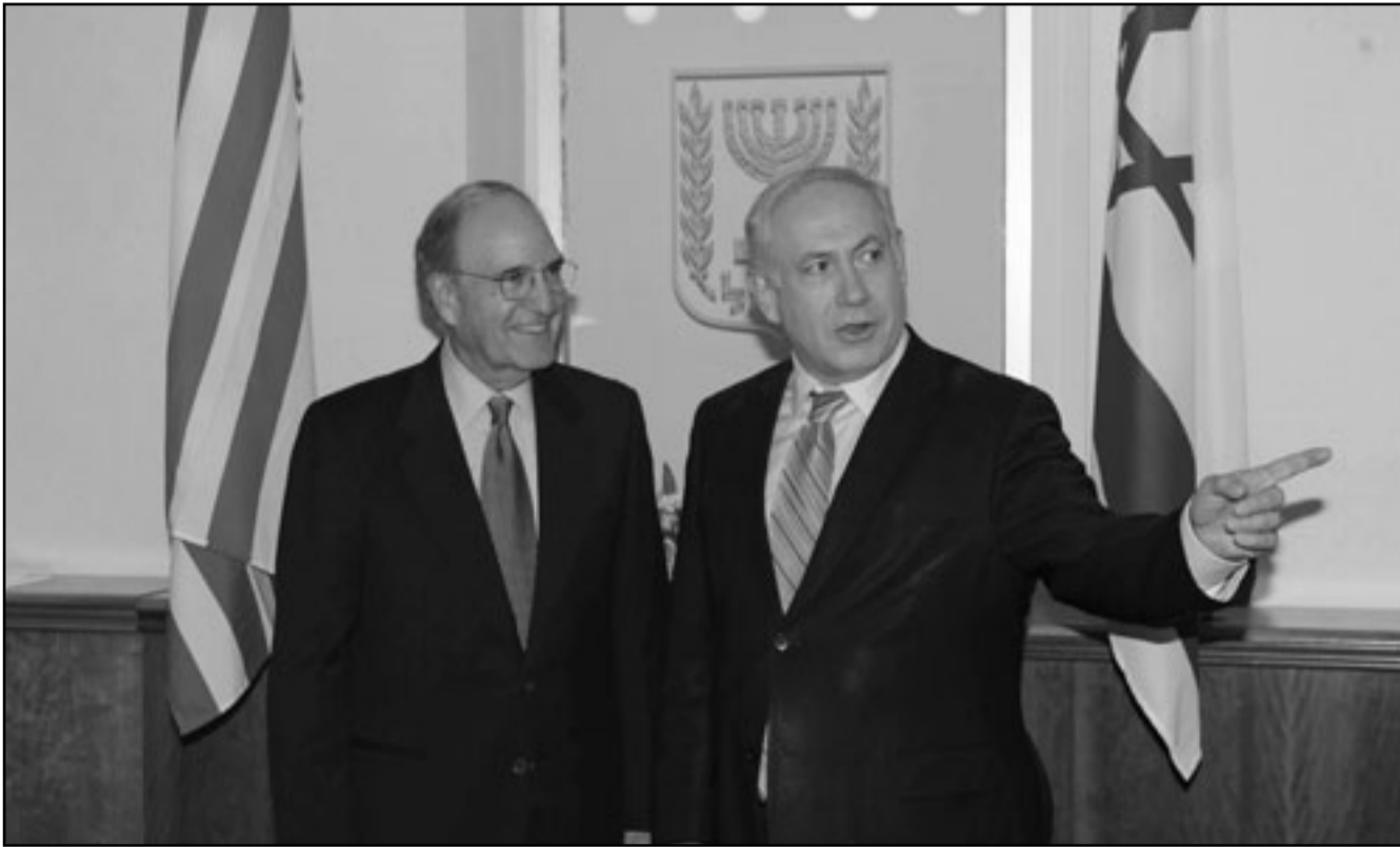
رئيس الوزراء الاسرائيلي بنيامين نتنياهو خلال اجتماعه مع المبعوث الامريكى الخاص جورج ميتشل

لكن يجب ضمان حرية الحركة لآبناء جميع الديانات في المدينة. وأكد شرطيت أنه يقبول اسرائيل لمبادرة السلام العربية سيتم تطبيع العلاقات بين اسرائيل والدول العربية.