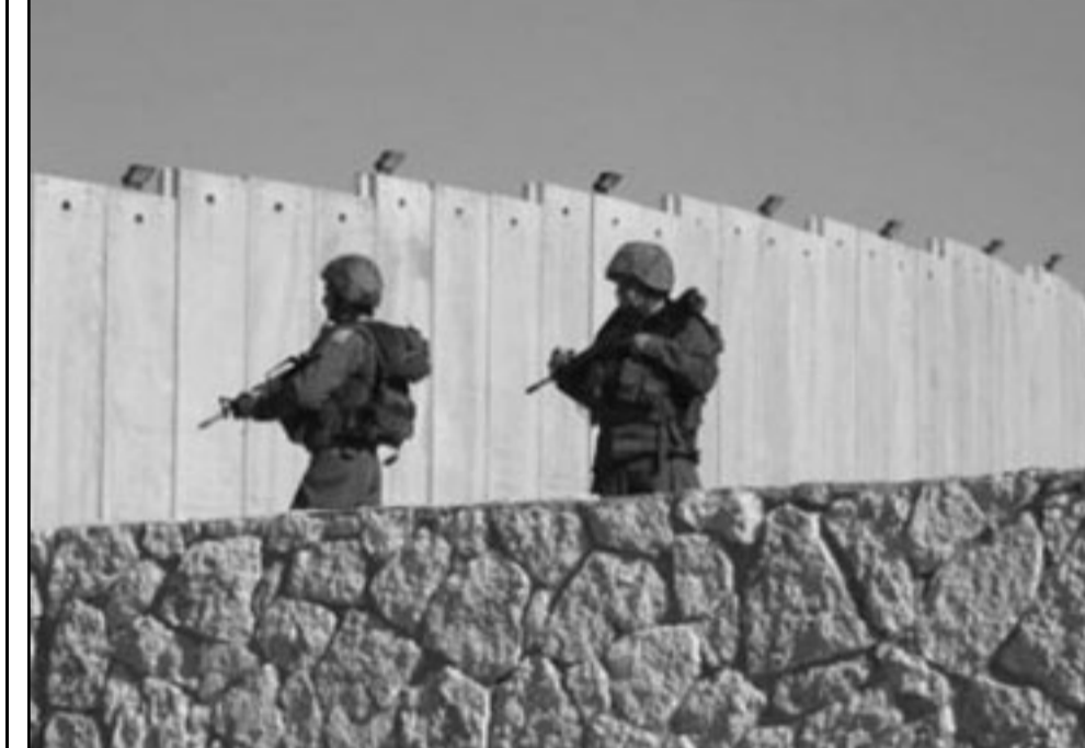
الجدار يفصل الاحياء الفلسطينية عن ماضيها ومستقبلها

الضخمة بلا طيار. كثيرون جدا الناس في اسرائيل الذين يئبغي ارغامهم على محو برامج جهاز السيطرة والهدم، قبل أن يثور بعيد عيه ومستعمله والراجين منه أي نحن جميعا.