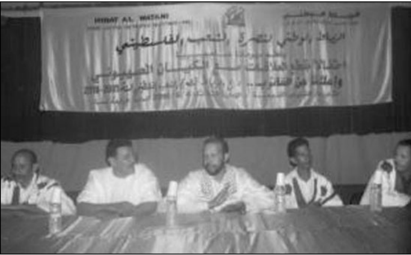
جانب من ندوة لنصرة الشعب الفلسطيني في موريتانيا

ربطها ولد الطابع وقاومها الجميع.. وفاز ولد عبد العزيز بشرف قطعها