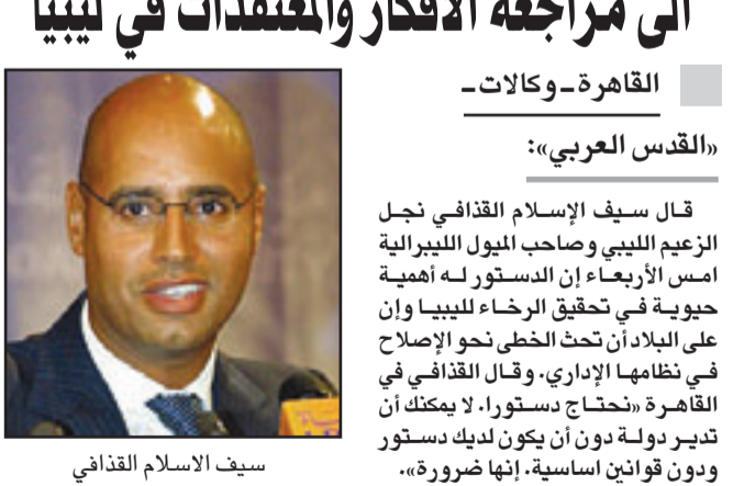
سيف الاسلام القذافي

القدس العربي: قال سيف الإسلام القذافي نجل الزعيم الليبي وصاحب البيول الليبرالية امس الأربعاء ان الدستور له أهمية حيوية في تحقيق الرخاء الليبي وان على البلاد ان تحت الخطى نحو الإصلاح في نظامها الإداري، وقال القذافي في القاهرة «نحتاج دستوراً، لا يمكننا ان تدير دولة دون ان يكون لديك دستور ودون قوانين اساسية. إنها ضرورة». وتقول مصادر قريبة من الدوائر الحاكمة ان سيف الإسلام الذي تلقى تعليمه في مدرسة لندن للاقتصاد امضى سنوات ينشئ صورته كإصلاحي كما انه يسعى الى جمع التأييد من أجل دستور ليلاذ لكنه يواجه مقاومة من متشددين من اصحاب المصالح في بقاء النظام الحالي على ما هو عليه. وقال ليبي على صلة بدائرة سيف الإسلام ان نجل الزعيم الليبي يخطط لمسعى جديد في الأشهر القليلة القادمة لوضع دستور. وقال سيف الإسلام «يجب مراجعة