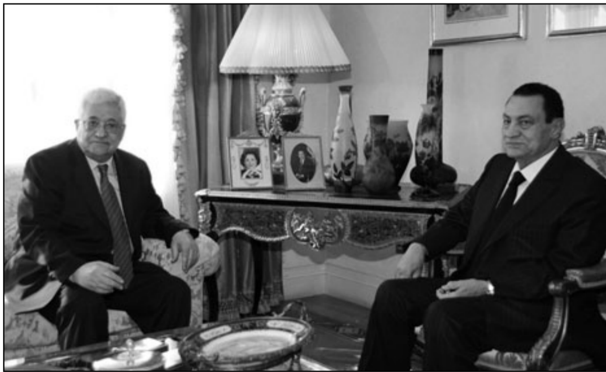
الرئيس المصري حسني مبارك خلال اجتماعه مع الرئيس الفلسطيني محمود عباس

الجمود، ومن المتوقع استئناف المحادثات الصعبة بين الاسرائيليين والفلسطينيين في الايام المقبلة بعد الضوء الاخضر الذي اعطته الجامعة العربية السبت للرئيس الفلسطيني محمود عباس.