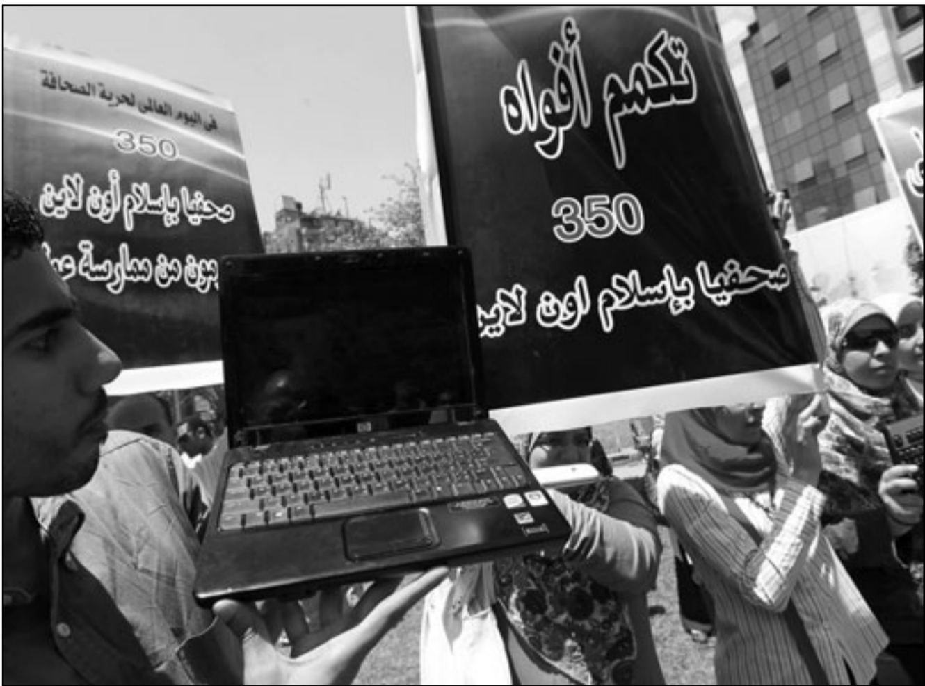
صحافيون مصريون من العاملين في موقع (إسلام أون لاين) يتظاهرون في القاهرة أمس احتجاجا على اغلاق الموقع في العاصمة المصرية