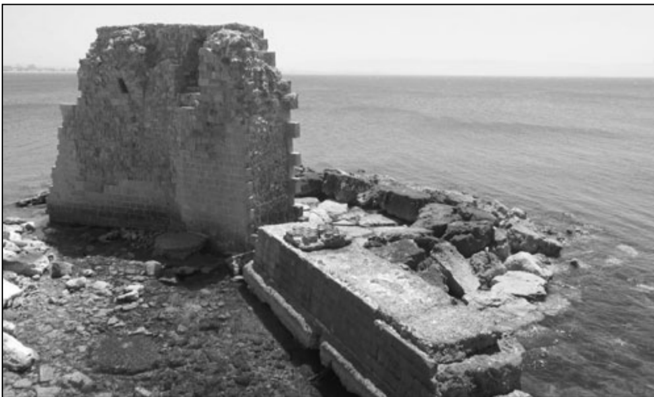
حي يابور في عكا

تضعها البلديات والسلطات الحكومية والهادفة إلى تشريد وترحيل سكانها العرب. ومن خلال البحث والتجول في المدينة يتوصل الإنسان إلى استنتاج خطير وهو أن المخططات والجهود والميزانيات المبرودة من أجل تكريس الهوية اليهودية ومحو الصلة بين هذه المدن والعرب الفلسطينيين قد قطعت شوطا كبيرا.