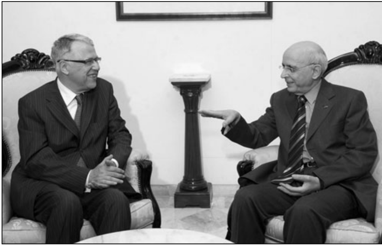
رئيس الوزراء المغربي عباس الفاسي (يسار) خلال المحادثات مع نظيره التونسي محمد الغنوشي في تونس أمس

لجنة العليا المشتركة التونسية المغربية، وستتمحور حول بحث ومناقشة آفاق تعزيز العلاقات الثنائية، لجهة تفعيل التعاون في مختلف المجالات لتحقيق تشابك الصالح والتكامل الاقتصادي.