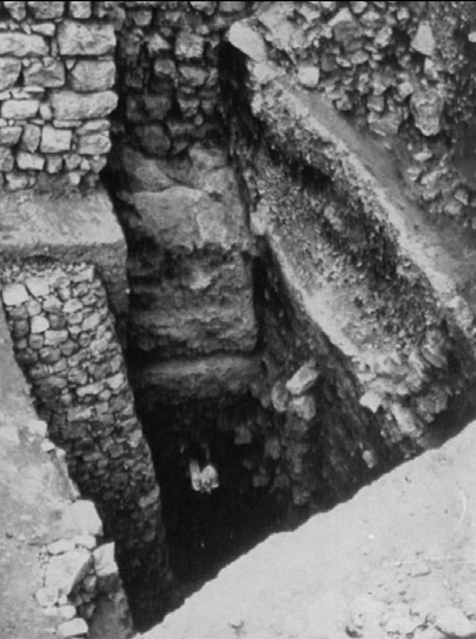
مقطع من الفخرات التي تمت في القدس ما بين عام 1960-1967

كما أنجز العديد من الأفلام عن القدس بثت في عدة محطات عالية، إضافة لبرنامج (الفن الإسلامي في القدس) في 15 حلقة، (زهرة المائات) 27 حلقة، وهو الآن يصدر الإصدار 30 حلقة عن الفن والعمارة في القدس.. بالتعاون مع تلفزيون القدس التربوي.