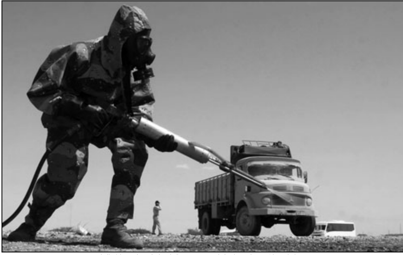
جندي إيراني خلال تدريبات عسكرية على حرب جراثومية وكيميائية على شواطئ الخليج

المرحلة الثانية من التدريب تركز على مواجهة هجمات كيميائية وجراثومية مفترضة إيران تجري مناورات جديدة بالخليج مع توتر ملفها النووي