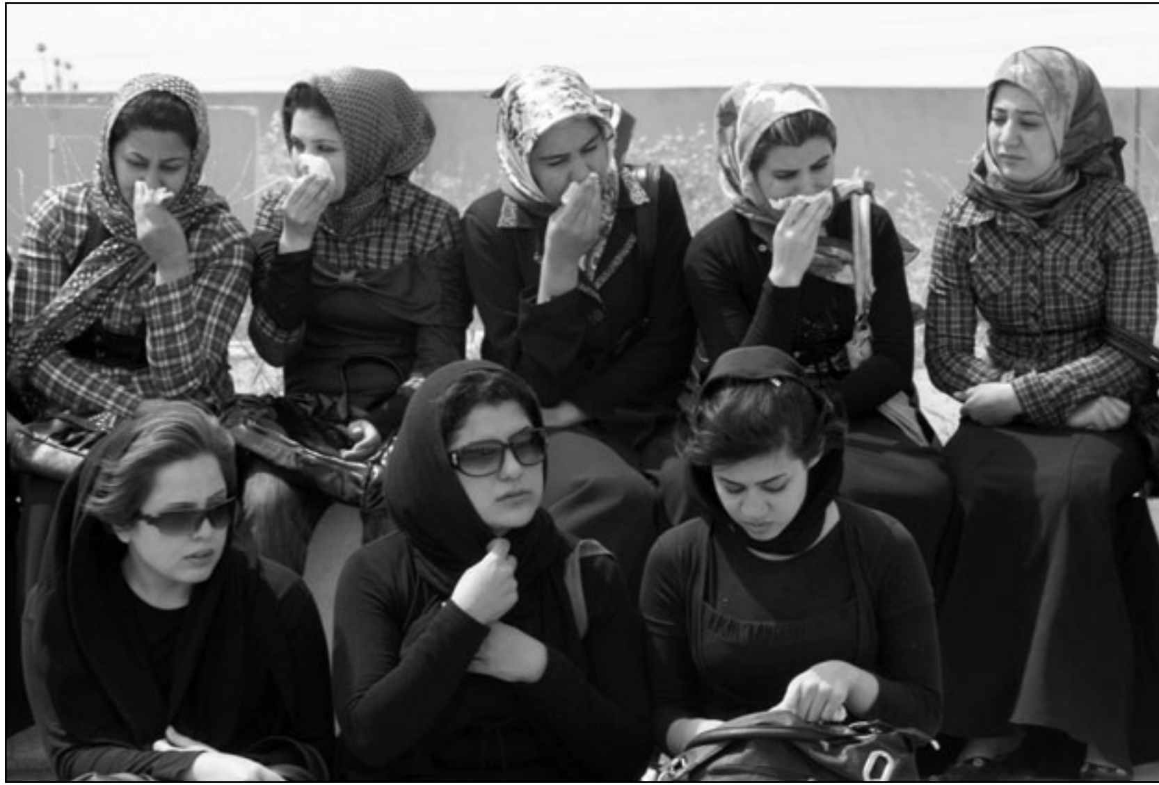
قربيات لصحافي كردي يبكيه بعد العثور على جثته امس الاول