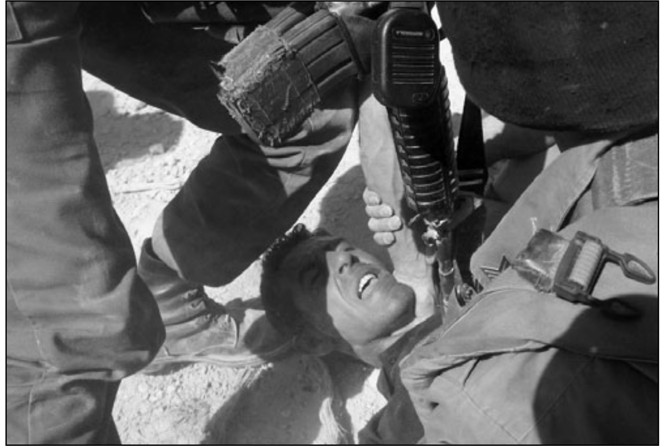
جندو اسرائيليون يعتقلون فلسطينيين خلال احتجاج لمنع الجرافات الاسرائيلية من تسوية اراض فلسطينية لضماها للجدار العازل في قرية الوجة في منطقة بيت لحم