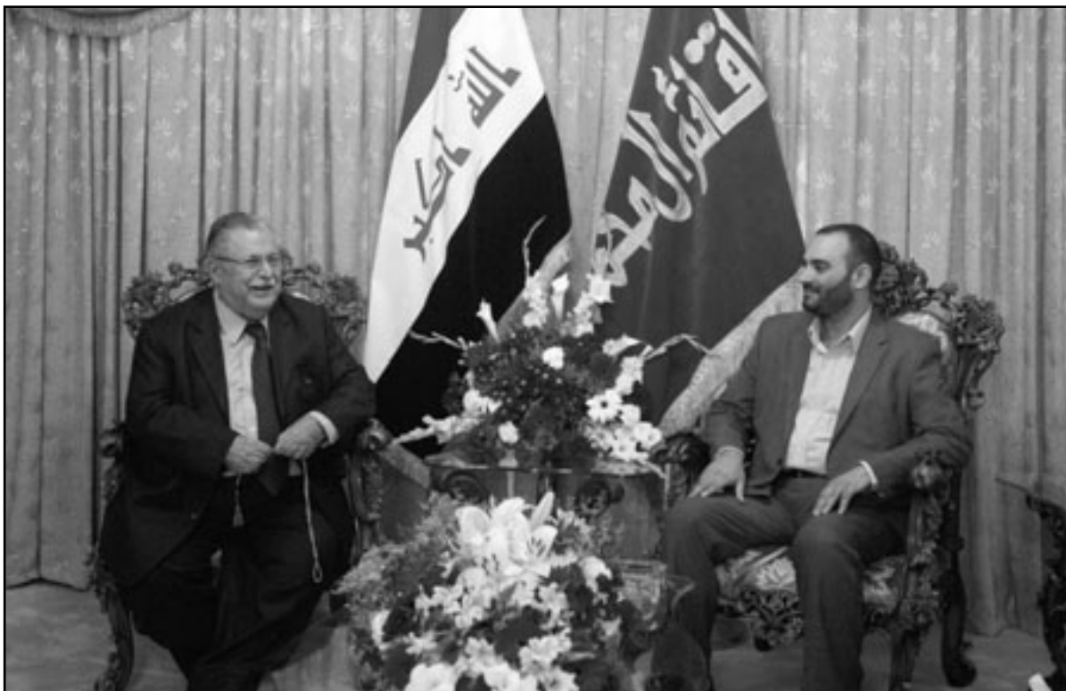
الرئيس العراقي جلال الطالباني اثناء استقباله كزار الفخاخي رئيس المكتب السياسي للتيار الصدري

■ النجف (العراق) - ا ف ب: اعلن التحالف الكردستاني وقوفه الى جانب الائتلاف الشعبي المكون من قائمتي دولة القانون والائتلاف الوطني العراقي وموافقته على اي مرشح يقدمه الائتلاف الذي بات يشكل اكبر كتلة برلمانية منبثقة عن انتخابات آذار/مارس. وقال عضو التحالف الكردستاني روش نوري ساويش بعد لقائه المرشح الشعبي الكبير اية الله علي السيستاني في النجف جنوب بغداد، ان «التحالف الكردستاني متمسك بتحالفاته القديمة التي اادت الى بناء العملية السياسية وتشكيل الحكومة السابقة وكتابة الدستور»، وبعد حزب الدعوة بزعامة رئيس الوزراء نوري المالكي والمجلس الاعلى الاسلامي بزعامة عمار الحكيم من ابرز حلفاء الاكرا. و اعلن ائتلاف دولة القانون والائتلاف الوطني تحالفهما الثلاثاء، فيما يشغلان 159 مقعداً ويشكلان الكتلة الاكبر في البرلمان الذي يضم 325 مقعداً. وكان التحالف الكردي بين الحزبين الكرديين الرئيسيين في اقليم كردستان الذي حصل على 43 مقعداً، اعلن في وقت سابق انه سيضم الى الكتلتين في حال تحالفهما. و اضاف نائب رئيس الوزراء المنتهية ولايته ان «الاكرا ليس لديهم أي خط احمر على ان مرشح يختاره التحالف الجديد لرئاسة الحكومة، وأضاف شاويش «حملت رسالة التي سماها السيد السيستاني من رئيس اقليم كردستان مسعود بارزاني تؤكد على الموقف الثابت للكتل الكردستاني مع الاكرا في الائتلاف الوطني ودولة القانون»، مشيراً الى ان «سماحته أكد على ضرورة الشراكة الوطنية وبناء حكومة عراقية تقوم على