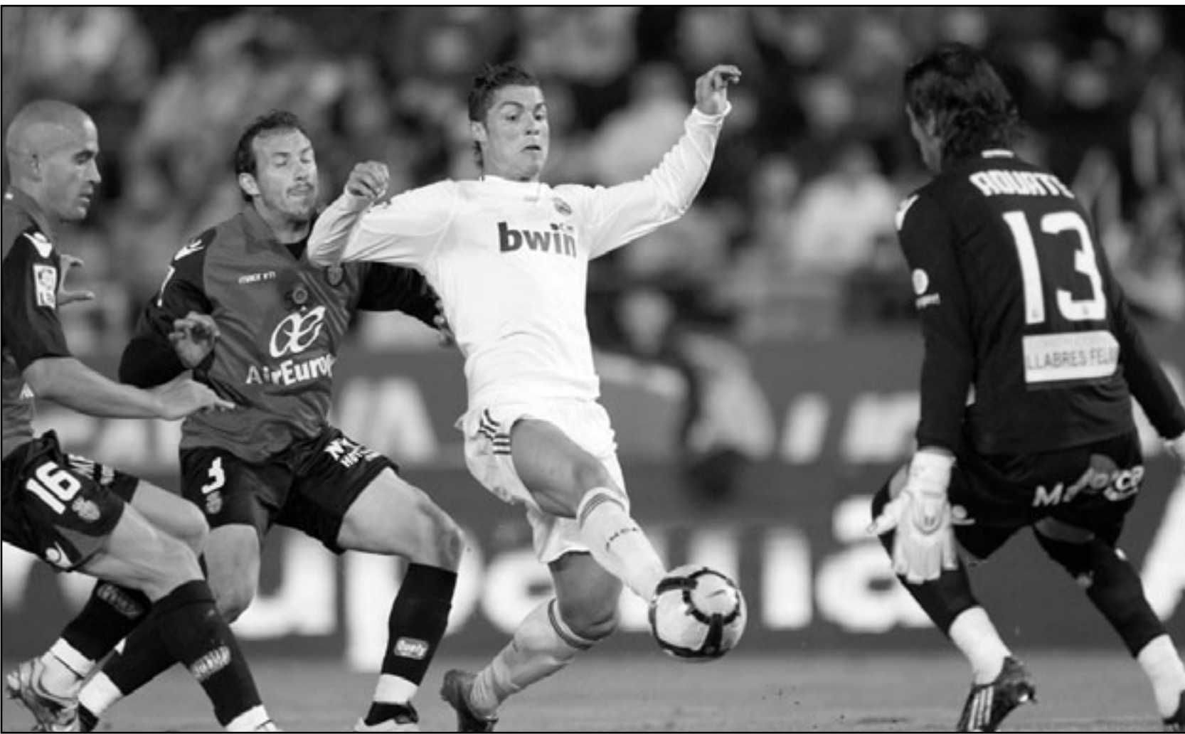
كريستيانو رونالدو نجم ريال مدريد (وسط) يقذف بالكرة مسجلا هدفا الثاني في مرمى مايوركا

مطارته لبرشلونة على لقب الدوري الاسباني لكرة القدم بعدما سحق مضيغه ريال مايوركا 1/4 في المرحلة السادسة والثلاثين من المسابقة. ورفع ريال مدريد رصيده إلى 92 نقطة في المركز الثاني بفارق نقطة واحدة خلف برشلونة الذي تغلب على ضيفه تينيريفي 1/4 ايضا. وتقص النجم البرتغالي الدولي كريستيانو رونالدو دور البطولة ونجح في تسجيل ثلاثة أهداف (هاتريك) ليواصل مسيرته الرائعة مع النادي الملكي منذ انضمامه لصفوف الفريق قادما من مانشستر يونايتد الإنكليزي. ونجح ريال مدريد في تحويل تأخره بالهدف الذي تقدم به إدوريز زوبيلديا مايوركا بعد مرور ربع ساعة، ورد الفريق بأربعة أهداف حاسمة تكفل رونالدو بتسجيل ثلاثة منها، فيما اختتم زميله الأرجنتيني جونزالو هيجونين أهداف الفريق. وسجل رونالدو خمسا من آخر ستة أهداف لريال مدريد ليقود النادي الملكي لتحقيق انتصارات درامية في الفترة الأخيرة. وتقدم إدوريز زوبيلديا بهدف لأصحاب الأرض مستغلا خطأ سانجا لدفاد ريال مدريد في الدقيقة 16. ولكن بعد مرور عشر دقائق فقط اندرك رونالدو التعادل لريال مدريد بعد أن تلقى تمريرة رائعة من سيرجيو راموس ليسدد مباشرة في شبك دودو اواتي حارس مرعى مايوركا. وكان رونالدو على موعد مع الهدف الثاني له وفريقه في الدقيقة 57 بعدما تلقى تمريرة جديدة من سيرجيو راموس ووضع لسته على الكرة لتعرف طريقها للمرمى. وفي الدقيقة 72 واجه رونالدو بمفرده ثلاثة من