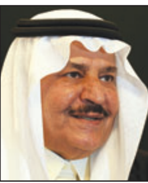
الامير نايف بن عبد العزيز

جملة وتفصيلاً عن نشاط لهؤلاء الجواسيس في البلدان الأخرى لمجلس التعاون الذي يضم الكويت والسعودية والبحرين والامارات العربية المتحدة وقطر وعمان. واكد نائب كويتي للثلاثاء ان اعضاء الخلية ينشطون في بلدان عربية أخرى في الخليج.