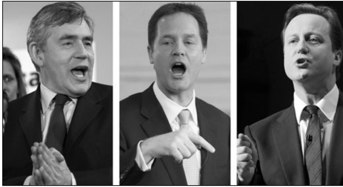
دايفد كاميرون، نيك كليغ، غوردون براون

لندن - «القدس العربي»: مع الساعات الاولى من صباح اليوم ستعرف النتائج الاولى من الرابع والخاسر في انتخابات السادس من ايار (مايو) في بريطانيا، لكن النتائج مكتوبة على الجدار وتحمل كتهنئات بنهاية حقبة من حكم العمال، فيالنسبة لصانديق الاقتراع التي هي الحكم في النهاية لن تعرف النتيجة النهائية الا منتصف هذا اليوم او بعده، حول بقاء حكومة غوردون براون، زعيم العمال او دخول ديفيد كاميرون في خطه الشبوعية الى 10 داوينغ ستريت لكن تعليقات الصحف والاستطلاعات يبدو انها حسمت الامر واسدلت الستار على ما يبدو على 13 عاما من حكم العمال، ويظهر هذا في عناوين الصحف الرئيسية والشعبية والتي حملت عناوينها الرئيسية «انتخابات الشعب» (انديبننت) ، كاميرون «املنا الوحيد» (صن)، «مصير الامة» (التايمز)، «قضايا ساخنة لبريطانيا» (ديلي ميل)، «كاميرون ينتظر الجائزة» (غارديان)، «دي - دي - دي» (ديلي اكسپرس)، «يوم التصير» (ديلي تلغراف)، «صوتوا للعمال» (مورنينغ ستار)، صورة لكاميرون وعليها تعليق «ثيس ووز؟ هل هذا صحيح؟» (ديلي ميرور) واخيرا «الاسهم البريطانية ترتفع فالاسواق (تقاسم) تراه على فوز المحافظين» (الفاينانشال تايمز). كل هذا يغطي حسا ان بريطانيا امام مرحلة تغيير هامة غتت عليها الازمة المالية اليونانية، كما ان العليقن اتقوا