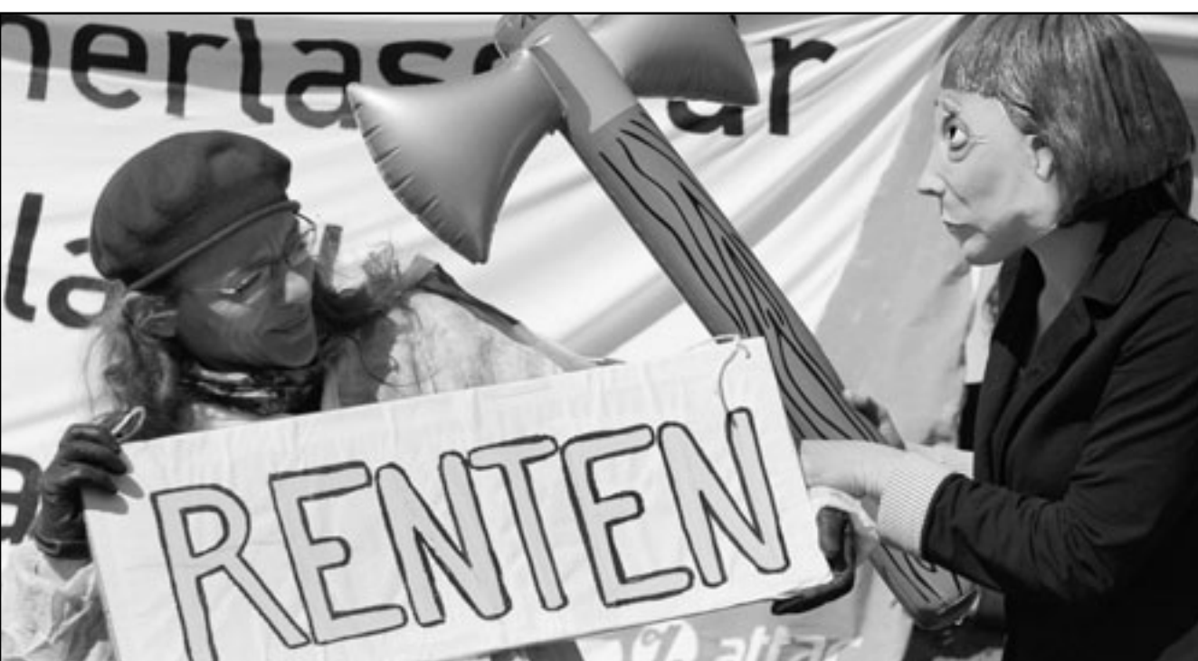
مظاهرة المانية تضغ على وجهها قناعا يشبه المستشارة الألمانية وتحمل فاسا تريد ان تضرب به رأس مظاهرة أخرى تحمل ياغتها كتب عليها معاش التقاعد

قسم الاقتصاد في جامعة أثينا يقول إنه لو كانت اليونان محافظة بعملتها المحلية كانت ستختار أو مستطع إلى خفض قيمة هذه العملة وبالتالي تحصل على دفعة سريعة لغراتها التنافسية رغم أن ذلك سيؤدي إلى ارتفاع معدل التضخم نظرا لارتفاع أسعار المنسودرة. في الوقت نفسه تعهد قادة النقابات العمالية في اليونان بمقاومة إجراءات التقشف في البلاد التي تعانى من انخفاض مستوى الأجور ودعا إلى مزيد من الاحتجاجات والإضراب فيها وضبط الرقابة الجوية وعمال الموانئ وموظفو الدولة والأطباء والمعلمين والعمالين في القطاع المصرفي. ومنذ مطلع الأسبوع يشارك مئات الأفرام من القوات المسلحة في الاحتجاج عملة موحدة ساهم في تشجيع السياحة، أما باناغويونيس بيتراكيس رئيس