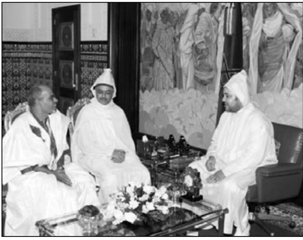
ولد سويلم في يسار الصورة خلال استقباله من طرف الملك محمد السادس بعد تخليه عن البوليساريو الصيف الماضي

وكانت الكثير من الأصوات السياسية المغربية تطالب في الماضي بتوظيف العائدين من مخيمات تندوف في الدبلوماسية بدل تكليفهم بمهام أمنية ضخمة في وزارة