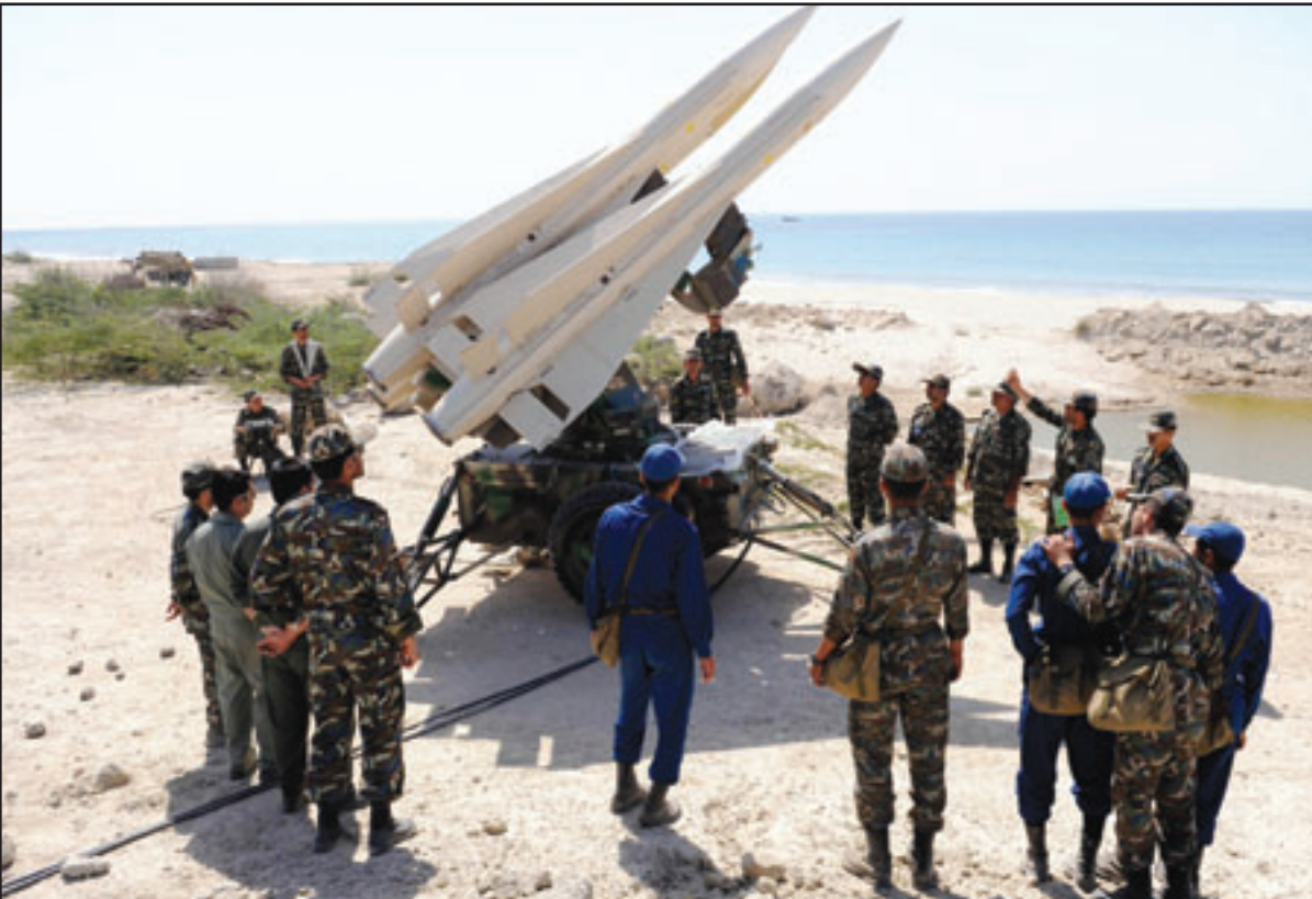
عسكريون إيرانيون اثناء مناورة على شواطئ الخليج لاختبار صواريخ حديثة