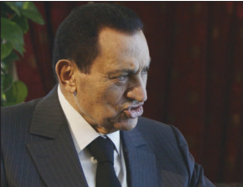
الرئيس المصري حسني مبارك

تجاهل ما اعتمده الشعب من تعديلات دستورية منذ 2005 وما يتعين ان يتوافر للدساتير من ثبات ورسوخ واستقرار.. وحذر من تعريض مصر لمخاطر الانتكاس.. ولم يوضح الرئيس المصري كنه انتكاس الا مراقبين اعتبروه تهديداً بقمع الحركة المطالبة بالتغيير، واعتبروا ان انتقاد مبارك للبرادعي في الخطاب السنوي لعهد العمال وهو الاهم بالاجندة السياسية والإعلامية وان كان ضمنياً، ربما يشير الى ان النظام يتعامل مع حركة التغيير بجدية كاملة وبمشاعر مختلطة من القلق والازعاج. وعلى عكس التوقعات لم يعلن مبارك رفع الحد الأدنى للأجور تنفيذاً لحكم القضاء الإداري الذي صدر في اواخر الشهر الماضي، كما لم يعلن تغييراً حكومياً، كما لم يشر الى إجراء تغيير حكومي الى أنها حالة الطوارئ المفروضة منذ توليه السلطة قبل 29 عاماً، ويتيحها ما استمرته 30 دقيقة، كما لاحظ مراقبون ان صوت الرئيس مازال يعاني شرخاً واضحاً منذ اجرائه وضعناً اقداماً على الطريق الصحيح بحلول على انتخابات تشريعية العام الحالي ورئاسة العام المقبل وكلنا في خندق واحد كصيرين