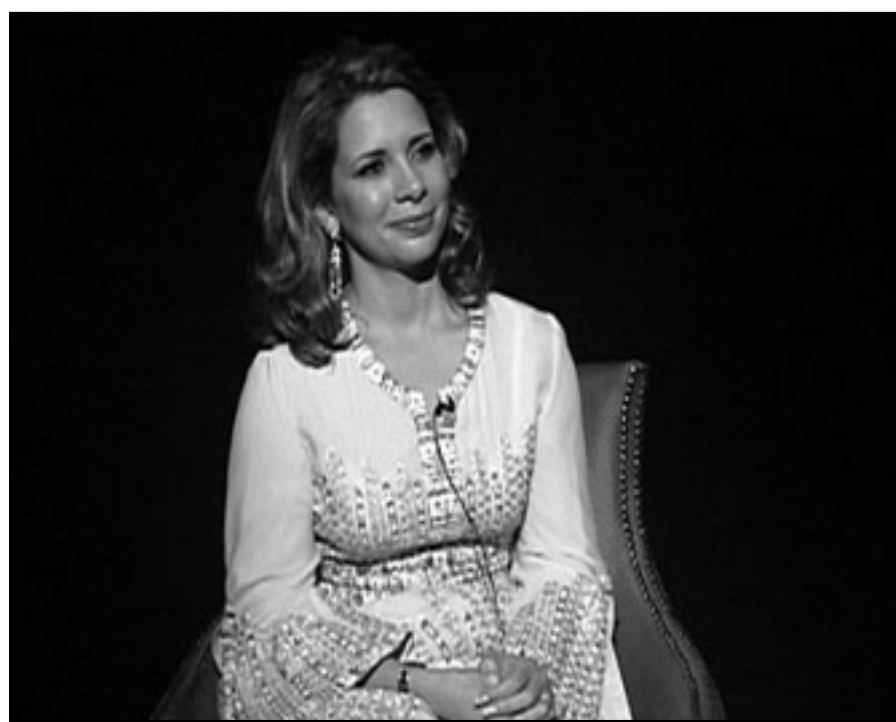
الاميرة هيا بنت الحسين في مقابلة حصرية مع دبي 1

منتمية في الوقت نفسه أن يزداد الاهتمام بالرياضة