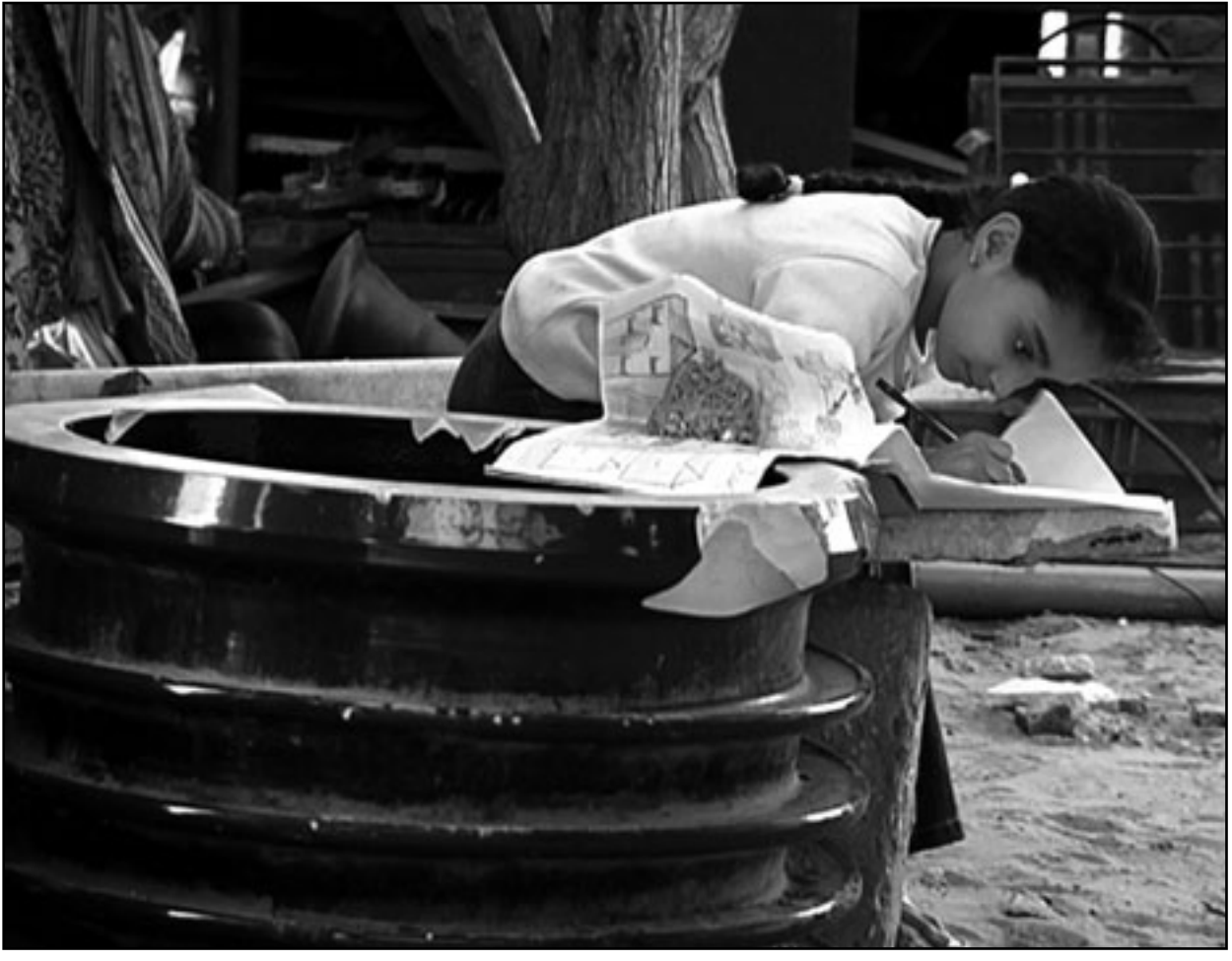
لقطة من فيلم «تمتمات منى»

وقد فازت الشركة بالعديد من الجوائز المختلفة في العديد من المهرجانات العربية والدولية خلال الأعوام الماضية.