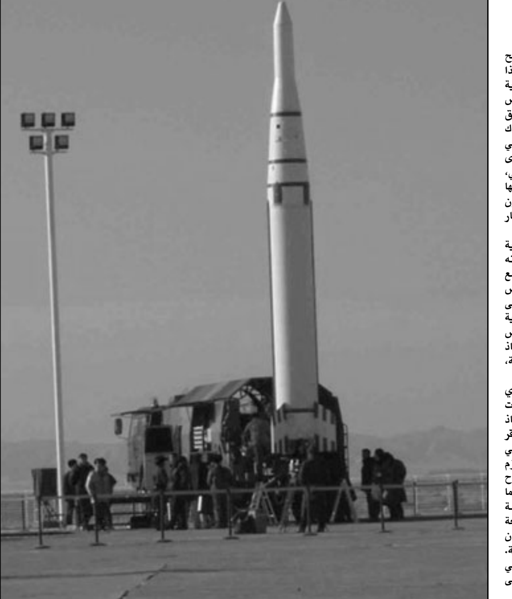
السعوديون يجرّون اتصالات لشراء رؤوس نووية