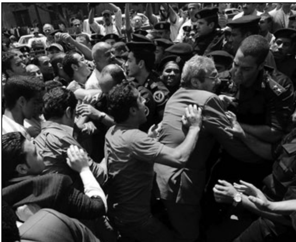
مواجهات بين رجال الشرطة ومتظاهرين في القاهرة

في قانون العقوبات وقد ثبتت في حق هذا النائب، فضلا عن تكرار هذا النائب لنفس التصريحات المحرزة في برنامجين حواريين على شاشات التلفزيون وأمام ملايين المشاهدين «برنامج من قلب مصر، وبرنامج العاشرة مساء»، وهو ما يعني أنها جريمة مستمرة يستحق العقاب عليها، حيث لا تنسحب الحصانة التي يتمتع بها على تصريحاته خارج مجلس الشعب.