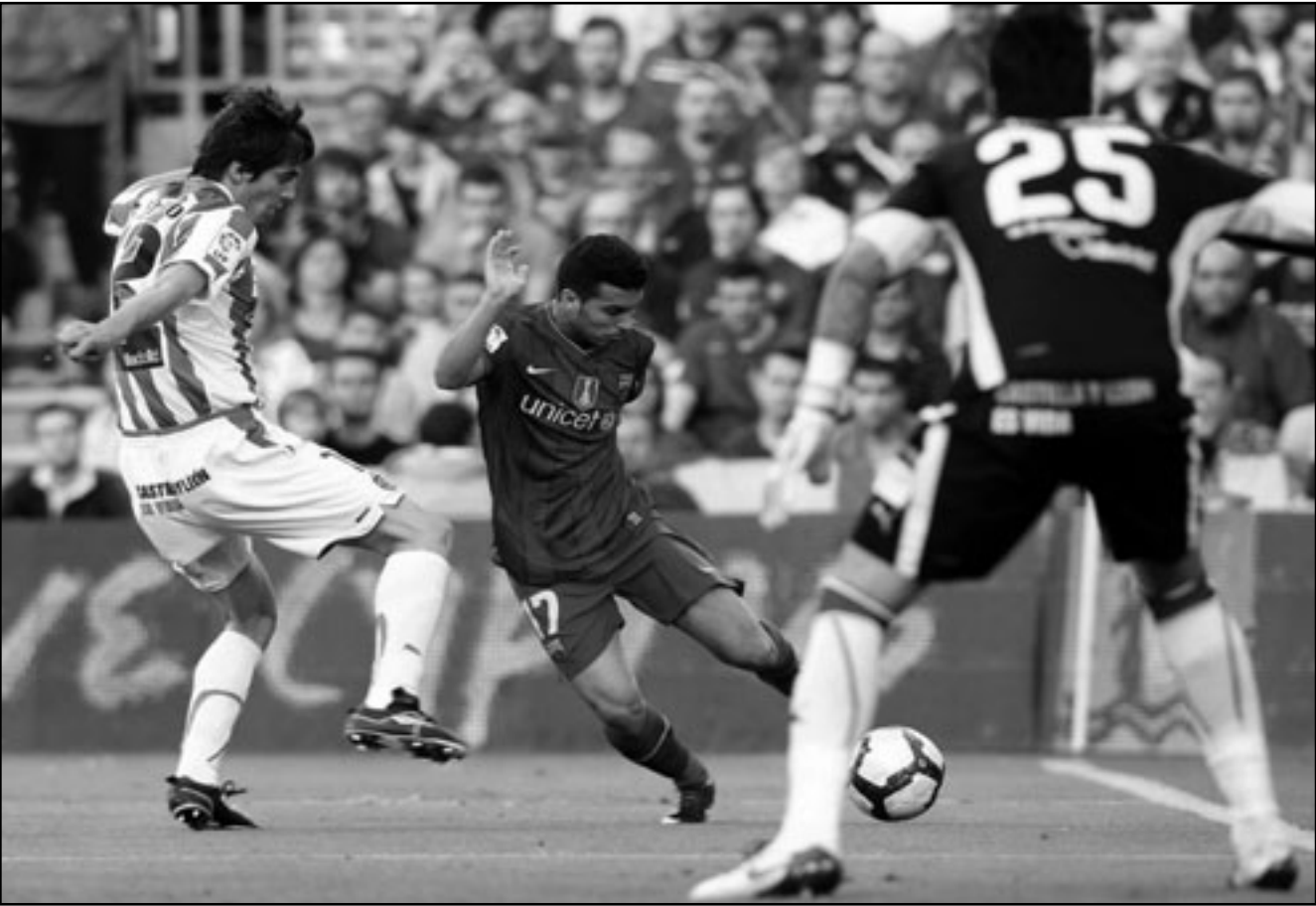
نجم برشلونة بديرو روديجوز (وسط) يتفرد بالكرة

رصيد النقاط التي جمعها هذا الموسم وهو 99 نقطة كما لم يمن سوى بهزيمة واحدة فقط طوال الموسم. من جانبها خصصت صحيفة «سبورت» نصيبا خاصا من الإشادة بالنجم الأرجنتيني ليونيل ميسي الذي سجل 47 هدفا لبرشلونة هذا الموسم من بينهم 34 هدفا بمسابقة الدوري المحلي وحدها فيما وصفته الصحيفة بأنه «موسم رائع للاعب».