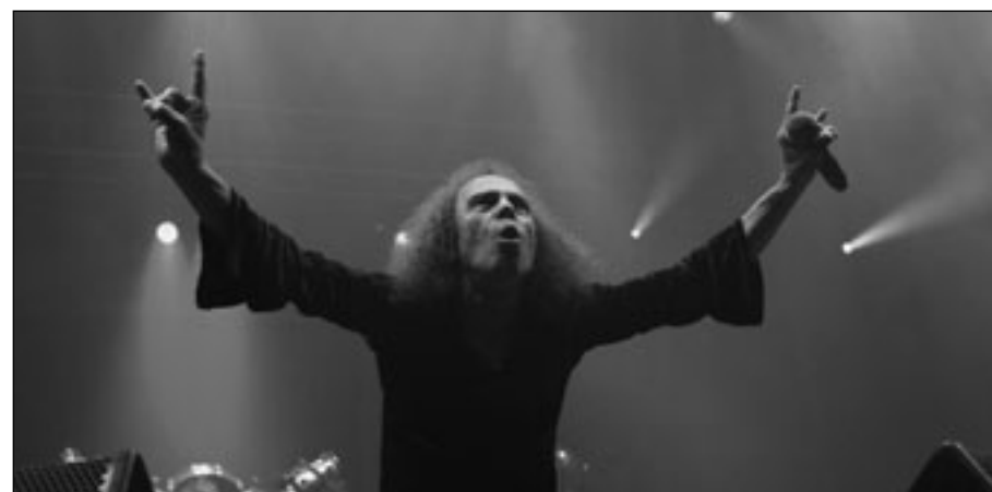
روني جيمس ديو «ابو قرون الشيطان»

يذكر أن ديو حل محل المغني البريطاني، أوزي أوسبورن، في فرقة «بلاك سابت»، عام 1978. وكان ديو، واسمه الحقيقي رونالد بادافونا، يحيي جماهيره برفق خنصره وسبابته كعلامة لقرون الشيطان التي تشتهر بها أو ساط موسيقى «الهيبي ميتال».