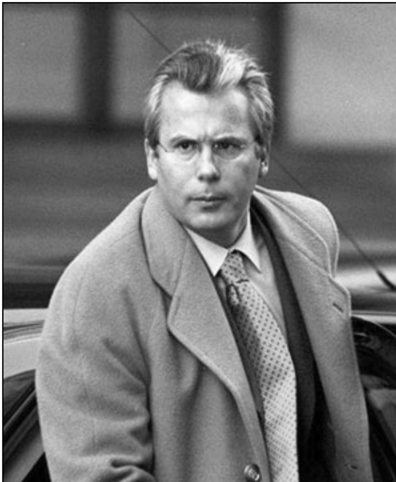
القاضي الإسباني بالتاسار غارسون

جرائم ضد الإنسانية. وتسببت الدعوى في أزمة بين مدريد والرباط وجرى تجميدها بسبب صعوبة محاكمة ملك أو رئيس دولة، لكن غارسون قبل سنة 2007 التحقيق في ما يعرف بخروقات الصحراء الغربية ضد جنرالات مغاربة من ضمنهم الجنرال حسني بنسليمان قائد الدرك والجنرال عبد العزيز بناني المفتش العام للجيش المغربي. وكانت توجد في مكتب غارسون في المحكمة الوطنية في قلب مدريد عشرات الملفات التي تهم دعاوى تخص جرائم ضد الإنسانية لأظمة في آسيا وإفريقيا والقرعة الأمريكية بل والمنظمات مثل القاعدة وزعيمها أسامة بن لادن. لكنه عندما حاول التحقيق في الجرائم التي شهدتها إسبانيا إبان الحرب الأهلية في الثلاثينات من القرن الماضي والعقود التي أعقبتها خلال حكم الجنرال فرانيسكو فرانكو تعرض للتحقيق بسبب جرائه على فتح ملف أصدر فيه البرهان الإسباني قانون العفو الشامل سنة 1977. وانتهى التحقيق بقرار المجلس الأعلى للقضاء بإبعاده الخميس الماضي عن ممارسة المهنة بسبب هذا الملف وملفات أخرى يشتبه أنه انتهك فيها بعض الإجراءات القانونية. كان غارسون القاضي الذي يحب الإعلام، فتقول إلى نجم إعلامي ينافس لاني ريال غرندا و«البارصا» (برشلونة) ونجوم التمثيل والعداء في إسبانيا، وكان يسارع لتولّي التحقيق في الملفات التي تجلب تغطية إعلامية، وهو ما جعل الكثير من الذين في الحكم أو تركوه، لا سيما وأن المحكمة الجنائية الدولية لم تكن قد انتقلت إلى طور العمل والتفتيح. بعد بينوتشي، كان دور الملك الراحل الحسن الثاني، حيث رفع نشطاء البوليزاريو دعوى ضده بتهمة ارتكاب