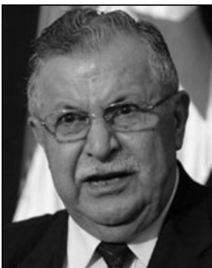
الرئيس جلال الطالباني

الناقد مسعود بارزاني. وخاض طالباني وبارزاني العدوان لللودان لأكثر من 20 عاماً، حرباً دامية بين 1994 و1998 للسيطرة على العائدات الجزئية لطرق التهريب مالت الكفة فيها او لطالباني قبل توقيع اتفاق تقاسم السلطة بينهما في كردستان. واليوم تفوق بارزاني في فضل البقاء سيداً في منطقة كردستان وترك طالباني يذهب إلى بغداد ليصبح في 2006 رئيساً للعراق.