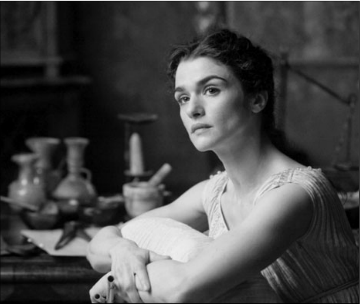
لقطة من فيلم «أغورا»

كان الاتفاف جمهور المثقفين حول الفيلسوفة ايباتيا يسبب حرجا بالغنا للكنيسة المسيحية وراعبيها الأسقف كيرلس الذي كان يدرك خطورة ايباتيا على جماعة المسيحيين في المدينة، خاصة وأن أعداد جمهورها كان يزداد بصورة لافتة للانتظار، بالإضافة إلى أن صداقتها للوالي (أورستوس) الذي كانت بينه وبين أسقف الاسكندرية (كيرلس) صراع سياسي في النفوذ والسيطرة على المدينة. كان أورستوس مقربا إلى ايباتيا ويكن لها تقديرا كبيرا، كما يقال انه كان أحد تلاميذها، وهو ما يفسر ما كان (كيرلس) مستاء مما قد يعمله وجود ايباتيا وزاد الأمر سوءا أن الأسقف دخل في صراع مع اليهود المتواجدين بالمدينة، وسعى جاهدا لإخراجهم منها، ونجح في ذلك إلى حد كبير وذلك بمساعدة أعداد كبيرة من الرهبان، الذين شكلوا ما يمكن تسميته بجيش الكنيسة، ولم يكن باستطاعة الوالي التصدي لهذه الفتوى، بل يتعرض بدوره للإهانة من جانب بعض الرهبان الذين قاموا بقتله بالحجارة، بعد أن علموا بالتقرير الذي أرسله للإمبراطور متضمنا الفتوى