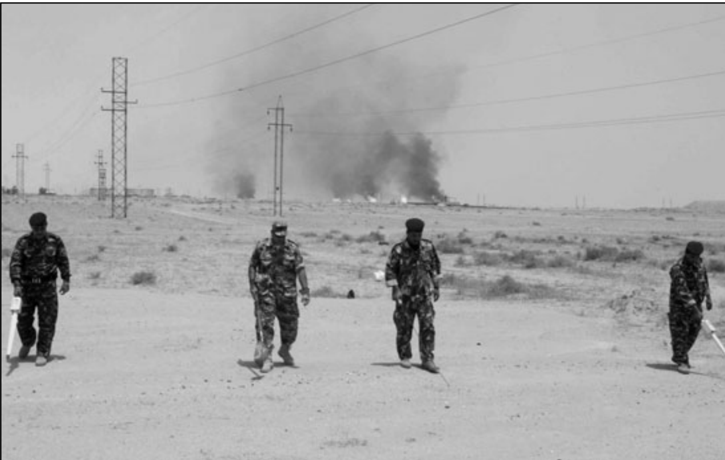
جنود عراقيون يقومون بالبحث عن الغام قرب حقل الرميعة النفطية

ستحسن الوضع الامني في نينوى ومثلما نتوقع لكن هذه النقاط وقتية وليست دائمية وتعمل لكي تقرب ما بين القوات الامنية بعدما كانت في السابق احادية وتعمل لوحدها». وقال هيل «نحن لا ننتقل لبناء نقاط تفتيش لا تخدم المحافظة لكننا نريد من هذه النقاط الامنية مساعدة الناس»، مضيفاً «علت ان هناك اجتماعا في اربيل وكان ناجحا ونحن سنكون داعمين للقاقتين (الحدباء ونينوى التاخية) للعودة للمشاركة في الحكومة المحلية». وأضاف ان «اللقاءات بحاجة الى مرونة من الجانبين ولكن اعتقد بانها في بعض الاحيان المرونة غير مرحب بها، ولكن اعتقد ان مجلس المحافظة سيكون باشرافنا لاعمال العملية السياسية».