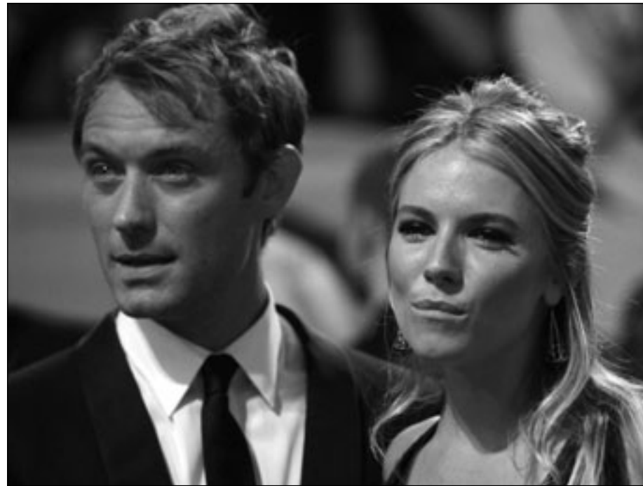
سينا ميلر و جود لو

■ هامبورغ - د ب أ: قريباً قد تشهد العلاقة المتقلبة بين الممثل البريطاني جود لو وصديقته الممثلة الأمريكية سينا ميلر النهاية السعيدة بعقد القران خلال الصيف المقبل. ونشرت مجلة «يونته» الألمانية في عددها الصادر أمس الاثنين أن جود وسينا اتفقا على الزواج خلال الصيف الحالي في الريف الإنكليزي في حفل صغير يحضره الأصدقاء وبعضهم العروسان بالزواج مرة أخرى في نيويورك. وأضافت المجلة أن العروس كلفت شقيقتها بتصميم فستان الزفاف ونقلت المجلة عن أحد الأصدقاء قوله: «لن يصدق أحد أن جود وسينا سينتزوجان، إلا بعد عقد القران نظراً لأنهما انفصلا في عام 2006 بعد إعلان الخطوبة». الجدير بالذكر أن علاقة الممثل مع مربية أبنائه أنهت العلاقة مع سينا ولكن الأمور عادت إلى مجاريها مرة أخرى، دون أن تخلو من حالة خيانة من جانب الممثل بعد أن أنجب طفلة غير شرعية من عارضة أزياء أمريكية وأصبح لديه أربعة أطفال، من بينهم ثلاثة من زوجة سابقة. ويبدو أن جود (37 عاماً) وسينا (28 عاماً) يرغبان في طي صفحة الماضي وبدء حياة جديدة تقوم على الثقة والالتزام.