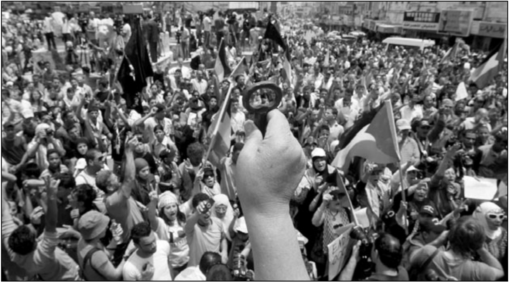
مسيرات في رام الله لحياء ذكرى النكبة

وحول اعلان مسؤولين اسرائيليين عن نية اسرائيل الاستمرار في مشاريع البناء في القدس الشرقية قال عريقات ان اسرائيل «اذا استمرت في الاستيطان وهدم البيوت وتهجير السكان وفرض الحقائق على الارض فانها بذلك تكون حكمت على المفاوضات بالدمار قبل ان تبدأ» مشددا «على وجود التزامات على اسرائيل يتوجب