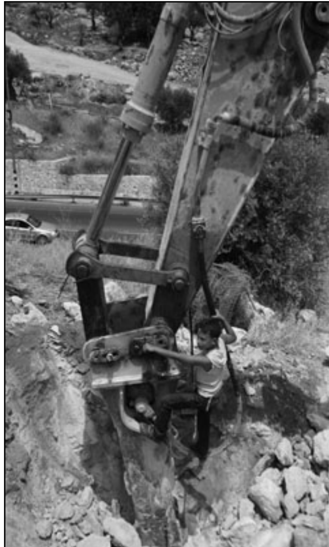
جرافة تمهد قطعة ارض صادرتها اسرائيل

ولفت المحلل الاسرائيلي الى أنه وعلى الرغم من ان الناطق بلسان البلدية يوم أمس، صرحت هذه الانباء، مدعيا ان بركات يصر على