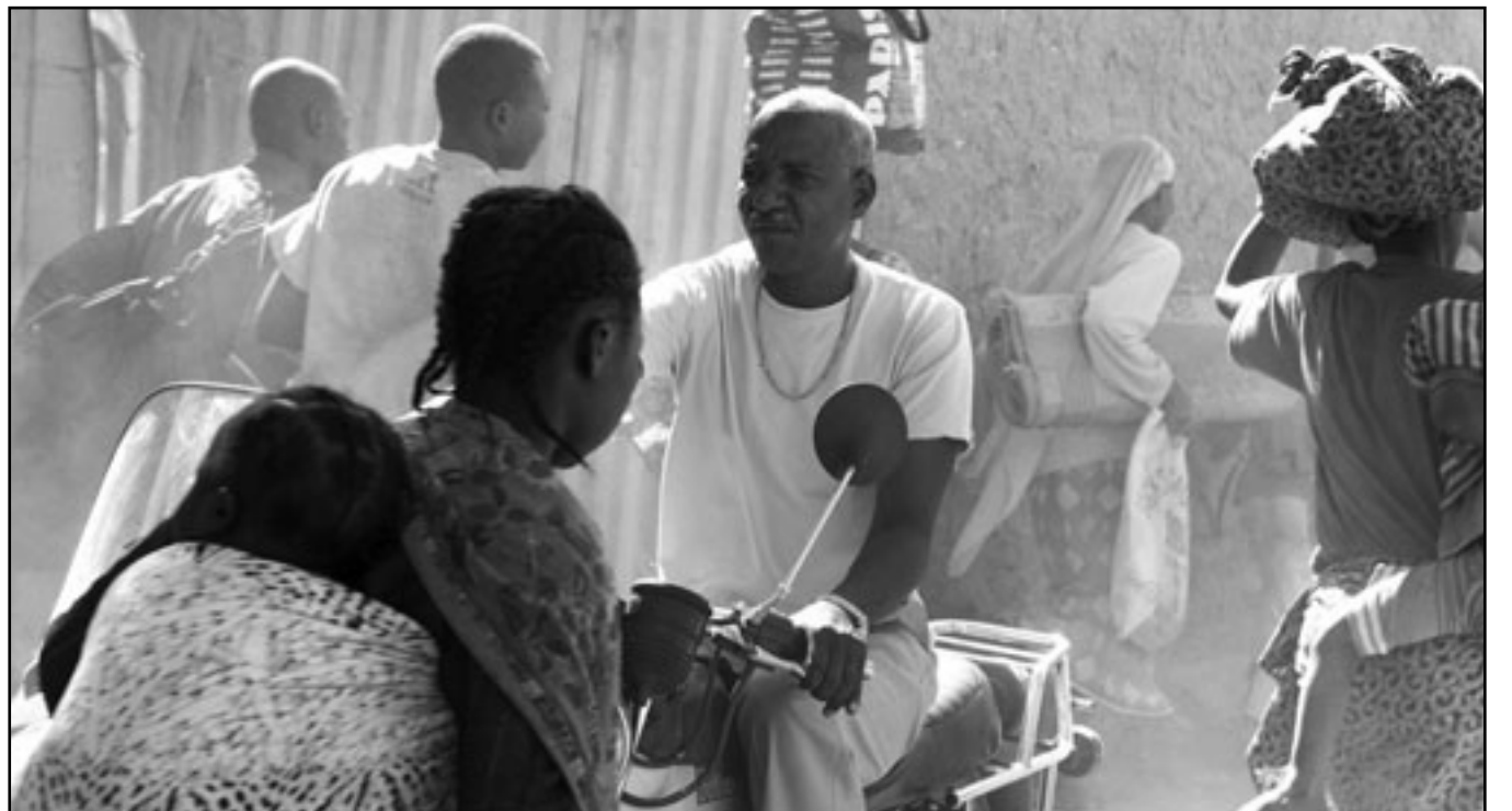
لقطة من فيلم «رجل صارخ»