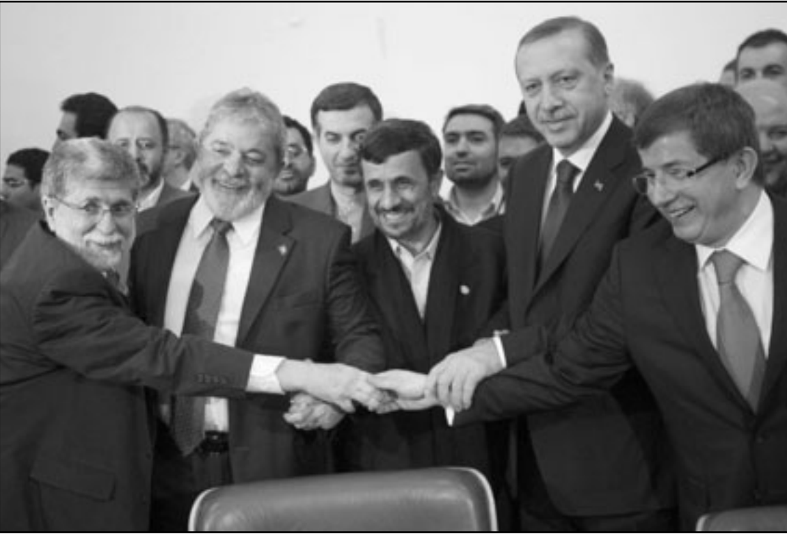
رئيس الوزراء التركي اردوغان ورئيس اليراني نجاد والرئيس البرازيلي داسيلفا في صورة تذكارية في طهران امس

والبرازيل صباح الاثنين في طهران اتفاقا لنقل 1200 كغ من اليورانيوم الإيراني الضعيف التخصيب إلى تركيا مقابل حصول طهران على 120 كغ من الوقود النووي الخصب بنسبة 20% من الطاقة لتشغيل مفاعل الأبحاث في طهران. وأعلن مهيانيرست ان إيران ستواصل تخصيب اليورانيوم بنسبة 20% كما اوردت وكالة الأنباء الإيرانية الرسمية وذلك بعد توقيع اتفاق بين إيران وتركيا والبرازيل حول اقتراح لتبادل الوقود في تركيا. وقال مهيانيرست «الطابع ان تخصيب اليورانيوم بنسبة 20% سيسمّر في بلادنا. وعرضت تركيا والبرازيل وهما ليستا من الدول دائمة العضوية في مجلس الأمن المتوسط للوقوف لحل للامّة. وكان ينظر للامر على أنه الفرصة الأخيرة لتجنب فرض جولة رابعة من العقوبات الدولية. وقال المسؤول لوكالة «فرانس برس» طالبا عدم الكشف عن اسمه ان «الإيرانيين تابعوا بتركيا والبرازيل عبر التظاهر بموقفهم، على نقل قسم من اليورانيوم الذي يمتلكونه إلى تركيا لمبادلة بوقود نووي.