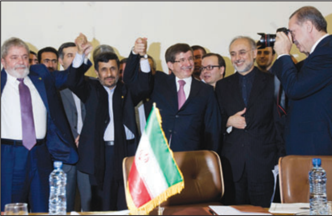
رئيس الوزراء التركي رجب طيب اردوغان يأخذ صورة تذكارية للرئيسين الإيراني محمود احمدي نجاد والبرازيلي دي سلفا