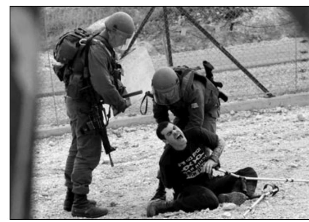
كل من ينتقد اسرائيل يتهم بالالاسامية

اضيقوا الى ذلك الانشغال الحثيث بالكارثة، الذي يبدأ في روضة الاطفال ويتبني بالرحلة الاعتبارية لولندا، لتحصلوا على تلاميذ ليس فقط علمهم ضيق ومله، بالمصطهدين، بل وايضا التاريخ الاسرائيلي نفسه مشغوب منه، افحصوا اطفاككم، ما يعرفونه عن حرب لبنان الاولى او عن يوم الغفران سيصدمه. ثمة المنهاج التعليمي هذا السباب