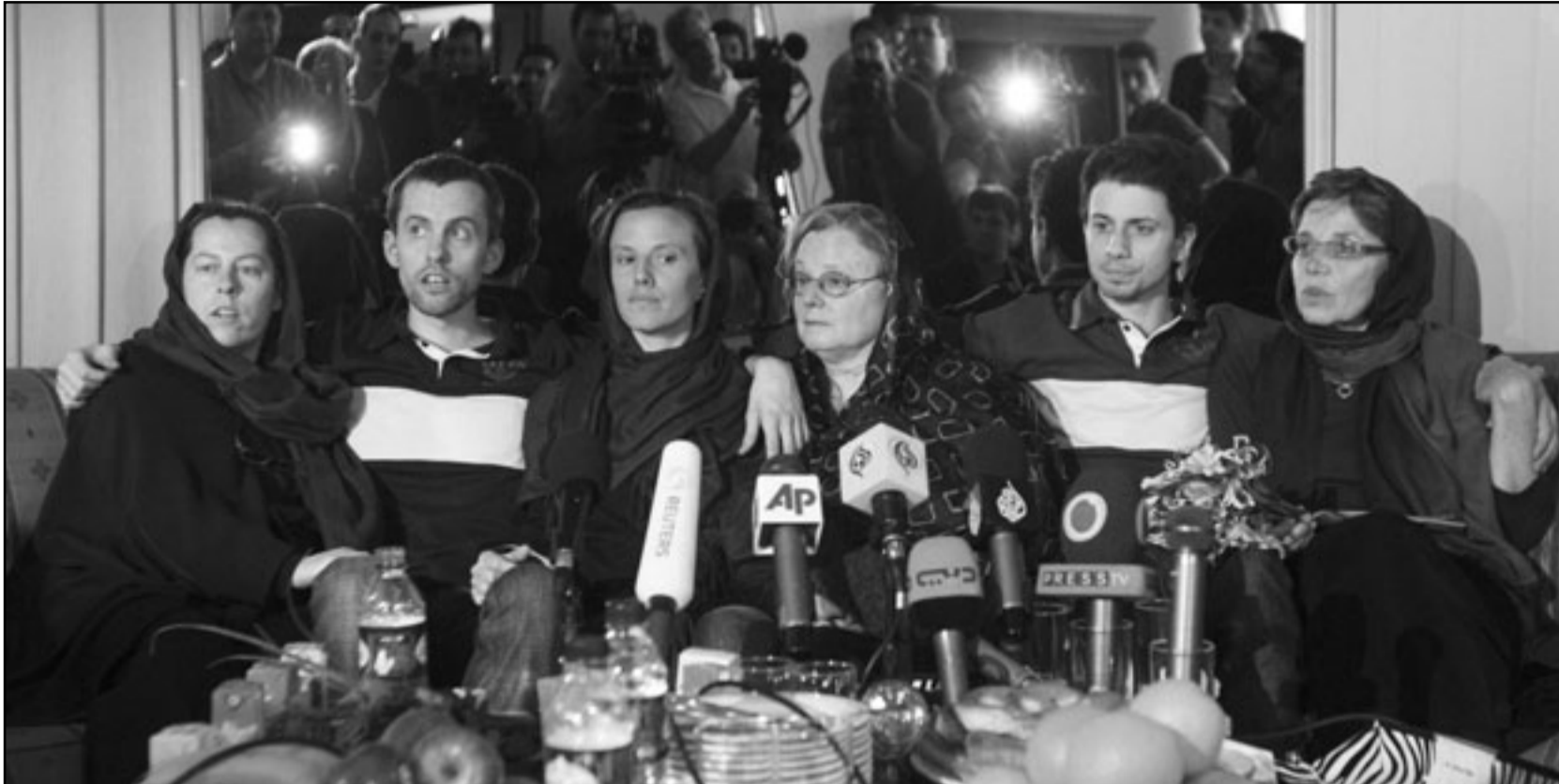
صورة جماعية لامهات الأمريكيتين الثلاثة المعتقلين في فندق الاستقلال بالعاصمة الإيرانية طهران