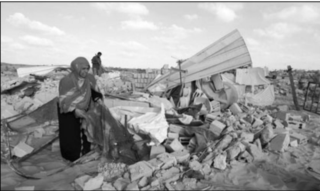
فلسطينية تنتقد انقاض منزل بعد ان دمته حكومة حماس في رفح

حكومة، ودعا المركز حكومة حماس إلى «تجميد كافة قرارات الهدم الخاصة بالمنازل المقامة على اراض حكومية مؤقتا، وناقذ اصحاب المنازل المذكورة من التشرّد»، وطالبها بالتوصل إلى مبيعة مناسبة وتوافقية مع اصحاب المنازل المقامة على تلك الاراضي. وحثت على ربط تنفيذ أية مخططات لازالة التعديلات محل الازمة الخطيرة في قطاع الاسكان الذي يعاني منه سكان القطاع عموما.