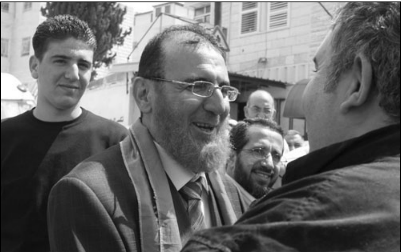
نائب حركة حماس محمد ابو طير يستقبل المهنيين بعد الافراج عنه من السجون الاسرائيلية التي امضى فيها اربعة اعمام

شديدة ضد غزة اسمتها (الرصاصة المصبوب) ما يشهدها السكان منذ بداية الصراع، حيث اندت هذه الحرب التي استخدمت فيها اسرائيل اسلحة محرمة دوليا التي استشهد نحو 1500 فلسطيني، عدد كبير منهم من المدنيين والأطفال والنساء، علاوة عن اصابة أكثر من 5000 آخرين، وخلفت وراءها انهارا منازلهم بسبب القصف، واعتبرت المصادر الدولية أن قضية خطف اي جندي اسرائيلي تصرب على الؤثار