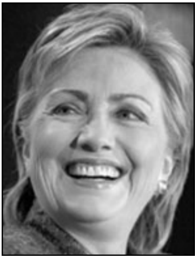
كليتتون هددت بحساسية من يعرقل المفاوضات

■ جوفه تصريحات سديدة على لسان محافل في ادارة اوباما، والحكومة الإسرائيلية ووزعاء يهود من الولايات المتحدة يحاولون اقتناعنا مؤخرا بان علاقات اسرائيل – الولايات المتحدة عادت الى طبيعتها. بالمقارنة، فان نقي المشكلة يؤكد فقط خطورة الازمة، صدف لي مؤخرا ان رأيت عن كذب المشهد السياسي في الولايات المتحدة والتفت بزعماء ومفكرين يهود من اوساط واسعة بين السكان. الامر المقلق هو انه لا يوجد اي دليل حقيقي على ان الولايات المتحدة غيرت هذا الشكل او ذاك سياسة الصلحة التي انتهجتها تجاه الاسلام من خلال الابتعاد عن الامر المشجع هو انه خلافا لتوقعات المستشرقين اليهود لوباما، ثار مؤخرا احتجاج كبير من جانب يهود امريكيين في ضوء العدا الذي اظهرته الادارة تجاه حكومة نتنياهو. زعماء يهود كثيرون تحدثوا عن مذهبهم من الشكل الذي نكت فيه اوباما تعهدها تجاه اسرائيل من الفترة التي سبقت الانتخابات، وان كان معظمهم رفضوا الاعراب عن الاحتجاج بشكل علني وجماهيري. هذه ظاهرة استثنائية. زعماء يهود، لا يخشون بشكل عام من اطلاق صوتهم، ينسجون اتعادم الفعل لديهم بالزعم ان الاحتجاج سيكون غير نافع بل وضار، ويزعمهم، السبيل الافضل للتصدي للوضع الحالي هو العمل الهادي خلف الكواليس.