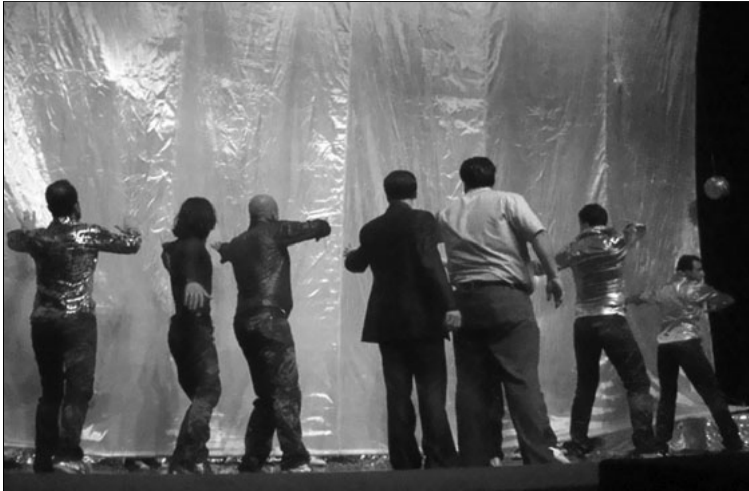
من عروض المهرجان