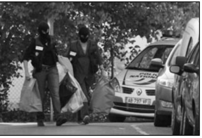
قوات شرطة فرنسية تنقل مستندات حول نشاطات قيادة إيثارهاية