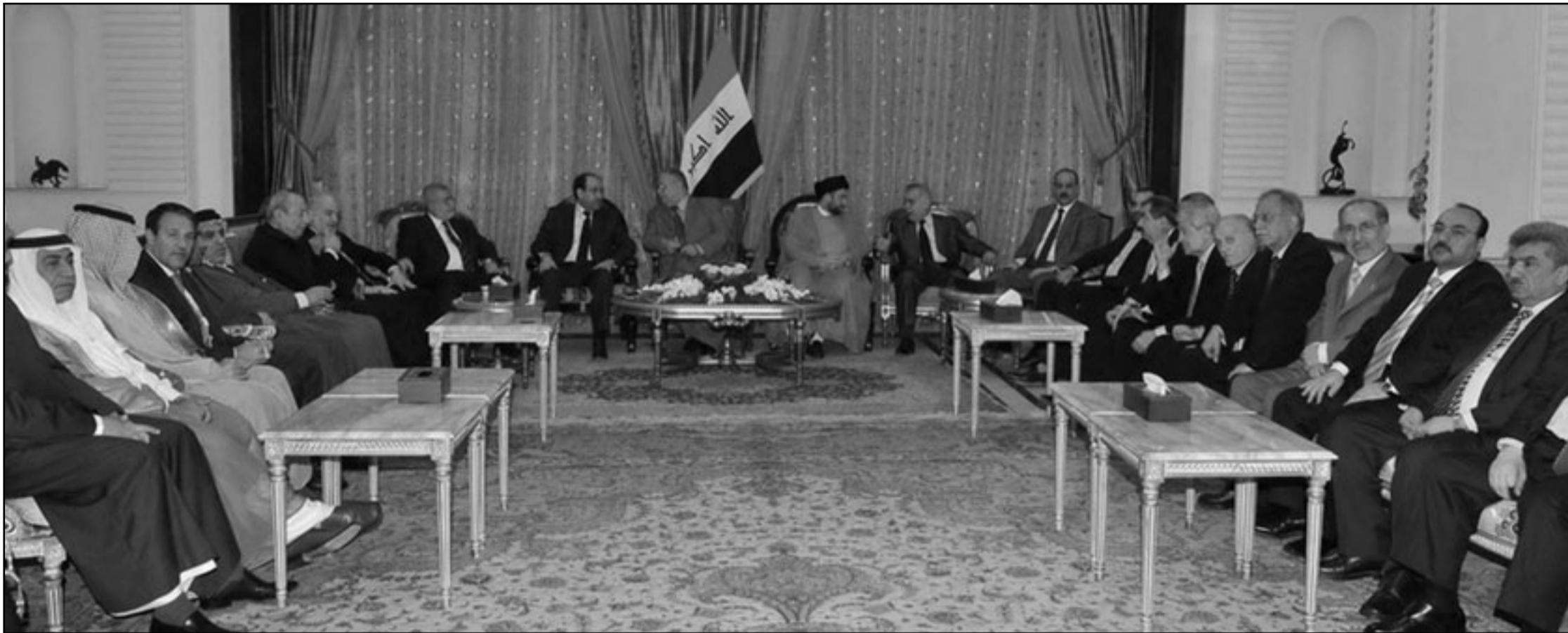
طارق الهاشمي وعمار الحكيم وجلال الطالباني ونوري المالكي اثناء الاجتماع في بغداد امس

في الوقت الذي ينتظر الرئيس طالباني قادة الكتل السياسية على مأدبة الغداء، الخميس، توجه اياد علاوي رئيس القائمة العراقية الفائزة بالانتخابات النيابية مساء الاربعاء الى العاصمة الاردنية عمان. وقال مصدر مطلع: ان علاوي الذي وصل العاصمة الاردنية عمان توجه الى الكويت صباح الخميس في زيارة مفاجئة لم يعلن عنها مسبقاً.