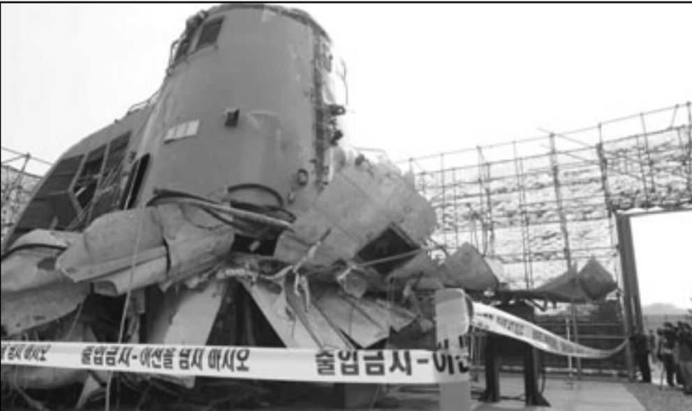
البارجة الكورية الجنوبية تشونان

وإعلان وزير الخارجية البريطاني وليام هيغ في بيان أن هذا الهجوم يدل على اندماج التعاطف مع الحياة البشرية واحتقار الزوراء الياپاني بيوكي هاتوياما فاعتر ان تصرف كوريا الشمالية «لا يغبقر»