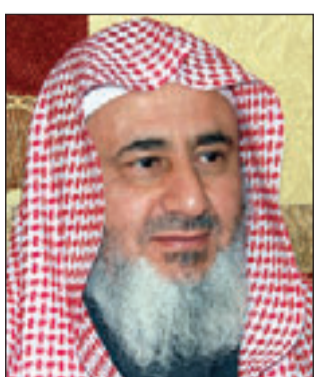
الشيخ عبد الحسن العبيكان

■ الرياض - يو بي آي: أشار عالم دين سعودي الجدل مرة أخرى عبر فتوى تختص بجواز إرضاع الكبير، مؤيدا في الوقت نفسه اقوالا منفردة لمشايخ مسجوبين على الأزهر، ووجهت بانتقادات لاذعة من قبل العديد من العلماء. وقال الشيخ عبد الحسن العبيكان، المستشار القضائي بوزارة العدل وعضو مجلس الشورى السعودي، في فتواه التي نشرتها امس صحيفة «المرصد» الإلكترونيية بما نصه «إذا احتاج اهل بيت، ما إلى رجل اجنبي يدخل عليهم بشكل متكرر وهو أيضا ليس له سوى اهل ذلك البيت ودخوله فيه صعوبة عليهم ويسبب لهم احراجا وبالآخص إذا جاء في ذلك البيت نساء او زوجة فإن للزوجة حق إرضاعه». واستشهد عالم الدين السعودي بحديث سالم مولى خديفة واقوال أخرى استشهد بها عن أم المؤمنين عائشة زوج النبي محمد، واقوال نسبها الى شيخ الإسلام ابن تيمية قال بانها مذكرة في العديد من المؤلفات الخاصة به، واختلف