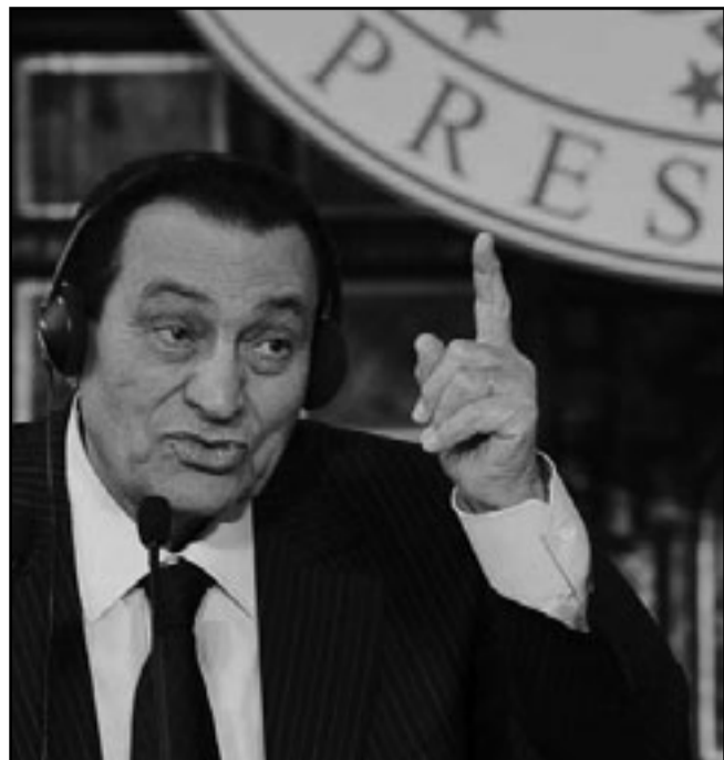
الرئيس حسني مبارك

خضوعه في السادس من آذار/مارس لعملية جراحية لإزالة الحصوة المرارية وزيادة لحيمة في الإثني عشر في مستشفى هايديلبرغ بألمانيا.