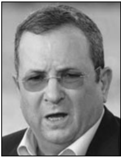
باراك تلقى معاملة ملكية في واشنطن

حاسمة من أعضاء مجلسي الكونغرس. كنتيجة لذلك بدأت مؤخرا الادارة بمحاولة اظهار روح أخرى، وزير الدفاع ايهود باراك تلقى معاملة ملكية في واشنطن، والرئيس اوباما «قف زيارته غير مخطط لها» في أثناء لقاءات باراك مع ممثلي آخرين من الادارة. والى جانب ذلك بدأ تقريبا كل كبار مسؤولي الادارة تكرر شعار "لاسرائيل – الولايات المتحدة، متينة أكثر من اي وقت مضى، تكرار تصريحات التأيد لاسرائيل من جانب ممثلي الادارة هو ظاهرة مباركة، ولكن لشدة الاسف، لا يوجد اي دليل