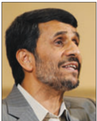
الرئيس الإيراني آحمدي نجاد

■ طهران - اف ب: أعلن مسؤول إيراني الخميس أن إيران ستسحب من الاتفاق الموقع مع تركيا والبرازيل لتبادل قسم من مخزونها من اليورانيوم الضعيف التخصيب في حال قرر مجلس الامن الدولي عقوبات جديدة بحقها بسبب نشاطاتها النووية، بحسب ما افادت وكالة الأنباء الطلابية الإيرانية. وقال نائب رئيس مجلس الشورى محمد رضا بهنودار «من المحتمل اقتراب سلسلة جديدة من العقوبات بحق إيران، لكننا نسبق وقتنا أننا في هذه الحال لن نعود ملزمين بتعهدنا بحال الاتفاق»، ووافقت إيران الاثنين بالاتفاق مع فرنسا والبرازيل على تبادل قسم من مخزونها من اليورانيوم الضعيف التخصيب (3.5%) على الأراضي التركية مقابل الحصول على وفود نووي اقل طيران للابحاث، غير ان الغربيين شككوا في