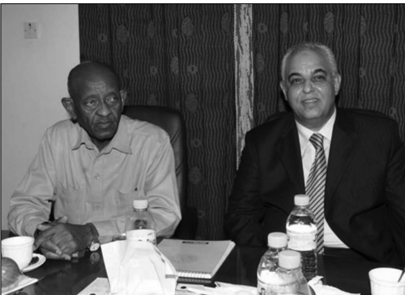
وزير الري المصري مع نظيره السوداني في الخرطوم امس

وفي بيان، أعلن بابولياس عقب المحادثات ان العلاقات اليونانية المصرية جيدة جدا واعتقد ان بالإمكان توسيع تعاوننا في المجال الاقتصادي.. وقال بابولياس ان الاستثمارات اليونانية في مصر بلغت «مليار دولار» (810.8 مليون يورو). من جانبه، أعرب مبارك عن ارتياحه «للتعاون الطويل الامد بين البلدين» والعاقد بشكل خاص الى الجالية اليونانية الكبيرة المقيمة في الاسكندرية، شمال غرب مصر. وسيتباحث الرئيس المصري ايضا عصر الخميس مع رئيس الوزراء اليوناني جورج بابانديرو في مطار اثينا الدولي قبل العودة الى القاهرة. ودعا بابانديرو الذي شارك صباح الخميس في منتدى الاقتصاد العربي الثامن عشر في بيروت والذي تشهد بلاده أزمة مالية خطيرة، الدول