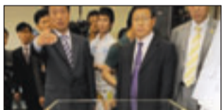
جزء من محرك السفينة الكورية الجنوبية التي اغرقت بطوريدي شمالي

■ عواصم - وكالات: قالت وزارة الخارجية الأمريكية أمس الخميس ان إغراق سفينة كورية جنوبية بطوريدي كوري شمالي «عمل لا داعي له ولم يسبقه استفزاز»، وينبغي «التأكد ان تكون له عواقب»، وقال المتحدث باسم الوزارة بي جي. كرولي في افادة صحافية «كان هذا بوضوح استفزازا خطيرا من جانب كوريا الشمالية، وستكون هناك بالتأكيد عواقب ما فعلته كوريا الشمالية»، من جهته، اعتبر المتحدث باسم البيت الابيض روبرت غيبس ان الهجوم حدث «برشد اهمية بالغة»، في تاريخ كوريا الشمالية وكوريا الجنوبية، وخلص تحقيق دولي حول سبب غرق السفينة شيوئان التي تزنت 1200 طن وغرقت في 26 آذار (مارس) قبالة جزيرة باينغيونغ قرب الحدود البحرية مع كوريا الشمالية، الخميس ان السبب هو طوربيد اطلق من غواصة كورية شمالية، وقتل 46 بحارا كوريا جنوبيا في هذا الهجوم.