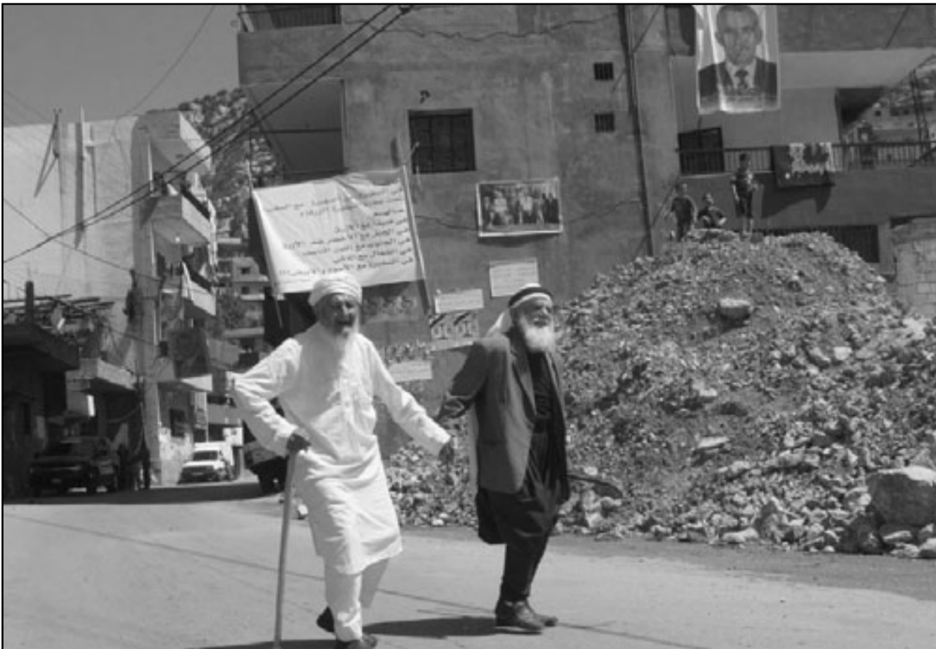
لبنانيان يسيران امام ملصق لاحد المرشحين للانتخابات المحلية في قرية الدينية

تهديدا ميطنا للآخرين وهذا الامر يشكّل جرما جزائيا يعاقب عليه القانون». وقال: «هل يقبل الرساء الثلاثة سليمان جبري والحريري بهذا المنطق في هذا الزمن اللبناني، زمن الدولة اللبنانية والقانون اللبناني»، متوجها الى فرنجية بالقول: «دعونا لعدم ضبط النفس في محاوالات الغف واللمز في اتجاهات معينة لانها لا تغير ولا تخدم جو التهذبة الذي نسعى اليه»، وتكره بان «هنالك الكثير من الملفات الماضية المعقدة، التي اذا ما بدانا بفتحها سنعيدنا الى فترة ما قبل اتفاق الطائف»، وقال «اعتقد ان النائب فرنجية، وفي لحظة هدوء، سيعيد صياغة ما يصدر عنه بأسلوب آخر»، و اضاف «كنت اتوقع ومقاتي الوزير محمد الصديقي وقاطع هذه الانتخابات ارمين لعدم ضمّ ارميني الى اللائحة التوافقية كذلك تحفظ على الانتخابات العلويون في جبل محسن لعدم اعطائهم الحجم المناسب ضمن اللائحة وبلغت نسبة المشاركة في طرابلس في 21 في المئة».