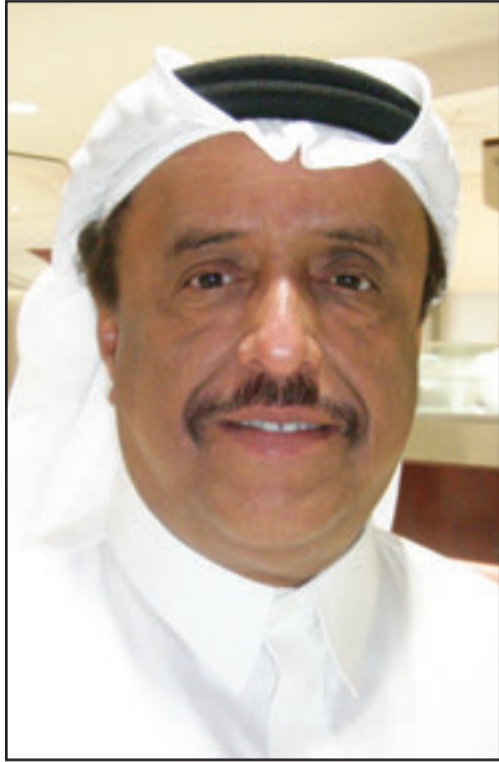
قائد عام شرطة دبي الفريق ضاحي خلفان

كشفت القائد العام لشرطة دبي الفريق ضاحي خلفان في حوار شامل مع «القدس العربي» أن مسؤولاً اسرائيلياً اتصل بمسؤول عربي في دولة اقليمية كبيرة الذي بدوره اتصل بمسؤول في دبي يطالبه بعدم نشر صور المتهمين في عملية اغتيال المبحوح لأن هذا سيؤثر على علاقاتهم مع الناحية الانسانية، ولكنه رفض ذلك متسائلاً اين كانت الانسانية في قتل المبحوح؟ واكد الفريق ضاحي لـ «القدس العربي» ان الخسائر عربي قبل ان يكون فارسياً، وكشف ان الحرب ستندلع بمجرد انتهاء الدرع الصاروخية في اسرائيل والتي ستهاجم ايران فوراً، وأضاف ان ايران حتى لو كانت تملك القوة ان تتخذ قرار الحرب. وطالب الفريق ضاحي دول المنطقة بالقيام بتمارين عسكرية استعداداً للحرب القادمة وأضاف ان كل الاحتمالات واردة في حال ضربت ايران. وايدى اعجابيه بأسلوب الامين العام لحزب الله السيد حسن نصر الله في مواجهة اسرائيل خلال الحرب الاخيرة، على لبنان، وقال انه انتصر ودحر اسرائيل بصواريخه، وقال ان نصر الله لم يدمر لبنان بل انتصر لان «تدمير الكرامة اصعب من تدمير الحجر». وتحدث الفريق ضاحي في جمل حوار مع «القدس العربي» عن استلامه تهديدات بالقتل، فيما أكد قصة تحليق طائرة فوق منزله ولكن منذ أكثر من سنة. وحول قضية اغتيال القيادي في حماس محمود المبحوح قال انه سلاح قتل المبحوح ورئيس الموساد من خلال القنولات القضاية، واكد ان البريطانيين والاسرائيليين يعرفون من هي الجهة التي تفق داخل اسرائيل خلف عملية