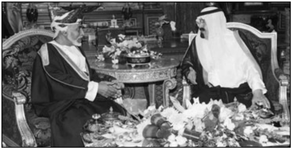
الاعمال السعودي الملك عبد الله بن عبد العزيز والسلطان قابوس بن سعيد خلال لقائهما في جدة امس