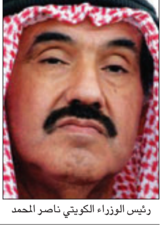
رئيس الوزراء ناصر المحمد

لندن - «القدس العربي»: أعلن عماد السيد الحامى الخاص لرئيس مجلس الوزراء الكويتي الشيخ ناصر المحمد، انه ستمت ملاحقة الكاتب محمد الوشيحي وجريدة «الدستور» المصرية قضائيا في جمهورية مصر العربية. وقال السيد ان قضية سيتم تحريكها في هذا الصدد بتهمة السب والقذف والمساس بكرامة رئيس الوزراء، مضيفا بقوله «كنت اتمنى لو ملك الكاتب الشجاعة ليكتب ما كتبه من اساءات في احدى الصحف أو المنتديات الكويتية». وكان الجيشي كتب مقالا ساخرا في صحيفة «الدستور» المصرية تحت عنوان «الصبريون في نعمة»، انتقد فيه الحكومة الكويتية؟ وكانت الكويت قد شهدت خلال الفترة الأخيرة عددا من الاعتصامات والمهرجانات الخطابية للمطالبة بالإفراج عن الكاتب الصحفي محمد عبدالقادر الجاسم الذي يقبع في السجن المركزي بعد اتهامه بنشر مقالات يرى البعض انها مساس بالذات الاميرية التي صانها الدستور الكويتي. الى ذلك تقدم النائب الكويتي المعارض خالد الطاحوس الاحد بطلب لاستجواب رئيس الوزراء الشيخ محمد الصباح على خلفية مشكلة تلوث في منطقة سكنية. وقال الطاحوس بعد تقديمه بالطلب في البرلمان ان «الاستجواب انساني بالدرجة الاولى وانا تقدمت به بعد ان فشلت كل محاولاتي لحل مشكلة