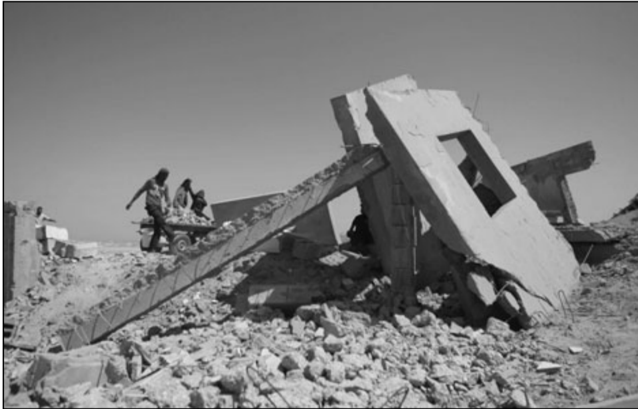
آثار القصف الاسرائيلي على رفح

غزة - «القدس العربي» من اشرف الهور: شن الطيران الاسرائيلي يوم امس سلسلة غارات جوية استهدفت مطار غزة الدولي وحدثت فيه دمارا كبيرا، هي الثانية خلال الـ 24 ساعة الماضية، عقب سقوط صاروخ على النقب الغربي، فيما لقي ستة شبان حتفهم خلال انفجار وقع في احد انفاق التهريب المقامة اسفل الحدود مع مصر.