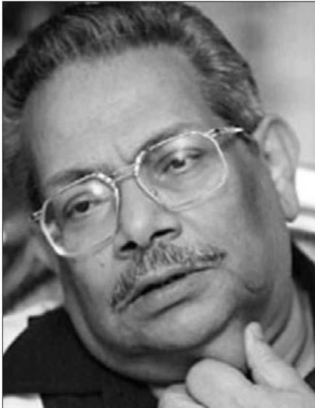
اسامة انور عكاشة