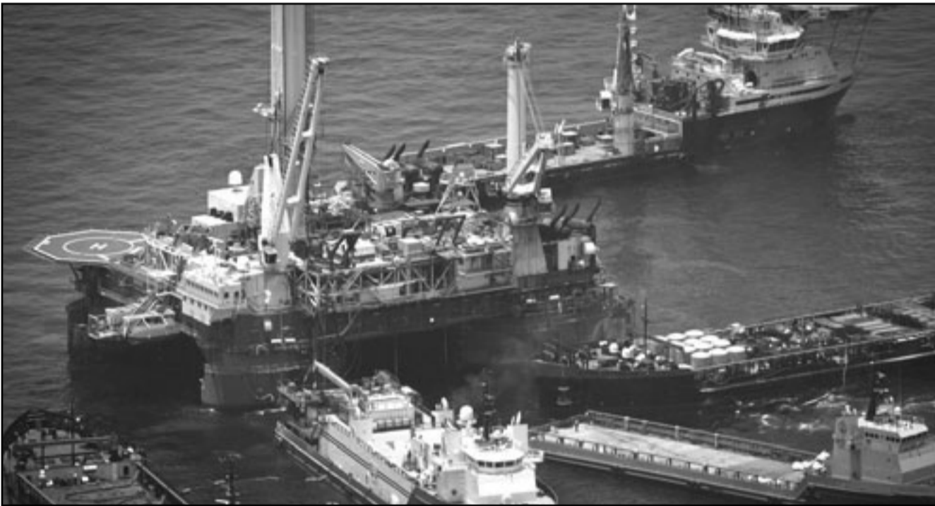
سفن اسناد حول منصة تنقيب احتياطية قرب منطقة التسرب النفطي قبالة سواحل لويزيانا

■ واشنطن - فينيس - وكالات الأنباء: أكد المدير العام لمجموعة بريتش بتروليوم بيوب دادلي امس الأحد أن مجموعته ستعمل على محاولة احتواء التسرب النفطي في خليج المكسيك بغطاء جديد «حتى اب/اغسطس على الأقل» بانتظار الانتهاء من الابار الثانوية بعد فشل محاولة سد البئر بالاسمنت. وقال مسؤول بي.بي لشبكة سي.ان. ان «هذه العملية ليست دون مخاطر ولم يتم اختبارها في السابق على هذا العمق» البالغ 1500 متر. ولغاية الآن ينتشر النفط في مياه خليج المكسيك بونيرة مليونين إلى ثلاثة ملايين لتر يوميا منذ غرق المنصة ديبووتر هورايزن حسب مجموعة خبراء مكلفة من قبل الادارة الأمريكية. ساقت بريتش بتروليوم دعوت في وقت سابق السبت الأمريكيين إلى «الطلي بالصبر»، وتخضع المجموعة لضغوط كبيرة من الرأي العام الأمريكي والادارة الأمريكية التي تعيش هاجس الكارثة السياسية التي نجمت عن عدم تحرك ادارة الرئيس الأمريكي السابق جورج بوش الكافي إزاء اعصار كاترينا في العام 2005 في المنطقة نفسها. وتوجه (اوباما) يوم الجمعة الماضي إلى لويزيانا (جنوب الولاية الأكثر تضررا من بقعة النفط، وأعلن زيادة