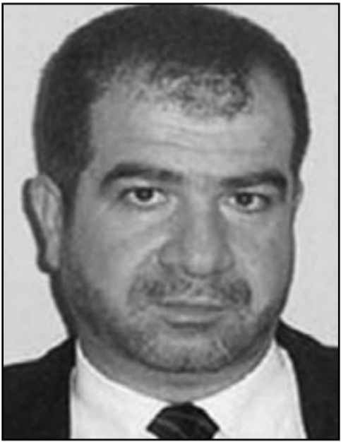
الشيخ علي ابو السكر

فيها الكثير، وبالنسبة لابو السكر كان المستفيد الاكبر بعد الانتخابات الذي قد تاتي به ترتيبات الايام القليلة المقبلة لان مجلس الشورى، كما قال ابو السكر، سيستكمل في الاجتماع المقبل اختيار اربعين العام واعضاء المكتب التنفيذي وبالنسبة للجمع لا زالت صيغة «لا غالب ولا مغلوب» عنصر الامام والاسلاميين بعد الاتواء الخشن لاعاق ازمة تحصل داخل بينهم منذ عام 89 اسبوع متكامل لاستيعاب الهزات الارتدادية وتعريف بقية تفاصيل صفقة تنحية بني ارشيد. بعد هذا الاسبوع ستبدأ معركة جديدة من طراز مختلف عنوانها هذه المرة الموقف النهائي من المشاركة في الانتخابات العامة وفقا لقانون الدائرة الافتراضية الذي يرى فيه الرافقون صيغة مناسبة جدا للاسلاميين.