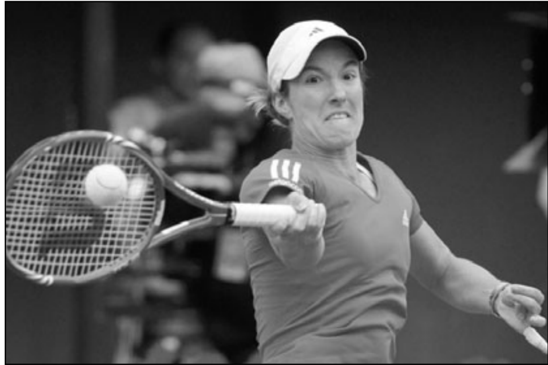
البيجيجية جوستين هينان

وأضافت «في التنس أي شيء قد يحدث سريعا، أريد أن أصل إلى أبعد حد ممكن، لدي حافز كبير». وفي الدور الرابع لفئة السيدات تغلبت