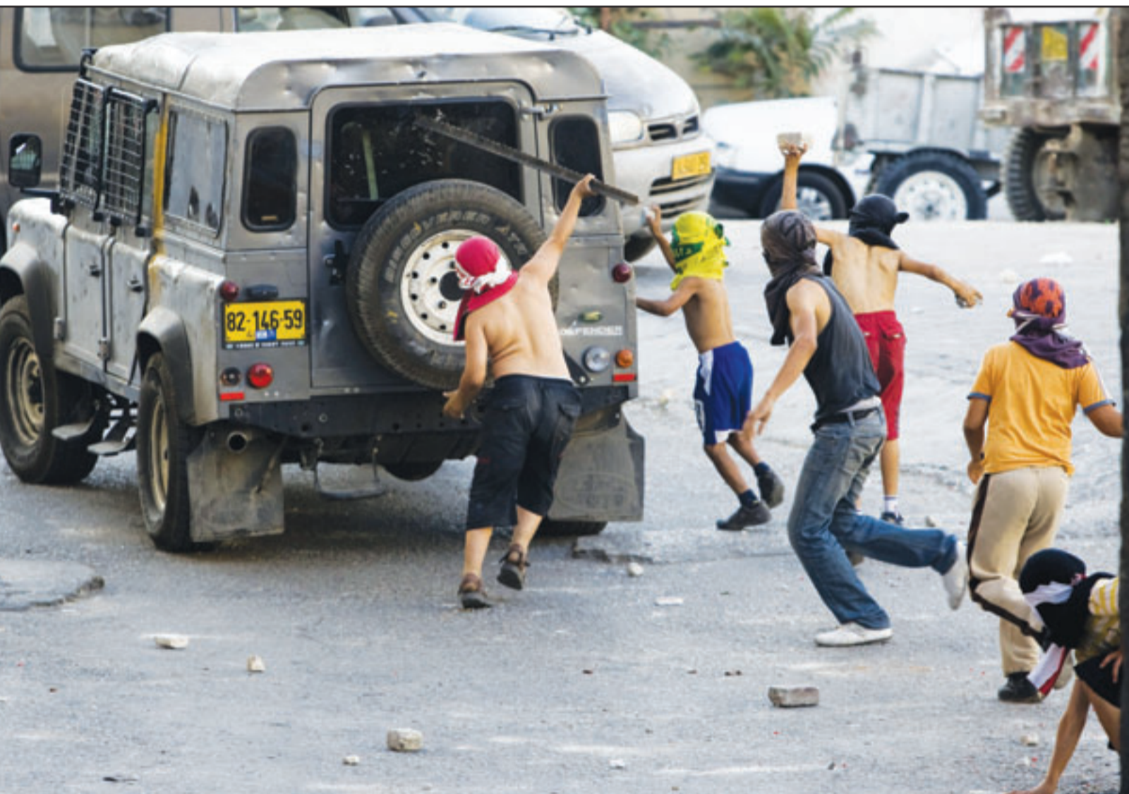
فتيان فلسطينيون يرشقون سيارة لقوات الاحتلال الاسرائيلي في حي السلوان بالقدس الشرقية

بنغلاديش - د ب ا: أعلن مصدر رسمي ان شبكة الانترنت بسبب قضية الرسوم الكاريكاتورية للنبي محمد وصور «مفقتة» لقيادة هذا البلد المسلم نشرت على موقع التواصل الاجتماعي. وقالت لجنة تنظيم الاتصالات في بنغلاديش ان الموقع حجب مساء السبت واعتقلت الشرطة شاباً، وصرح الرئيس الانتقالي للجنة محمود ديوار ان القرار اتخذ بعدما «جرح الموقع المشاعر الدينية للاغلبية المسلمة من سكان البلاد». وأضاف ان «بعض الصلات في الموقع ايضا تحوي صوراً مفقتة لقائدها بما في ذلك لابي الامة الشيخ محيى الرحمن ورئيسة الوزراء الحالية الشخبة حسينة واجد».