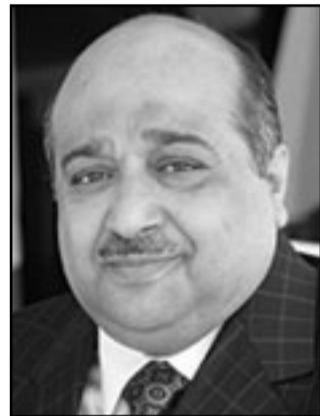
محمد بن عيسى الجابر

هيومن رايتس ووتش يفيد بأن مدير المقر اجري الاتصالات عديدة بالشيخ محمد بن عيسى الجابر بشأن الموقف القائم في مقر الظهران. وكانت مجلة «فوربس» قد اوردت في عام 2010 الشيخ محمد بن عيسى الجابر في المركز 39 من بين اغنى اغنياء العالم، والشيخ الجابر يشغل أيضا منصب مبعوث خاص لليونسكو معني بالتعليم والتسامح والثقافات في الشرق الأوسط، وهو محدث باسم الأمم المتحدة في بعثيات إعادة ابتكار الحكومات، وكتيب اليونسكو الخاص بحام 2010 المعني بالتونج الحضاري ورد فيه وصف «قيم الضيافة السخنة والكرم، تعلي منها مجموعة شركات ام بي أي الجابري إلى أعلى المستويات، وتشي بالتحضّر والمدن، ومن ثم الحضارة». ولم ترد اليونسكو على سؤال «هيومن رايتس ووتش» الذي أرسل إليها في 20 ايار (مايو) بشأن الجابري، على ضوء وضع العمال في شركة «جداول» الدولية في الظهران، ولم تتصل وزارة العمل السعودية، التي تتبعها محاكم العمل، ولم تبادر