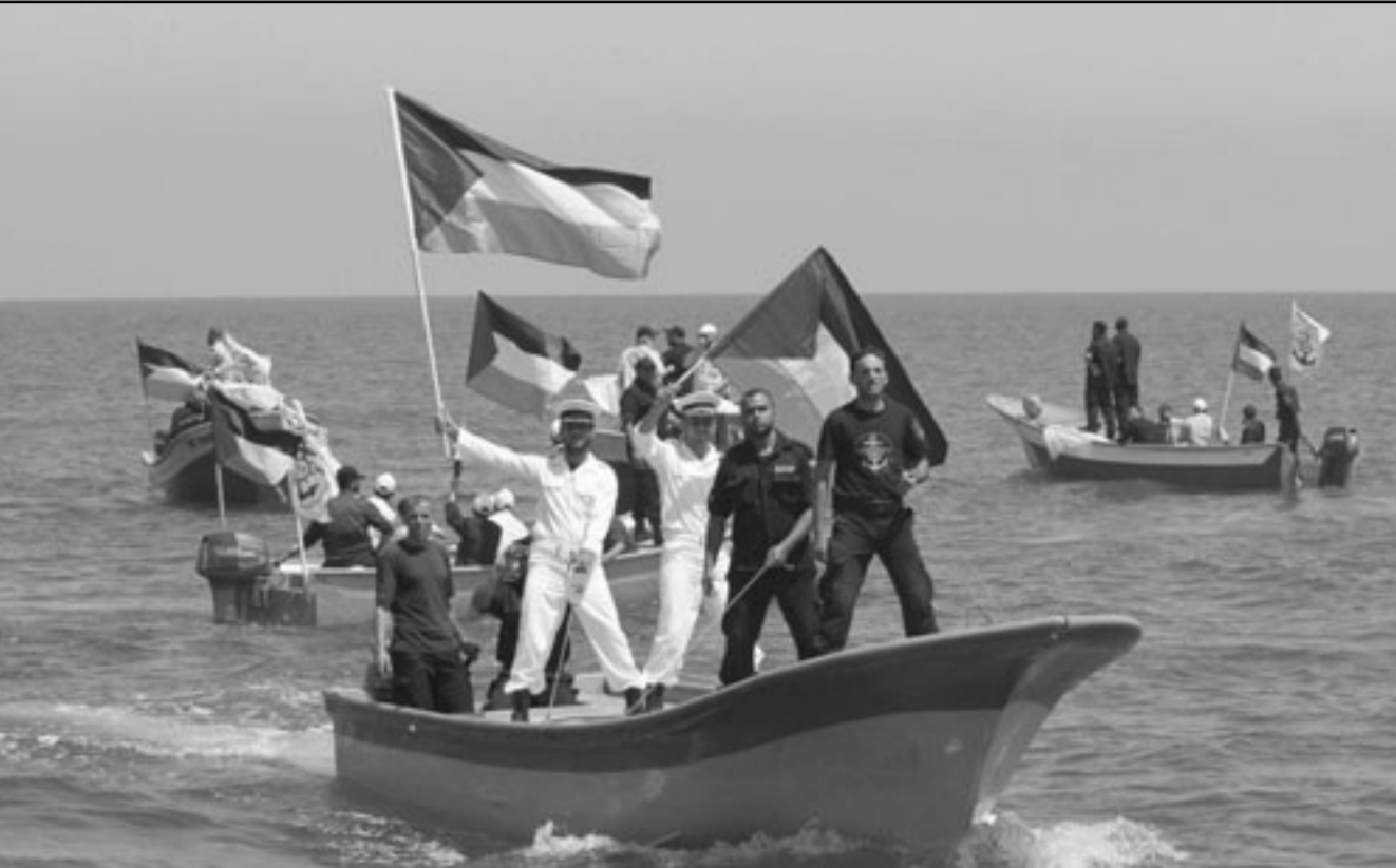
عناصر من شرطة حماس يحملون الاعلام الفلسطينية وينتظرون اسطول الحرية وسط البحر

تصريح تلقته «القدس العربي» نسخة منه ان التهديتات الاسرائيلية «لم تؤثر على خط سير اسطول الحرية»، ودعت الحملة المجتمع الدولي لحماية القوايين الانسانية والدولية، وقالت ان عدم تحرك المجتمع الدولي لمواجهة «العريضة الاسرائيلية» تجاه اسطول السفن سيشكل «وصمة عار جديدة على جبين هذه الدول التي تتغنى بحقوق الانسان».