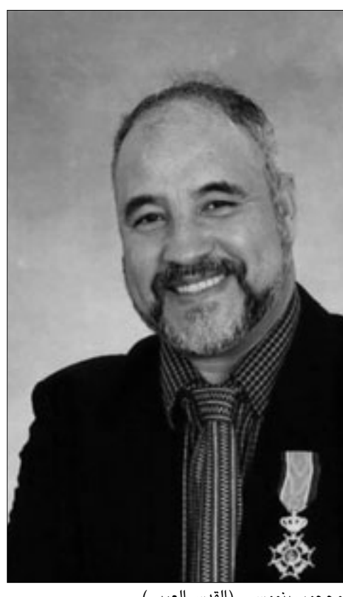
محجوب بنموسى (القديس العربي)

الدور التي تعبر عن انتمائهم العربي فلا يستعنيون به إلا في الأعمال التي تحتاج إلى شخصيات عربية، مع العلم بأنه قادر على تجسيد كل الأدوار وإقناعنا بما فيها الأدوار الهولندية، ونتمنى رغم ما جئنا به من مكاسب في هذا المجال أن يتم التعامل معنا على أساس أننا فنانون هولنديون بالدرجة الأولى وأن لا يتم التفرقة بيننا في هذا الشأن. في مبادرة هي الأولى من نوعها في أوروبا إن لم يكن في العالم أجمع تقوم مؤسسة الجسر في هولندا مرة كل سنتين، بتنظيم أكبر تظاهرة سينمائية مغربية خارج المغرب؟ هل يمكنكم تعريفنا على هذه المؤسسة؟ مؤسسة الجسر هي مؤسسة مغربية هولندية تهدف إلى تعزيز الرؤية الثقافية المغربية والتعريف بها داخل هولندا، ومن خلال هذه الرؤية تسعى إلى إرساء جسر ثقافي بين الثقافة المغربية والثقافات الأخرى بما فيها الهولندية، إذ تقوم بتنظيم فعاليات ثقافية مختلفة ومتعددة، كما تقوم بخلق الفعاليات المناسبة وتوفير الإمكانيات اللازمة لتحقيق تلاحق الثقافة المغربية بالثقافات الأخرى، كما تبادر إلى إقامة شراكات وعلاقات ثقافية مع الجمعيات والمؤسسات الهولندية لتحقيق عمل مشترك... وغيرها من المهام التي تهدف في مجملها إلى التعريف بالثقافة المغربية.