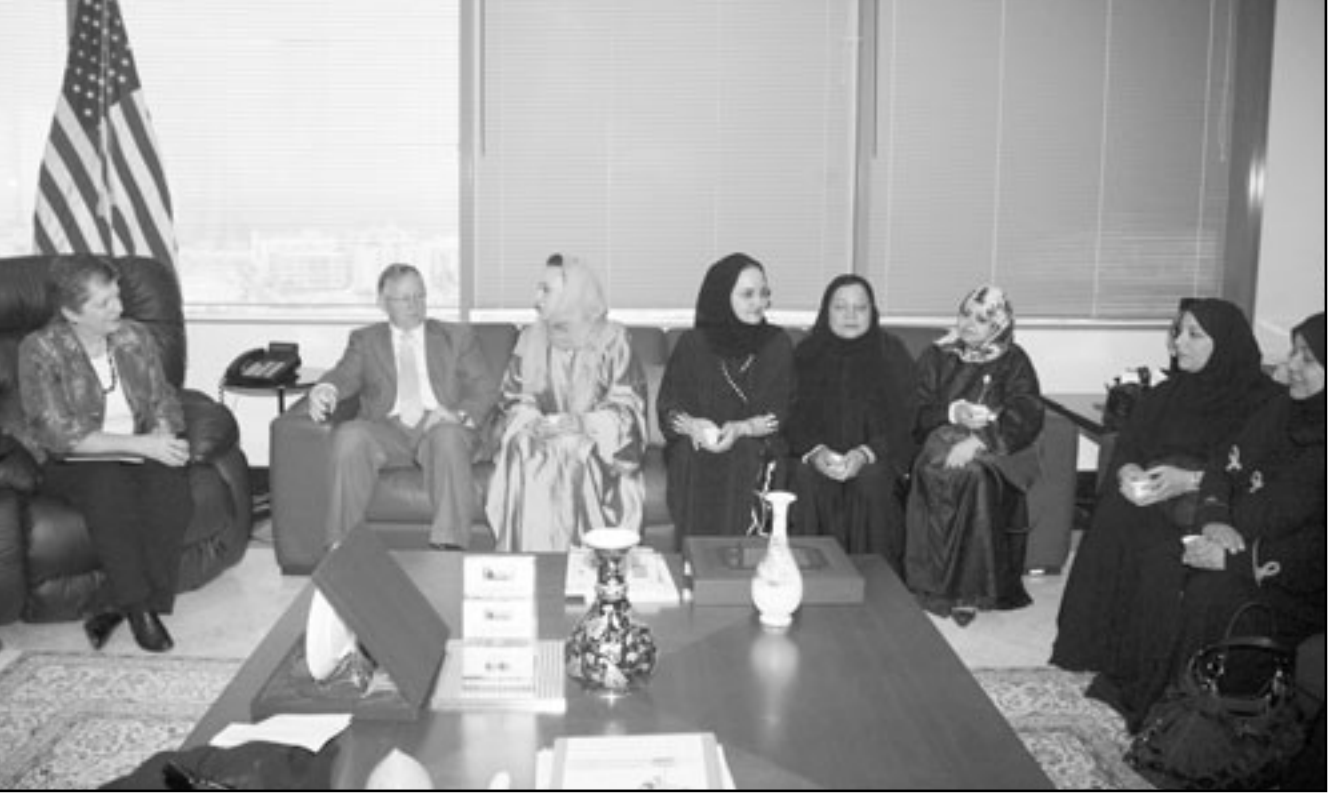
وزيرة الامن الداخلي الامريكية جانيت نابوليتانو خلال لقاء مع سيدات اعمال سعوديات في جدة امس

جدة (الملكة العربية السعودية) - ف ب: شددت وزيرة الامن الداخلي الامريكية جانيت نابوليتانو الاثنين من جدة (غرب) على «التعاون الامني المتين جدا» بين السعودية والولايات المتحدة اللتين تتابعان باهتمام بالغ تحركات المتطرفين في اليمن على حد قولها. وقالت نابوليتانو بعد لقاء العاهل السعودي عبدالله بن عبدالعزيز ان «التعاون في المجال الامني متين جدا مع السعودية». وناقش الطرفان البرامج المخصصة لمكافحة التطرف والجهود التي تبذل من اجل الحؤول دون تنفيذ هجمات بحسب الوزيرة الامريكية. وكررت الوزيرة ان بلادها تتعاون بشكل وثيق مع اليمن لمكافحة التطرف الاسلامي. وقالت «نحن قلقون جميعا من النشاطات الارهابية في اليمن، وما تقوم به الولايات المتحدة في اليمن يتم بالتوافق والتعاون مع الحكومة اليمنية». وبحسب الوزيرة، فان واشنطن تساعد الرياض على حماية الحدود السعودية اليمنية التي يتسلل عبرها المتطرفون وتجار المخدرات. وقالت «لقد تفرقتنا اليوم الى سبل حماية الحدود بين اليمن والسعودية، لكن الوزيرة امتنعت عن التعليق على الهجوم الاسرائيلي الدامي على «اسطول الحرية» الذي كان يحاول كسر الحصار على قطاع غزة. ومن المفترض ان تتجه نابوليتانو الى الامارات بعد السعودية للمشاركة في مؤتمر حول سلامة الطيران المدني.