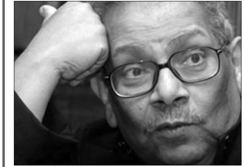
أسامة أنور عكاشة

الثابت؟ ماذا سافعل بهما ومن سيرد علي؟ هكذا ترحل دون أن أسمع صوتك مرة أخرى، وأنت تردد كالعادة: «واحد بالك» لتناك من انتباهي.. ما أقسى أن تجد نفسك مجبرا على أن تكتب عن ترحيلهم بكلمة «كان» في حين ما زال قميصه مبتلا بعرقه الذي لم يجف بعد، تذكرت هذا المشهد، وأنا أعيد تشغيل شريط حوارَي الأول مع عميد الدراما العربية، الكاتب الكبير أسامة أنور عكاشة. سجدتُ العرق، لكن سيقى صوتك، أيها الغالي.. حيا، نابضا، شاهدا على خسارة كبيرة بالنسبة لي، فلولا ما تورطت في محبة السرد. وصلني خبر رحيل أنور عكاشة في إيميل مقتضب، تحت عنوان «عاجل»، من صديق يعرف أنني مهووس بأسامة حد عبادة البطل، لكن ما فتنتني به - منذ بداية التسعينات - كان عبقريته السردية / الدرامية... بينما ما زلت نادر الاهتمام بمقالته وتصريحاته النارية. كان الخبر من دون تفاصيل، وهكذا وجدته مرتكبا، غير مصدق، غير قادر على كبح جماح دموعي، ودون حتى محاولة التناك من الخبر.. ما أنتني أكثر أنني اعتبرت نفسي مقصرا عما فعلته في لولا به هاتفيا، أو على الأقل إرسال رسالة قصيرة.. تدعو له بالشفاء العاجل.. أتالم... لأنه رحل دون أن أسمع صوته.. لأخبر مرة، وأتساءل: هل أحذف رقم هاتفه الحاصل ورقم هاتفه السكندري