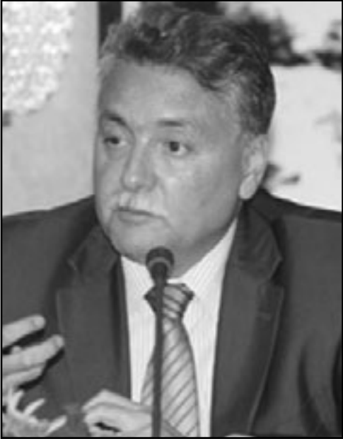
الوزير السابق نيل بن عبد الله

وكان المؤتمر، الذي انعقد تحت شعار «جيل جديد من الإصلاحات مغرب الديمقراطية»، قد صادق ليلة الأحد - الاثنين على تشكيلة مجلس الرئاسة الذي تم استحداثه ضمن التركيبة التنظيمية للحزب بعد إدخال المؤتمر تعديلات دولية ومترجم مختلف منذ 1987.