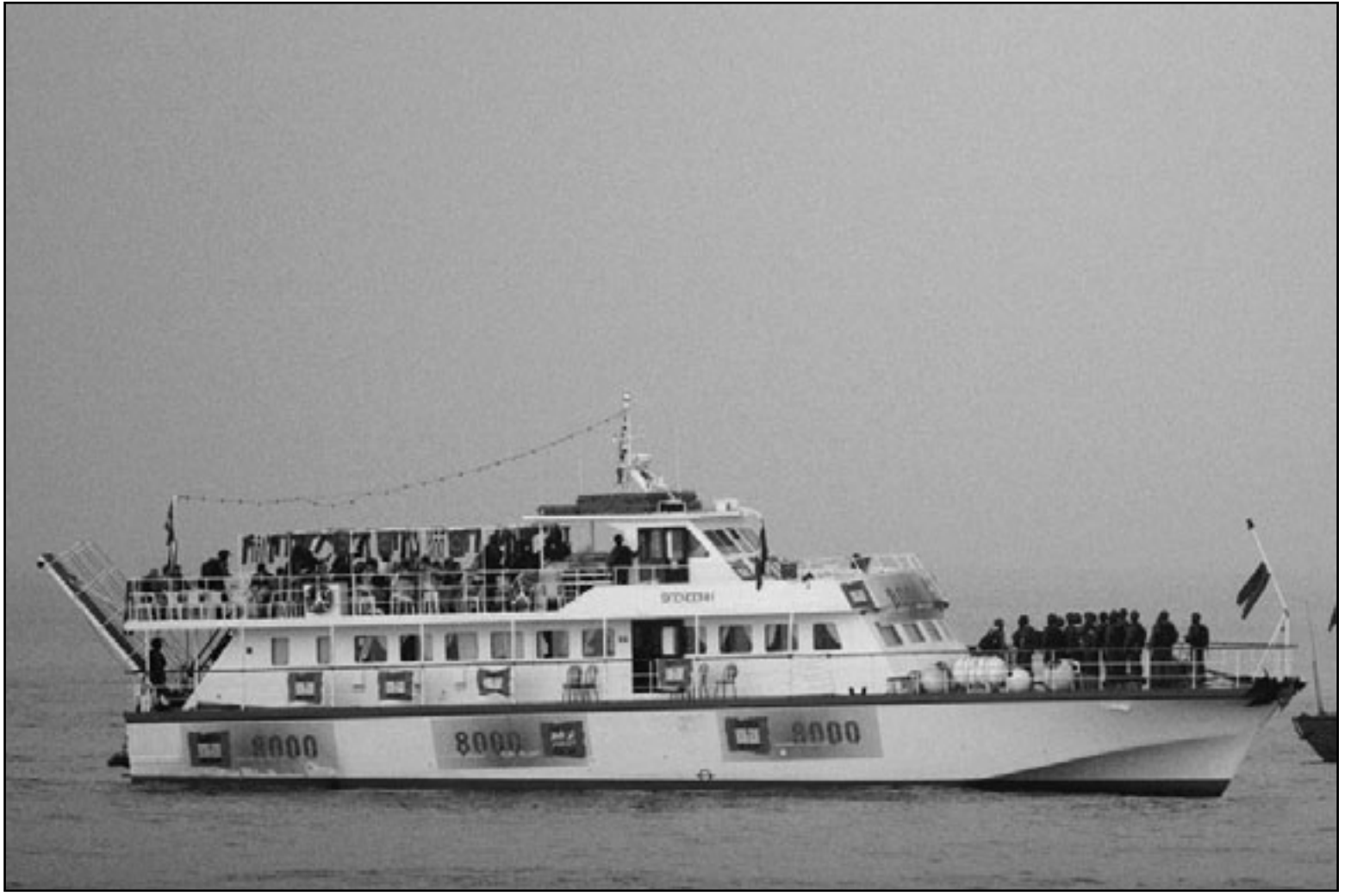
وحدات الكوماندوس الاسرائيلي بعد اقتحام احدى السفن في قافلة اسطول الحرية اثناء توجيهها الى قطاع غزة . وجندي اسرائيلي يراقب الهجوم من الساحل