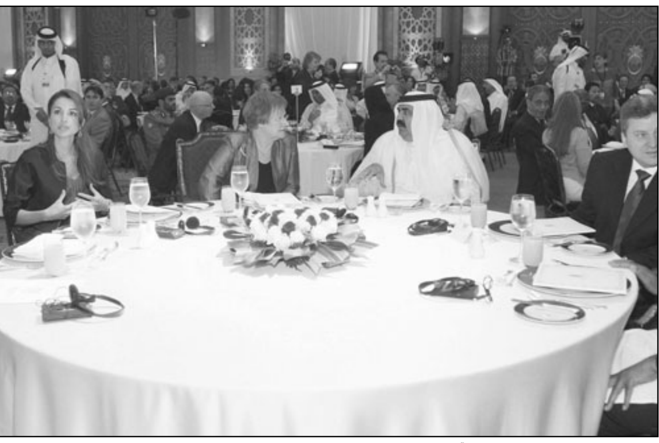
امير قطر الشيخ حمد بن خليفة آل ثاني والملكة رانيا العبد الله وعدد من المشاركين خلال مأدبة غداء أقيمت على هامش منتدى الدوحة

وأوضح كولر أنه أبلغ رئيس المجلس الاتحادي، ينز بورنزن، بتقدمه استقالته وسيقولى بورنزن، طبقا للدستور، منصب رئيس الجمهورية بصفة مؤقتة لحين انتخاب رئيس جديد للبلاد. تأتي استقالة الرئيس الألماني في مرحلة حرجة تمر بها الحكومة الألمانية برئاسة المستشارة أنجيلا ميركل، حيث