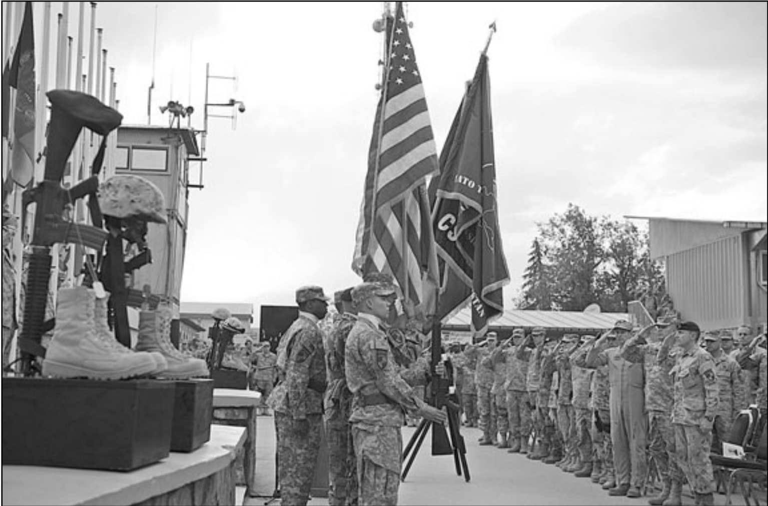
جنود من حلف الناتو خلال توديع جنائمين اصدقاء لهم سقطوا في افغانستان

في منطقة بانجواي في إقليم قندهار. وأضاف أن الغارة الجوية شنت بعد أيام من تتبع أمير ومقاتليه لعدة أيام حيث توقفوا في كوخ غير مأهول بالسكان بالقرب من قرية زانج آباد. وأشارت «إيساف»، أن أمير كان ضمن مئات السجناء من طالبان الذين فروا من سجن في عاصمة الإقليم التي تسمى أيضا «قندهار» في حزيران (يونيو) 2008 ويقود منذ ذلك الحين هجمات طالبان في مناطق داند وزهيري و بانجواي. وأضافت القوات الدولية أن «أمير كان موجودا في الآونة الأخيرة في باكستان للتخطيط لهجمات طالبان المقبلة، وعاد إلى افغانستان في نيسان (أبريل) ليقود الهجمات ضد قوات التحالف في ولايات أفغانستان». وتأتي الغارة وسط استعدادات لنحو 12 ألفا من القوات الأفغانية وقوات الناتو لشن عملية عسكرية في إقليم قندهار. وأعلن الناتو رسميا مؤخرا أن قوات الحلفاء تعتزم القضاء «على أكبر عدد من قادة طالبان بقدر ما نستطيع» قبل بدء العملية في قندهار. يذكر أن قندهار هي المعقل الروحي لحركة طالبان وكانت مقرها الرئيسي من عام 1995 وحتى أواخر عام 2001 عندما أطاح بها في غزو قادته الولايات المتحدة الأمريكية. وقال مسؤولون أفغان ومن الناتو إنهم ياملون في تغيير الاتجاه إلى القتال ضد المسلحين في قندهار ويجبرونهم على إجراء مفاوضات سلام مع الحكومة.