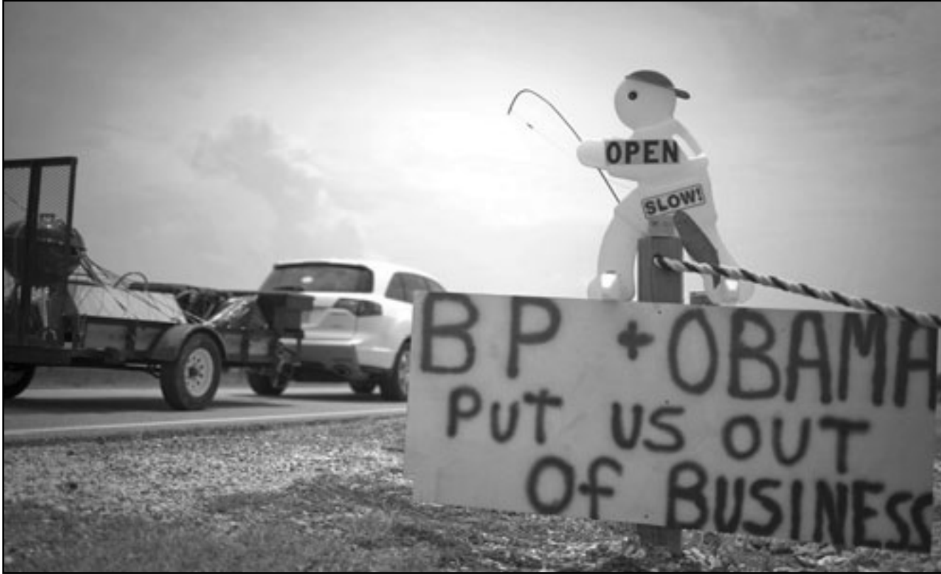
ياضفة على جانب الطريق وضعا سكان جزيرة قرب سواحل لويزيانا التي تضررت من البقع النفطية كتب عليها «بي بي وأوباما أخرجنا من مجال العمل».

الاسبوع الماضي الى ان كمية تتراوح بين 12 الف برميل و19 الفاً تتسرب يوميا من البئر وهي ارقام تزيد كثيرا عما اعلنته بي.بي. وهو خمسة آلاف برميل يوميا. وقال أوباما يوم السبت الماضي «إن كل يوم يمر مع استمرار هذا التسرب يمثل اعتداء على اهالي منطقة ساحل الخليج وعلى أرزاقهم والثروة الطبيعية التي تحضنا جميعا».