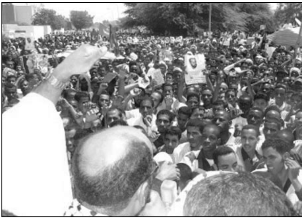
من المظاهرات الحاشدة في نواكشوط أمس

وحسب مقتضيات القانون الأساسي لحزب التقدم والاشتراكية فإن اللجنة المركزية تنتخب الأمين العام للحزب بالأقتراع السري بالأغلبية المطلقة، وباستناد نظام الدوريتين إذ إن يحصل أي من المرشحين على الأغلبية المطلقة.