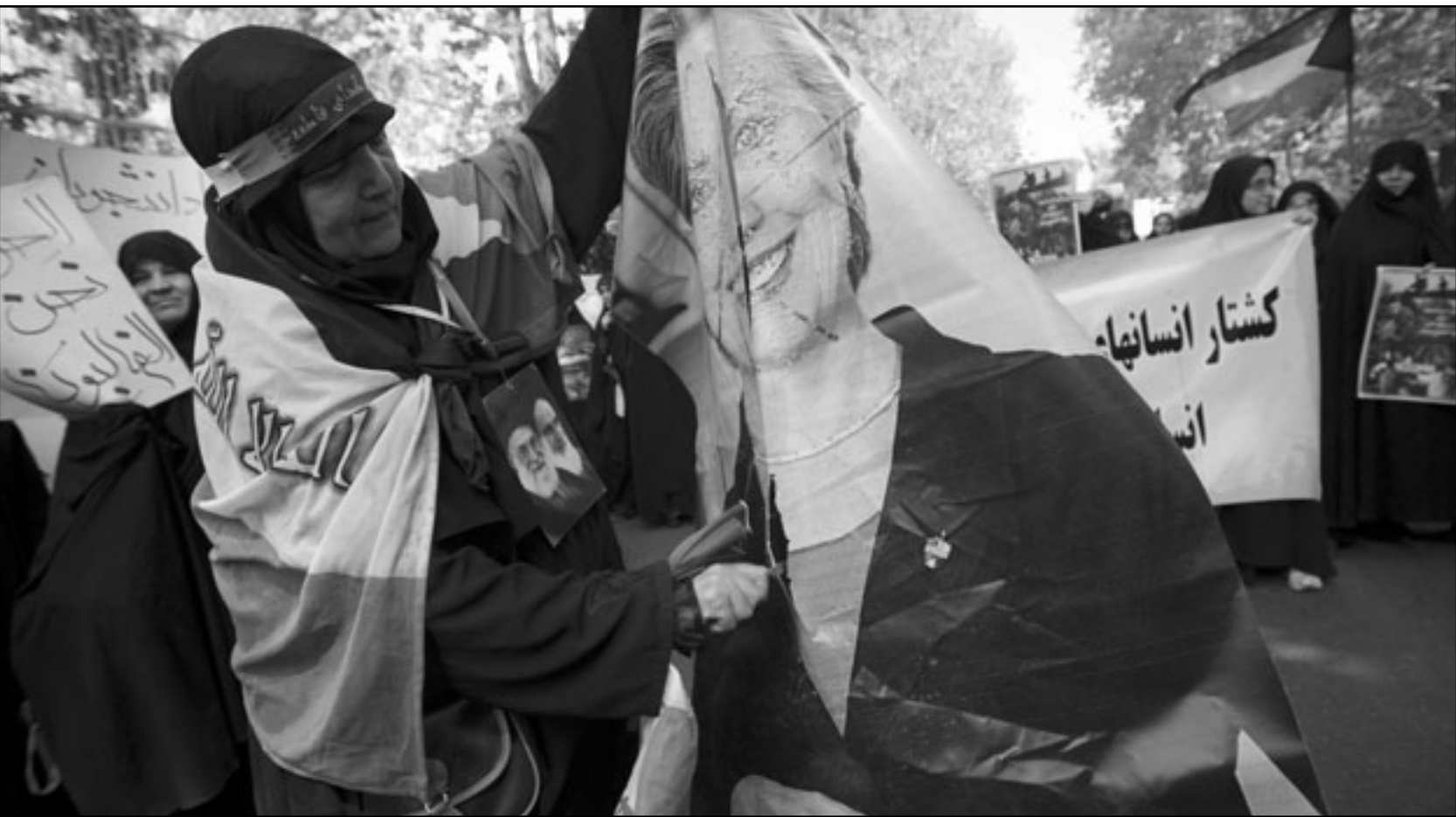
متظاهرات إيرانيات يرفعن صورة مجسمة ليهلاري كلينتون احتجاجا على الهجوم الاسرائيلي على اسطول الحرية في البحر

يو سي بيلين ■ في صيف 2005 غادرت اسرائيل بقيادة حكومة الليكود، قطعا غزة- اليسار، الذي انتقد الانسحاب من جانب واحد، ورآه اضاعا لتسوية سياسية مع محمود عباس، الرئيس الفلسطيني الجديد، أيد الانسحاب فقط لأنه ظن أن البقاء في غزة حماقة أكبر من تركها بغير تسوية. وفعل رئيس الحكومة آنذاك، ارييل شارون، ذلك لأنه لم يؤمن بأي تحاد مع العرب، ومن المحقق أنه لم يظن أنه يمكن التوصل الى سلام معهم. لقد فهم المشكلة السكانية ومعنى التدهور الى وضع تتسيطر فيه قلة يهودية على كثرة فلسطينية. ولهذا ضحى بأقل الامور أهمية في رأيه أي بقطاع غزة. لم يستجب شارون لفكر ترك شمالي القطاع في يد اسرائيل أو تحتفظ بمحور فيلادلفيا، لأنه أراد أن يعرف العالم أن غزة لم تعد جزءا من الاحتلال الاسرائيلي. كان ذلك خطأ شديدا. لم تحصل اسرائيل على أي وعد من أي