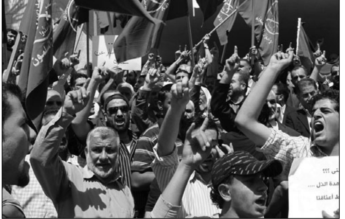
اردنيون يتظاهرون ضد الجزرة الاسرائيلية

بشعة ومرفوضة ومدانة... لا شيء مطلقا يبرر استخدام القوة ضد المدينين في هذه المهمة الإنسانية». وأضاف الشريف أن على المجتمع الدولي «التحرك الفوري والحازم للضغط على اسرائيل لرفع حصارها الظالم عن قطاع غزة وأهله