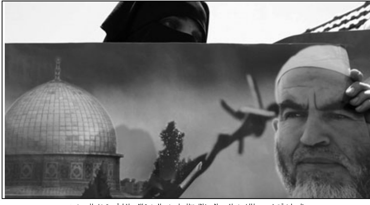
فلسطينية ترفع صورة للشهيد رائد صلاح خلال تظاهرات ضد المجزرة الاسرائيلية بحق نشطاء مدنيين

دعا ميرتس إلى «إعادة النظر في صناعة القرار المتعلقة بالحدث»، وأنه «حتى لو نفذت اسرائيل قفحا السيدا إلا انه يحظر العمل بالطريقة التي أدت إلى سقوط عدد كبير جدا من القتلى والجرحى». وتكرت وسائل إعلام إسرائيلية أن عددا من الحاضرين يشن انتقادات على مدير إدارة المخابرات وجنوب اسرائيل تظهرون عند مدخل ميناء أسدود ضد العملية العسكرية الإسرائيلية وشدوا على أن «الجيش الإسرائيلي استخدم غزة والتي وصفها اللجنة بـ«المجزرة»». وحمل أعضاء كنيست عرب رئيس الوزراء الإسرائيلي بنيامين نتنياهو ووزير الدفاع إيهود باراك مسؤولية الاعتداء، ودعاوا إلى إضراب عام ووقف التظاهر وطردوه من المكان. وقالت الإذاعة الإسرائيلية إن جميع التظاهرات من من العيوديات ومن سكان جنوب اسرائيل وتظاهر عند مدخل ميناء أسدود الذي تمت قيادة