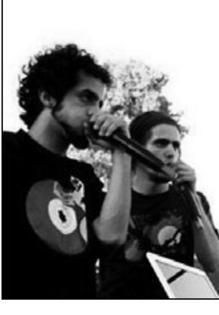
فرقة رام الله أندراوند الفلسطينية