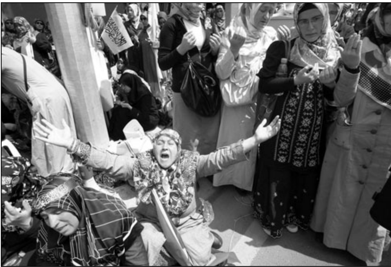
اتراك يرفعون الاعلام الفلسطينية ويتظاهرون وسط انقرة احتجاجا على الجزرة الاسرائيلية ضد اسطول الحرية وسط البحر... ووالدة ناشط مشارك في الاسطول تبكي بعد سماعها الانباء