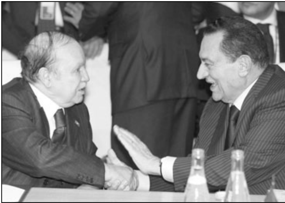
بوتفليقة ومبارك في اجتماع قمة أفريقيا، فرنسا

فيها القمة صحفية الرئيس الفرنسي ساركوزي، وتابعت «عندما التقى مبارك، بوتفليقة، الذي كان يجلس بين القادة في الصف الأول، تصافح الرئيسان بحرارة وتعانقا في لقاء أخوي حميمي يعكس عمق العلاقات القوية بينهما، وما يمله كل منهما للأخر من تقدير ومحبة».