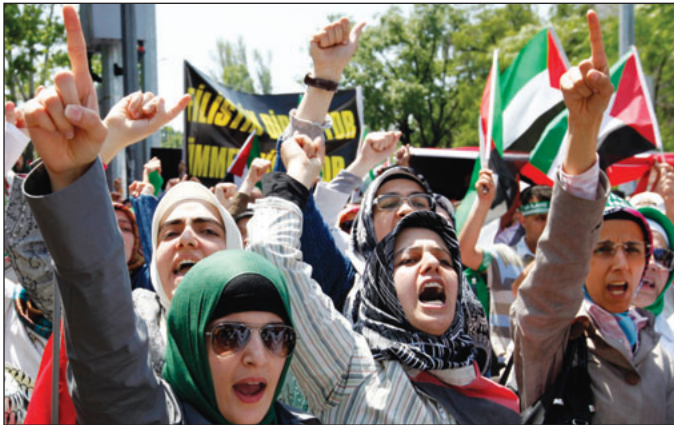
سيدات تركيات يشاركن بمظاهرة احتجاج وتندي بالجزرة الاسرائيلية امام القنصلية الاسرائيلية في اسطنبول