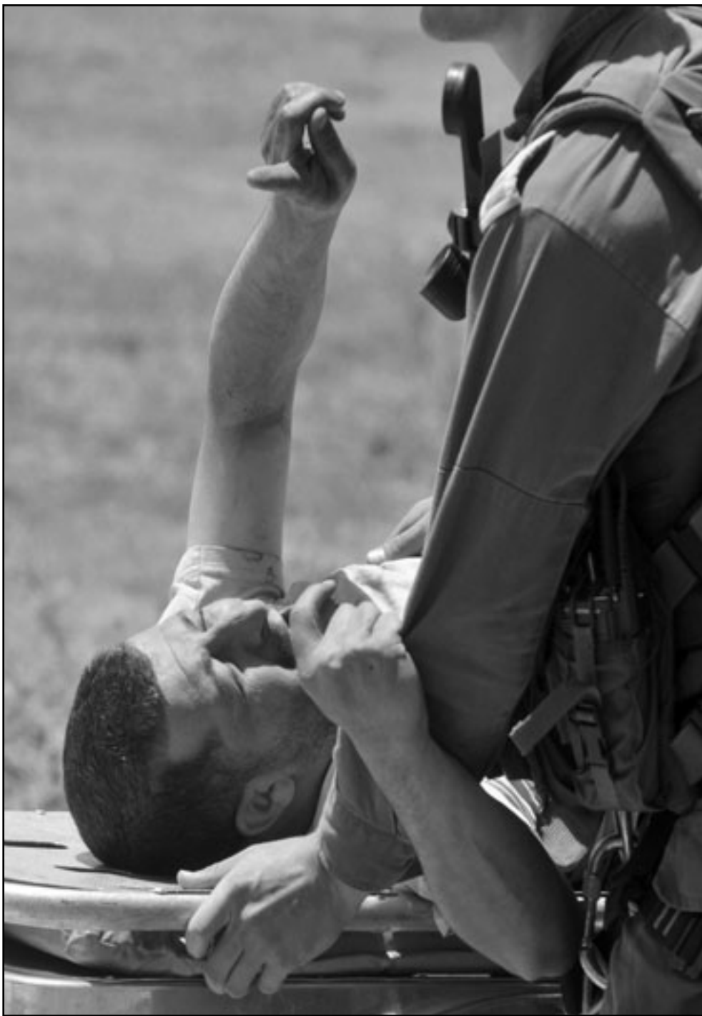
جريح اصيب في الهجوم على اسطول الحرية لدى وصوله الى مستشفى تل هشومير

إسرائيل في ورطة وتنتهيها يتابع الموقف من الخارج وأعلنت تل أبيب أن رئيس الوزراء بنيامين نتانياهو قرر عدم قطع جولته الخارجية لكندا، متابعياً التطورات الناجمة، وذكرت أنه أجرى مشاورات هاتفية مع رؤساء الأجهزة الأمنية ومع مستشاريه الذين يرافقونه في الجولة. وأيقنت شرطة إسرائيل أفرادها في حالة «تأهب عالية» تحسباً لأي طارئ. وكانت مصادر سياسية في تل أبيب طالبت بتننيهاه بقطع جولته الخارجية والعودة للبلاد، حتى لو كلف الأمر إلغاء اجتماعه بالرئيس الأمريكي باراك أوباما.