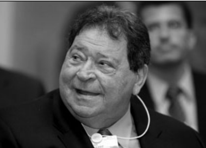
وزير الصناعة والتجارة الاسرائيلي بنيامين بن البعازر خلال مشاركة في منتدى الدوحة