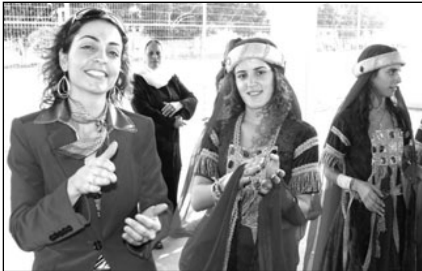
لقطة من الفيلم الوثائقي «يافا»