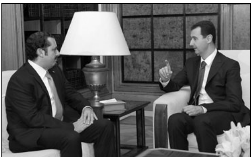
الرئيس السوري لدى اجتماعه مع رئيس الحكومة اللبنانية