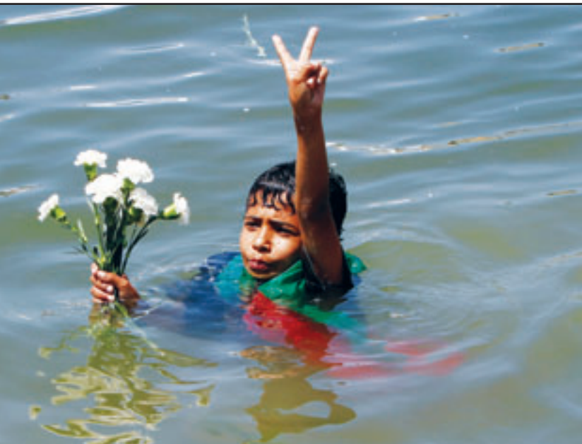
طفل من ابناء غزة يسبح حاملاً باقة ورد ويرفع علامة النصر اثناء استعداده لاستقبال قافلة الحرية