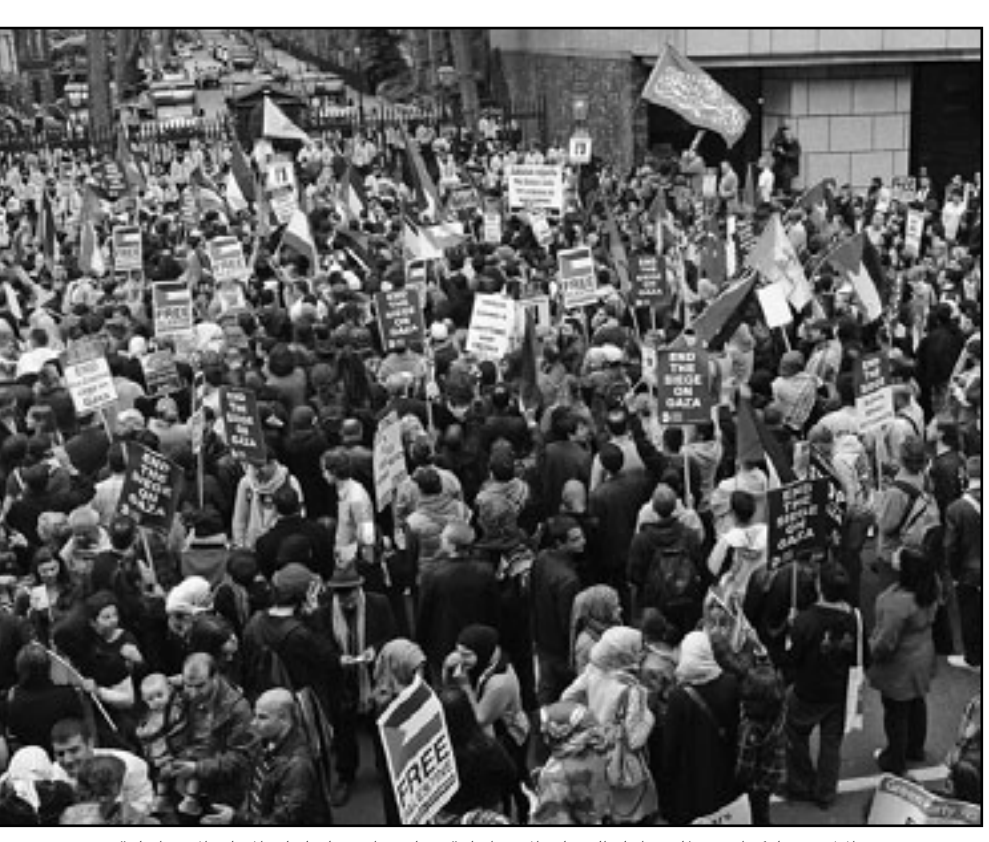
الآلاف شاركوا في تظاهرة أمام السفارة الاسرائيلية في لندن احتجاجا على المجازر الاسرائيلية

هل يمكن ان تؤدي المجزرة الاسرائيلية الى تعديل سياسة النظام المصري تجاه معبر رفح؟ هل يمكن ان تكون غطاء لفتح مستديم للمعبر في استثمار للتعاطف الدولي الهائل الذي ادت اليه المجزرة؟ ام انها لن تؤثر على سياسته تجاه معبر رفح. لا يد ان هذه الاسئلة المشروعة ستكون محل جدال واسع في الساحة السياسية والاعلامية المصرية والعربية خلال الايام المقبلة. ومن الصعب التنبؤ بالاجابة عنها، الا ان المؤكد ان المجزرة ستشدد ما يتعرض له النظام داخليا واقلبيها من احراج بسبب غزة، كما ستكرس اجواء من الارتباك تشوب الموقف الرسمي المصري بالفعل تجاه هذا الملف الشائك. وكانت وزارة الخارجية المصرية اصدرت بيان الاسبوع الماضي اكدت فيه استعدادها لادخال جميع قوافل الاغاثة الى غزة سواء جاءت عن طريق البر او البحر، وهو ما فاجأ المراقبين ان احدا لم يطلب