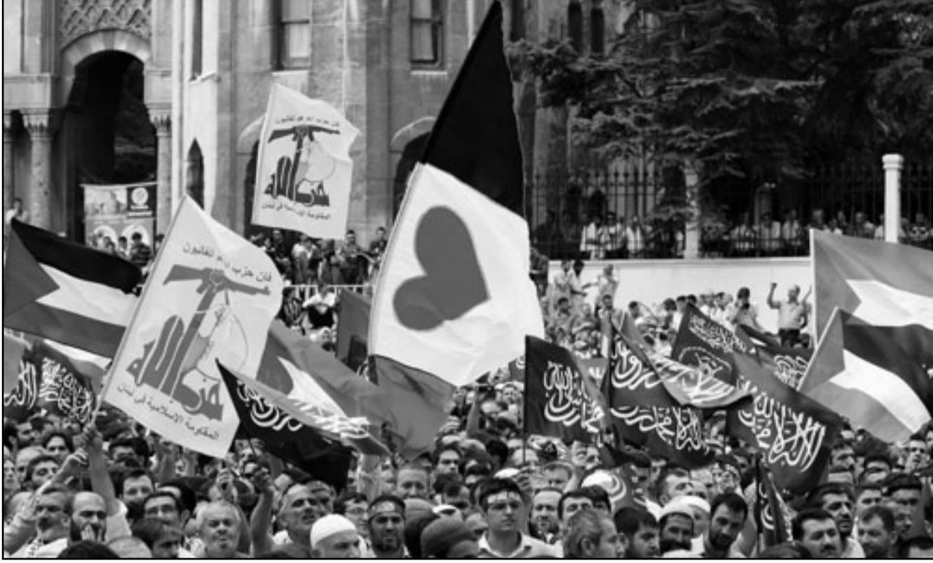
الاف من الاتراك يتظاهرون في اسطنبول احتجاجا على الهجوم الاسرائيلي الدامي على اسطول الحرية

حرب إسرائيل في غزة، وأصبح رئيس الوزراء التركي رجب طيب اردوغان منذ ذلك الحين واحدا من أشد منتقدي إسرائيل ووقعت سلسلة من الخلافات الدبلوماسية مع تازم العلاقات بشكل أكبر. ودعت انقرة بعد الغارة الاسرائيلية على سفينة المساعدات لعقد اجتماع طارىء لجلس الامن الدولي دعا لاجراء تحقيق محايد في الامر. الى ذلك نكرت وكالة انباء الاناضول ان تركيا ارسلت في وقت مبكر الجمعة طائرتين مجهزتين بمعدات طبية الى اسرائيل لاعادة خمسة من رعاياها الذين اصيبوا في الهجوم الذي شنته مجموعة كومندوس اسرائيلية على اسطول دولي صغير كان ينقل مساعدات الى غزة. ونقلت الوكالة عن السلطات قولها ان هؤلاء الأشخاص هم آخر الناشطين الباقين في اسرائيل بعد هجوم الاتئين. واوضحت وكالة انباء الاناضول انها لا تعرف متى ستعود هذه الطائرات الى انقرة. وهي تنقل ايضا فريقا طبيا يتألف من بضعة اختصاصيين. وقد نقلت جثث ضحايا الهجوم الاسرائيلي التسع (8 اترك و امريكي تركي الاصل) الى تركيا صباح الخميس، وكذلك 19 جرحيا وأكثر من 450 ناشطا. واعلن رئيس الوزراء التركي رجب