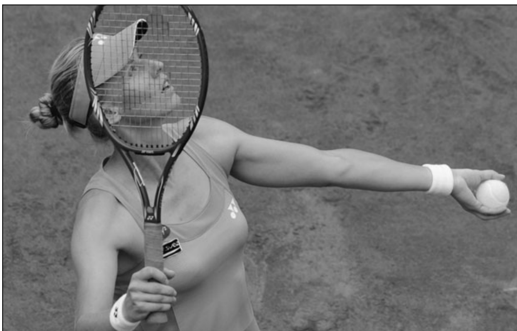
الروسية إيلينا ديميتييفا

ولجا لوف إلى تغيير كلوزه بعد الشوط الأول ودفع زميله جيرونيمو كاكوا الذي ترك انطباعا جيدا خلال المباراة وقد يقود هجوم الفريق في مبارياته بالونديال. ولم يدل لوف بأي تصريحات بهذا الشأن عقب انتهاء المباراة خاصة وأنه سيكون مستاء للغاية من استبعاد كلوزه من التشكيل الأساسي للفريق في المونديال بعد كل ما قدمه كلوزه للفريق والسجل الرائع لهذا المهاجم المخضرم. وبسجل كلوزه 48 هدفا للمنتخب الألماني ليحتل المركز الثاني في قائمة