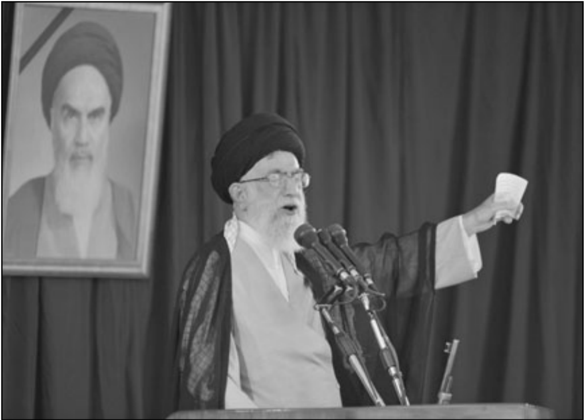
والمرشد الأعلى للمجمهورية الإسلامية آية الله علي خامنئي يلقي خطبته في ذكرى وفاة الامام الخميني