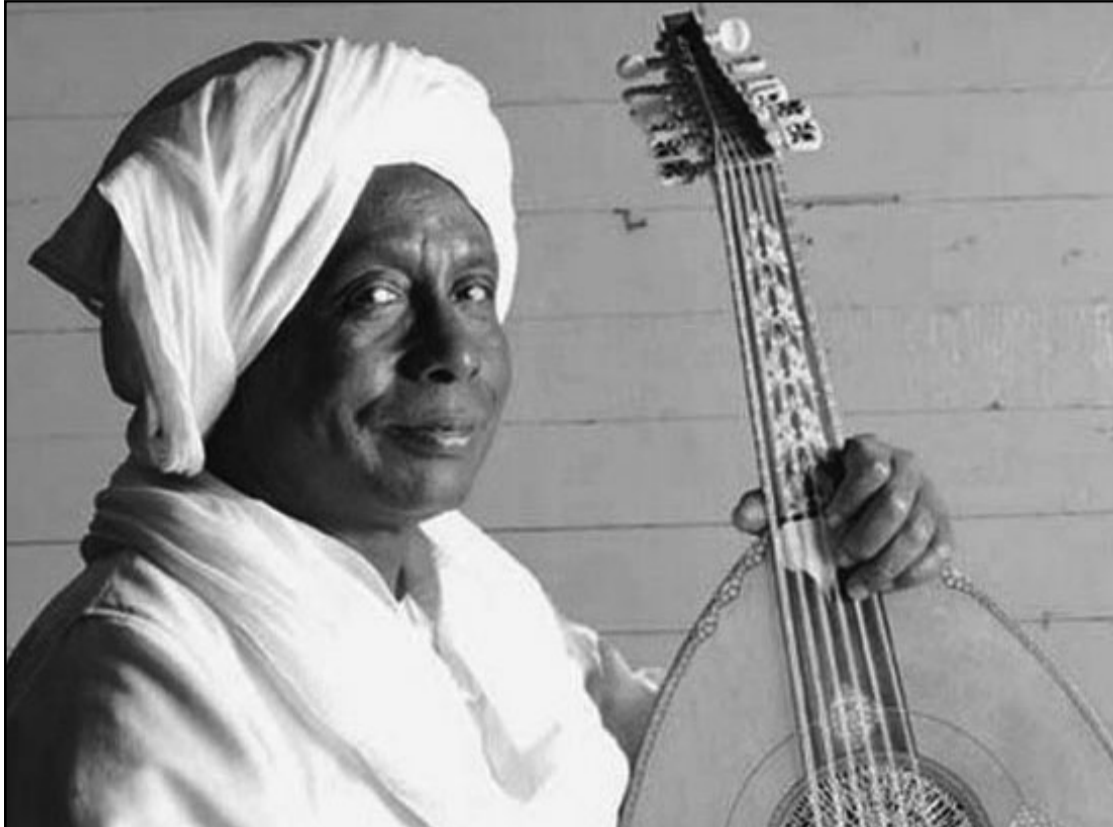
المطرب النوبي الراحل حمزة علاء الدين

على مسرح الأكاديمية المصرية بروما، كما غنى في ألمانيا وكرواتيا في إطار احتفال بالاسبوع الثقافي المصري ومعرض توت عنخ آمون، إذ غنى من التراث القديم أغنية تنعاج الجينية ومن ألحان شقيقه أكرم مراد أغنية «خبز أمي» ومن ألحانه الخاصة «ماريا» أكبر المسارح الدولية بالأمم المتحدة كان الملح الرئيسي هو ذوبان القارة الإفريقية في قالب موسيقي واحد دون النظر إلى الفوارق اللغوية أو العرقية، وقد ساعد هذا التجانس على سرعة انتشار موسيقاه وذياع صيته بين القارات البيضاء قبل السوداء، ولعل ما ورثه كرم مراد عن معلمه وأبوه الروحي تلك الثقافة التي ترفض العنصرية بين أبناء الشعب الواحد وتجعل السماعية والطبية عنصراً أساسياً من مكونات الفن وهي مدرسة ينتمي إليها الكثيرون من أبناء الجنوب والشمال، حيث الفن لا يعرف التمييز ولا يؤمن بغير الموهبة وأكبر دليل على هذه الحقيقة أن علاء الدين أقام طوال حياته في الولايات المتحدة وشارك في العديد من الاحتفالات الرسمية ووضع الموسيقى التصويرية لبعض الأفلام الأمريكية من إنتاج هوليوود، أبرزها فيلم الحصان الأسود وهو نفسه من حصل على المنحة اليابانية لدراسة المقارنة بين العود الشرقي وآلة «البيوا» اليابانية وقام بعد أن استوفى دراسته الأكاديمية بإعادة موسيقى لأشهر رقصات اليابانية في أوروبا، ومن هنا استوعب كرم مراد تلميذه التجنب الدرس فحرص على أن يكون سفيراً للنوايا الحسنة والفن أهداف بمعظم العواصم العالمية فغنى