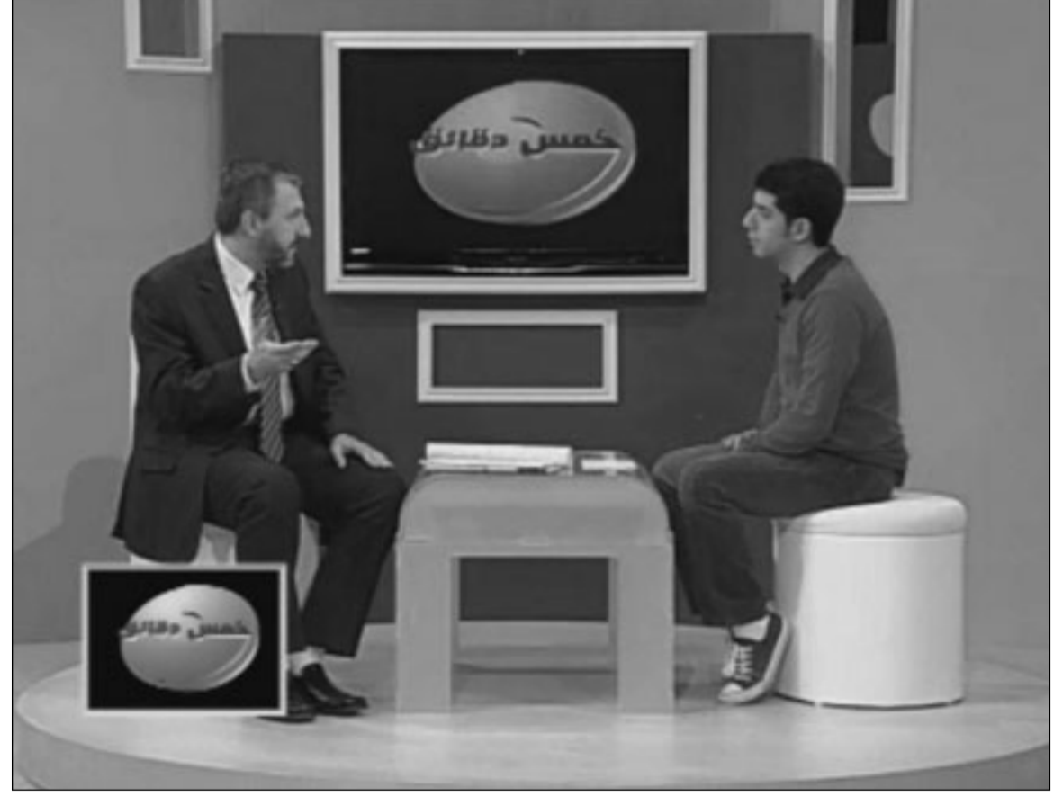
لقطة من برنامج «من حولنا»