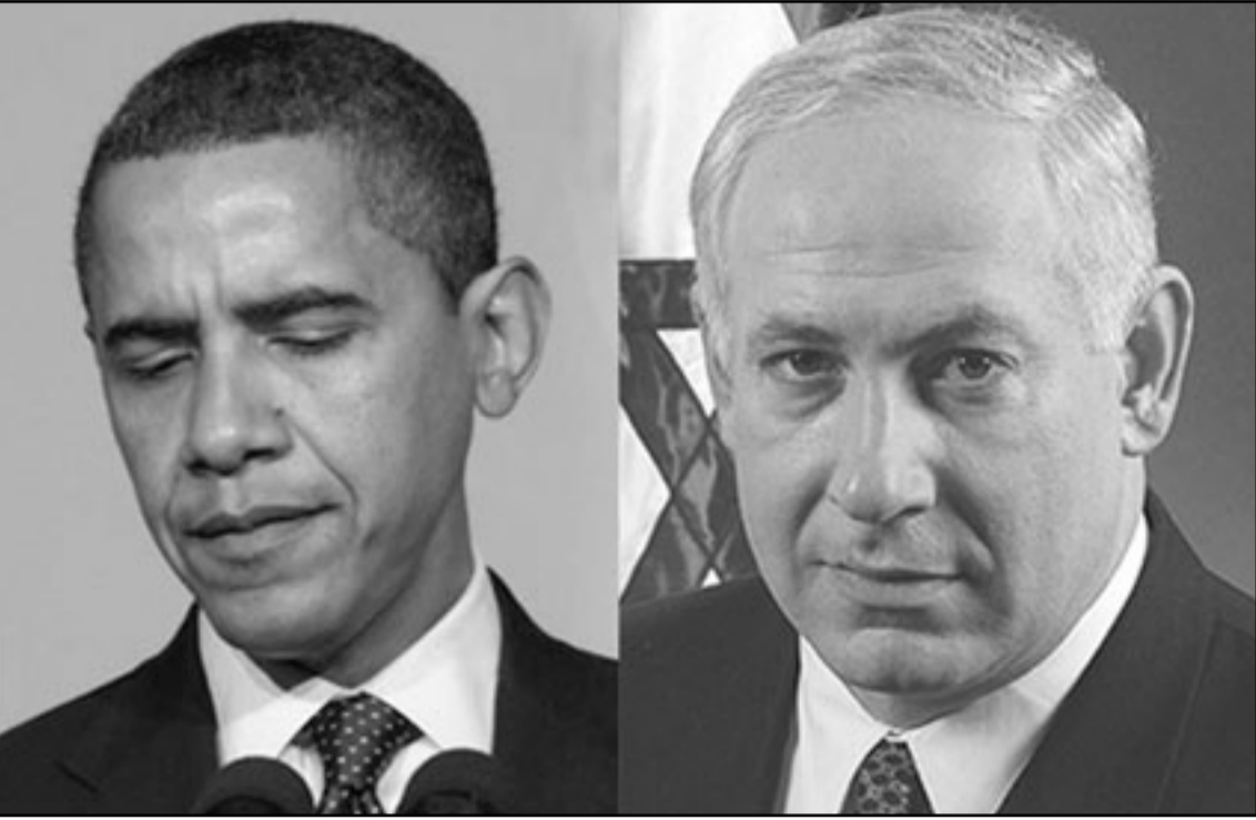
بالقميص ذي الكمين القصيرين وبيئت الانباء عن انه واحد منا وان رئيسه يحبه. ولكن احساس النصر الاسرائيلي كان زائفا. فنندت طلب تنتياهو مساعدة اوباما كي يمنعه الضغوط على اسرائيل في الموضوع النووي.

في نهاية الاسوع الماضي انتهى مؤتمر النووي العالمي في نيويورك بقرار دعا اسرائيل، بلغة