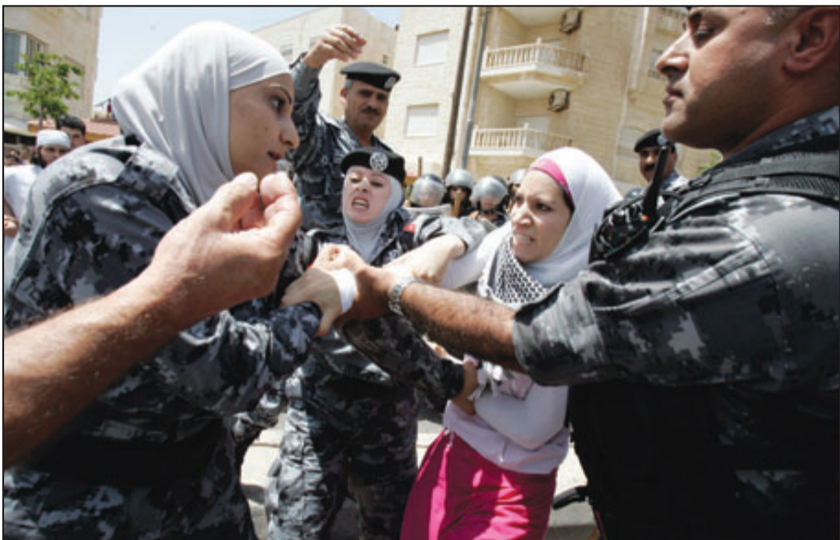
قوات شرطة اردنية تتعارك مع مظاهرة تحاول الوصول للسفارة الاسرائيلية في العاصمة عمان