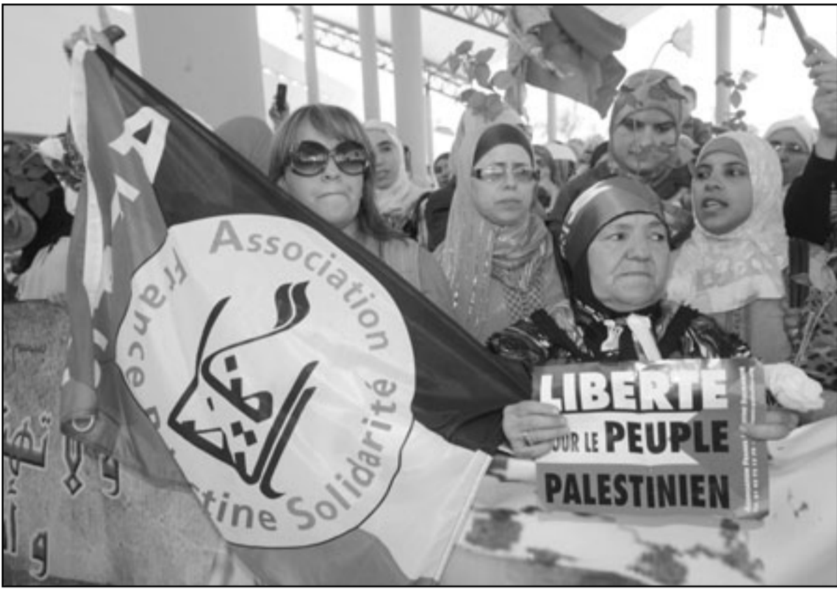
استقبال حاشد للمغاربة العائدين من «أسطول الحرية» في مطار الدار البيضاء الخميس

الاجراءات؟ ومن جانب آخر، أعلنت مجموعة العمل الوطنية لساندة العراق وفلسطين عن تنظيم تظاهرة ضخمة الأحد في العاصمة الرباط تحت عنوان «مسيرة الحرية ضد الإرهاب الصهيوني».