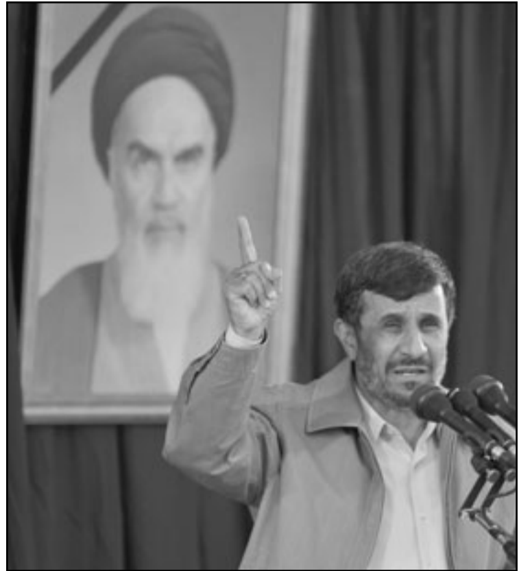
الرئيس الإيراني أحمدني نجاد يلقي خطبته في ذكرى وفاة الامام الخميني

وقال خامنئي بهذا الصدد «المهم هو موقف الناس الحالي» وليس ماضيهم، وحذر من أن «بعض الذين رافقوا الامام في الطائفة التي اعادته من باريس الى طهران شنقوا لاحقاً بتهمة الخيانة».