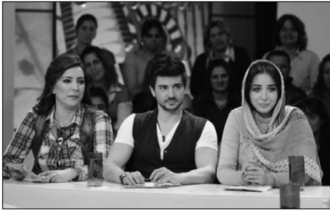
لقطة من برنامج «سوالفنا حلوة» على قناة «دي»