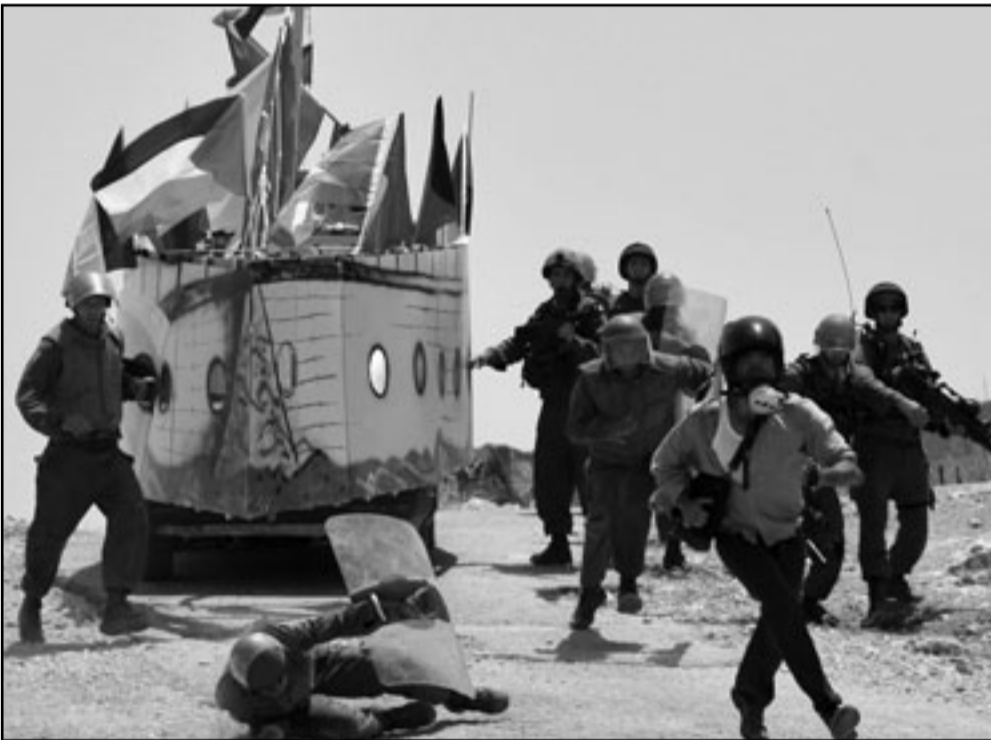
مصور اجنبي يرتدي قناعا واقيا من الغاز يحاول الهرب من جنود إسرائيليين بعد تصويرهم اثناء اعتداءهم على فلسطينيين صموا مجسما لاسطول الحرية خلال تظاهرة في قرية بليعن

مضيفا «لا يجب أن يقتصر فتح المعبر على الحالات الإنسانية، المعبر يجب أن يكون مفتوحا بغارته المصالحة الفلسطينية مطالبا مصر بفتح جميع المعابر مع غزة وفتح معبر تجاري مماثل لمعبر رفح ردا على الجزرة الإسرائيلية بحق أسطول الحرية».