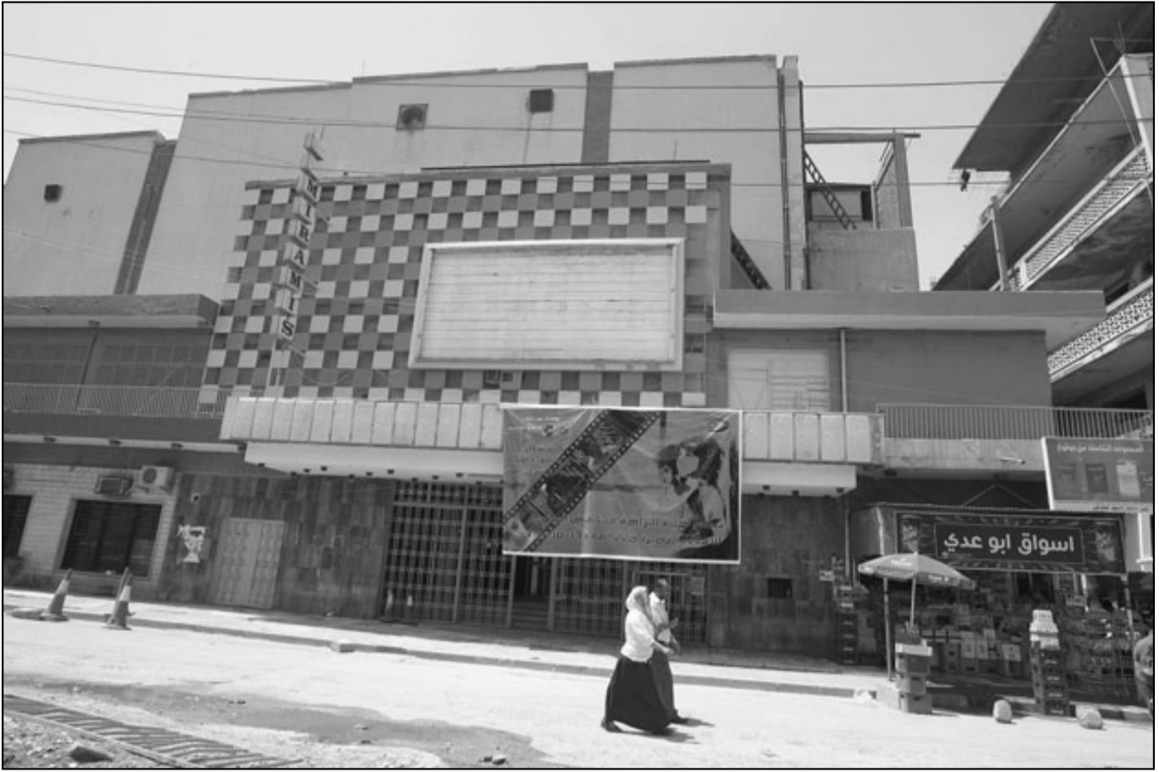
دار سينما مهجورة في وسط بغداد

في المنطقة ضمن أفضل 100 مدينة». يشار إلى أن منظمة ميرسر تعمل على اعداد هذه التصنيفات لمساعدة الحكومات والشركات متعددة الجنسيات في تقدير الرواتب والتعويضات المناسبة للموظفين عند اسناد مهام دولية لهم، ولضمان حصول المغتربين على تعويض صعوبة المعيشة المناسب والكافي ضمن حزمة التعويضات المقدمة لهم، وتتسعى الشركات التي تحصل على صورة واضحة عن جودة مستويات المعيشة في تلك المدن، ويقوم التصنيف بناء على مؤشر لاحتساب النقاط، بحيث تصنف الشركات بالمقارنة مع نيويورك كمدينة معيارية، حيث تبلغ نقاطها على المؤشر 100 نقطة.