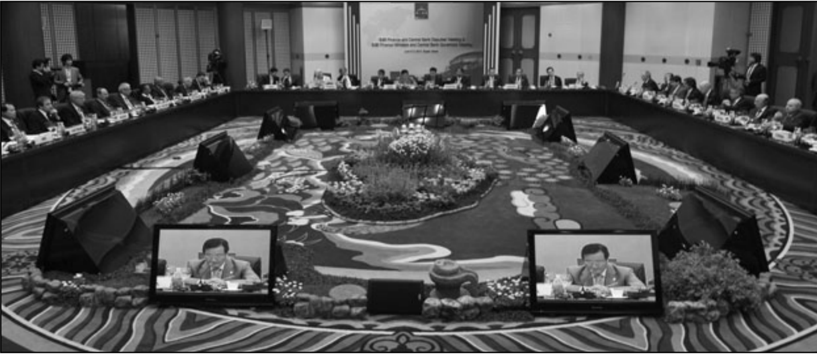
وزراء مالية ومحافظو البنوك المركزية في دول مجموعة العشرين خلال اجتماعهم يوم الجمعة في مدينة بوسان بكوريا الجنوبية

جديدة لإشاعة الاستقرار في الاقتصاد العالمي الذي اهتز بفعل مشكلات الميزانيات الأوروبية والمحافظ من تراجع النمو. وقال ساكوتج ايل رئيس اللجنة الرئيسية لمجموعة العشرين للصباحين «فيما يتعلق بالأزمة الحالية فإن مجموعة العشرين حذرة للغاية بشأن التطورات وتساند المبادرات التي قدمها الاتحاد الأوروبي وصدوق النقد الدولي لعلاج المشكلة». وكان تيموثي غابنر وزير الخزانة الأمريكي عبر في وقت سابق عن قننه في أن الاقتصاد العالمي قوي بدرجة يمكنه من تجاوز متاعب أوروبا. وقال في تصريحات لشبكة سي.ان.بي.سي التلفزيونية من لاس انسا، «لدينا انتعاش متواضع لكن متماسك إلى حد بعيد».