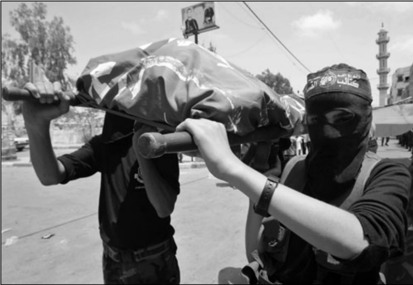
عناصر من حماس يحملون نعشا خلال تظاهرة تأييد ودعم لتركيا وسط قطاع غزة

قوبنا ووقولنا، وخرجت مظاهرات غضب الجمعة في عدة مناطق في قطاع غزة بدعوة من حركتي حماس والجهاد الإسلامي، تنديدا بالهجوم على الأسطول وتضامنا مع ناشطيه.