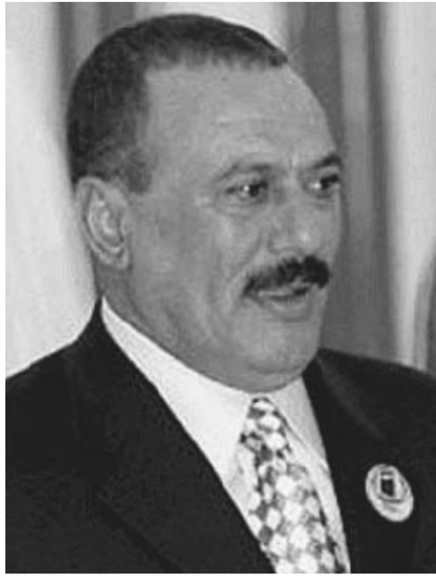
الرئيس اليمني علي عبد الله صالح

الحوار . وقال «أكرر ما جاء في البيان السياسي الذي أعلنته في 22 مايو أن يهب الناس من السياسيين إلى الحوار السياسي أفضل من استخدام المصطلحات في الصحافة والألفاظ غير السليمة». وأضاف على السياسيين أن يهبوا إلى الحوار إلى كلمة سواء من أجل مصلحة اليمن واستقراره ووحدته، واليمن أكبر منا بكثير وهو يتسع للجميع والشراكة مفتوحة دون أي تعنت أو كبرياء وترحب بالحوار الجاد دون تسويق ومماطلة.