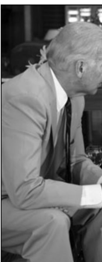
الرئيس المصري حسني مبارك لدى استقباله نائب الرئيس الأمريكي جو بايدن

وأوضح نائب الرئيس الأمريكي ان محادثاته مع مبارك تطرقت كذلك إلى «تلقي الكثير آراء برنامج ايران النووي»، مشفقا الكبير آراء برنامج ايران النووي، «وتوقع هذا يتوقف على سلوك الجانب الآخر». في إشارة إلى حركة حماس التي سيطرت بالقوة على قطاع غزة منذ منتصف 2007 اثر اقتتال بينها وبين حركة فتح. وقررت مصر الثلاثاء الماضي فتح معبر رفح إلى أجل غير مسمى أمام حركة مرور الأفراد والمساعدات الإنسانية، وجاء هذا القرار غداة الهجوم الإسرائيلي الدامي على الأسطول الدولي الذي وقع تسعة