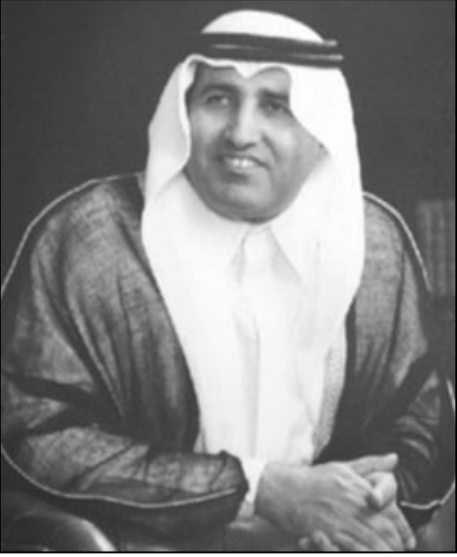
ولي عهد رأس الخيمة المخلوع الشيخ خالد بن صقر القاسمي

قد تكون لديهم اذنتهم القوية من ناحية انتشار التيار السلفي في الامارة وعبر كون خالد الشبيحي احد مفندي جهات يوليو (سبتمبر) واد في الامارة.