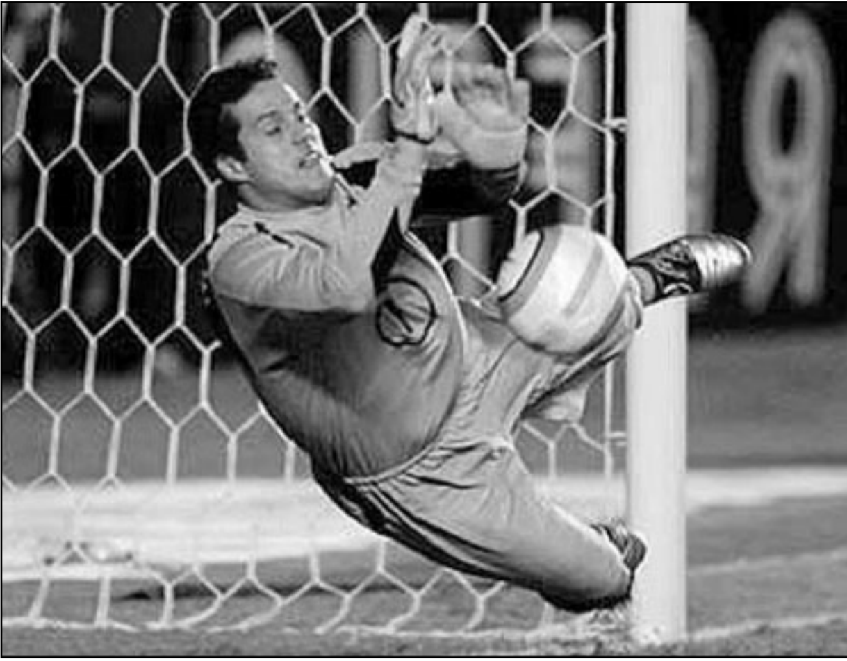
سيزار حارس مرمى البرازيل