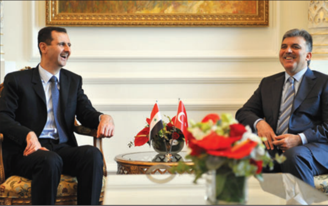
الرئيس التركي عبد الله غول مستقبلاً نظيره السوري بشار الأسد أمس

وتطرق إلى تصريحاتها بشأن القذرات النووية الإسرائيلية، مشيراً إلى قولها إنه يجب رفض بقاء إسرائيل القوة النووية الوحيدة في الشرق الأوسط. كما عرض ما أطلاق عليه مواقف حنين زعبي التي تشكل خطراً على دولة إسرائيل، وقدم مقاطع من مقابلاتها الصحافية، وعرضت أمام الجلسة مقابلات مسجلة من المقابلات العربية، أكدت فيها حنين زعبي رفضها ليهودية الدولة.