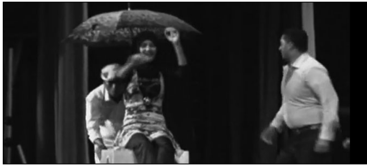
مشهد من مسرحية «مك نازل»