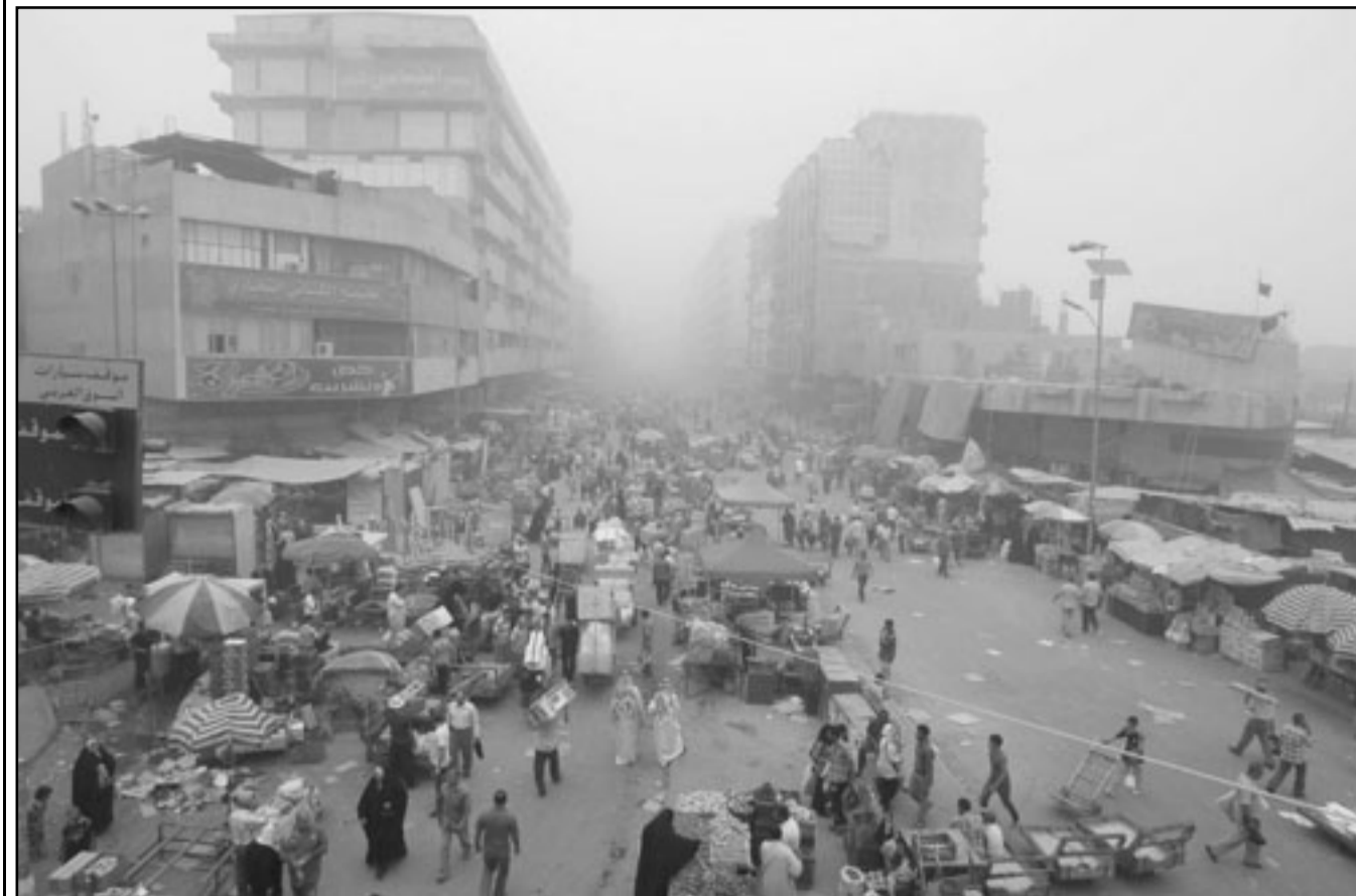
سوق في وسط بغداد امس