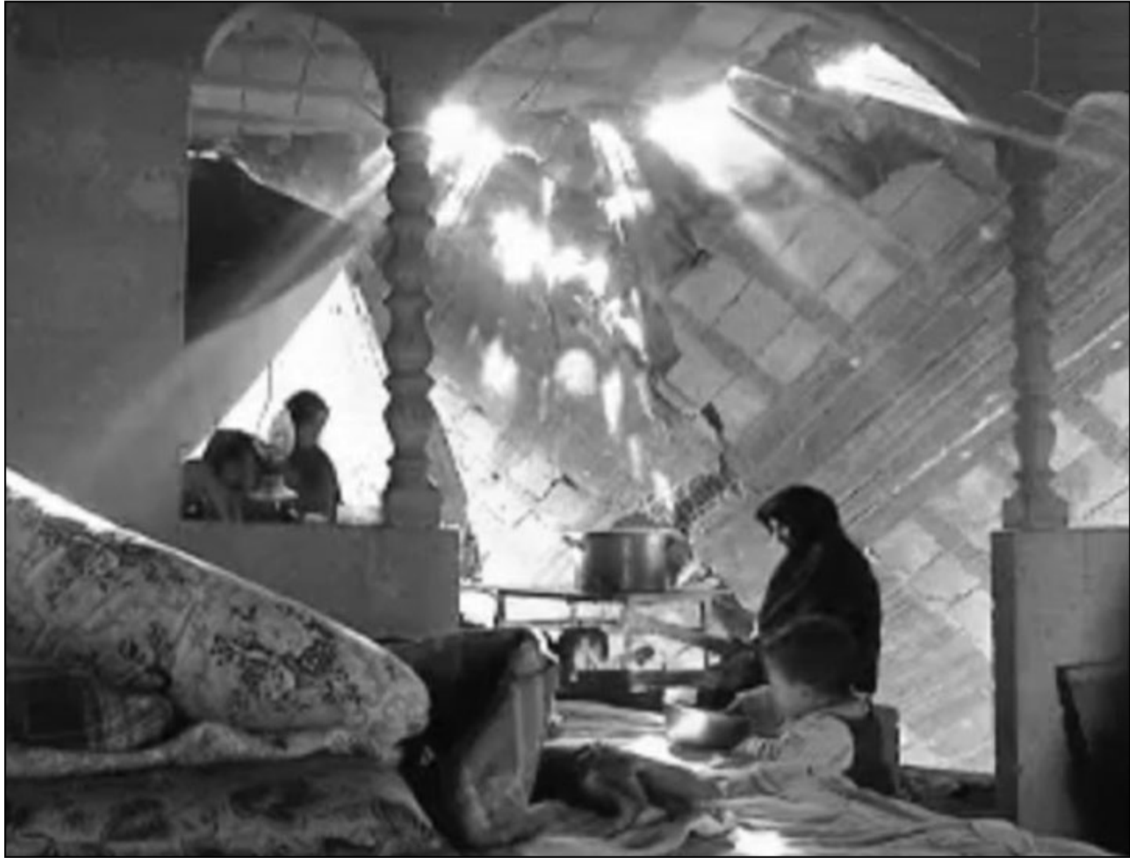
لقطة من فيلم « غزة 2009 »

ليس من السهل على أحد تقديم القول الفصل في هذا الموضوع، موضوع الزواج المختلط، خاصة وأن القضية الفلسطينية في عهدها السادس باتت أكثر تشابهاً وتعقيداً من التسيب الذي استعمل في العقود الأولى من عمرها، إذ نشأت أجيالاً تلو أخرى، على جانبي الخندق، لا تعرف سوى هذا الواقع، حتى اعتقدت أنه الحالة المهيمنة باعتبارها الحالة التي ولدت فيها، ومن الممكن أن تضي حيواتها كاملة في ثناياها. وتحوالي السياسي الوطني / القومي، مع الاجتماعي / الحيادي، كان أفلاماً من السينما الفلسطينية أن تذهب إلى عدد من مفردات الواقع الاجتماعي على أرض فلسطين التاريخية، كما فعل المخرج نزار حسن، عام 1995، عندما قارب جرائم الشرف، مثلاً، في فيلمه « ياسمين »، وكما فعل في العام نفسه المخرج ميشيل خليفي، بقايرته موضوع الزواج المختلط، في فيلمه الذي ذكرنا، ومن