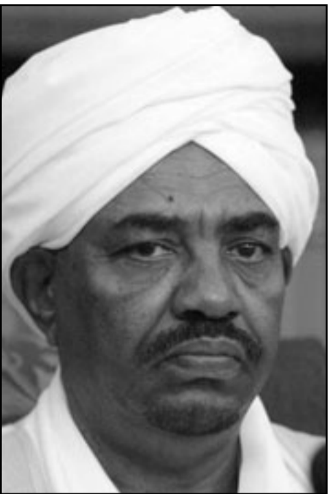
الرئيس السوداني عمر البشير

■ الخرطوم - ف ب: طلب السودان من السلطات الاوغندية سحب قرارها بعدم دعوة الرئيس السوداني عمر البشير الى القمة المقبلة للاتحاد الافريقي والاعتذار عنه. وقال المتحدث الرسمي باسم وزارة الخارجية معاوية عثمان خالد لوكالة الانباء السودانية ان اوغندا اتخذت قرارا «ليس في صلاحيتها المطلقة، بعدم دعوتها للبشير الى قمة الاتحاد الافريقي المقررة الشهر المقبل في كمبالا، وتابع المتحدث ان «سلطة توجيه الدعوات لحضور القمة الافريقية ليست من صلاحية الدولة المضيفة وانما من صلاحية الاتحاد الافريقي بالتنسيق مع الدولة المضيفة». وطلبت الوزارة من اوغندا «سحب» هذا القرار والاعتذار عنه علنا، والا هددت بطلب نقل القمة الى اي عاصمة اخرى يمكن لجميع القادة الافارقة المجيء اليها بدون الخضوع للمضغوط، و«الابتزاز».