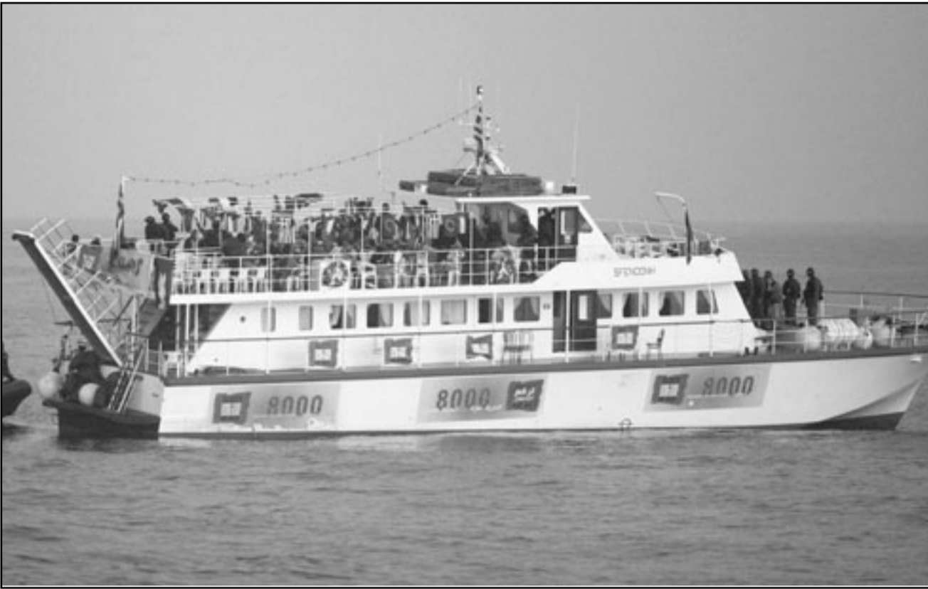
اسطول الحرية نقطة انعطاف في النزاع العربي -الاسرائيلي