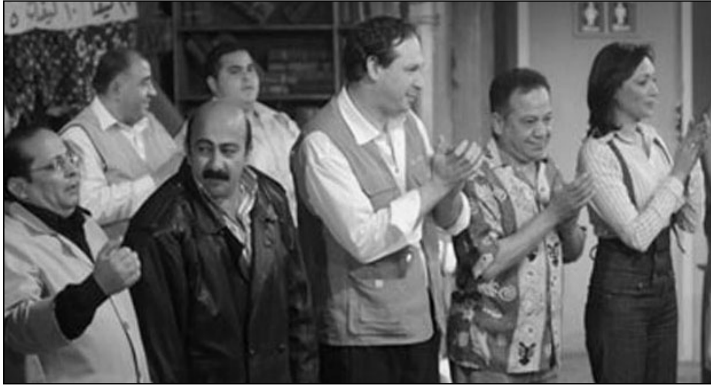
إبطال مسرحية «حمام روماني»

■ انضمام نقابة الممثلين رفضوا هذا المشروع لأن الأكاديمي هو الأحق بفرصة العمل وليس أي شخص يأتي من الشارع ليحصل على فرصة لجرد حضوره