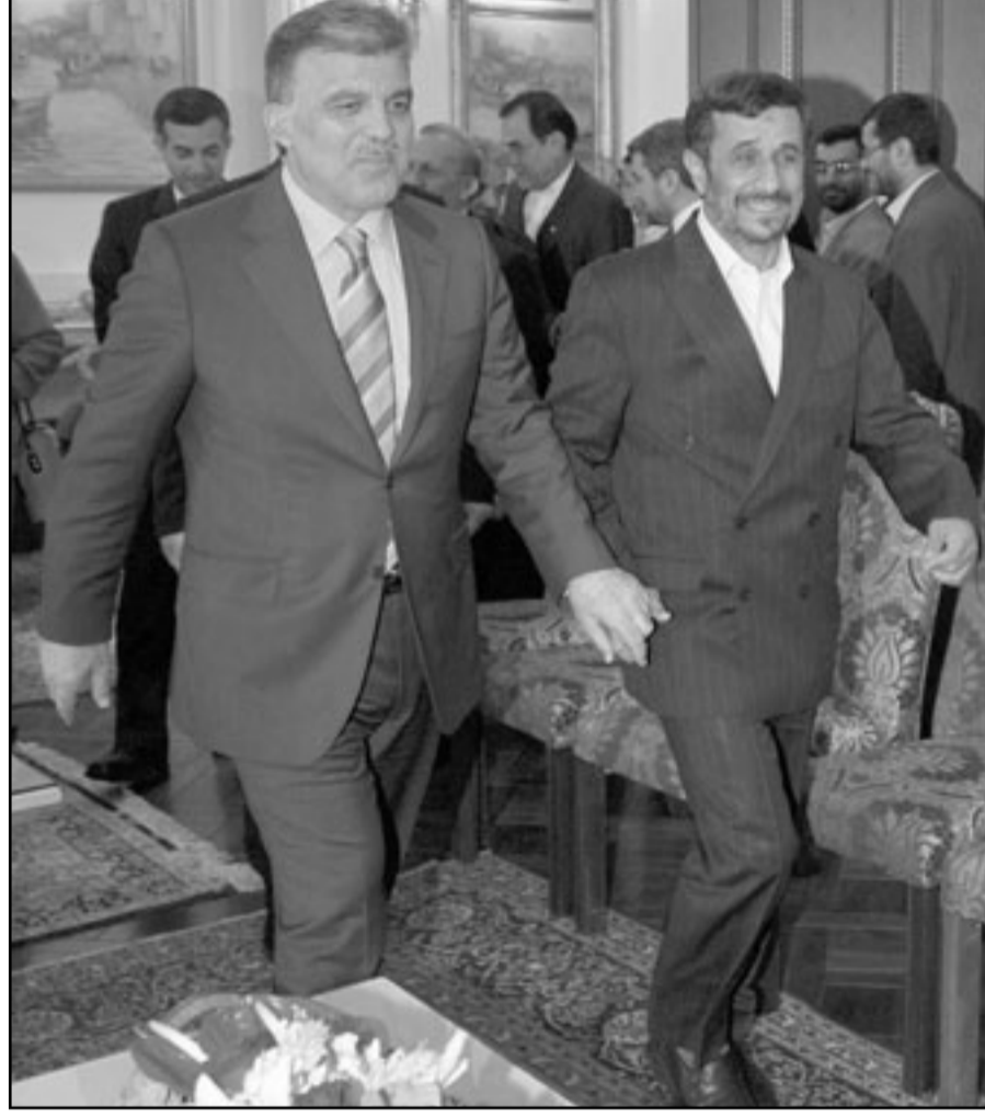
الرئيس التركي عبد الله غول مستقبلا الرئيس الإيراني احمدي نجاد في تركيا امس

■ ويري دبلوماسيون غربيون ان المناقشات حول اسرائيل سابقة لوانها لان امانو لم يحصل على كل الاقتراحات. واخيرا سيتطرق الحكاه الى ملف سورية حيث تعرض الوكالة على نقص التعاون من قبل دمشق في التحقيق حول موقع دير الزور الصحراوي الذي قصفته اسرائيل في ايلول/سبتمبر 2007.