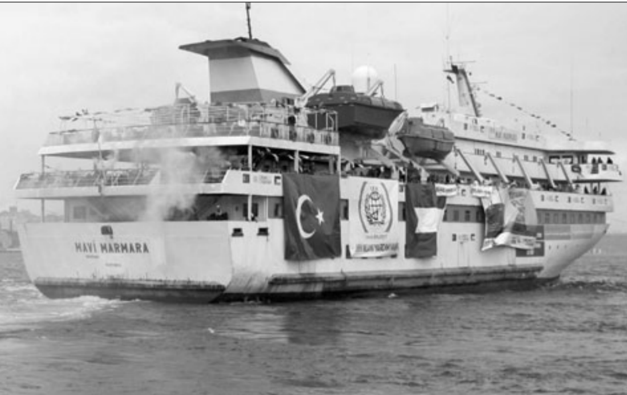
أحد سفن اسطول الحرية

يزال قريباً، والمقصود به وصاية وزارة الداخلية، فألى عهد قريب كان قطاع الإعلام تابع بشكل مباشر وصرح للداخلية، في وزارة هيبة يجمع نائبيتها وزير قوي بحجم الوزير الراحل إدريس البصري، تحمل اسم وزارة الداخلية والإعلام!