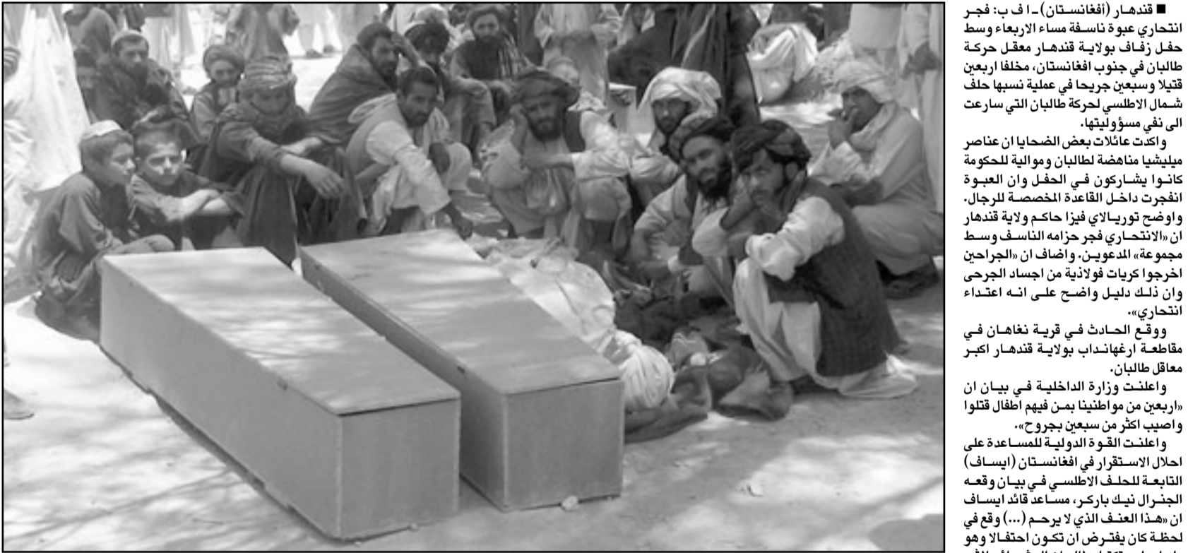
افغانيون امام جثث ضحايا التفجير الانتحاري الذي استهدف زفافا في قندهار