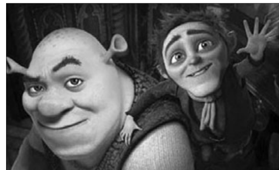
لقطة من 'شريك الرابع' بالأبعاد الثلاثية

يذكر أخيراً أن فيلم (شريك لأبيد) الذي يروي معاصرات الغول الأخضر العملاق هو جزء من سلسلة نتجت استوديوهات DreamWorks Animation الأمريكية بعد 3 أجزاء ناجحة بدأ أولها في عام 2001، وكان قد تصدر إيرادات السينما في أمريكا إذ حقق 43.3 مليون دولار في فترة الثلاثة الأيام الأولى من عرضه... ليصل إجمالي ما حققه منذ بدء عرضه إلى أكثر من 133 مليون دولار.