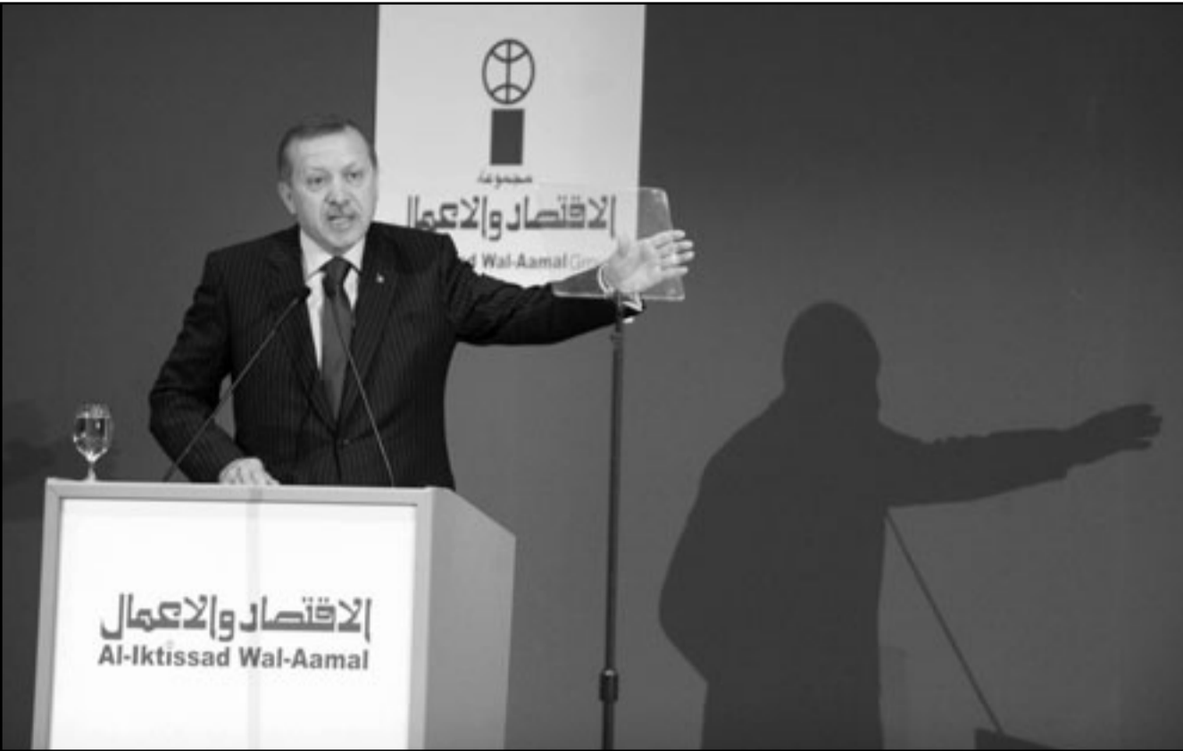
رئيس الوزراء التركي رجب طيب اردوغان خلال لقائه بمندبي الاقتصاد والاعمال اسس

الصاروخية إس 300 دفاعية ولن تتأثر وفي واشنطن انتقد السناتور المتحدة الذي صدر الاربعة لأنه استثنى النووية بتبنيها روسيا قرب بوشهر في الجمهورية جون كايل قرار عقوبات الأمم الاتفاق الصواريخ وأول محطة للطاقة إيران.