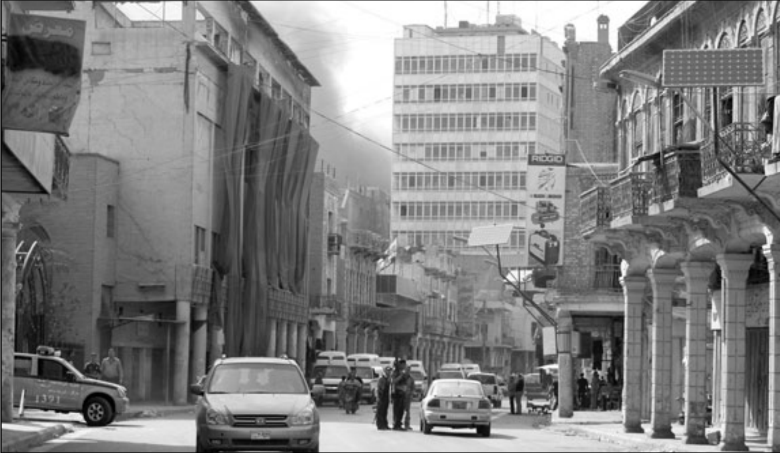
رجال أمن عراقيون في إحدى نقاط التفتيش قرب موقع الانفجار الذي أدى إلى مقتل خمسة وأصابة عشرين آخرين في العاصمة بغداد أمس

نائبها غاليبيهم من قائمة المالكي لتحقيق الكتلة الأكثر عددا التي ستناطح إليها مهمة تشكيل الحكومة الجديدة في الوقت الذي لا تزال القائمة العراقية بزعماء اياد علاوي التي حصلت 91 من مقاعد البرلمان في الانتخابات غير متوافقة على حسم تسمية الرئاسات التي حصدت نتائج الانتخابات العراقية (أغسطس) المقبل.