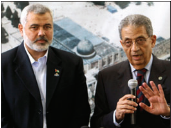
امين عام الجامعة العربية ورئيس حكومة حماس في غزة يتحدثان للصحافيين

جزيرة - «القدس العربي» من أشرف الهور: أكد الامين العام للجامعة العربية عمرو موسى أمس الأحد خلال زيارة غير مسبوقه إلى قطاع غزة ان الحصار الذي تفرضه اسرائيل على القطاع منذ اربع سنوات «يجب ان يكسر»، وأضاف ان الخطوة القادمة ستخصص لعملية إنعاش القطاع خاصة لإعادة اعمار قطاع غزة بعد الحرب، وشدد على اهمية المصالحة الفلسطينية. ولم يستبعد موسى ان تعقد الجامعة العربية اجتماعا على مستوى المندوبين الدائمين في قطاع غزة، في الريب العاجل، وقال انه ربما يقرر شيئا قريبا جدا. وقال موسى في مؤتمر صحفي بعيد وصوله إلى القطاع، في أول زيارة له كأمين عام للجامعة العربية، عبر مبعوث راجح بحضور لاجئ شعب فلسطين في غزة لاشاهد بنفسه ما جرى وما