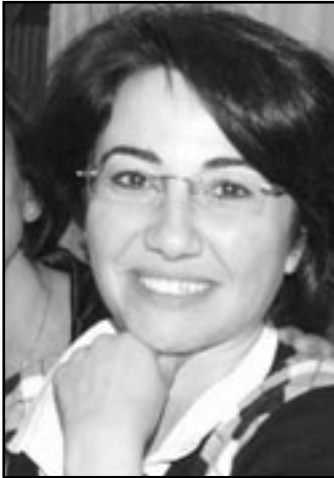
لا يوجد مبرر للهجوم الغرز على حنين الزعبي