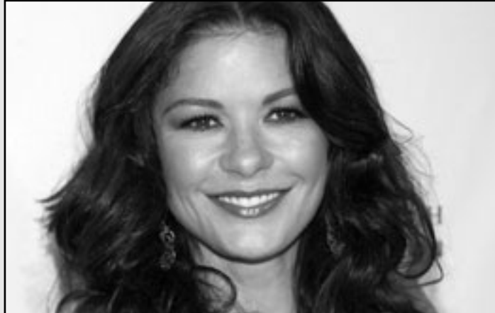
كاترين زيتا جونز

■ لندن - يو بي آي: فازت الممثلة كاترين زيتا جونز بتقدير من الملكة إليزابيث الثانية بمناسبة الاحتفال بعيد مولدها الرسمي.