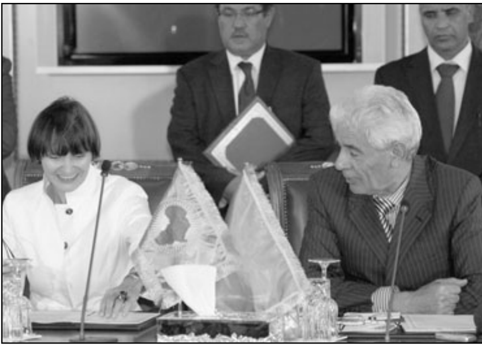
وزيرة الخارجية السويسرية ميشلين كالي -راي ونظيرها الليبي موسى كوسا لحظة توقيع الاتفاق الثنائي

سويسرية وطردت شركات سويسرية من ليبيا فضلاً عن إعلان وقف صادراتها النفطية إلى الكونغرس. وبالنهاية أعلنت طرابلس في آذار/مارس «حظرًا اقتصاديًا شاملاً» على سويسرا وذهب الزعيم الليبي معمر القذافي إلى حد الدعوة إلى الجهاد ضد سويسرا بعد موافقة السويسريين في استفتاء على منع بناء المآذن في بلادهم.