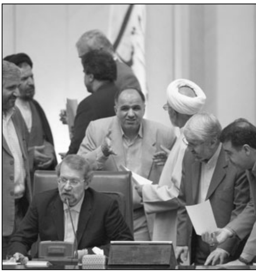
رئيس البرلمان الإيراني علي لاريجاني خلال مناقشة مشروع تحديد العلاقات مع الوكالة الدولية للطاقة في طهران امس

عاصم وكالات: قال نائب وزير الخارجية الإيراني للشؤون القنصلية والمغتربين حسن قشقاوي ان الولايات المتحدة تحجز 63 ايرانيا في سجونها بسبب اعداء ليس لها أي انساب من الصحة. وقلت وكالة انباء الطلبة «استا» عن قشقاوي قوله إنه تم إخلاء سبيل 543 مغتربا ايرانيا كانوا محتجزين في سجون أجنبية العام الماضي بفضل الجهود التي بذلتها وزارة الخارجية الإيرانية، وقلت الوكالة عن قشقاوي قوله ان «إيران تلاحق مسألة المعتقلين الإيرانيين في امريكا بجدية ولكل منهما قسم للمصالح في الدولة الأخرى». وقال نائب وزير الخارجية الإيراني «إن امريكا لا تتعاون في مسألة إطلاق السجناء والهدف من وراء احتجازهم سياسي». كما أشار قشقاوي إلى «اختطاف امريكانيين للعالم النووي ايراني شهرام اميري، معتبرا ذلك انتهاكا لحقوق الإنسان وهذا ما شهدناه على نطاق واسع في الغرب». وكانت وزيرة الشؤون الخارجية الأمريكية هيلاري كلينتون دعت ايران السبت إلى تنفيذ التزاماتها الدولية والأفراج عن كل المعتقلين السياسيين وثلاثة امريكيين محتجزين منذ حوالي عام.