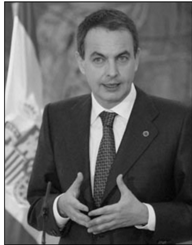
رئيس الحكومة الإسباني خوسيه لويس رودريغيث سبتييرو (أرشيف)

وتقوم بهذا في وقت ترفع هذه الحكومة في شعار «تعزير علمانية الدولة الإسبانية»، حيث لا تتدخل مباشرة في الشؤون المسيحية في إسبانيا ومنظمة وفتح مهابكل ثابتة في حين أن الحل الإسلامي يحتاج للمساعدة حتى تتم هيكلته بشكل متين. في هذا الصدد، وضعت وزارة العدل المكلفة بالجمعيات الإسلامية مؤخرًا مشروع قانون يهدف إلى تنظيم اللجنة الإسلامية وجعلها أكثر دينامية وأكثر تمثيلية. فهذه اللجنة حتى الآن مقصورة على «اتحاد الجمعيات الإسلامية في إسبانيا»، والفيديرالية الإسبانية للجمعيات الدينية الإسلامية، لكن توجد عشرات الجمعيات وفيدريالات أخرى خارج اللجنة تطلب بالانضمام إليه.