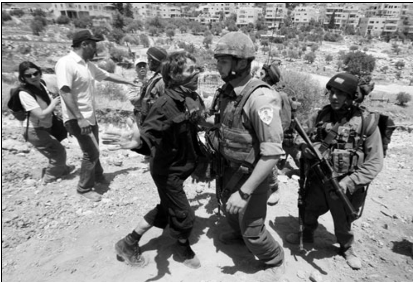
ناشطة سلام تتجامل مع جندي اسرائيلي خلال تظاهرة ضد الجدار العازل في بيت جالا

المتطورة (ميكافا 4) في المعرض حيث وصلت الى باريس تحت اجراءات أمنية مشددة، وقامت شركة رفائيل الاسرائيلية بتزويد الدبابة المعروضة بنظام حماية نشط، وبحسب المصادر الامنية في تل ابيب فإن كولومبيا من بين الدول التي أبدت اهتماما بشراء دبابة (ميكافا 4). وزادت المصادر ذاتها قائلة للصحيفة العبرية ان شركة تطوير الاسلحة الاسرائيلية (رفائيل) تستعد لعرض نظام القبة الحديدية المضاد للصواريخ قصيرة المدى الذي طورته مؤخرا للرد على صواريخ القسام التي تطلق من قطاع غزة، معتبرة ان قرار الكونغرس الامريكى يوم 24 ايار (مايو) الماضي بدعم المشروع الاسرائيلي بمبلغ 205 ملايين دولار سيساعد شركة رفائيل على بيع 8 بطاريات من هذا النظام للولايات المتحدة على اقل تقدير. من جهة اخرى تستعد شركة (ليبيل) الاسرائيلية لعرض عدد من الانظمة الدفاعية الجديدة بما فيها النظام الذي يزود مركبات افراد سلاح حماية من الاسلحة الموجهة المضاد للدبابات، وقد جرى تطوير نظام EoShield بالتعاون ما بين شركة «البيت» والقيادة العامة للجيش الاسرائيلي، حيث يعمل على توفير حاجز حماية 360 درجة معتمدا على التشويش الالكتروني لتضليل الكائنات الموجهة المظلمة من الجسر او البحر او الجو. وقالت مصادر