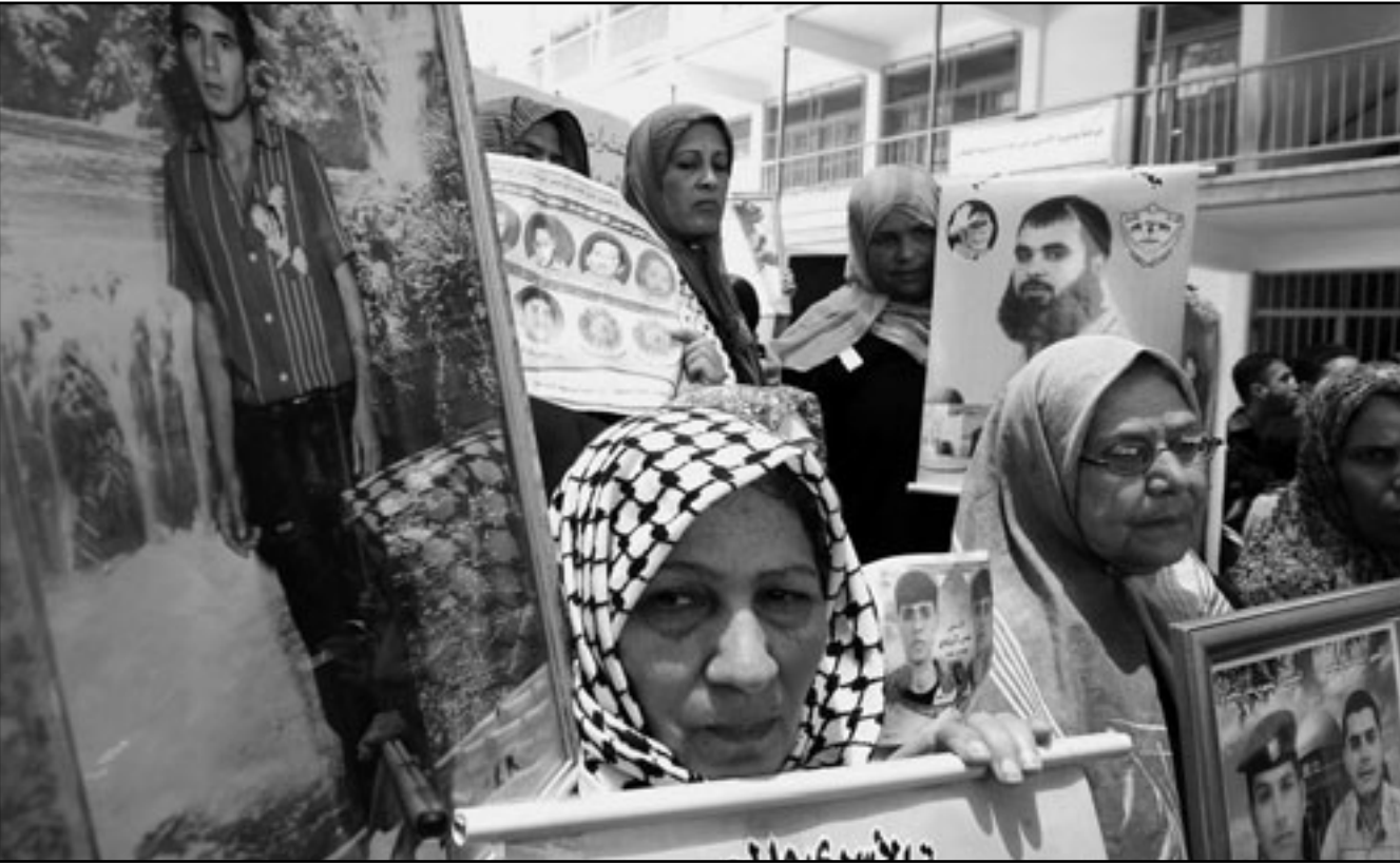
فلسطينيات يتظاهرن خلال زيارة الامين العام لجامعة الدول العربية للمطالبة باطلاق سراح ابناءهن من السجون الاسرائيلية

الأمين العام لجامعة الدول العربية يتفقد الدمار في قطاع غزة الأمين العام لجامعة الدول العربية يتفقد الدمار في قطاع غزة