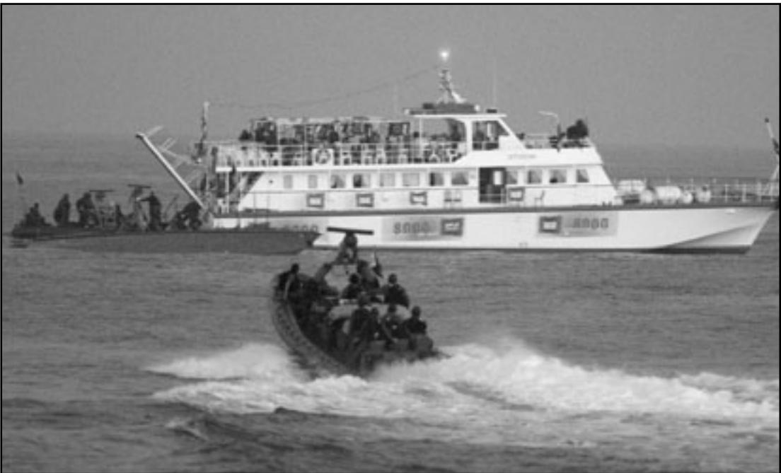
قضية اسطول الحرية فرصة مناسبة لإتمام الانفصال عن غزة

■ لا شعور أفضل من ان تكون محاصرا بين اعداء، ولا يمكن ان تتبين سهولة كون اسرائيل مستعدة لأن ترى عدوا وراء كل شجيرة حتى إنها غير قادرة و لا تريد ان تفرق بين اهل حقيقي وهمي، فالجميع طغاة، اولهم الرئيس باراك اوباما، الذي اسمه الاوسط حسين، ويشهد فوق كل شك على اي معسكر ينتهي اليه، وماذا يمكن ان نتوقع من رئيس امريكي مع خلفيته كهذه وبخاصة وهو يبدد ولايته خطبتين مد بهما يدا دافئة الى العالم العربي والاسلامي؟، لن تجدي عليه اي اوروبا فلا يوجد ما يقال فيها، فهي عود منذ أيام خالية، أوليست ذات صلة بما يحدث في ايران؟ ألم تكن لها مفاعلا ذريا وستبيعه الان صواريخ اس 300 مطورة مضادة للطائرات؟ وبريطانيا دولة مرمية لا بسبب الانتفاخ الذي توجهه لاسرائيل بسبب العملية الفاشلة على الاسطول ومحاولتها محاكمة سبب اسرائيليين، بل وفي الاساس بسبب المتوقعة التي يرفضها تجارها على نتوجات من المستوطنات وجامعيوها على جامعيي اسرائيل، ومنها، وربما أكثر، النرويج والسويد، هاتان الدولتان المرهقان، اللتان لا يستطيعان ان تقفان نوع الحرب الشديدة التي تقوم بها اسرائيل في مواجهة مليون ونصف مليون من الفلسطينيين في غزة. أما رئيس حكومة تركيا فيشك اصلا