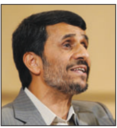
الرئيس الإيراني احمدي نجاد

طرابلس - أ ف ب: اعلن وزير الخارجية الليبي امس الأحد ان هنيبال القذافي نجل الزعيم الليبي معمر القذافي حصل من كاتون جنيف على مبلغ قدره «حوالي 1.5 مليون يورو، تعويضا عن نشر صحيفة سويسرية صورتين له التقطتا خلال توقيفه في تموز/يوليو 2008. وقال موسى كوسى اثر التوقيع على اتفاق بين طرابلس وبرن يهدف لحل الازمة السياسية التي اندلعت جراء هذا التوقيف ان «الحكومة ايدت هنيبال القذافي وحكمت له بتعويض قدره نحو 1.5 مليون يورو». وأضاف ان «هذا القرار تم تنفيذه والمبلغ تم تحويله إلى حساب مصرفي» تابع لهنيبال القذافي، وكانت محكمة الدرجة الاولى في جنيف حكمت في نيسان/ابريل لصالح هنيبال القذافي في قضية نشر صورته، ولكنها لم تقر في حينه طلب