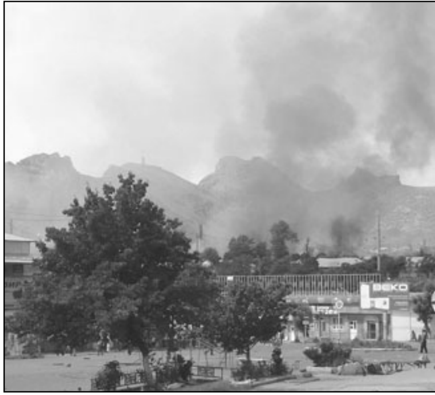
اعمدة الدخان تتصاعد من احياء سكنية في مدينة اورش جنوب قرغيزستان امس

بشكيا. ف ب: قتل 97 شخصا واصيب اكثر من 1200 آخرين في أعمال العنف العرقية التي تجتاح جنوب قرغيزستان منذ ثلاثة أيام، كما أعلنت وزارة الصحة القرغيزية أمس الأحد. وقالت الوزارة في بيان «عند الساعة 17,00 (11,00 تغ) في 13 حزيران/يونيو، تم احصاء 97 قتيلا في مناطق اورش وجمال اباد، مشيرة إلى 1247 جريحا، بينهم 727 قيد المعالجة في المستشفيات. وعيانت قرغيزستان الاعد جيشها وسحمت لقواتها باطلاق النار بدون اذار مسبق في جنوب هذا البلد الاستراتيجي في آسيا الوسطى، بهدف اخذ أعمال العنف الانتية التي اوقعت ما لا يقل عن 86 قتيلا و الف جريح منذ اذلتها الجمعة. واعلنت وزارة الدفاع تعميمة الاحتياط في الجيش ممن تتراوح اعمارهم بين 18 و 50 سنة. كما اجيز لقوات الامن مساء السبت اطلاق النار بدون سابق اذار. وقالت وزارة الدفاع في بيان انها «تدعو جميع الاحتياط الذين تقل اعمارهم عن خمسين عاما للحضور اليوم قبل الساعة 15,00 (9,00 تغ) الى نقاط الاحصاء». و اضاف البيان ان «تنظيم التعبئة الجزئية للسكان المدنيين تبدأ في مكاتب التجنيد العسكري في مدن وقاطعات البلاد». كما فرضت الحكومة الانتقالية حظرا للجول طيلة النهار والليل في اوش ثاني مدن البلاد وفي منطقتين مجاورتين لها، بعد ان كان هذا التدبير ساريا خلال الليل فقط.