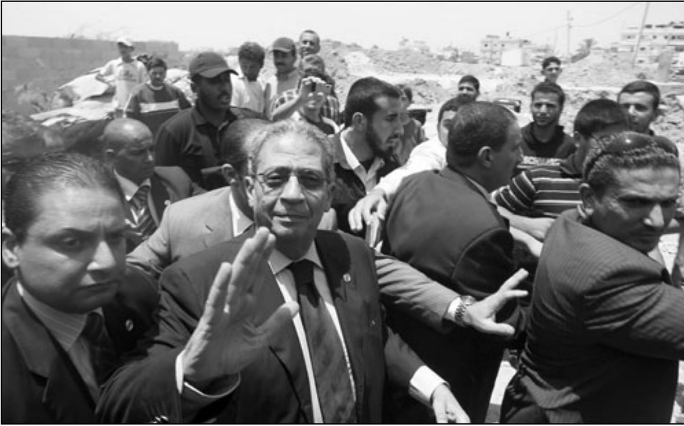
الامين العام لجامعة الدول العربية يتفقد الدمار في قطاع غزة

الأمين العام لجامعة الدول العربية يتفقد الدمار في قطاع غزة الأمين العام لجامعة الدول العربية يتفقد الدمار في قطاع غزة