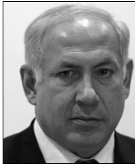
اسرة التحرير متراس 2010/6/13