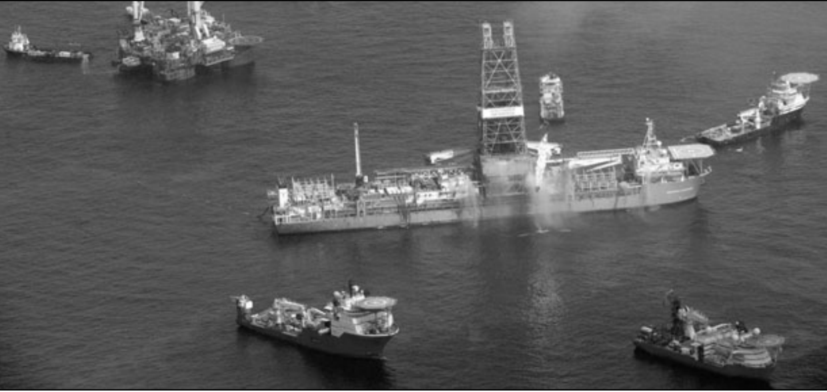
سفينة الحفر ديسكو فدر انتربرايز تجمع النفط من البقعة التي نجمت عن انفجار بئر دييوتو هرايزون