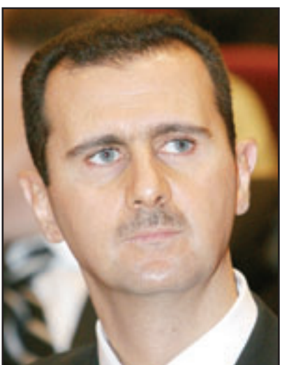
الرئيس السوري بشار الاسد

الأمريكية بدمشق ان الأنباء التي تحدثت بهذا الخصوص هي تخمينات سياسية لكن ليس ثمة ما يبررها لأنه وحسب المصادر الأمريكية فإن الإجازة الطويلة لسفير أي دولة يقضيها ببلادها لا تعني أنه جرى سحبه من مهامه، ولغفت في حديثها لـ«القدس العربي» ان السفارة الأمريكية لم تعلم بأية إشارة أو معلومة في هذا السياق. وأضافت: «هكذا أمور لا تجري بهذه الطريقة السرية، وكان المفروض ان نعلم نحن كسفارة أمريكية بهذا الأمر»، وكشفت عن أن هناك زيارة مقبلة لو قد تقني أمريكي إلى وزارة الخارجية السورية.