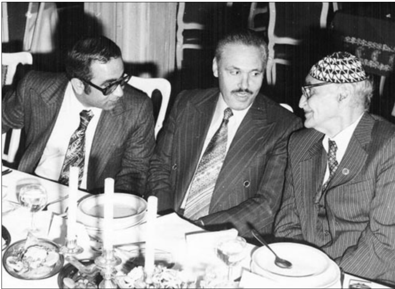
في جلسة مع الشاعر العراقي مهدي الجواهري