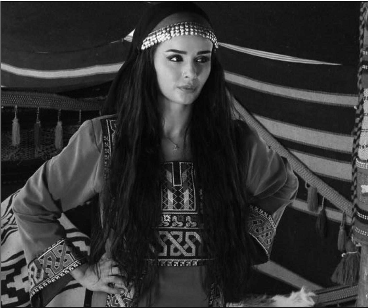
لقطة من مسلسل «المراقب»

وتستأب أحداث هذا المسلسل من خلال قصة بين ثلاثة قبائل بدوية مسالة تعيش في امان وبعد أن تعصف بها تقلبات الزمان يتحول الامن والسلام إلى الحرب والدمار بما فيها من أكتسب الدم والقتل والمطاردات والخيانة ورغم كل هذه الماسي والظروف تبقى روح الاصلية مزروعة في