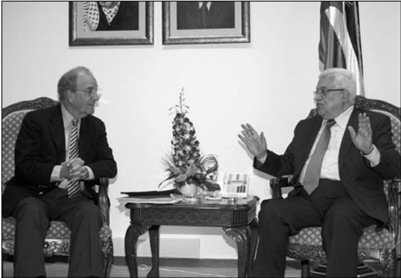
الرئيس الفلسطيني لدى اجتماعه مع المبعوث الامريكي في رام الله

الاستيطان، وجديتها بالاعلان عن افضال الاحتلال لجهود السلام.