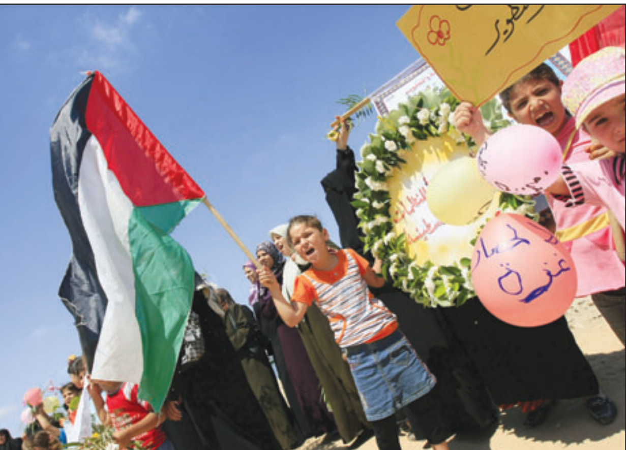
سيدات واطفال فلسطينيون يتظاهرون في مينا غزة احتجاجا على الحصار الاسرائيلي للمطاع

فترة طويلة، وبالتالي فإن الامر منطقي»، و اضاف «ربما يمكن القبول بتدخل وزير اخر للمسامحة اردوغان». وقالت مصادر مقرية من بن العياز لصحيفة «يديعوت احرونوت»، ان عدم ابلاغ ليبرمان باللقاء كان الامر الصائب لان وزير الخارجية «لعب دورا كبيرا في تعميق الازمة مع تركيا»، و اشارت عدة وسائل اعلام الى ان البيت الابيض تدخل ايضا في التحضيرات لبعث اللقاء. وفي هذا السياق قالت صحيفة «هارتس»، المصدر الخميس ان كبار المسؤولين في حزب ليكود يتهمون وزير الامن يهود باراك بتسريده النبا عن اللقاء، وذلك بدافع رغبته في اخراج ليبرمان من الائتلاف، في حين تشير التقديرات الى ان الاخير لا ينوي الاستقالة من الحكومة.