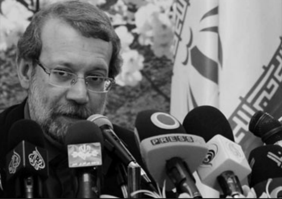
رئيس مجلس الشورى الإسلامي (البرلمان) في إيران علي لاريجاني خلال مؤتمر صحفي بالسفارة الإيرانية في دمشق

اليه عقوبات اقتصادية جديدة في محاولة لاقناع إيران بالتخلي عن برنامجها النووي، ويهدف النص خصوصا على التاتير على تزود طهران بالبازين الذي لا تملك منه كميات كافية بسبب عدم قدرتها على تكرير الكميات اللازمة. وتتشبه الاسرة الدولية بان إيران وبالرغم من سفير المتكرر تسعى لامتلاك السلاح النووي تحت ستار برنامج نووي مدني، الى ذلك قال وزير الخارجية الإيراني منوچهر متكي ان التصويت على العقوبات ضد بلاده في مجلس الامن جعل إيران أكثر عزما على تطوير برنامجها النووي السلمي. وتنسبت وكالة الانباء الإيرانية الرسمية «ارنا» الى متكي قوله في رسائل منفصلة بعث بها الى وزراء خارجية دول مجلس الامن الدولي «ان التصويت على مثل هذه القرارات لا يمس فحسب من وجهة نظر الشعب الإيراني، ببرنامج إيران النووي السلمي، بل يجعل إيران أكثر رسوخا في عزمها على استمرار نهجها الحالي في تطوير التكنولوجيا النووية السلمية،» وانتقد متكي «بشدة» معدي قرار فرض العقوبات، وقال «ان إسقاط بقية الدول في مجلس الامن مع القرار يبعث على الأسف». وتوجه متكي، في رسالتين الى وزير الخارجية التركي أحمد داود أوغلو والبرازيلي شليسو أومريم بالاشادة «من جانب الحكومة والشعب الإيراني، وقال بدرابية وحكمة حكومة وشعب البلدين لما اتسما به من ممانعة وصمود امام الضغوط السياسية لعدد من