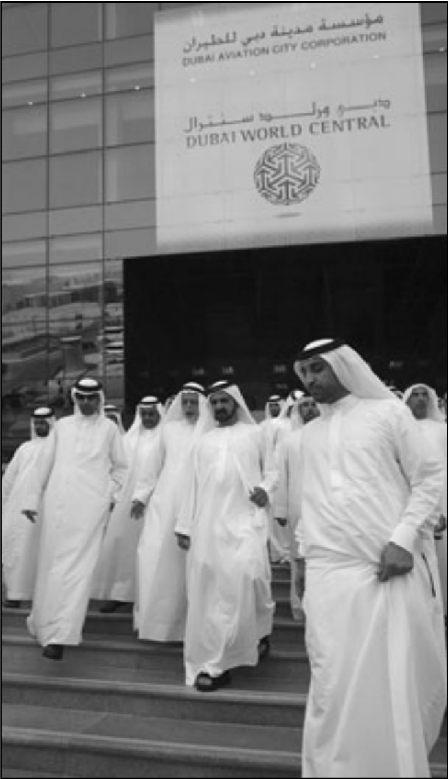
الشيخ محمد بن راشد يتوسط مجموعة من كبار المسؤولين لدى زيارته المطار