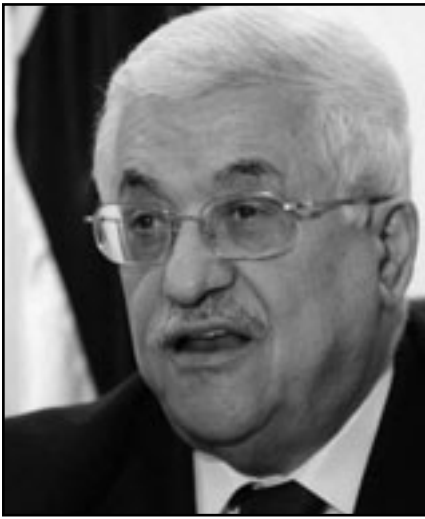
عباس، لا أنوي اعلان الدولة الفلسطينية

الرئيس من أعلى سنهيه السبع والسبعين يبدو حسنا ومتيقظا ونشيطا ويذخ سبجارة بعد سبجارة. قبل ثلاثة أشهر نشرت أبناء عن انهيار مفاجيء، وعن علاج في الأردن، وعن ضعف. إنه الحقن لأنه غير قادر على كف نفسه عن التبغ. «نحن مع أولمرت لكن لم أدخل سجناته»، يقول. «حتى في واشنطن عندي رخصة خاصة للتدخين في فندق كاريلتون، وفي ركن ما في البيت الابيض. وأنا أعلم أن الرئيس ابواما يذخ سرا. وتعد هذه الإتسامة أقال، لقد دخلت تسبيبي ليقتي معي