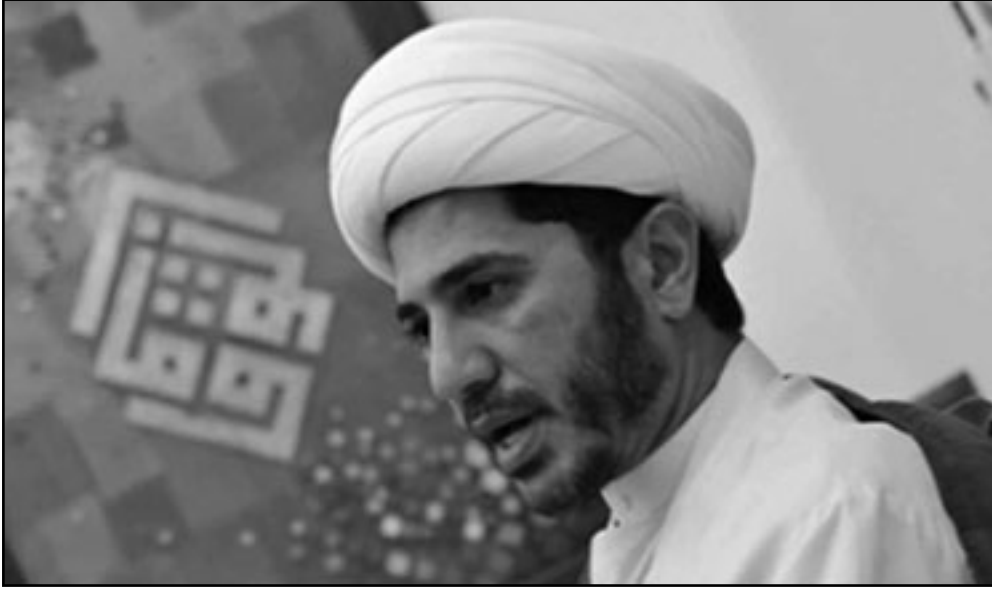
الأمين العام لجمعية الوفاق الوطني الإسلامية البحرينية المعارضة ورئيس كتلتها النيابية الشيخ علي سلمان