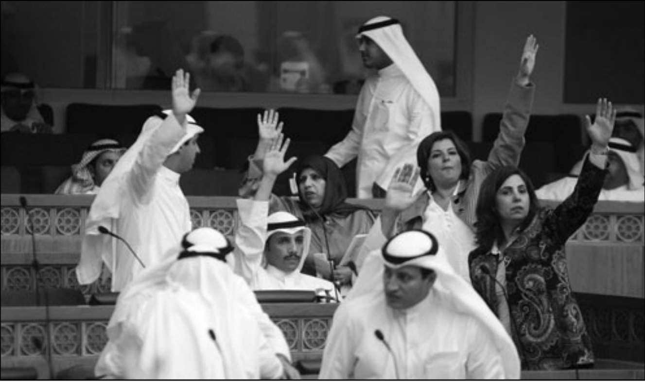
نواب كويتيون خلال الجلسة الاخيرة للبرلمان

الى ذلك أكد رئيس مجلس الامة الكويتي جاسم الخرافي امس ضرورة قبول الديمقراطية بحلولها ومرها، والحاجة الماسة لنقد الذات والوقت الصادقة مع النفس ومراجعة ما انجزته السلطان في دور الانعقاد المنقضي. وقال الخرافي في كلمة له بالجلسة الختامية لدور الانعقاد الثاني من الفصل التشريعي الـ13 لمجلس الامة «اذا كان لنا زماما علينا ان نقبل الديمقراطية بحلولها ومرها فمن ميجابتها كذلك ان نتعلم منها الدروس» مؤكدا الحاجة الماسة لنقد الذات ووقفة صادقة مع النفس «نراجع فيها يتجرد، وموضوعية ما قننا به في دور الانعقاد المنقضي». واضاف ان «علينا ان نراجع ايضا ما كان يجب علينا القيام به واغفلناه وما قننا به ولكن دون المستوى المطلوب» مبينا ان ذلك «لا يخص المجلس وحده بل الحكومة كذلك.. وواضح انه يتعين على الحكومة تحسين ادائها وتنفيذ برنامج عملها بالفعالية