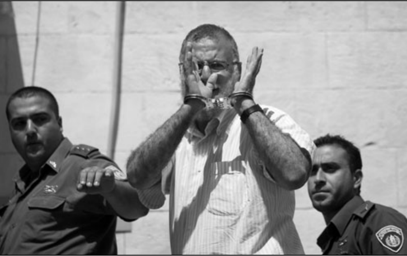
نائب حماس محمد ابو طير خلال اعتقاله من قبل قوات الاحتلال الاسرائيلي في القدس

«بمئلا تصعيدا اسرائيليا يهدف الى طرد شعبنا من مدينة القدس ومحاوله لانتزاعها من الاراضي الفلسطينية المحتلة»، وطالب القيادة الفلسطينية بالتوجه لمجلس الامن ومطالبه بالتدخل العاجل لوقف الاجراءات الاسرائيلية.