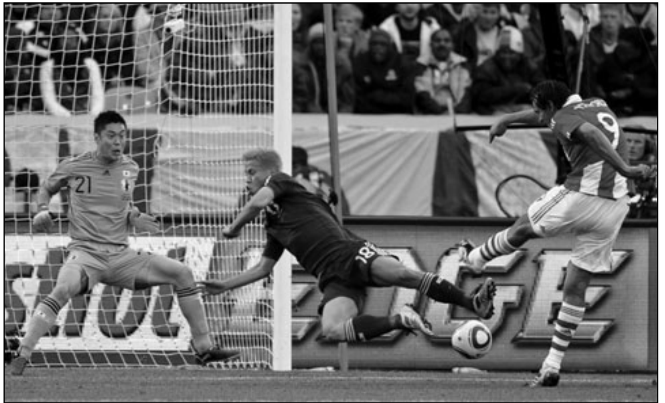
كيسوك هوندا (وسط) في فقرة خلال مباراة المنتخب الياباني مع باراغواي

طوكيو - رويترز: أعلن لاعب الوسط شونوسوكي ناكامورا اعتزال اللعب مع منتخب اليابان قبل مباراتين فقط من بلوغه المباراة الدولية رقم مئة في مشواره وذلك بعد خروج الفريق من كأس العالم لكرة القدم المقامة حالياً في جنوب أفريقيا. وذكرت وسائل اعلام محلية الخميس ان اللاعب البالغ من العمر 32 عاماً قرر اعتزال اللعب مع المنتخب الوطني بعدما جلس على مقاعد البدلاء في معظم مباريات نهائيات جنوب أفريقيا. وقال ناكامورا صحفية نيكان سيورتنس بعد خروج اليابان من دور الستة عشر بمرات الترجيح على يد باراغواي الثلاثاء «بالنسبة لمباراتي القادمة مع اليابان لن تكون هناك أي مباراة». وأضاف «كنت أرغب في ترك بصمة الوسط شونوسوكي ناكامورا اعتزل اللعب مع منتخب اليابان قبل مباراتين فقط من بلوغه المباراة الدولية رقم مئة في مشواره وذلك بعد خروج الفريق من كأس العالم لكرة القدم المقامة حالياً في جنوب أفريقيا. وذكرت وسائل اعلام محلية الخميس ان اللاعب البالغ من العمر 32 عاماً قرر اعتزال اللعب مع المنتخب الوطني بعدما جلس على مقاعد البدلاء في معظم مباريات نهائيات جنوب أفريقيا. وقال ناكامورا صحفية نيكان سيورتنس بعد خروج اليابان من دور الستة عشر بمرات الترجيح على يد باراغواي الثلاثاء «بالنسبة لمباراتي القادمة مع اليابان لن تكون هناك أي مباراة». وأضاف «كنت أرغب في ترك بصمة