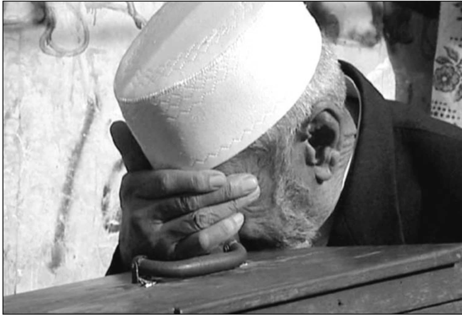
لقطة من فيلم «إلى أبي»