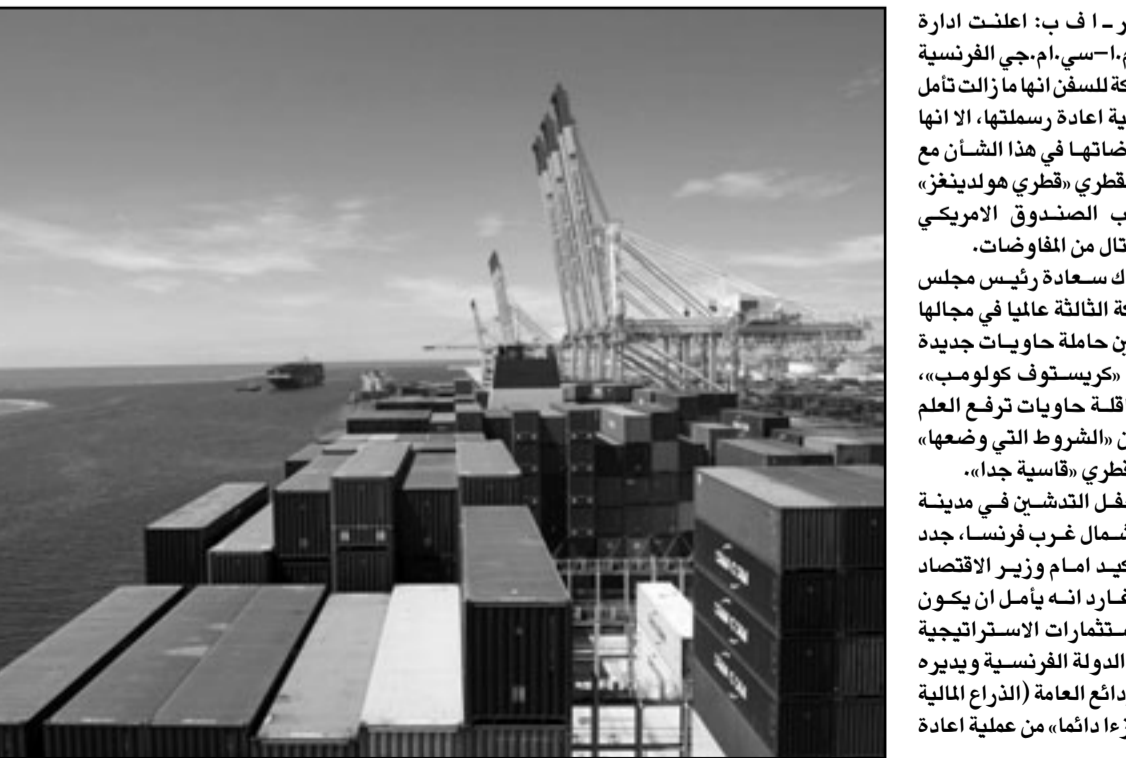
سفينة الحاويات كريستوف كولومبس الملكة لعائلة سعادة اللبنانية في ميناء الهافر الفرنسي

صندوق الاستثمارات الاستراتيجية الفرنسي «ينظر أن نجد شريكا آخر ليؤكد، مشاركتة، وما زالت الشركة عازمة على إنهاء مفاوضات إعادة الرسملة قبل نهاية تموز/يوليو. وكانت عائلة سعادة اللبنانية الاصل كشفت عن زعمها بحصة اقلية في رأسمال الشركة، وذلك بسبب ديون يفترض أن تبلغ 5.5 مليار دولار في نهاية 2010. وحاملة الحاويات «كريستوف كولومب» طولها 365 مترا، أي ما يوازي طول ثلاثة ملاعب كرة قدم، وبماكنها نقل حتى 13800 حاوية، وبلغت كلفتها 170 مليون دولار.