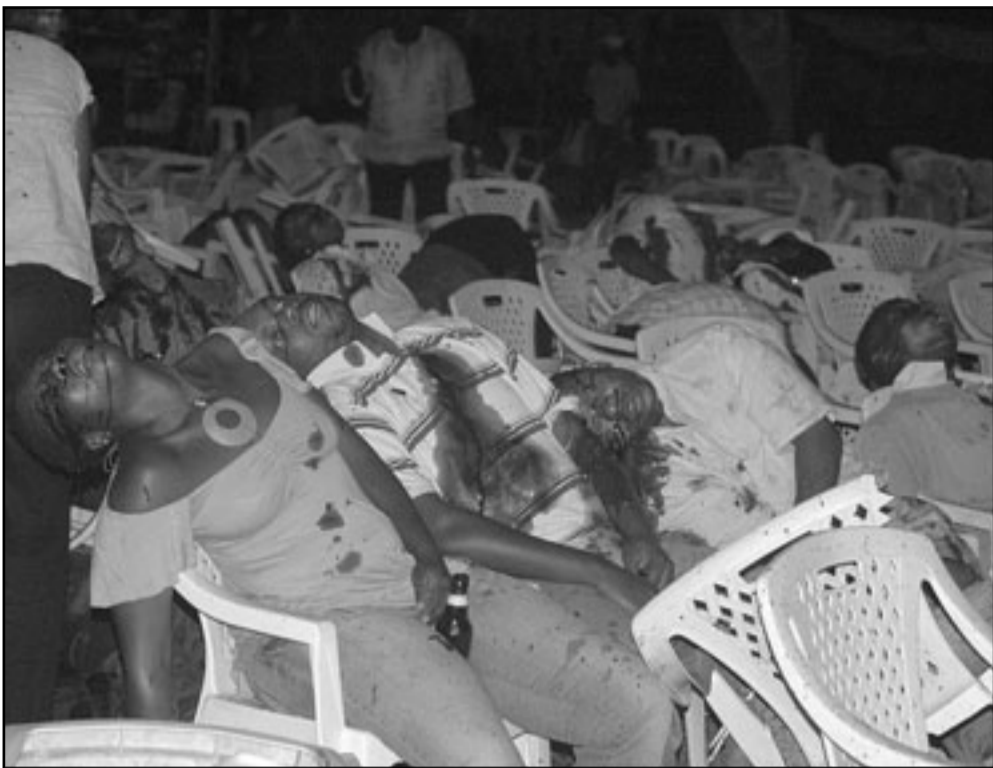
ضحايا احد التفجيرات التي وقعت في العاصمة الاوغندية كامبالا مساء الاحد