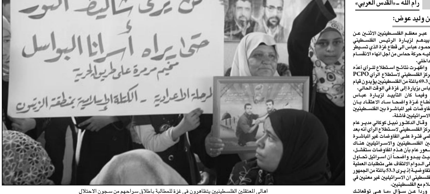
اهالي المعتقلين الفلسطينيين يتظاهرون في غزة للمطالبة باطلاق سراحهم من سجون الاحتلال

ذك كله يشكّل ترجيحاً امريكياً بالاتزام الذي قطعه اواماً بانهاء الاحتلال واقامة الدولة الفلسطينية وتحقيق السلام الشامل في المنطقة. وقال خالد 46.6 بالمئة من المستطلعين بانهم يتفقون بقيادة حركة فتح، في حين قال 33.7 % بانهم يتفقون بحركة حماس، و16.5 بالمئة لا يتفقون بالقيادتين، وتردد 3.8 بالمئة في الاجابة عن هذا السؤال. ويشان حق العودة للاجئين الفلسطينيين عبر معظم الفلسطينيين عن