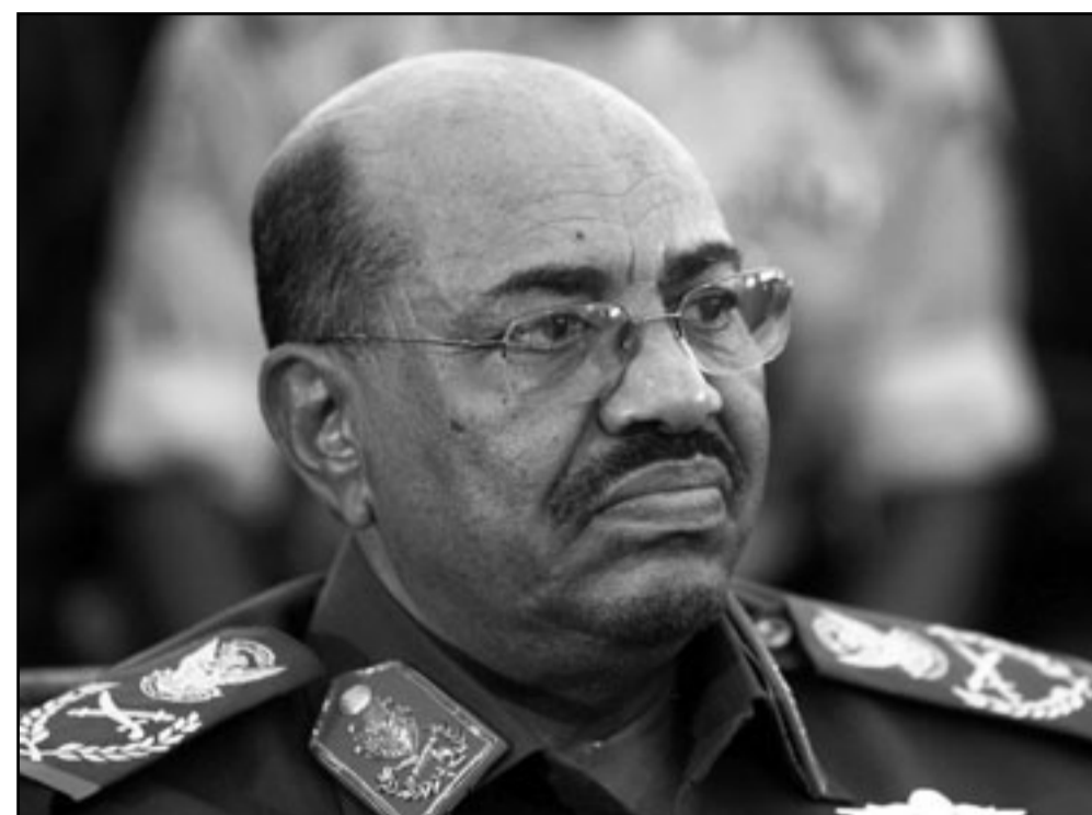
الرئيس السوداني عمر البشير

■ لاهاي - اف ب: اضافت المحكمة الجنائية الدولية تهمة الإبادة الى تهم جرائم الحرب وجرائم ضد الإنسانية الواردة في مذكرة التوقيف الصادرة بحق الرئيس السوداني عمر البشير، بحسب حكم نشر الاثنين. واعلن القضاة ان «الحكمة تعتبر ان هناك ادلة كافية تدفع الى الاعتقاد بانها يمكن اضافة تهمة الإبادة (الى تهم جرائم الحرب ومذكرات التوقيف بحق عمر البشير (...)).