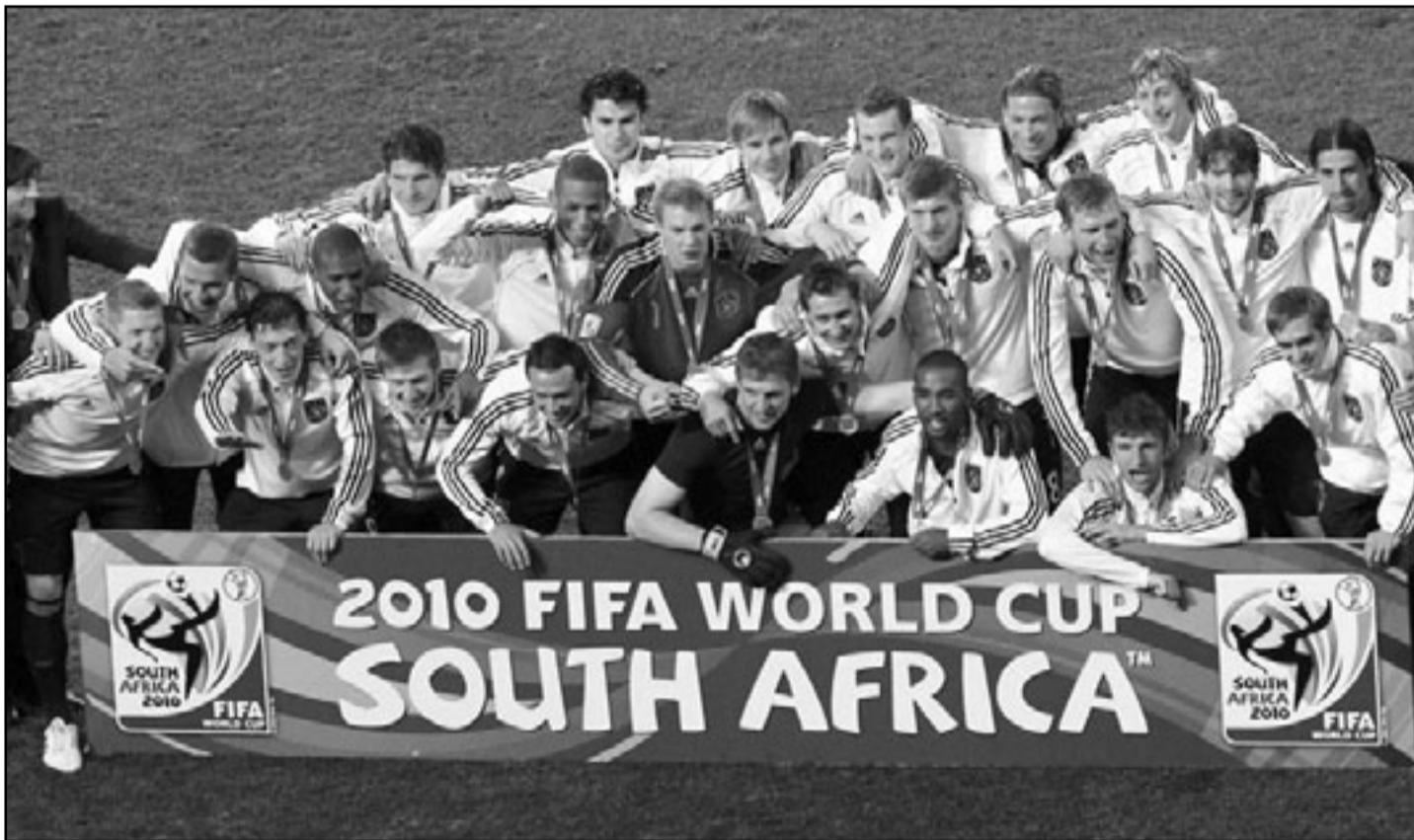
المنتخب الألماني الحائز على الميدالية البرونزية

استرداد - د ب أ: يعود المنتخب الهولندي الذي هزم في نهائي كأس العالم لكرة القدم 2010 أمام أسبانيا إلى بلاده في وقت أمس، حيث يلقي استقبالا رسميا وسط احتفالات في أمستردام تشمل رحلة بحرية للفريق في القنوات المائية بالدينة. ويرافق الفريق لدى دخوله المجال الجوي لهولندا طائرة عسكرية من طراز «إف 16» مطليبة باللون البرتقالي، وهو اللون الوطني للبلاد. ولن يكون هناك استقبال شعبي لدى وصولهم للمطار حيث ستلقاهم فور وصولهم مروحية عسكرية إلى أحد الفنادق للقاء الأهل والأصدقاء. وستنقل الملكة بياتريكس ورئيس الوزراء المنتهية ولايته جان بيتر بالكنينده اليوم الثلاثاء الفريق قبل إقامة ترحيب رسمي في أمستردام. ويشارك مئات الآلاف من المشجعين في الاحتفالات، والتي تشمل رحلة في قارب في القنوات المائية للدينة، يعقبها حفل استقبال في ميدان المتحف بالدينة. وكانت تقارير أولية قد ذكرت إلغاء الرحلة البحرية بعد خسارة الفريق الأحد بهدف مقابل لا شيء أمام أسبانيا، لكن مسؤولي المدينة قالوا أمس إنها ستتم بالتأكيد.