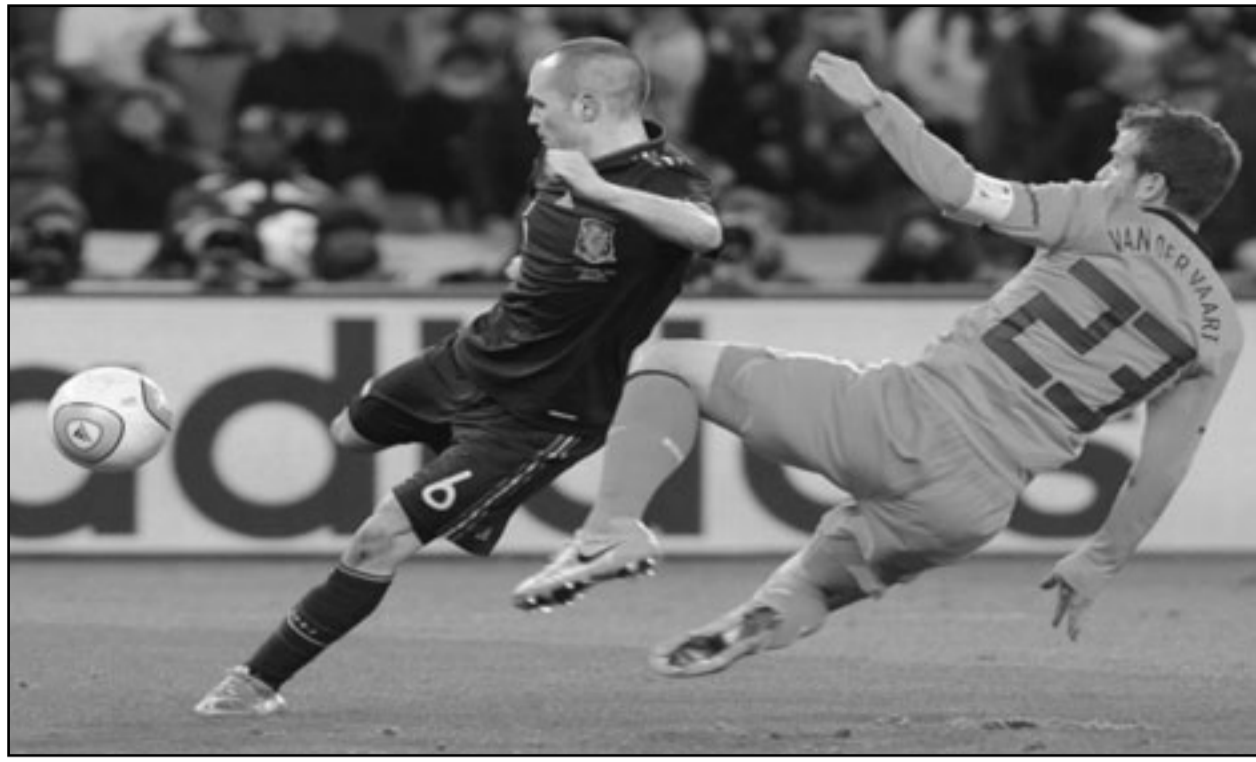
نجم منتخب اسبانيا اندريه انيستاستا يسدد هدف الفوز