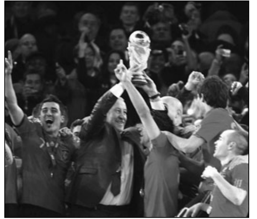
مدرب المنتخب الاسباني يرفع كأس البطولة