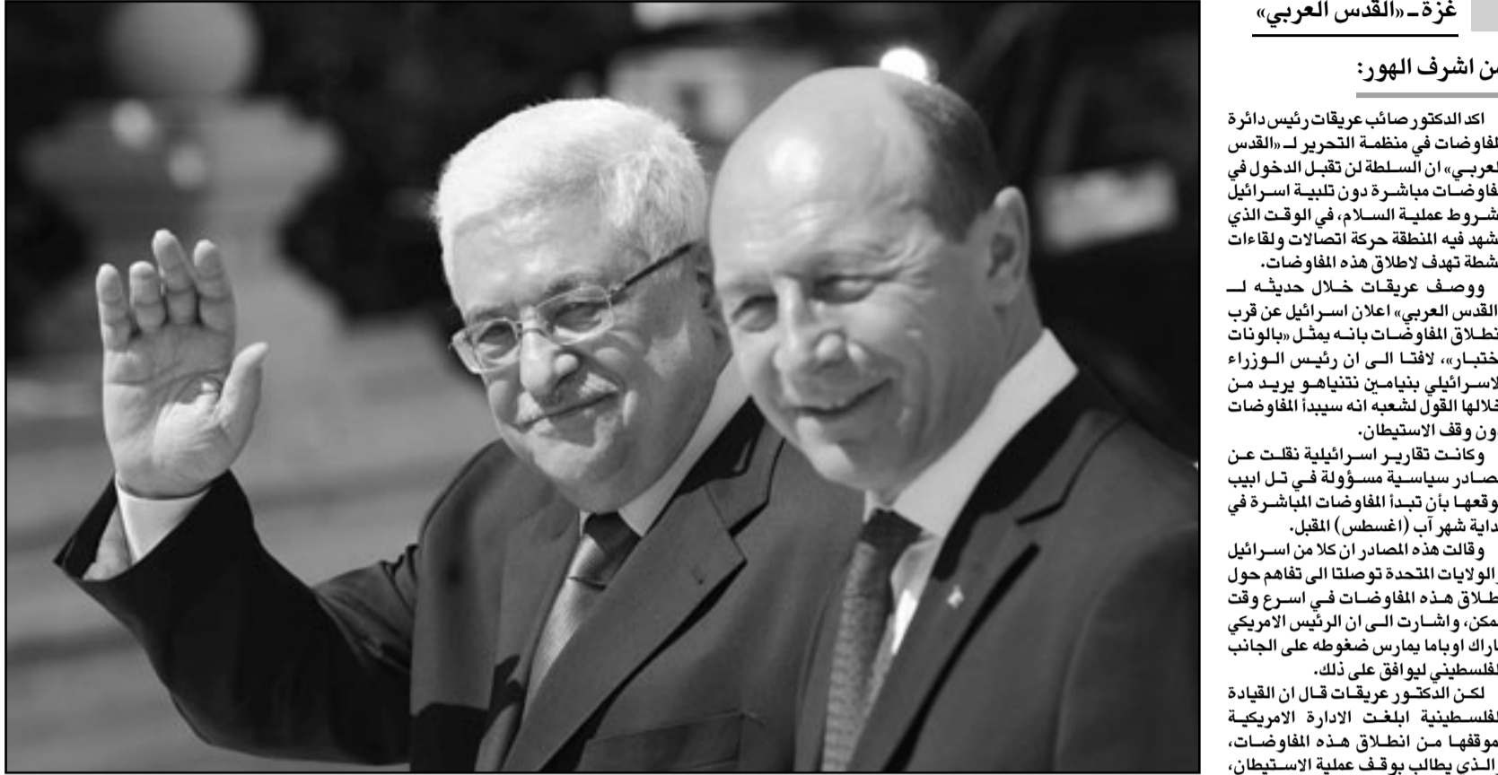
الرئيس الروماني لدى استقباله نظيره الفلسطيني خلال زيارة رسمية ليوخارست