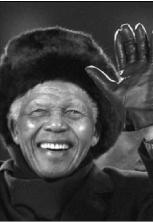
نيلسون مانديلا يحيي ضيوف جنوب أفريقيا