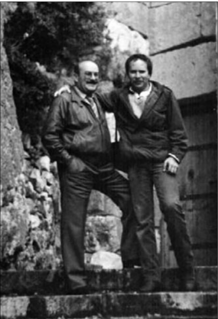
داوود شيخاني مع ابنه المخرج

بعد (كان يا مكان) لم يقدم داوود شيخاني ما يرضي طموحه، فعممط الأعمال التي نفذها، مما كثنل إلا محاولة للاستمرار والوجود ضمن معايير جديدة باتت تحكم في سوق الإنتاج الدرامي وتسفه تقاليده... كان يحمل مشروع مسلسل ضخم عن الحرب الصليبية ووقائعها