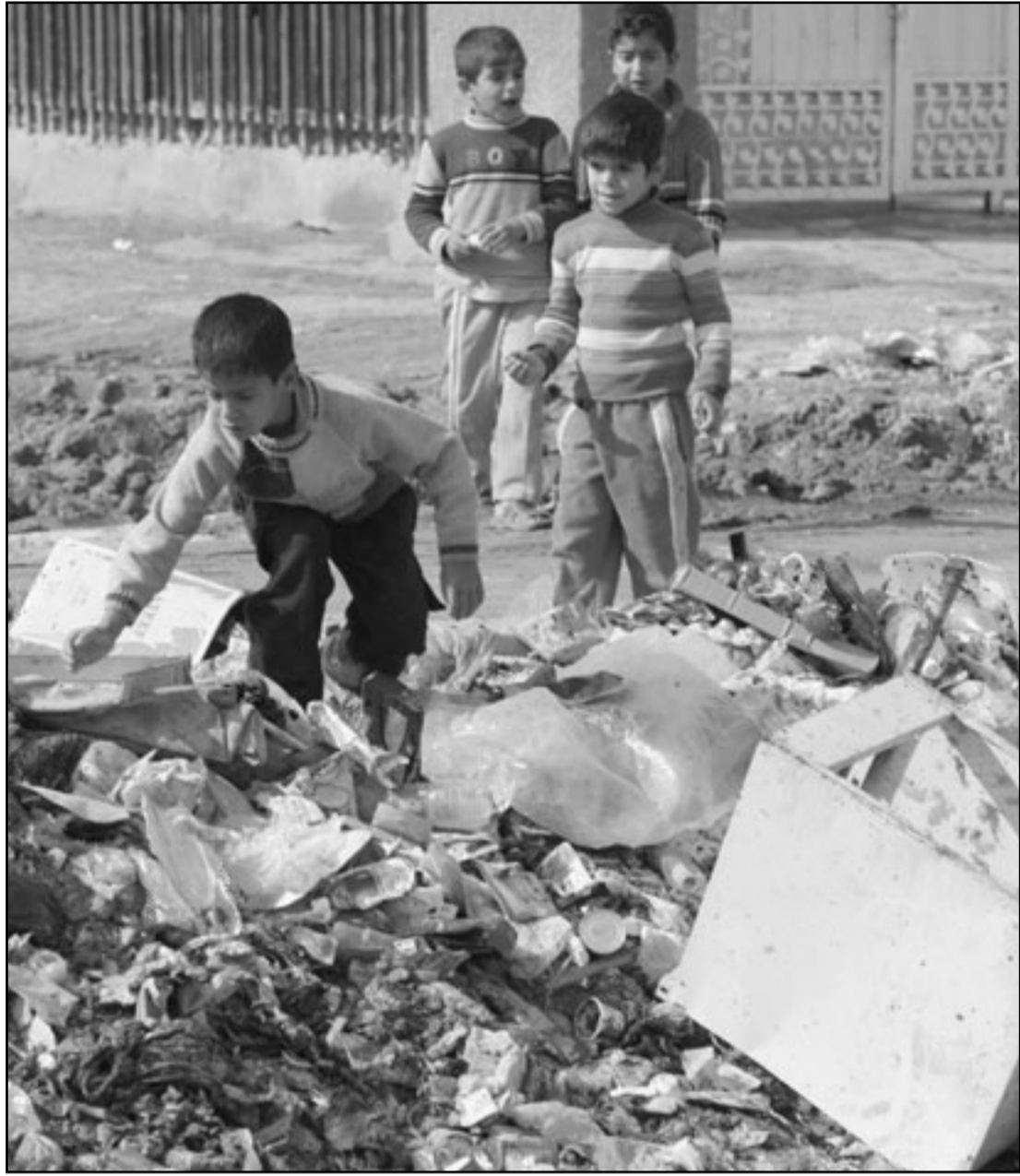
اطفال عراقيون يبحثون في اكوام القمامة بمدينة الصدر في بغداد