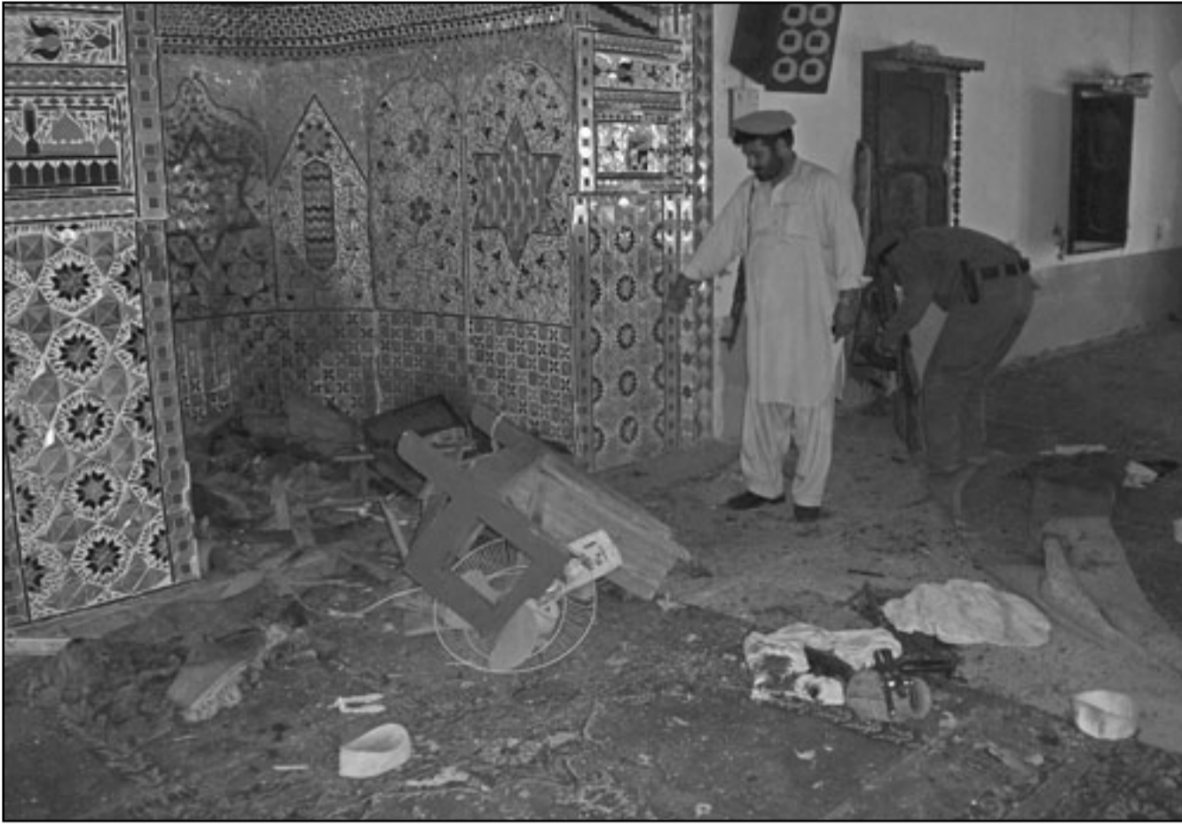
احد المساجد عقب تفجير انتحاري في افغانستان الجمعة

الثاني (نوفمبر) القادم، ويجعل زمني يعمل حسب واشنطن، وبحسب المسؤول فان محاولة بترايوس التاكيد على ضرورة تحقيق نتائج كانت وراء نقاش حاده وبينه وبين السكرتير العام لقوات الناتو اندريس فوغ راسوسوسين في مؤتمر بينهما تم عبر الفيديو الاسبوع الماضي.