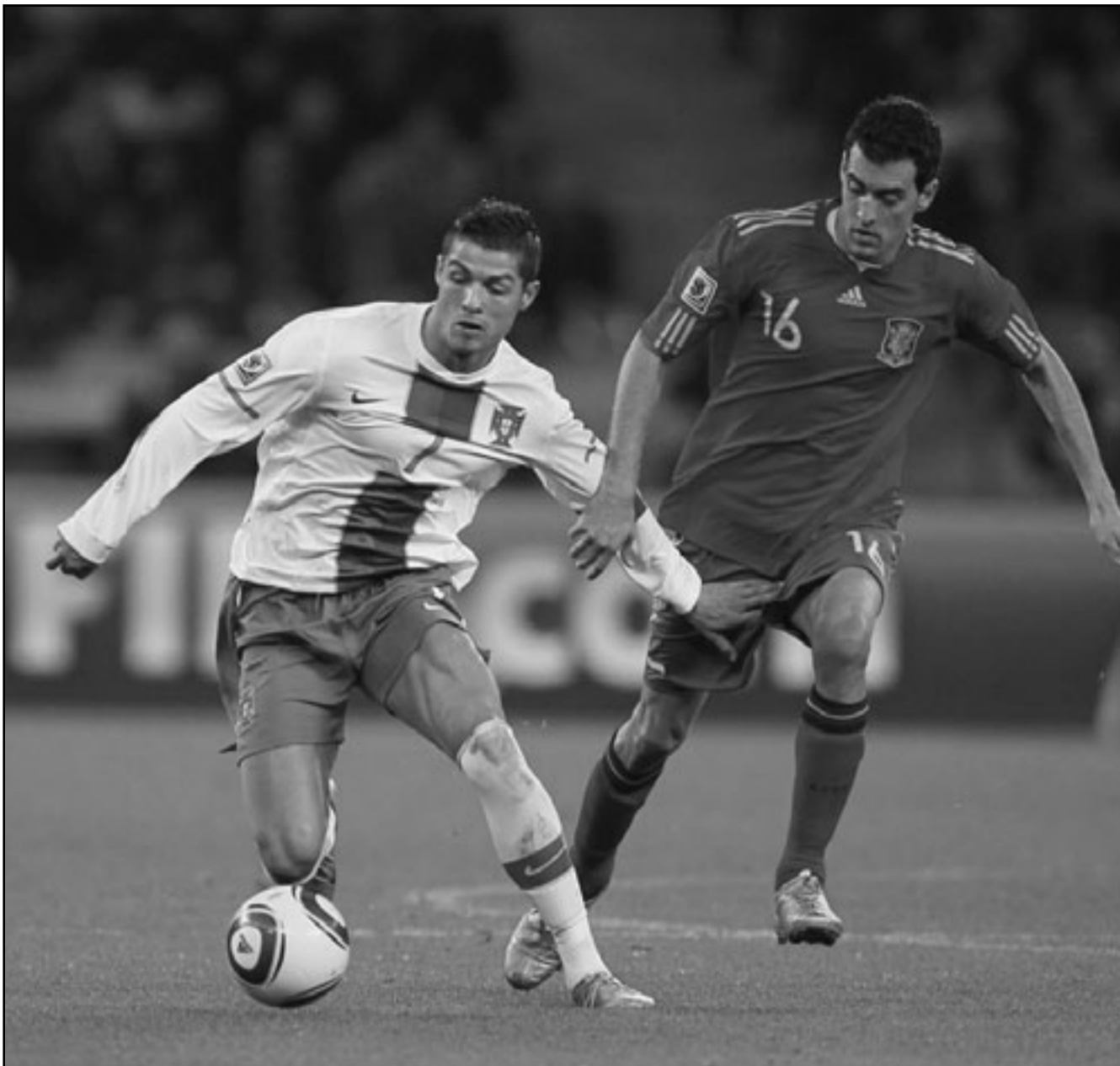
كريستيانو رونالدو ينفرد بالكرة خلال مباراة منتخب البرتغال مع اسبانيا في كأس العالم

برلين - د ب أ: ذكرت الصحافة الألمانية الجمعة أن لاعب الوسط الدولي سامي خضيرة نجم شتوتغارت سيقرر خلال الأيام المقبلة إذا ما كان سينتقل إلى صفوف ريال مدريد الأسباني. وقال لاعب المنتخب الألماني «إبني أندرس» إذا ما كتبت سأرحل إلى ريال مدريد، النادي نفسه أكد أنه مهم، مضيفا أنه سيبتدئ قرارا «خلال الأيام القادمة، على الأكثر في الأسبوع المقبل»، وفي تصريحاته لصحيفة «بيلد»، أوضح خضيرة لكرة القدم والتي الأصل السبب الذي يدفعه للرحيل إلى ريال مدريد: «إنه أكبر ناد في العالم، الآن».