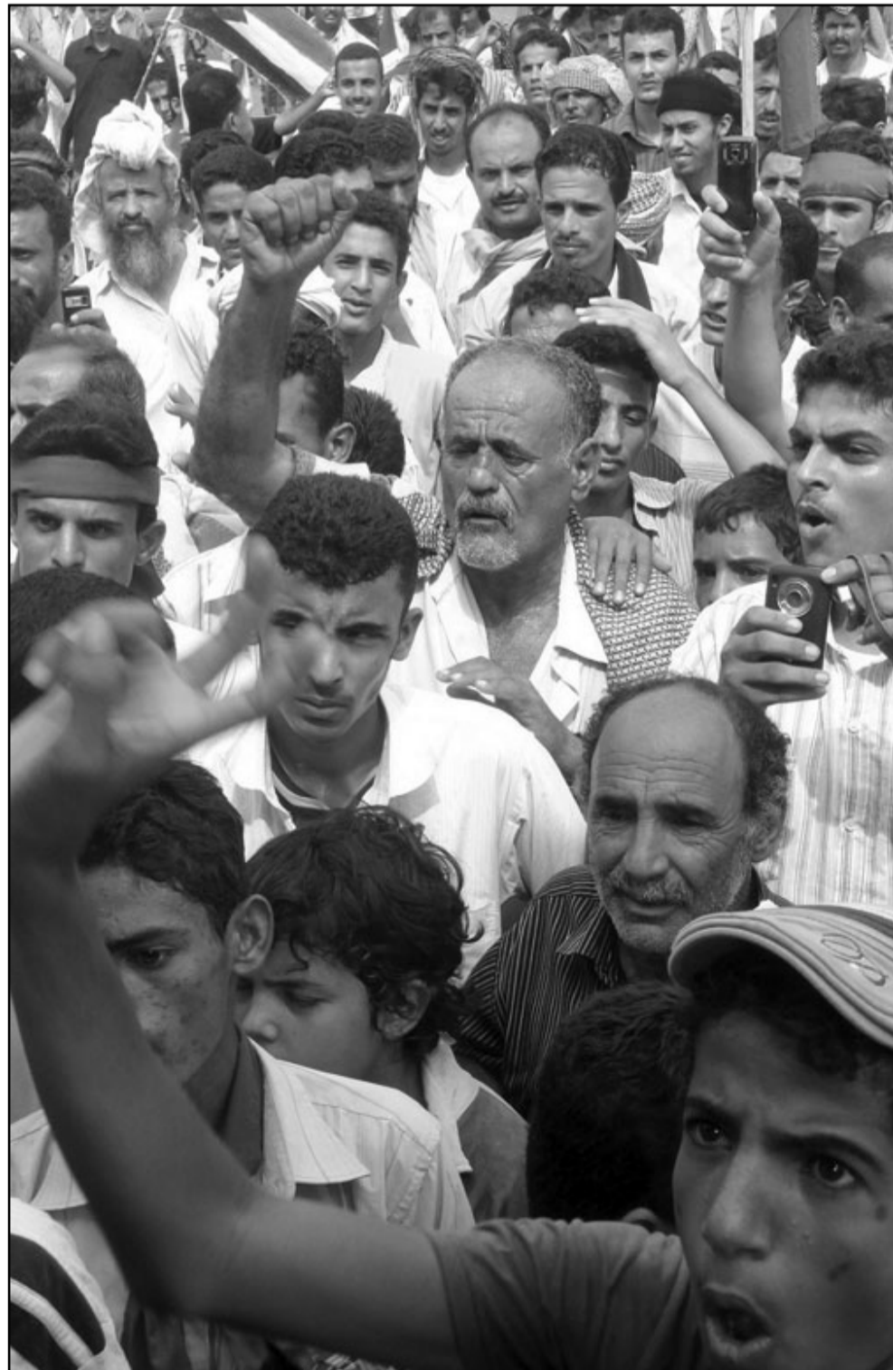
متظاهرون يمنيون في منطقة لحج

واعلنت وزارة الداخلية اليمنية على موقعها الالكتروني الخميس ان السلطات افرجت عن 183 من هؤلاء المعتقلين. الا