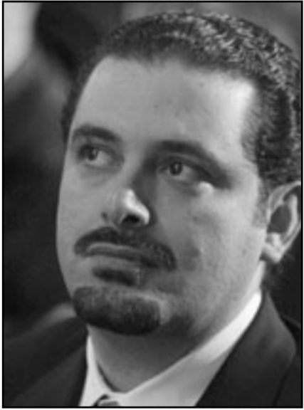
سعد الحريري يقول للأسد «انت اخونا»

الرئيس ورؤوس الاجهزة الحساسة. رفع فاروق الشمر، وزير الخارجية الخالد، وعين نائباً للرئيس، لكن من ذا يسععه؟ ومتى رايناه آخر مره؟» وجرى أمر مشابه ايضا على الجنرال اصف شوكت، صهر الرئيس، الذي كان رئيس اجهزة الاستخبارات، وهو اليوم يحمل اللقب الاجوف نائب رئيس هيئة الازكان، وتؤول صلاحياته الحقيقية الى الصفر. ان محاولة تخصيص سنين الاسد العشر في الرئاسة تظهر صورة مرعبة، فمن جهة، فتح سورية لاستغمارات اجنبية وجد خيرا اقتصاد لانشاء خطة لخصخصة المصارف والتخفيف على رجال الاعمال من الخليج، ولا سيما من السعودية. كما الاسد على ثقة من ان المال التركي سيسحب على المصانع والبنكي التحتية وان السياحة ستندمو وتزدهر، لكن تركيا تفضل استئجار مليارات في كرسئان خاصة، في مقابلة لذلك، الحظر الامريكي على التعاون مع سورية من كل نوع يصد الزخم. فادارة اوباما، مثل سابقتها تماما، تحاسب الاسد حسابا مرا عن توجيهه مرتزقة عربا الى العراق لقتل جنود امريكيين. وعندما عُرف الاسد ان البيت الابيض يتوسى بعلاقته بدمشق، وقف المرتزقة على الحدود. في شباط (فبراير) الاخير، عندما عيئت واشطن ووريت فورد سفيرا لها في دمشق لكن استقر رايها على ابقائه في الوطن حتى اشعار جديد، تحدثت موجة التسلل.