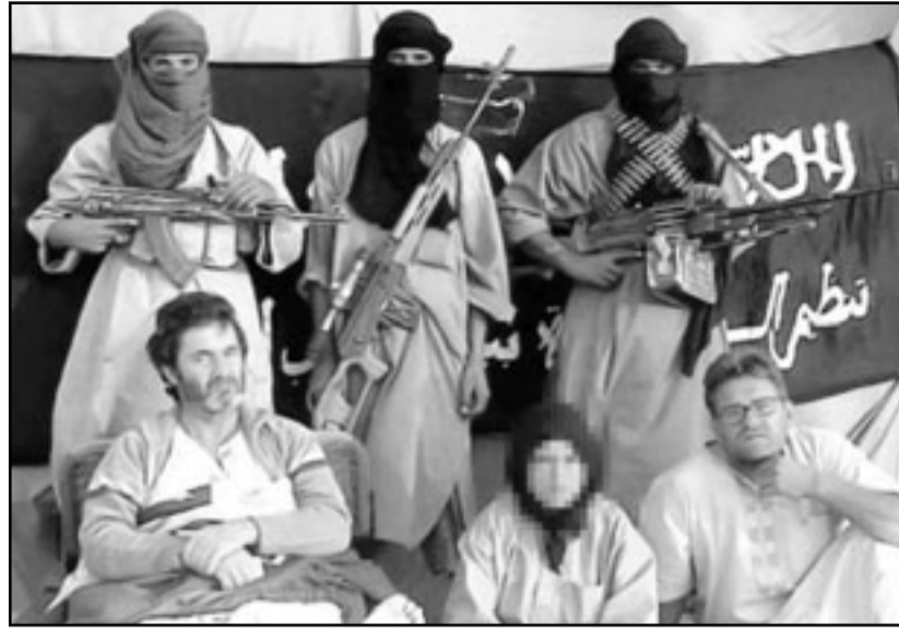
الرهيئتين الإسبانييتين، روكي على اليمن والبر على اليسار رفقة أفراد من تنظيم القاعدة المغرب الاسلامي

دي لفيغا أمس الجمعة في ندوة صحافية أن «المعلومات المتوفرة لدى الحكومة تؤكد أن الرهيئتين الإسبانييتين بخير وأن الجماعة التي تحتجزهما غير تلك التي تحتجز الرهيئة الفرنسي». وبهذا تحاول هذه المسؤولية الحكومية استبعاد انعكاسات سلبية للعملية العسكرية على الإسبانيين المختطفين. وتفيد مصادر سياسية إسبانية أن حكومة مدريد لم تكن على علم بهذه العملية العسكرية التي نفذتها القوات الموريتانية يعلم من باريس، ولو كانت تعلم لعارضتها لأنها تعتقد أن حل مشكلة الرهائن يمر أساسا عبر التفاوض وليس عبر القوة العسكرية.