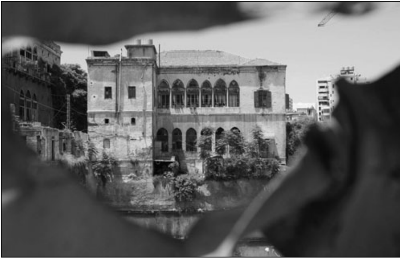
أحد بيوت بيروت العثمانية المهتدة بالهدم