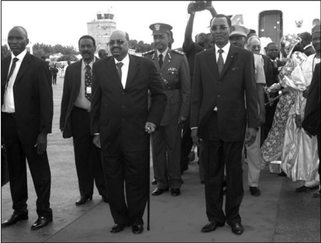
الرئيس السوداني عمر البشير مع نظيره التشادي ادريس ديببي امس

■ نجماينا - اف ب: اختارت تشاد اعطاء الاولوية للسودان رافضة تنفيذ مذكريتي توقيف اصدرتهما المحكمة الجنائية الدولية بحق الرئيس السوداني عمر البشير الذي انهي بعد ظهر الجمعة زيارة لنجماينا استمرت ثلاثة ايام.