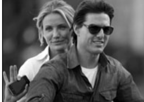
توم كروز وكامبيرون دياز

وقد قام كروز وكامبيرون مساء الأربعاء بالمشاركة في حفل العرض الأول لفيلمها الجديد «نايت أند داي» (فارس ونهار) في مدينة ميونخ جنوب ألمانيا.