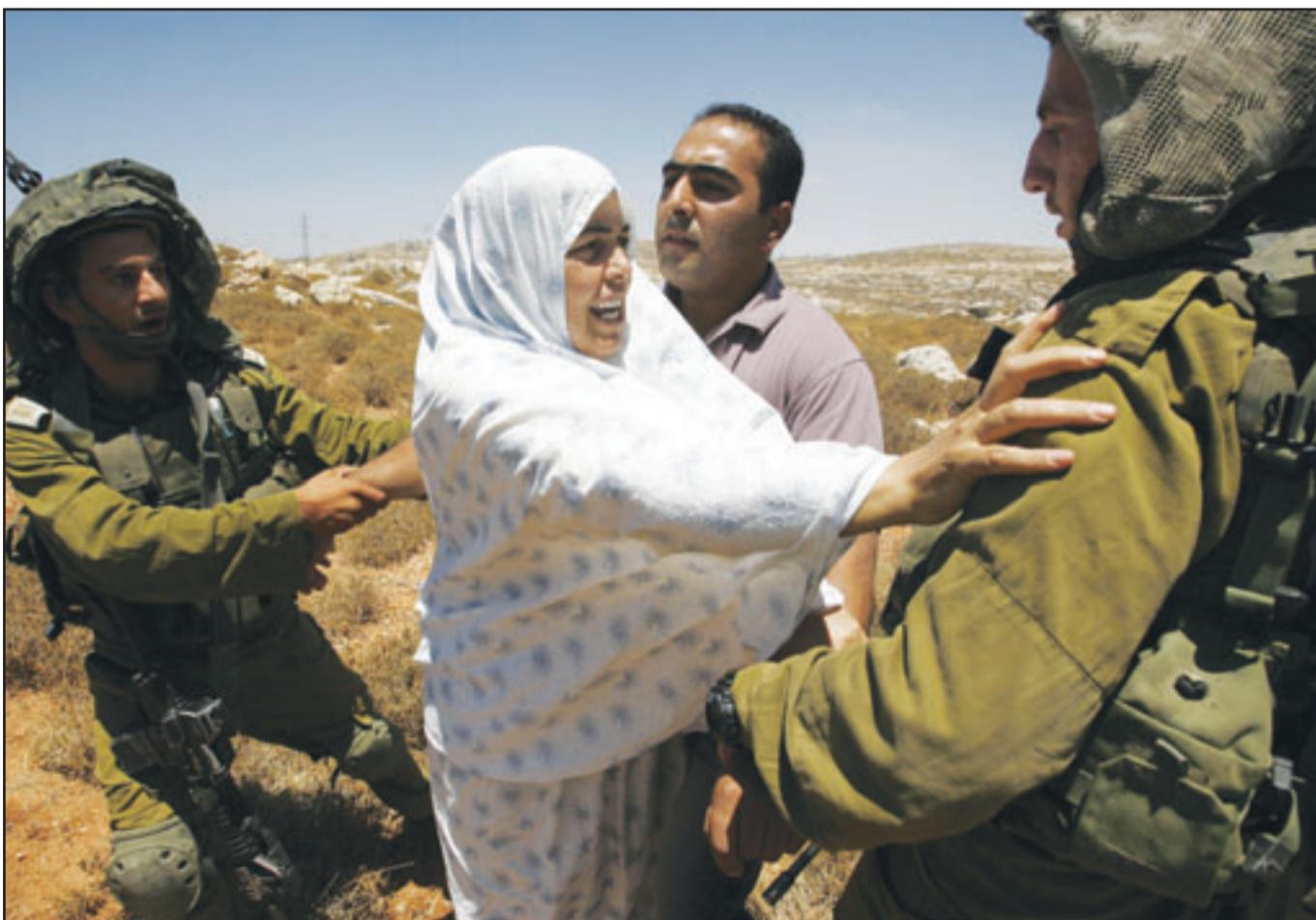
سيدة فلسطينية وابنها يتعاركان مع جنود الاحتلال عقب استيلاء مستوطنين على أرضهم قرب الخليل

تتخذها وهذه واحدة منها». وأضاف «يحدونا الأمل في ان نتخذ الخطوات اللازمة الأخرى». وفي حين تتوقع وصول سفينتي مساعدات من لبنان قالت اسرائيل الخميس ان لها الحق في «استخدام كل الوسائل الضرورية»، لمنعها من الوصول الى غزة. وصفت وسائل الاعلام الإسرائيلية مصادر السفينتين مريم وناجي العلي بأنها وشيكة، لكن مصادر لبنانية قالت ان السفينة مريم تقطعت بها السبل بسبب مشكلات تتعلق بإجراءات ورقية. واعترفت اسرائيل بارتكاب أخطاء في التخطيط