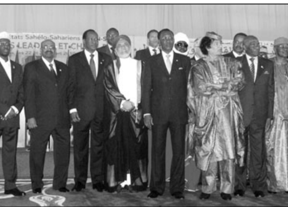
الزعيم الليبي معمر القذافي وأعضاء قمة الساحل والصحراء التي عقدت في تشاد

الليبي معمر القذافي الخميس في نجامينا موضوع القمة لـ 15 للاتحاد الإفريقي وذلك في كلمة أمام حوالي 12 رئيسا إفريقيا، معتبرا ان الاتحاد يتعدى بذلك على «اختصاص» اليونسيف. ومن المقرر عقد قمة الاتحاد الاوروبي من 25 الى 27 تموز/يوليو في كيبالا تحت عنوان «صحة الام والرضيع، الطفولة والتنمية في افريقيا». وعلق القذافي في كلمته عند افتتاح قمة دول الساحل والصحراء (سين-صاد) بقوله «اما موضوع القمة الرئيسي الذي هو الطفولة او الاطفال الرضع، فهذا نحن لن نناقشه لاننا لسنا (اليونسيف)... هذا اختصاص (اليونسيف)». وكرر الزعيم الليبي انتقاداته لمشروع الوحدة الإفريقية، وقال انه من الضروري «احترام القانون التأسيسي للاتحاد الإفريقي وتطبيقه، والذي لا يريد ان يطبق هذه القرارات وتحمل المسؤولية وموقفه غير شرعي». وأضاف «القرارات موجودة وستوضع امام قمة الاتحاد الإفريقي بواسطة الرئيس (التشادي) ادريس (ديبي انثو) رئيس سين-صاد الذي سيصدر عنا وعن هذه القمة». وكان القذافي احد الداعين المتمسكين الى انشاء الاتحاد الإفريقي الذي انطلق عام 2002 محل منظمة الوحدة الإفريقية التي انشئت عام 1963. وتولى القذافي الرئاسة الدورية للاتحاد الإفريقي من كانون الثاني/يناير 2009 الى كانون الثاني/يناير 2010. وكان رافعا في الترشح لولاية