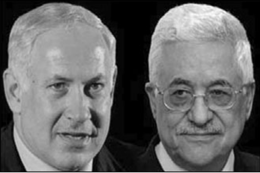
ينفي تعزيز زعامة محمود عباس

في نهاية المفاوضات في ابيدنا، نظريا هذا يبدو منطقيا، اما عمليا فم سيقفر بدون مفاوضات مباشرة ما سيقيى وما لن يبقى في ابيدنا في اطار ودوتين لبقاش نأهيك من أنه من زاوية نظر الفلسطينيين فان هذه حقفة لن تشجع الاسد.