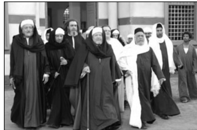
لقطة من مسلسل «شيخ العرب»