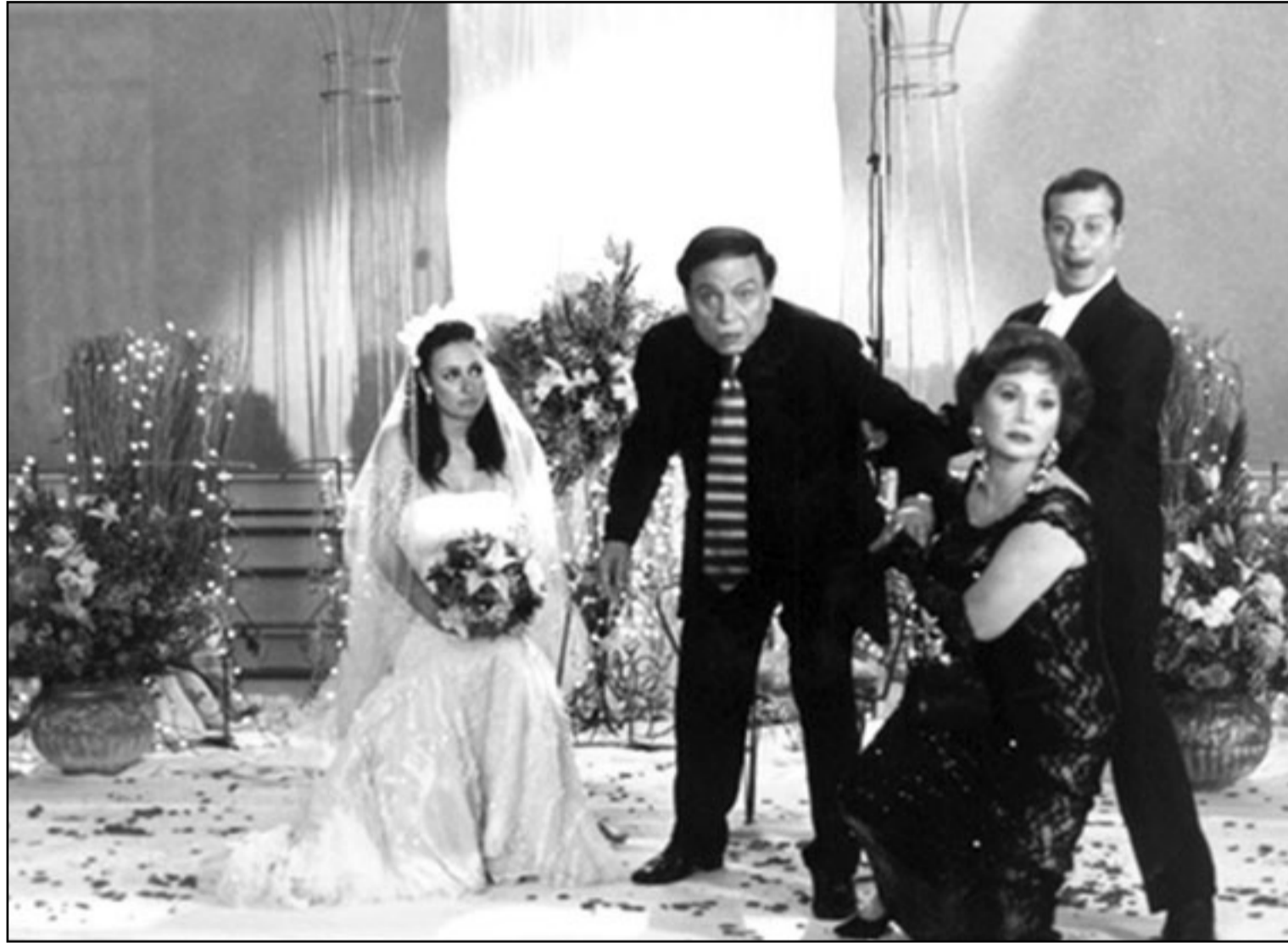
لقطة من فيلم «عريس من جهة أمنية»

ويتمدد الفكر الفكري ليشمل الأماكناً التي تدور بها الأحداث مثل (منزل البطلة وقسم الشرطة والفصل) حيث نشاهد نفس الموقف كل فترة مع اختلاف ردود الأفعال، بينما تتعدد أماكن التصوير في الجزء الداعشي الأخير الذي يكرس لفكرة المواطن الصالح، عندما تقوم نخبة بتغيير أسلوبها وتحصل على لقب المدرسة المثالية، وهو لقب زائف تماماً، فهي لم تفعل شيئاً تستحق عليه المكالفة، فالسيد المؤلف قد استوعب متطلبات