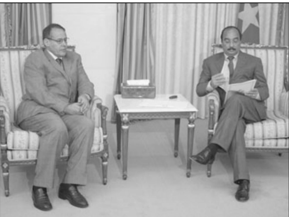
الرئيس الموريتاني خلال لقائه بمحمد خداد عضو الامانة الوطنية لجبهة البوليساريو

نحن على كل حال في الجمهورية العربية الصحراوية الديمقراطية منفجحن ومستعدون للمساهمة في ايجاد حل مشرف للجميع يحترم حقوق هذا ويضمن مصالح ذلك، حل مبني على أساس الشرعية الدولية والحياد والديمقراطية وعلى أساس حق الشعوب في تقرير مصيرها..»