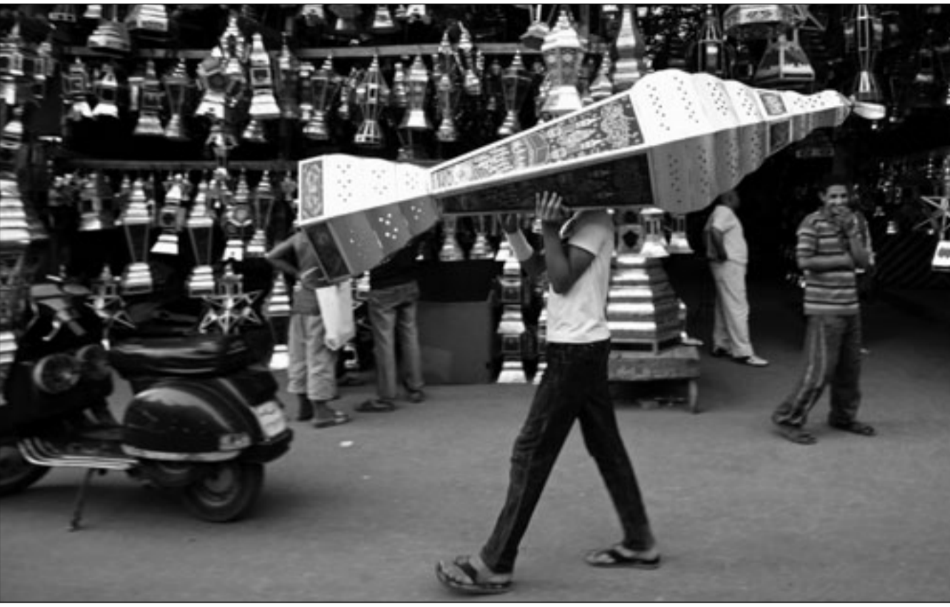
فوانيس رمضان تنتشر في القاهرة عشية بدء رمضان