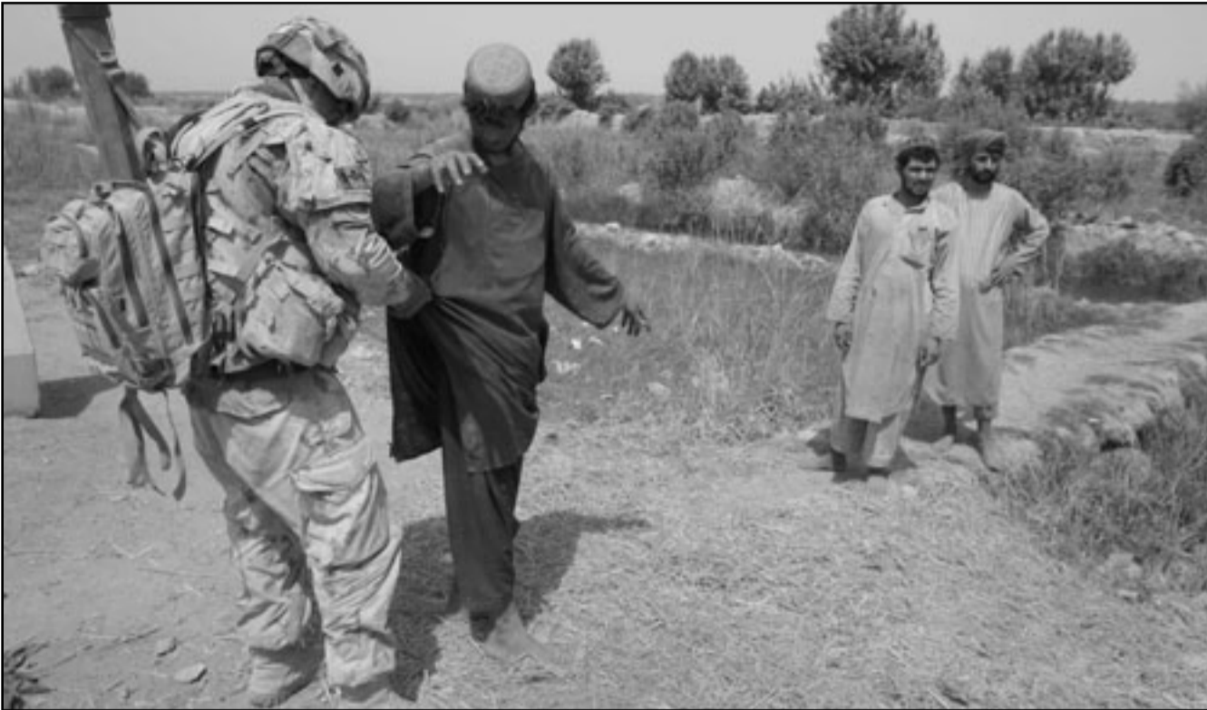
جندي كندي من قوات التحالف الدولية يقوم بتفتيش افغاني قرب قرية بازار بالقرب من قندهار امس