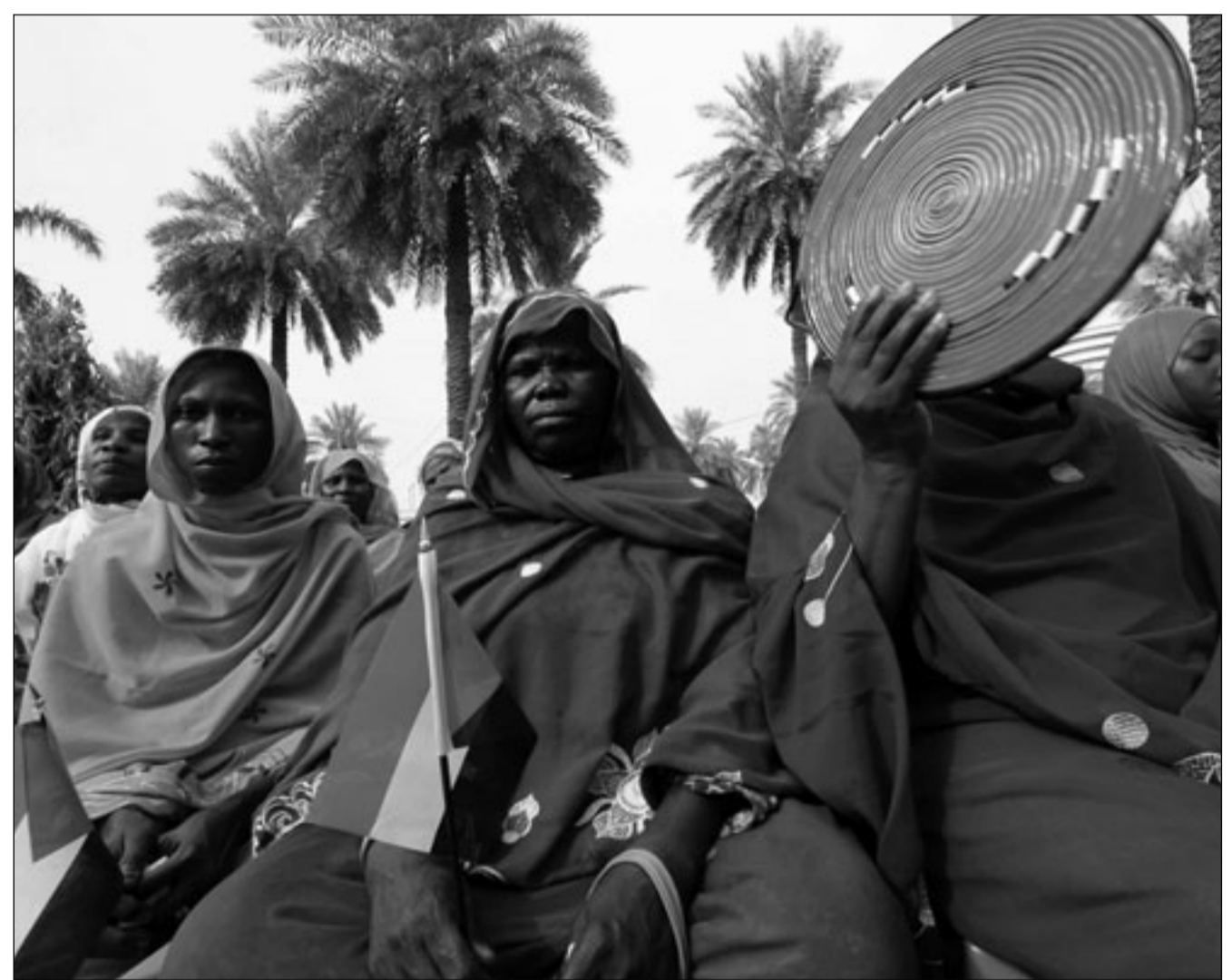
سودانيات في الخرطوم امس (اف ب)

مفروضة على المسيحيين وسمح للمصريين بالانخراط في الجيش. وتضيف أن «تعاليم» رائد النهضة التعليمية رفاعة الطهطاوي (1801-1873) كانت تعنى بأمة مصرية لا تتناسس على دين أو لغة وإنما تعتمد على مبدأ الوأمة والمساواة بين المصريين مهما تكن عقائدهم الدينية. وتشدد المؤلفة على أن «نظرة الغرب إلى الإسلام غير صحيحة وغير منصفة... نحن في حاجة إلى تصحيح نظرة الغرب المسيحي إلى الإسلام وتصحيح صورته ونحن أيضا بنفس القدر في حاجة إلى تصحيح نظرة العالم الإسلامي إلى المسيحية» وهذا كغفل باشاعة روح التعايش وقبول الاختلاف. وترى أن «قضية المعتقدمات الدينية» يجب أن تكون خارج محاولات الشرح والفهم والتقريب والمصالحة لأن العقيدة قضية تخص علاقة الإنسان وخالفه «ولا يجوز أن تكون محل جدل أو حوار» بل محل احترام متبادل. وتضيف أن هجمات 11 ايلول/سبتمبر 2001 على الولايات المتحدة «علت مبررا لترسيخ فكرة صراع الأديان عندما نسبت إلى إسلاميين ثم جاءت حرب أفغانستان (في نهاية العام نفسه) لتصفيتهم» في إشارة إلى تنظيم القاعدة الذي كان يتخذ من أفغانستان تحت حكم طالبان