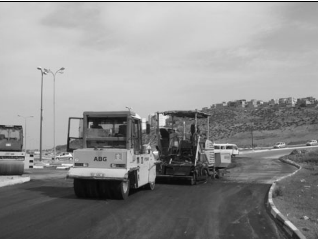
الطرق الجديدة تجسد استمرار تحويل الضفة الى كانتونات

ليس فقط 443. الطرق الواسعة الاخرى ايضا- تلك التي وسعتها او شقتها اسرائيل كطرق سريعة مسبقا في ظل المصادرة المكثفة للاراضي الفلسطينية - تخدم اساسا أو حصرا الاحتياجات الاستيطانية - المواصلاتية للمسافرين الاسرائيليين (يهود، في اغلبيتهم الساحقة، بفصل تعريف المستوطنات). في 2004 المجلس (الاسرائيلي) للاثمن الوطني يكشف النقاب عن الخطة لاقامة بنيتين منفصلتين من الطرق في الضفة (استمرار منطقي مباشر لمنظومة الطرق الالتفافية في الثمانينيات والتسعينيات)، مثلثو الدول المانحة والبنك الدولي نهلوا من الطلب الاسرائيلي الوثق في ان تمول التبرعات جزءا من الخطة. فالاحاديث الناعمة عن «الرغبة في ضمان نسيج الحياة الفلسطينية من خلال تواصل موصلاتي، لم تتوشح عقولهم. فقد فهموا بان هذا سبيل آخر