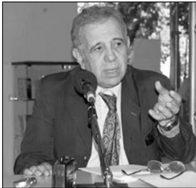
فاروق قسطنطيني رئيس للجنة الاستشارية الجزائرية لترقية وحماية حقوق الإنسان

والتي رأت السلطات الجزائرية أنها مسيئة لها وغير منصفة، بل ذهبت إلى حد اتهام بعض المنظمات الحقوقية بحماية الجماعات الاسلامية المسلحة.