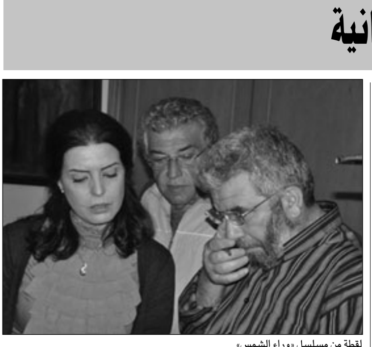
لقطة من مسلسل «وراء الشمس»

ثالث من هناك قائلا: نعم نعم لقد شاهدته قبيل الإفطار في مسلح تاريخي يجسد دور قائد عربي، وواصل آخر من هناك: بل بلى وأنا كنت قد رأيت قبيل مجيئي إليك بدور رومانسي مع تلك الممثلة التي اخته الآن وقد كانا متزوجين بالأسف في مسلسل آخر، ثم صاح واحد من هنا وآخر من هناك حتى تعالت الأصوات لتتشرع عن المسلسلات وقصصها وأبطالها وبطلاتها وهكذا حتى دخلنا في حديث غوغائي لم ينته منه إلا عندما شعرت أنا بالدوار وصرخت بهم قائلاً: أرجوكم أوقفوا هذا الهراء أرجوكم، ما أنا قد وجدتها وجدتها عرفت السبب الذي أصبنا نحن جميعاً به، إنه هذا الكم الهائل من الأعمال الدرامية العربية اللعينة التي تأتيها في فترة شهر واحد وهو شهر الصيام، فلم نعد نميز مسلسلاً من آخر ولا بطلا يؤدي دوره هنا وهناك ولا ممثلة كانت قبيل قليل اختنا لذلك الممثل، فنقلب جهاز التحكم وإذ بها عشيقتي، اختلخت علينا الأمور ودخل الحابل بالنابل ولم نعد نميز الأشياء بعضها من بعض، وقد بدأتنا نمل ونكل ونشعر باليأس والاحباط، وفقدنا عنصر التشويق في ترقب ومتابعة أي عمل درامي سمعنا عنه لم نسمع.