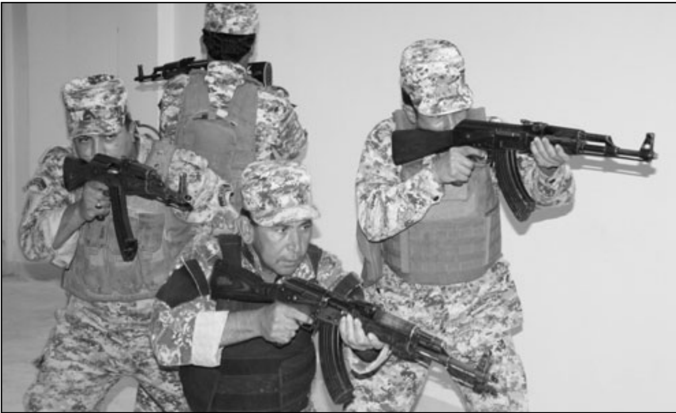
جنود عراقيون يتدربون في القاعدة الأمريكية ببغداد

من جهته، أكد رئيس الوزراء العراقي نوري المالكي الحرص على تطوير العلاقات مع الولايات المتحدة الأمريكية في مختلف المجالات وتعزيز اتفاقية الإطار الاستراتيجي، وأضاف خلال استقباله وفداً من الكونغرس الأمريكي في بغداد «تزيد تعميق العلاقات ضمن اتفاقية الإطار الاستراتيجي لأن المرحلة العسكرية انتهت بنجاح» كما نقل بيان صحفي لرئاسة الوزراء عنه يقول فيها يتعلق بتشكيل الحكومة إن «الأمور بدأت تتضح باتجاه تشكيلها وإن المهم أن يكون التشكيل منبسطاً على أسس صحيحة»، بحسب تعبيره. وأعاد البيان بأن أعضاء الوفد جددوا «دعم الولايات المتحدة للحكومة العراقية في جهودها من أجل الحفاظ على استقرار العراق وازدهاره» وتطويره في مختلف المجالات، وعلى صعيد آخر، أكد عضو في