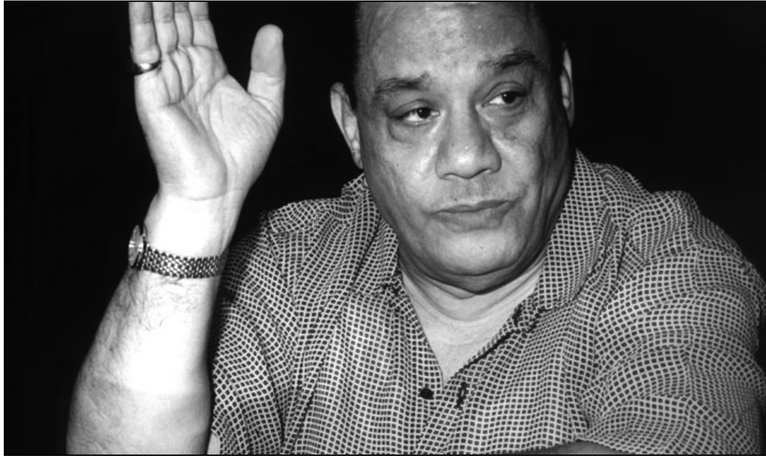
حلمي بكر (القدس العربي)