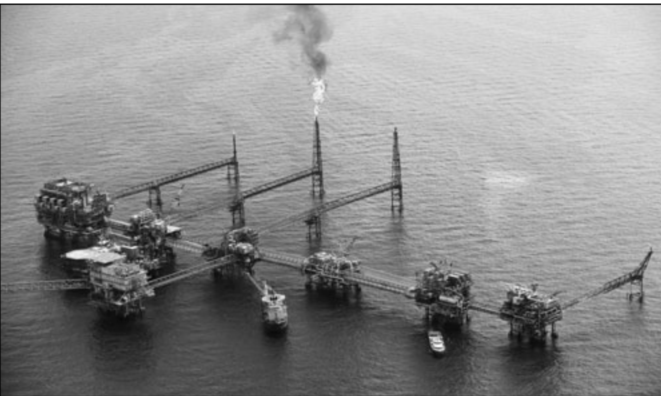
محطة بحرية متعددة المنصات تابعة لشركة النفط الوطنية المكسيكية العاملة في خليج المكسيك بعيدا عن حقل «بي بي» المغطوب

خلال إدارته لصندوق تعويضات هجمات الحادي عشر من ايلول/سبتمبر ولعملية تقدير أجور المديرين