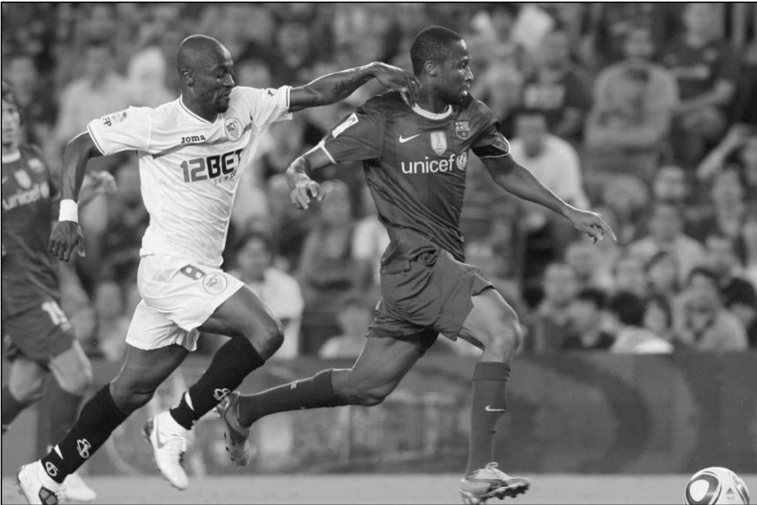
سيدون كيتا نجم برشلونة (يمين) في منافسة للفوز بالكرة مع زوكورا نجم اشبيلية خلال مباراتهما في كأس السوبر الاسبانية

3/ صفر خلال أول نصف ساعة من المباراة، ولكن توتنهام استعان بروحه القتالية ليسجل هدفين ويبقى المنافسة متوازنة.