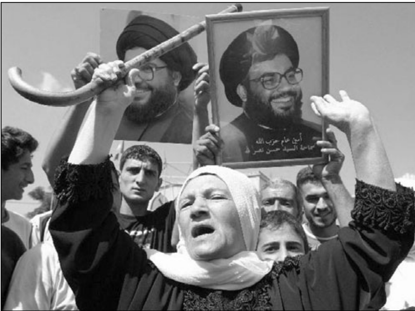
لبنانية تحتفل بانتصار حزب الله في حرب عام 2006 (صورة من الارشيف)

عن الطعام، في ظروف صعبة للغاية، على حد قوله. واوضح في سياق حديثه ان التصح بسرعة كبيرة جدا، حرب لبنان الثانية كانت على الوعي والبرع، وفي الحالتين فشل الجيش الاسرائيلي، على حد قوله. وبرايه فان الامر المهم فعلا هو صورة الجيش الاسرائيلي ومعه صورة اسرائيل في نظر العدو الذي تقالته وفي نظر الخصوم الاخرين في المنطقة، وهذا يمكن الخطر الاذخ الذي تسببت به هذه الحرب، لانه عندما تطلق اكثر من 3 آلاف صاروخ على الجليل وحيفا والخضيرة دون ان تتمكن اسرائيل من جني الثمن من اي احد، يتصدع الروح الاسرائيلي، وبالتالي فانه من المحتمل ان يظهر في من يقدر ان دفع العملية السياسية يستوجب اطلاق الصواريخ على تل ابيب، ذلك لان اسرائيل لم تقم بالرد الحقيقي على اطلاق الصواريخ من لبنان وانما اضطرت ايضا الى الموافقة على تسوية اممية تبقى على الترتيب الصاروخية بيد حزب الله. وزاد قائلا للصفا في حسام حرب، الذي اجري معه اللقاء ان الغطرسة والفتنة الناتجة الفيلة التي ميزت قيادة الجيش سببتا في اهمال تحسين الجبهة الداخلية، ذلك لانه اذا كان من الواضح ان سلاح الجو سيضيق على القواعد الصاروخية خلال عدة ايام فعندما يطلب من سكان المنطقة الشمالية اعداد الملاجئ والتزود بالوقود، والنتيجة معروفة، اكثر من مليون مواطن كانوا في الملاجئ لمدة ثلثي الشهر، يبحثون