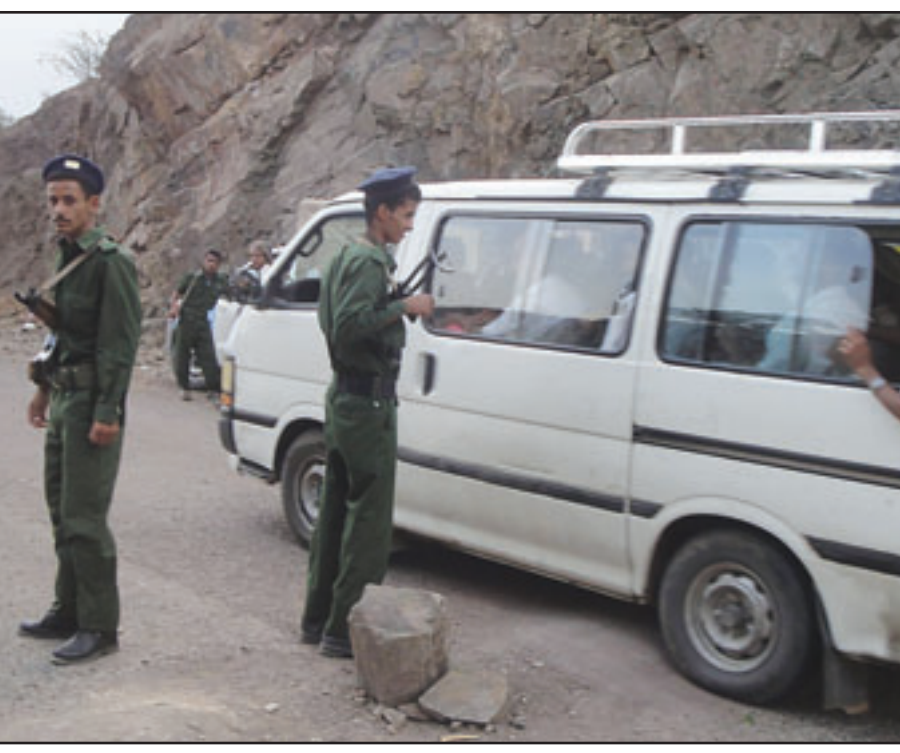
نقطة تفتيش عسكرية في اليمن

الرياض - يو بي آي - صنعاء - «القدس العربي»: توعد رجل الدين أنور العولقي، الأمريكي الجنسية والمحمدر من أصول يمنية الاثنيين بقتال أمريكا حتى آخر عنصر من تنظيم قاعدة الجهاد في جزيرة العرب «الذي يأخذ من اليمن منطلقاً له» وقال العولقي المنهم بمغول الإرهاب من قبل الإدارة الأمريكية في بيان على موقع «صدي الملاحم» مساء امس «سنستمر في القتال ضد أمريكا، حتى يقاثل آخر فرد من أفراد القاعدة للسبح الدجال». واتهم الحكومة اليمنية بالتواطؤ وتقديم التسهيلات للطائرات الأمريكية التي قصفت احد أعضاء القاعدة المدعو الكوي واربعة من مرافقيه بصواريخ كروز والقنابل العنقودية. وقال «نقول لجنود الرئيس المرتد بأنه ليس بيننا وبينكم إلا الدم، وقطع الرؤوس، ما دمتم سكرًا وجنودًا لذلك الطاغية». وسطر ذلك بيانًا، وكتبه مسؤول أممي يمني اسس الاثني من مقلد قيادي سعودي في تنظيم «قاعدة الجهاد في جزيرة العرب» خلال المواجهات المسلحة التي شهدتها محافظة أبين بجنوب اليمن أمس الأول. ورفض مسؤول أمن محافظة أبين اليمنية العميد عبد الرزاق