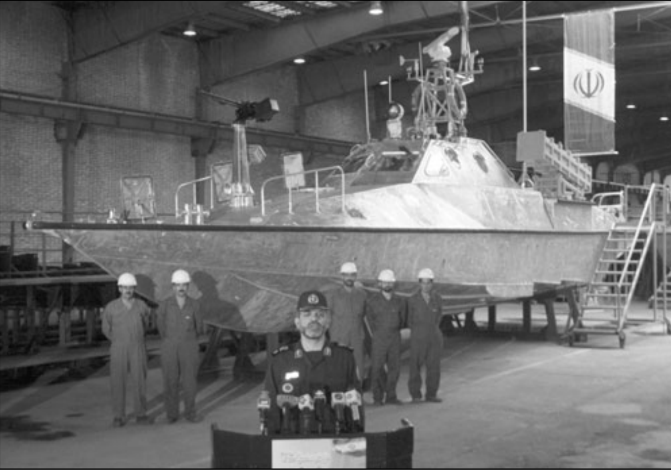
وزير الدفاع الإيراني احمد وحيدى يعلن في مؤتمر صحافي تشديش خط تصنيع الزورقين السريعين

الاحتفال بـ«اسبوع الحكومة» الذي تكشف خلاله طهران عن آخر انجازاتها التكنولوجية.