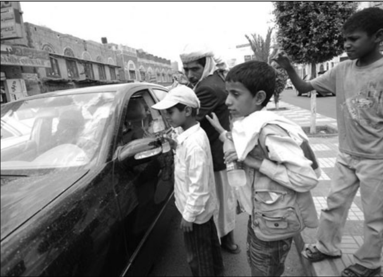
اطفال يمتحنون ببيوعن متاديل في أحد شوارع صنعاء

ويبرر نائب محافظ ابين الوضع قائلًا ان الدولة تحاول احتواء الجهاديين والقاعدة بنفس الطريقة التي تحاول فيها احتواء رجال القبائل، مشيرًا الى ان الحملات العسكرية تكلف الملايين وخسارة في المعدات والارواح ولهذا فمن الافضل دفع مليون دولار لشراء سكوتهم وعدم نشاطهم بدلًا من خسارة الملايين. وينقل في نهاية تقريره عن فيصل قائلًا لا تصدق الحكومة في دعمهم بالمال وتتفاوض معهم وتستخدمهم كخارية واعادها وبعد ذلك تقول لامريكا اعطاء مالا لقتال القاعدة.