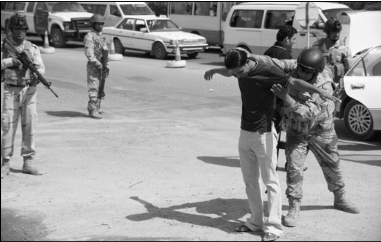
نقطة تفتيش في احد شوارع بغداد

منها العراقيون من غياب الامن وانقطاع التيار الكهربائي وتراجع الخدمات الاساسية، وعبر عن مخاوفه من تغلغل ايران في العراق فمع ان مدينة الفلوجة عانت عام 2004 من ايشع هجوم عليها من المارينز الان خوفه من المستقبل يجعله يامل ببقاء الامريكيين في العراق.