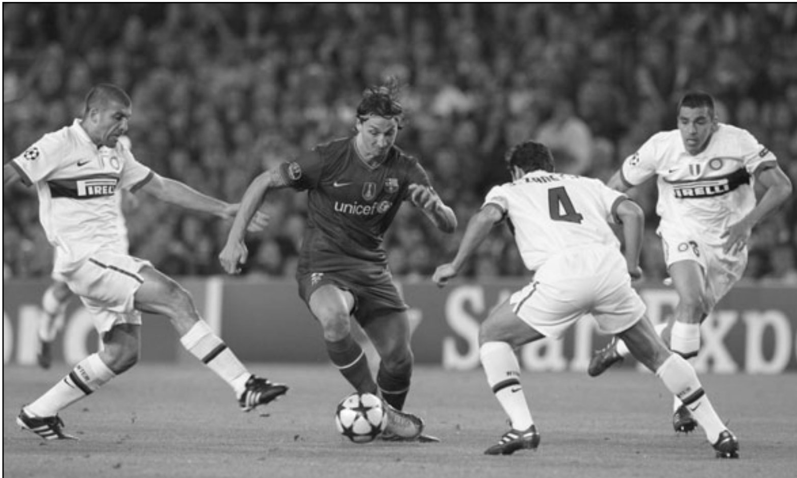
زلاتان إبراهيموفيتش (الثاني إلى اليسار) يتغرد بالكرة خلال المباراة بين برشلونة وانتر ميلان

م. مدريد - د ب أ: أعلن ناديا برشلونة الأسباني لكرة القدم وميلان الإيطالي عن التوصل إلى اتفاق بشأن انتقال السويدي زلاتان إبراهيموفيتش لاعب برشلونة إلى الدوري الإيطالي ضمن صفوف ميلان. وستنقل إبراهيموفيتش 28/ عاما/ للعب مع ميلان هذا الموسم على أن يكون النادي الإيطالي ملزما بدفع راتبه كاملا، ويبلغ حوالي عشرة ملايين يورو (12.73 مليون دولار). ويحتفل إبراهيموفيتش 28/ عاما/ اللاعب السويدي مقابل 24 مليون يورو، وهو ما يقل بكثير عن المبلغ الذي دفعه برشلونة لشراء إبراهيموفيتش من إنتر ميلان في تموز/ يوليو 2009. ويشعر إبراهيموفيتش بالغضب لرحلته عن برشلونة بعد موسم واحد فقط، وقد وجه انتقادات لخوسيب جوارديولا المدير الفني لبرشلونة. ونقلت وسائل الإعلام الإيطالية عن أدريانو جاليانو نائب رئيس نادي ميلان قوله إن اللاعب السويدي سيقوم عقدا لمدة أربعة أعوام الاثني، بعد الخضوع للفحص الطبي في ميلانو. وقال جالياني، «توصلنا إلى اتفاقية مع برشلونة حول استعارة اللاعب لموسم واحد قبل شرائه مقابل 24 مليون