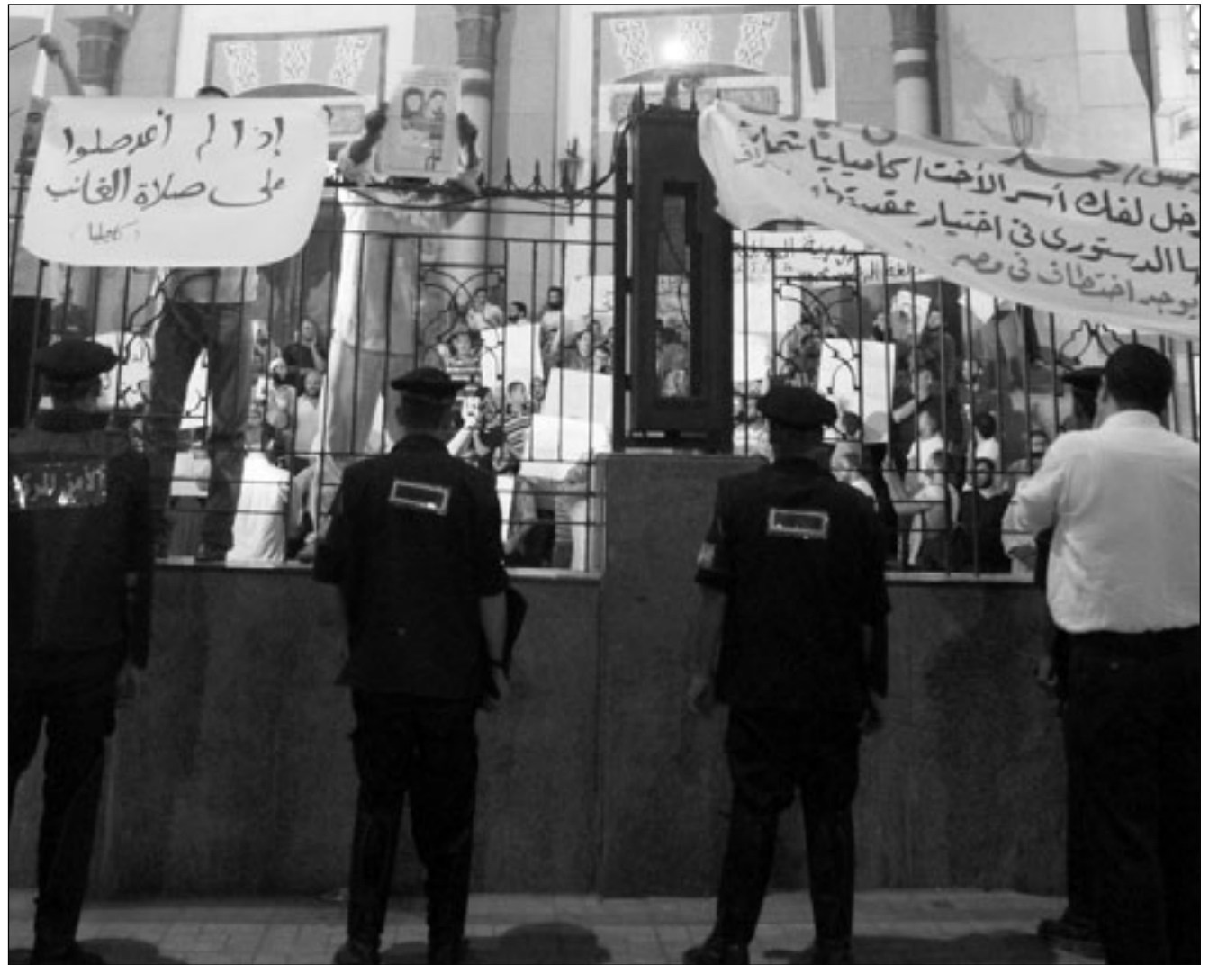
مظاهرة في القاهرة تطالب بالكشف عن مصير زوجة الكاهن (أ ف ب)