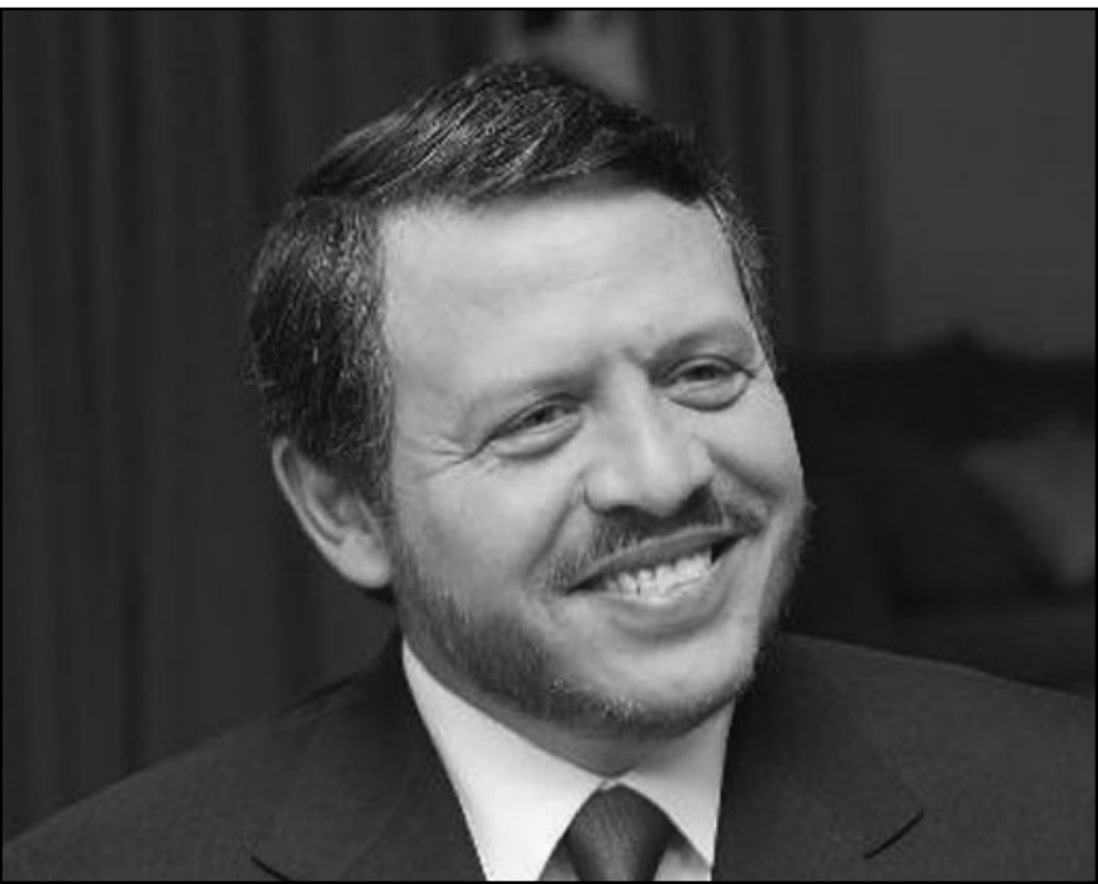
العهال الاردني عبد الله الثاني

جوية دقيقة عن الضفة الغربية لا تملكها السلطة الفلسطينية والذي من شأنه ان يعقد اي تقدم في المفاوضات بين الجانبين.