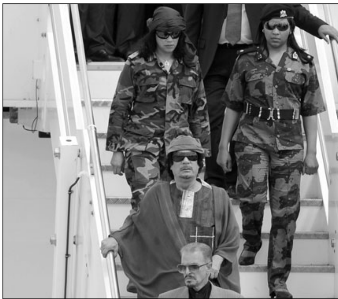
القذافي يغادر الطائرة بمطار روما أمس تحت العين الساهرة لحارساته، وفي الصورة الثانية موظف يحمل البسة الزعيم إلى مقر اقامته

مهاجرين مغربيين عن مخاوف من عواقب إعادة هؤلاء المهاجرين إلى بلدانهم. وقدم القذافي إلى ايطاليا مع خيمته التي سيصحبها في حديقه مقر اقامة السفير الليبي وليس في المنزه العام لفيلا بامفيلي كما فعل في حزيران/يونيو 2009.