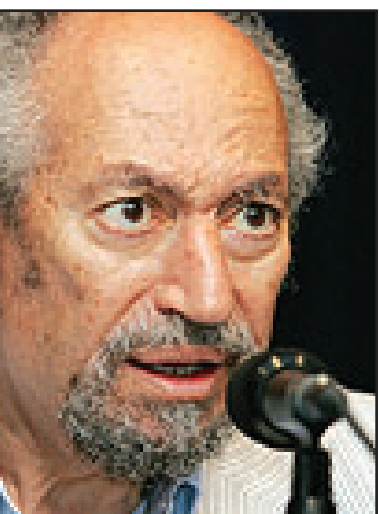
سعد الدين ابراهيم

■ القاهرة - يو بي آي: قالت صحيفة مصرية ان المعارض المصري البارز سعد الدين ابراهيم وقع امس الاحد على بيان لدعم نجل الرئيس المصري جمال مبارك للترشح لرئاسة الجمهورية في انتخابات عام 2011، ونقلت صحيفة «المصري اليوم» في موقعها على الانترنت عن ابراهيم قوله إنه وقع على بيان «الاتلاف الشعبي لدعم ترشيح جمال مبارك لأنه مع حق كل مصري للترشح لرئاسة الجمهورية وفقا لانتخابات حرة ونزيهة تحت إشراف دولي ومحلي».