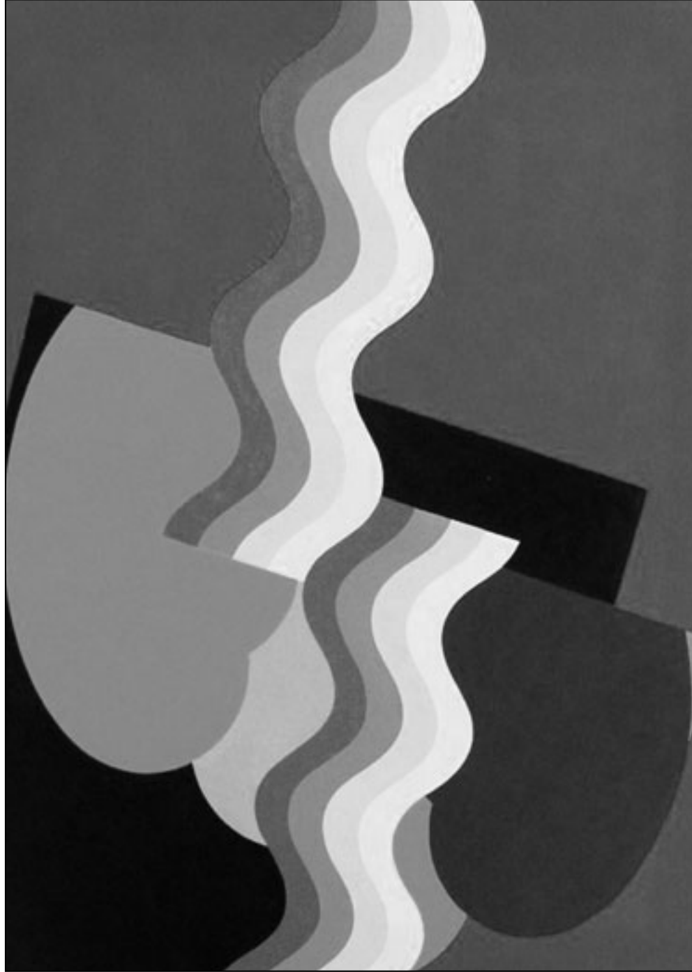
لوحة للفنان (القدس العربي)

بالخصوص في الفنون التشكيلية، لأنها كانت في منأى عن تأثير التيارات الإيديولوجية الراجحة وقتئذ وكذا عن السلطة الرسمية، بينما سقطت الكتابة الأدبية في هذا الفخ حيث برزت بوضوح سيطرة الاتجاه اليساري والاشتراكي عليها». ويشير إلى أن الفنانين التشكيليين المغاربة كانوا يمتلكون مواقف تقدمية متحررة بعيدة عن الضغوط الحزبية أو التوجهات الستالينية أو الناصرية، لأنهم كانوا واعين بأن الميول اليسار المتطرف أو للسلطة الرسمية لم يكن هو الطريق الصحيح، ويتابع: «كنا دائما متضامنين مع الحركات الشعبية ومع القضية الاستعمارية، وكان شغلنا الشاغل توضيح الرؤية لدى المواطن المغربي أن الفن لا يقدم رسالة (بوشفيش) ما، وإنما رسالة فنية محضة، وتكاد السقوط في (الكليتيهات) والفخاخ التي يمكن أن توجهك وتفرض عليك من الخارج». أما بخصوص أعماله الثقافية الجنية، فيقول: «لقد وجدت نفسي منذ أكثر من ثلاثين سنة ملتزما مع الحركة