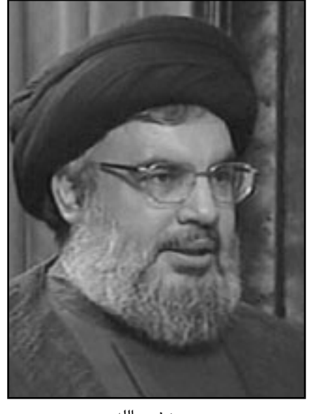
حسن نصر الله

وكان مؤتمر «إنماء بيروت» عقد نهاية الأسبوع اجتماعاً طارئاً، في فندق «الريفيرا»، مناقشة موضوع «بيروت منزوعة السلاح، وأصدر المجتمعون بياناً شديداً فيه على «رفض إستيحاء العاصمة من خلال انتشار السلاح والمسلحين في الأحياء وبين المنازل، والذي عندما يتراكم مع أجواء الاحتقان الشعبي الناتج من الموقف السياسي - الإعلامية والتعبوية والحزبية يصبح أراضاً جاهرة للانفجار العنفي المسلح الذي يهدد حياة الناس وأرزاقهم، داعين القوى الأمنية من جيش وقوى أمن داخلي، وهي المسؤولة عن أمن المواطنين وسلامتهم، إلى ممارسة دور أكثر حزمًا والتدخل في سرعة لتضرب المخطئين بالأمن والحسي الأيمن في منازلهم وأعمالهم، وليس انتظار الهدوء وتوقف إطلاق النار لتدخل بعد ذلك بين المقاتلين كانوا قوة فصل، أو حكم بين متنازعين»، ورفضوا «نظرية الأمن بالتراضي والتأجيل لجان التنسيق الأمنية بين المقاتلين التي تدعى إلى تحارب الحزب الأهلية البغيضة»، ووجهوا في هذا السياق سؤالاً للحكومة «عن الإجراءات التي اتخذت في حق الضباط الذين تقاسوا عن القيام بواجبهم في حماية الناس وممتلكاتهم ومنع العبث بالإستقرار والسلامة العامة».