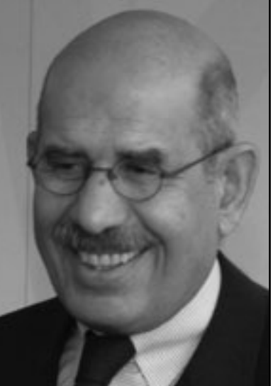
لن يغير قانون الانتخابات من أجل محمد البرادعي

لضمان ان يتواصل في عيد الفطر الدعم الحكومي للمنتجات الغذائية، مبارك الرئيس استدعي وزراء التنفيذ في الحكومة ليضمن ان تكون ايضا مياه جاريا وكهرباء، والا يبعث القيط بالملايين الي الجنون. الاجهزة لم تعد تضايق من يتابع مسار توريث السلطة، بالعكس دفعة واحدة يقرقونك بالمعلومات، وانت تتعرف على خطة عمل زاحفة من النوافذ الاعلى، عن توزيع متشدد للهام، قدم يعني عجوز تزيل الاغلام من اجل قدم اكثر شباهيا، مبارك القديم يعترزم التواصل الى ان يلقي جمال اعترافا كاملا.