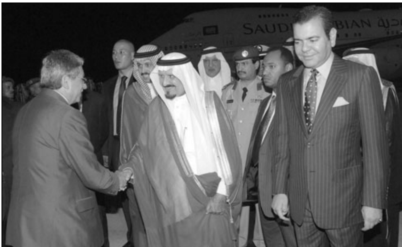
ولي العهد السعودي الامير سلطان بن عبد العزيز لدى وصوله الى مدينة اغادير بالمغرب امس وبجواره الامير المغربي رشيد بن الحسن

■ لندن - يو بي آي: ذكرت صحيفة صندي تلغراف امس الاحد ان رئيس الوزراء البريطاني الأسبق توني بليز والرئيس الأمريكي السابق جورج بوش تأمرا في الخفاء لمنع غوردون براون من تولي منصب رئيس وزراء بريطانيا خلفا لبليز. وقالت الصحيفة إن بليز سعى لإطالة فترة توليه منصب رئاسة الوزراء بعد تلقيه تحذيرا من ادارة بوش بأن لديها شكوكا خطيرة حول ملازمة براون لخلافته وستواجه مشاكل كبيرة في العمل معه. واضفت ان ادارة بوش كوتت هذا الانطباع بعد اجتماع عقده براون حين كان يترشح لمنصب وزير الخزانة (المالية) في حكومة بليز مع وزير الخارجية في حكومة بوش كوندوليزا رايس وانتقد خلاله بشدة سياسة الولايات المتحدة في مجال المساعدات والتنمية وأفريقيا، وقامت رايس بنقل حجريات الانجتماع غير المريح للبيت الأبيض