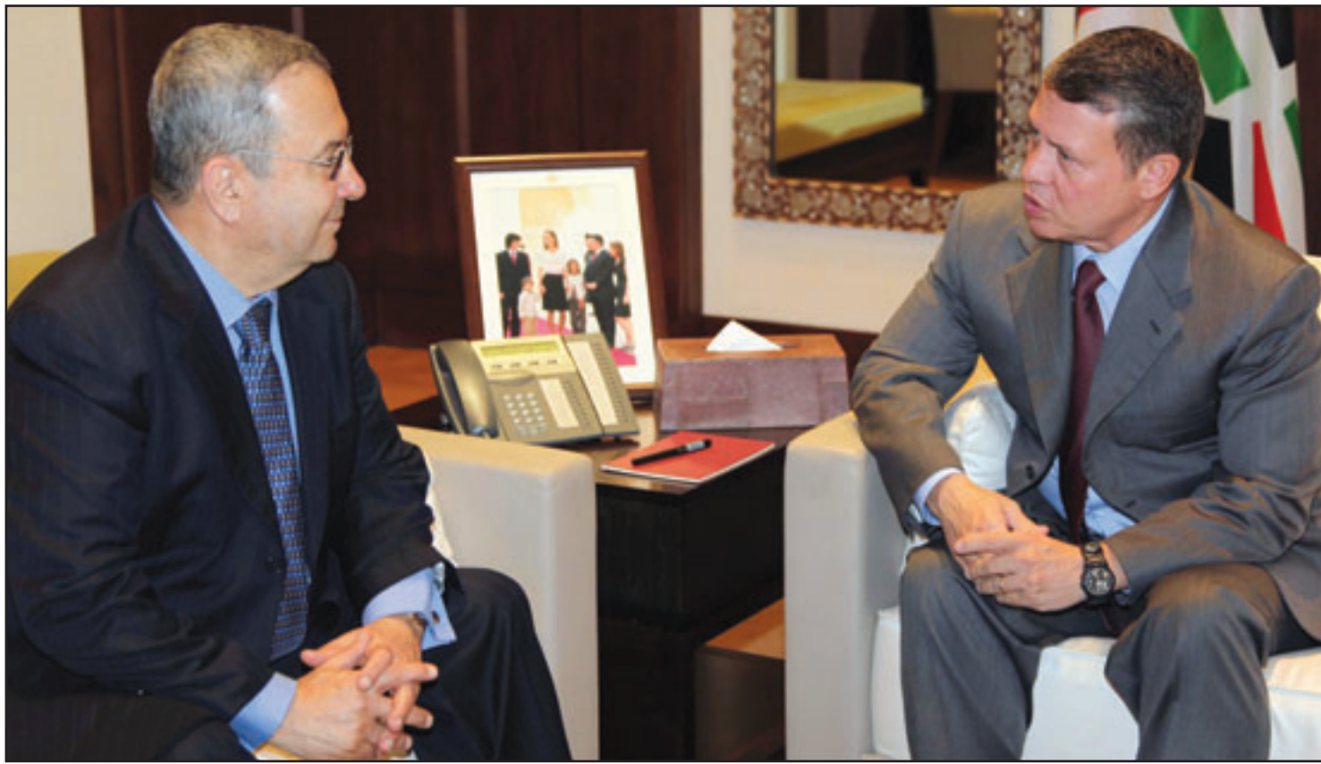
العامل الاردني الملك عبد الله الثاني خلال اجتماعه بوزير الدفاع الاسرائيلي يهود باراك امس