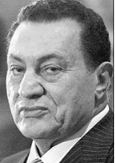
حسني مبارك، طالما بقيت حيا ساكون الرئيس

استطلاعات الراي العام تفيد لصالح بانه يجب تجاوز ثغرة خطيرة بين اصحاب الملايين