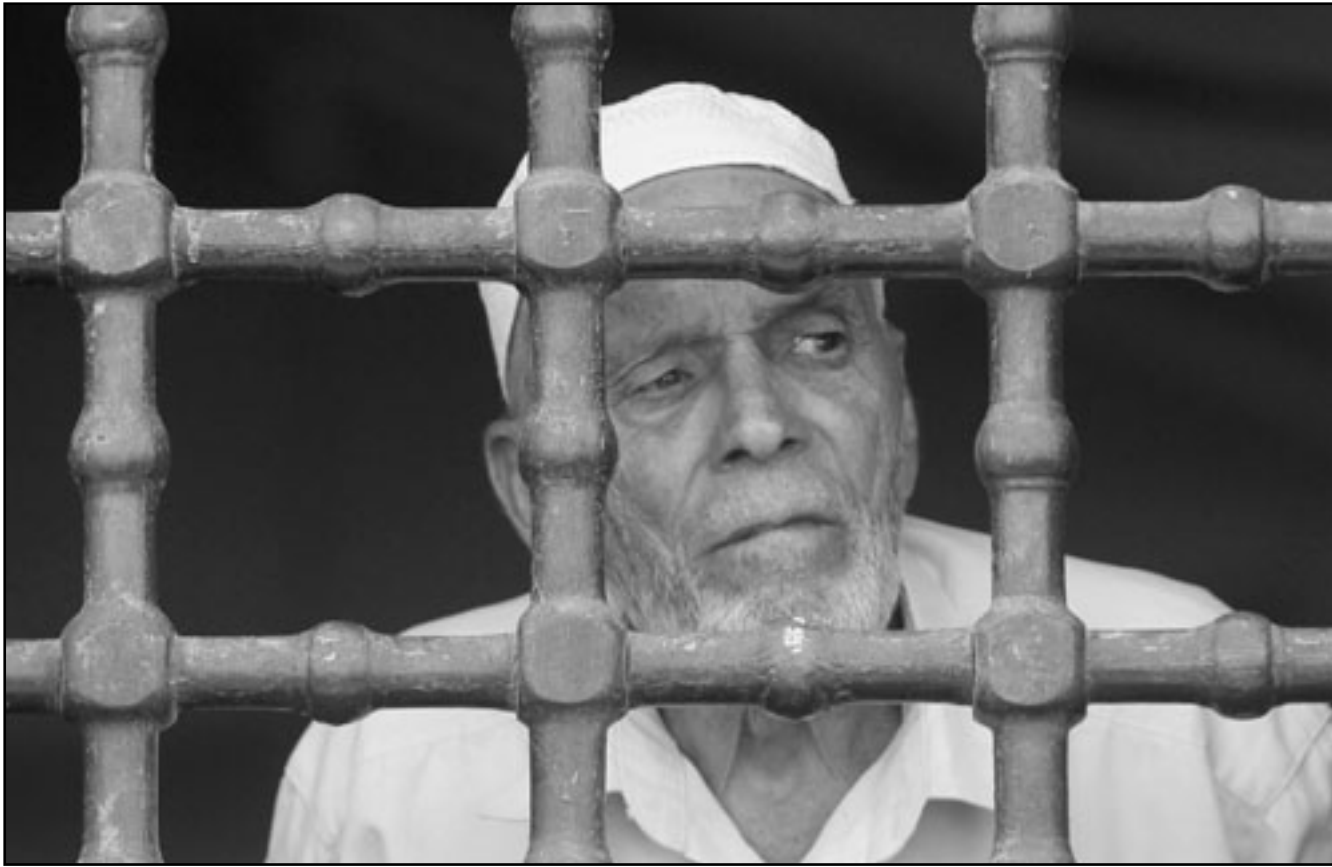
فلسطيني يراقب مسيرة للجهاد الاسلامي في غزة

ومن هنا يقترح المؤيدون لحل مرحلي وتفسير الصحيفة التي ان من الداعين الى الاتفاق المحلي، يوسى بيلين الذي تصفه بالعضو اليساري في الكنيست والذي يعتبر مهندس خطة السلام غير الرسمية عام 2003. ودعا بيلين الرئيس الامريكى باراك اوباما لتغيير قواعد اللعبة بيدوم من اجتماعه مع نتنياهو وعباس بحضور الرئيس المصري والعامل الاردني. ويبدو ان المتادين بحل جزئي قلقون من فشل المفاوضات التي يرون انها ستؤدي الى تزيدي الازمات. ولكن الفلسطينيين يرفضون فكرة الحل المحلي لان اسرائيل لم توف بتعهداتها القائمة منذ اتفاقيات اوسلو واهمها نقل السيطرة الامنية الكاملة في الضفة الغربية بحلول حسب الاتفاقيات الموقعة في التسعينيات من القرن الماضي. وعوضا عن الانسحاب تسيطر اسرائيل سيطرة كاملة على 60 بالمئة من اراضي الضفة الغربية فيما قررت الانسحاب بشكل كامل من قطاع غزة عام 2005. وفي الوقت الذي يسعى فيه عباس الى حل شامل وعادل يشمل اقامة الدولة الفلسطينية وعاصمتها القدس الشرقية وتسوية عادلة بالنسبة للاجئين يدعو نتنياهو الى تنازلات تاريخية تؤدي الى حفظ من اجل اسرائيل، وتخييه ما سماها «المزاعم حول شرعية اسرائيل» وتجعل من اسرائيل دولة لليهود.