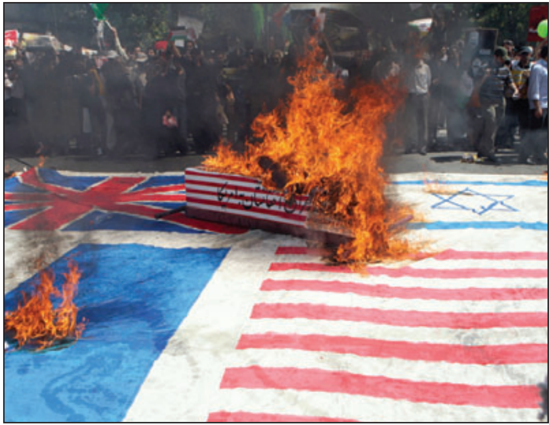
ايرانيون يحرقون علمي اسرائيل وامريكا اثناء مظاهرات لاحياء يوم القدس في طهران الجمعة