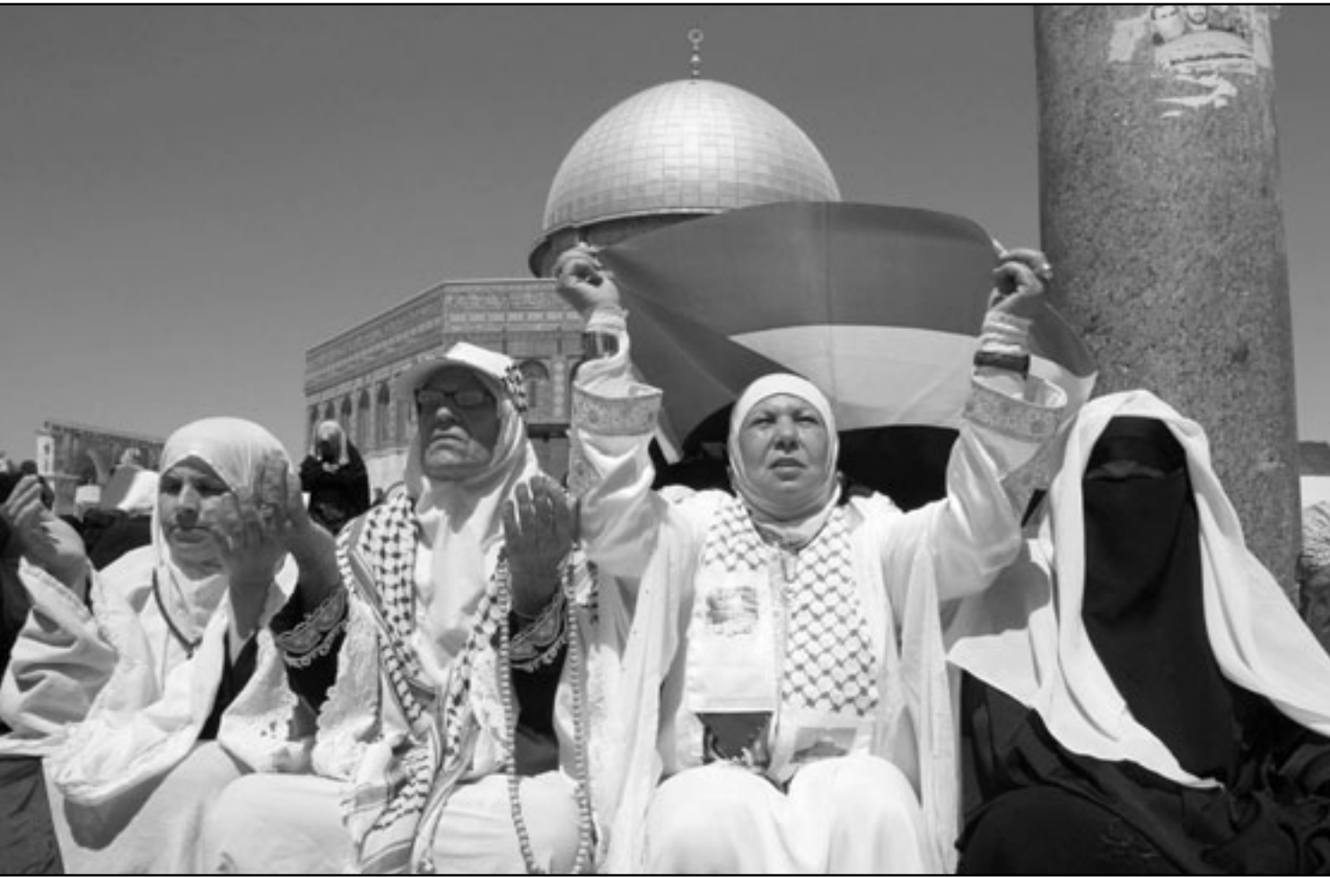
فلسطينية تحتمي بالعلم الفلسطيني من الشمس خلال صلاة الجمعة الأخيرة في رمضان في باحة الأقصى