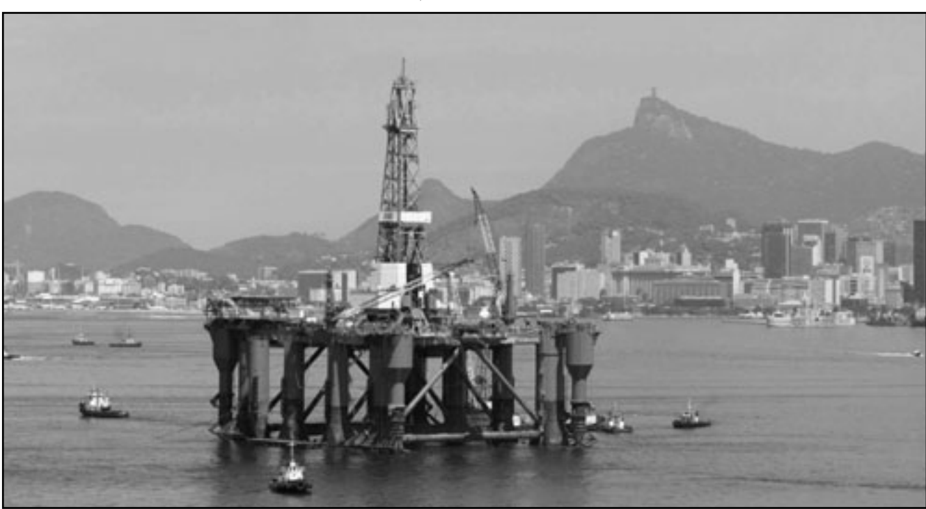
منصة تنقيب بحرية تابعة لشركة بتروبراس في خليج ريو دي جانيرو

من النسبة الحالية البالغة حوالي 30 بالمئة مما أثار قلق بعض المستثمرين بشأن ازدياد نفوذ الدولة داخل الشركة. وقال محللون إن حجم المقايضة الكبيرة مقارنة بالعملية بأكملها التي وافق عليها المانعون عن أن تصل إلى 85 مليار دولار يظهر أن الحكومة تتوقع أن تتمكن من الحصول على عدد كبير من الأسهم التي لن يكتب فيها مستثمر القطاع الخاص.