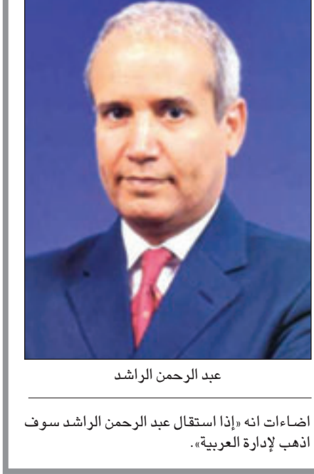
عبد الرحمن الراشد

التجربة في المنطقة. وجاء الراشد إلى الصحافة من خلال دراسته للانتاج السينمائي في أمريكا في الثمانينات، تولى بعد ذلك مكتب جريدة «الجزيرة» السعودية في واشنطن. بعد سنوات أصبح نائباً لرئيس تحرير «المجلة» السعودية الأسبوعية الصادرة من لندن، وبعدها أصبح رئيساً لتحريرها، حتى عُيّن رئيساً لتحرير جريدة «الشرق الأوسط» اللبنانية العام 1998. واستقال منها في عام 2003 ليصبح مديراً لقناة «العربية» الاخبارية التي انشئت له التصدي لقناة (الجزيرة)، ولتقديم خطاب بديل وعلاني حسب وصف مراقبين. ويتهم سعوديون الراشد بأنه ابتعد عن الشأن السعودي ويحج بركب عن العراق وإيران ولبنان وسورية، بينما يرى عرب بأن مقالاته تمثل وجهة نظر السعودية في الشأن العربي، ومع استقالة الراشد تبقى بورصة الاسماء التي ستخلفه مفتوحة، الا ان مراقبين للشأن السعودي يتوقعون ان يتم تكليف الاعلامي السعودي داود السريان بادارة شؤون المحطة الى ان يتم تعيين مدير جديد لها. وكان الصحافي تركي السديري رئيس تحرير صحيفة الرياض قد صرح في حلقة سابقة لبرنامج