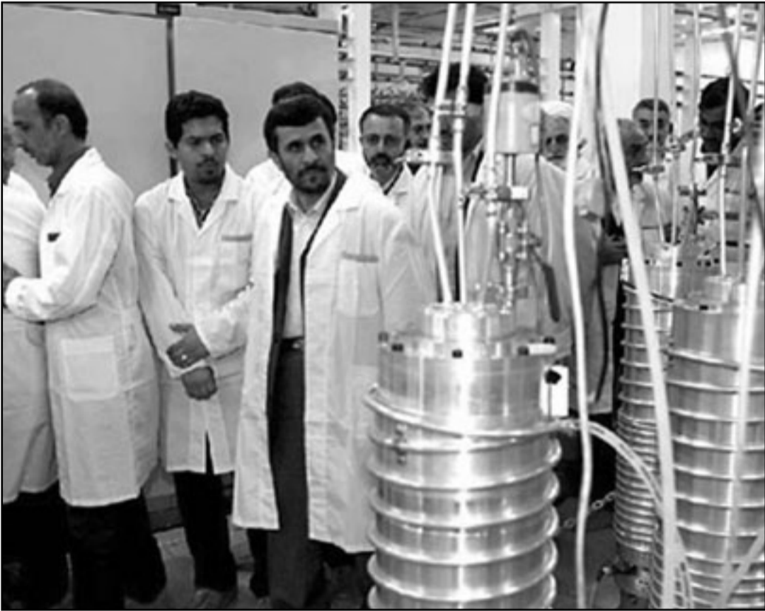
النووي الايراني يهدد دول الخليج العربي قبل اسرائيل

■ «الضفة الغربية» هو الانتحار، مهما يكن من امر فان كل كصص الجدة ستنتهي اذا ما استمر التجميد.