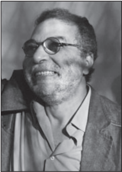
الوكيل الأول لوزارة الثقافة محسن شعلان