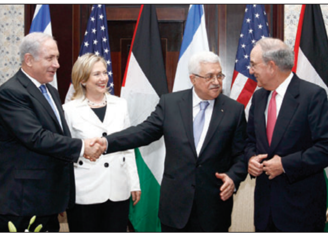
الرئيس الفلسطيني محمود عباس يصافح رئيس الوزراء الاسرائيلي بنيامين نتيناهو بحضور وزيرة الخارجية الامريكية هيلاري كلينتون وجورج ميتشل