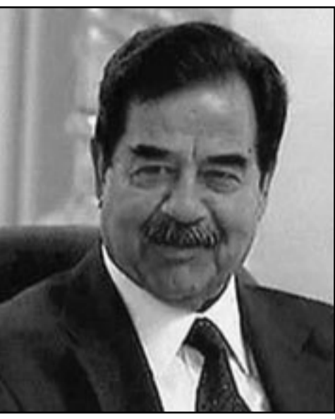
الرئيس العراقي السابق صدام حسين