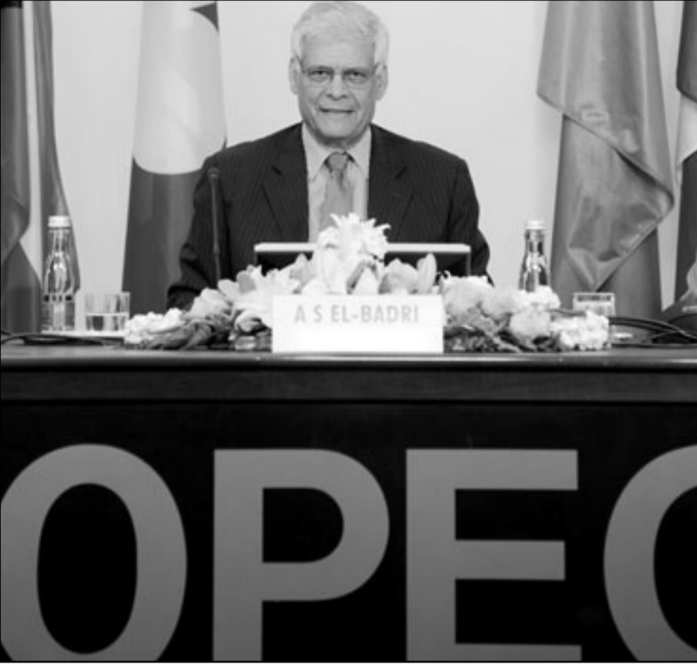
الامين العام اوبك عبد الله البدرى يتحدث الى الصحافيين امس في فيينا

الى قواعد تشجع المضاربات بشكل متزن». وطالب البدرى دول اوبك بالتخلص من تبعية الاعتماد على النفط والبحث عن بدائل، متمثلة في الصناعة والسياحة والثقافة والطاقة الشمسية وطاقة الرياح تحسبا ليوم تنضب فيه منابع النفط ومن أجل ضمان مستقبل الاجيال القادمة وتوفير حياة كريمة لهم.