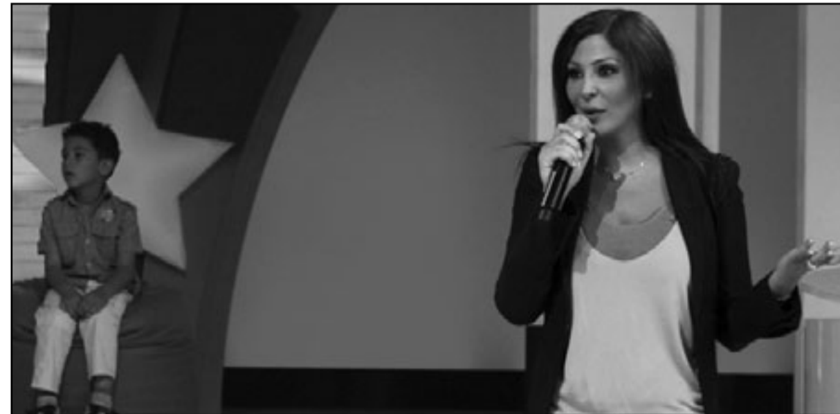
اليسرا في «ستار صغار»