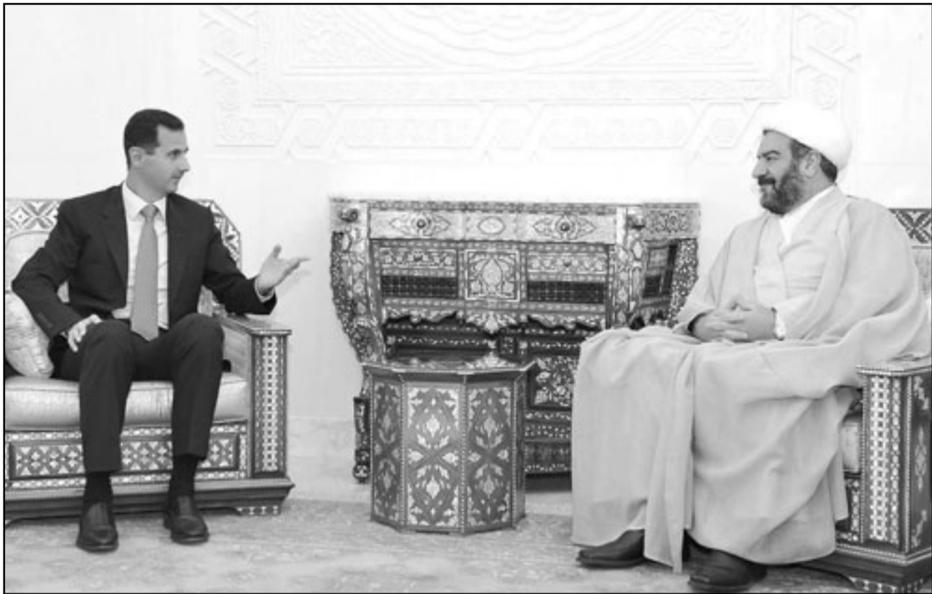
الرئيس السوري بشار الاسد مستقبلاً عباس البياتي عضو تحالف «دولة القانون»

علمت «القدس العربي» من شخصية عراقية مقربة من رئيس الوزراء العراقي نوري المالكي مقبلة في سورية أن وفد ائتلاف دولة القانون الذي يزور سورية والتقى الرئيس السوري بشار الاسد كان التقى الاثنين اللواء محمد ناصيف معاون نائب رئيس الجمهورية والشخص الذي يمسك بالعديد من الملفات الساخنة وكشفت الشخصية لـ «القدس العربي» والتي طلبت عدم ذكر اسمها أنها التقت الوفد العراقي بعد لقائه اللواء ناصيف وأن وفد دولة القانون أخبرها بأن اللقاء كان جيداً للغاية ويحمل أخباراً طيبة ومبشرة.