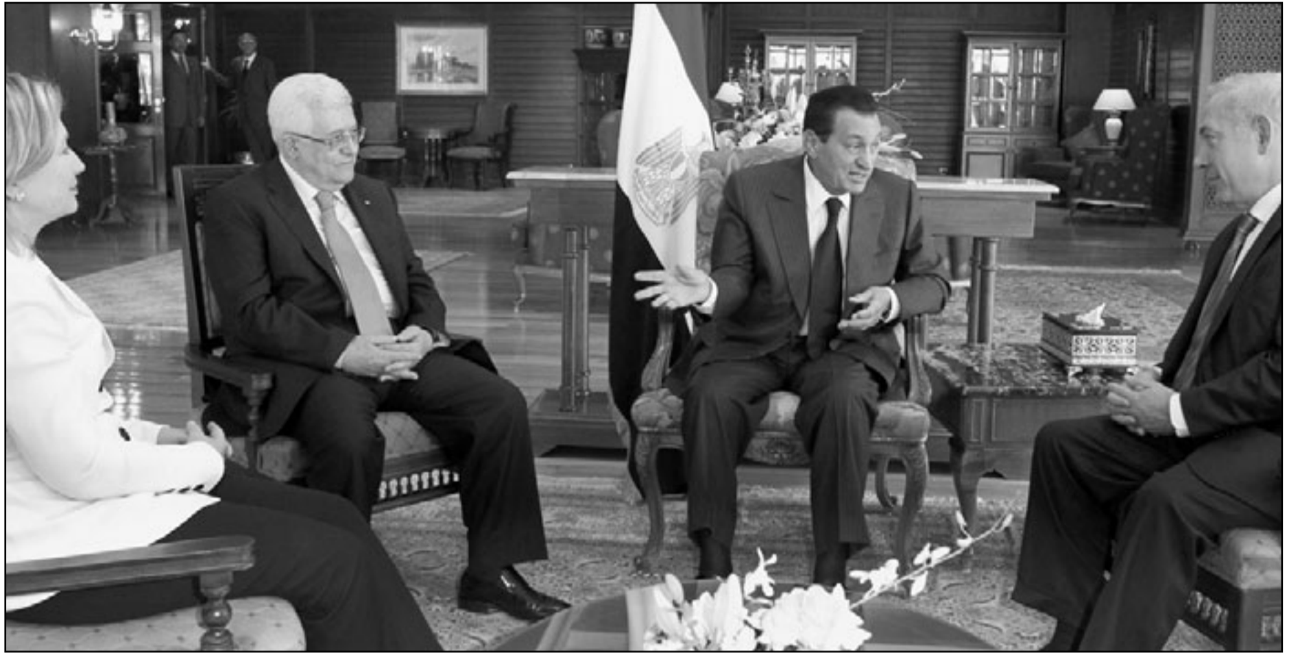
من (اليمن) رئيس الوزراء الاسرائيلي بنيامين نتيناهو والرئيس المصري حسني مبارك والرئيس الفلسطيني محمود عباس والى جانبه وزيرة الخارجية الامريكية هيلاري كليتون خلال قمة شرم الشيخ امس