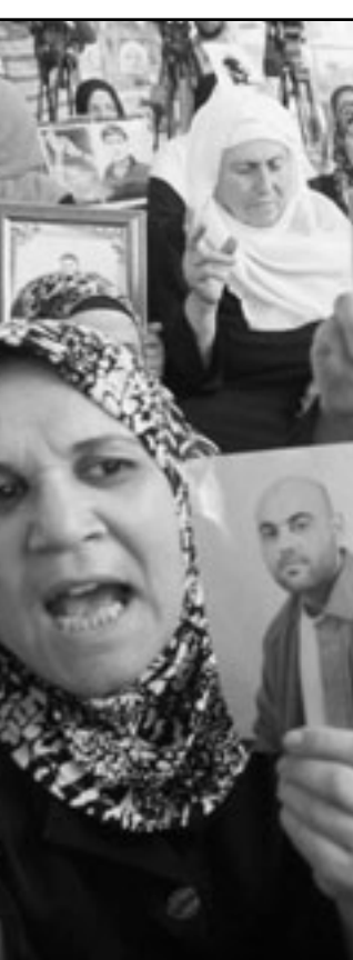
اهالي المعتقلين الفلسطينيين يعصمون في غزة للمطالبة باطلاق سراح ابنائهم

والتحاشون» التابعات لمصلحة السجون الاسرائيلية وعلى رأسهم مدير مصلحة السجون «بيني كنيانك» اجبرت الاسرى في سجن شطة على خلق ملاسهم بالكامل وبعاد جمودت التهذيب والتهذيبات والمؤسسات الفلسطينية التي تهتم بقضية الاسرى ان تغلق دورها في دعم نضالات الاسرى في اعقاب هذه الهجمة والانتهاكات التي ترتكب على مدار الساعة بحق الاسرى في كل السجون.