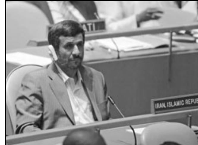
الرئيس الإيراني احمدي نجاد

■ عواصم - وكالات: قال رئيس الأركان العامة للقوات المسلحة الإيرانية اللواء حسن فيروز آبادي ان قيام إسرائيل بشن هجوم على بلاده يعد ضربا من الجنون. ونسبت وكالة «مهر» الإيرانية شبه الرسمية أمس الاثنين إلى فيروز آبادي قوله «أن قيام الكيان الصهيوني (إسرائيل) بشن أي هجوم ضد إيران بمثابة ضرب من الجنون». وأضاف «في ظل الظروف الراهنة ليس باستطاعة أمريكا وإسرائيل شن هجوم ضد إيران». وقال فيروز آبادي في مراسم تخريج دفعة جديدة من طلبة الكلية العسكرية ان «إيران لا تريد ان تدخل في حرب مع أمريكا وإسرائيل ولكن الاعتقاد السائد هو ان الظروف الدولية والإقليمية لا تسمح للولايات المتحدة وإسرائيل بالقيام بأي عدوان ضد إيران». وحول سياسة بلاده إزاء المعارضة قال، طالما المعارضة غير مرتبطة بهجات أجنبية فالقانون يسمح لها بطرح انتقاداتها وفق القانون ولكن حينما تصبح المعارضة أداة في يد الأجانب فالقانون ينبغي ان يتصدى لها بشكل قاطع». وقالت إيران أمس الاثنين إن الوكالة الدولية للطاقة الذرية التابعة للأمم المتحدة تعاني من أزمة «سلطة» أخلاقية ومصداقية، مما يسلب الضوء على العلاقات المتوترة بشكل متزايد بين طهران والوكالة. وانتقد عدد كبير من الصحفيين رئيس هيئة الطاقة الذرية الإيرانية أحدث تقرير للوكالة بخصوص برنامج إيران النووي المتنازع عليه ووصفه بأنه غير نزيه وأشار إلى أن القوى الغربية أثرت عليه.