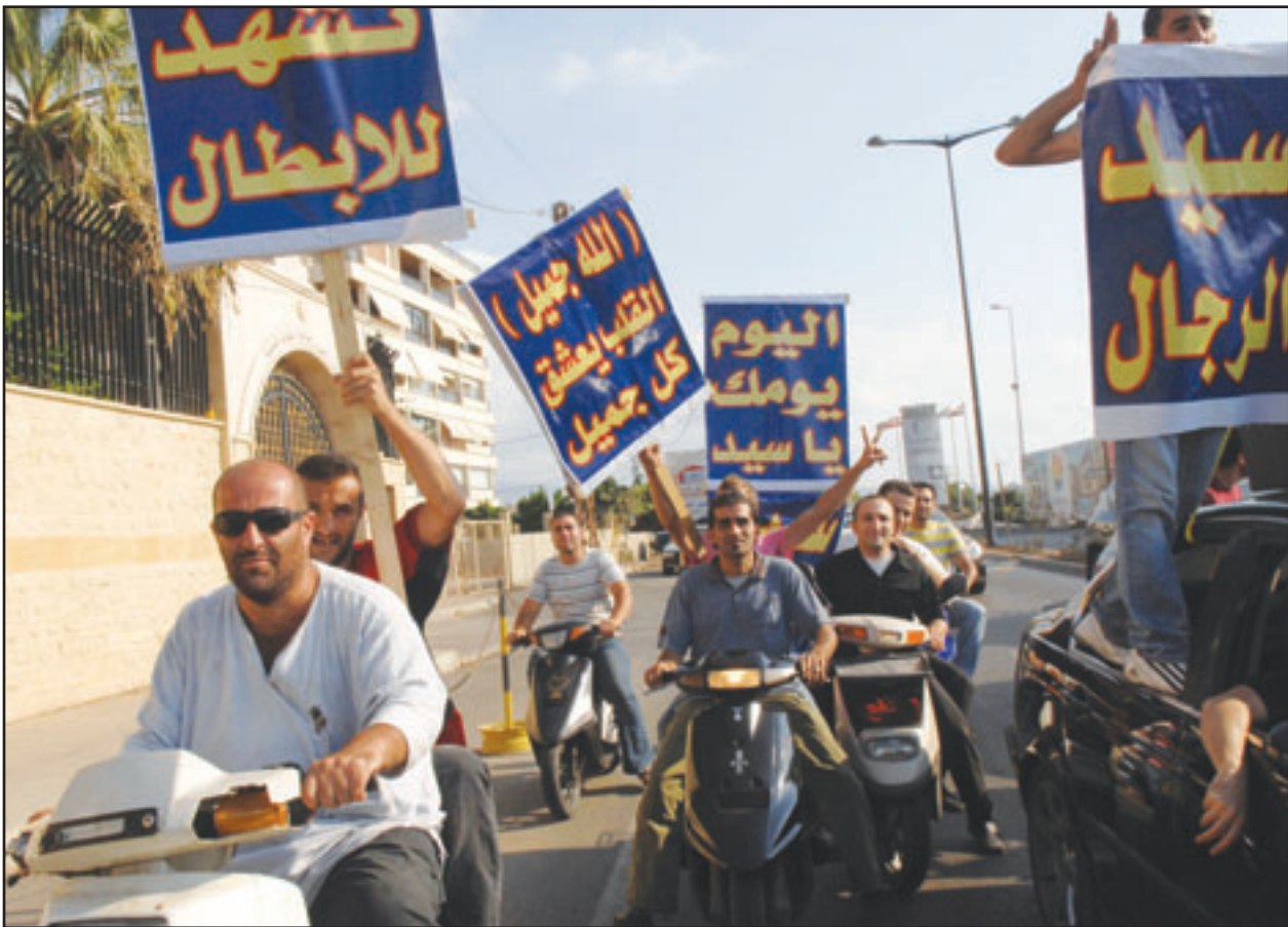
انصار اللواء جميل السيد يرفعون ياخطات مؤيدة له