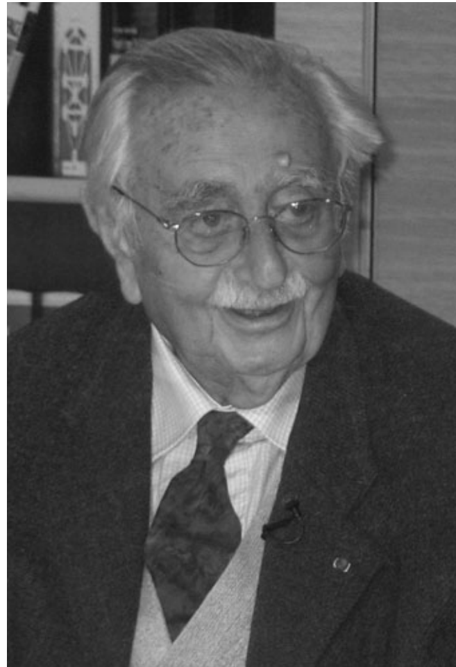
عمران المليح (القدس العربي)