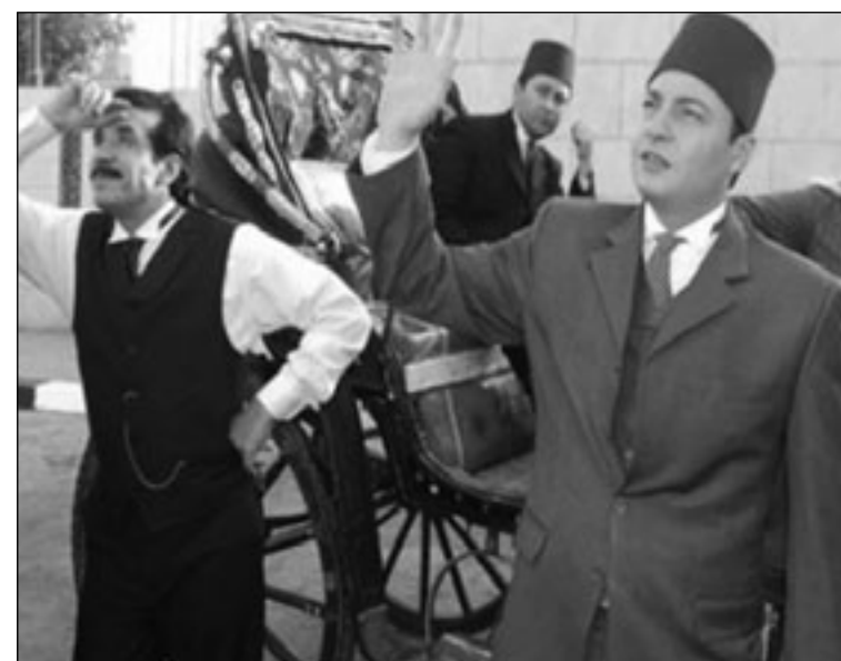
لقطة من مسلسل «رجل لهذا الزمان»