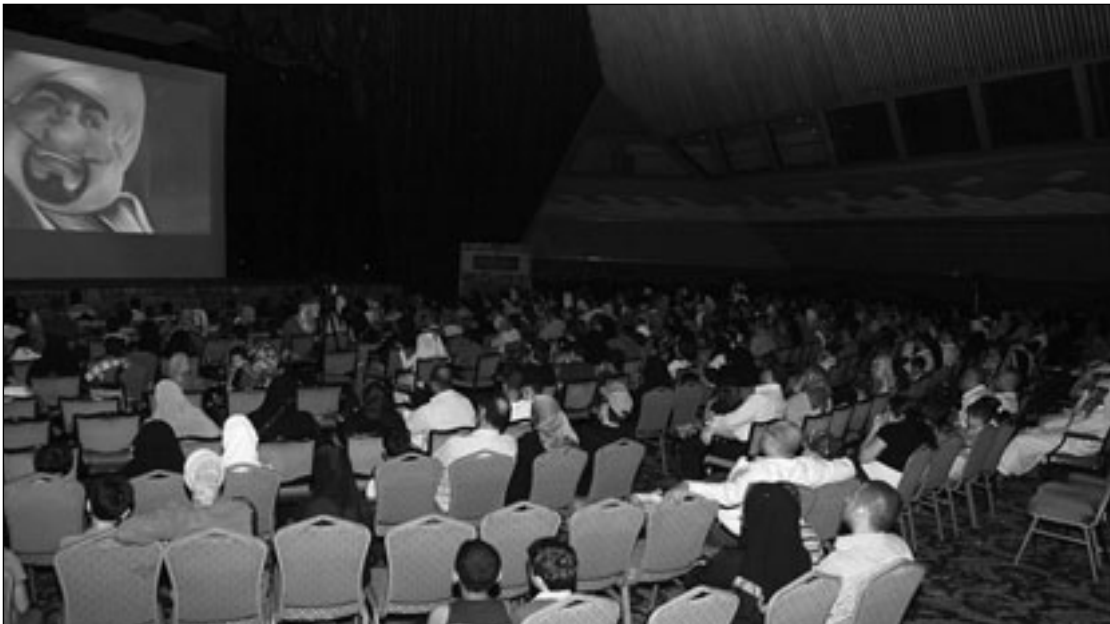
جانب من الحضور (القدس العربي)