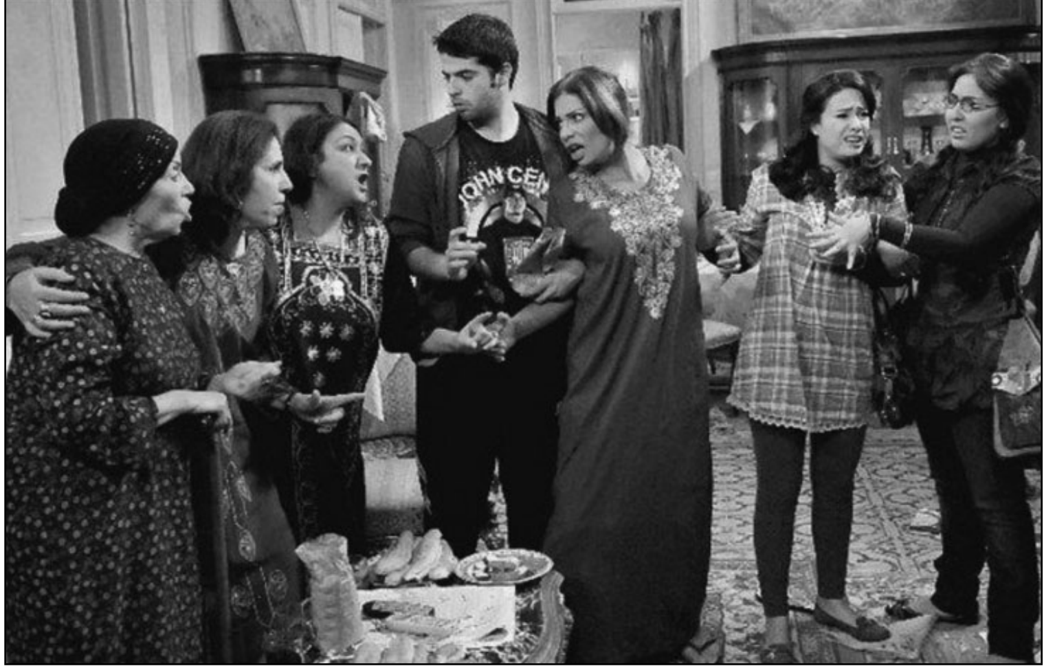
لقطة من مسلسل «عايزة أتجوز»

إن كوميديا الموقف ( Situation Comedy ) التي بنى عليها ما يعرف باسم Sitcom ويعتبر في مسيط عبارة عن مسلسل تلفزيوني أو إذاعي ساخر، يقوم بتسليط الضوء على ردود أفعال عدد من الشخصيات في المسلسل تجاه مواقف غير اعتيادية، مثل أن تعرض شخصيات العمل إلى عدد من المواقف المحرجة أو أن يتعرضوا لظواهر متفرقة مثل: تعدد كوميديا الموقف أحد صنوف الأدب المتعلقة بالأداء الكوميدي الساخر بحيث يتعزز أبطال العمل بشكل متكرر إلى مواقف ساخرة و طريفة، حيث تكون تلك المواقف متركزة في بيئة أو مكان واحد كعائلة تعيش في منزل، أو مكان عمل يجتمع فيه عدد من الشخصيات، ومن الجدير ذكره أن من يقرأ في تاريخ كوميديا الموقف ونشأتها سيرفر أنها بدأت في الأصل في الإذاعة، وهذا يتبادر إلى الذهن سؤال: هل اعتمد صانعو الكوميديا في الإذاعة على الصراخ والمبالغة في الأداء؟ وهل المبالغة في الأداء والصراخ والبكاء بداع ودون داع لذلك أمر ملح في عمل من المفترض أن ما يميزه هو أنه ساخر وكوميدي وهدفه أن يدعونا للضحك؟ وهل من البربر أن تقوم «علا» الفنانة التونسية هناد صبري في مسلسلها المصري الجديد «عايزة أتجوز»، بملاحقة الكاميرا والحديث معها (أي نحن) طوال الوقت بداع ودون داع حتى تصل إلى مرحلة الضحك على الأقل في الحلقات العشرة الأولى؟ لدرجة أنني خفت عليها لكثرة ما كانت تكلم الكاميرا وأسررتها في الوقت نفسه، فلا مشهد تقريباً يخلو من هند صبري صورة أو صوتاً، ولا يخفى على أحد أن مسرح هذا العمل «رغم إسماعيل إمام» الدارس والمخرج والتفصيل دخل الفن من بوابة المسرح بمرسحيتي «جزيرة القمر» و«بودي جارد» ثم دخل السينما بقبوة بأغلام مثل «أمير الغلام» و«حسن ومرقص» و«بوحة» وغيرها من الأفلام التي لاقت قبولاً لدى المشاهدين، ثم طرق باب