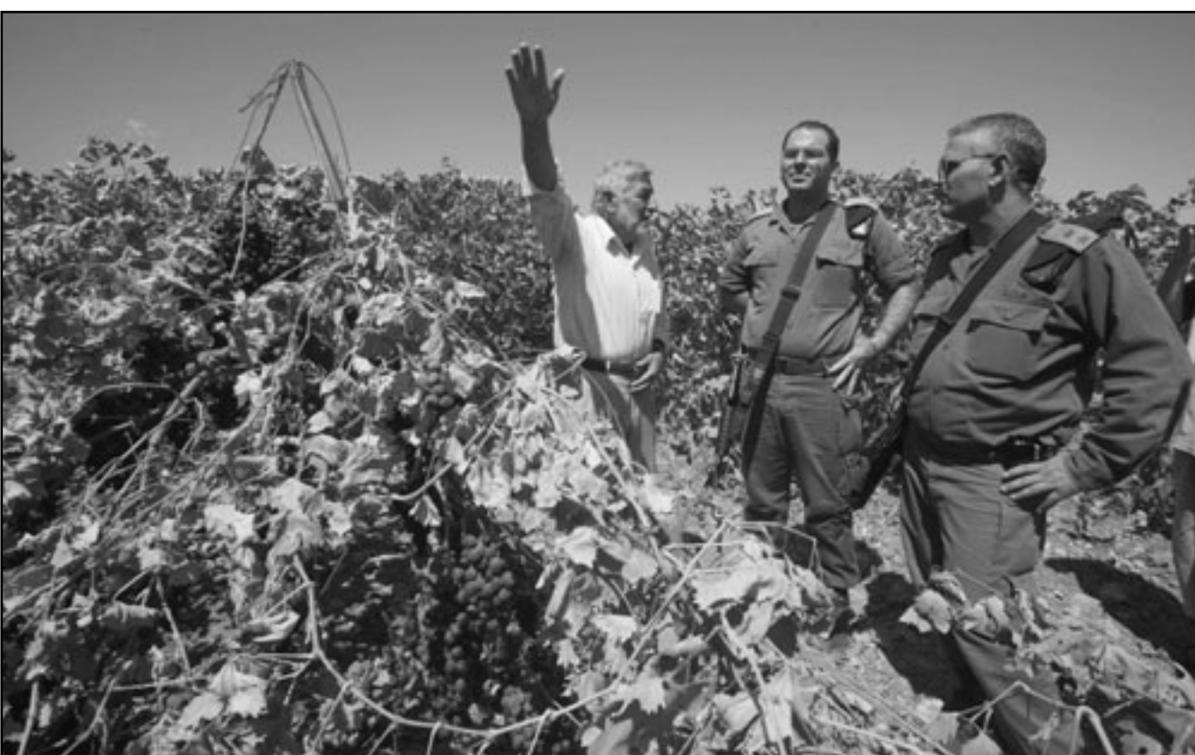
فلسطيني يطلع جنود الاحتلال على الدمار الذي أحدثه المستوطنون بأرضه وأشجاره في منطفة الخليل

يهاجمون طلبة المدارس بالحجارة والزجاجات الفارغة، فيما يتلفون بكميات نابية بحقهم. من جهة أخرى وضعت سلطات الاحتلال إخطارات على شخيرة في منطقة فرزة غرب مدينة دورا جنوب الخليل، تقضي بصحابة 44 دونما زراعيًا للمواطنين هناك.