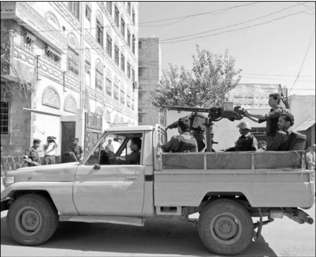
جنود يمنيون يقومون بحراسة مبنى الحكمة بصنعاء

قبل تلك العناصر الإرهابية». مؤكدا مقتل أحد الجنود الحكوميين وأن «القوات المسلحة والأمن لم تهاجم بعد أوكار تلك العناصر من القاعدة وأن ما حدث كان عبارة عن هجمات واعتداءات قامت بها تلك العناصر الإجرامية، حيث تم التصدي لها والرد عليها وضرب المواقع التي تنطلق منها مصادر النيران من مناطق خالية من السكان». في غضون ذلك دعت تيارات الحراك الجنوبي انتصارها في المحافظات الجنوبية إلى الخروج في مظاهرات احتجاجية الخميس المقبل تزامنا مع انعقاد الاجتماع الوزاري لمجموعة أصدقاء اليمن المزمع انعقاده في نيويورك، كما دعا انتصاره من المخترئين في الولايات المتحدة للتظاهر أمام مقر انعقاد المؤتمر للتعريف بقضيتهم. وقال بيان منسوب للمجلس الأعلى للحراك السلمي لتحرير الجنوب «ندعو جماهير شعبنا الجنوبي الصامد إلى المشاركة في السيارات والمهرجانات والفعاليات المختلفة يوم الخميس 23-9-2010 والتي ستقام في كافة محافظات الجنوب وفي مقدمتها العاصمة عدن». وأعلن المجلس رفضه للحوار الدائر بين السلطة والمعارضة حول تداعيات الأوضاع في المحافظات الجنوبية، وذكر أن هذا الحوار «لا يعنينا من قريب ولا من بعيد».