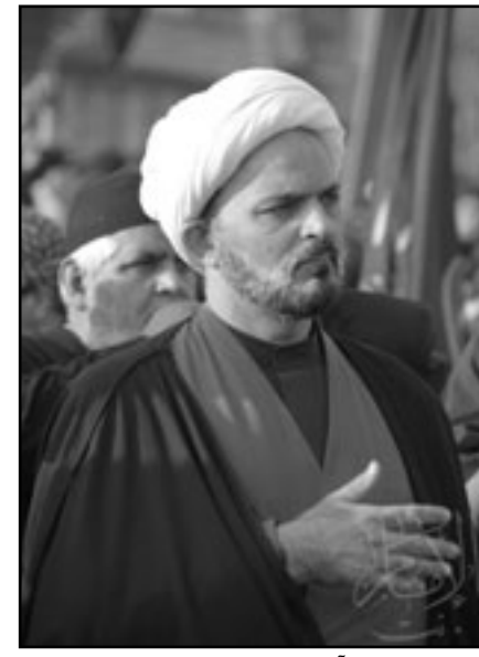
آية الله حسين نجاتي

■ المنامة - ف. ب: أعلنت هيئة شؤون الإعلام البحرينية الاثنين أنها قامت بسحب وتوقف ترخيص النشرات المنشورة لعدد من الجمعيات السياسية متهمه أياها بمخالفة القوانين المعمول بها في هذا الشأن، في حين أكدت جمعيتان معارضتان بارزتان ان القرار يشمل منشوراتها ودعا الهيئة للتراجع عنه. وقال المدير العام للمطبوعات والنشر بيته شؤون الإعلام عبدالله بنيتيم في تصريح بثته وكالة انباء البحرين «إن النشرات الصحافية لبعض الجمعيات السياسية» قد اتخذت شكلا ومضمونا يختلف بمرور الزمن عن الشروط الواجب اتباعها عند اصدار نشرة صحافية».