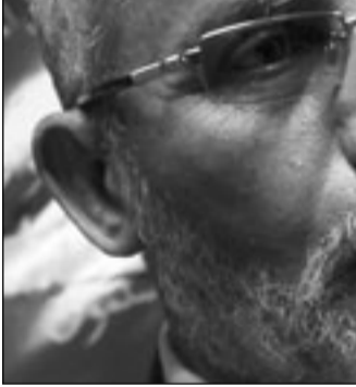
المرشد العام لجماعة الإخوان محمد بديع

أكد نافع علي نافع مساعد الرئيس السوداني استعداد الحكومة لاجراء الاستفتاء في موعده، وأغرب نافع عن أمه في إتاحة الفرصة للوحويين الوطني سبيدل كل ما هو ممكن في كل وأكده أنه إذا تهيئت الفرصة للمكافئة لاستفتاء حر ونزيه فإن فرصة الوحدة ستكون أكبر بكثير من فرصة الانفصال.