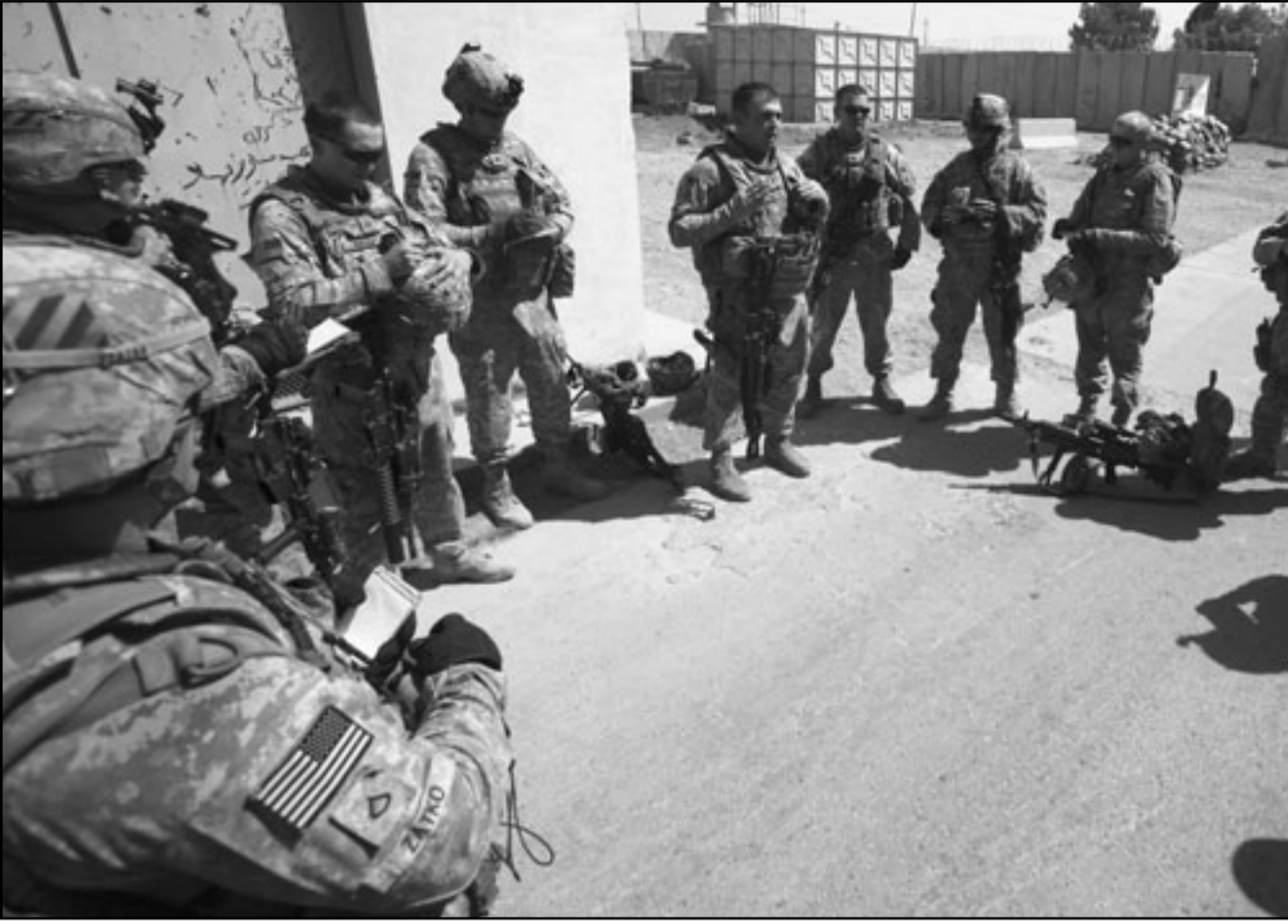
جنود امريكيون في الموصل الجمعة