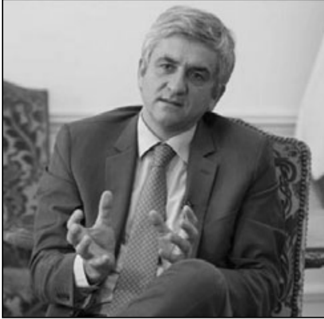
وزير الدفاع الفرنسي ايريفيه موران

المغربية في الصحراء الغربية. كما لا تزال باريس تتهم الجزائر باقتصاد سياسة حمائبة في اعقاب سلسلة تدابير اخذتها تحدد من حركة الشركات الفرنسية. شهدت العديد من الملفات حلحلة، من بينها ملف الدبلوماسية الجزائرية الذي تمت تبرئته مؤخرا من القضاء الفرنسي في الخطف استحسن الجزائر. حتى في اوج الازمة، لم يتوقف التعاون بين البلدين في مجال مكافحة الارهاب، بحسب مسؤولين وخبراء، وقال بونياتوفسكي «الامر الحقيقي للغاية، هو ان هناك مصلحة مشتركة في التعاون بشكل فاعل في محاربة تنظيم القاعدة في بلاد المغرب الاسلامي». ونشأ التنظيم الذي يعلن ولاء للقاعدة في عام 2006 من رحم الجماعة السلفية للدعوة والقتال المنبثقة من الجماعة الاسلامية المسلحة التي اغرقت الجزائر بالدماء خلال تسعينيات القرن الماضي وديرت جهات في فرنسا. وقال جان فرانسوا داغوزان من مؤسسة البحث الاستراتيجي ان «الجزائر لاعب اساسي وميزتها ان لديها تنظيم القاعدة في بلاد المغرب الاسلامي داخل اراضيها، في المنطقة، انها البلد الاقوى، الاغنى والاكثر». وأشار قادر عبد الرحيم من معهد العلاقات الدولية والاستراتيجية