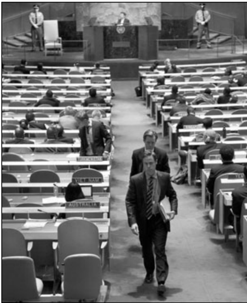
اعضاء الوفود الأوروبية ينسحبون خلال القاء الرئيس الإيراني كلمته في الأمم المتحدة

وقال أحمدي نجاد «كل القيم حتى حرية التعبير في أوروبا والولايات المتحدة ينسحب على منزع الصهيونية». وكان الرئيس الإيراني قد شكك من قبل في مشارك النازي وقال إن إسرائيل ليس لها حق في الوجود.