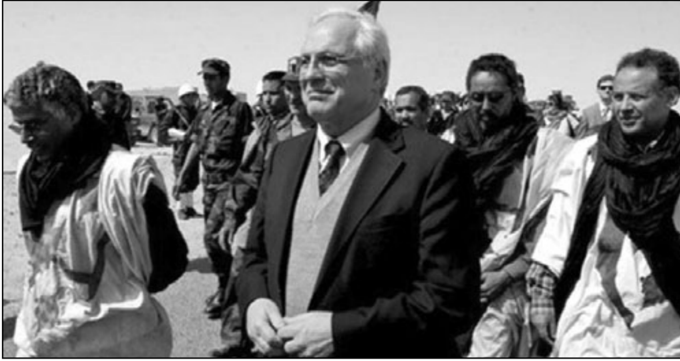
روس في إحدى زياراته للمنطقة (أرشيف)

رسمية مغربية ان 36 صحراوي يوجد ضمنهم 12 امرأة و 14 طفلا كانوا في مخيمات تندوف التحقوا يوم الاربعا الماضي بمدينة العيون. وحسب السلطة المحلية فان عدد الأشخاص الذين تمكنوا من الفرار من مخيمات تندوف منذ بداية السنة الجارية والتحقوا بمدينة العيون بلغ 1400 فرد.