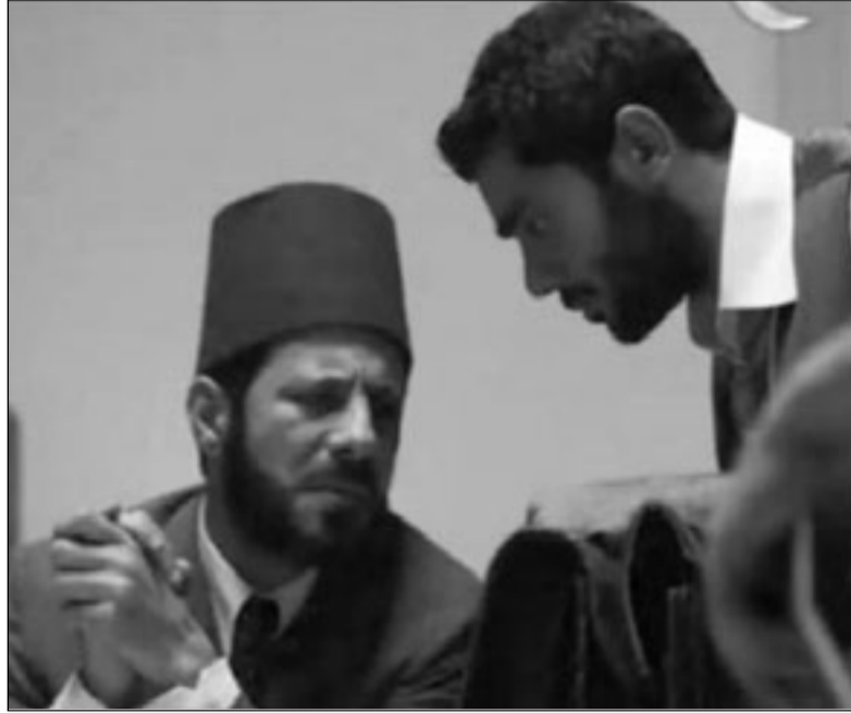
لقطة من مسلسل «ضبيعة»

الانطباع الذي خرج به العديد من المشاهدين لحلقات المسلسل الذي عرض في شهر رمضان تحت عنوان (الجماعة) يتلخص في أن الهاجس الذي كان يسكن وحيد حامد، وهو يكتب حلقته، كان هاجس الإذانة. كاتب (الجماعة) ظل شغفه الشاغل، في أغلب حلقات المسلسل، إذانة حركة الإخوان المسلمين منذ نشأتها، وعلى امتداد تاريخها، إلى اللحظة الراهنة. لقد كان المسلسل مكتوباً بلغة، أقرب في العمق، إلى لغة البيانات السياسية التي تستعمل في المناقشات، والزيارات بين الأحزاب والهيئات السياسية، عندما يتبادل الاتهامات، حول وقوع اضطرابات اجتماعية، أو اصطدامات بين عناصرها، بحيث يلقي كل طرف اللوم على الطرف الآخر، ويحمله ببعثات ما وقع من خسائر وما سقط من جرحي. لقد كان المسلسل أقرب في الكتابة التي احتوته إلى نص توثيقي منه