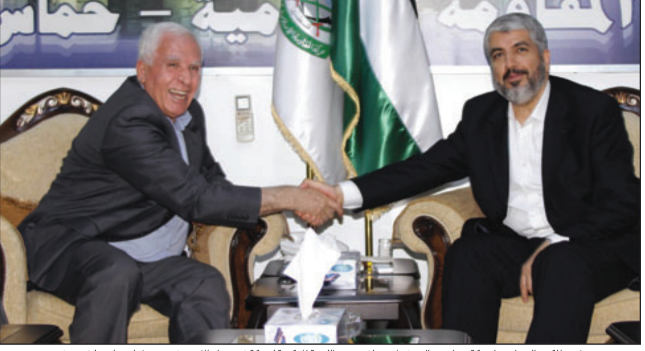
رئيس المكتب السياسي لحركة حماس خالد مشعل يصافح عضو اللجنة المركزية لحركة فتح عزام الاحمد في دمشق