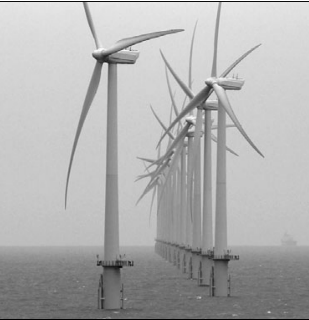
بعض من التوربينات المثة التي تشكلت منها محطة ثينيت لتوليد الكهرباء من طاقة الرياح

رائدا عالميا في هذه الصناعة. فحن جزيرة أوتشا اعتقد بقوة أنه يجب علينا تسخير رياحنا وأموالنا لتحقيق أقصى استفادة منها». ويجذب قطاع طاقة الرياح في بريطانيا استثمارات العديد من الشركات الأجنبية مثل فائينغول السويدية وستات أول النرويجية وأر.دي.بيلو. إي الألمانية. وتحت مظلة «اصدقاء الأرض» المعنية بالدفاع عن البيئة بافتتاح المشروع باعتباره خطوة مهمة في طريق تأمين إمدادات الطاقة في المستقبل ولكنها قالت إن سجل بريطانيا في مجال استغلال مصادر الطاقة المتجددة مازال غير مشجع.