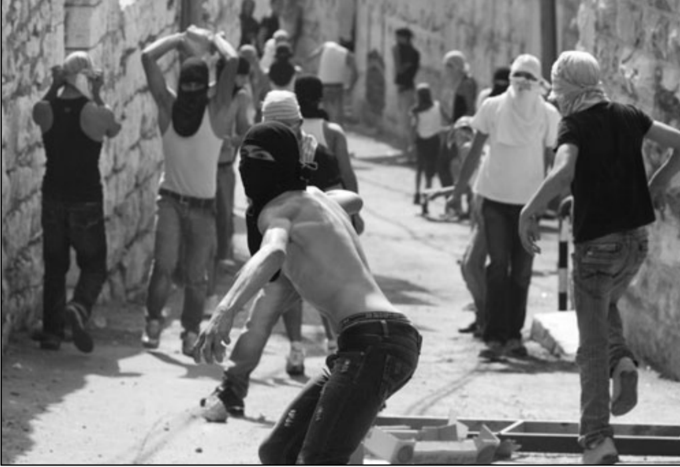
شبان فلسطينيون يمشقون قوات الاحتلال بالحجارة قرب الأقصى

ورفع المشاركون الاعلام الفلسطينية والياططات المنددة بسياسة الاحتلال الرامية لتهب الأراض وتتهجير أصحابها منها، وأحرقوا بعض منتجات المستوطنات الإسرائيلية.