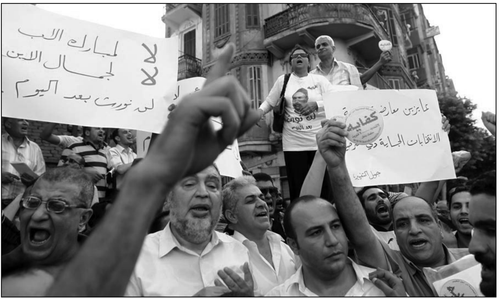
مظاهرة للمعارضة في القاهرة الثلاثاء الماضي

الانقسام المعارضة وتعلن بشكل متتال مشاركتها وبالتالي موقف الإخوان هو خوض الانتخابات... وفي الواقع قرر حزب الوفد الصغير المشاركة في الانتخابات، بأغلبية بسيطة (57 بالمئة) لجمعية العامة. وتعد حركة الإخوان المسلمين المحظورة قانوناً، أكبر قوة معارضة منظمة في مصر وقد سجلت في الانتخابات التشريعية الأخيرة عام 2005 انتصاراً سياسياً غير مسبق بفوزها بـ 20% من مقاعد مجلس الشعب، وقال مصطفى كامل السيد استاذ العلوم السياسية في جامعة القاهرة إن «جماعة الإخوان من مصلحتها على الأمد الطويل المشاركة لان هذا سيسمح لها بحسب مؤيديها (يساري) والحزب الناصري موقفها وواضف انه بشكل عام سيكون