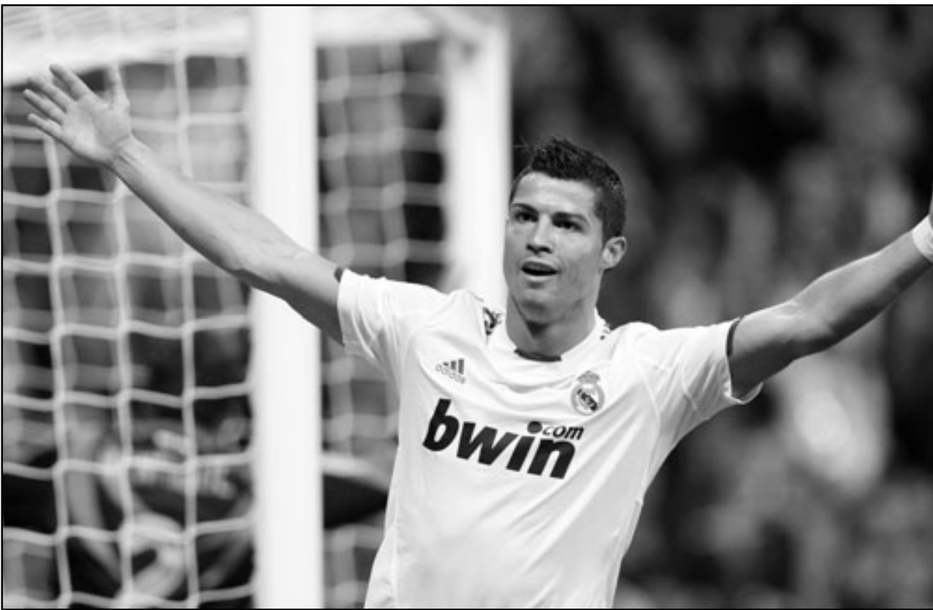
البرتغالي كريستيانو رونالدو