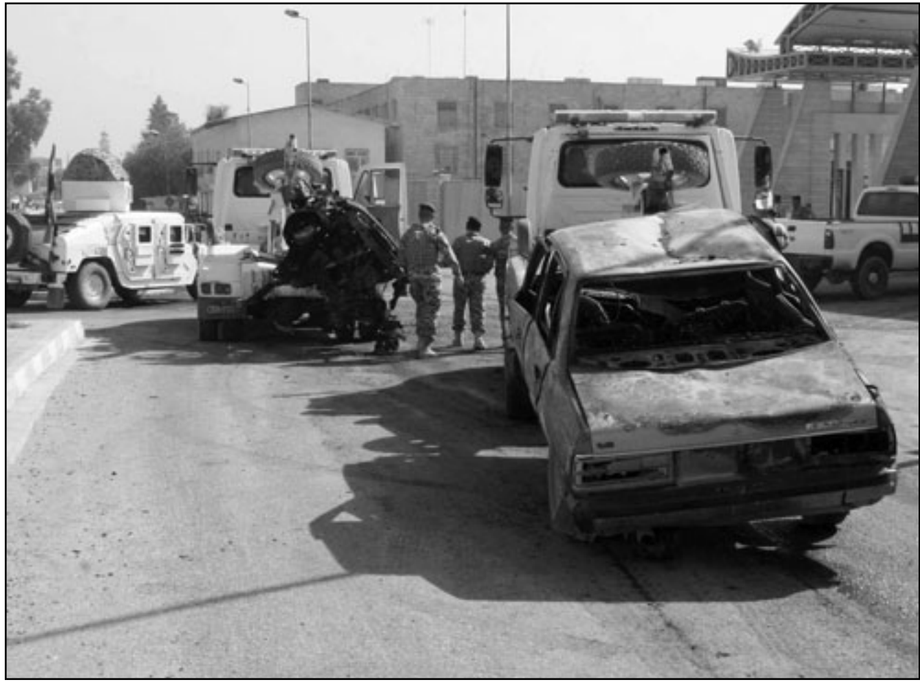
عناصر من الشرطة العراقية يتفقدون سيارة بعد انفجارها في مجمع طبي بالموصل امس

ومقابر القتلى الأبرياء، الجميع يعملون ذلك في العراق لأنهم كانوا الضحايا، ولكننا حدثنا» فقط «ظلالا ندعي أننا لم نعرف» وظلنا ننسج حول أنفسنا سبيجا من الأكاذيب. وأشار أن شخص تعرض للتعذيب كونه داعية إرهابية، فيما نظر إلى اكتشاف مقتل أطفال داخل منزل في غارة أمريكية أنه نوع من الدعاية الإرهابية، أو أنه «كولتار دامج» أي «أضرار جانبية»، أو على حد قول القادة الأمريكيين «ليس لدينا معلومات كافية حول ذلك»، ويرى فيسك في صندوق التقارير الجديد على أنه «مادة يمكن أن تصحح أساسا للحكامين في الحاكم».