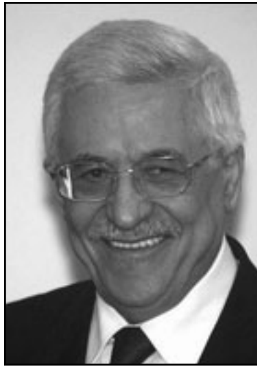
عباس لم يبشر بنهاية الوساطة الامريكية

المنطقة. كصبر، السعودية ودول الخليج مصالحة في المس بمكانتها كوسيط. ايران لا بد ستستغل التقرير، ولا سيما في كل ما يتعلق باتهام الولايات المتحدة بارهاب الدولة، ولكن هي ايضا لها مصلحة في ان تدع الوثائق ترتاح كي لا تقف هي بذاتها في بؤرة هدف الدول العربية بسبب تدخلها في العراق.