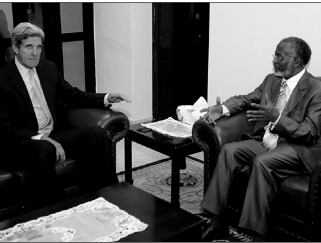
وزير الخارجية السوداني علي أحمد كرتي مجتمعا بالسناتور الأمريكي جون كيري بالخرطوم أمس