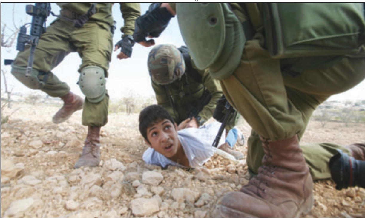
جنود الاحتلال الاسرائيلي يعقلون فتى فلسطينيا خلال مظاهرة في قرية بيت أومر قرب مدينة الخليل بالضفة الغربية