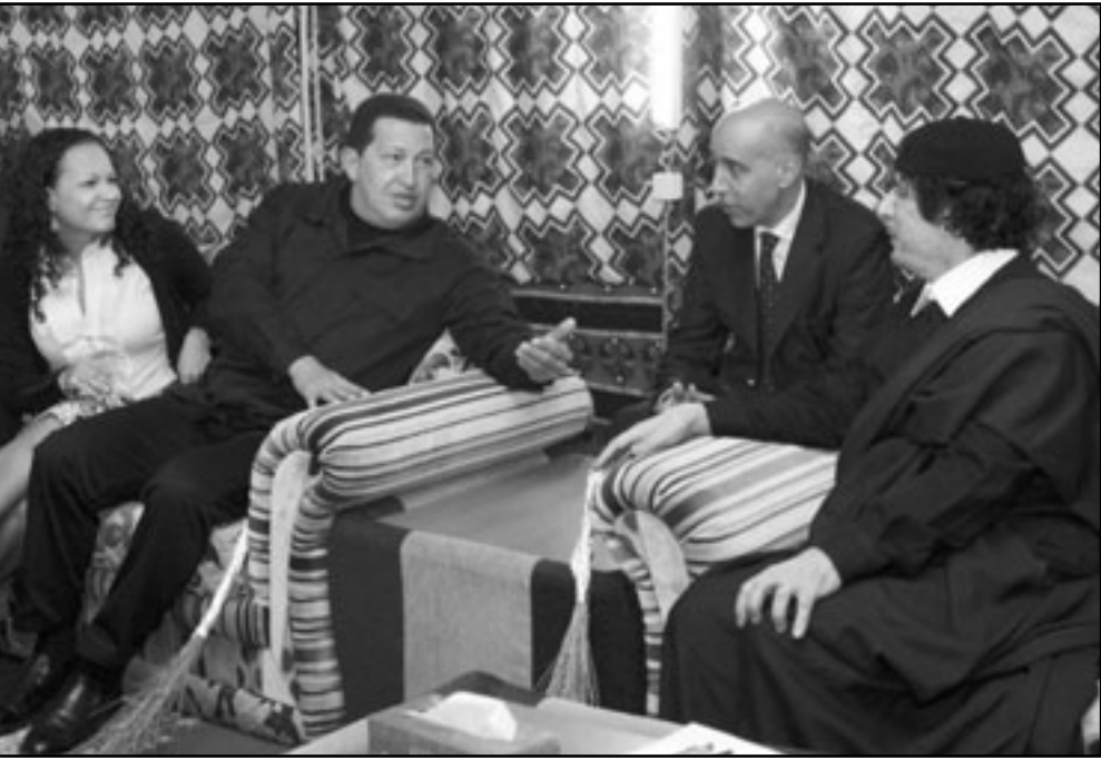
الرئيس الليبي معمر القذافي مستقبلا رئيس فنزويلا هوغو شافيز في طرابلس أمس

تستهدف تقبيل التعاون بين الجانبين وقال «نحن الآن نصنع وتنسج التعاون والتكامل بين منطقتي أمريكا اللاتينية وأفريقيا عن طريق يوابها الكبيرة ليبيا».