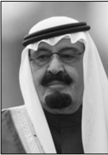
السعودية لن تلغي صفقة السلاح الهائلة

بربراغو 242 هو فقط نموذج واحد، صغير، من اصل جملة كبيرة من العظيقات والوثائق التي نشرت امس. من بين كل ما نشر، يمكن الجدال في ما هو اكثر اهمية: عادة القتل التي اكتشفت في العراق، السلوك العسكري العدواني أم حقيقة ان البناتغون كذب - بوضوح، عندما قررت بانه لا يوجد احصاء رسمي يعدد القتلى المدنيين في الحرب، ولكن يمكن ايضا الاعتراف بانه