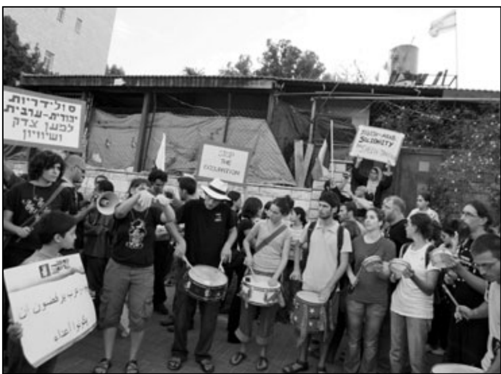
فلسطينيون يحتجون على اوامر هدم منازلهم في حي سلوان في القدس المحتلة

وطب رئيس بلدية القدس نير بركات قبل عشرة ايام من رئيس الوزراء بنيامين نتانياهو الموافقة على خطة البلدية التي تتعلق بمشروع بناء حديقة أثرية يهودية جديدة في حي سلوان بالقدس الشرقية.