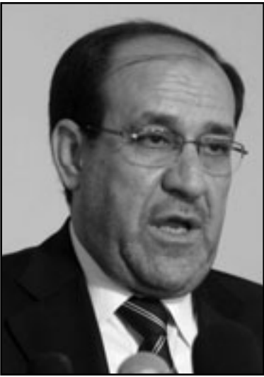
المالكي كان شريكا في اعمال القتل