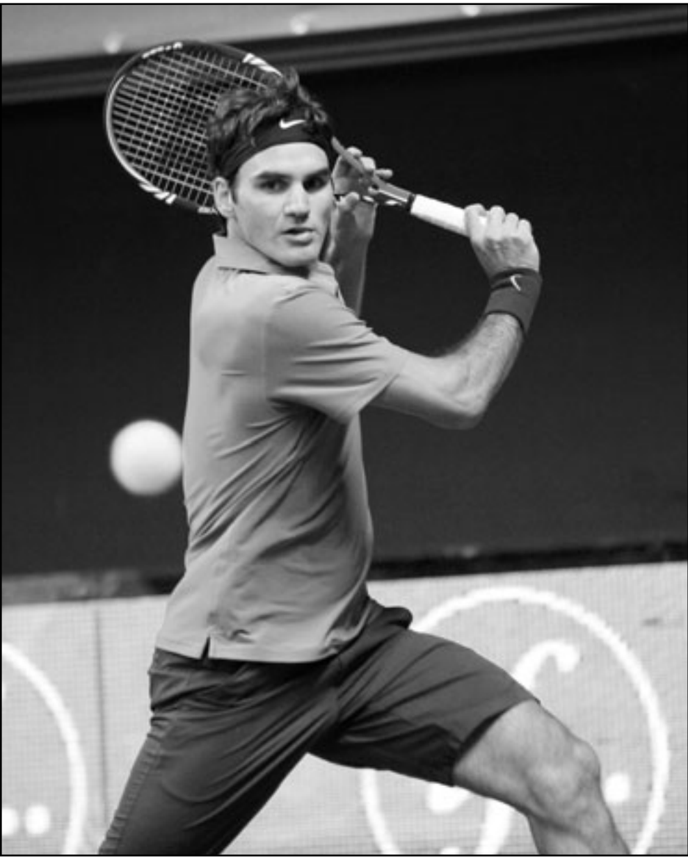
السويسري روجيه فيدر

باريس - رويترز: خسر ستاد رين 1-صفر على أرضه أمام مونبلييه لكنه احتفظ بموقعه في صدارة دوري الدرجة الأولى الفرنسي لكرة القدم بعد تعادل سانت ايتيين صاحب المركز الثاني 1-1 مع كاين، وسجل يوريس مارفو هدف الفوز لومبلييه بضربة رأس لكرة من ركلة ركنية قبل نهاية الشوط الأول بدقيقتين ليتوقف رصيده رين عند 19 نقطة من عشر مباريات. وتناسق مونبلييه بعد طرد المدافع غاري بوكالي عقب مرور ساعة من زمن اللقاء كما أنهى رين المباراة بعشرة لاعبين عقب خروج قادر مانجانتي مطرودا قبل سبع دقائق من النهاية. وتأخر سانت ايتيين بفارق نقطة واحدة عن رين بعد تعادله مع ضيفه كاين بفضل هدف ايمانويل ريفيير قبل ثماني دقائق من نهاية اللقاء. وكان سانت ايتيين أن يخرج فاشزا