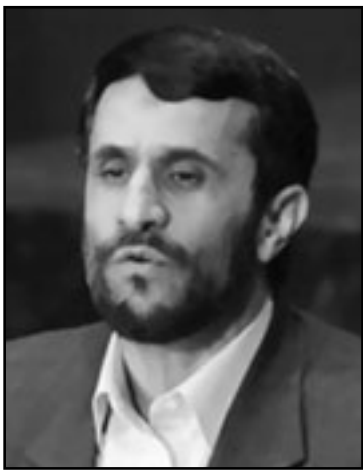
نجاد يدعو الى اباداة اسرائيل

كفيلة بان تكون تتعارض مع سياسة ادارة اوباما التي تتطلع الى مد اليد الى ايران، ولكن بعد سنتين، حتى المؤيدون الكبار للبيت الابيض يعترفون بان هذه السياسة لم تحط أي نتيجة.