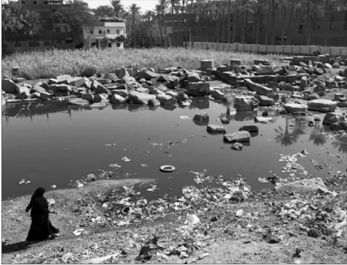
سيدة مصرية في قرية ميت رهينة جنوب القاهرة حيث كان اكتشاف التمثال الشهير للملك رمسيس الثاني

لكن تصريحات بعض المسؤولين في الاسابيع الاخيرة تشير الى ان ارتفاع الاسعار ستكون قضية لها اولوية في الانتخابات. ومن المتوقع ان يهيمن الحزب الوطني على السباق الانتخابي وسط شكوى معتادة من جانب المعارضة والجماعات الحقوقية بان الانتخابات شابها مخالفات. لكن الانتخابات ما زالت تخضع لمراقبة دقيقة لمعرفة مدى ما ستسمح به السلطات من هامش للمعارضة قبل الانتخابات الرئاسية في 28 نوفمبر تشرين الثاني/نوفمبر 2011 عندما يترب جميع اذا ما كان مبارك سيسعى لولاية جديدة.