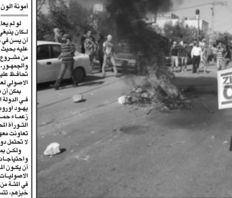
جانب من تظاهرة ام الفحم

هذه الظاهرة كانت اعتراضا على القسم الشمالي من الحركة الاسلامية، وهي حركة ائتد لحماس وجهات مسلحة غير قانونية، اخرى لا تحت اسرائيل والغرب كله فقط. في مقابلته، القائل على خلفية تدنيس القسم الشمالي من الحركة الاسلامي، شرف العائلة يفعل ذلك لأنه يعتقد أنه القضاء على اسرائيل وأن يطبق هنا حكما دينيا اسلاميا، تضطر تحته عضو الكنيست الزعبي الى التفتع وراء برقع، مثل المظاهرين الذين احاطوا به ورموا قوات الاسلطة الاسرائيلية التي يكرهونها جدا بالحجارة.