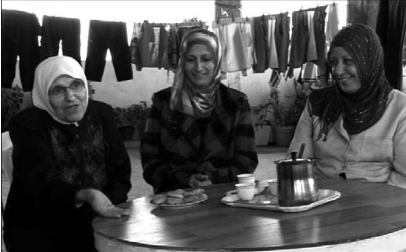
لقطة من فيلم «ملكة النساء»

شهدت العاصمة الإماراتية تظاهرة سينمائية عالمية، وكان الحضور العربي فيها لافتاً، في إنتاج الأفلام، وفي حضور عدد من النجوم، من كتاب سيناريو ومخرجين وممثلين ومنتجين وغيرهم من الضيوف، الذين حضروا وتابعوا فعاليات المهرجان التي تواصلت عروضا لمدة عشرة أيام، وشارك فيها ما يزيد عن ستين فيلماً محلياً وعربياً وعالمياً، بالإضافة إلى أفلام مسابقة الإمارات والأفلام المشاركة في مسابقة الأفلام القصيرة. كان افتتاح المهرجان بفيلم «سكرتاريا» Secretariat للمخرج الأمريكي راندال والاس، وهو يحمل فكرة التحدي والحلم والرغبة عند الإنسان، وتأتي هذه الإرادة القوية من سيدة تحقق حلم والدها وتستمر في الحفاظ على ما تركه لأولاده، بعكس أخيها الضعيف المتردد الذي أراد أن يبيع المزرعة والخيول، بالاتفاق مع زوجها الذي ابتعدت عنه زوجته (بيبي تشيززي) لتشرى على مزرعة الخيول، والفيلم مأخوذ عن قصة واقعية عن الحصان الذي لا تزال أرقامه قياسية تذكر في السجلات حتى اليوم. وكانت الخطوط العريضة لأفلام المهرجان تتناول قضية فلسطين، والجريمة المنظمة في العراق، وتقييم المرحلة الشبوعية في بعض البلدان الاشتراكية، إضافة إلى جوانب من قضايا العمال والمرأة والطفولة، كما كانت هناك قصص فردية وعائلية واجتماعية، ومن الأفلام التي شددت الاهتمام بفيلم عن غيفارا (تشي - رجل جديد) وفيلم كارلوس. ولعل من أهم هذه الأفلام المتميزة ما قدمه المخرج الفلسطيني إيليا سليمان في فيلمين: «سجل اختفاء» و«يد البهية»، وقد تميزت أعمال سليمان بلغة سينمائية راقية، وتعبير عميق، يفضح جرائم الصهيونية ضد الشعب الفلسطيني، بالصورة الجردة من الكلام.