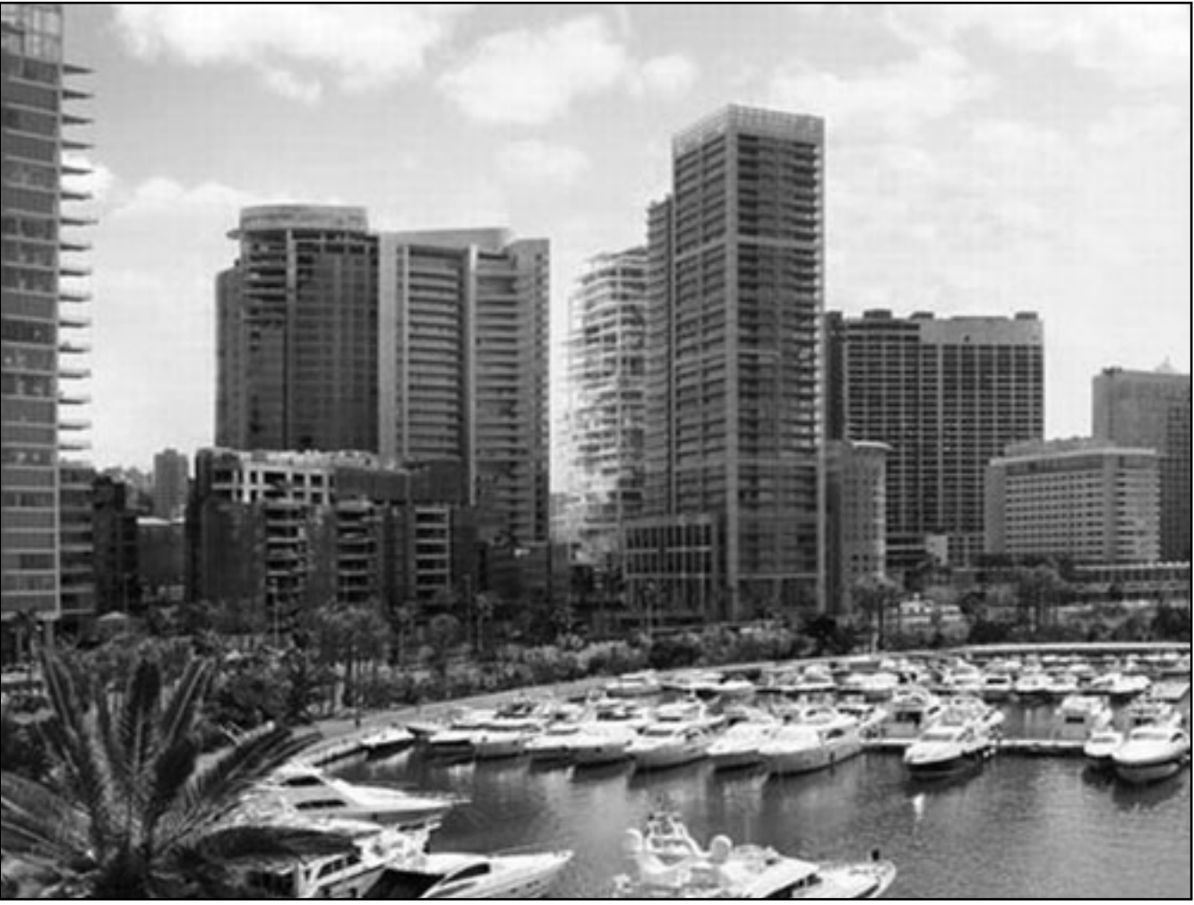
مشروع «بيروت تيريسس» شرفات بيروت المظلة على المارينيا

وقال متولي في اتصال هاتفي مع رويترز تعقيبا على توقيع العقد ونحن معجبون بمستقبل قطاع التجزئة في