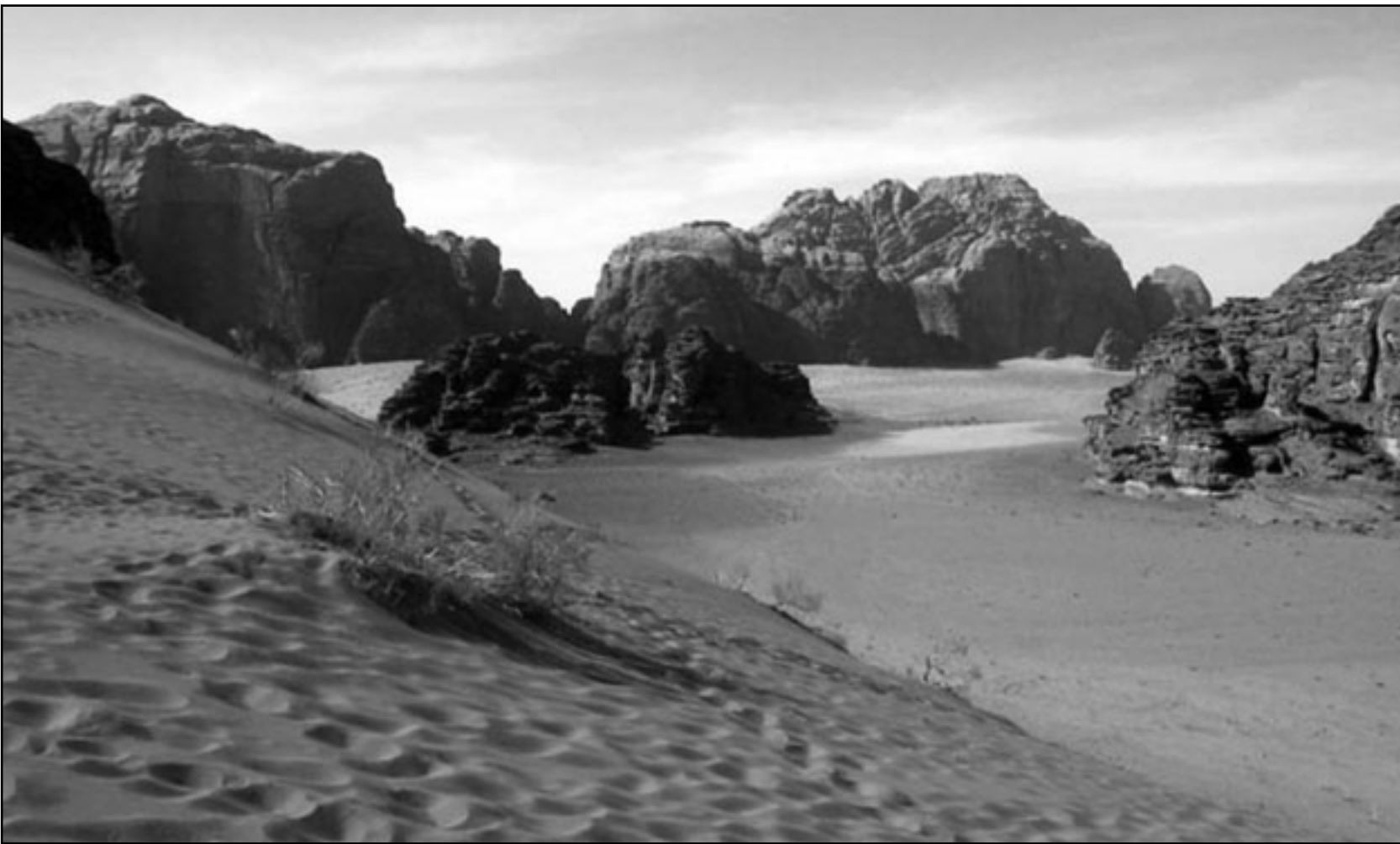
جانب من وادي رم