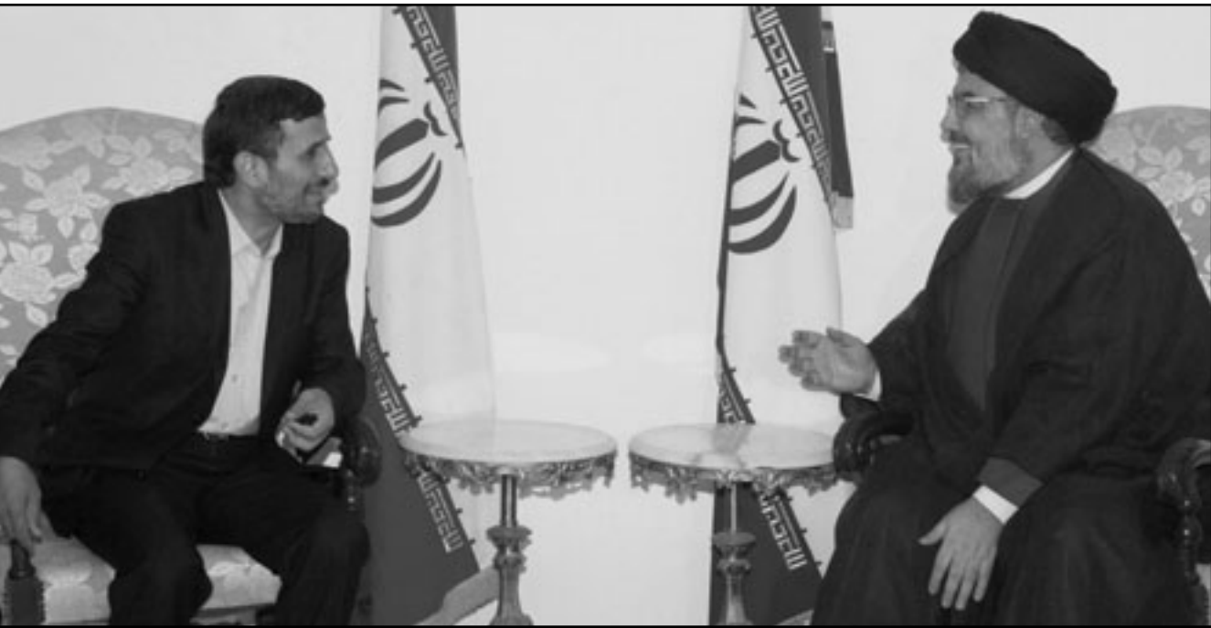
حسن نصر الله خلال استقباله الرئيس الإيراني أحمدني نجاد في بيروت

–حين توجه الى حليفه المحلي، منظمة حزب الله– أظهرت جدول أعمال مختلفاً، أقل تنوعاً، وعليه، فحين عبر عن تأييده لحزب الله في ظل انتقاد تحقيق الامم المتحدة المتواصل، تطلع أحمدني نجاد الى الضغط على الحكومة لتفادي خيار اتخاذ خطوات ضد حزب الله، من خلال دعمها لحزب الله، أو وضحت إيران أيضاً مصلحتها المستمرة في اداء دور مركزي في الساحة اللبنانية، في جانبها فها في ان تتمكن من زيادة قوتها ونفوذها في هذه الدولة الشرق أوسطية.