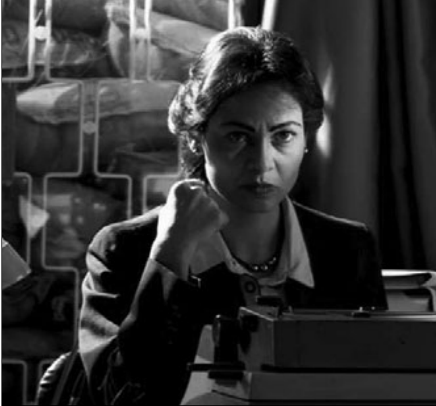
لقطة من فيلم «شتي يا دني»