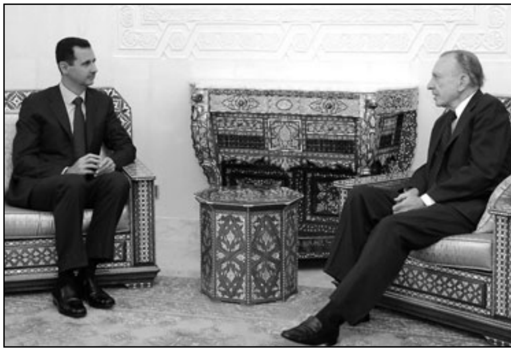
الرئيس السوري بشار الاسد لدى اجتماعه مع السيناتور الامريكي ارلين سبيكتور

الاردنيون بان السائح اليهودي يكثر من العبت في الاوصيات والحدان والترية عند زيارته المواقع السياحية الاردنية، ومن الوافدة ان شغف السائح الاردني بالبحث عن آثار تخصصه بدأ يزجج السلطات الاردنية ويسعى خلافا لبقاوات من العتبة للترافق الاردنية كما قالت الخطيب وليس سرا كما يقول صالح العلي وكيل السياحة الخاص بان «يبلد السائح اليهودي من الاسباب التي تجعل التعامل بنوعه مع ليس منتجا فاليهودي السائح تربية لعمان ليوم واحد وقبض معه طعامه ومياهه خصوصا اذا كان جنديا، ويغادر دون انفاق ولو دولار واحد في الاردن.