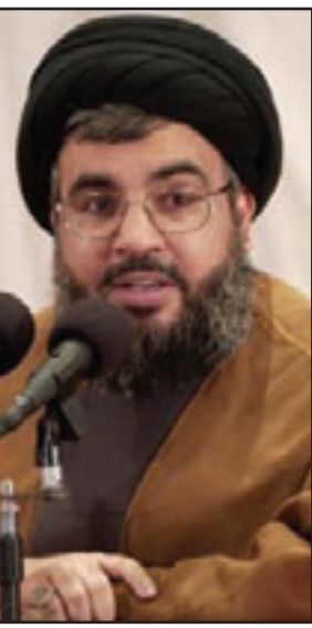
السيد حسن نصر الله

تساءل: من منكم يقبل اطلاع احد على ملف زوجته او ابنته او اخته الطبي