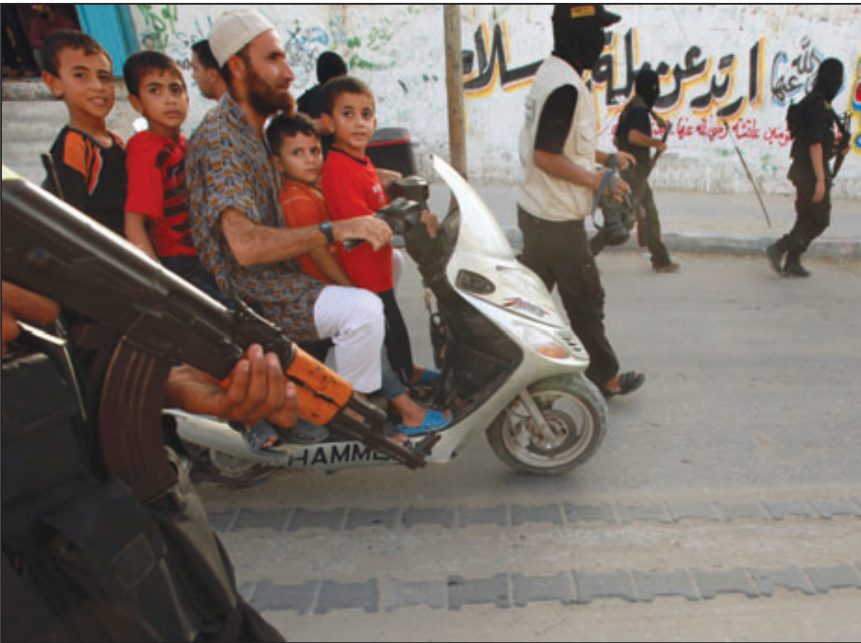
فلسطيني وابتاؤه الاربعة على دراجة نارية وسط عرض عسكري لحركة الجهاد الاسلامي في قطاع غزة امس

الناصرة - «القدس العربي» من زهير أندراوس: