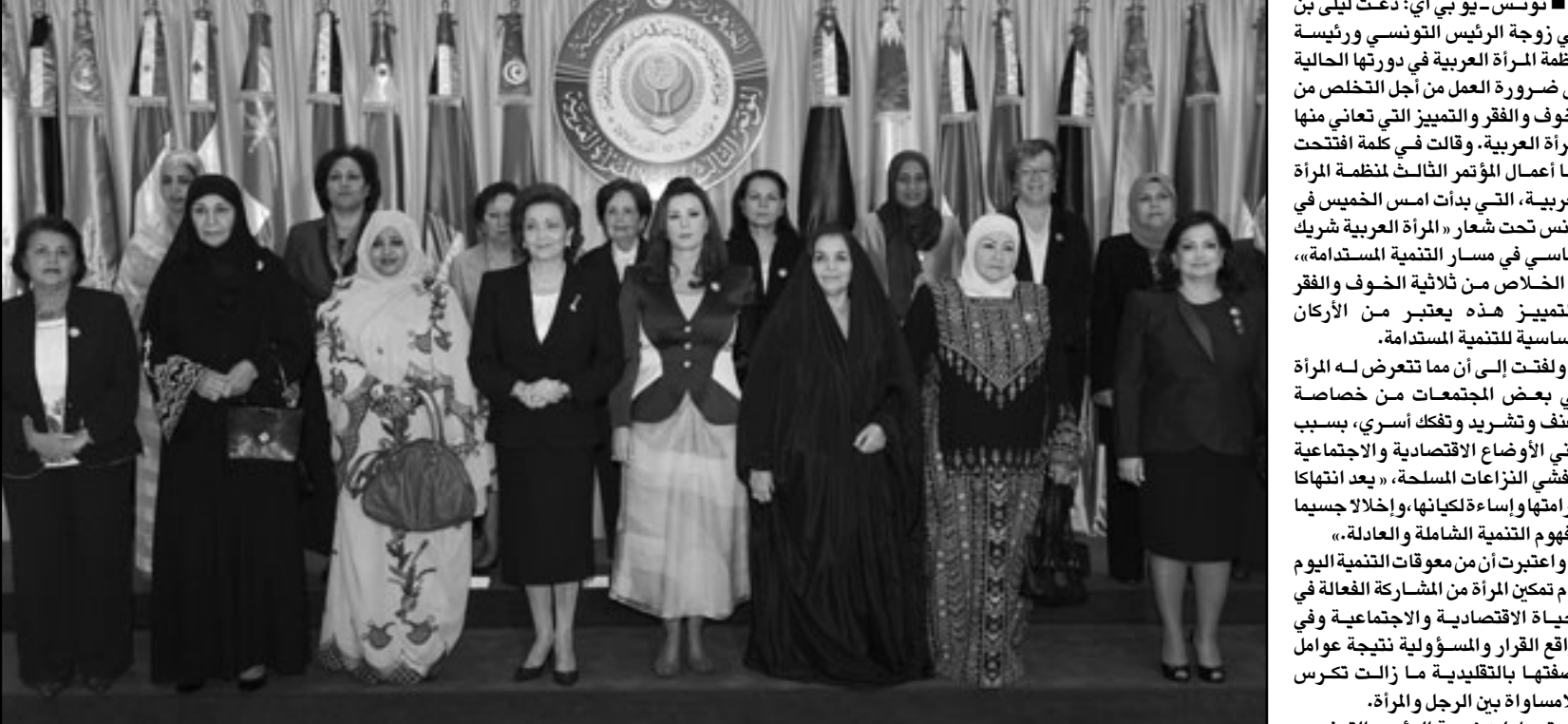
صورة للسيدات العربيات الأوائل في المؤتمر الثالث لمنظمة المرأة العربية

تونس - يوبي أي: دعت ليلي بن علي زوجة الرئيس التونسي ورئيسة منظمة المرأة العربية في دورتها الحالية إلى ضرورة العمل من أجل التخلص من الخوف والفقر والتمييز التي تعاني منها المرأة العربية. وقالت في كلمة أفتتحت بها أعمال المؤتمر الثالث لمنظمة المرأة العربية، التي بدأت أمس الخميس في تونس تحت شعار «المرأة العربية شريك أساسي في مسار التنمية المستدامة»، إن التخلص من ثلاثة الخوف والفقر والتمييز هذه يعتبر من الأركان الأساسية للتنمية المستدامة. ولفتت إلى أن ما تتعرض له المرأة في بعض المجتمعات من خصاصة وعنف وتشريد وتفكك أسري، بسبب تدني الأوضاع الاقتصادية والاجتماعية ونفسي النزاعات المسلحة، «بعد انتهاك لكرامتها وإساءة ذكائها، وإخلاقا جسيما يفهم التنمية الشاملة والعادلة». واعتبرت أن من موقفات التنمية اليوم عدم تمكين المرأة من المشاركة الفعالة في الحياة الاقتصادية والاجتماعية وفي مواقع القرار والمسؤولية نتيجة عوامل وصفتها بالثقيلية ما زالت تكرس المساواة بين الرجل والمرأة. وتساءلت زوجة الرئيس التونسي في هذا الصدد عن مدى وفاء المجموعة الدولية بالالتزامات التي حددتها في المراجعات الأمامية في هذا المجال، في الوقت الذي تعاني فيه المرأة في دول عدة من التمييز والإقصاء والتمييز. وكانت أعمال هذا المؤتمر التي ستواصل على مدى ثلاثة أيام، قد انطلقت بحضور عدد من السيدات الأوائل في الدول العربية، منهن المشاركة فاطمة بنت مبارك، أرملة رئيس دولة الإمارات الراحل الشيخ زايد بن سلطان آل نهيان،