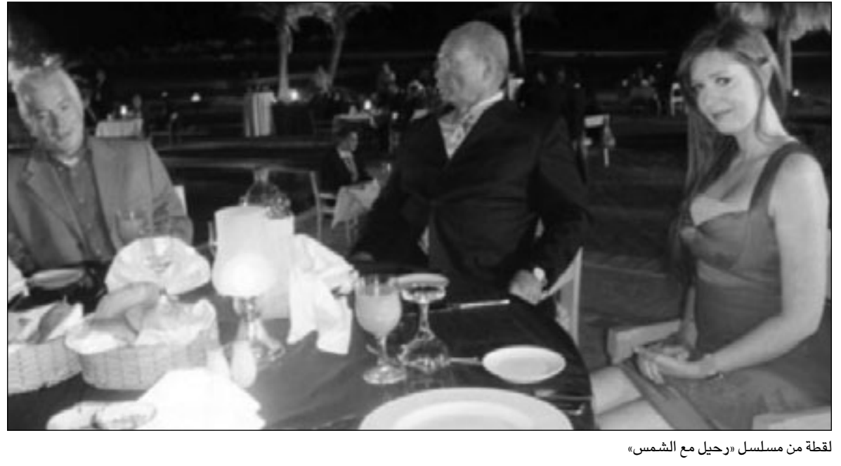
لقطة من مسلسل «حبل مع الشمس»