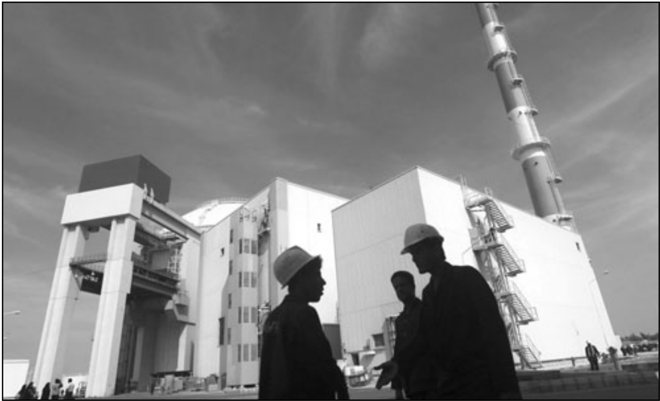
إيرانيون أمام محطة بوشهر النووية

عواصم - وكالات: شدد رئيس الاجهزة السرية البريطانية ام.اي.6، الخميس في لندن على ضرورة القيام بعمليات مشتركة لاجهزة الاستخبارات، للحصول على أكبر قدر من المعلومات عن جهود ايران لحيازة السلاح النووي. وقال السير جون سيورز الذي يترأس ان يتحدث علنا في كلمة تلقها للتلفزيون البريطاني مباشرة، ان «وضع حد للانتشار النووي لا يمكن معالجته فقط على صعيد الدبلوماسية التقليدية».