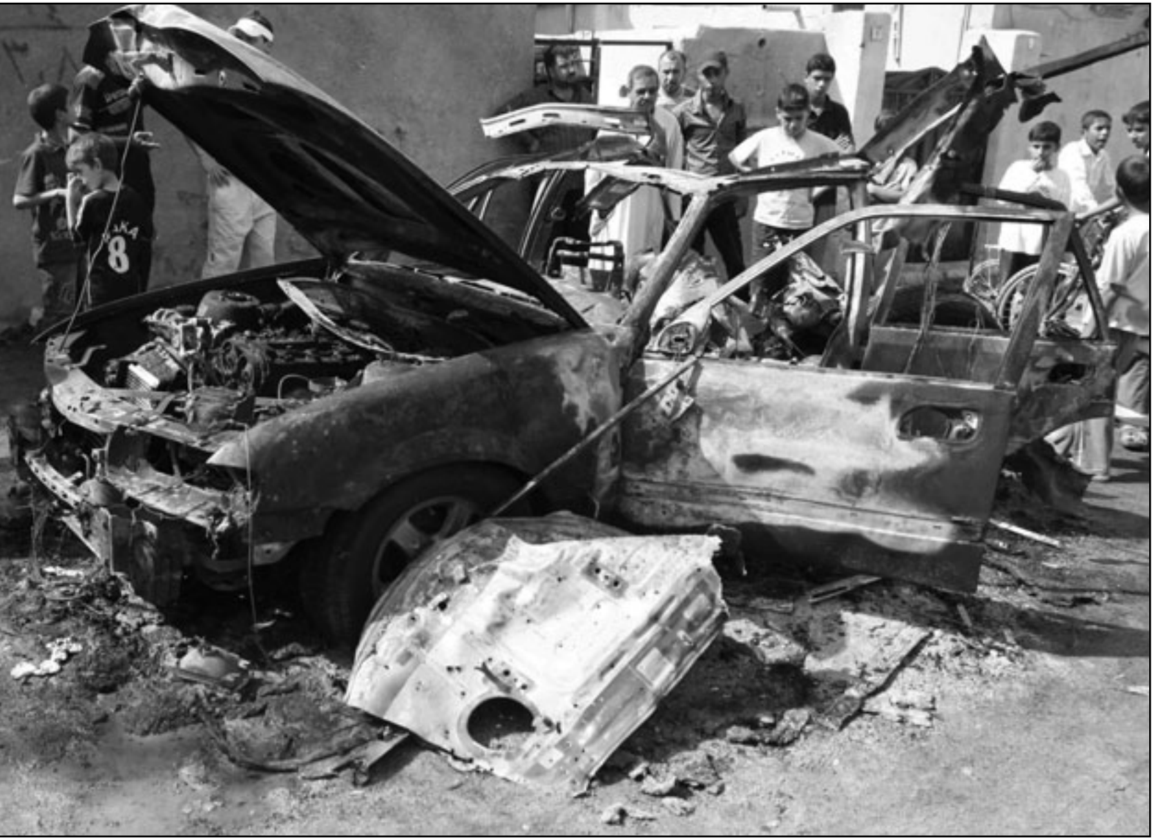
عراقيون يتجمعون حول سيارة انفجرت في جنوب مدينة البصرة

وبحسب آخر مسودتين تم الاتفاق عليهما بين الكتل السياسية، كما تنص المقترحات الكردية على تمويل وتسليح قوات البيشمركة كجزء من منظومة الدفاع الوطني وتعيين ضحايا النظام السابق تعويضاً عادلا وسريعا. وتنص الورقة الكردية أيضا على أن يكون للتحالف الكردستاني حق البت بمرشحي الوزارات السيادية والوزارات الأخرى ذات الصلة بالإقليم، وتشير المقترحات إلى أن الحكومة المقبلة بعد مستقيلة في حال انسحاب الكرذ منها نتيجة خرق دستوري أو عدم تنفيذ البرنامج الحكومي.