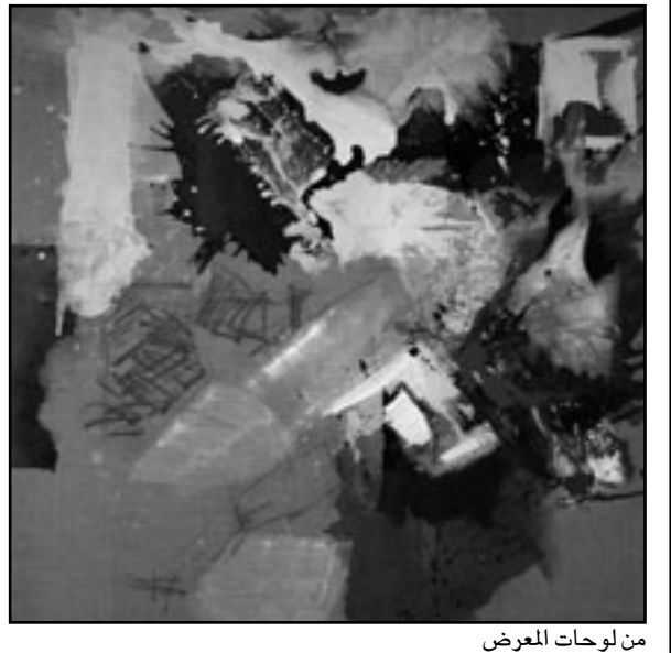
من لوحات المعرض