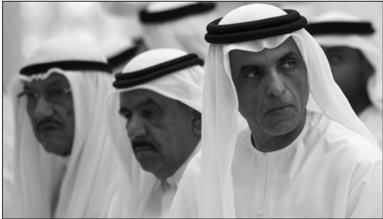
الشيخ سعود بن صقر القاسمي حاكم رأس الخيمة الجديد (الاول من اليمين) خلال تشييع جثمان والده