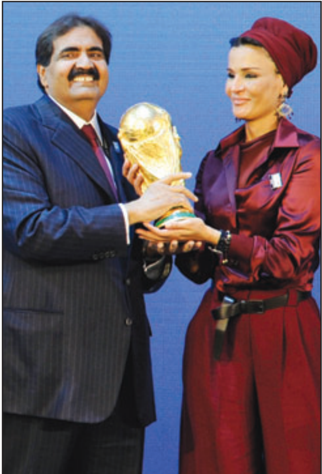
أمير قطر الشيخ حمد بن خليفة آل ثاني وحرمة الشيخة موزة المسند يحملان كأس العالم لدى إعلان فوز قطر باستضافة المونديال عام 2022

تجاوزت قطر عقبات درجات الحرارة المرتفعة صيفا ومخاوف بشأن البنية التحتية، لتتأهل امس الخميس شرف تنظيم نهائيات كأس العالم لكرة القدم 2022. وأصبحت قطر أول دولة عربية وإسلامية وأول دولة بمنطقة الشرق الأوسط تفوز بحق استضافة كأس العالم، ويقول محللون إن فوز قطر باستضافة البطولة سيدعم صورة المنطقة عالميا، وأكد رئيس ملف قطر الشيخ محمد بن حمد آل ثاني، إن هدف قطر من وراء استضافة كأس العالم هو منح شعوب الشرق الأوسط الفرصة لكي يعيشوا بطولة عالم رائعة، وأضاف «ثريد من كأس عالم قطرية أن تشرك أرضا وأن تقدم كأس عالم تكون حقيقة حدثا عالميا يشعر به الآباء والأمان وهم يتابعون مع أطفالهم المباريات في المدرجات»، وقال نحن جاهزون لصنع التاريخ، توقعوا ما يذهل، وهو شعار الملف القطري. وأوضح الشيخ محمد بن حمد، نجل أمير دولة قطر، أنه لن تكون هناك أي مشاكل في حالة تأهل المنتخب الإسرائيلي إلى النهائيات، وأضاف «قطر ليست عنصرية وستلتزم بقواعد الفيفا، سترحب بالجميع».