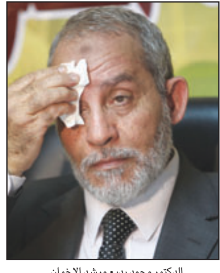
الدكتور محمد بدوي مرشد الاخوان

الان بعد انسحاب الوفد و«الاخوان»، ويرجحون «أن طبخة التزوير» شاطط» أو فسدت، حيث لم يحدث «تدخل اداري كاف على الأرض» لمساعدة مرشحي احزاب المعارضة، وهي لم تستطع بنفسها ان تحقق النجاح في مواجهة «ماكينة التزوير» للصحافة التي ركزت على اسقاط مرشحي لصالح مرشحي احزاب الحاكم، الذين وصل عددهم إلى ستة على مقعد واحد كما في بعض الدوائر. وسيكون التحدي الرئيسي أمام النظام في المرحلة المقبلة أنه ما زال يملك «تعددية سياسية حقيقية» تمنحه ما يكفي من المشروعية لانتخاب رئيس جديد، بينما سيكون على احزاب المعارضة أن تجد الطريق البديل للرد على أفعالها، ما سيمثل اختبارا قاسيا لحقيقة قوتها السياسية والشعبية. ومع البرلمان الاحادي اللون القاعد الطعم والذي تفوح منه رائحة التزوير والبطلان، والمشكل من نسبة تسعينية من المصريين أنهم تجاوزوها، منذ عقود، فإن لافتة «لم ينجح أحد» قد تكون الانسحاب لوصف نتائج الانتخابات.