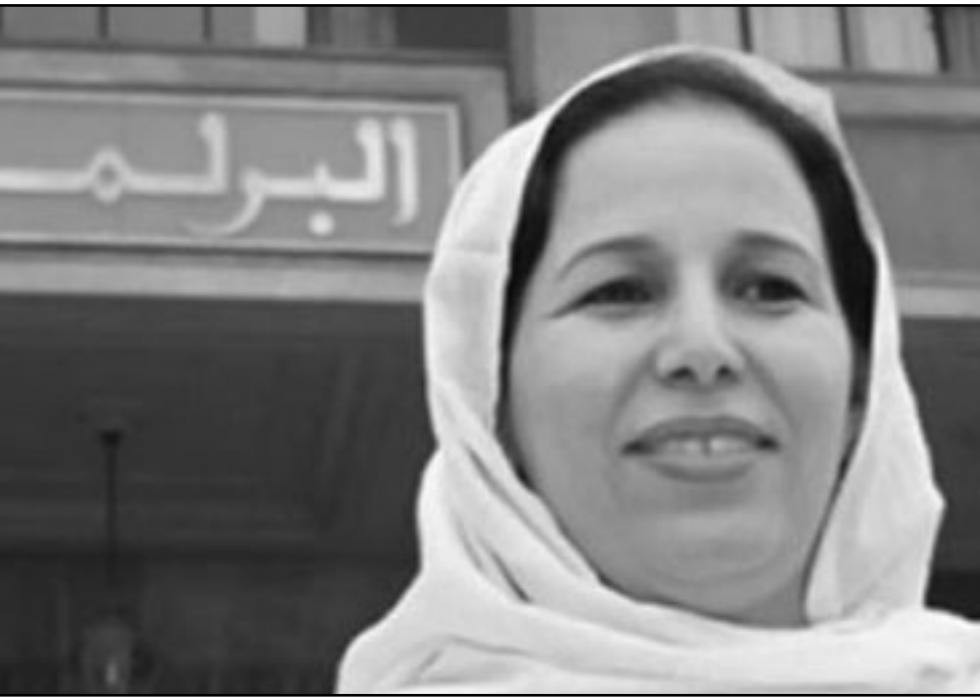
البرلمانية كمجولة بنت ابي

والعنصرية لجان ماري لوبان وحزبه (الجبهة الوطنية)، من جهته طالب ممثل النيابة بشهرين حبس غير نافذ وغرامة قدرها 20 ألف يورو، وكذا إبعاد لوبان عن تسيير شؤون الحزب لمدة عام. وبعد صدور حكم البراءة في حق زعيم الجبهة الوطنية، أعربت ماريين لوبان ابنته وتابنته في الحزب عن ارتياحها لقرار القضاء الفرنسي، مشيرة إلى أنه «من غير العقول أن يرسل الفرنسيون أبناءهم لحاربة حركة طالبان بالاسلح في أفغانستان، في حين تمنع كسؤولين سياسيين من محاربة الطالبان».