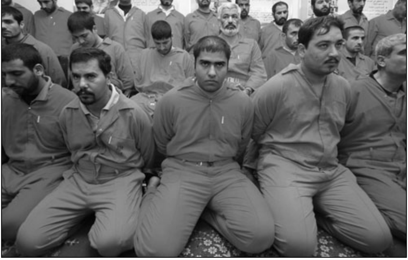
صورة لـ39 معتقلا من تنظيم القاعدة عرضتها وزارة الداخلية العراقية في مؤتمر صحافي في بغداد

بغداد - وكالات: انفجرت عبوة ناسفة اسن الحxisين برتل تابع للجيش امريكي في غرب بغداد من دون معرفة حجم الخسائر. وقال مصدر في الشرطة العراقية ان «عبوة ناسفة انفجرت أثناء مرور رتل للجيش الامريكي على الخط السريع بمنطقة الشعلة غرب بغداد صباح اليوم من دون ان يشتبه معرفة حجم الخسائر والأضرار بسبب الطوق الأمني الذي فرض حول مكان الحادث». وكانت أربع عبوات انفجرت صباح امس في أماكن متفرقة ببغداد وأسفرت عن إصابة 7 أشخاص من بينهم 4 شرطيين بجروح.