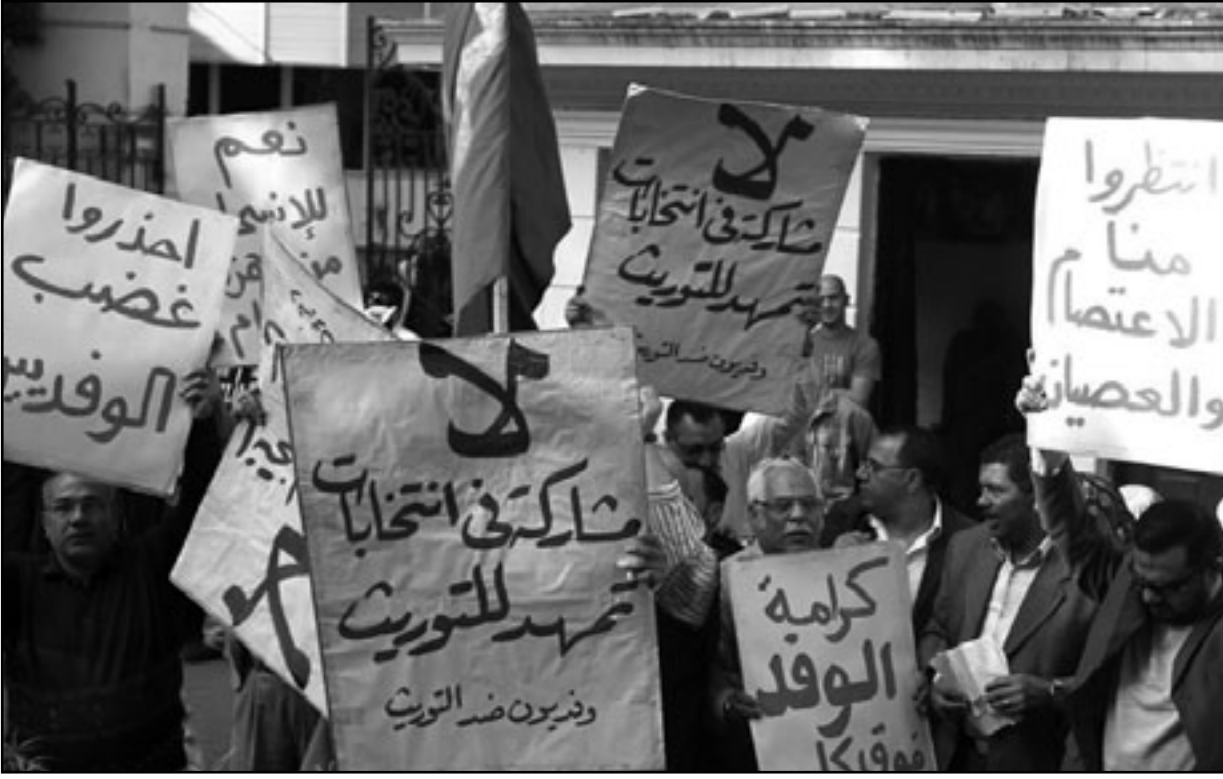
أعضاء في حزب الوفد يتظاهرون ضد المشاركة في الانتخابات في القاهرة أمس