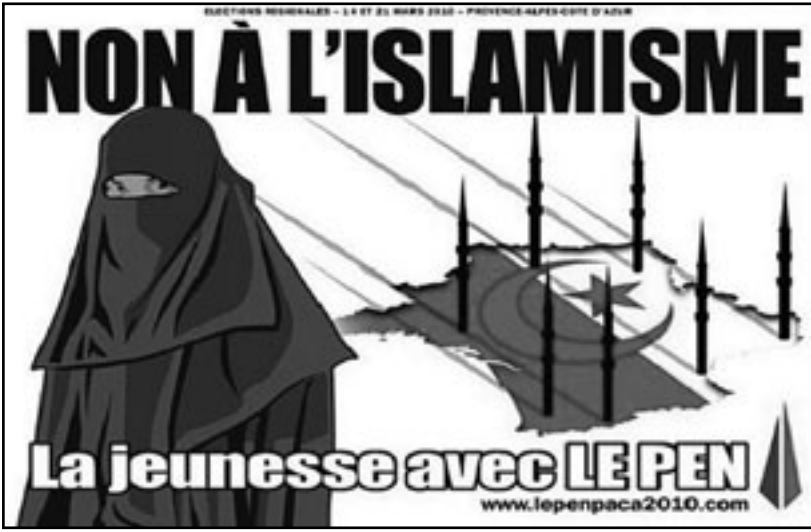
جان ماري لوبان، وفي الصورة الثانية المصق الذي تسبب في محاكمته

وبعد أن أعلنت مختلف الأطراف عن اتفاقها على التفاوض يبقى الجانب الغامض في كل هذا، هو موجعية الحوار، ويستتبع مراقبون أن هل سيقبل الرئيس ولد عبد العزيز باتفاق داكار كموجعية؟ وبالمقابل هل تستغل المعارضة عن اشتراط مرجعيتها للحوار؟ وهل لجموعة الاتصال الدولية دور في هذا الشأن وهي التي أحالت أضرابه للف الموريتاني لرفوف الخلفية دون أن تتابع الاتفاق الذي توصلت فيه؟