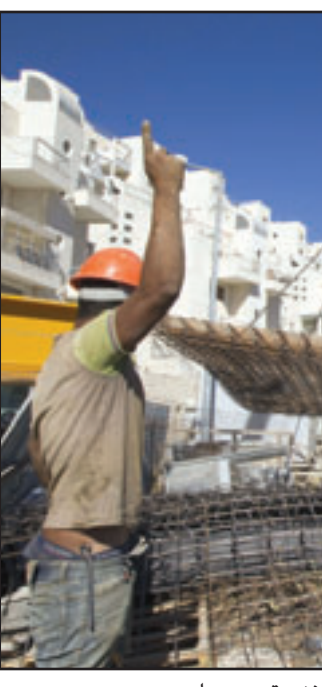
عمال يبشرون البناء في مستوطنة على جبل ابو غنيم قرب بيت لحم

رام الله - «القدس العربي» من وليد عوض: أعلنت مصادر فلسطينية الخميس أن واشنطن بلغت القيادة الفلسطينية أن مفاوضاتها مع إسرائيل بشأن تجميد الاستيطان فشلت مرة أخرى، وأنها بحاجة مزيد من الوقت لإجراء اتصالات إضافية مع الحكومة الإسرائيلية برئاسة بنيامين نتانياهو لافتعابها بضرورة وقف الاستيطان، من أجل العودة للمفاوضات المباشرة مع الفلسطينيين. ودخلت القيادة الفلسطينية في اجتماعات مكثفة الخميس لبلورة خطة للتحرك بشأن دعوة اللجنة العربية للسلام لعقد اجتماع لها لاتخاذ قرار عربي فلسطيني موحد بشأن آلية التحرك في المرحلة القادمة. وأشارت مصادر فلسطينية مطلعة لـ«القدس العربي» إلى أن دعوة اللجنة العربية للسلام قد تتأجل لطلوع العام القادم، في ظل وجود تحفظ عربي على عقد اجتماع لها ليبحث خطة التحرك القادمة بعد فشل الجهود الأمريكية في اقتناع إسرائيل بوقف الاستيطان، وانسحاب الإدارة الأمريكية حاليا بقضية ويكيليكس والوثائق السرية السرية.