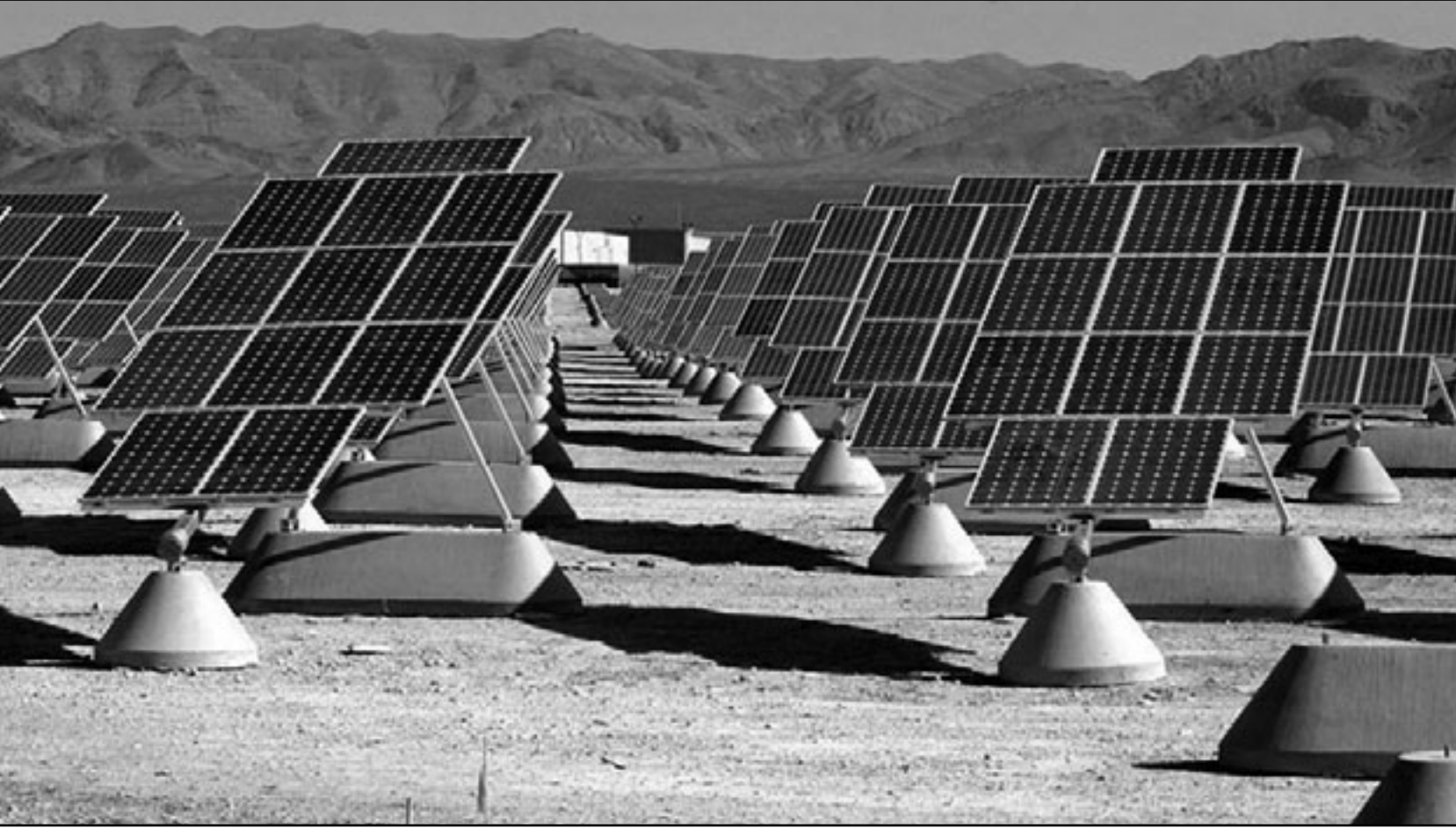
الروح للاندماق وتخزين الطاقة الشمسية من بين التقنيات التي سيتم استعمالها في مشروع ديزرتيك

هذه، «إن إنتاج الطاقة الشمسية في أفريقيا سيكون أقل تكلفة بشكل كبير بمجرد بناء البنية التحتية لـ (عملية) النقل، والشركات الكبرى لديها من الأدوات ما يمكنها من الحصول على التمويل... إذا أرادت».