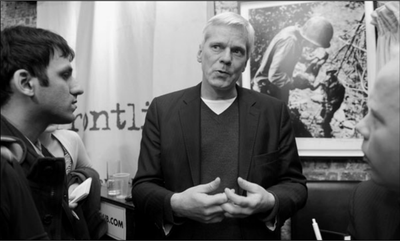
المتحدث الرسمي باسم موقع «ويكيليكس»، كريستين هرفنسن خلال مؤتمر صحافي في لندن امس

تلك العملية، فيما تتخذ وزارة الخارجية بالفعل اجراءات لتأمين وثائقها. وقالت الخارجية الأمريكية إن موظفيها غير مسؤولين عن تسريب وثائق ويكيليكس.