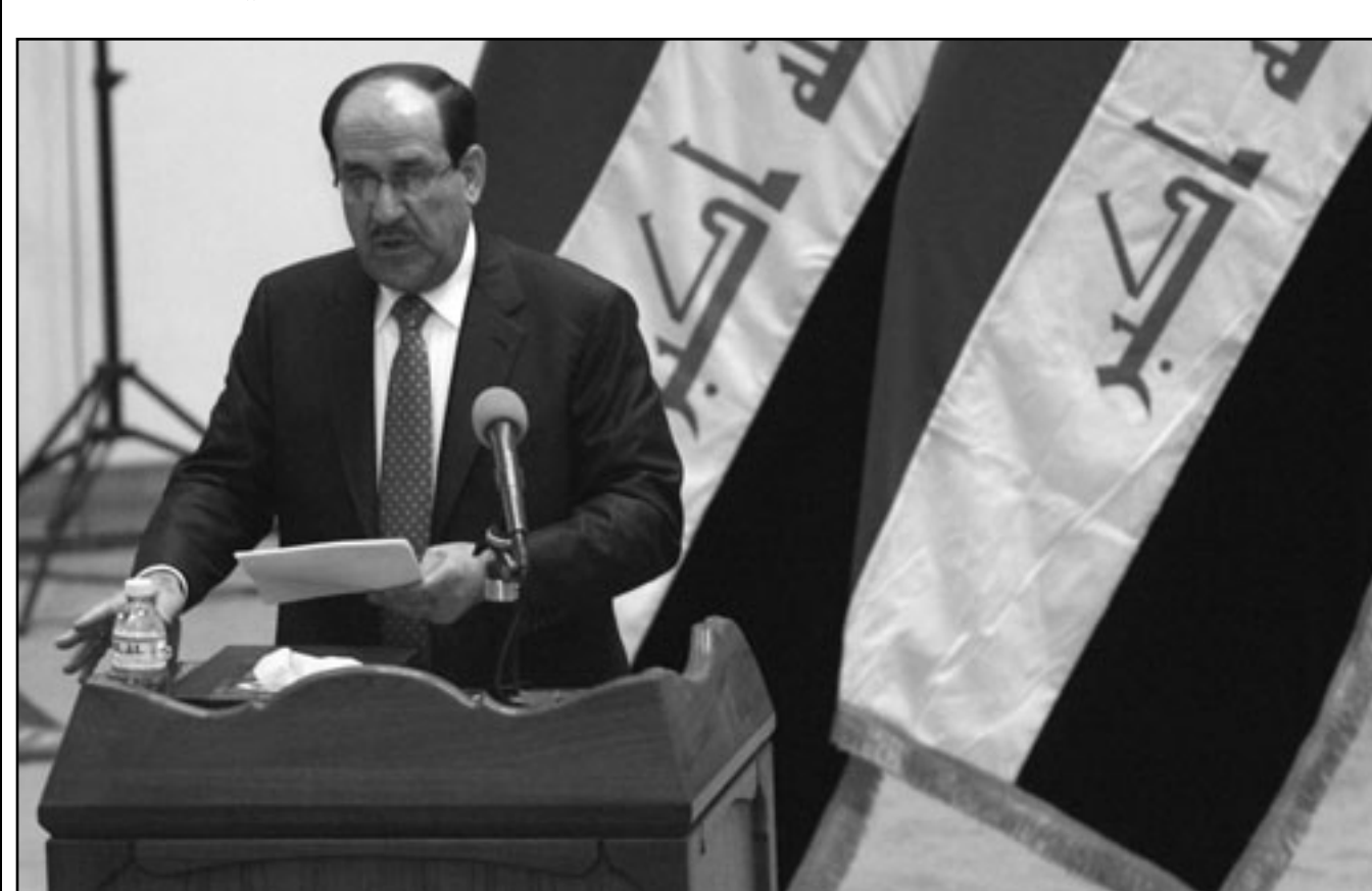
رئيس الوزراء العراقي يلقي كلمته أمام مجلس النواب

التشكيله الحكومية من أي امرأة خلافا للنائب، بينهم رئيس المجلس الأعلى الإسلامي عامر الكيبي. كما يتضمن جدول أعمال الجلسة قراءة تقرير اللجنة المكلفة بالبرنامج الحكومي وفتح باب مناقشة الدستور العراقي. وأبدت أعضاء في البرلمان اعتراضهن الشديد على خلو