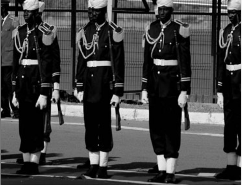
جنود سودانيين في مطار الخرطوم بانتظار وصول الرئيس المصري والزعيم الليبي امس