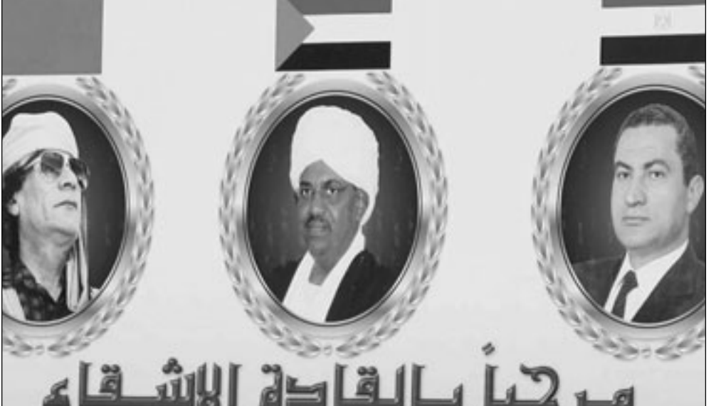
مرحبا بالقادة الإشقاه

لم تكن المعارضة في مصر تتخيل، في أسوأ تقدير لها، أن تكون هذه هي نهاية عام 2010 الذي حملت بأن يكون النسبة لها «عاما للديمقراطية». يمهد للانتخابات الرئيسية المقررة العام المقبل. كما يرى كثيرون أن عام 2010 لم يخل من أحداث وتطورات، قدر لها في الجمل أن تكون بطعم خبيث الأمل. وكان من بين الأحداث التي علماها العام جمعيته إقرار مجلس الشعب تمديد العمل بقانون الطوارئ، المفروض منذ 29 عاماً، لعامين آخرين. ورغم ما قيل عن أن تمديد العمل هذه المرة «نيولوك» جديداً للقانون بعد قصره على الإضراب والمخدرات، خرجت احتجاجات شعبية ومظاهرات تؤكد جميعها أن من حق الشعب أن يتعمد بالحرية الكاملة التي يحرمه منها هذا القانون. وقاض النكيل خلال عام 2010 بالعديد من العمال الذين ضاقوا ذرعاً بما آلت إليه ظروفهم فجأوا إلى أرضية البرلمان، ومن بين أطول هذه الاعتصامات اعتصام عمال شركة «مونستيو» للغزل والنسيج الذين كانوا يسعون إلى ضمان حقوقهم بعدما هرب مالك الشركة نتيجة تزام الديون عليه، لتقرر وزارة القوى العاملة وبنحة القوى العاملة مجلس الشعب نصفيه التشريعي وخروج العمال على العجاش المبكر، وانتهت الأزمة بموافقة العمال على اتفاق يقضي بحلهم بنك مصر، الذي آلت إليه أصول الشركة بصفته الدائن الأكبر لها، 65 مليون جنيه لصرف تعويضات للعمال. عام 2010 شهد أيضاً إجراء انتخابات غرقتي البرلمان، الشورى والشعب، وكانت النتيجة فيها ليست فقط ضمان الأغلبية للحزب الوطني الديمقراطي الحاكم وإنما كفلت له الانفراد بشؤون بلد بلفظ معظم أبنائه من الرغبة في المشاركة، وفقاً لمعدلات المشاركة الرسمية في التصويت. وشهدت مصر في حزيران/يونيو من العام الذي