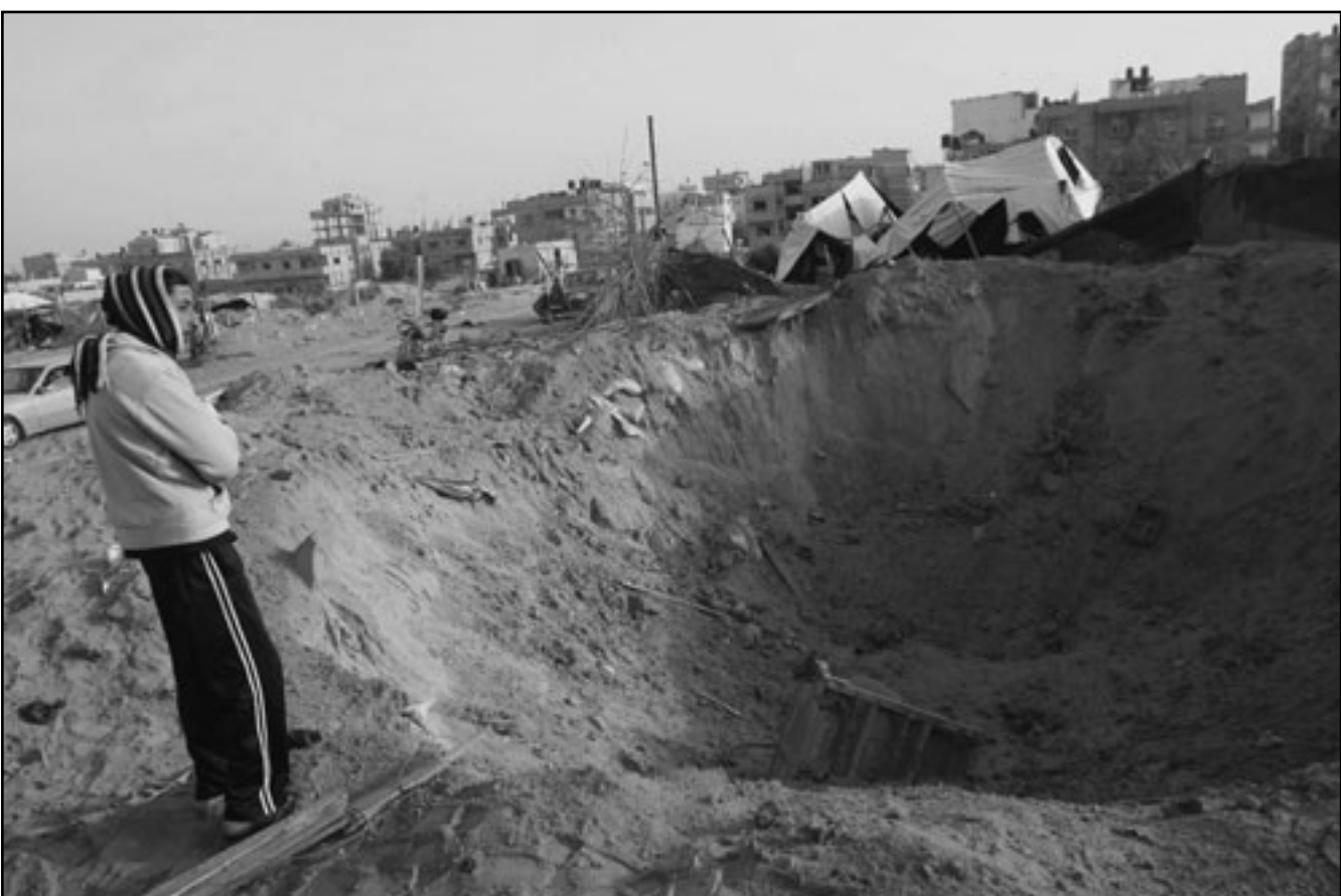
فلسطيني يتفقد آثار الدمار بعد قصف اسرائيلي لاحد الانفاق في رفح

النشطاء الفلسطينيين من غزة، ازدادت، لافتا الى ان جيشه «يعمل داخل القطاع على بعد مئات الامتار لحباط العمليات». وذكر الجنرال اشكنازي انه سجلت منذ بداية العام 118 عملية ضد قوات جيشه، وانه تم قتل 60 ناشطا في عمليات الجيش الاسرائيلي في الفترة