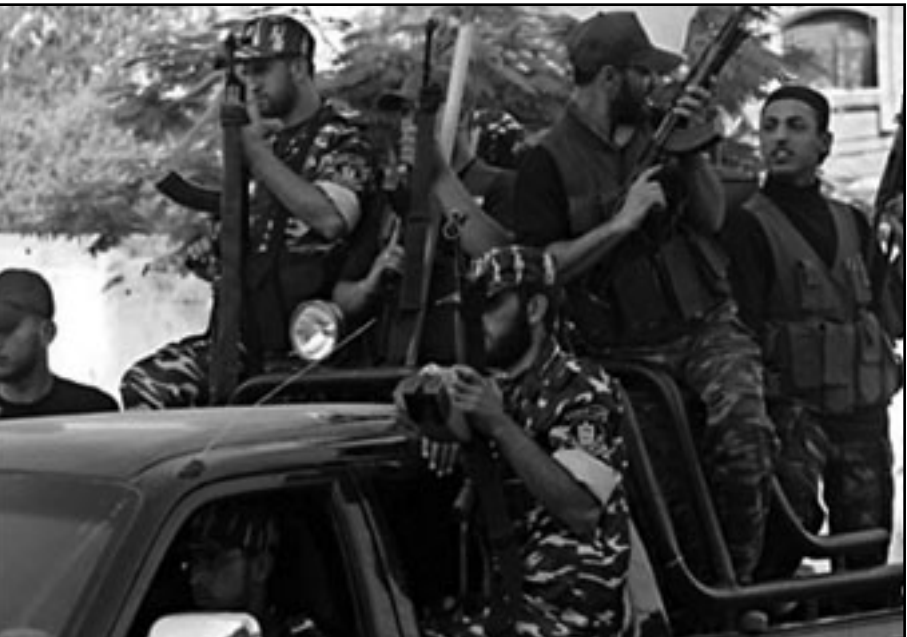
الحرب القادمة ستكون اعنف من الحروب السابقة

تسلسل سيضع الجيش هناك منذ الآن فصاعدا كثيية دبابات مزودة برع مضادة للدبابات، يُبين المرسلون العسكريون لن يعتقد ان هذه بشرى الكتيبة المذكورة في الكتيبة الوحيدة في الجيش التي تملك درعا كهده وان جيش حماس تعلم محاربة الدبابات الحرس الثوري الايراني، بعبارة اخرى؛ ان كلمات رئيس الأركان غايي اشكازي للجنود زمن زيارته الاخيرة لواقع كيسو فيم على حدود غزة: «ستقع هنا أحداث اخرى، سيستمر القتال حول الجدار وفي مجال الأمن ويجب ان تكون مستعدين»، لا يوجد مواطن إسرائيل لا يقشعر بدنه لقراءة كلمات كهده خلال الصواريخ، تفصل اسئلة الجنود عن العملية العسكرية القادمة: «جولة» ستكون اكبر وأكثر تعقيدا مما عرفنا في الماضي ومن المهم أن نتهيها بنصر مؤكد واضح.