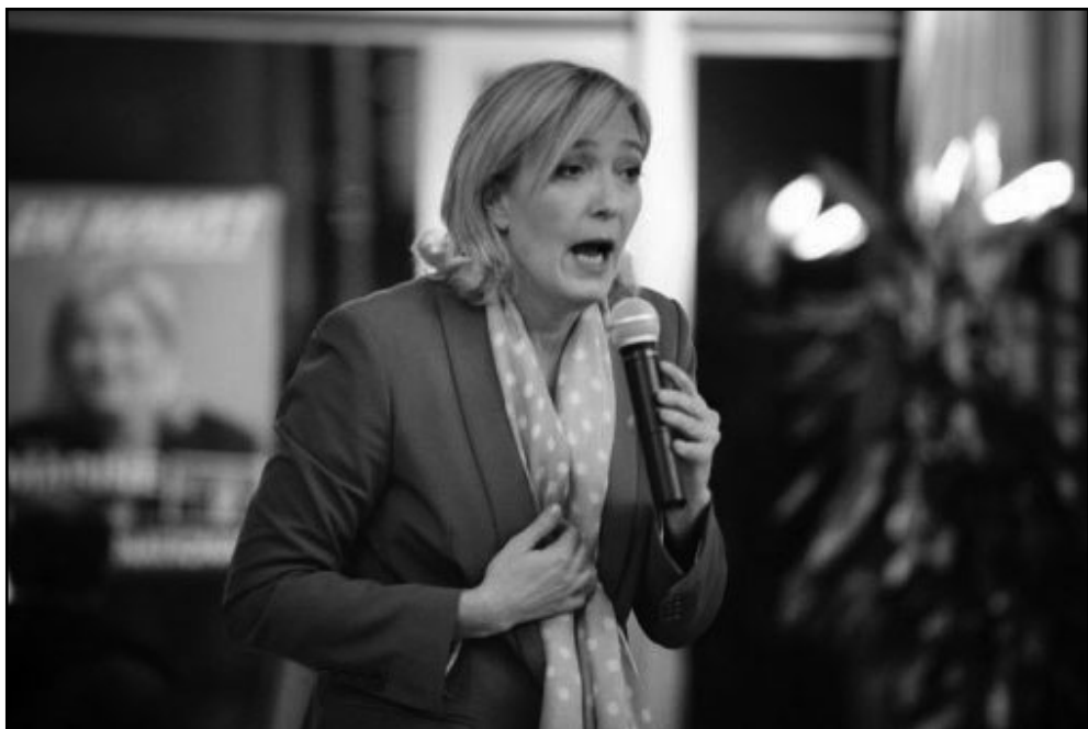
الهولندي كيرت فيلدرز والفرنسية مارين لوبان يقودان حملة اليمين الأوروبي ضد كل ما هو غير مسيحي- يهودي

استردام الاسبوع الماضي «قاقتنا تقوم على المسيحية واليهودية والانسانية (والاسرائيليين) يخوضون معركتنا». وأضاف «اذا سقطت القدس فستليها