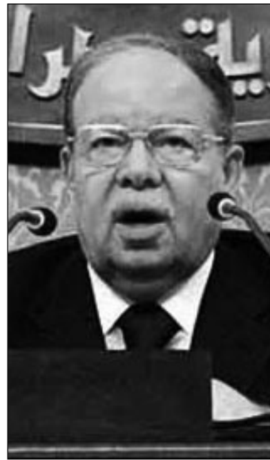
أحمد فتحي سرور