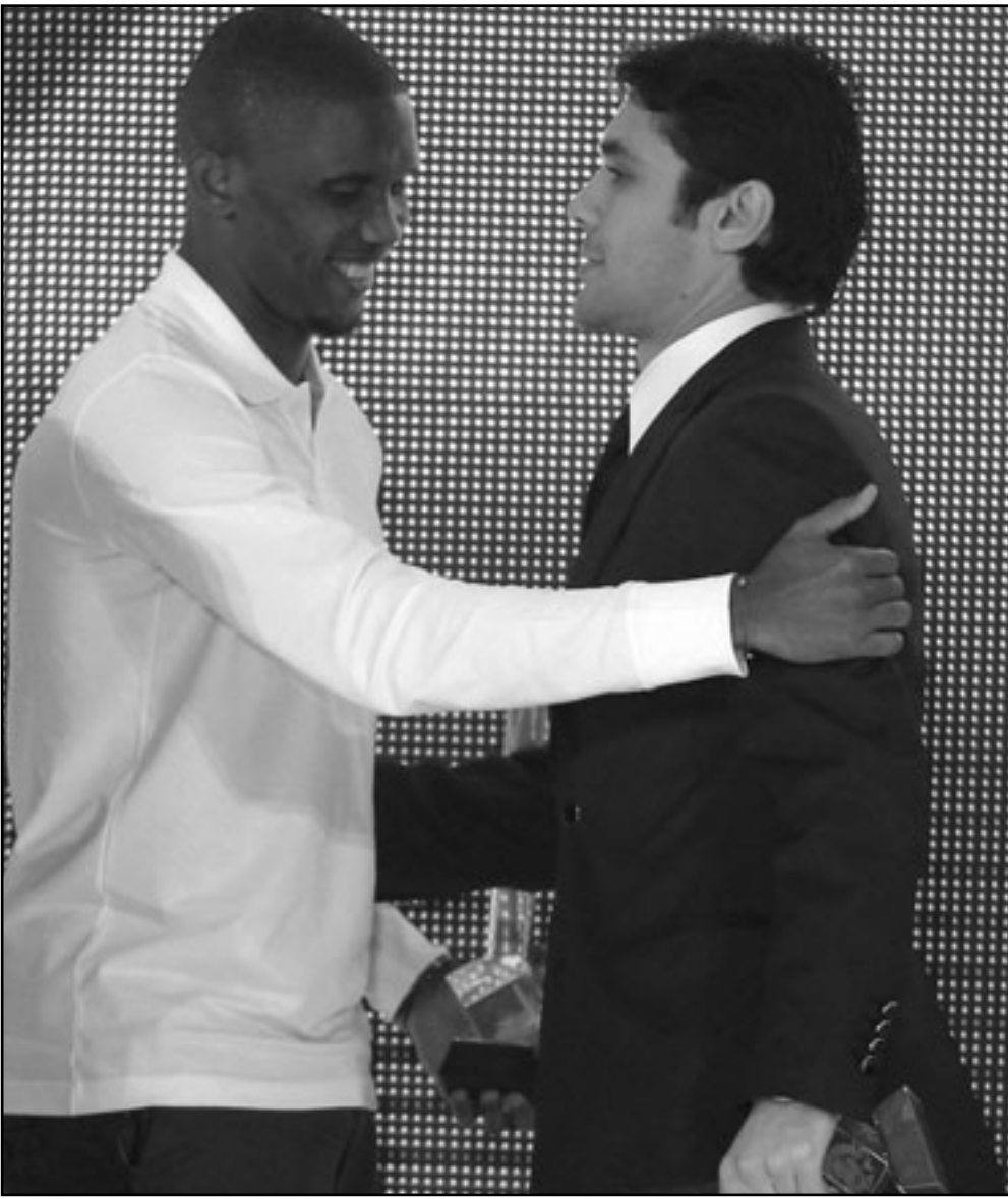
الصقر المصري احمد حسن (يمين) يتلقى تحية ملك افريقيا صامويل ايتو الكاميروني