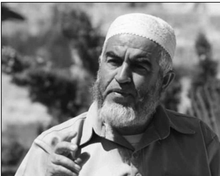
الشيخ رائد صلاح

اسرائيل، في حينه حاول أن يبني الهيكل المزعوم، ولا زلت أكثر جيداً، في خلال لقاء كان ما بين تفتياهو وما بين الرئيس المصري حسني مبارك، في تلك الأيام الرئيس حسني مبارك كشف له عن مخططات كانت قد بادرت حكومة تفتياهو إلى إعدادها من أجل بناء الهيكل المزعوم في تلك الأيام، فتفتياهو شخصية، وأنا أقيم شخصيته بناء على دراسة كل تحركاته، مرة أخرى أقول، هو صاحب مغامرات بخلفية صهيونية، ولذلك كل شيء وارد، على صعيد مخططاته تجاه المسجد الأقصى، على صعيد مخططاته تجاه غزة، تجاه لبنان، تجاه إيران، تجاه العمق العربي والإسلامي.