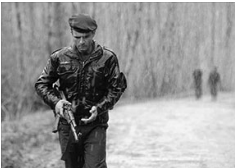
لقطة من فيلم «الصيد»

أعمال عنف في الشوارع بعد يومين فقط من مغادرة طاقم الفيلم الإيراني. وقول أي ما اراده هو ان يلمس الشيوخ العميلة التي تقسم مجتمعا لم يشهد ثورة فحسب، بل وشهد حربا استمرت ثمان سنوات وقيام دولة دينية جديدة يعتبرها المنتقدون طغيانا آخر. وقال بيترز في ندوة بعد عرض الفيلم «إيران وحده 70 في المئة من سكانها دون سن الثلاثين، ولماذا يعني أن 70 في المئة من السكان لا يعرفون ماذا كانت الثورة»، وأضاف «ثم لديك السكان الذين يحكمون والذين خاصوا الحرب، عليهم أن يتعاملوا مع مشاعرهم الخاصة بشأن ما حدث لهم، وبشأن وهاب الإضطهاد الذي يشعرون به بشأن جيش لا يفقههم، ثمة صدام بين قطعين من السكان لا يريد أي منهما أن يفهم الآخر».