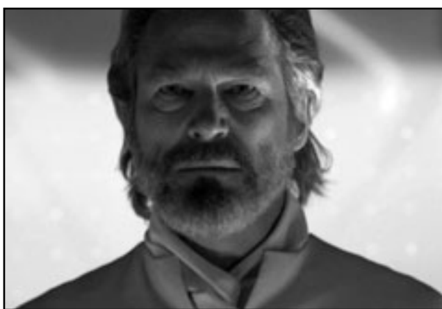
جيف بريدجز في لقطة من فيلم «إرث ترون»

واحتل المركز الأخرى على التوالي كل من: «تأخذ» سادساً (8.67 مليون دولار)، و«الجعبة السوداء» سابعاً (8.3 مليون دولار)، و«كيف تعرف» ثامناً (7.6 مليون دولار)، و«هاري بوتر وهالات الموت» تاسعاً (4.84 مليون دولار)، و«لا يمكن إيقافه» عاشراً (1.8 مليون دولار).