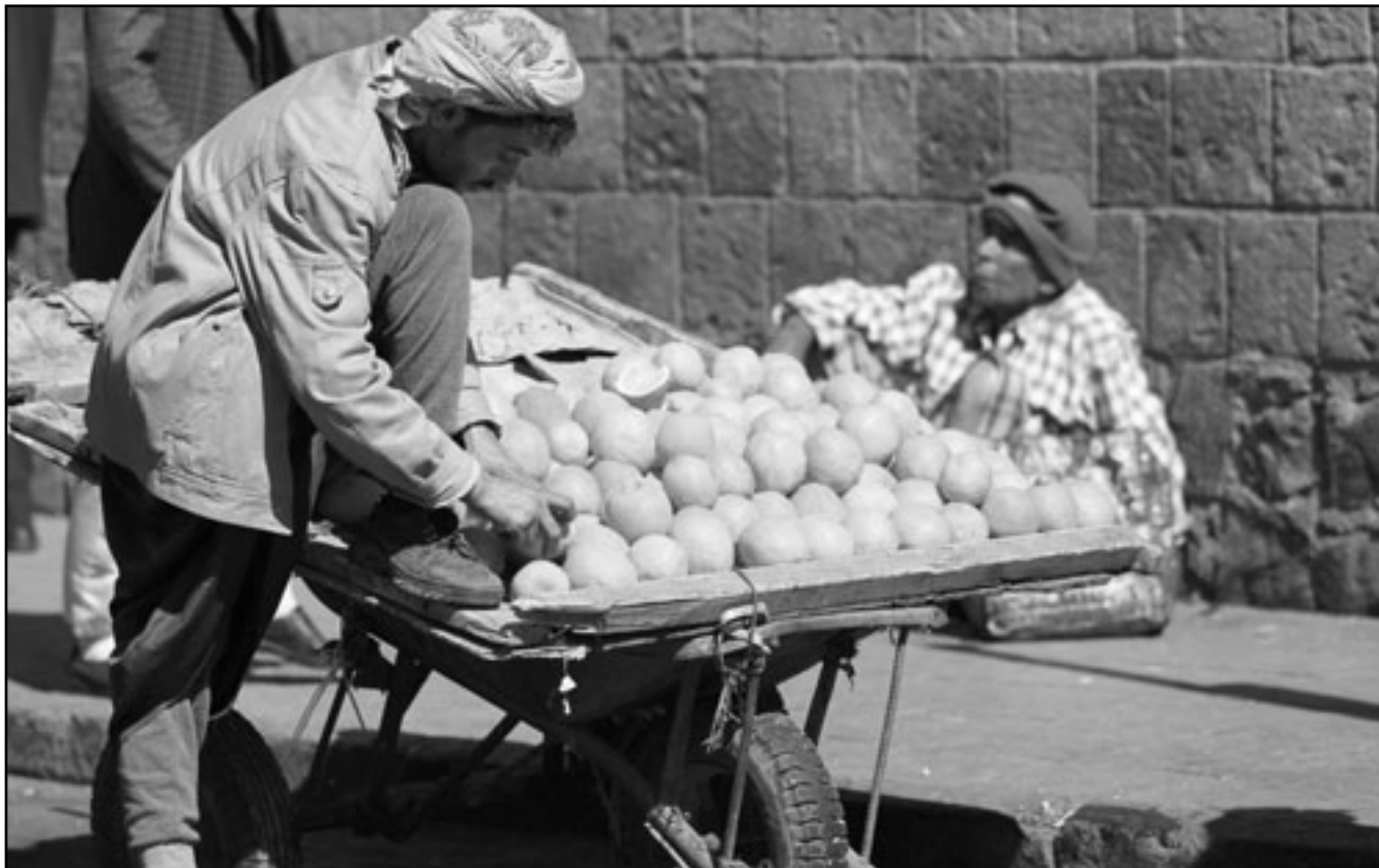
بياع يمني يبيع البرتقال في شوارع صنعاء

(باريس) يواجه صعوبات متعددة أبرزها اتساع مساحة الفقر، وتفتيش البطالة، والنمو السكاني السريع، وشح المياه، والمشاكل المتعلقة بألية الحكم. وفي المحصلة، فإن مجمل التحديات