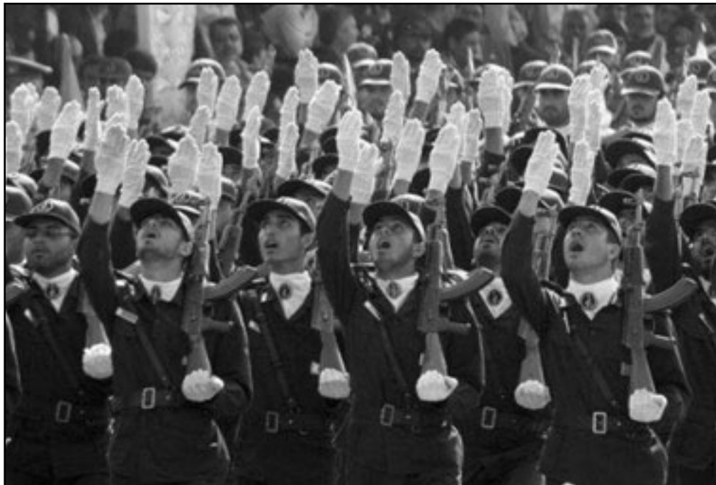
الراي العام الأمريكي يعارض فتح جبهة جديدة

تتوصل الى اتفاق دولي على وقفه! بالتوازي يُكثرون من الحديث في العالم عن الخيار العسكري، الافتراض العام هو ان هجوما عسكريا امريكا غير وارد، امريكا متورطة في حربين غير شعبيتين، في افغانستان وفي العراق، وفي ركود اقتصادي عميق. اغلبية حاسمة في الراي العام تعارض بشدة فتح جبهة جديدة، كما ان البنتاغون لهجوم على ايران ام لا، لا يعرفه سوى