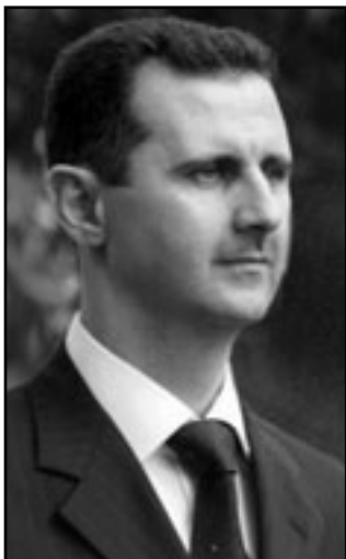
الرئيس بشار الأسد

برلين - رويترز: قال الرئيس السوري بشار الأسد في مقابلة صحافية نشرت أمس الثلاثاء إن تركيا تقوم بدور متزايد أمهيته في استقرار المنطقة في الوقت الذي تنأى فيه القوى الغربية بنفسها عن نفقة. وعندما سئل الأسد عما إذا كان يشعر بان تركيا تبعد عن الغرب وحلف شمال الأطلسي والولايات المتحدة لصالح الدول الإسلامية قال لصحيفة بيلد الألمانية اليومية واسعة الانتشار إنه يشعر أن هذه ليست مسؤولية تركيا، وقال خلال المقابلة «أقول أن الغرب هو الذي يتبعد عن تركيا».