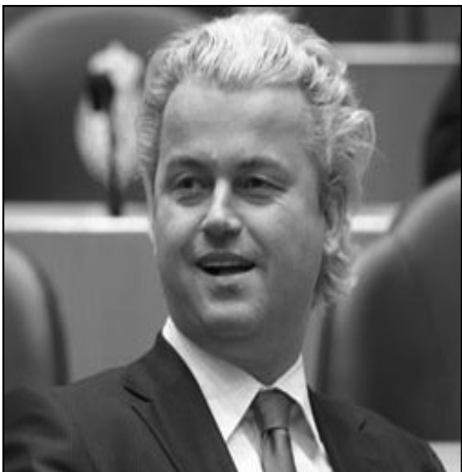
الهولندي كيرت فيلدرز والفرنسية مارين لوبان يقودان حملة اليمين الأوروبي ضد كل ما هو غير مسيحي- يهودي