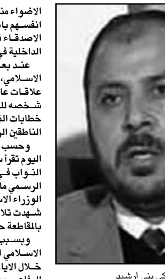
الشيخ زكي نبي ارشيد

الاضواء منه في البرلمان، أما سياسياً سمح له النواب انفسهم باطلاق تصريح جاذب للاهتمام يقول فيه: الاصدقاء في مجلس النواب يدناؤا يسابقون وزارة الداخلية في قمع حرية الرأي والتعبير. عند بعض حضور الشيخ ارشيد داخل التيار الاسلامي، يقال التالي: لو تعاقد ارشيد مع شركة علاقات عامة امريكية وبيع ملايين الدولارات لعادة خطابات النواب ومقالات صحف الحكومة وخرصته فيه الناطقين الرسميين وخلال ثلاثة ايام فقط. وحسب الباحث السياسي عمر لطفي لانه في صفحة اليوم تقرّر سياسياً وشعبياً ثلاث ملاحظات: مجلس النواب في حالة فوضى نظامية وسياسية.. الاعلام الرسمي ما زال مرعوباً ومركوباً على حد تعبير رئيس الوزراء انسعيد عبد الرؤوف الروابدة، الانتخابات شوبت تالياً غير مبرر وبإتالي قرار الاسلاميين بالمقاطعة حكيم للغاية.