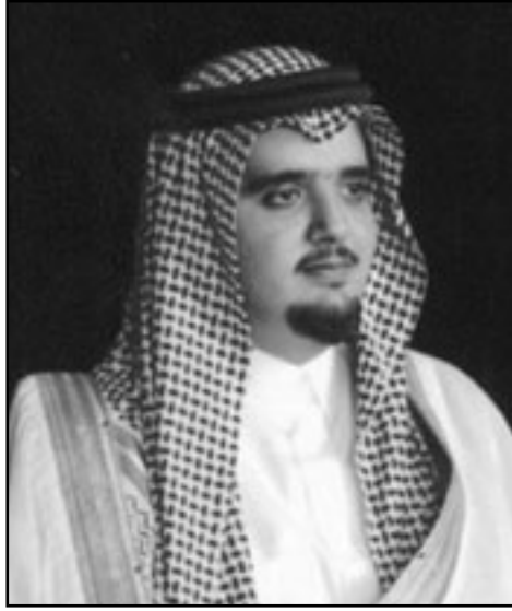
الامير عبد العزيز بن فهد بن عبد العزيز

ونظمت المؤسسة مهرجاناً للزواج الجماعي في ثلاث مدن هي الأحساء وحائل وينبع، بحيث يحتفل كل مدينة من المدن الثلاث بتزويج 100 شاب وقناة على مدار يومين متعاقبين.