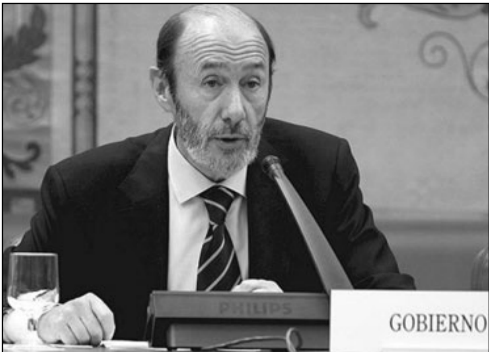
وزير الداخلية الإسباني الفريدو بيريث روبالكابا

تضاعفت في السنة الأخيرة من التغلغل في إسبانيا عمليات تنظيم القاعدة بالمغرب وفي الوقت ذاته، نقلت وكالة «أوروبا برس» أن اسبانيا عانت من عمليات تنظيم القاعدة بالمغرب الإسلامي الذي كان قد اختطف ثلاثة أسبان يعملون في جمعية غير حكومية خلال تشرين الثاني/نوفمبر من السنة الماضية، وتم الإفراج عنهم بعد شهر لقاء قديمة مالية. ويعتبر وزير الداخلية أن عملية الاختطاف هذه جعلت اسبانيا تكثف من وجودها في دول الساحل، وهو الوجود الذي أصبح في مستوى التواجد الأمني والاستخباراتي الفرنسي. ومن جهة أخرى، استبعد الوزير، وفق تقرير أمني إسباني، تغلغل القاعدة في صفوف الصحراويين أنصار البوليزاريو أو تورط بعضها في أحداث مخيم العيون. وهو بهذا يؤيد الرواية الأمريكية حول غياب علاقة بين البوليزاريو وتنظيم القاعدة، بينما يشدد المغرب على وجود علاقة وإن كانت غير مباشرة.