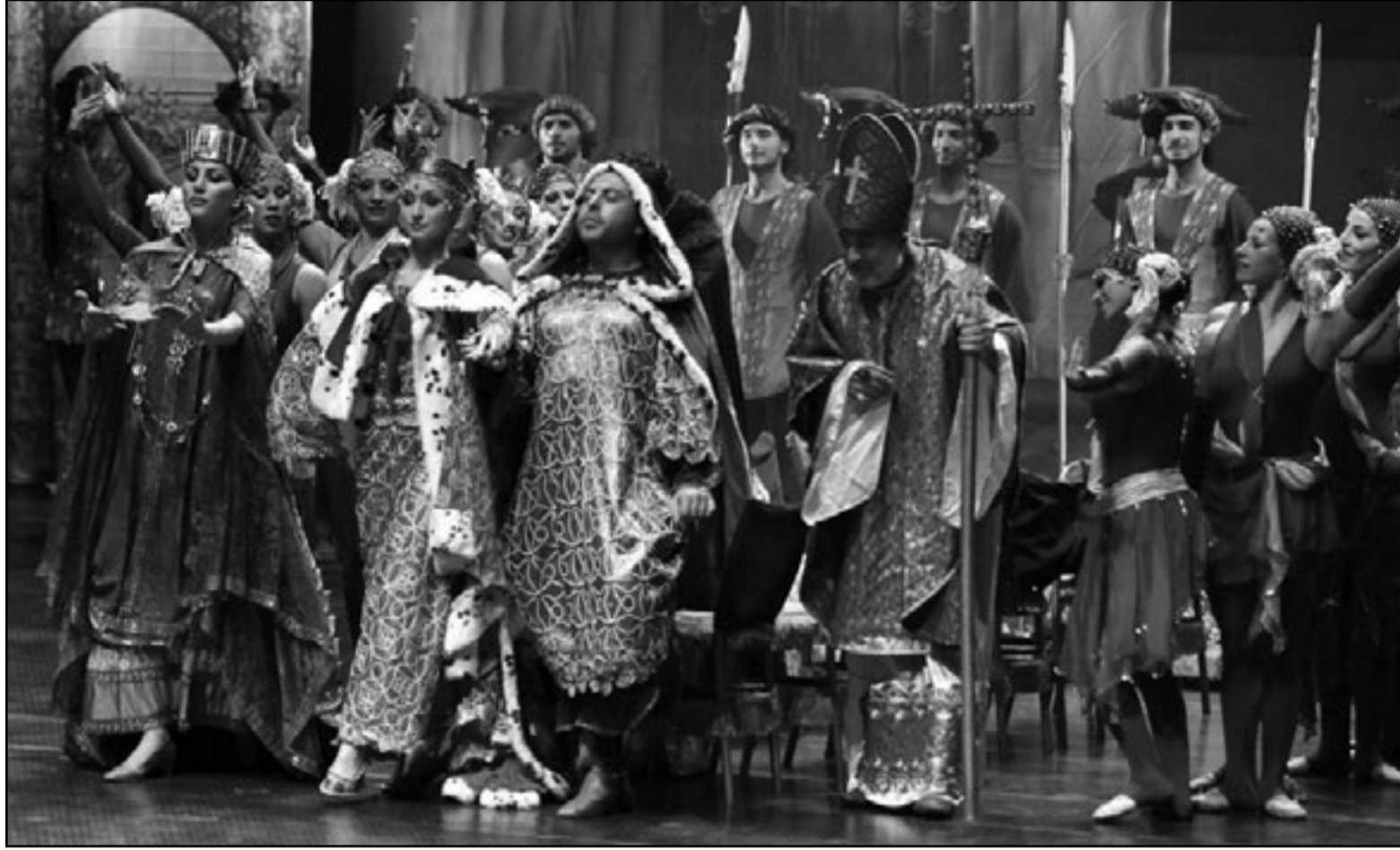
فرقة «أنا» للرقص الشعبي في حفل الختام لمهرجان دمشق المسرحي