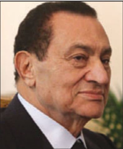
الرئيس المصري حسني مبارك

وتقول اسرائيل ان حماس تتحمل المسؤولية عن زيادة الهجمات الصاروخية وانها لم تفعل ما يكفي لمنع المنظمات الصغيرة من اطلاق النار عبر الحدود، وتقول حماس ان اسرائيل هي المعتدي الاصلي، وقال المتحدث باسم حماس طاهر النونو انه يجب على الامم المتحدة ان تصحح الموقف الذي عبر عنه سيرى الذي كان يحدد مطالبة بالحد من لاحتلال الاسرائيلي، وقال ان الامم المتحدة مطالبة باحترام حقوق الشعب الفلسطيني التي نص عليها القانون الدولي وقرارات الامم المتحدة ذات العلاقة وعدم استخدام سياسة ازواجية المعايير.