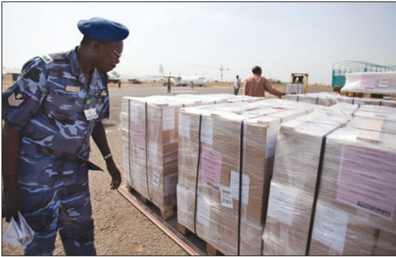
رجل امن سوداني من الجنوب يتفقد شحنة بطاقات الاستفتاء في مطار جوبا امس

ويعدو الفرع الجنوبي للحركة الشعبية، التي تتولى السلطة في جنوب السودان المتمتع بحكم شبه ذاتي، الى انفصال الجنوب، وفي حال اختار الجنوبيون الانفصال، سيستقل الجنوب في تموز/يوليو.