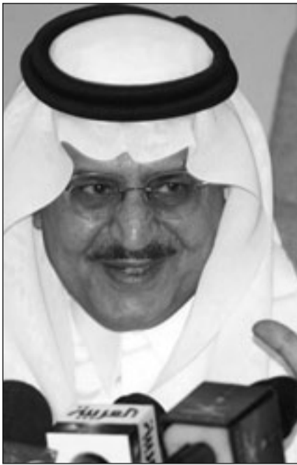
الأمير نايف بن عبد العزيز

الأثنان مثل هذه النوايا. ومن العقبان التي تواجه مبارك الابن خلفيته غير العسكرية في بلد ظل يحكمه ضباط سابقون منذ ثورة عام 1952. وشهدت مصر أول انتخابات رئاسية تعددية عام 2005. لكن طبقاً للقواعد الحالية أصبح من شبه المستحيل على أحد الترشح في الانتخابات دون مساندة من الحزب الوطني الديمقراطي الحاكم، لذلك فمن المرجح أن يجري اختيار أي زعيم جديد خلف الأبواب المغلقة وليس من خلال الانتخابات.