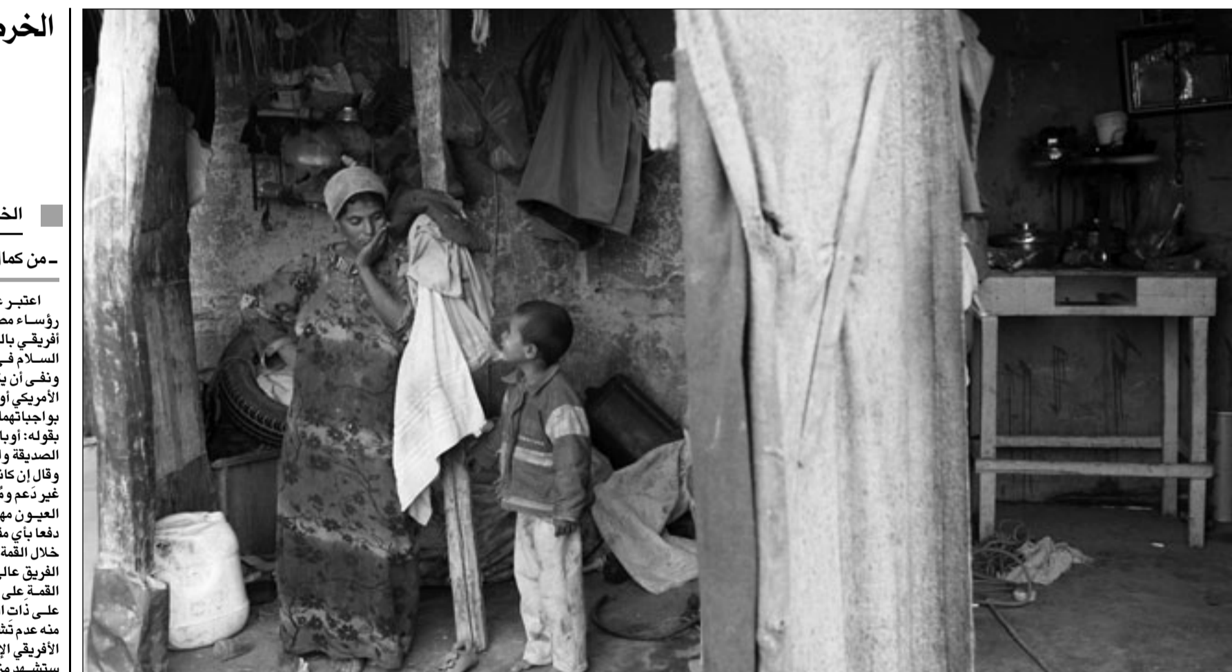
سيدة مصرية مع طفلها في مستكنها بمنطقة الجبارة العشوائية في القاهرة

اعتبر علي أحمد كرتي وزير الخارجية السوداني زيارة رؤساء مصر وليبيا وموريتانيا بداية لوجود عربي، إسلامي، أفريقي بالسودان، وتأكيداً على أن المنطقة تقف مع طرفي السلام في الاستمرار لإكمال العملية مهما كانت النتائج، ونفى أن يكون مبارك والقذافي نقلًا رسائل من الرئيس الأمريكي اوباما أو أية جهة أخرى، وقال إنهما رئيسان يفومان بأجباتهما ولا يمكن أن يكونا رسولين لجهات أخرى، وأضاف بقوله: اوباما له طرقته في إيصال رسالته، وإن رسائل الدول الديمقراطية والشقيقة مختلفة عنها لأنها تدعم ومساندة، وقال إن كانت لأوباما أهداف أخرى، فليست لهذه الدول أهداف غير دعم ومساندة السودان الذي أكد أنه سيبقي في حدقات العيون مهما كانت النتائج، ونفى أن يكون مبارك والقذافي ندعا بأي مقترحات جديدة لحل القضايا العالقة بين الشريكين خلال القمة، وقال إن الجميع ارتضوا بالوساطة الأفريقية عبر الفريق عالي المستوى برئاسة تأسو امبيكي، مُشيراً إلى تأكيد القمة على ضرورة ارتباط الشريكين بالوسيط والعمل معه على ذات النهج، معتبراً عدم الدفع بمقترحات جديدة الغرض منه عدم تشتيت الجهود، واعتبر القمة جزءاً من التوافق العربي الأفريقي الإسلامي لمساندة السودان، وكشف أن الأيام المقبلة ستشهد مزيداً من الوافدين لدعم الشريكين والتأكيد على أن السلام الذي سيعا إليه يضم كل المنطقة، وقال إن القمة رسالة قوية للمجتمع الدولي بضرورة وقوفه مع السودان في هذه المرحلة والسعي لسلام في دارفور من خلال دفع الأطراف في اتجاه الحل، وتوقع كرتي في هذا الخصوص حدوث اختراق في ملف دارفور خلال الفترة المقبلة تكون على إثره كل ملفات السلام في السودان بلغت النهايات، كما أن القمة تبعث برسالة أخرى حتى لا يشعر السودان بأنه معزول والتأكيد