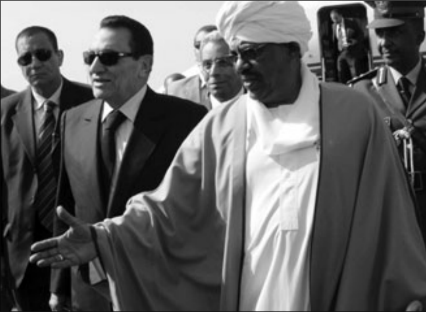
الرئيس السوداني عمر البشير اثناء استقبال الرئيس المصري حسني مبارك في مطار الخرطوم امس الاول

القاهرة - يوبى: التقى الرئيس المصري حسني مبارك أمس الأربعاء البابا شنودة الثالث، الزعيم الروحي للاقباط الارثوذكس في مصر، لأول مرة عقب فترة توتر بين الكنيسة والدولة. وقالت مصادر مطلعة ليونايدي برس انترناشنال ان مبارك التقى ايضا برئيس الوزراء احمد نظيف ووزير الدفاع المشير حسين طنطاوي. وكانت «أحداث العمرانية» هي السبب الابز مؤخرًا لتوتر العلاقة بين الكنيسة القبطية والدولة في الشهور الماضية. وكانت اشتباكات دامية بين قوات الامن والمظاهرين الاقباط اندلعت في 24 تشرين الثاني/نوفمبر الماضي بين مظاهرين اقباط وقوات الامن مخلفة قتلين في صفوف المظاهرين، اضافة الى عشرات