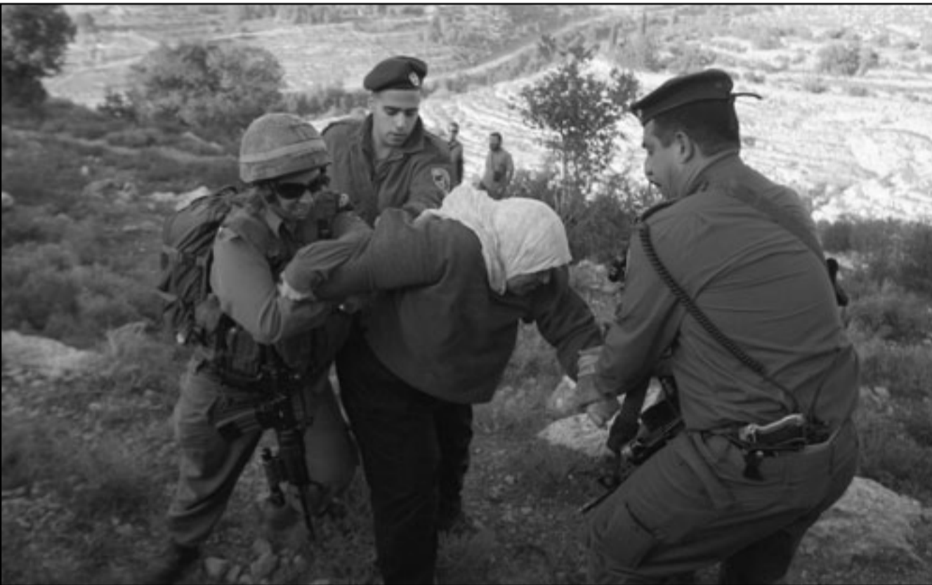
جنود إسرائيليون يحاولون إبعاد فلسطينية خلال تظاهرة ضد الاحتلال في بيت لحم

ويوم اسن قصفت قوات الاحتلال المتمركزة على الشريط الحدودي شرق مدينة غزة، اراضي فارغة شرق حي الزيتون بعشر قذائف مدفعية، دون وقوع اصابات، وتزامن القصف مع تطبيق مكثف لطائرات الاستطلاع في سماء المدينة.