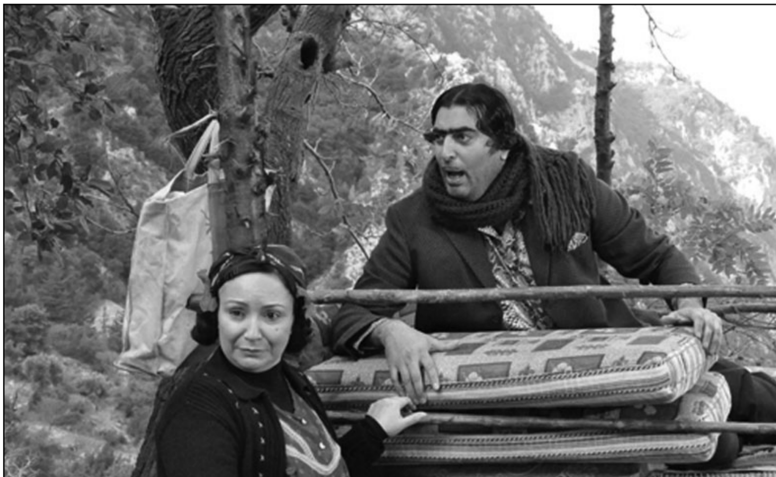
لقطة من مسلسل «ضيعة ضايعة»

جاء في تقرير التنمية الثقافية العربية الثاني أن المسرح الذي تبنته الدول وأصبح جزءاً من المؤسسة الرسمية لم يجتهد نفسه أليات تطور تسمح له بالتعامل مع المسجديات السياسية والاجتماعية. ويعتبر التقرير أن ثمة إشكالية أساسية لدى المؤسسات المسرحية، تتجلى في تهمؤ البنى الثقافية التي تشجع لوجود المسرح في المجتمع، ويشير إلى أنه، ولأسباب عديدة، خرج المسرح العربي إلى فضاءات جديدة تنتمي إلى الحياة اليومية كالشوارع والأقضية والأفانق والبيوت، وهي الحال التي تنطبق