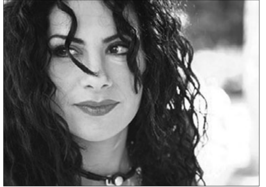
صبا مبارك في لقطة من فيلم «مدن ترانزيت»

يحفظها اليمنيون جيدا، مبعث فخر. وفي وقت لم يعد تاريخه المعاصر يصنع انجازا يحتق به، وكل الاخبار تقول عنه انه يمن بائس، فان اهله يعلمون بانته ليس بائسا لهذا الحد، وان بوسعهم سماع وصنع اخبار اكثر بهجة.