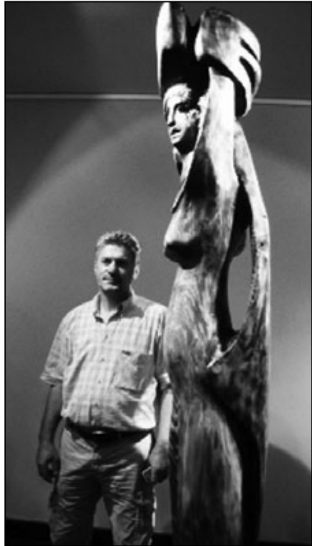
ملقني النحت على الخشب