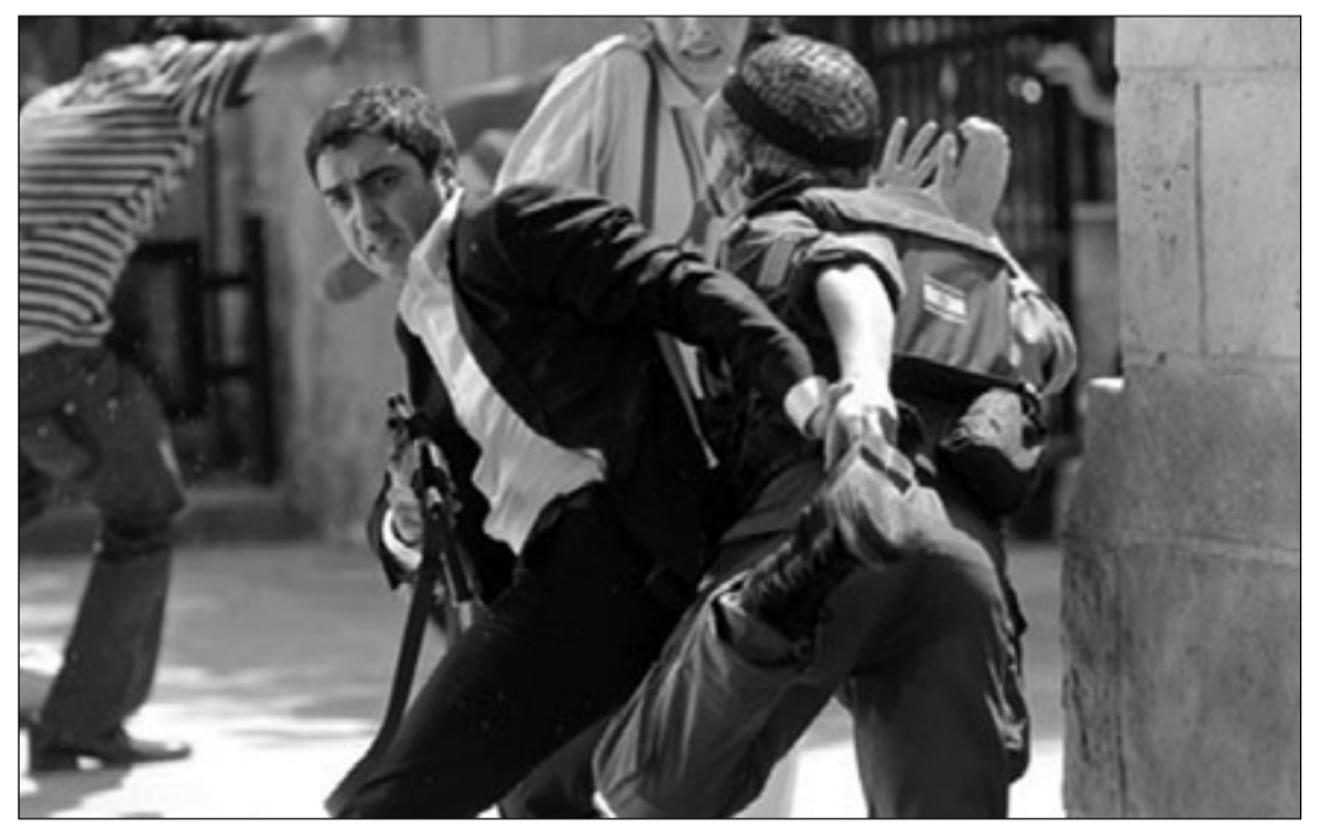
لقطة من فيلم «وادي الذئاب» فلسطين»