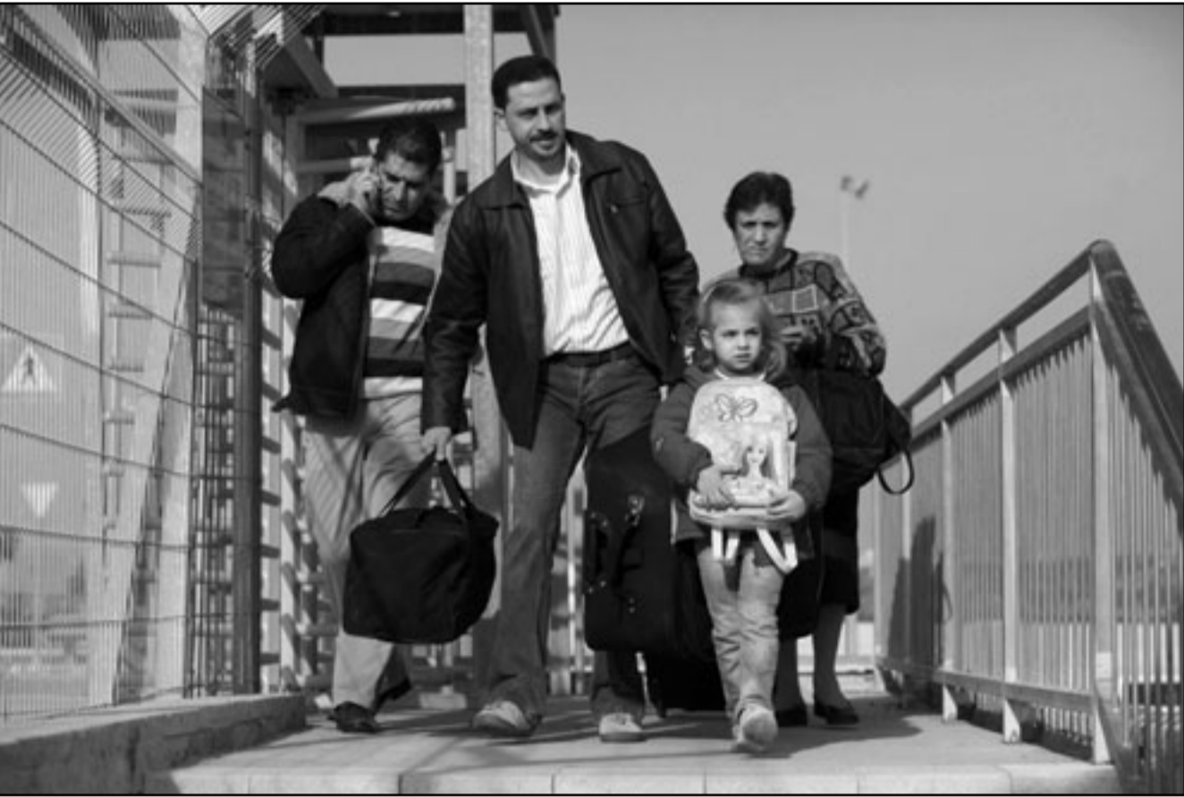
فلسطينيون يعبرون من معبر إيريز في غزة في طريقهم الى بيت لحم للاحتفال بعيد الميلاد

ورد على سؤال حول صحة الأنباء التي تردت عن فتح في وقت سابق عن مقترح تقدم به محمد دحلان عضو اللجنة المركزية في حركة فتح للدخول على خط المصالحة باعتباره «الرجل الأقر» على إبراهيم. وقال «دحلان وسقط عدد من الإخوة طالباً بأن يفتح له الباب من أجل إنهاء ملف الانقسام الفلسطيني مدعياً بأنه هو الأقر على ذلك، ولقد أرسل مقرها بذلك، وحماس رفضت التعامل مع دحلان واعتدلت في المضي به».