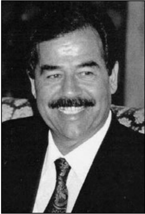
الرئيس الراحل صدام حسين