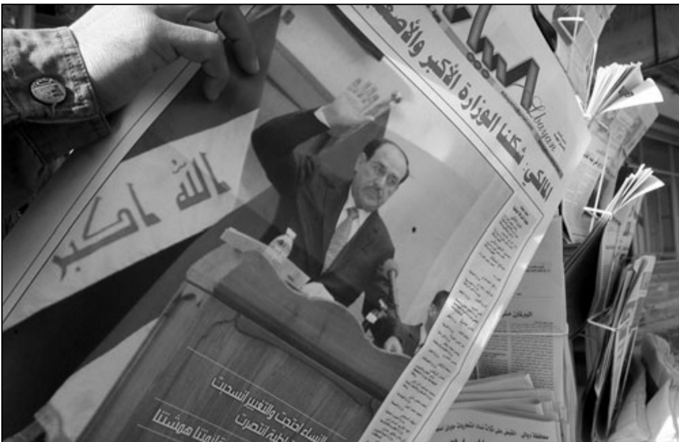
صحيفة عراقية نشرت خبر تشكيل الحكومة امس