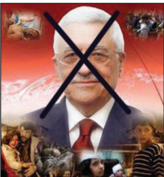
صورة صفحة الرئيس عباس كما ظهرت على الفيس بوك

وتابع دحلان «رغم أن الرئيس عباس شكل لجنة متابعه لإسقاط من قدمه وقمت بالرد على جميع أسئلة اللجنة وذهبت اللجنة بإجاباتي إلى الرئيس محمود عباس إلا أن نتائج تحقيق هذه اللجنة لم تعجبه فقام بتحويل ذل إلى لجنة التحقيق».