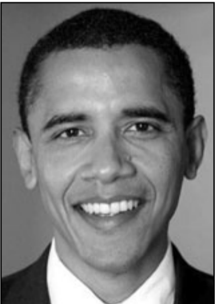
اوباما لا تعنيه الديمقراطية بالشرق الاوسط