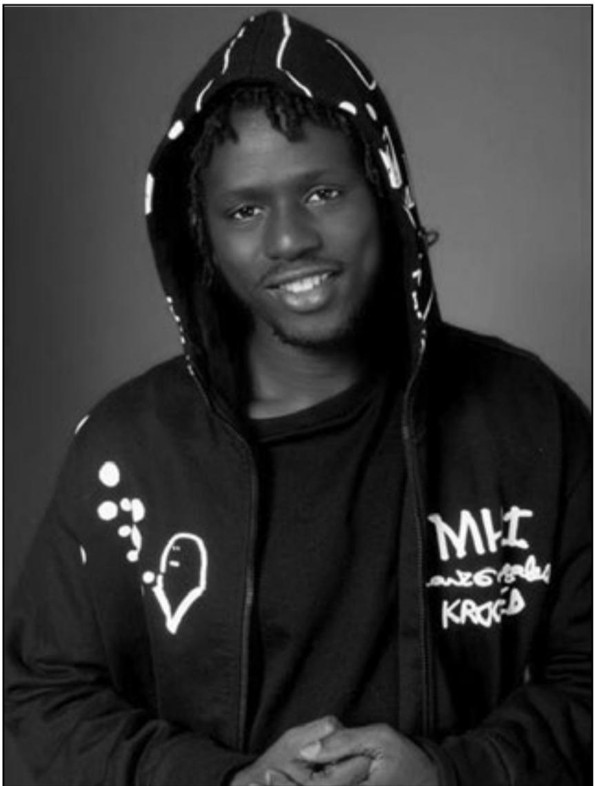
مغني الراب ايمانويل جال

ويظهر نجما الموسيقي البشيا كيز وبيتر جابرييل والممثل جورج كلوني والامين العام السابق للامم المتحدة كوفي عنان والرئيس