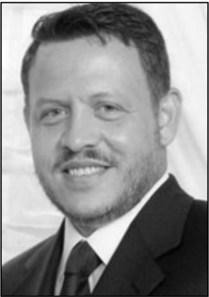
الملك عبد الله، لا للحوار الامريكي مع ايران