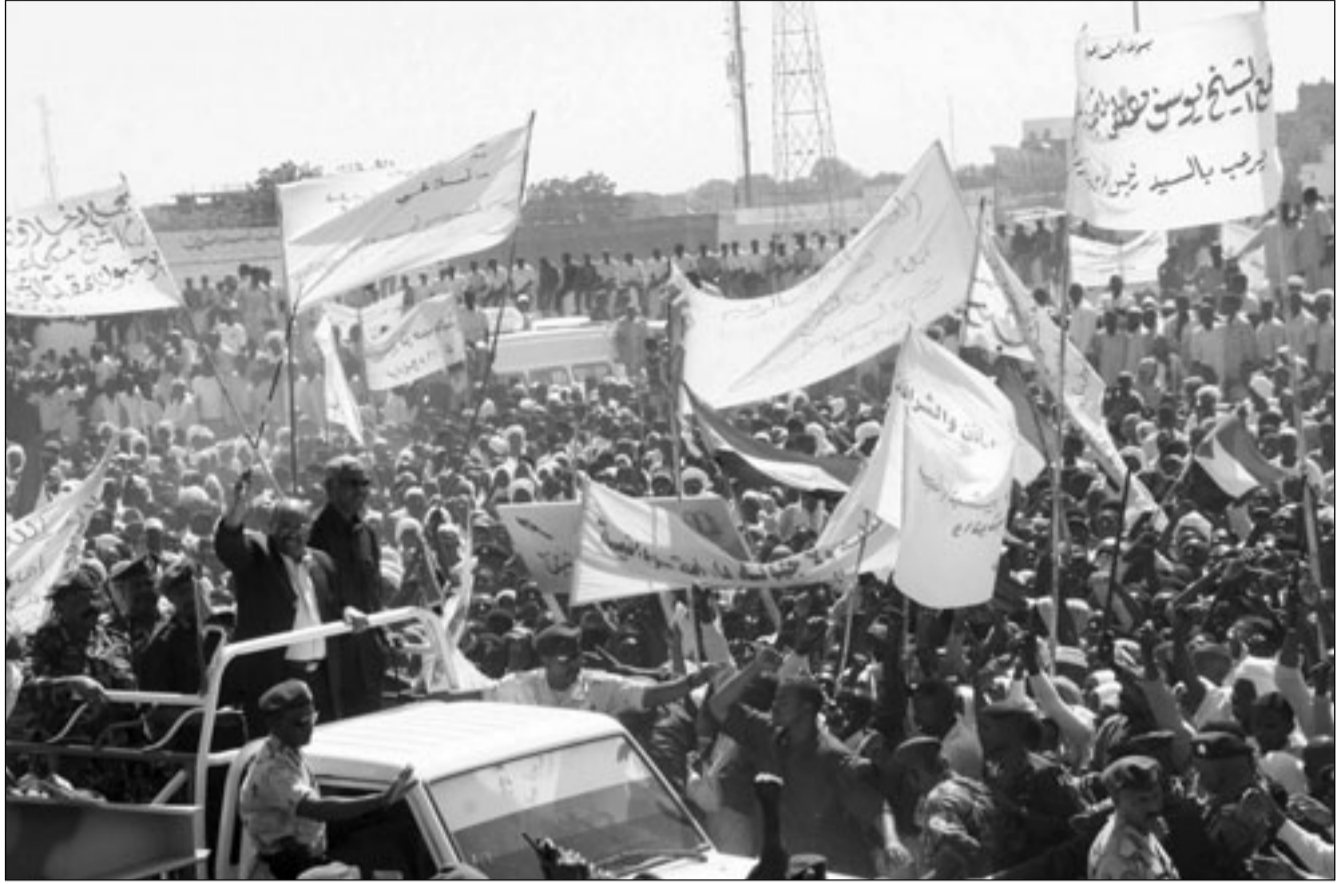
الرئيس السوداني عمر البشير اثناء زيارة لجنوب السودان أمس

وفي السياق طالبت الحكومة، الأمم المتحدة بموافاتها بتقرير مفصل عن مزاولة الحسابات المتعلقة بأوجه صرف أموال برنامج نزع السلاح والتسريح وإعادة الدمج الموجودة بطرف برنامج الأمم المتحدة الإنمائي UNDP، وأبلغ العميد عثمان نوري السكرتير التنفيذي للمجلس القومي لتنسيق نزع السلاح والتسريح وإعادة الدمج، ممثل برنامج DDR ببعثة الأمم المتحدة رفض الحكومة للتخصيص الذي قدمه برنامج الأمم المتحدة الإنمائي بشأن تقرير المراجعين المستقلين الذين عينتهم المنظمة الدولية في أعقاب مطالبة