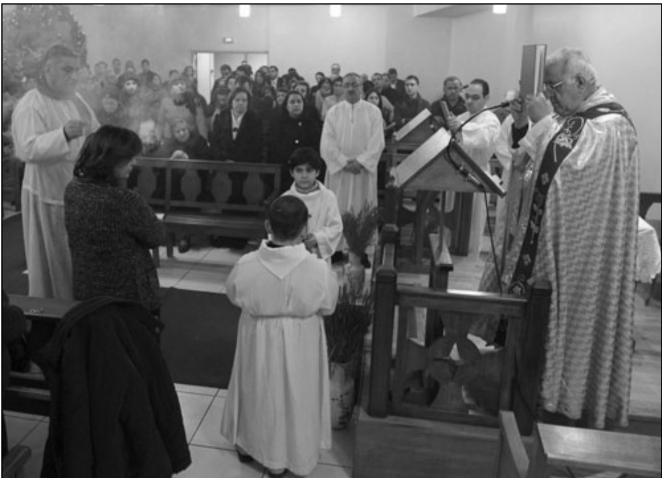
عراقيون خلال الاحتفال باعياد الميلاد في بغداد