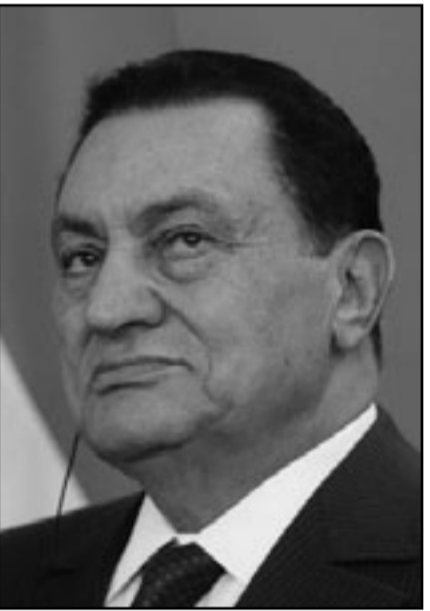
مبارك يكن عداء شديدا للايرانيين

بان يتقدم في خلق أدوات اقليمية لمعالجة مواضيع مثل المياه، الطاقة والمواصلات وبذلك يساعد في تنمية اقتصادية في جزء من الصراع بين المعسكرات القطبية في الشرق الاوسط، لهذا السبب على اسرائيل ان تتبنى استراتيجية عمل فاعلة ولا اكتفي بالاستمرار بقرعة البرقيات السرية، التي تثبتت انه لا يفتح المعسكر المعتدل - المحالف في العالم العربي، ايران هي المشكلة الوجودية وليس بالذات الموضوع القطبتي.