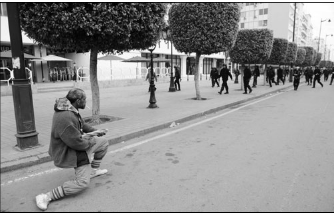
تونس اختار مواجهة قوات الأمن على طريقته في مظاهرات الاحتجاج على الحكومة أمس

صارمة في عهد بن علي ويقول كثير من السياسيين انهم تعرضوا لمضايقات ولم يسمح لهم بالقيام بحملاتهم بحرية. وفر بعض السياسيين الذين ينتمون للمعارضة للاقامة في المنفى وان كان بعضهم عُين في الحكومة الجديدة.