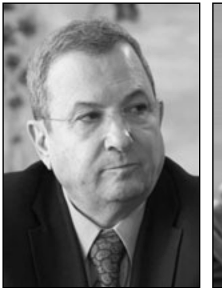
باراك يميني متطرف خطر