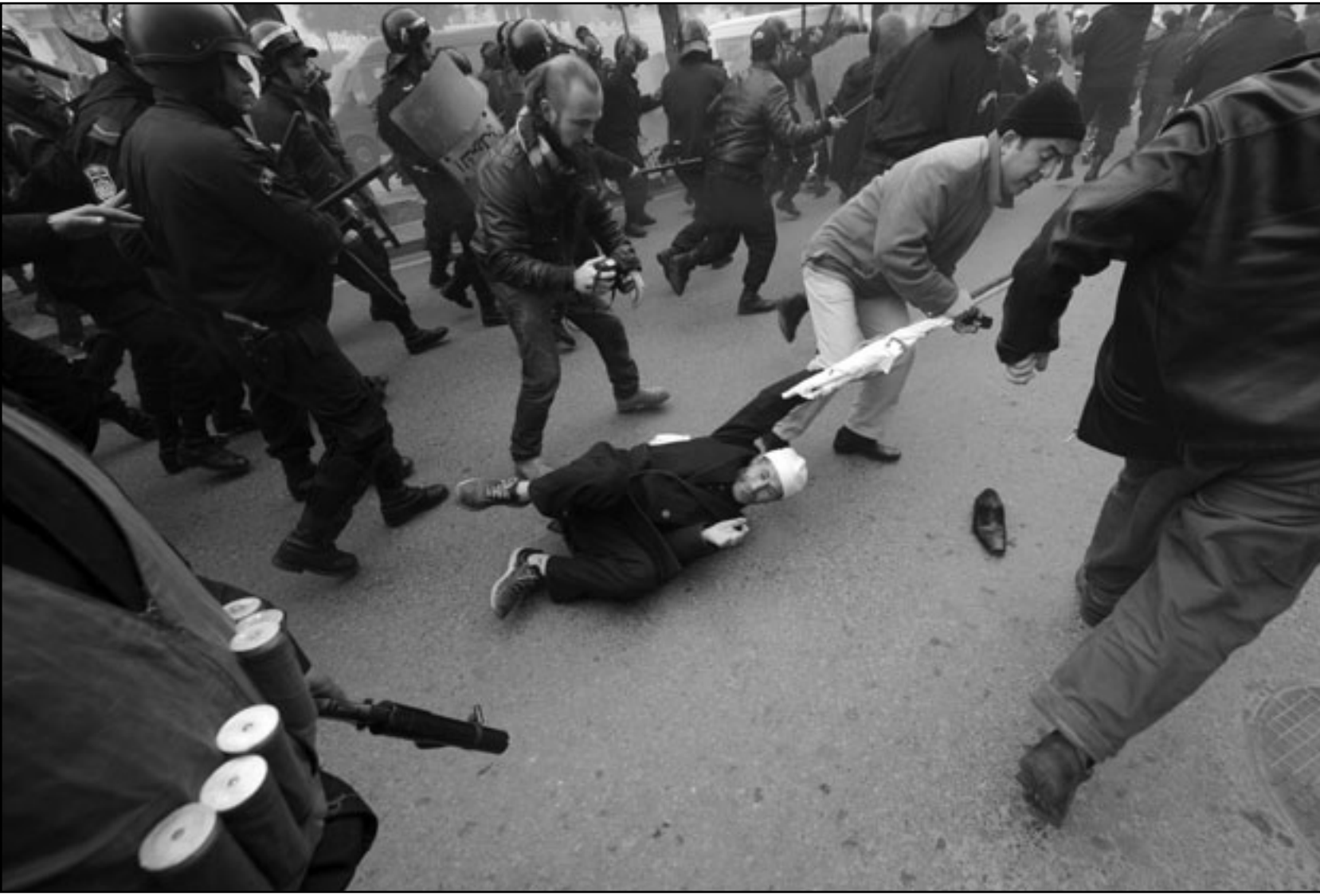
رجال أمن بالزيين الرسمي والمدني يحاولون السيطرة على متظاهرين بشوارع العاصمة أمس

الاسلامي. ونقل موقع التلفزيون الإيراني عن لاريجاني قوله «على العالم الإسلامي ان يصغي الى صرخة الشعب التونسي (...) التي تترجم بوضوح الاستياء من سنوات طويلة من الديكتاتورية». وقر الرئيس بن علي الجمعة من تونس بعدما حكم البلاد 23 عاما بقبضة من حديد، اثر شهر من التظاهرات والاحتجاجات واجهها بقمع دام وقع 78 قتيلا وفق اخر حصيلة رسمية.