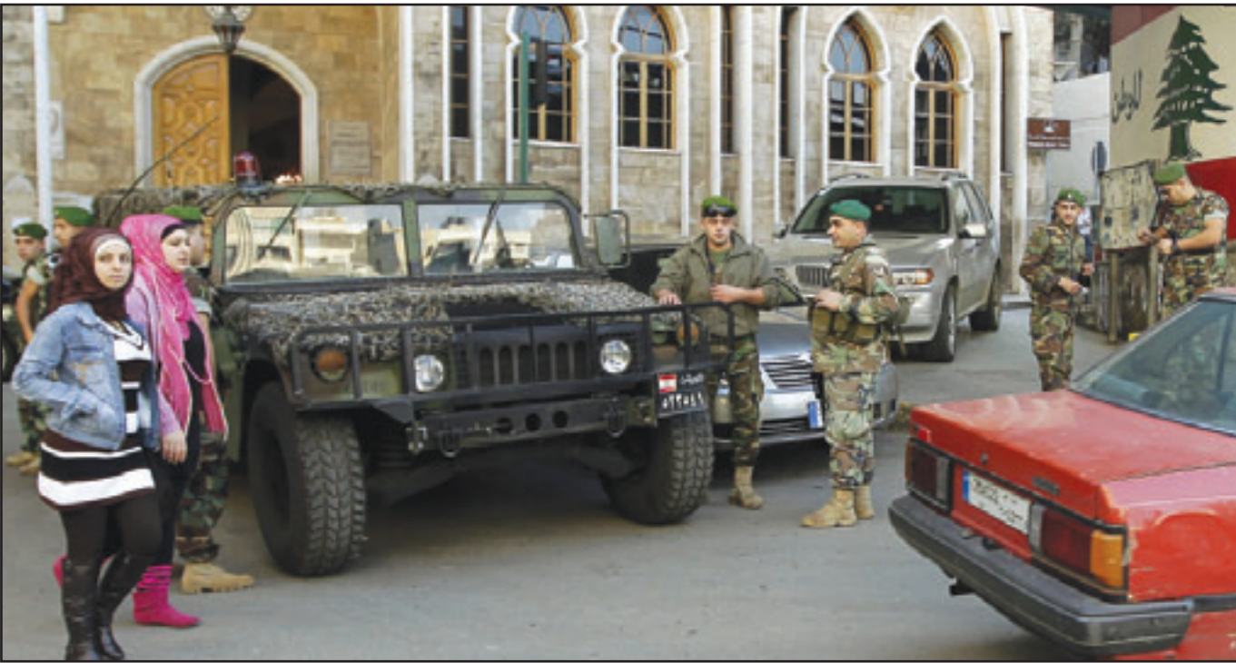
دورية عسكرية وعناصر من الجيش تنتشر في احياء بيروت

السوري يشار الاسد قائد الجيش اللبناني العماد جان فهوجي ما اعتبر نوعاً من رسالة لعدم تدخل الجيش لمنع أي تحركات للمعارضة والوقوف على الحيد. وأفاد مصدر مقرب من رئيس المجلس اللبناني نبيه بري انه اثر الإعلان عن صدور القرار الطلبي حصلت تحركات شعبية عفوية في بعض المناطق منذ ليل أمس ما استدعى تدخل الرئيس بري للعمل حتى ساعات الصباح الأولى لاستيعاب هذه التحركات واحتواء الوضع وذلك عبر الاتصال بقيادات عديدة. وكان الرئيس بري أكد «ان رئيس حكومة تصريف الاعمال سعد الحريري أخفا في عدم الإعلان عن التزامه بشيود التسوية السورية السعودية السابقة»، مشيراً الى «ان قرار المعارضة، بأن مرحلة ما قبل إصدار القرار الاتهامي تختلف عما بعده، ودخل حيز التنفيذ». وقال «ان المعارضة التي طالنا حذرت من الماطلة في امر وطني حساس إلى هذه الدرجة، تكون قد نعتت تلقائياً التسوية الماضية، وصار لزاماً البحث والتفاوض على