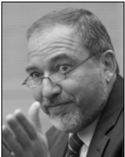
ليبرمان اكثر الراجحين من تفكك حزب العمل

فألصوت صوت ميرتس واليدان يدا الليكود، فهو يقاوم التهرب من الخدمة العسكرية ويموله أيضا. ويؤيد تهويدا أكثر حرية ويؤيد كل طرف حريدي أيضا.