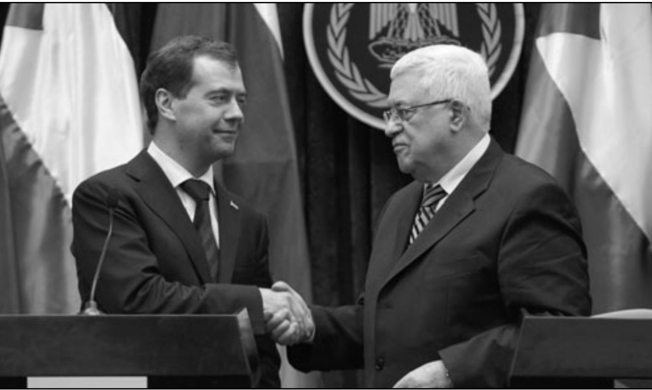
الرئيس الفلسطيني محمود عباس ونظيره الروسي ديمتري ميدفيديف خلال مؤتمرهما الصحافي في أريحا

السياسية الروسية على رأس وفد يتجاوز الـ100 شخص حضروا إلى فلسطين. ومن جهتها رحبت حركة «فتح» بزيارة ميدفيديف واعتبرتها نجاحا متميزا للسياسة عباس حيث وصفت الزيارة بالثابته. وأكد المتحدث باسم فتح احمد عساف في تصريح صدر عن مفوضية الإعلام والثقافة الثلاثاء على «الأهمية الخاصة التي توليها الحركة لزيارة الرئيس ميدفيديف كونها تأتي بنفس الوقت الذي قررت فيه القيادة الفلسطينية التوجه إلى مجلس الأمن من أجل استصدار قرار لتجريم والغاء الاعتراف على كل الأراضي الفلسطينية المحتلة وفي مقدمتها القدس».