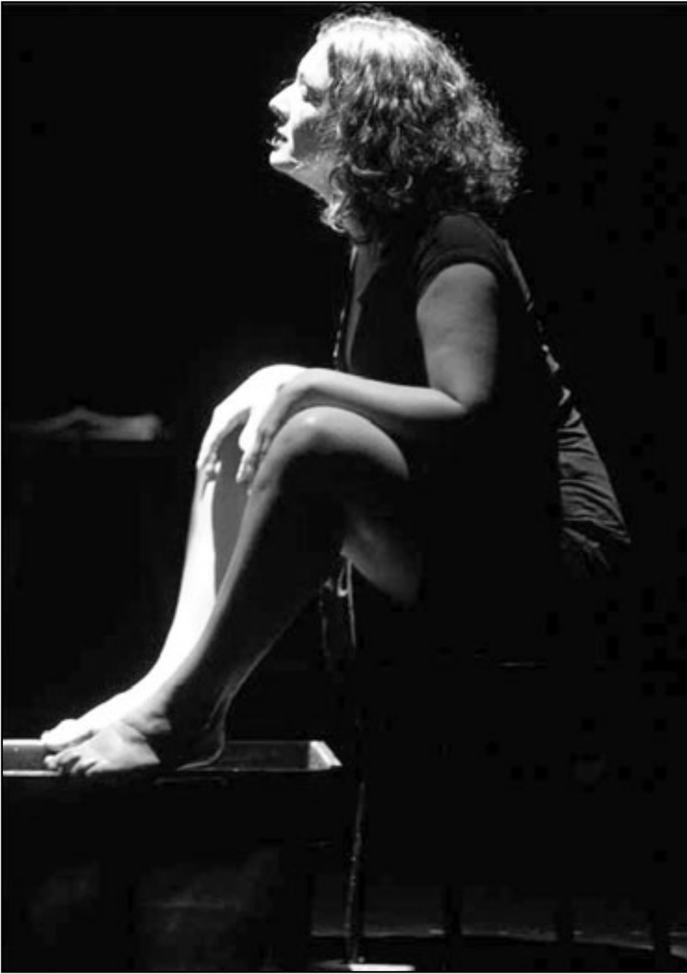
مشهد من مسرحية «طقوس الاشارات والتحويلات» (القدس العربي)

في المشهد الخامس من المسرحية يتأمل الملك الجديد «أبو عزة» بلبسة الفيل بنظرة يملؤها الشيق ويقول للسيف: «أيتها السيف قل لي بعيني واجعل يظلمك في متناول يدي وتنفذ في مسامي حتى يندغم وأحدنا بالأخر الملك والبلطة.. الملك هو الذي سينفذ الأحكام التي يصدرها لا شيء يظهر للملك مثل الدم.. سأغفلس بالدم.. سأستحجم هذه.. وقد حدد ونوس علاقة المواطن بالسلطة في بداية مسرحيته «الملوك هو الملك» بأنها علاقة حرب فهي حرب بين التسامح والموثوق بين الرعايا والعمامة من جهة، والسادة من جهة أخرى. الفلحة الأولى تطالب دائماً ولا تمل من فرض الموعظ، أي حرب تتخذ أشكلاً لإرضاء صاحبها، فإمام الخليفة يتفحش والسلطة من جهة ثانية بتأجيلها جميعاً.