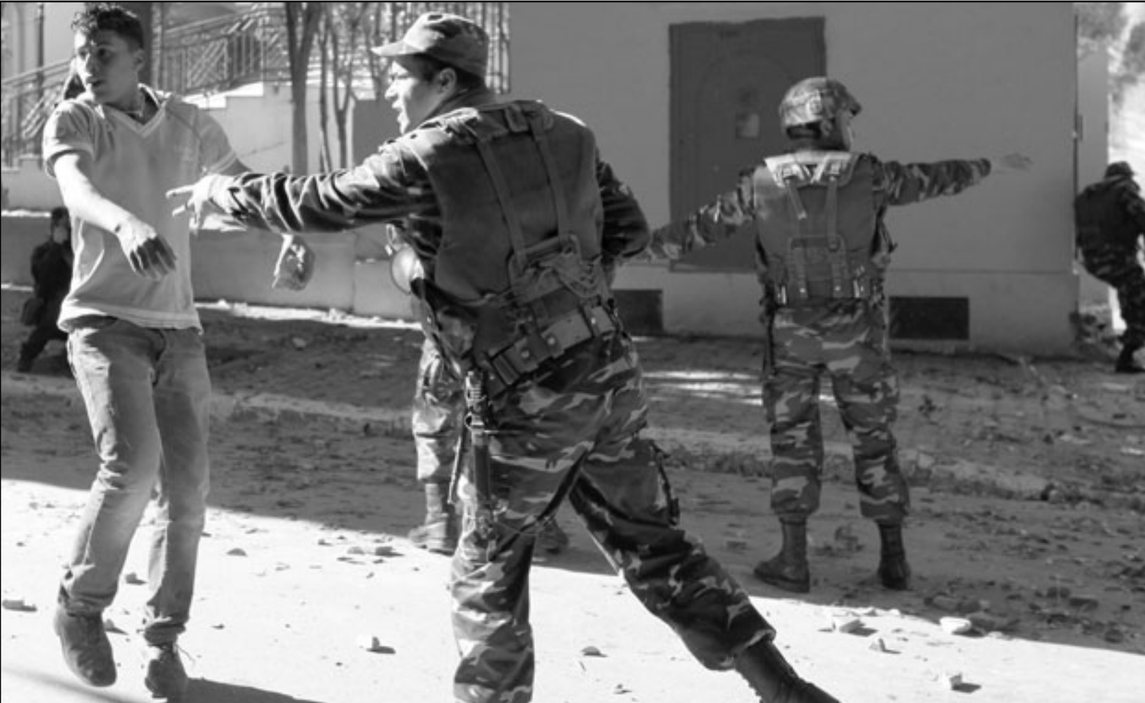
جندي يحاول ثني شاب من المحتجين عن العبور باتجاه قصر الحكومة بحي القصبة أمس

فرنسا في تونس ببار مينا سيستبدل بظهيره المعتمد في بغداد بوريس بولون. فيما تعرض موقف باريس من الثورة التونسية لانتقادات شديدة.