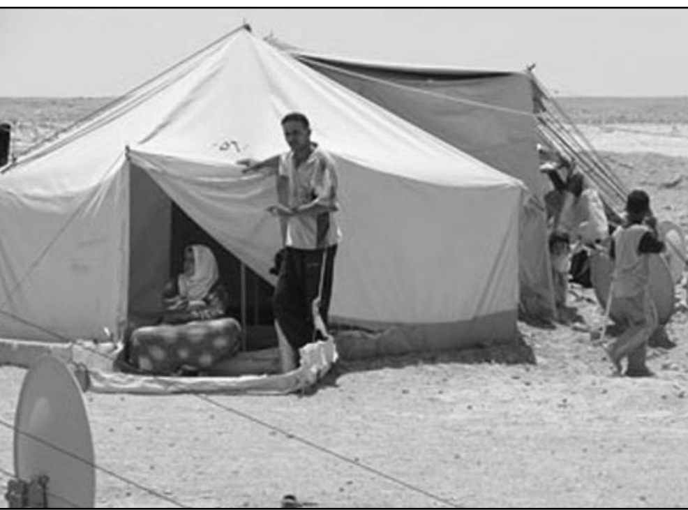
ليس من العدل ابقاء ملايين اللاجئين تحت نعل الاحتلال

«بدلا من الانشغال في تقدم التسوية الدائمة التي تضمن مستقبل اسرائيل كدولة يهودية وديمقراطية، وجدت نفسي غارقا على مدى سنة ونصف السنة في مفاوضات على توسيع شرفات. في الوقت الذي يتشير فيه رؤساء مجلس الامن القومي الى انجازات مفاجئة لاجهزة امن السلطة الفلسطينية، فان تفصيلتنا في