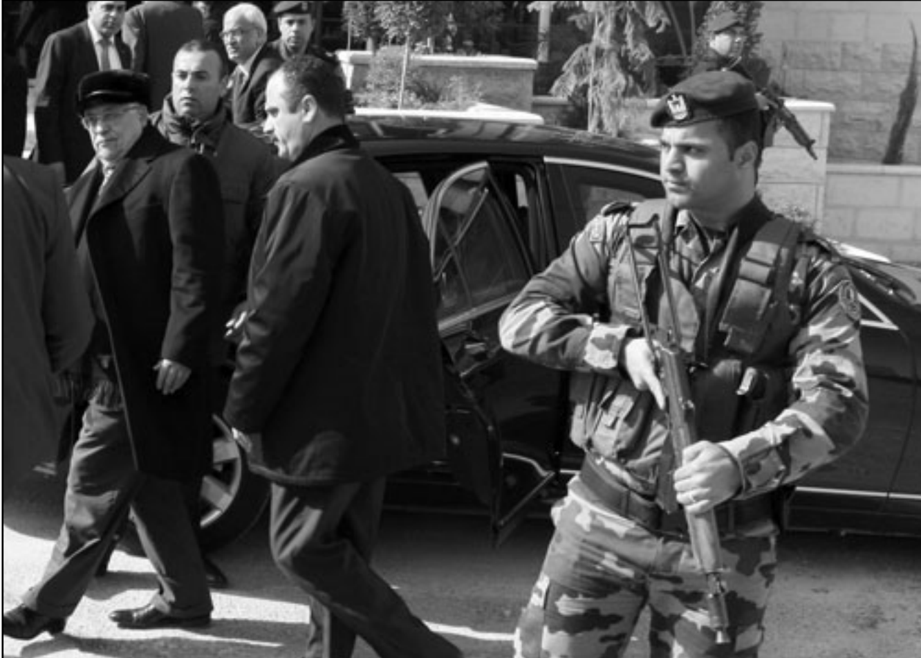
الرئيس الفلسطيني محمود عباس يغادر سيارة برفقة كبير المفاوضين الفلسطينيين صائب عريقات

يجد عريقات الالقول «انها ساعة الحقيقة، احمدني نجاح في غزة ولبنان، اليكستان سننهار، والوصول والسودان دولتان فاشلتان والدول العربية لا تفعل شيئا. هل تصرف ان ابو مازن اقنع رجل اعمال من اجل فتح اذاعة لموسوي»، واكد ميتشل ان ابو مازن لا يعمل كل العرب بل الفلسطينيين. واكد ميتشل لعريقات ان تحليله عن الوضع الاسرائيلي غير صحيح لكن عريقات اكد انه يعرف الاسرائيليين اكثر مما يعرفونهم. «انا عطس احدهم في تل ابيب اخذ الانفلونزا في اريحا»، وذكره ميتشل انه طالما ظل الجانب الفلسطيني يشكو لالاستيطان سيسحمر وعندها قال عريقات ان حل الدولتين ان أفضل «فستأخذ من اجل الدولة والمساواة».