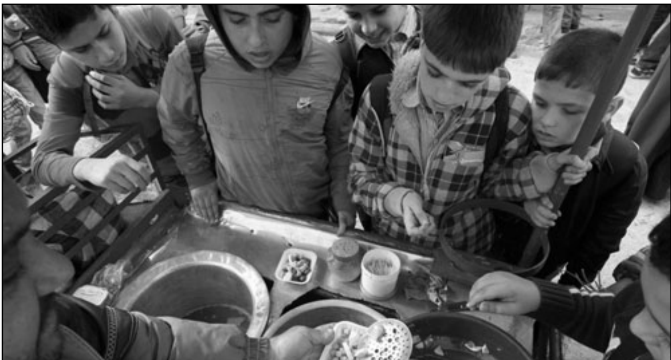
اطفال فلسطينيون لاجئون في مخيم عين الحلوة يشربون الغول والحمص

واتهم حمدان المفاوضين الفلسطينيين بأنهم كانوا يقدمون عرضاً لو قبلتها اسرائيل لاعتبرت واحداً من اكبر الخيانات للشعب الفلسطيني خاصة فيما يتعلق بالقدس والحرم الشريف.