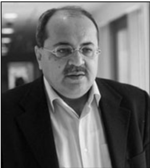
النائب احمد الطيبي