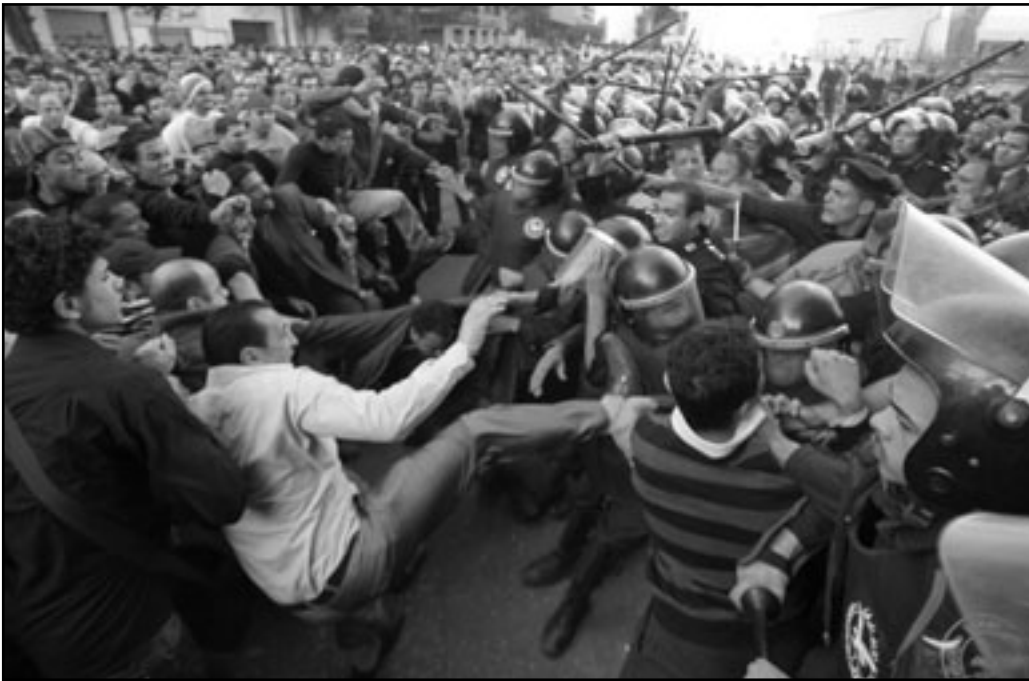
هل تبشر مظاهرات المصريين بنهاية عصر مبارك؟

كان الالخبميات بتأمن الحالة الصحية لمبارك، وامكانية أن يخلفه ابنه جمال زادت من التوتر وتوران الانعصاب في اوساط الجماهير. ثورة الياسمين في تونس رفعت على الفور مستوى الآمال