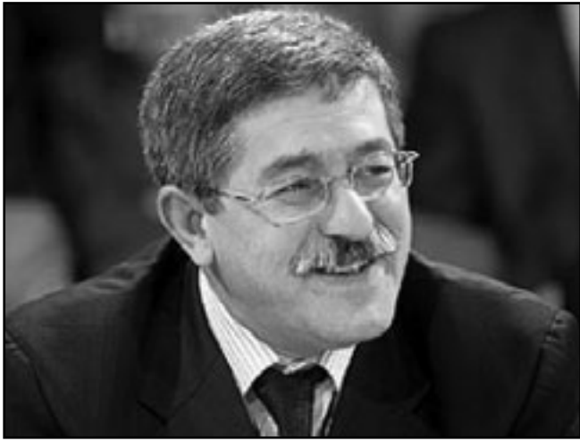
الوزير الاول الجزائري احمد اويحيى

كاسباب للتعجيل بشراء القمح. وأشار اويحيى إلى نقص المعروض في سوق القمح العالمية وعدم التيقن بشأن محصول الجزائر من القمح هذا العام