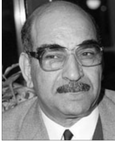
محمد عابد الجابري