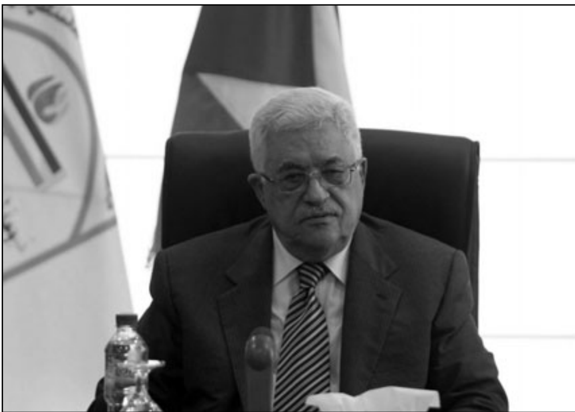
الرئيس الفلسطيني محمود عباس يترأس اجتماع اللجنة المركزية لمنظمة التحرير الفلسطينية في رام الله

ورأى أن ما تقوم به «الجزيرة» يرمي لاغتيال عباس والقيادة الفلسطينية سياسياً، موضحاً أن الأهداف الوطنية حتى لو كان حل السلطة، وقال «خيار حل السلطة موضوع أمام القيادة الفلسطينية في رام الله، ونحن نقول له إن الأمر حتى يتعلق بفضيلتنا الوطنية فحسب مستعدون للتضحية حتى بانفسنا وليس فقط برواتبنا».