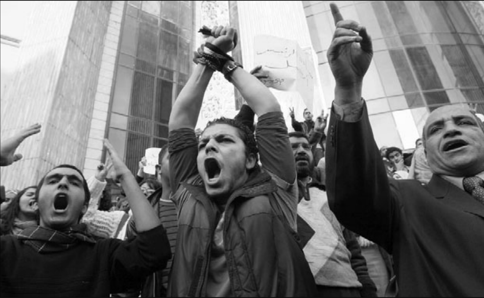
متظاهرون امام نقابة الصحفيين في القاهرة أمس