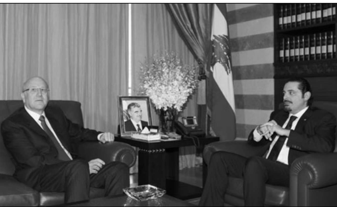
رئيس الحكومة المكلف نجيب ميقاتي لدى اجتماعه مع زعيم كتلة المستقبل سعد الحريري

بناء الثقة بالدولة وصدقيتها حيال المفات الأساسية، وفي الطبعية وأهمها تثبيت الاستقرار الأمني والمالي، و«دانت الواقف والتصريحات والبيانات التحريضية التي استندت على العصبية الطائفية والوطنية واتفاق الطائف. وأضاف: لقد جاء تصويتي في الاستشارات ترجمة لهذا الخيار بعدما كنت قد حاولت إعطاء فرصة للتوافق، لكن عندما رأيت ان هناك دولا عطلت العملية السورية - السعودية ولاحقاً المحاولة العربية - التركية، استقالة الوزراء الشيعية وأحداث 7 ايار، كان لا بد لي من ان التزم بالتصويت في الاستشارات الليبانية بما يتوافق مع ثوابتي».