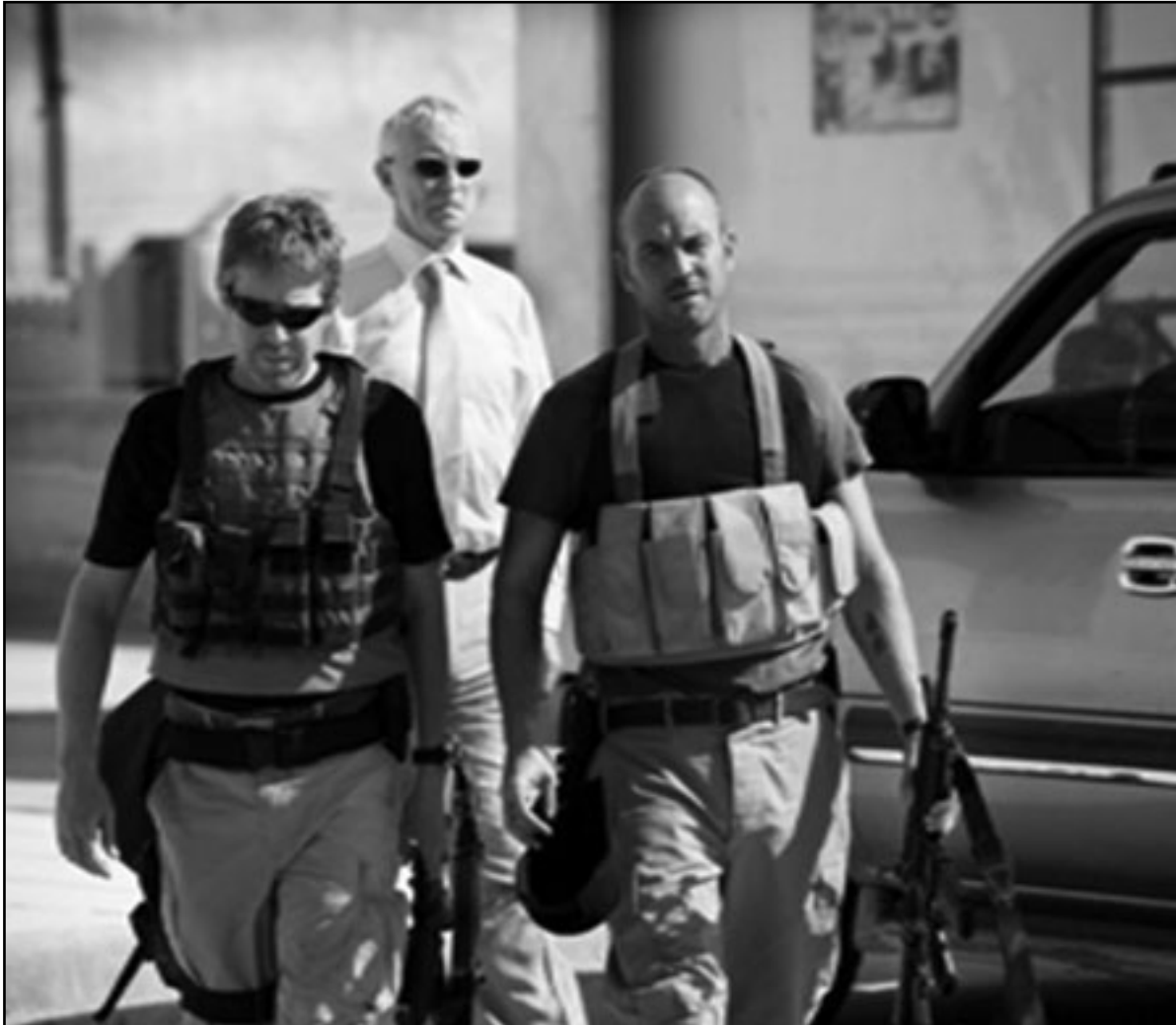
لقطة من «الطريق الايرلندية»

الغريب هو كيف أن الفيلم يكاد يقلت، في صلب حكايتها، من بين أصابع مخرجيه. صحيح أن الطرح يبقى جاداً للغاية، والمضمون يحمل رسالته المعادية للحرب ولادوار الغربية فيها بلا مواربة، لكن السيناريو لا يستطيع إلا أن يتكئ في أكثر من مكان على الواقع، والبحث عن الحقيقة، القيادة الفردية لهذا البحث، الصاعب التي تواجهه، استخدام الصراع مع محاولة تني المحقق عن هدفه أو تهديده، وتغلبه على المصاعب وكشفه الحقيقة في نهاية الفيلم رغم يتسبب في فضيحة تضر بالأمسية وسعمتها التي تساوي عشرات ملايين الدولارات على شكل مهام عسكرية.