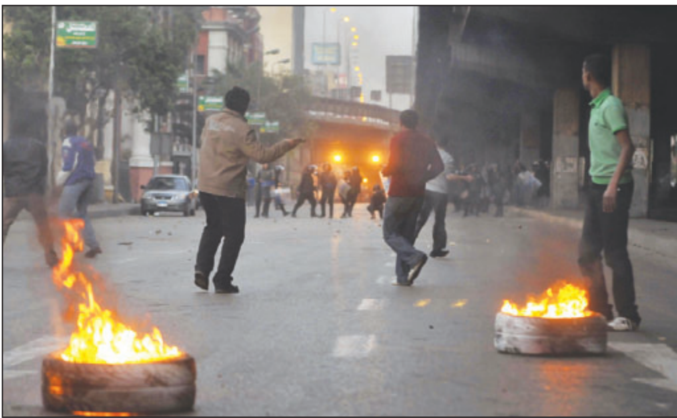
جانبا من الاشتباكات بين المتظاهرين وقوات الامن في القاهرة امس