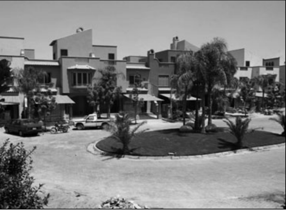
فيلات من مشروع «بالم هيلز» للتطوير العقاري قرب القاهرة

تكون لديها القدرة على امتصاص مثل هذه المشكلات... وقال «أسهم عز وبالم وغيرها ستعاني من ضغوط وبيع عشوائي من الأفراد (عند استئناف التداول) ولكن لا بد أن يعلم المتعاملون أن الأسواق قد انتهى وما هو قادم لن يكون بنفس الدوران يساوي 5.94 جنيه مصري.