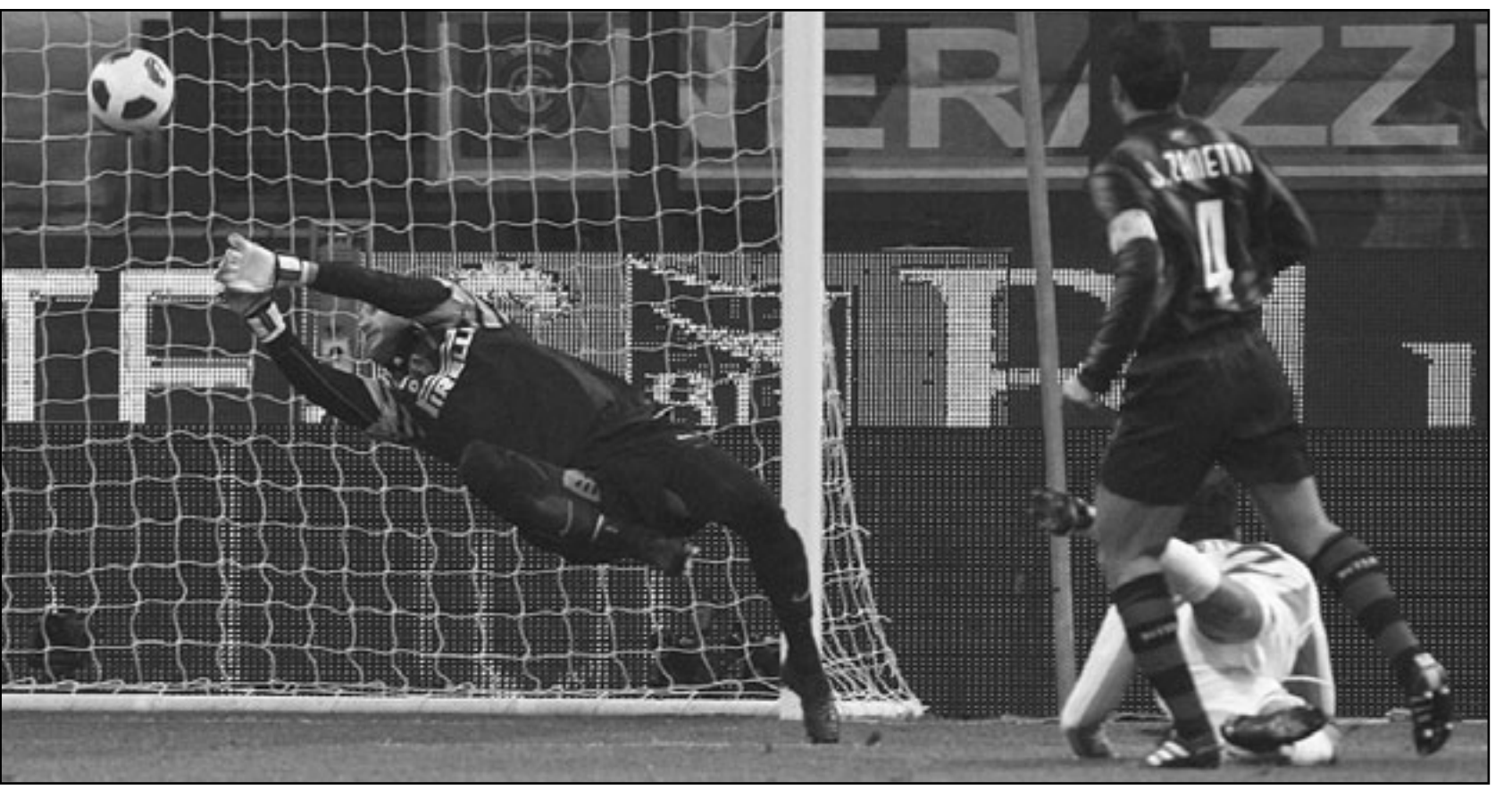
جوليو سيزار حارس مرمرى انتر ميلان ينقذ مرماه من تسديدة نجم روما ماركو بوريللو

مباراة متتالية. وسدد صانع اللعب البرازيلي كاكا العائد الى ريال بعد إصابة خطيرة في الركبة كرة ارتطمت بالعارضة واحرز هدفا جميلا بتسديدة مثقفة من عند حافة منطقة الجزاء في الدقيقة الثامنة لم يتمكن كلاوديو برافو من التصدي لها. وقبل لقاء الاحد لم يسجل رونالدو اهدافا في المباريات الاربعة الاخيرة وانتهى هذا الصيام عن التهديد بتسديدة قوية بالفم اليسرى من خارج منطقة الجزاء في الدقيقة 21. وارتقى رونالدو - الذي اكمل عامه 26 السبت الماضي - اعلى من دفاع سوسيداد وسدد كرة بضربة رأس