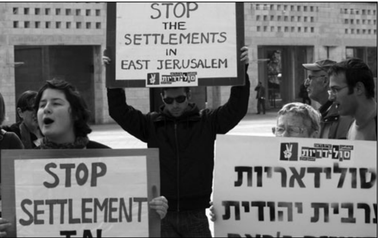
تشياء سلام فلسطينيون واسرائيليون يتظاهرون ضد الاستيطان في حي الشيخ جراح في القدس

ومن جهة اخرى اوردت الإذاعة التابعة لجيش الاحتلال الإسرائيلي الإثنى، خبراً مفاده أن وزير الدفاع الإسرائيلي يهود باراك أقر مؤخراً خطة لإصفاء الشريعة على 15 مبنى استيطانية تابثا شيدت من دون ترخيص في مستوطنة «بيتانييم»، 10 مبان استيطانية أخرى في مستوطنة «غيفه تسوف» في الضفة الغربية، ولفلت الإذاعة إلى أن باراك أبلغ محكمة العدل الإسرائيلية العليا بإقراره هذه الخطة.