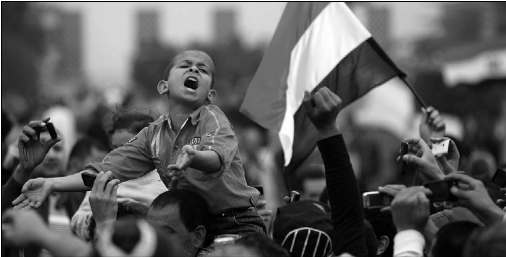
طفل مصري يشارك الالاف في ميدان التحرير

القاهرة - اف ب: منع المتصمون الجيوش المصري الاثنى من فتح اهم مجمع حكومي في ميدان التحرير، رافضين بذلك عودة الحياة الطبيعية الى هذا الشريان الحيوي في قلب القاهرة الذي يحتلون جواره منذ اسبوعين فيما أعلنت الحكومة عن رفع الرواتب في القطاع العام بنسبة 15% في محاولة لامتصاص غضب الشارع. كما ارجأت بورصة القاهرة فتح ابوابها حتى الاثنى المقبل في ما اعتبر نكسة لمحاولات اعادة الحياة الى طبيعتها.