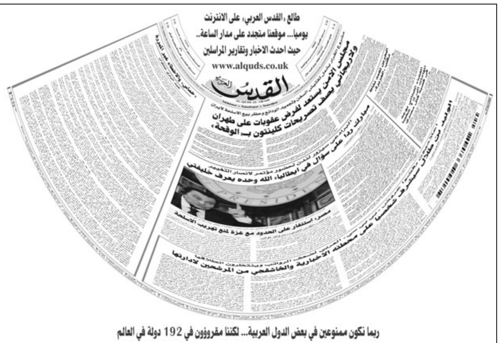
ربما تكون ممنوعين في بعض الدول العربية... لكننا مفرورون في 192 دولة في العالم

موضوعات نقل الركاب والشحن والإطعام والخدمات. وقال وزير التعليم العالي السوري الدكتور غياث بركات خلال افتتاحه المعرض إن «المعرض الحالي يمثل استمراراً طبيعياً لمسار العلاقات المتينة بين البلدين الصديقين سورية وإيران في كافة المجالات مضيفاً أن الاختصاص الذي يمثله المعرض هو في غاية الأهمية بالنسبة للشركات السورية المختلفة وكذلك بالنسبة مراكز الأبحاث والدراسات المختلفة