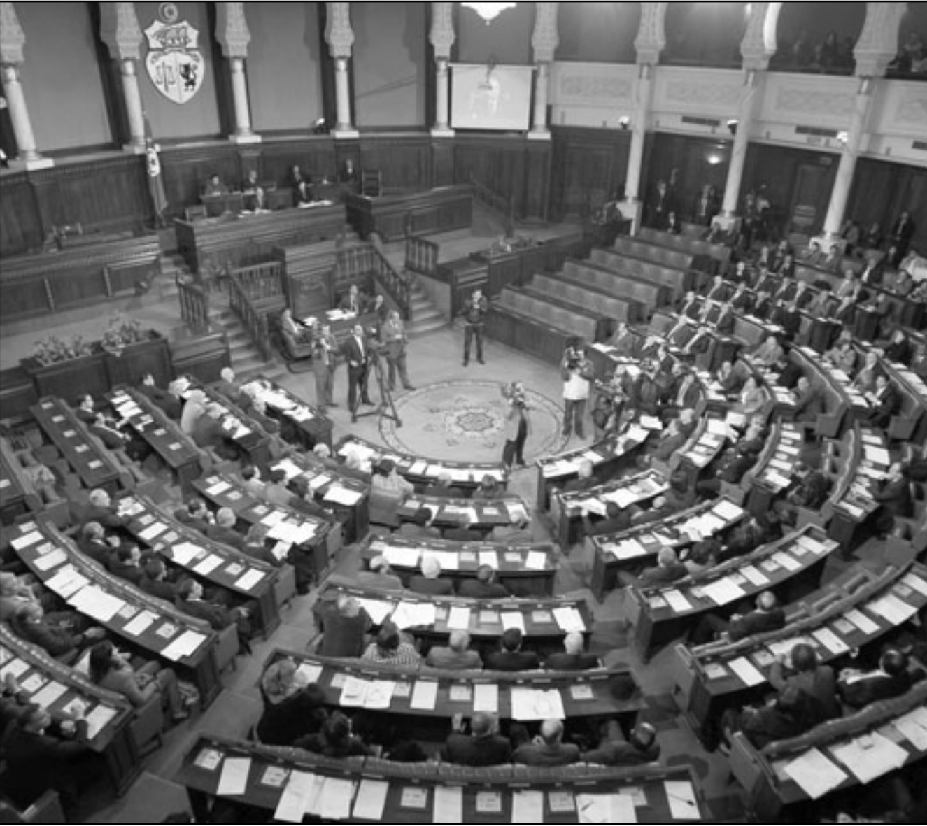
جنود يحرسون مقر معتمدية الكاف (شمال) وقد احترق في احتجاجات جرت الأحد وأسفرت عن أربعة قتلى، وفي الصورة الثانية البرلمان التونسي يناقش أمس تفويض صلاحياته للرئيس المؤقت فؤاد المبرز