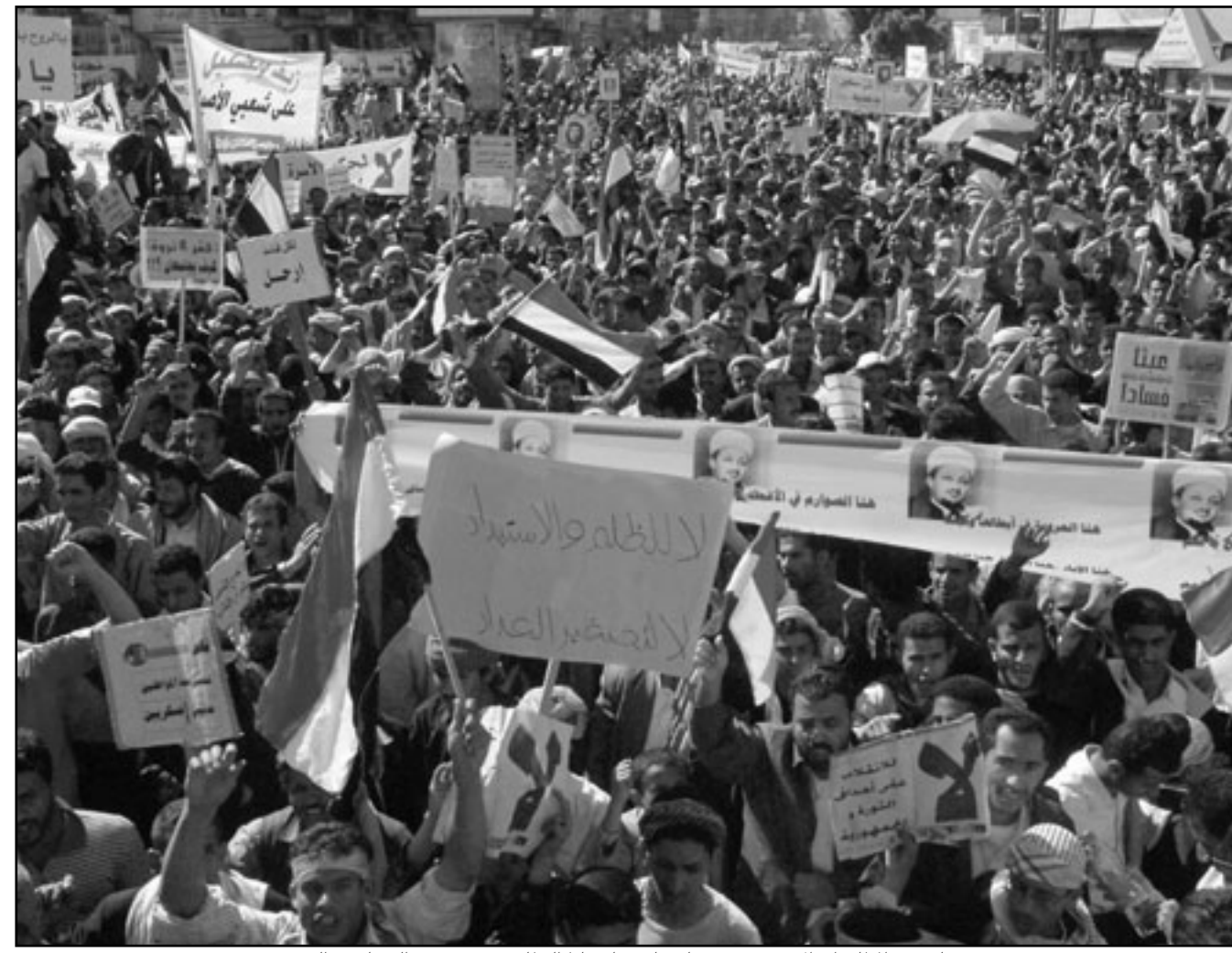
جانب من المظاهرات الاخيرة في صنعاء اعتادي باسقاط النظام وتندد بتعشي الفساد في اليمن

ونقلت عن توني بيرمان، المستشار الاستراتيجي للقناة في امريكا قوله ان اللقاءات المتعددة مع المسؤولين الامريكيين ساعدت في ترتيب العلاقات، فيما التقت كلينتون مع مديرى الجزيرة الكبار وتحدثت معهم بصراحة قبل عام لترطيب الاجواء وقال بيرمان ان الصحافة الان هي علاقة متينة بين «حكومة قوية وقناة قوية».