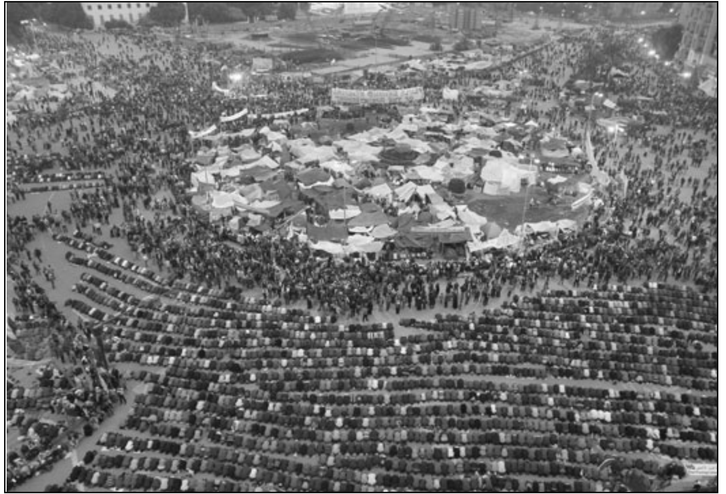
صورة من الأعلى للمتظاهرين أثناء الصلاة في ميدان التحرير