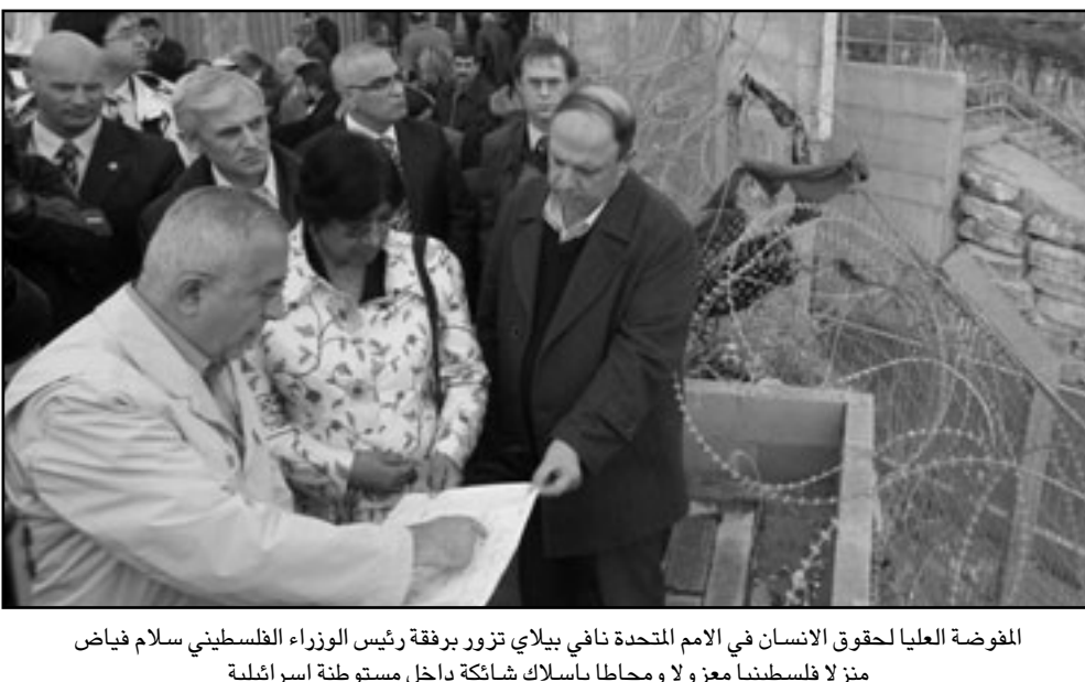
المفوضة العليا لحقوق الانسان في الامم المتحدة نايفي بيلاي تزور برفقة رئيس الوزراء الفلسطيني سلام فياض منزلاً فلسطينياً معزولاً ومحاطاً بأسلاك شائكة داخل مستوطنة اسرائيلية

من حالة عدم الاستقرار التي تهدد الامن والسلم الاجتماعي، متمنياً على الشعب المصري «تعليب الحكمة والحوار الوطني البناء لتجاوز تلك الحالة». وقد تراس أعمال المؤتمر بداية رئيس المجلس الوطني الفلسطيني سليم الزعنون بصفتي رئيس الاتحاد قبل ان يسلم الرئاسة الى دولة قطر ممثلة برئيس مجلس الشورى محمد بن مبارك الخلفي، وغاب عن الافتتاح الامين العام للجامعة العربية عمرو موسى ورئيس مجلس الشعب المصري احمد فحفي سورى.