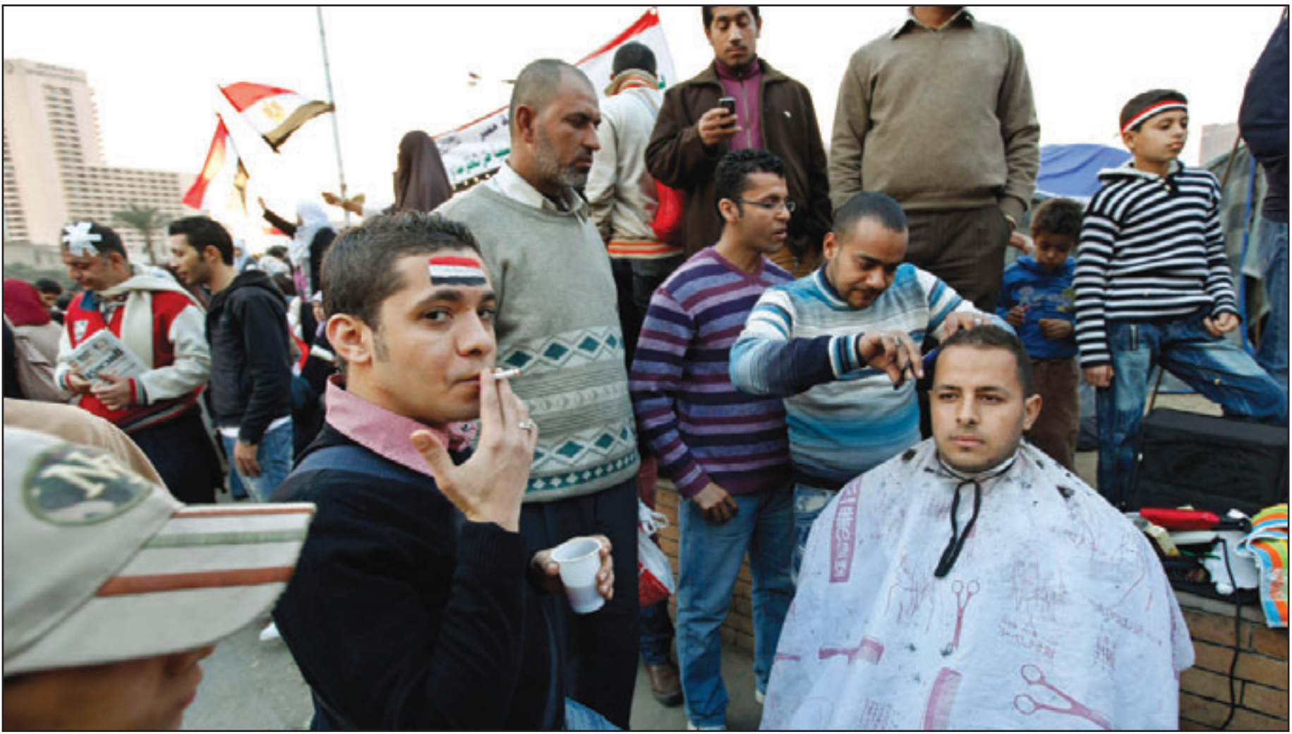
حلاق يقدم خدماته لاجد المتظاهرين في ميدان التحرير امس