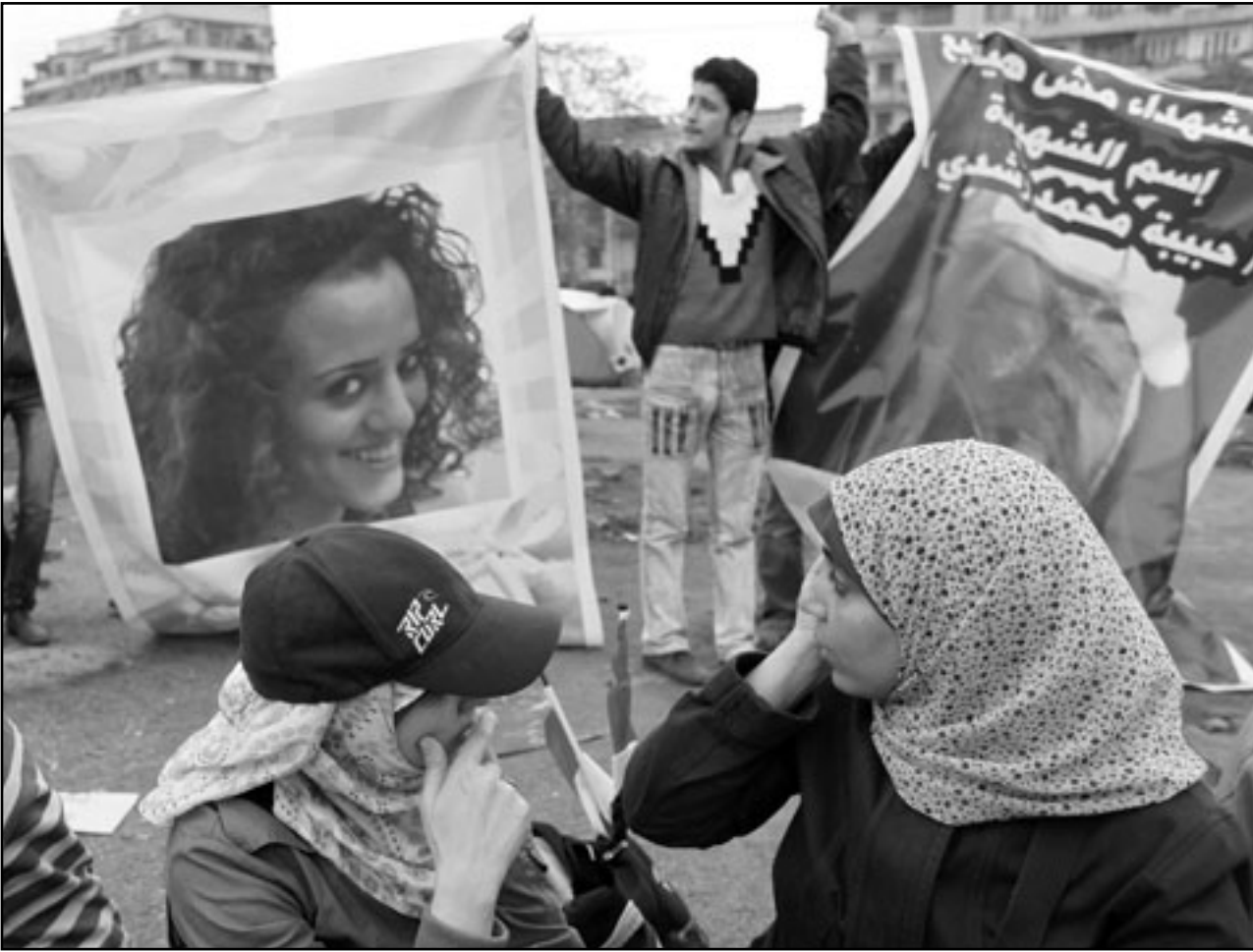
صور الشهداء تتوسط ميدان التحرير