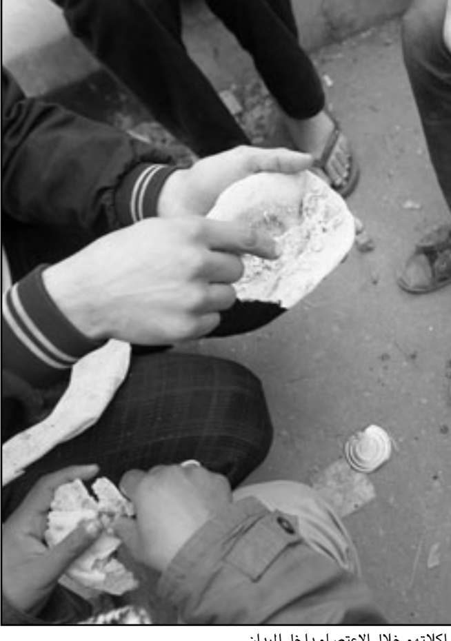
متظاهرين في ميدان التحرير يشاركون في اكلهم خلال الاعتصام داخل الميدان

وتشير الصحيفة الى الشلة التي تمت حول عز منها احمد المغربي و ابراهيم كمال وهشام طلعت مصطفى. ويرى باحثون ان احمد عز وجماعته ممن منعوا من السفر وامر التحقيق بمصادرهم المالية لا فرق بين عز وجمال مبارك، ولكن بولمانيا من الاخوان قال ان الشعب لا يفرق بين عز وحسني مبارك.