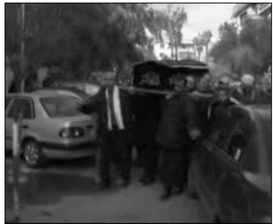
جانب من جنازة المخرج عمر أميرلاي

للتعليق. بعد خان الحرير، قمت بإخراج مسلسل اسمه «جلد الأفي» بعده جاعني الجزء الثاني من خان الحرير ثم «الفصول الأربعة»، وهو مسلسل كبير وضم، وبعده توقف عن الإخراج لفترة طويلة وتفرغت لكتابة