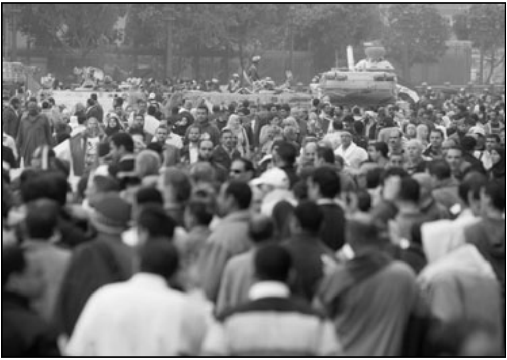
العالم الحر مطالب بمنع تكرار ما حصل في مصر

منع خطوات متسرة أكثر مما ينبغي والمساعدة في ان يبني اليوم الجديد في صالح المصريين انفسهم، مثلما ايضا في صالح المصالح بعيدة المدى لامن واستقرار المنطقة.