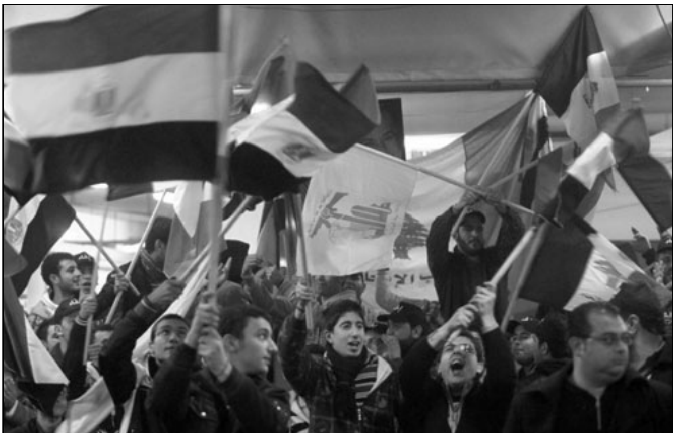
انصار حزب الله يتظاهرون بأبيد الشعب المصري في بيروت

الصف، وكم كان من الأفضل لو يستطلع الجيش المصري الذي سطر بطولات تاريخية ولم يبق مرة في مواجهة شعبه أن يتولى عملية إزالة رواسب النظام ورعاية عملية التغيير بعيداً عن أذقة المخابرات ودواتها ورموزها الظلمة والفسادة والتي تتصدر الشاشات اليوم،