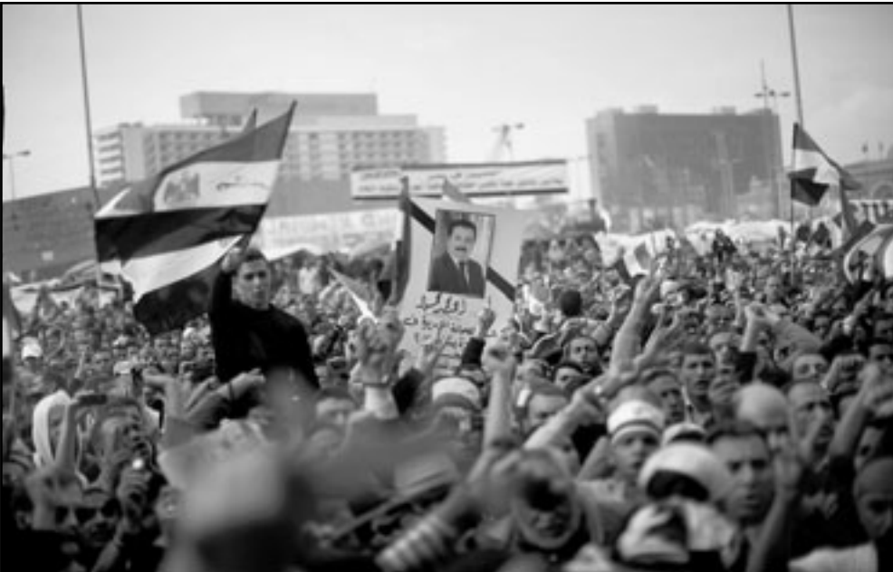
مصر الديمقراطية ستكون نموذجا للاقتداء في العالم العربي والاسلامي

لن تؤيد رئيس دولة يزود الانتخابات ويستعد لنقل الحكم من نفسه الى ابنه، بمسؤولي التي ان اقول له: يا صديقي، انتهي طريقك، انصرف. وفوق التعليل الابدولوجي - القيمي يبق، كما نشر اوباما، التعليل الاستراتيجي. مصر تعتبر حجر اساس للاستراتيجية الامريكية في الشرق اوسط، ومحظور على امريكا ان