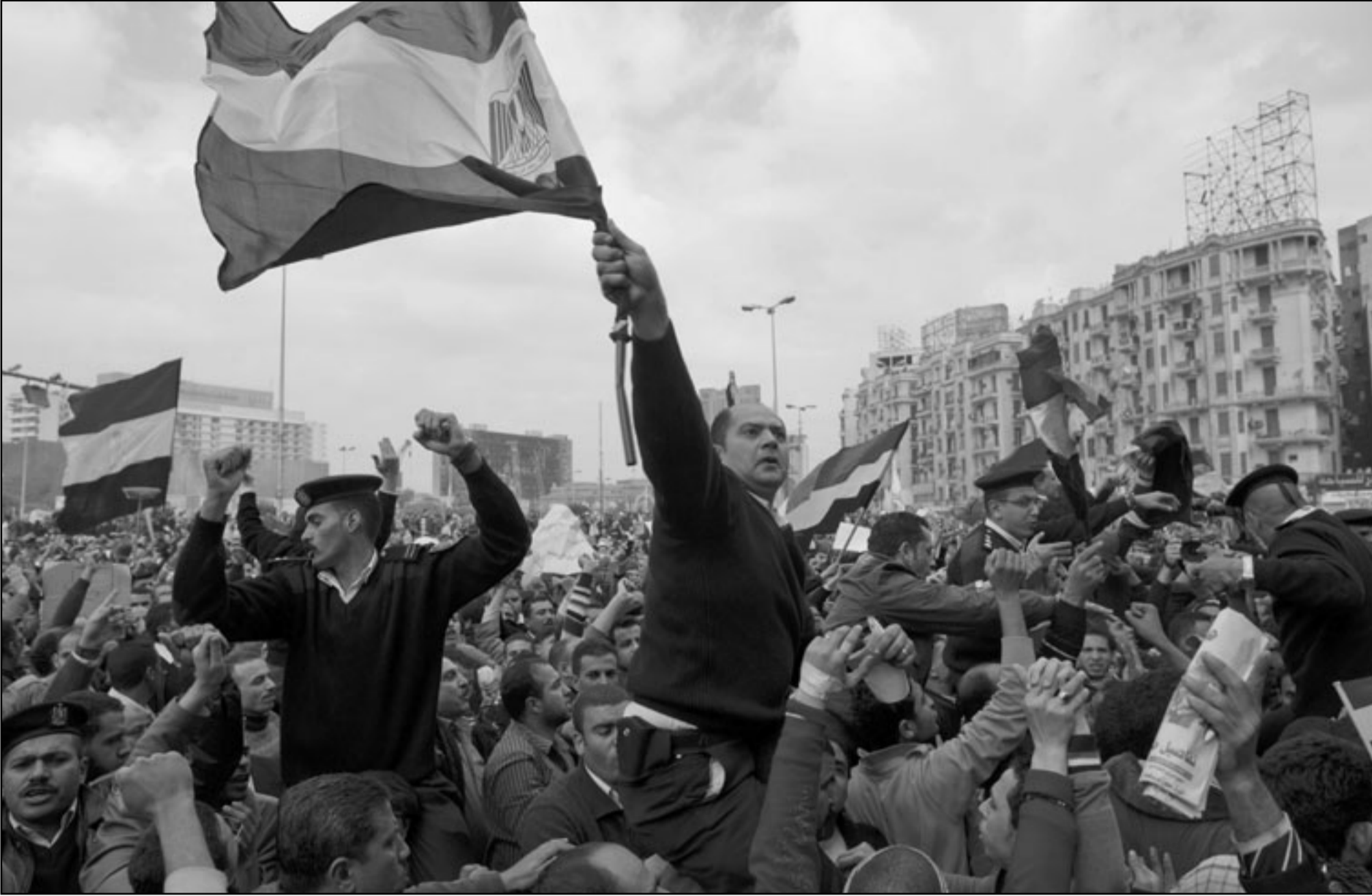
رجال الأمن والشرطة يتظاهرون لتحسين اوضاعهم في ميدان التحرير امس