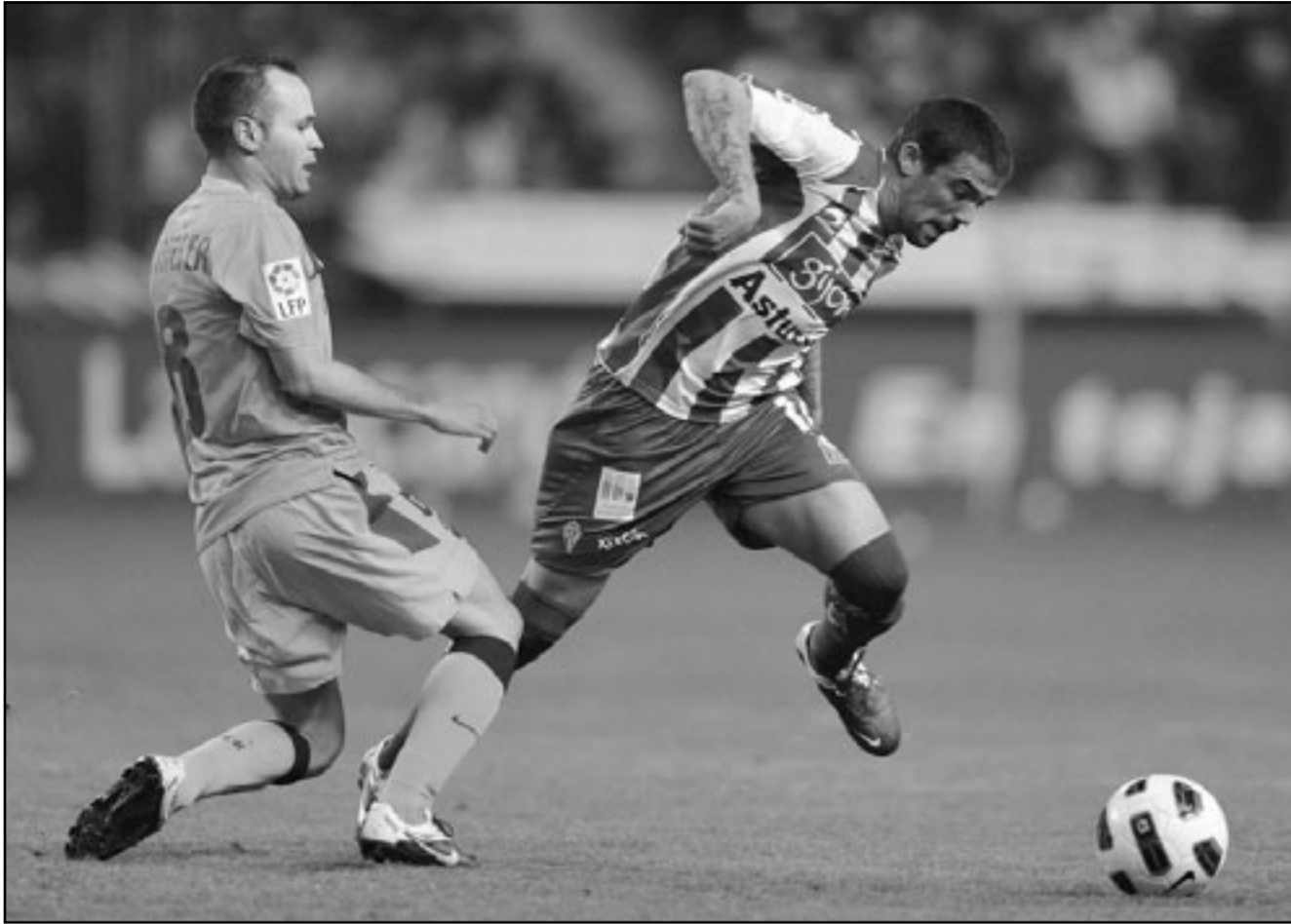
اندريا انيستا (يسار) نجم برشلونة في منافسة على الكرة مع نجم خيخون اينجاسيو خافيير

مؤكدين لفريق برشلونة وسط تألق ملحوظ من جانب كويلار الذي تصدى لعدة فرص محقق في الوقت الذي اندفع فيه برشلونة بكامل قوته الضاربة من أجل تسجيل هدف الفوز. وحقق ريسينج سانتاندر فوزا صعبا على أشبيلية وتغلب عليه 2/3 ليرفع سانتاندر رصيده إلى 25 نقطة في المركز الثاني عشر ويتجمد رصيده أشبيلية عند 31 نقطة في المركز السابع. وكادت المباراة تنتهي بالتعادل 2/2 لكن مانويل أرنابا خطف هدف الفوز 2/3