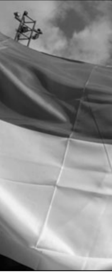
فلسطينيون يحتفلون بنجاح الثورة المصرية

وخرجت مسيرات مؤيدة للثورة المصرية في كافة أنحاء قطاع غزة، وفي مدينة رام الله بالضفة الغربية منذ أن أعلن في مصر عن تنحي الرئيس مبارك عن الرئاسة لصالح قيادة الجيش المصري. ونظم انصار حركة حماس في كافة مناطق القطاع مسيرات أطلقت خلالها أغنية نارية في الهواء تبارك الثورة المصرية، التي رحبت فيها الحركة عبر بيان رسمي. وتقدمت في البيان حركة حماس بالتهنئة للشعب المصري، بنجاح ثورته الشعبية، وتمنت لحمر وشعبها الخير والأمان والنقدم والأزدهار من أجل صلحة ومستقبل الشعب المصري والأمة العربية والإسلامية.