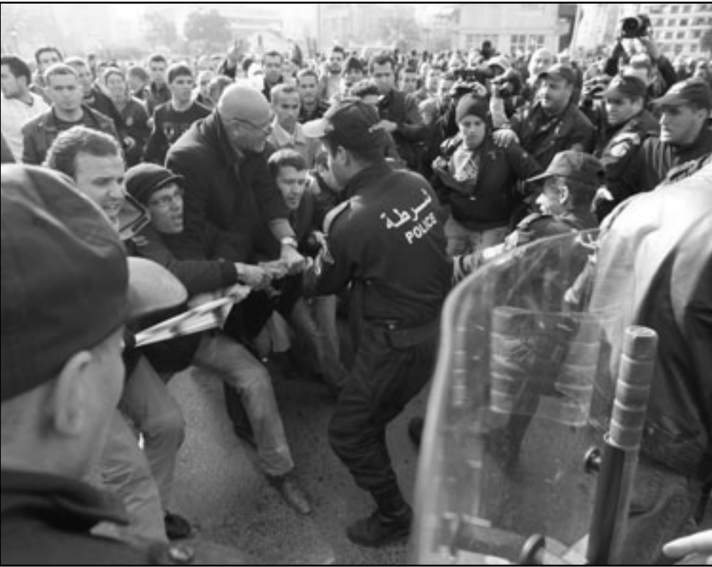
قوات الامن تحاول السيطرة على المظاهرات التي نظمها جزائريون بباريس تضامنا مع أبناء وطنهم في الداخل وشعارها يطالب بتقلية بالرحيل

وحسب بيان لوزارة الداخلية فقد شارك في المظاهرة 250 شخصا، في حين قدرت التتسقية بـ 2500 شخصاً، في حين آلت مظاهرة. وقالت الداخلية أن 18 شخصا أوقفوا في حين ذكرت الرابطة الجزائرية للدفاع عن حقوق الإنسان أن عدد الموقوفين تجاوز 1300 أطلق سراحهم بعد ذلك بساعات.