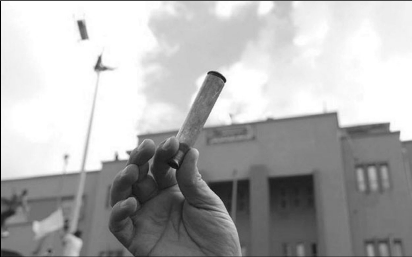
صورة من فيس بوك (في ظل الحصار الاعلامي المطلق) لمتظاهر يحمل رصاصه حية قال ان قوات الامن الليبية تستعملها ضد المتظاهرين