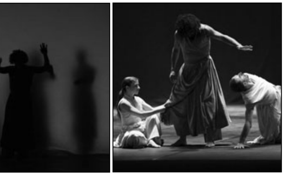
من عرض «الطريق العمودي»