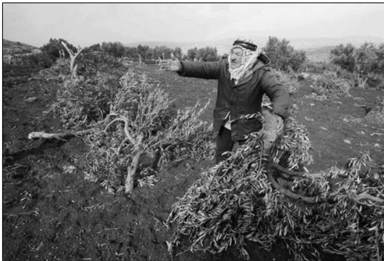
فلسطيني يتفقد آثار الدمار بعد قطع مستوطنين اشجار الزيتون في قرية قصرة قرب نابلس

أيام بعقد سلسلة لقاءات أخرى مع الفصائل الثوي مشاركتها في حكومتها، كما علمت «القدس العربي» أن كلا من حزب «فدا»، وجبهة النضال الشعبي الذين كانوا يشاركان في الحكومة السابقة، سيبتلان في الحكومة القادمة، وأنهم أعطوا موافقة لفياض بذلك، غير انه لم يحدد بعد أسماء الوزارات التي ستشكل الحكومة.