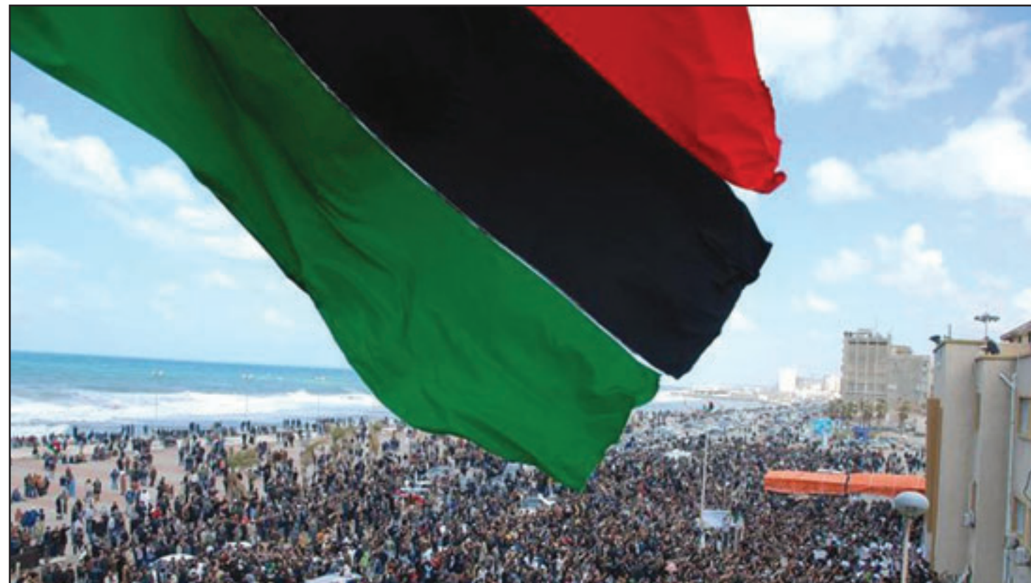
جانب من المظاهرات التي اجتاحت مدينة بنغازي