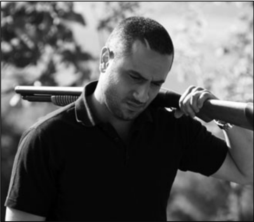
لقطة من فيلم «مرة أخرى»