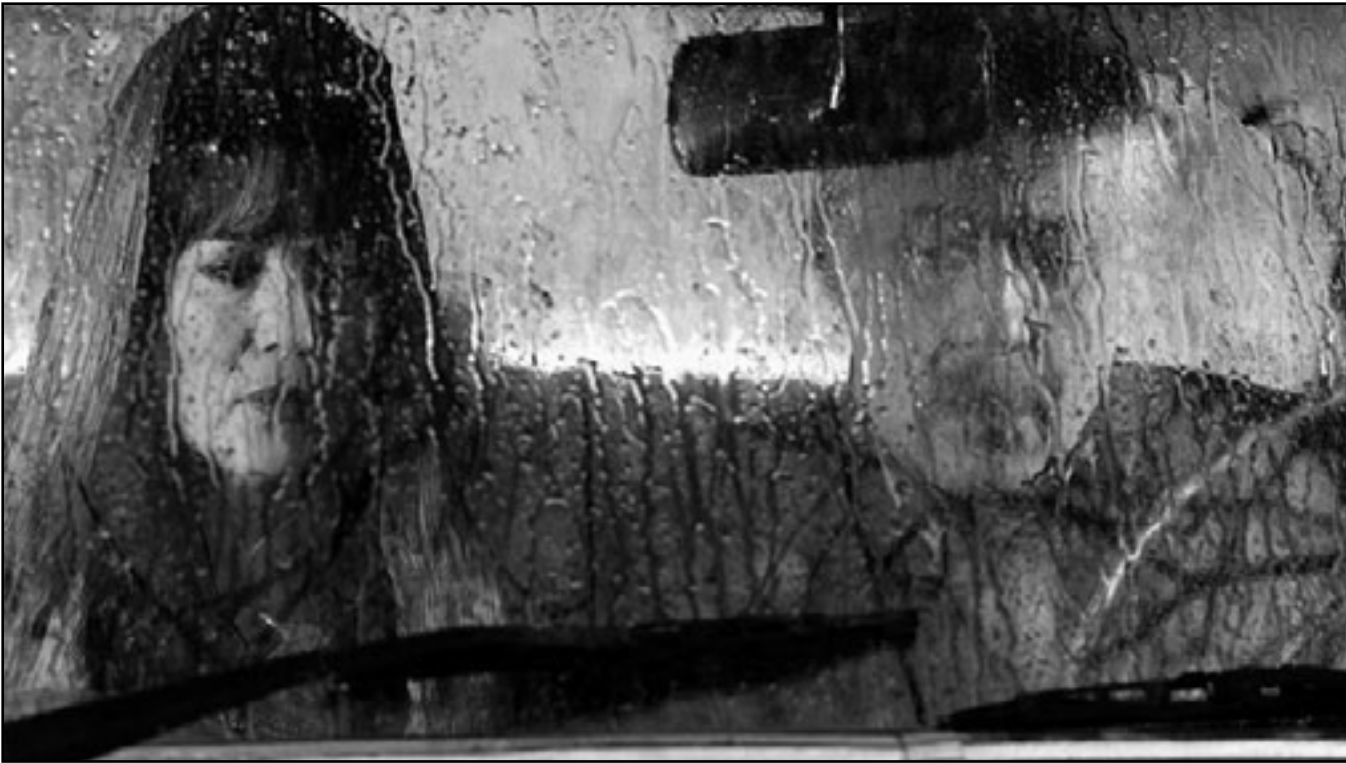
أيمن زيدان وسمير سامي يطلا فيلم «مطر أيول»