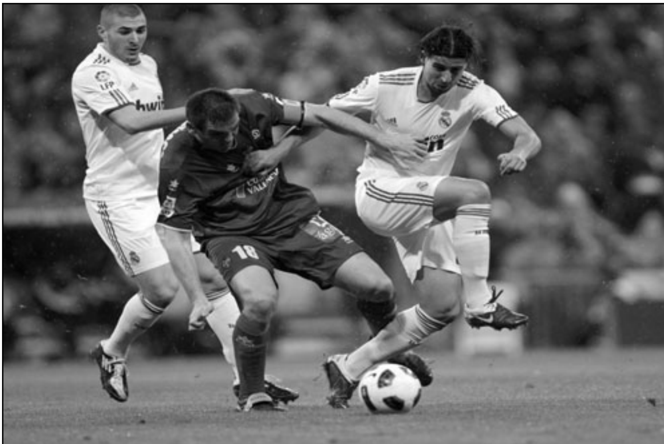
سامي خضيرة نجم ريال مدريد (يمين) يحاول الفوز بالكرة