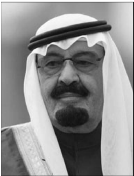
العاهل السعودي عبد الله بن عبد العزيز

دعوات متصاعدة من أطراف سعودية مختلفة وسط قلق رسمي من امتداد تأثير الاحتجاجات الشعبية في بلدان عربية أخرى لمدن المملكة. ولا تزال الاضطرابات التي تجتاح عددا من الدول العربية تحظى باهتمام مختلف وسائل الإعلام العالمية. فقد تناولت صحيفة «بلانديس بوستن» الدنماركية الصادرة امس الاحد هذه الاضطرابات من زاوية ارتباطها بارتفاع أسعار النفط لاسيما بسبب تصاعد أعمال العنف في ليبيا، أحد أكبر مصدري النفط في العالم، على مدار ما يقرب من أسبوعين. وقالت الصحيفة في مستهل تعليقها إن ارتفاع أسعار النفط أظهر «وبطريقة مؤلمة» أن العالم مرهون وإلى حد بعيد باستقرار الإمدادات النفطية وذلك على الرغم من الجهود المبذولة للتخلص من هذا الارتباط. وأضافت الصحيفة أن توترا شديدا يسود العالم في الوقت الراهن لأنه لم يعد أحد يستطيع استبعاد أن تمتد الاضطرابات في الدول النفطية مثل ليبيا والبحرين إلى السعودية، أكبر منتج للنفط في العالم. وقالت الصحيفة إن ردود الأفعال على مستوى العالم ستتمسك بالعجز والاعتسالم في حال حدوث ذلك. غير أن الصحيفة أشارت إلى أن العالم سيكون أفضل إذا حلت حكومات ديمقراطية حرة عن طريق انتخابات نزيهة محل النظم الاستبدادية في الشرق الأوسط والأدنى وشمال أفريقيا».