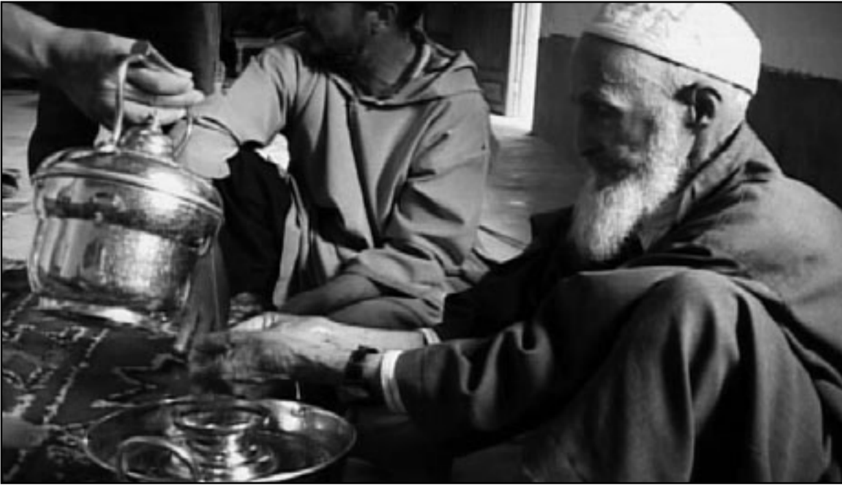
لقطة من فيلم «أشلاء»

فاهم ميزة من مزاي الفيلم الوثائقي انه لا يعتمد البتة على ممتكبن، ومهمته تنحصر في «البحث والنقضي عن الحقيقة»، كما أن عمره لا يتعدى الـ50 دقيقة إلا في بعض الحالات النادرة، أما تكاليفه فهي أقل بكثير من تكاليف إخراج فيلم تلفزيوني أو فيلم سينمائي. والأمر يعود إلى موضوعنا بعدما حددنا مثلًا تقنيا لنقائص به الأفلام الـ19 التي عرضت في «المهرجان الوطني للفيلم بطنججة»، والتي يدعى معها مدير المركز السينمائي المغربي أنها كلها أفلام سينمائية وأنها أنتجت سنة 2010.