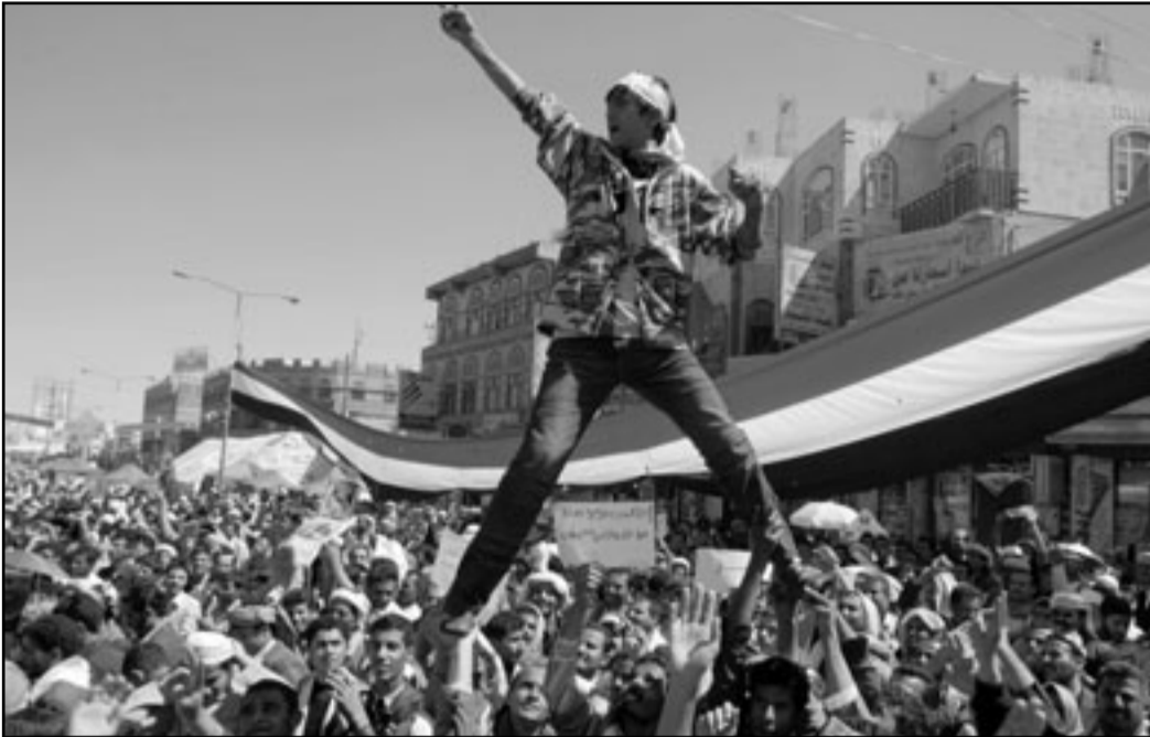
سقوط النظام اليمني يعني ظهور صومال جديد

الحالي وهو الرباط السياسي الوحيد البين مرحطها بغير مساعدة وضغط خارجيين. وادا لم يحدث هذا فقد تندف بعد خمس سنين احتياطات النفط، ولن يكون في امكان الحكومة اذناك أن تزود سكانها الذين قد يضاعفون عددهم في العقد القادم، بالناء. إن اسقاط النظام