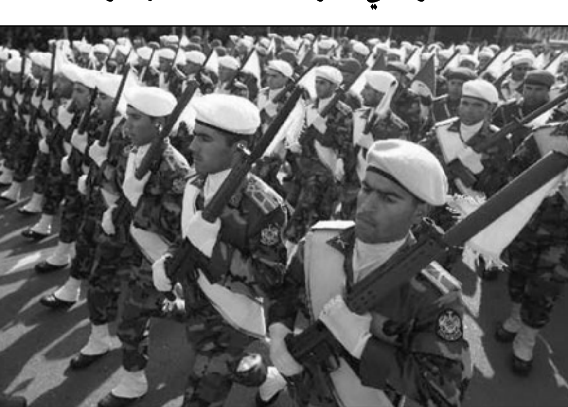
اسرائيل ستجر المنطقة الى حرب اذا هاجمت ايران

اسرائيل التي مجابهته عندما يظل الصديق الوحيد لها هو محمود عباس، انه في الحقيقة رجل لطيف كامله لبن، لكن جعلته أصبحت مطووعة بالتأييد الدولي وأخذ تعلقه باسرائيل يتضائل. ما تزال تركيا لم تدب فما زلنا نستطيع التمسك بنيل توبها واقترح صداقة جديدة. سيفتضي هذا في الحقيقة اعتذارا ودفن تعويضات، وسيفتضي الاعتراف بالخطا والحماية. لكننا سنتدعي على الاقل مع شريكة استراتيجية. اما الامكانية الأخرى فهي ان نتقي مع الفخامة التي لا تساوي الكثير.