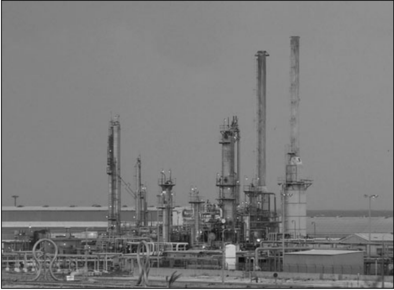
جانب من ميناء تصدير النفط من البريقة

على برنامج طهران النووي، كما أصول مثل أموال أو ممتلكات تعتقد الحكومة أنها حصيلتها نشاط مخالف للقانون. لكنها قد تكون عملية طويلة نظرا لخضوعها لدفع وطعون المالكين، ويمكن مباشرة العملية التي تعرف بمصادرة الأصول الدولية إذا عثر في الولايات المتحدة على أموال دمار شامل ويفتح الأراضي الليبية أمام مفتشي الأسلحة الدوليين. ورفعت واشنطن تلك العقوبات في 2004. *هل تستطيع الحكومة الأمريكية مصادرة أصول ليبية عن طريق القضاة؟ - نعم، تستطيع وزارة العدل الأمريكية اللجوء إلى القضاء