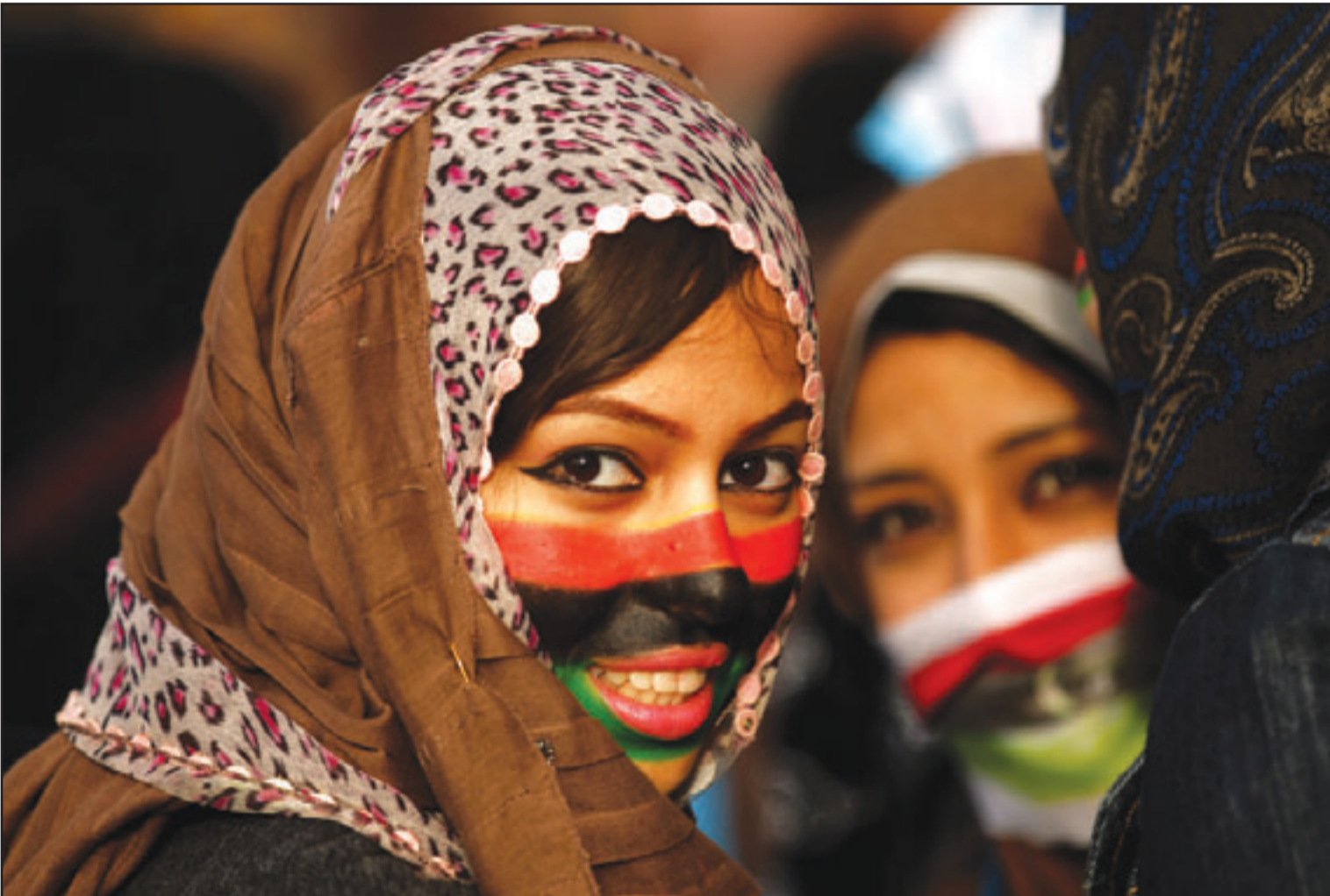
ليبيات رسمتا العلم الليبي القديم على وجهيهما اثناء احتفالات بتحرير بنغازي (ا ف ب)

على المساعدة، في المواقف الخارجية رفعت بريطانيا الحصانة الدبلوماسية التي كانت تتمتع بها أسرة القذافي فيما قال وزير الخارجية البريطاني وليام هيج ان رحيل الزعيم الليبي «أفضل امل يمكن ان نتمناه لليبيا».