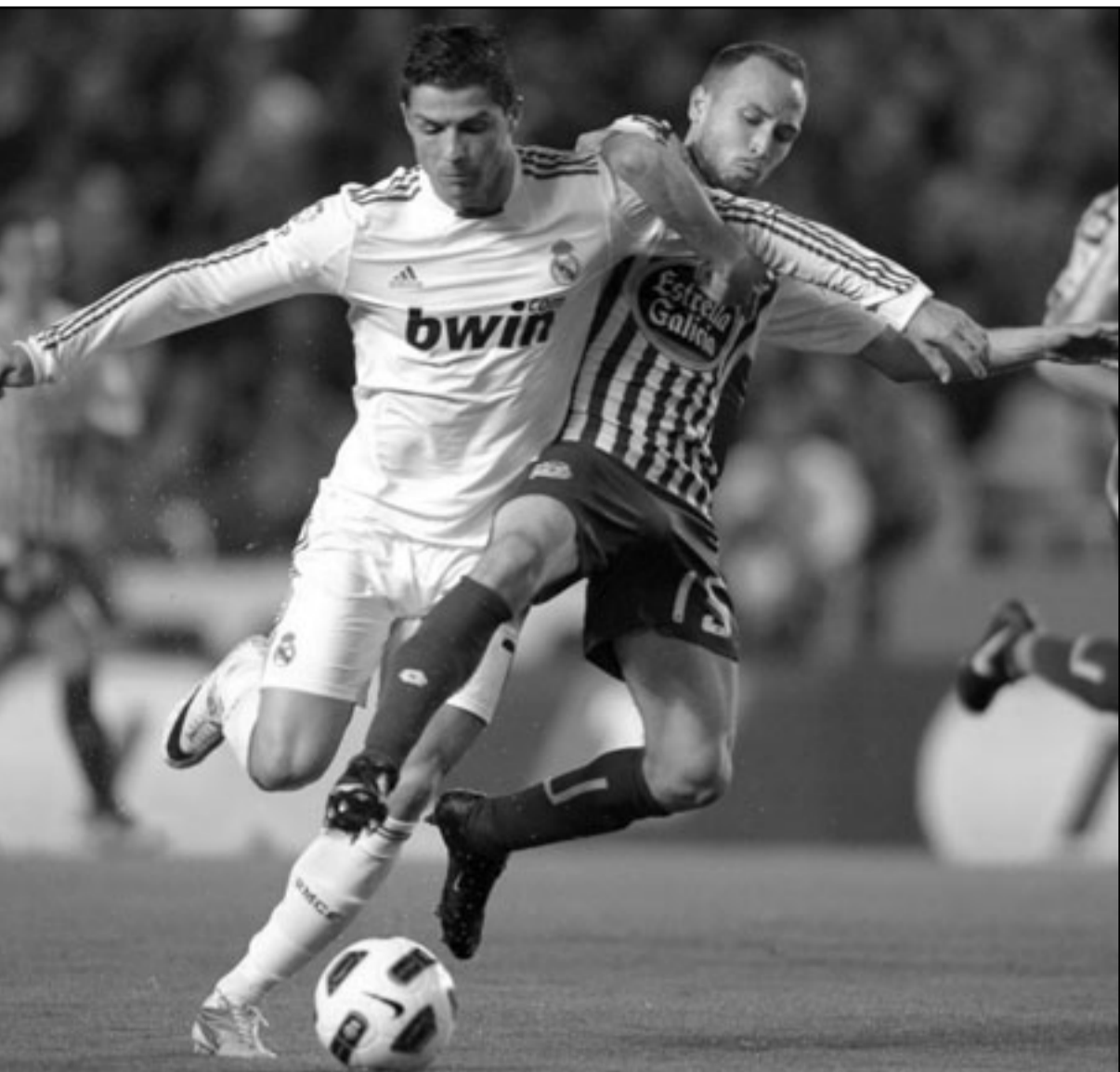
نجم ريال مدريد رونالدو يتغرد بالكرة ومدافع ديپورتيفو «لاوري» يحاول انتزاعها من قدميه

وتابع «من غير الطبيعي أنه بعد مشاركتنا في دوري البطال أوروبا نعود