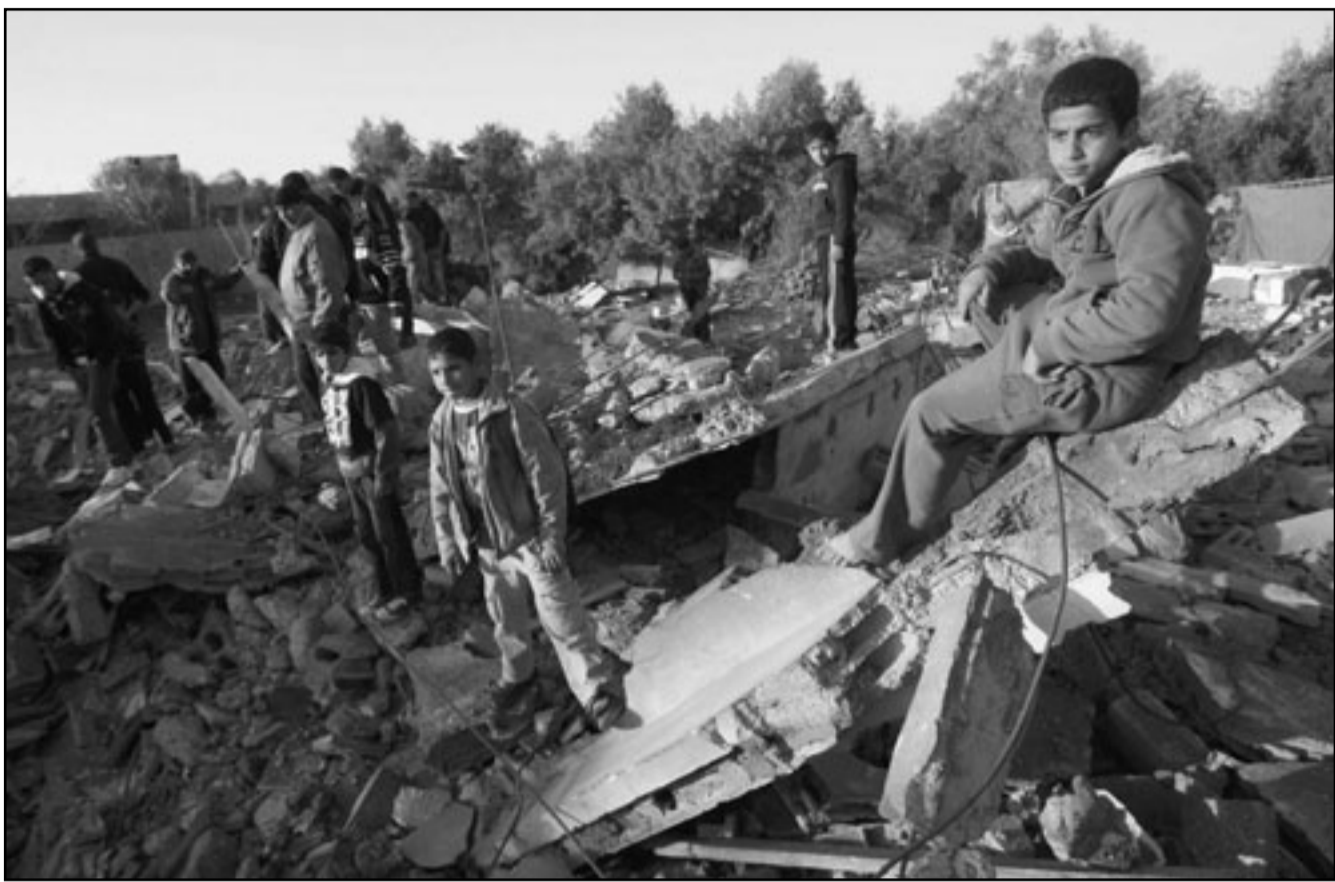
فلسطينيون بين انقاض منازل دهما القصف الاسرائيلي

وبسبب تكرار عمليات إطلاق الصواريخ من غزة واستمرار حالة «الغليان» في الدول العربية المطالبة بتغيير أنظمة الحكم قررت شرطة