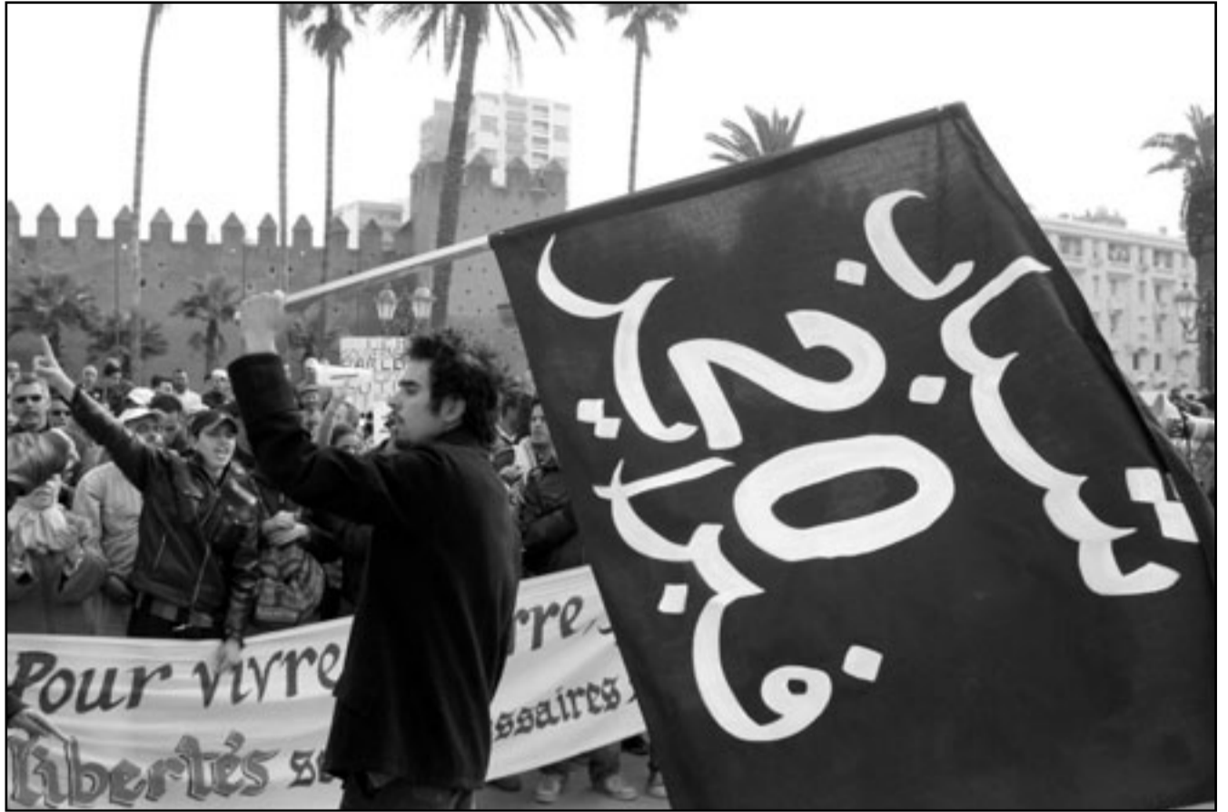
راية «شباب 20 فبراير» وسط تظاهرة امس الاحد بالعاصمة الرباط

وقالت وكالة الأنباء المغربية ان تجمعا عدا مدن مغربية امس الاحد والسبت تظاهرات في اطار مواصلة المطالبة باصلاحات دستورية وسياسية واقتصادية واجتماعية ومحاربة الفساد تخلل بعضها موجهات وعنف كان اشدها في مدينة الداخلة أقصى جنوب البلاد والتي تسفر تفت قتل وجرحي. وقالت وكالة الأنباء المغربية ان تجمعات نظمت ببعض المدن في اطار تظاهرات ما يعرف بشباب 20 فبراير، خصوصا في الدار البيضاء والرباط والداخلة، قبل ان تنتفض في جو من الهدوء. واوضحت ان السار البيضاء، عرفت تجمعا وكافة الابناء المغربية ان تجمعات نظمت ببعض المدن في اطار تظاهرات ما يعرف بشباب 20 فبراير، خصوصا في الدار البيضاء والرباط والداخلة، قبل ان تنتفض في جو من الهدوء. واوضحت ان السار البيضاء، عرفت تجمعا وكافة الابناء المغربية ان تجمعات نظمت ببعض المدن في اطار تظاهرات ما يعرف بشباب 20 فبراير، خصوصا في الدار البيضاء والرباط والداخلة، قبل ان تنتفض في جو من الهدوء.