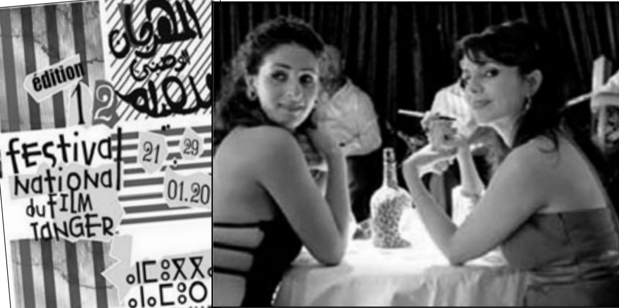
لقطة من فيلم «نساء في المرايا»

■ ثمانية أفلام على الأقل لم تنتج سنة 2010. أما إذا أضفنا إليها كلا من فيلم سعد الشرايبي وفيلم محمد مرنيش اللذين أنتجا سنة 2011 بشهادة المركز السينمائي المغربي نفسه، وفيلم «فيلم» الذي لا تطبق عليه تسمية الفيلم المطول، فتنتج إلى 8 أفلام مطولة سنة 2010 إن الوقت لا يحتمل ممارسة التزييف، لأن الحقيقة أقوى وتضع ولن يجدي البعض الاستمرار في التعمير وممارسة الكذب المثير للدعشة، في محاولة لطمس الحقيقة، إلى أن عنق الحقيقة على طريقة «ثقافة البروجاز»، كي تتجاوز مع أرواح الشخص وورغياته أمر منبوه، فالطلب هو معالجة الشأن السينمائي المغربي في واقعه وليس الهروب إلى ممارسة التزوير برؤية ذات بعد واحد، لأن حل الكذب قصير. ليس بالكذب أو بالسلوك الاتصالي، نثرى السينما المغربية، ربما حصل ذلك نتيجة انهماج الروح التضالوية التي قاد إلى انهيار المنويات الفترية وتآزم الذات التي فضلت الفوائد على الأخلاقيات.