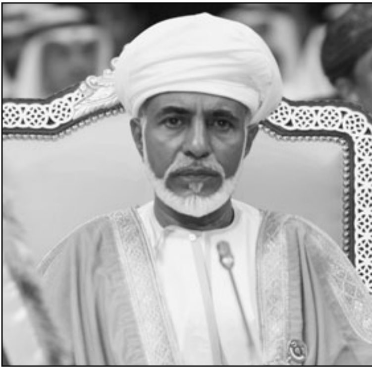
السلطان قابوس بن سعيد

■ مسقط - وكالات: أكد مصدر عماني لوكالة فرانس برس ان متظاهرين عمانيين قتلوا برصاص مطاطي اطلقته الشرطة خلال مواجهات شمال مسقط الاحد، فيما اصيب خمسة آخرون بجروح. وقال شاهد من رويترز ان النيران تندلع في مركز للشرطة ومبنى حكومي في بلدة صحار العمانية الأحد بعد اشتباكات بين الشرطة وأكثر من ألفي محتج يطالبون باصلاحات في السلطنة. وقال المصدر الامني «قتل شخصان برصاص مطاطي اطلقته الشرطة العمانية واصيب خمسة آخرون خلال مواجهات في صحار (تبعد حوالي 200 كلم شمال مسقط) عندما حاولت مجموعة من المتظاهرين التقدم باتجاه مركز للشرطة». وأضاف المصدر ان المتظاهرين «قاموا باحراق بعض السيارات». وفي الوقت الذي اعتصم فيه أعضاء مجلس الشورى داخل مبنى القصران السلطان قابوس أوقف العمل بمرسوم التشكيل الوزاري المحذوف الذي أثار حفيظة المعتصمين والمتقنين الذين أصدروا بياناً يستنكرون فيه القتل المحذوف التي تم فيها تدوير المناصب من دون إحداث تغيير جوهري يتفق مع طموحات الشعب. وقالت مصادر