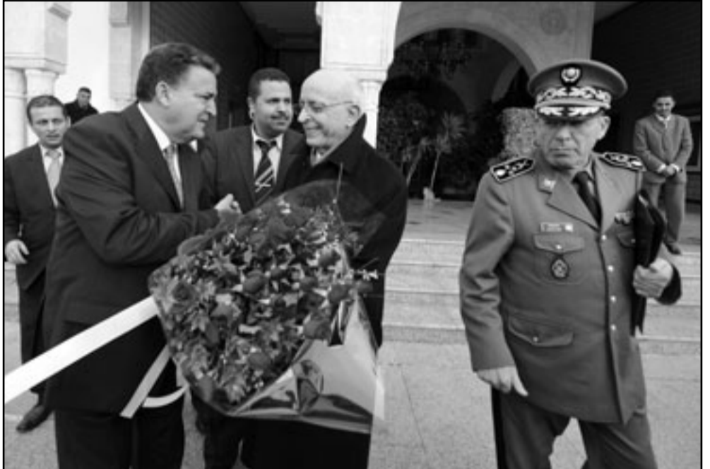
محمد الغنوشي يودع وزير داخلية فرحات الراحمي بعد إعلان الاستقالة، بينما بدأ كان الجنرال رشيد عمار يستعجل الانصراف

الرباط- «القدس العربي»- وكالات: أعلن في تونس مساء امس الأحد عن استقالة الباجي قائد السبسي رئيسا للحكومة الانتقالية خلفا للغنوشي الذي قدم استقالة امس الأحد في أعقاب موجة من الاحتجاجات الشعبية أسفرت عن مقتل قتلى وجرحى وتوتر في عدة مدن بالبلاد. وقائد السبسي من قياديي التجمع الدستوري الديمقراطي الذي حكم تونس الى الشهر الماضي، وتقلد عدة مناصب وزارية في حكومات الرافضين الراحل الحبيب بورقيبة، كما كان من المرشحين للرئيس الخلووع زين العابدين بن علي عداة عندما كان وزيرا أول. وتتهم الغنوشي بأنه قريب من النظام السابق في تونس الذي أطيح به الشهر الماضي في انتفاضة شعبية، واتهموه ايضا بعدم إجراء اصلاحات كافية وسريعة. وقال الغنوشي ان استقالته ستوفر «اجواء افضل للعهد الجديد»، مضيفا انه يريد الحيولة دون سقوط المزيد من الضحايا في الاضطرابات السياسية التي تشهدها البلاد. وقتل خمسة اشخاص واصيب عدد اخر بجروح في اشتباكات بين قوات الامن ومظاهريين بالسنغال الحكومة الانتقالية. وقال الغنوشي عبر التلفزيون الرسمي ان استقالته تحمّل البلاد. وتشهد تونس حالة من عدم الاستقرار منذ موجة الاحتجاجات التي أطاحت بالرائس السابق زين العابدين بن علي في 14 كانون الثاني/يناير وهو ما شجع ثورة مماثلة في مصر وأثار احتجاجات في أنحاء العالم العربي. لكن الكثير من التونسيين اصعبوا بالاحباط بسبب المسار البطيء للتغيير منذ الثورة. وأكد الغنوشي مجددا على تعهد الحكومة باجراء انتخابات رئاسية في 15 تموز/يوليو لاختيار رئيس جديد للبلاد خلفا بن علي. ميدانيا أعلنت وزارة الداخلية ان خمسة اشخاص قتلوا خلال «عمال الخبز والتخريب والنهب والحرق» التي وقعت السبت في شارع الحبيب بورقيبة بوسط العاصمة.