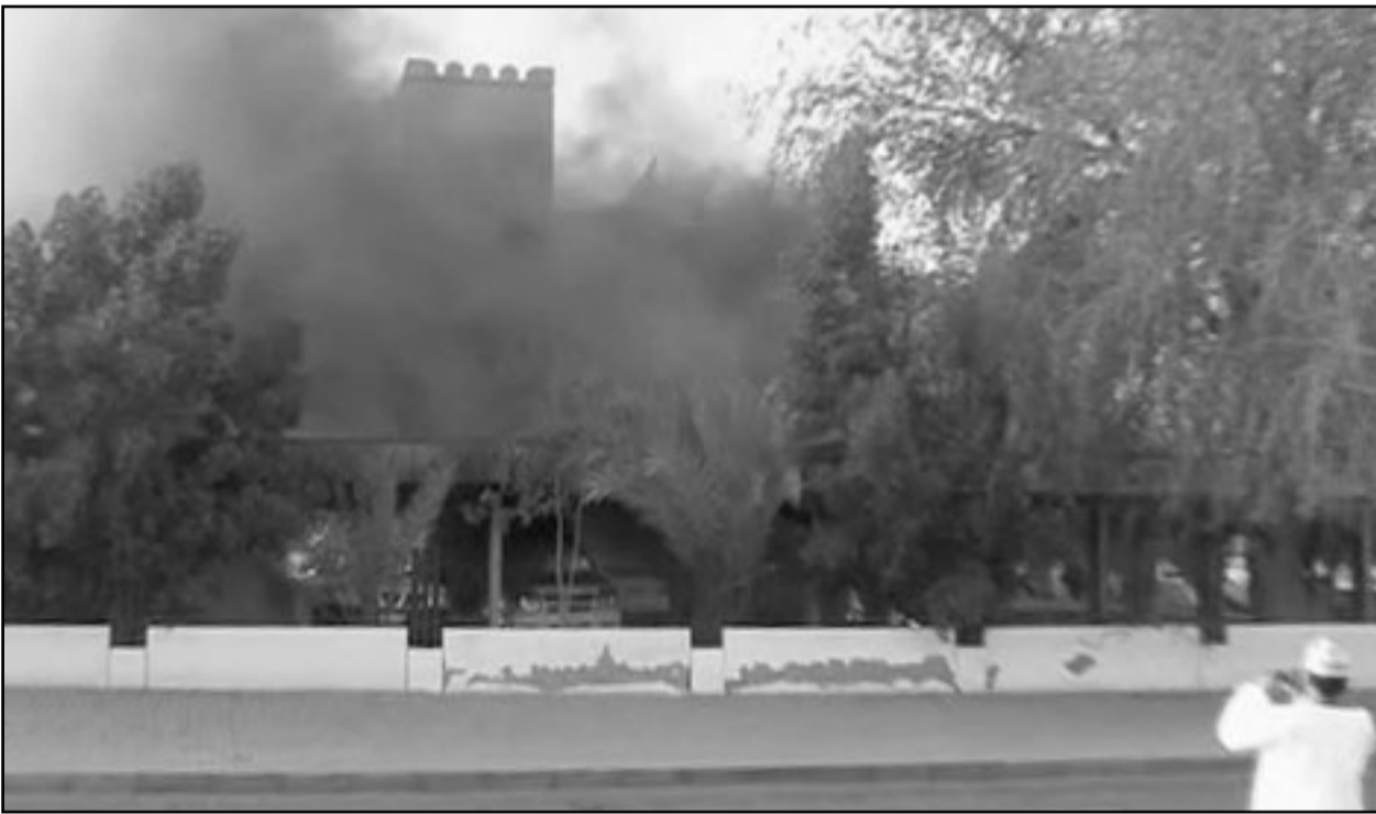
عماني يصور مبنى حكوميا اشعله المتظاهرون في صحار امس