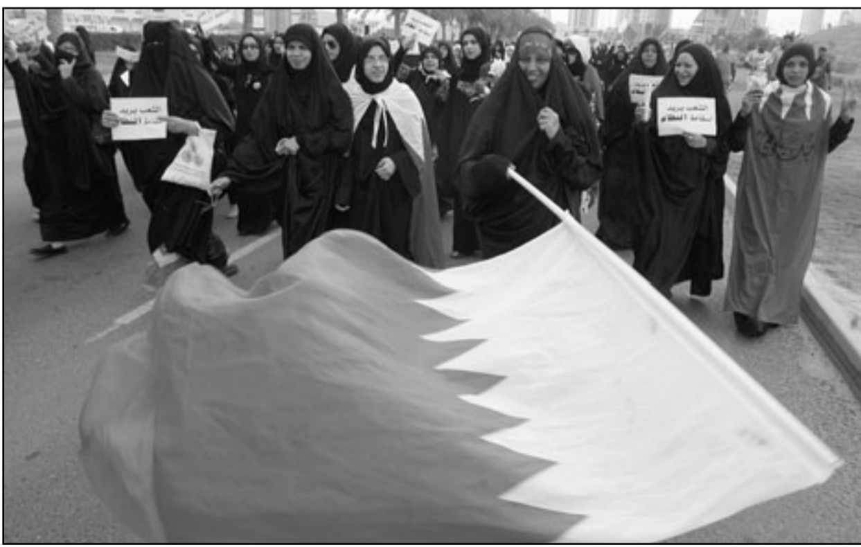
بحرينيات يتظاهرن في المنامة يطالبن باسقاط النظام

■ نيويورك - يو بي اي: قال محللون عسكريون أفغان واعتبرت ان التكتيكات الجديدة تسلط الضوء على تحدي حركة التمرد المتنامية التي لديها خزان تستخدم وجهها جديدا ومرعايا إذ أن المسلحين يستخدمون الانتحاريين الذين يتسببون بأكثر عدد من الضحايا ويخططون لحملة اغتيالات أيضا. ونقلت صحيفة «نيويورك تايمز» عن المحللين قولهم ان رهان المسلحين هو على ان الخوف سيولد الغضب وسيقود الأفغان أي إيمان لديهم بالقوات الحكومية الأفغانية وعودون بالتالي إلى «طالبان». وقال الجنرال جاك كي، الذي تقاعد من الجيش الامريكي في العام 2003 وهو حاليا أحد مستشاري قائد الناتو في أفغانستان الجنرال ديفيد بترابريس، «لا بد من التساؤل حاليا، ان كنت في طالبان ماذا كنت ستفعل؟». ورأى انه نظراً لأحتشاد قوات «الناتو» في الجنوب، يبدو ان الجواب هو مهاجمة الدينين وخلق حالة من عدم الاستقرار في مسعى لإعادة تعزيز الامتصاص من القوات الأجنبية والشكوك بالرئيس الأفغاني حامد كرزاي. ولقبت الصحيفة إلى انه خلال أقل من 4 أسابيع، قتل 116 أفغانياً في 7 تفجيرات انتحارية، مشيرة إلى ان هذا التغيير واضح عن التفجيرات الانتحارية قبل 6 أشهر فقط يوم كان نوحها في منطقة الخليج.