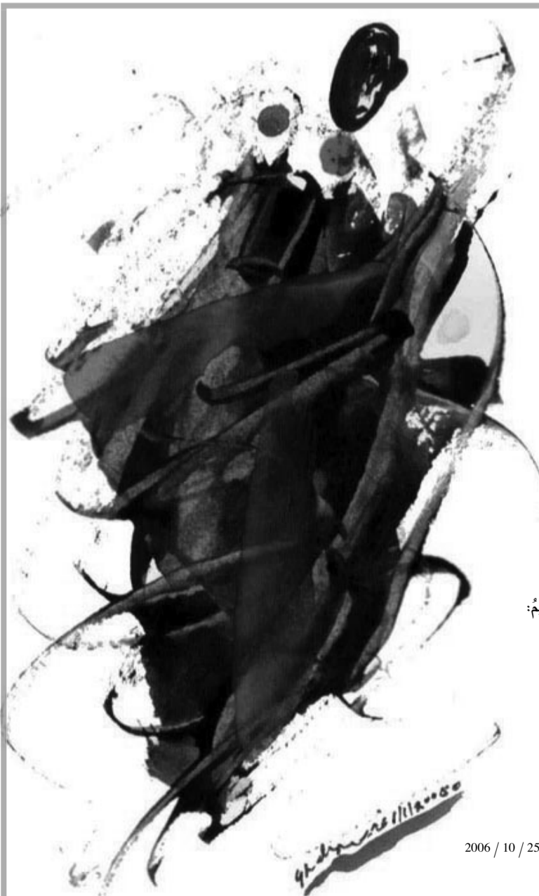
طرابلس 10 / 25 / 2006

نديا يغازلها ويركض حولها كهفٌ تباعد في الزمان يا أيها الوطن الذي ما نك من زمن يحصن صوته ويفصل التاريخ تابوتا يودع موته يا أيها الوطن المغرد في الزمان يا أيها الحصن المخلد في المكان إني أبغض فوق هامتك التي ارتفعت جنونا ولمّ من صحرائك الكبرى فتونا ها إنني أسعى إليك بكل ما أوتيت من شغف الرجل حتى إذا أنستُ قريبا من رباك ركعتُ لك لأقبلكُ تتسابق الدقات في وادي المدى حتى إذا قال الزمن: «هل تلتقي؟» هتف الجميع الحبّ والعنقاء والبلد العظيم؛ «سنتلقى» سكنون نهراً من كؤوس الحب يحتضن الوجود نهراً يسيل مع المدى الليبي هداراً ويُسكرة الخلود (من ديوان «فردت أن أفرح»)