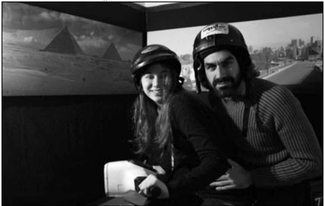
اشتا تصوير إحدى اللقطات