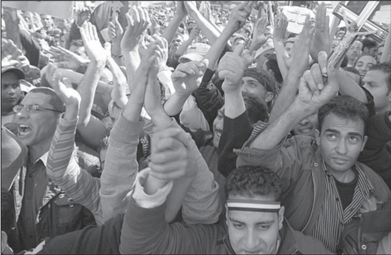
مصريون اقباط يتظاهرون امام مبنى التلفزيون احتجاجا علي حرق كنيسة اطيح امس

الانتخابات الرئاسية. وقالت الوكالة ان منظاري تطرق الى «اجراء الاستفتاء على التعديلات الدستورية يوم 19 آذار/مارس الجاري» وطلب من رئيس الوزراء «عقد اجتماعات للمحافظين لاعداد منع اقامة اي مشروع على النهر خارج اراضيه». وأكد المشير طنطاوي مجددا خلال هذا اللقاء، بحسب الوكالة المصرية، ان المرحلة الانتقالية ستتم وفقا للجدول الزمني الذي اعلنه المجلس الاعلى للقوات المسلحة في الاعلان الدستوري الذي اصدره في 13 شباط/فبراير الماضي بعد يومين من سقوط مبارك. وكان هذا الاعلان الدستوري اشار الى ان المرحلة الانتقالية ستشهد ثلاث مراحل تبدأ باعادة تعديلات دستورية واجراء استفتاء عليها ثم اجراء انتخابات تشريعية واخيرا