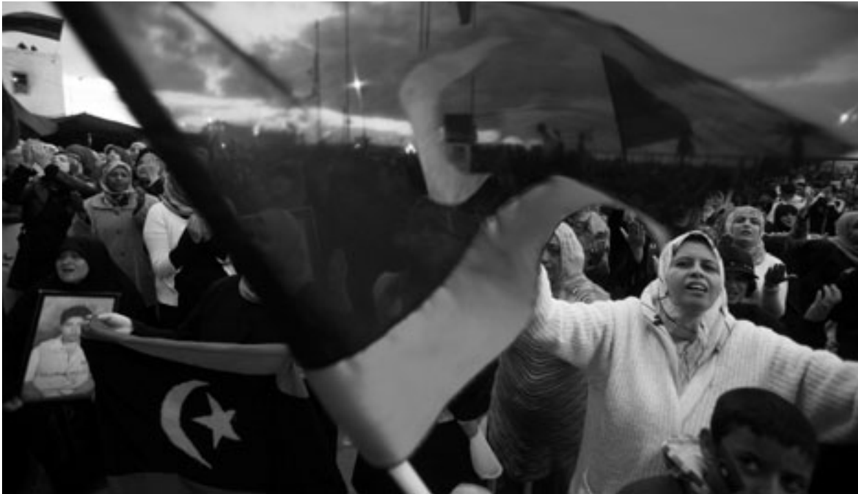
على الغرب ان يختار بين الديمقراطية والغيان في العالم العربي

لقد سبق أن كانت، منذ زمن ليس ببعيد، ثورة استدعت شراكة استكمالية من هذا النوع. وقد كانت اقل بروزاً للعيان، وذلك ان الشخصين المتحدثين كانا من ذات الحزب، ومع ذلك، فبين رونالد ريغن، الذي قضى معظم