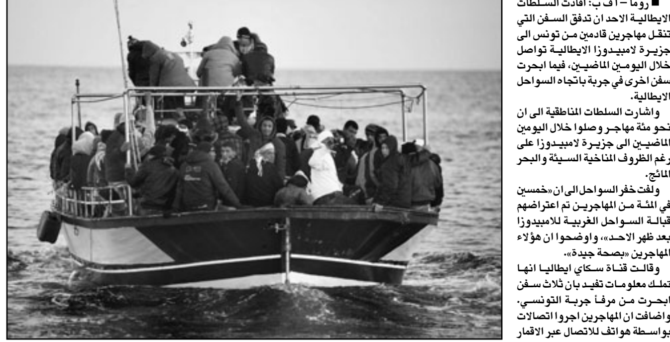
قارب مهاجرين عند وصوله الى لامبيدوزا الأحد قادمًا من تونس

روما - ا ف ب: أفادت السلطات الإيطالية الأحد أن تدفق السفن التي تنقل مهاجرين قادمين من تونس إلى جزيرة لامبيدوزا الإيطالية تواصل خلال اليومين الماضيين، فيما ابحت سفن أخرى في جربة باتجاه السواحل الإيطالية. وأشارت السلطات المنطقية إلى أن نحو مئة مهاجر وصلوا خلال اليومين الماضيين إلى جزيرة لامبيدوزا على رغم الظروف المناخية السيئة والبحر المائج. ولفت خفر السواحل إلى أن «مخمين في المئة من المهاجرين تم اعتراضهم قبالة السواحل الغربية للامبيدوزا بعد ظهر الأحد»، وأوضحوا أن هؤلاء المهاجرين «بصحة جيدة» وقالت قنسة سكايا الإيطالية انها تملك معلومات تفيد بأن ثلاث سفن ابحت من مرفأ جربة التونسي، وأضافت أن المهاجرين اجروا الاتصالات بواسطة هواتف للاتصال عبر الأقمار الاصطناعية مع مواطنين لهم كانوا قد سبقوهم إلى لامبيدوزا لإبلاغهم بوصولهم.