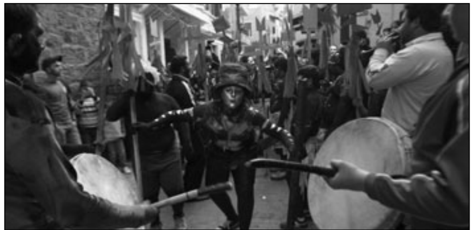
من مهرجان زامبو في طرابلس بلبان

■ طرابلس- وروتترز: احتفل سكان مدينة طرابلس الساحلية في شمال لبنان يوم الأحد (6 آذار/مارس) بمهرجان «زامبو»، السنوي في بداية موسم الصوم الكبير عند المسيحيين الذي يسبق عيد القيامة الجيد. وطلّى المثقون أجسامهم ووجههم بألوان مختلفة وخرجوا إلى الشوارع في أزياء تماثل ملابس سكان أمريكا الجنوبية الأصليين، حيث غنوا ورقصوا في المهرجان.