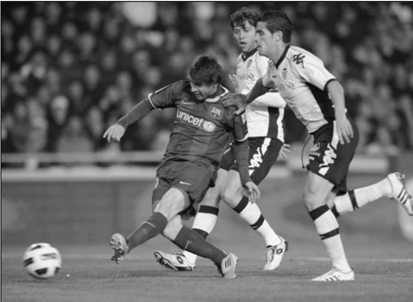
ليونيل ميسي نجم برشلونة (يسار) يحاول الانفراد بالكرة في منافسة مع مدافع بولندي ريكاردو كوستا

ومن الصعب على ميسي أو ماهير برشلونة أن تتسنى هذه الليلة التي سجل فيها ميسي أربعة أهداف (سوبر هاتريك) ليقود برشلونة إلى الفوز 4/1