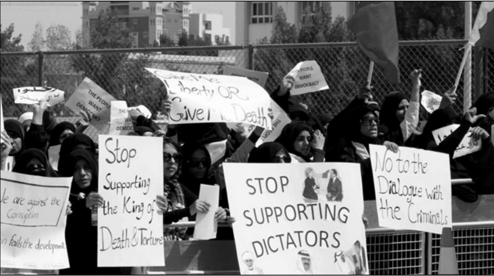
بحرينيات يتظاهرن امام السفارة الامريكية في المنامة امس

منتخبه مع اجراء تحقيق في ممارسات قوات الامن، وتطالب المعارضة ايضا بتوفير ضمانات تكفل استمرار الاحتجاجات السلمية مع ضرورة ان تقوم وسائل الاعلام الرسمية بتغطية مكثفة لهذه الاحتجاجات.