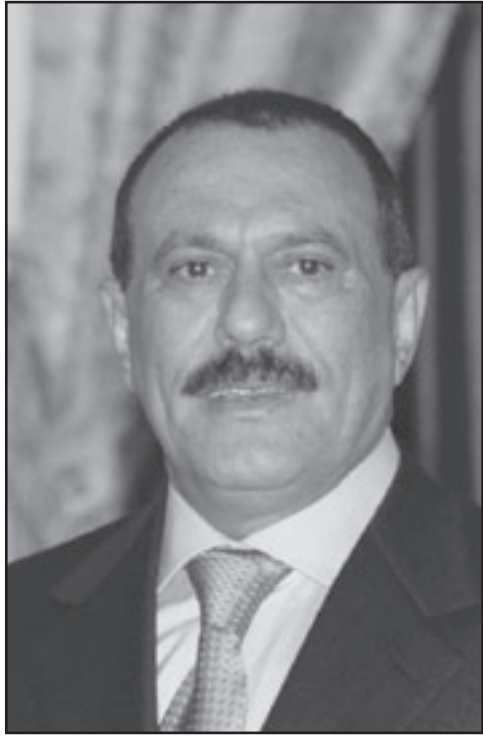
علي عبد الله صالح

تعهد ائتلاف المعارضة اليمنية أمس الاثنين بتصعيد احتجاجات تجتاح البلاد وتطالب بتنحي الرئيس علي عبد الله صالح عن الحكم بعدما رفض خطة تقضي بأن يترك السلطة العام الحالي. ويتعصم عشرات الآلاف من المحتجين في مدن يمنية كبرى ولا يتنامون في الليل لسماع الخطابات وإنشاد الاغاني الوطنية بعد أن ارتفعت نبرة احتجاجاتهم المناهضة لسلطة صالح. ورفض صالح وهو حليف للولايات المتحدة في حربها على الجناح الاقليمي لتنظيم القاعدة خطة اقترحها ائتلاف للمعارضة الاسبوع الماضي وتقضي بإجراء إصلاحات سياسية وانتخابية تمهد الطريق أمام تنحيه عن السلطة في غضون العام الحالي. وقال محمد الصبري وهو المتحدث باسم الائتلاف إن الاحداث الاخيرة اثبتت أن النظام غير قادر على تلبية مطالب الشعب وإنه لهذا السبب يجب أن يرحل. وقال لرويترز إن المحتجين يدرسون عدة خيارات للتصعيد من بينها تنظيم يوم ينزل فيه كل اليمنيين إلى الشوارع ويطلق عليه اسم جمعة العودة وخيارات أخرى. واقرب اليمن جبار السعودية أكبر مصدر للنفط في العالم من حافة التحول إلى دولة فاشلة حتى قبل الاحتجاجات الأخيرة ويسعى صالح جاهدا لترسيخ هدة مع المتطرفين الحوثيين في الشمال وإخماد حركة انفصالية في الجنوب. وأضافت الاحتجاجات اليمنية المتنامية وسلسلة من الانتساقات في صف حلفاء صالح إلى الضغوط عليه لانهاء حكمه الممتد منذ ثلاثة عقود في اليمن لكن لا يبدو أن أي من الجانبين مستعد للتنازل لانهاء الأزمة. ورفض صالح خطة المعارضة التي كانت تتضمن أيضا إقالة أفراد في أسرته من مناصب مهمة وكرز الرئيس اليمني تعهد بالاستقالة عند انتهاء فترته الرئاسية في 2013. وتبني صالح اقتراحا قدمه زعماء دينيون بتعديل