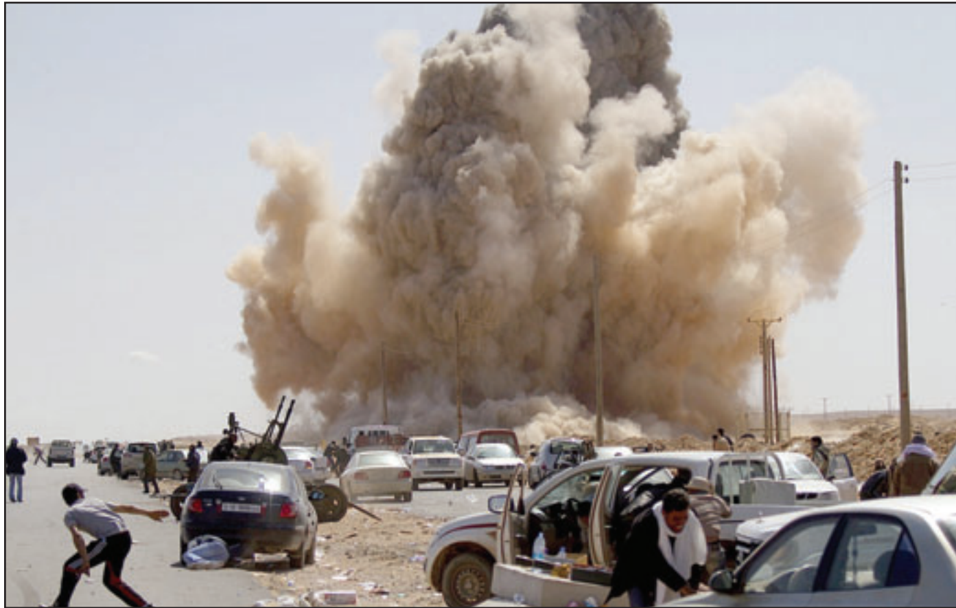
سكان بلدة رأس لانوف النغظية يحاولون الفرار من ضربات جوية تشنها القوات الموالية للزعيم الليبي معمر القذافي

طرابلس - وكالات - لندن - «القدس العربي»: