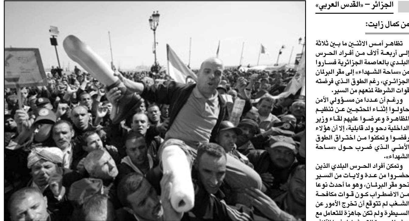
حارس بلدي من معطوبي الصراع الأهلي في التسعينات يحاول على الأكتاف في مظاهرة أمس وقد حمل رجليه الاصطناعية في يده