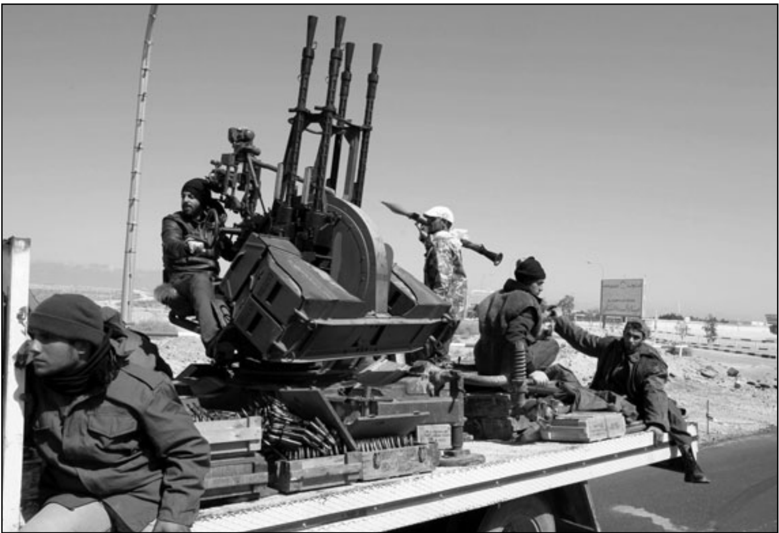
قوات من الثوار الليبيين خارج قرية راس لانوف

التوجه غربا إلى ما بعد بن جواد البلدة التي استعادتها القوات الموالية للزعيم الليبي. وكانت قوات القذافي استعادت الأحد بن جواد البلدة الصغيرة التي وصل إليها الثوار بعد ظهر السبت على أمل مواصلة طريقهم إلى سرت التي تبعد حوالي مئة كيلومتر غربا.