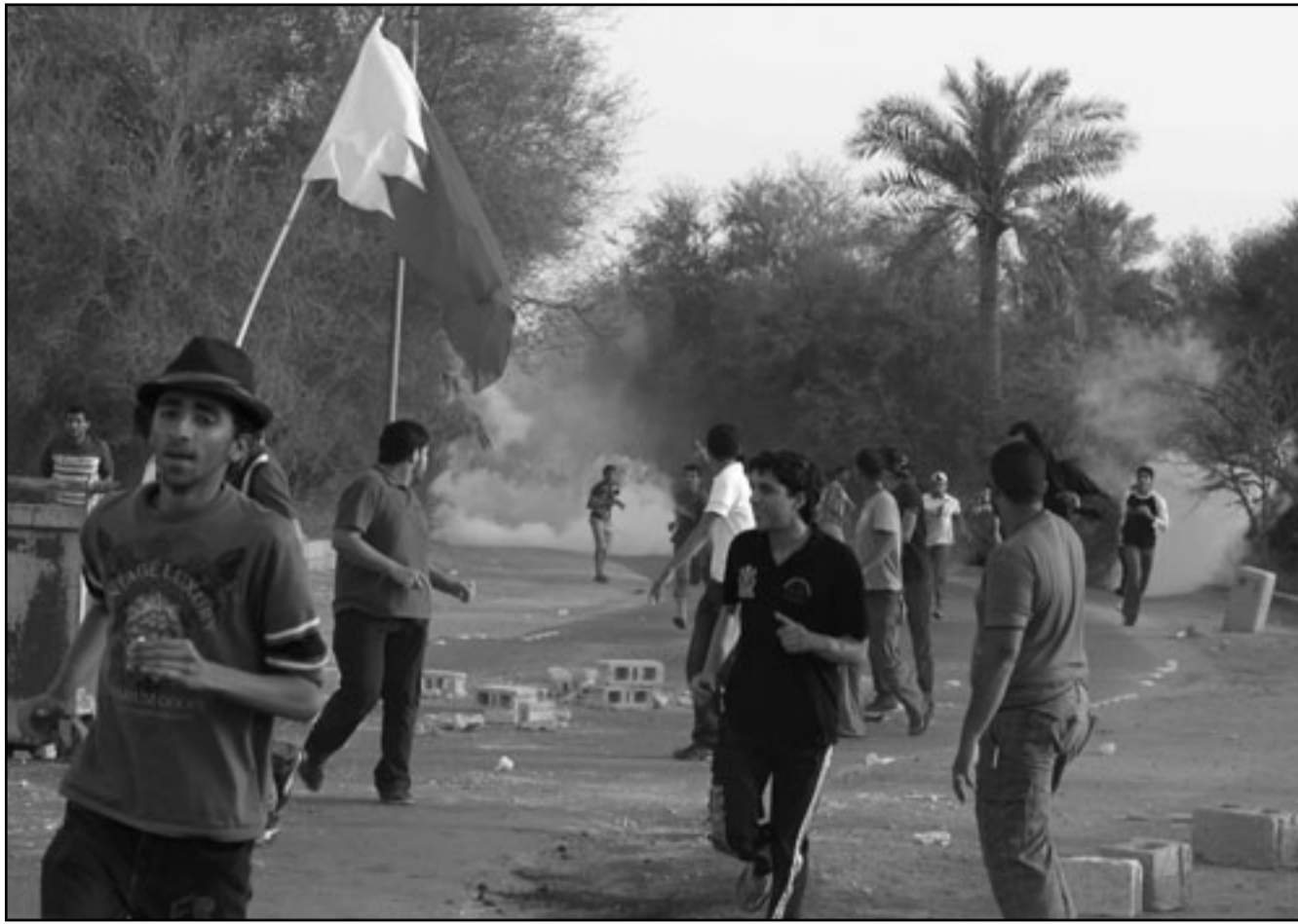
شباب بحريني يتظاهر مطالباً بإصلاحات في المنامة