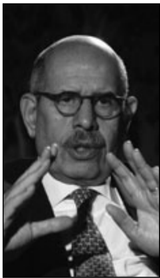
د. محمد البرادعي

القاهرة - يو بي اي: كشف صحيفة الاهرام المصرية الجمعة ان مجموعة اسلامية متطرفة قامت بقطع اذن شاب مسيحي في صعيد مصر بعد ان اقامت عليه الحد بدعوى «علاقة ائمة» مع سيدة مسلمة. وذكرت الصحيفة ان المجموعة التي لم يتم تحديد هويتها اجرت محاكمة للشباب القبطي ايمن انور مرتي بتهمة اقامة «علاقة ائمة» مع السيدة المسلمة ثم قاموا بالهجوم على شقيقه وتكسير محتوياتها واحراق سيارته قبل الحكم عليه بقطع احدى اذنيه.