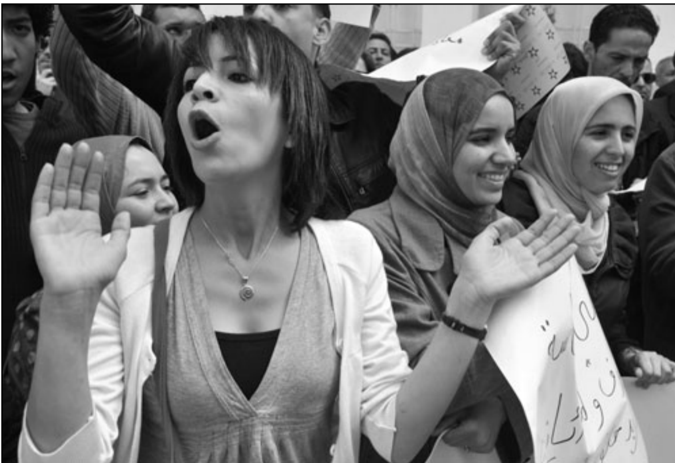
صحافيون تظاهروا الخميس أمام مبنى التلفزيون الحكومي بالرباط مطالبين بمزيد من الحرية الإعلامية

وقال بلاغ مشترك للمكتب الوطني النقابي الموحد للشرطة الوطنية للاذاعة والتلفزة، وبنقابة مستخدمي القناة الثانية، والنقابة الديمقراطية للاعلام السعدي البصري، ان «الوقفة محطة تضالعية وستليها خطوات تصعيدية