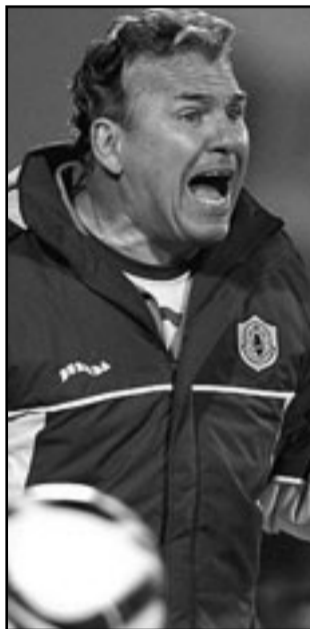
المدرّب البرازيلي سبستياو لازاروني

العهد، قال مدرب فريق قطر «هناك ستة فرق تنافس على المربع ولها حظوظ وافرة في ذلك، وفرصتنا لا تزال قائمة في إنهاء الدوري ضمن المراكز الأربعة الأولى، وتبقى أمامنا تسع نقاط يمكن حصدتها في آخر ثلاث مباريات، وعلينا أن نستعد لها من الآن.