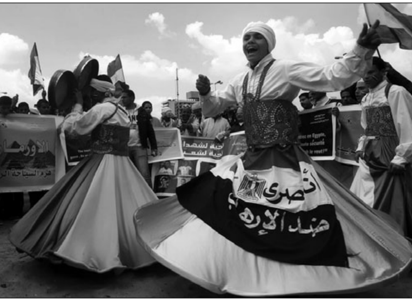
دراويش يرقصون في ميدان التحرير الجمعة

ويرى أن من يدعم القذافي يعد أمماً.. فيما حرص العديد من دعاة الفضائيات على الدعاء بالنصر لليبيين في القريب العاجل ودعا الشيخ محمد