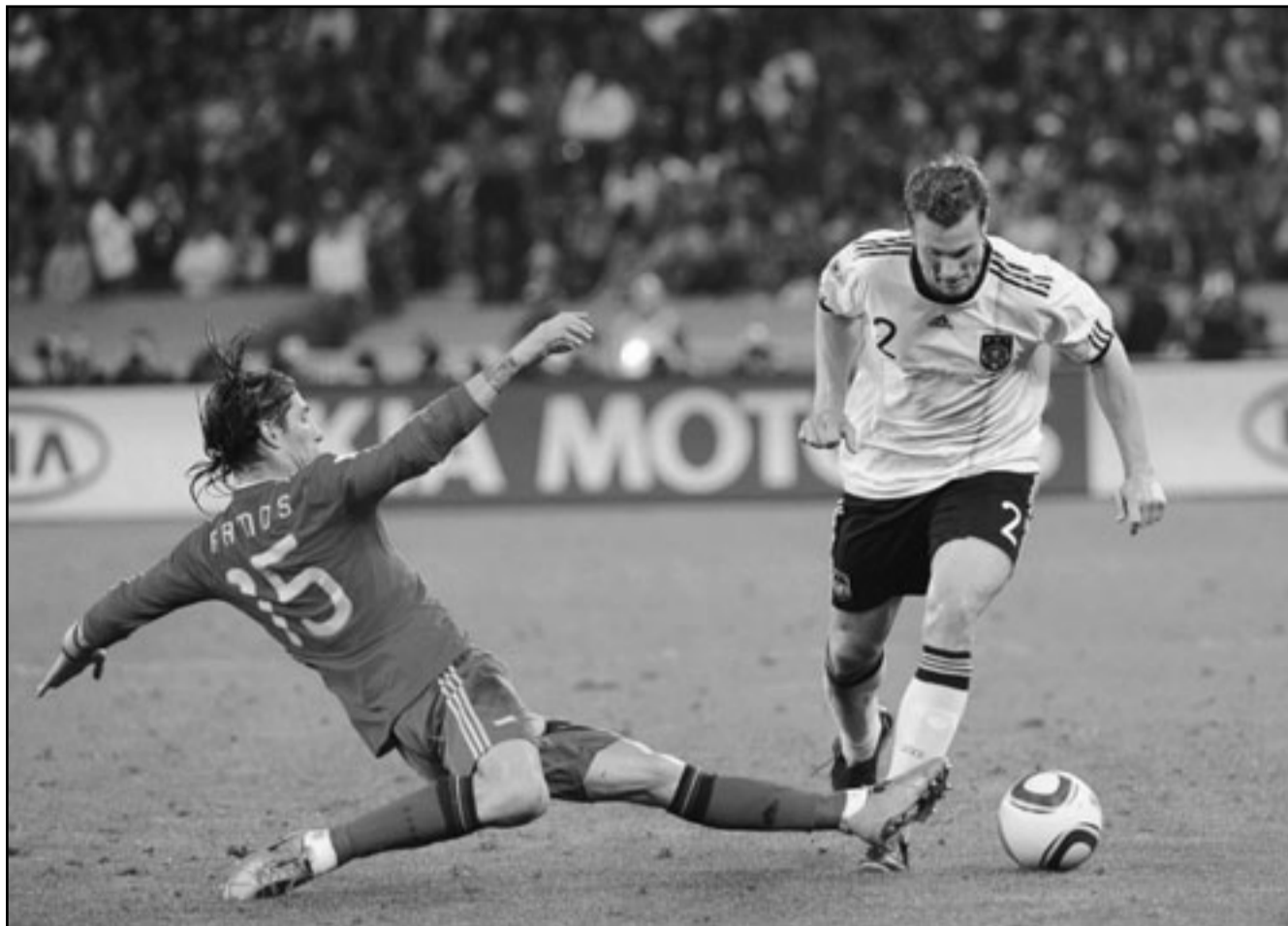
سيرجيو راموس مدافع منتخب اسبانيا (يسار) في صراع على الكرة مع مارسيل جانسين نجم المانيا

وفي حالة نجاح منتخب كازاخستان في هز شبك نظيره الالماني، فإنه سيدخل سجلات التاريخ حيث أنه سيكون الهدف رقم ألف في شبك المنتخب الألماني في تاريخ مبارياته الذي يمتد ل103 عام.