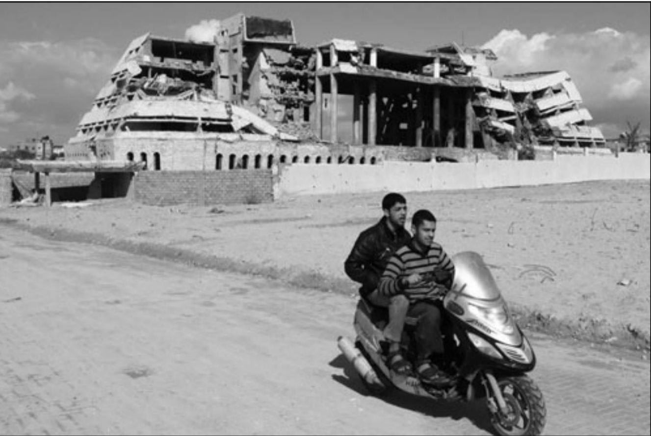
فلسطينيون يراقبون اثار القصف الاسرائيلي لموقع امثي لحماس في غزة

واستشهد نحو 1500 فلسطيني عدد كبير منهم من النساء والأطفال خلال تلك الحرب، وأصيب أكثر من 5000 آخرين، وهدمت قوات الاحتلال أكثر من 14 ألف منزل ومنشأة.