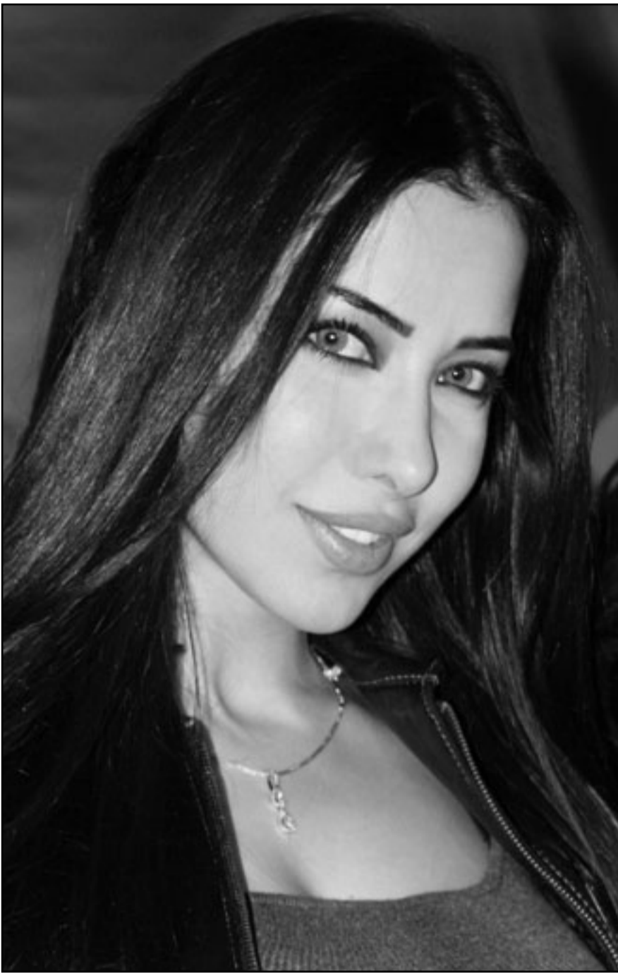
لقطة من فيلم «300 إسبارطي»

Link nrk2 www.nrk.no/net-tv/direkte/nrk2