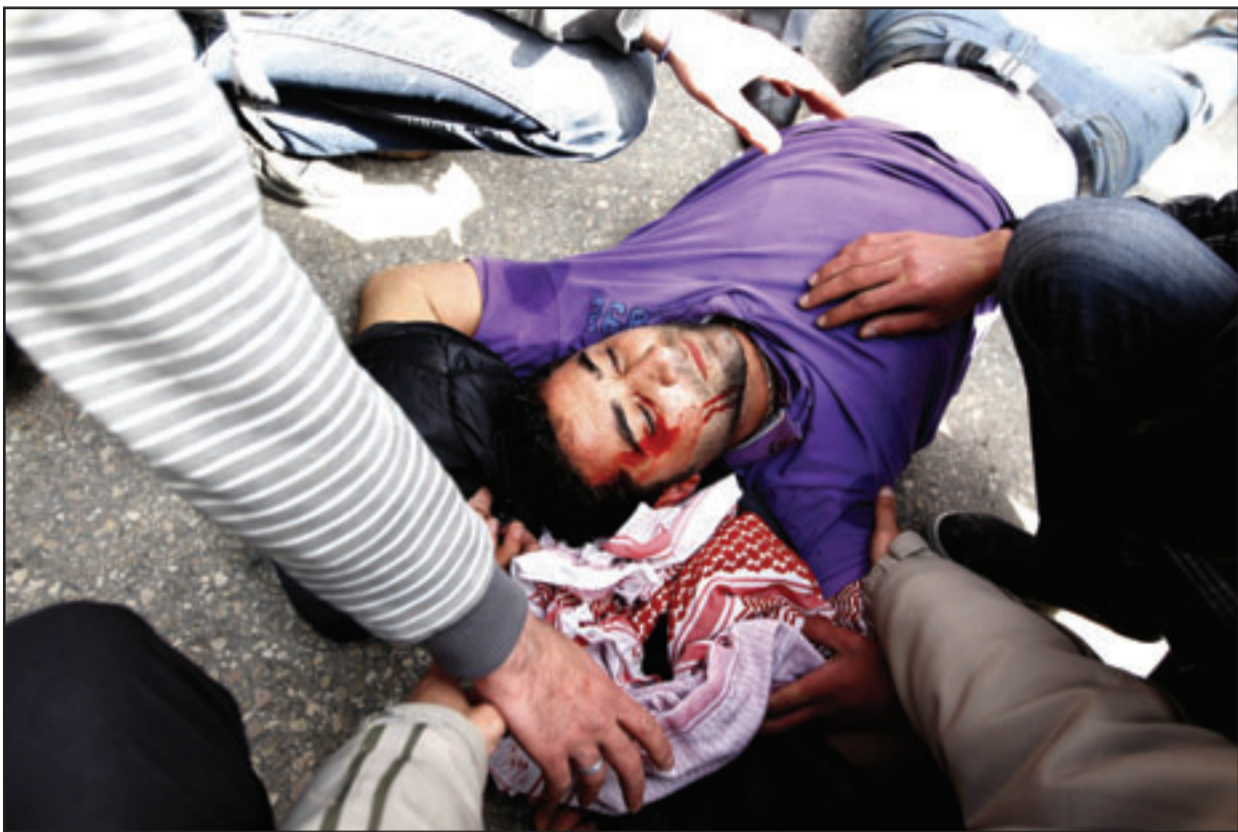
احد المصابين بهراوات الشرطة في عمان امس

■ درعا دمشق - وكالات: اتسع الجمعة نطاق التظاهرات المطالبة باطلاق الحريات في سورية واوقعت عشرات القتلى في محافظة درعا والمضمية والضمين في «يوم غضب» انطلق في معظم المدن والقرى السورية رغم اعلان السلطات السورية الخميس عن سلسلة من الاجراءات الاصلاحية في محاولة لمتصاص غضب الشارع، ونقلت قناة العربية التلفزيونية عن وزير الاعلام السوري محسن بلال قوله ان الوضع هادئ في سورية.