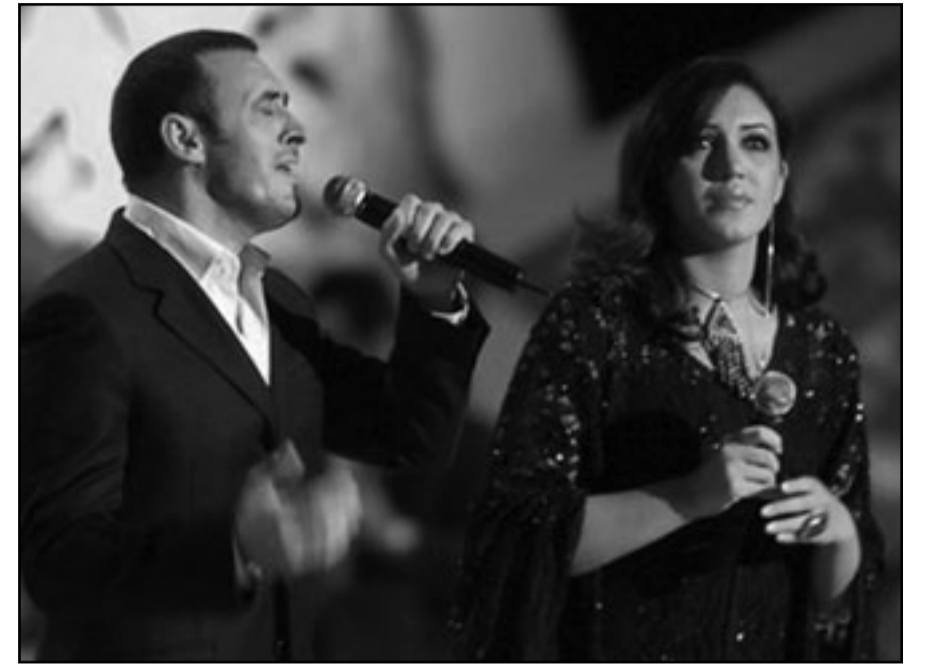
أسماء المنور مع كاظم الساهر