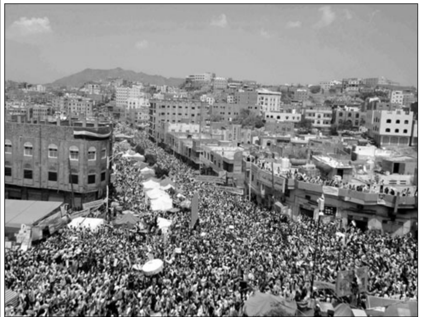
الآلاف المتظاهرين اليمينيون في صنعاء الجمعة

الشرق أمريكا برأسها على تلك الأحداث، وكان أسوأ ما صدر عنها هو تصريح وزير دفاعها ذي الخلفية الخبائية «غيثس» الذي طالب بضرورة تعطيم الدفاعات الجوية الليبية كي يكون حظر الطيران فوق ليبيا ممكناً، لأنه يخاف على الطيران الأمريكي من تهديد الدفاعات الجوية الليبية كما زعم، وطالب الجنرال «مولن» بضرورة إصدار توقيض من الأمم المتحدة يجيز استخدام القوة ضد القذافي.