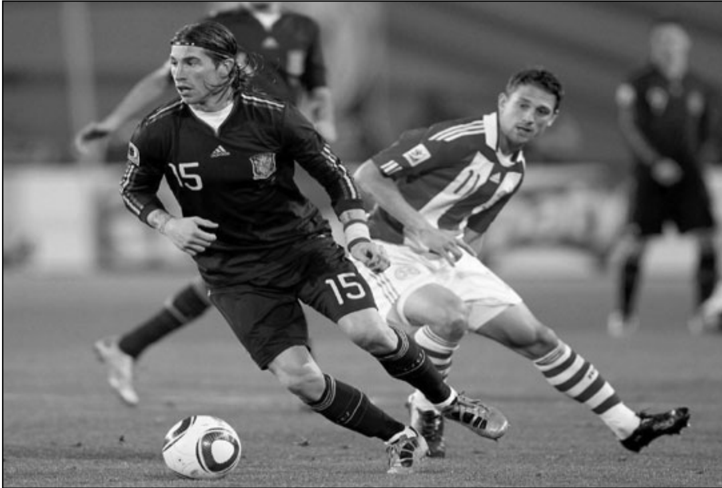
نجم منتخب اسبانيا سيرجيو راموس (في الواجهة) ينفذ بالكرة خلال المباراة مع باراغواي في كأس العالم

حيث يستضيف منتخب أندريجان صاحب المركز الخامس قبل الأخير في المجموعة. ويسعى المنتخب النمساوي إلى استعادة توازنه في التصفيات عندما يحل ضيفا على نظيره التركي باسطنبول اليوم في مباراة أخرى بنفس المجموعة.