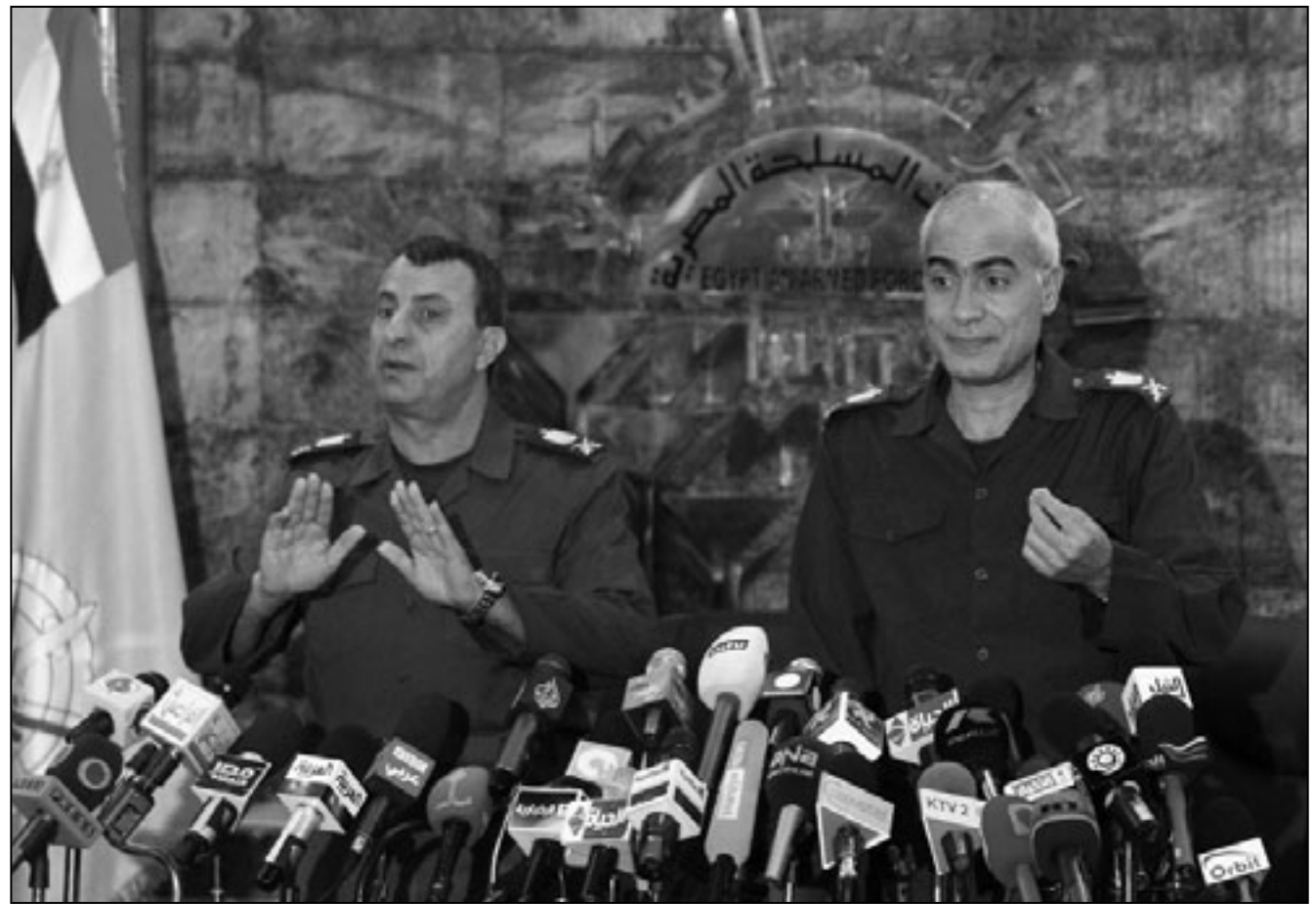
اللواء ممدوح شاهين (الى اليمين) يتحدث الى الصحافيين امس

القاهرة - ا ف ب: اعلن الجيش المصري الاثنين اجراء اول انتخابات تشريعية بعد سقوط الرئيس السابق حسني مبارك في ايلول/سبتمبر المقبل لكنه لم يحدد موعدا للانتخابات الرئاسية وهو جدول زمني ما زال مبهما يؤدي الى تعديد الفترة الانتقالية التي تعزز القوات المسلحة البقاء خلالها في السلطة. وقال اللواء ممدوح شاهين عضو المجلس الاعلى للقوات المسلحة مستشار وزير الدفاع في مؤتمر صحفي دعيت اليه الصحافة المحلية والدولية ان الانتخابات البرلمانية ستجري في شهر ايلول/سبتمبر المقبل، كما تعهد بالغاء حالة الطوارئ السارية في مصر منذ ثلاثين عاما عقب اجراء هذه الانتخابات التشريعية.