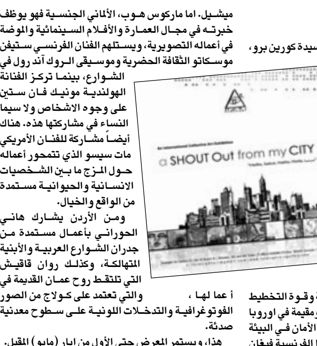
أعمالها، والفنونة جرافية والتدخلات اللونية على سطوح معدنية هذا، ويستم المعرض حتى الأول من ايار (مايو) المقبل.

عمان - «القدس العربي»: افتتحت سفيرة فرنسا في الأردن، السيدة كورين برو، يوم الإثنين، 28 آذار (مارس) الجاري افتتاح معرض «سلام من مدينتي» الذي يقامه مركز «رؤى 32» للفنون، ويضم أعمال تسعة فنانين وفنانات من ألمانيا، هولندا، فرنسا، إسبانيا والأردن وفنزويلا وأمريكا. تتمحور أعمال المعرض حول التعابير الفنية الخاصة بالمدن، ولا سيما «الحدران الخضراء»، التي تربط بين المدن المختلفة، من الأردن إلى أوروبا والعالم. الفنانون المشاركون في المعرض هم البرت كوما من إسبانيا، والذي ينتج تخطيطات مفعمة بالحيوية بسووعها الجسد الانساني بأسلوب يجمع ما بين العفوية وقوة التخطيط بلون واحد. إيرين يو، وهي من فنزويلا ومقيمة في أوروبا حيث تعبر عن القلق الناجم من اندعام الأمان في البيئة المدنية المحيطة به، وكذلك هو حال زميلتها الفرنسية فيغان