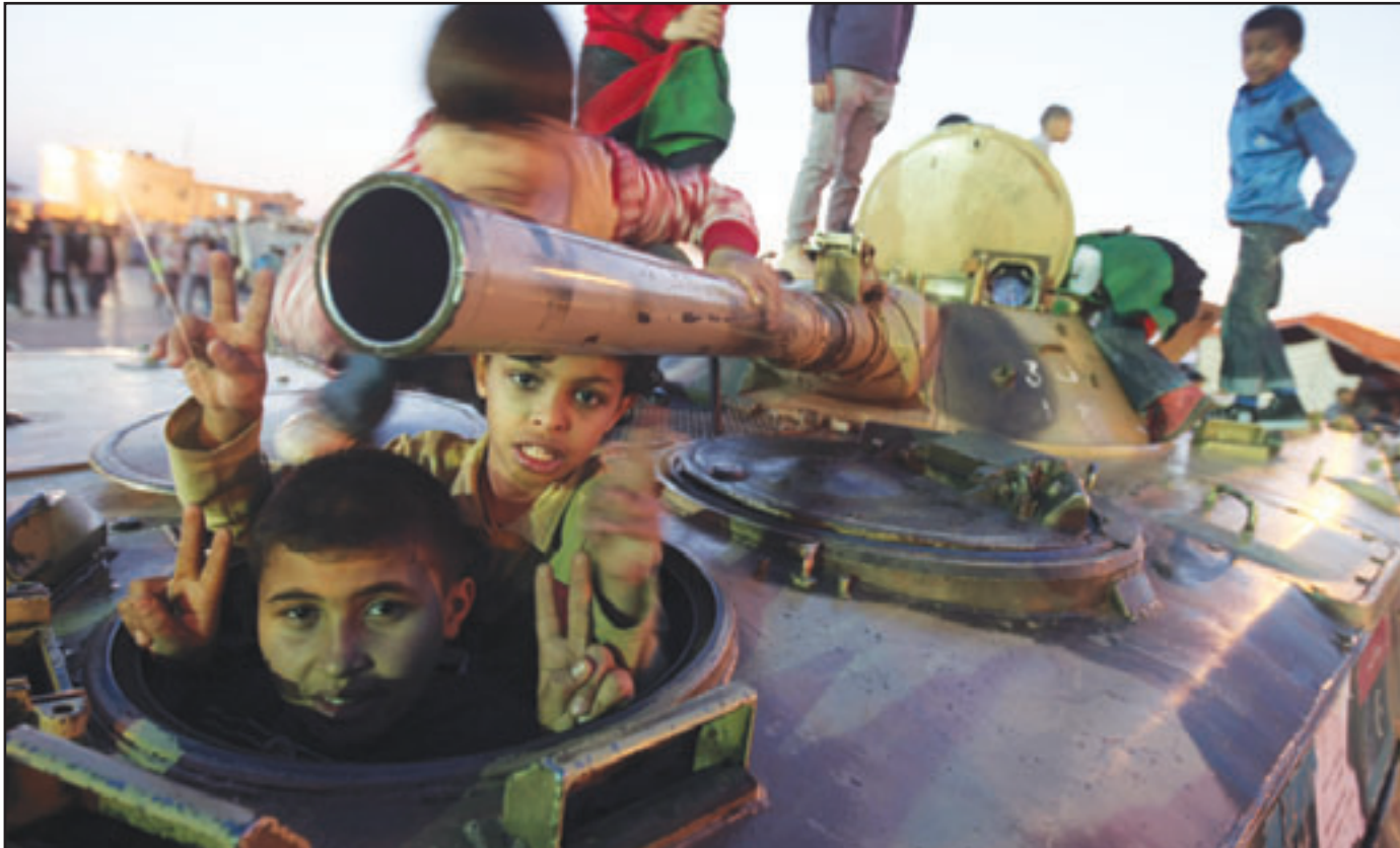
اطفال يلعبون على يدبابة استولى عليها الثوار من قوات القذافي

تولى حلف شمال الاطلسي قيادة عملية ليبيا، الى ذلك أصبحت قطر امس اول دولة عربية تعترف بالمعارضة الليبية ممثلاً شرعياً وحيداً للشعب وهي الخطوة التي قد تنذر بتحركات مماثلة من دول خليجية اخرى، وتاتي هذه الانباء بعد يوم من تصريح مسؤول كبير بالمعارضة الليبية المسلحة بيان قطر وافقت على تسويق النفط الخام الذي تنتجه حقول شرق ليبيا التي لم تعد تحت سيطرة الزعيم الليبي معمر القذافي. ونقلت وكالة الانباء القطرية عن مسؤول بوزارة الخارجية، هذا الاعتراف يأتي عن قناة بان المجلس اصبح عملياً ممثلاً لليبية وشعبها الشقيق. وكانت فرنسا قد اعترفت بالمجلس الوطني الانتقالي المعارض كممثل شرعي لليبية وهي الدولة الغربية الأولى والوحيدة التي اتخذت تلك الخطوة حتى الآن. (تفاصيل ص 6 و 7)