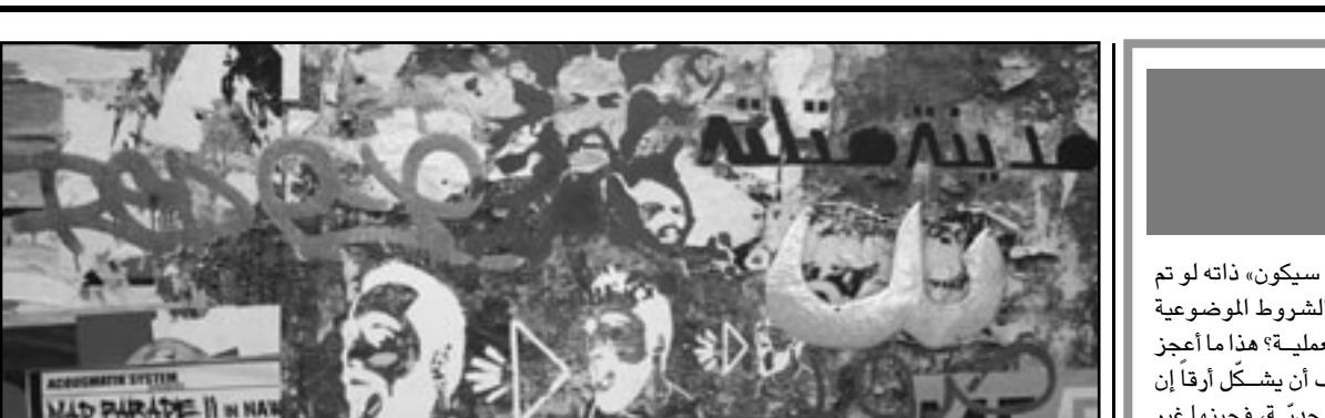
لوحة لفنان الحوراني (القدس العربي)

أحياناً أفكر بعد الانتهاء من كتابة ما؛ ماذا لو أنني بدأت بتلك الكتابة بعد ربع ساعة من البداية الفعلية لها، أو أن كلمة تلفونية استقطعتني أثناء الكتابة لمدة تزيد عن 5 دقائق، وهي كافية لإخراجي من جو الكتابة (فعلًا وموضوعًا) وإدخالني، بل وإغالي، في آخر، وماذا لو أنني كتبت عن الموضوع ذاته وأنا في حالتي النفسية والذهنية ذاتها وفي الوقت ذاته لكن في مكان آخر، أو أنقر أحرف كيبورد لابتوب آخر، أو أثناء سماع موسيقى أخرى، أو هدهد آخر لتشويش خفيف لكيف الهواء، أو مع فتجان شاي الأخضر، لا شيء، لا شيء، أو.. أو.. أفكر.. هل هذه التغييرات، على شخصيتها المتفرّضة، غير ندي صلباً بالصيغة المنهائية للكتابة، لبينة الكتابة، للأفكار للتعبير للمفردات لل... لل... لل... لا أعرف أي شيء من أية إجابة محتملة، لكنني أعرف تماماً أن أحداً لن