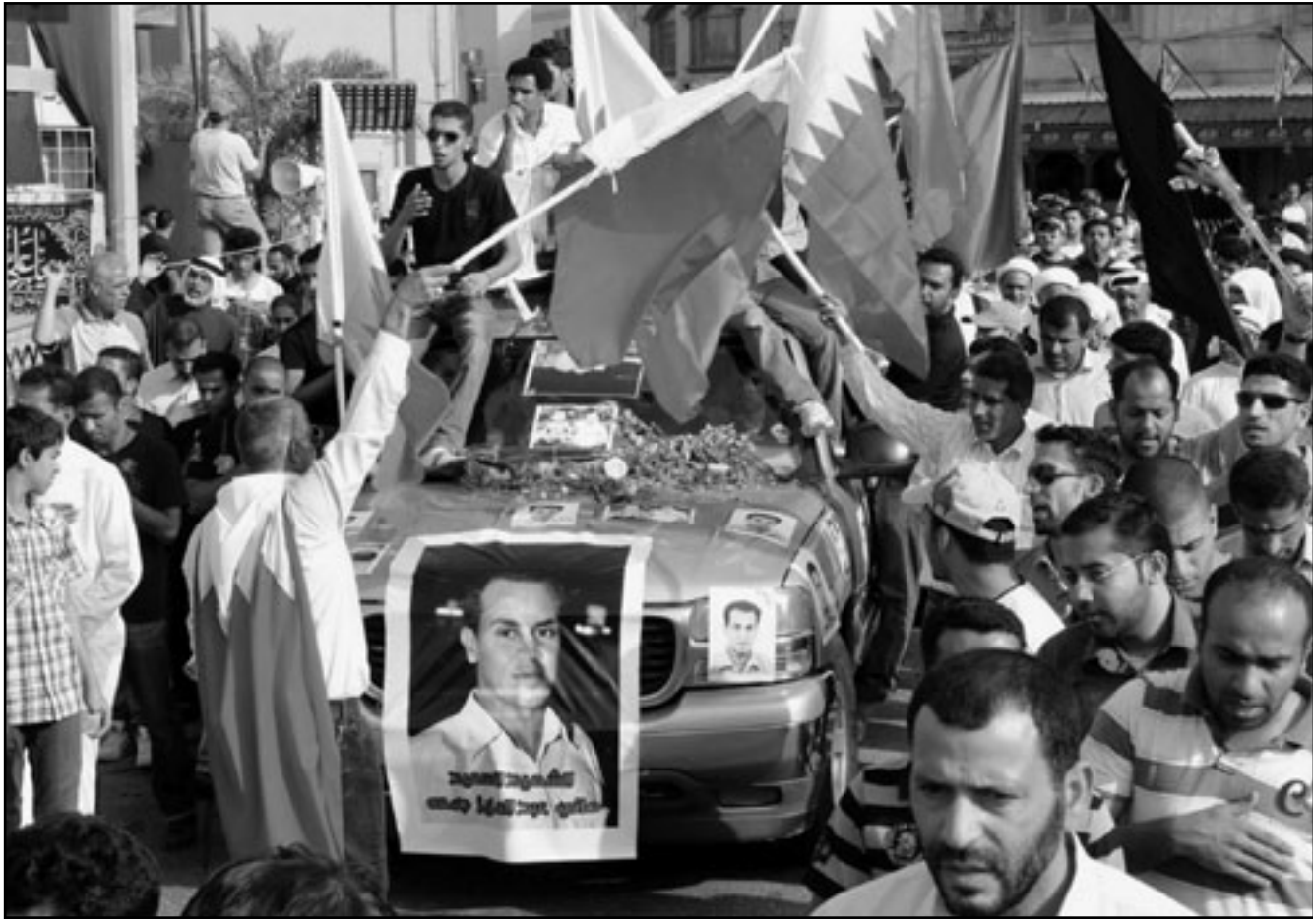
بحرينيون يشيعون جثمان احد ضحايا المظاهرات في المنامة

المختارين في وقت سابق من آذار السعودية الأمر الذي أدهش الأغلبية الشعبية في البحرين وأغضب إيران.