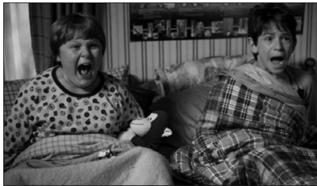
لقطة من «مذكرات طفل جبان»

■ لوس انجليس - رويترز: تصدر الفيلم الكوميدي العائلي (مذكرات طفل جبان) قواعد رورديك إيرادات السينما في أمريكا الشمالية هذا الأسبوع، بعد أن حقق 24.4 مليون دولار تغيير عن الأسبوع الماضي محققاً 11 مليون دولار خلال الأيام الثلاثة الماضية، والفيلم من إخراج ثور فريدينتال وبطولة زاكري جوردون وروبرت كايرون وراشيل هاريس. وجاء في المركز الثاني فيلم المغامرات (سكار باناش) الذي حقق 19 مليون دولار خلال الفترة نفسها، والفيلم من إخراج زاك ستاينر وبطولة إيمي برونينج وفينيسا هيجنز وابي كورنيس. وتراجع فيلم (بلا حدود) من المركز الأول إلى الثالث محققاً