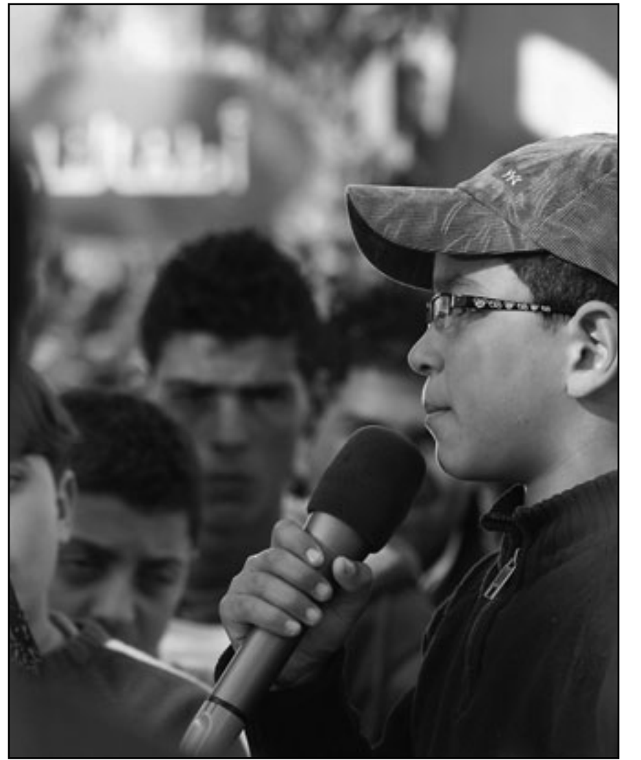
من برنامج «أطفالنا» في تونس