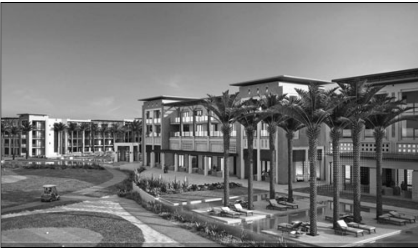
جانب من مشروع بالم هيلز لاسكان الفاخر قرب القاهرة

توقيع أي صفقات على الإطلاق في النصف الأول من 2011 وانها ستخفف انفاقها على الانشاءات 50 منخفا بنسبة 9.80 في المئة الى 3.22 جنيه.