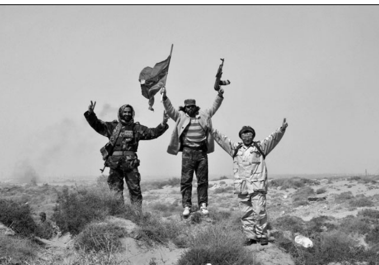
ثوار فرحون قرب العقيلة أمس بينما بواصل زملاؤهم التقدم غرباً نحو سرت

■ سرت - طرابلس - وكالات: استأنف الثوار الليبيون بعد ظهر أمس الاثنين زحفهم البطيء إلى سرت بعد أن كانت قوات العقيد معمر القذافي تصدت لهم صباح أمس ووقفهم عند مدخل بن جواد. وخلفا لتقدمهم السريع الأحد مستفيدين من الضربات الجوية للتحالف الدولي، لم يتقدم الثوار أمس الإثنين سوى 40 كلم مع وصولهم إلى بلدة رأس العوجة على طريق سرت ليصبحوا بذلك على مسافة نحو مئة كلم من هذه المدينة مسقط رأس العقيد القذافي. وكان الثوار سيطروا الأحد على بن جواد بعد أن استعادوا مصب رأس لانوف القفطي الذي يبعد عنها نحو 50 كلم شرقاً في طار زحفهم. الا أنهم تعرضوا صباح أمس الإثنين لثيران رشاشات قوات القذافي التي جاءت في سيارات بيك اب ووقفت تقدم الثوار باتجاه سرت. وعلى الأثر تراجع الثوار إلى بن جواد قبل أن يردوا عليهم بالمدفعية الثقيلة، وقد انطلقوا قذائف موزر وزخات من ثيران مدافع آلية ثقيلة في اشتباكات متفرقة مع قوات القذافي أثناء تقدمهم غرباً على الطريق الساحلي، وقال المعارضون إن مكائن متفرقة نصبتها قوات القذافي مدفعية للتراجل لكنهم استعادوا مواقعهم فيما بعد. ويعد ظهر أمس بدأ الثوار يتقدمون من جديد مع القيام بتفكيك المنازل المحيطة بالطريق حيث يبدو أنهم يواجهون مقاومة أقل من قبل قوات القذافي. وصباحاً قامت قوات النظام بدوريات في سرت، المدينة الساحلية التي تعد نحو 120 ألف نسمة وتقع على الطريق الرئيسي المؤدي إلى طرابلس (360 كلم شرق لكنها لا تزال تحت سيطرة القوات النظامية.