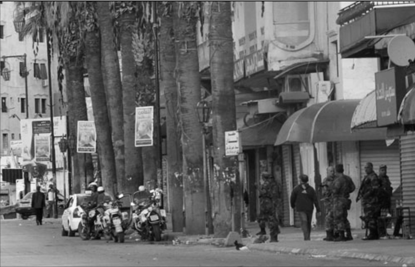
جند سوريون ينتشرون في شوارع اللاذقية

رسمية، وتحدث حبش عن وجود «مؤامرة طائفية ضد سورية والهدف منها تفريق الشعب الى طوائف واثارة الفرقات... وقال «هناك موقف واحد لرفض المؤامرة الطائفية ضد سورية» في المجلس. واتخذت مستشارة الرئيس السوري بنية شعبان لو كالة فرانس برس الاحد ان الاسد سيتوجه «قريبا» بكلمة الى السوريين بتطرق فيها خصوصا الى الاصلاحات المقبلة. واعلنت المستلطات الخيمس انها تدرس الغاء قانون الطوارئ القائم منذ 1963 وودعت باجراءات تكافحة الفساد.