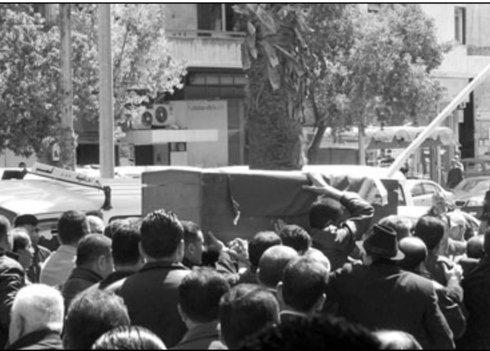
سوريون يشيعون قتلهم في اللاذقية امس

يعرفون بان ممثلي الأخ الأكبر- الاخوان المسلمين-سيجلسون قريبا في الحكومة المصرية، التي ستبقى على اتفاق السلام مع اسرائيل. يحتمل ان تبقى دمشق ايضا مدينة لجوء للارهابيين. في هذه الاثناء لا تزال المبادرة على الرف. لو كان لاسرائيل رئيس وزراء لا يختص في هذه الايام في شؤون البقاء السياسي، لما كان سمح بهذا التفويت الاجرامي لفرصة مبادرة السلام العربية، المبادرة التي لن تعاد مرة اخرى.