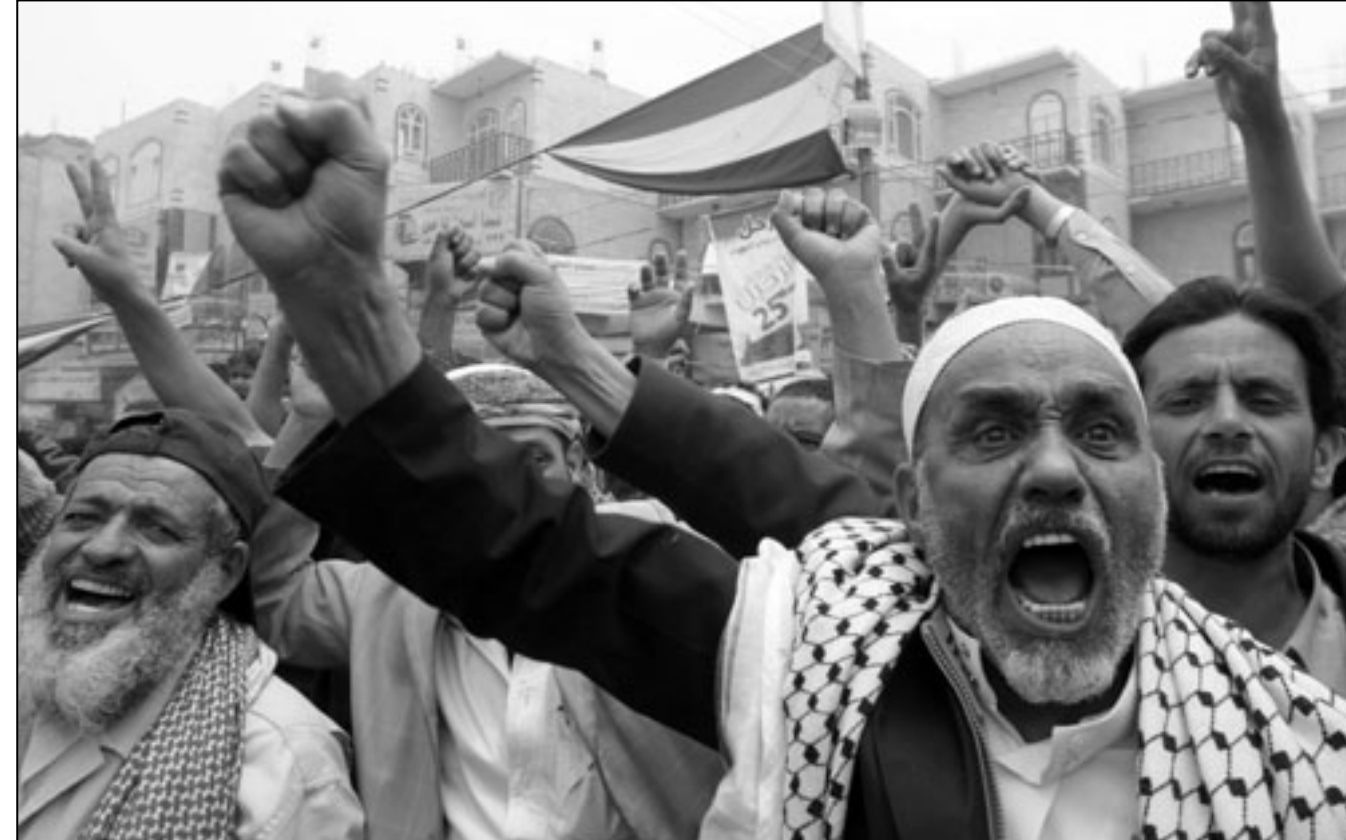
مظاهرون يمنيون غاضبين في صنعاء امس

أوسلو - ا ف ب: حاول الرئيس اليمني علي عبد الله صالح «على ما يبدو» ان يستخدم السعوديين من غير علمهم للقضاء على اللواء علي محسن الاحمر الذي انضم مؤخرا الى المحتجين كما كشفت صحيفة روجية الاثنين استنادا إلى مذكرة دبلوماسية سريا موقع ويكيليكس. ففي شتاء 2010 تم توجيه طائرات مقاتلة سعودية كانت تزور في وصف القصد الزبدي الذي تشهده اليمن منذ 2004 إلى مبنى قدم لموسوبين على انه مقر مهم للمتمردين، بحسب صحيفة أفنتوستن تقلا عن مذكرة سرية صادرة عن السفارة الامريكية في الرياض. لكن العملية الغيت عندما ادرك الطيارون السعوديون انهم يوشكون على قصف المقر العام لعلي محسن الاحمر. وافادت الصحفية ان علي محسن الاحمر هو «خ غير شقيق وحليف مقرب و منافس كبير لرئاسة علي عبد الله صالح. وتابعت «على ما يبدو حاول صالح التخلص من خصم محتمل». مؤكدة انها تملك الوثائق التي حصل عليها موقع ويكيليكس. وعلى عكس عادتها لم تنشر الصحفية نسخة الفاكس للمذكرة الدبلوماسية على موقعها على الانترنت. وتحدثت المذكرة التي لم يحدد تاريخها عن لقاء «سري» تم في 6 شباط/فبراير 2010 بين دبلوماسيين امريكيين ونائب وزير الدفاع السعودي خالد بن سلطان. والجنرال علي محسن الاحمر هو قائد المنطقة الشمالية الشرقية لكتيبة المدرعات الاولى، وذاع صيته في 21 آذار/مارس عند اعلان انضمامه الى الاحتجاجات ضد صالح الذي يحكم البلاد منذ 32 عاما. وقال العظيمة في اجتماع بالعاصمة السعودية ان المجلس يحترم اختيار الشعب اليمني لدعم الأمن والاستقرار والوحدة الوطنية. واليمن ليس عضوا في مجلس التعاون الخليجي الذي يضم البحرين والكويت وعمان وقطر والسعودية والإمارات العربية المتحدة.