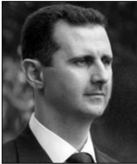
الرئيس السوري بشار الاسد

ويشعروا صور «المؤيدين»، شعبي ليس غبيا. وهذه ليست «مسيرات» بل مظاهرات ضدك. في هذه الاثناء يهتفون فقط «الحرية»، بعد قليل ستسمع كيف يهتفون «الشعب يريد اسقاط النظام»، هل تريد ان نذكرك بما حصل في تونس؟ واين مبارك؟ الجيل الشاب، الذي يخرج الآن الى الشوارع، وُلد في حالة الطوارئ، ومن فترتك في لندن لا بد انك تعلمت، انه لا توجد دولة متتورة تعيش على قوانين الطوارئ 48 سنة، يجب اعطاؤهم أملا. الشباب باتوا يفهمون بان