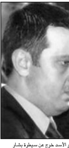
رامي مخلوف يعرض على قمع المتظاهرين

جانب أبناء عائلته محمد، حافظ ويهايا، يسيطرون على تجارة النفط والاتصالات وعلى وكالات استيراد السيارات والعداة في سورية، مخلوف وماهر يريان بانسجام الحاجة إلى قمع المظاهرات بالقوة، بالمقابل، فان محافل أخرى في الحكم السوري، ولا سيما في حزب البعث، يخشون من أن نشاطا عتيفا أكثر مما ينبغي من شأنه أن يؤدي إلى ضغط خارجي، عقوبات وربما اغتيال على هجوم عسكري خارجي ملثما في ليبيا، وحسب قسم من تقارير المعارضة، كف ماهر عن الطاعة لتعليمات بشار بوقف النار، وهو يدير المعركة كما يرى مناسباً.