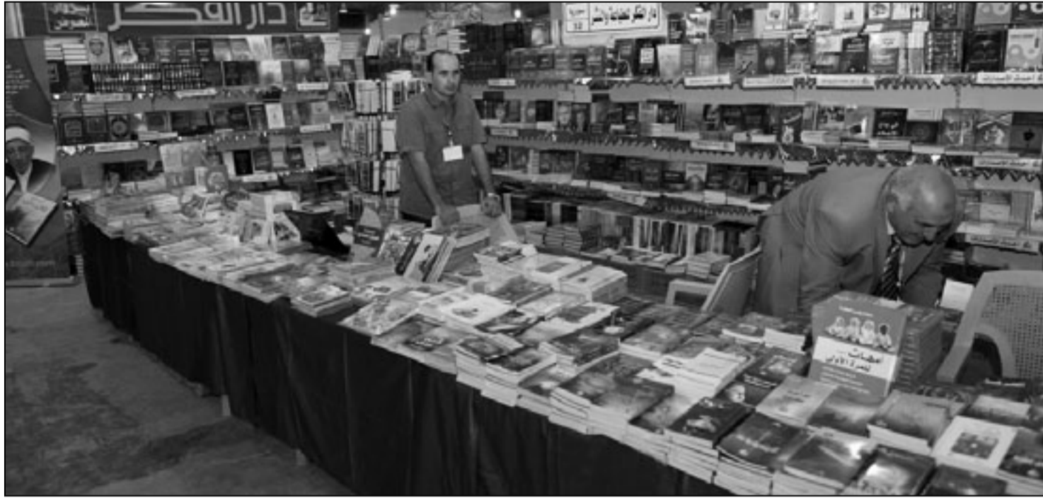
جانح من معرض عمان الدولي للكتاب