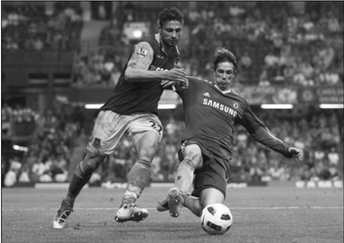
فرناندو توريس نجم تشيلسي (يمين) يتحدى مانويل واكوتا نجم ويستهام يونايتد للفوز بالكرة

الأخر من شبح الهبوط مع ستوك سيتي فيما يلتقي بلاكبيرن مع بولتون يوم السبت. ومازال ليفربول يحلم بزحزة توتنهايم عن المركز الخامس قبل مباراة الفريق أمام ضيفه نيوكاسل الاحد، فيما يلتقي سندرلاند مع فولهام ووست بروميتش البيون مع استون فيلا السبت.