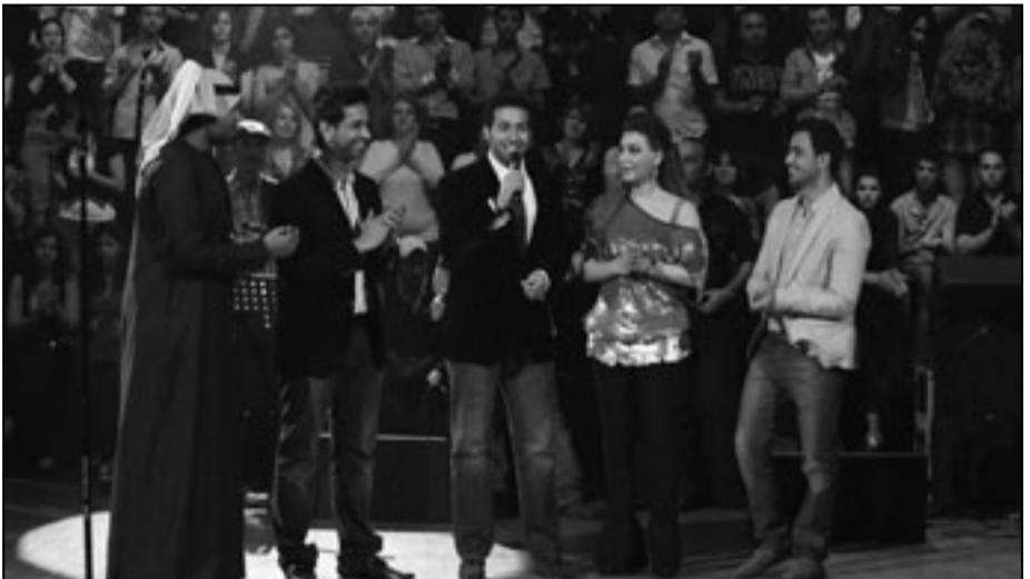
المشركون في الحلقة الثالثة من برنامج «تاراتاتا» (القدس العربي)

السنواي، بيلي هوال: لحنان فريد الأطرش، كلمات أحمد رامي، فرق ما بيننا: لحنان محمد القصيبي، كلمات علي شكري، يا بعد الورد: لحنان فريد الأطرش، كلمات أحمد رامي، ذكرياتي: لحنان محمد القصيبي، كلمات أحمد رامي، استقبلها: لحنان محمد القصيبي، كلمات بشارة الخوري، يا جيبني: لحنان منى عاصم، كلمات يوسف بيروس، وكان مسك الختام مع رابعة، ليالي الأنس: لحنان فريد الأطرش، كلمات أحمد رامي، وكان ل«القدس العربي» لقاء مع الفنانة تقول: من يوم كنت طفلة صغيرة تربيته على هذه الموسيقى والأغاني للفن العربي الأصيل، ثم دخلت المعهد الموسيقي ودرست مادة الغناء والشعر، وأنا ملقة في أعماله التي أحب التميز وأرفض الغناء التجاري، قدمت عدة حفلات محترمة في مصر ولبنان وقد قدمت للقطر العبد الكبير عبد الوهاب، وأم كلثوم لكن تبقى أسهان الفنانة الوحيدة التي أشعر بان صوتي ومشاعري معها، وتصفي: «أنا عملت على التدريب في الغناء ساعة يوميا، لكن أختار الحفلات وهي قليلة لكنها متميزة بجمهورها».