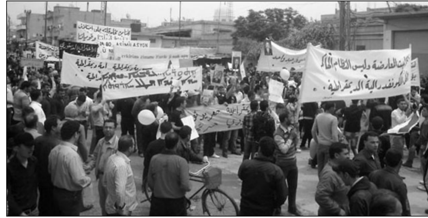
سوريون يتظاهرون في منطقة القامشلي في سورية في يوم غضب ضد النظام... وآخرون يغرون من البلد