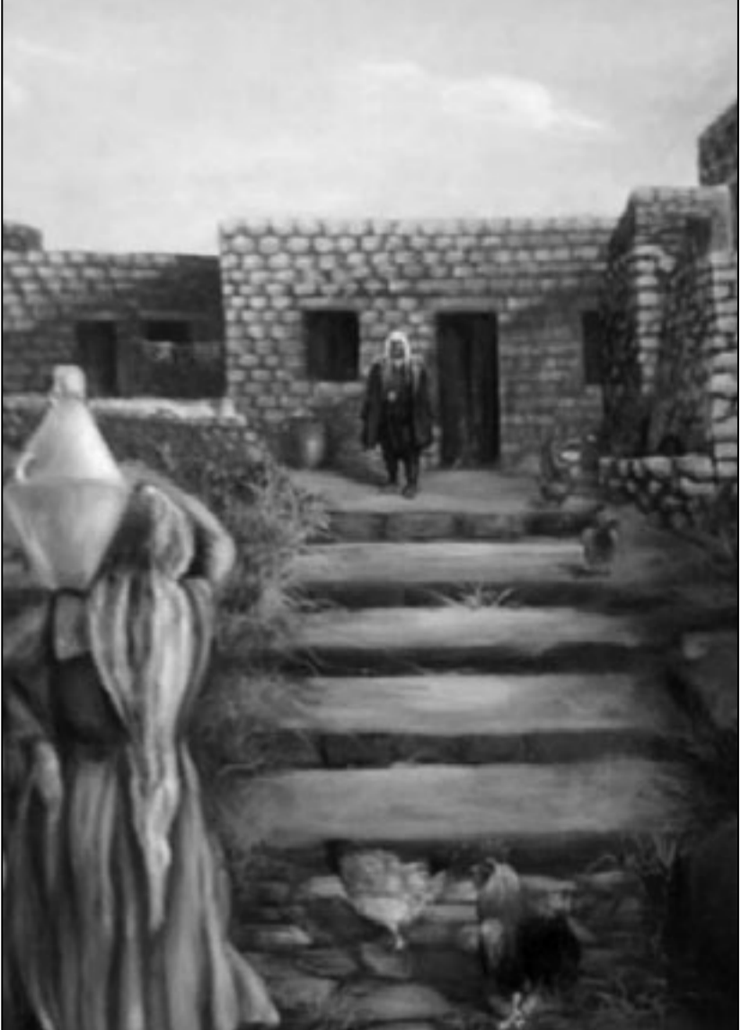
لوحة من بيئة السويداء

■ هناك شبه إجماع على أن الفنان يعجز عن التكيف