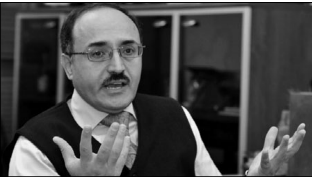
غسان بن جدو

إن محاولة الجزيرة الاستنفاة عن الإعلاميين الهجوم منعتف إعلامي كبير قد يجرح عليها نتائج معاكسة تماما، فلقد كانت القاعدة الذهبية الإعلامية، أن أي مذيع وإعلامي يغار الجزيرة لن يسقط نجمه، كما هو الشأن بالجزيرة، والقاعدة نفسها يمكن تطبيقها على الجزيرة في كون أي استنفاة عن أي نجم إعلامي ومعد لبرنامج سيصعب بأي حال من الأحوال تعويض الفراغ الذي سيتركه؛ لأن الجزيرة عرفت بانفتاحها على الراي الأخر ولكن أيضا ببرامجها الناجحة. وأن تخن الجزيرة بأنها قد تستطيع أن تحافظ على وراثتها من دون الإعلاميين الهجوم فهذا مسأحة التأويل واسعة ولا تتعد تلك العبارات التي تناقشتها الجرائد والمواقع الإلكترونية، وفي مقدمتها يومية السفير اللبنانية المنفردة بسبق نشر خبر الاستقالة، فتصح حقيقة عن متكون المهنية المقصودة، بيد أنه سرعان ما سنفهم المهنية المقصودة انطلاقا من سياق العبارة، حينما أردف قائلا والعهد دائما على