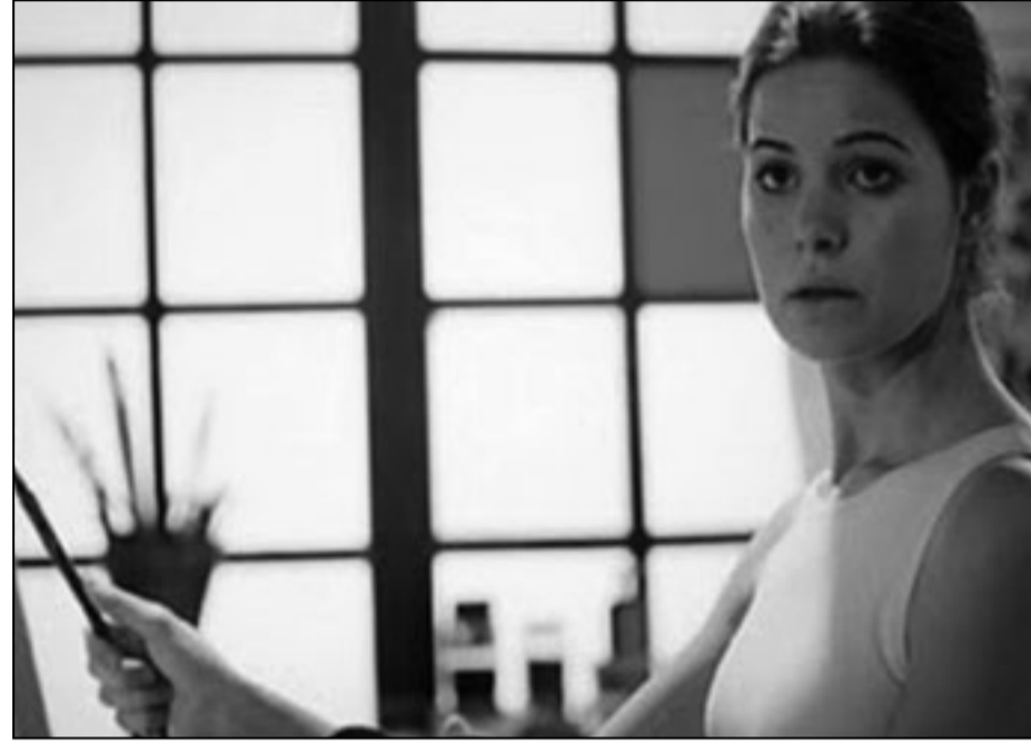
لقطة من فيلم «هوس العمق»

أو يكون واقعا تحت تأثير حالة الأسر التي بات عليها بعد تحديد إقامته بالمزمل لانقضاء مدة الخدمة بالحكومة، فقط هو لا يفعل شيئاً سوى السياحة في التفكير العميق طوال الوقت، إن يصعب عليه التواصل مع زوجته وابنه الوحيد «باسم سمرة»، الذي يزهو من أن لا أخركي يسري عنه ولكن من دون جدوى.