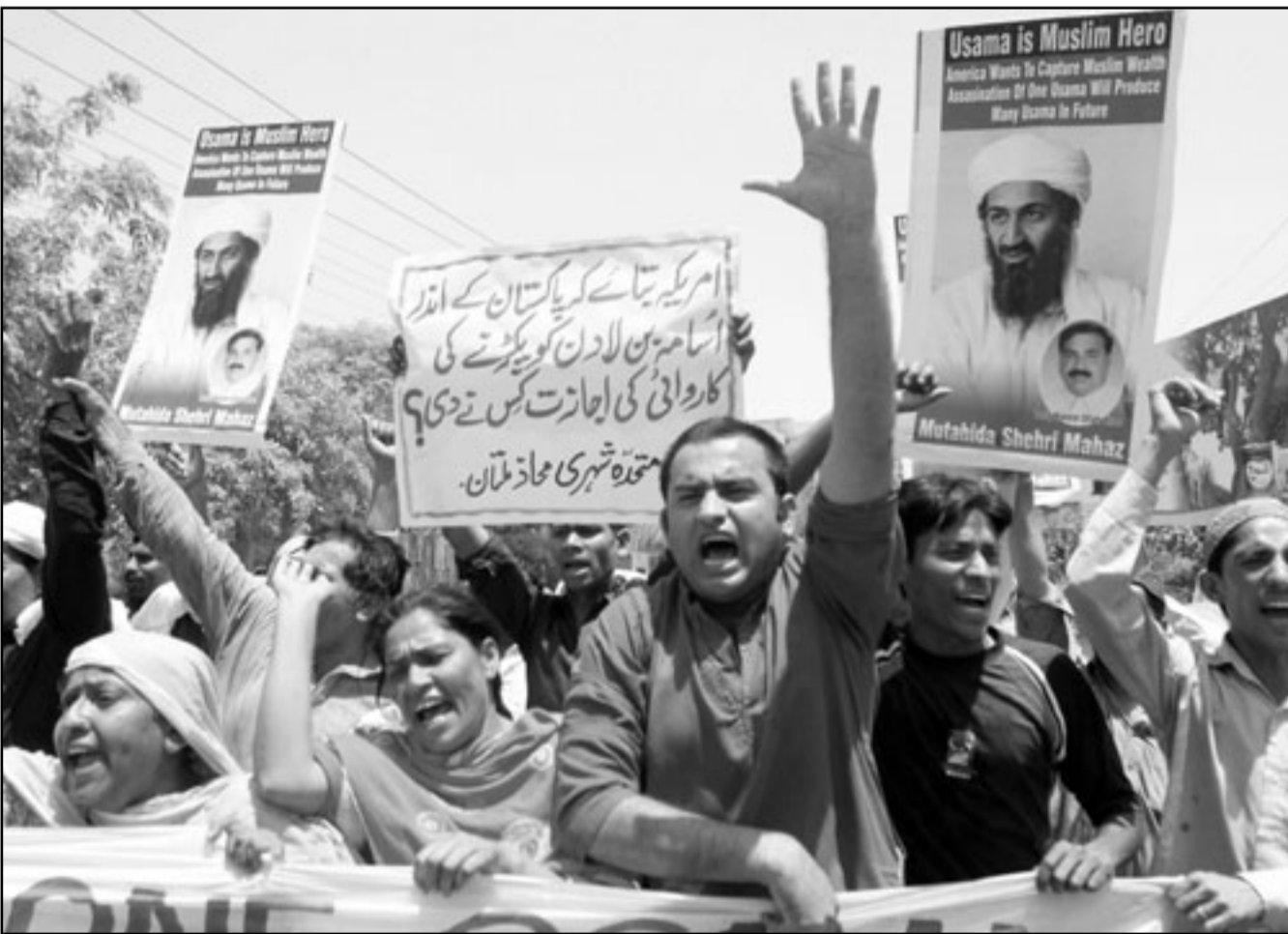
باكستانيون يرفعون صور بن لادن اثناء مظاهرات غاضبة بعد اقدم القوات الامريكية على قتله

طالب بتحقيق شفاف بما حدث داخله، خاصة ان امريكا اعترفت بمقتل بن لادن اعزل من السلاح. وحدثت عن تناقض الرواية الامريكية، ودفن بن لادن في مكان سرى في بحر العرب وان كان هذا مخطط منذ البداية، وعن العملية السريعة لدفنه حسبما يتطهله الاسلام لان العملية كانت سحجاتج الى اكثر من خمسين دقيقة كما تحدث الامريكيون. وخدم قاتلا ان العالم الان ليس اكثر التغيير التي تعد المنطقة العربية، ففي لانه لا حاجة الى قاعدة التي تستطيع تنظيمها لا اهمية له. وقال ان الجانب الايجابي لمقتل بن لادن انه سحب الشماعة من يد الالقادي وال الاسد وصالح من القاء اللوم على القاعدة لقمع الثورات الشعبية.