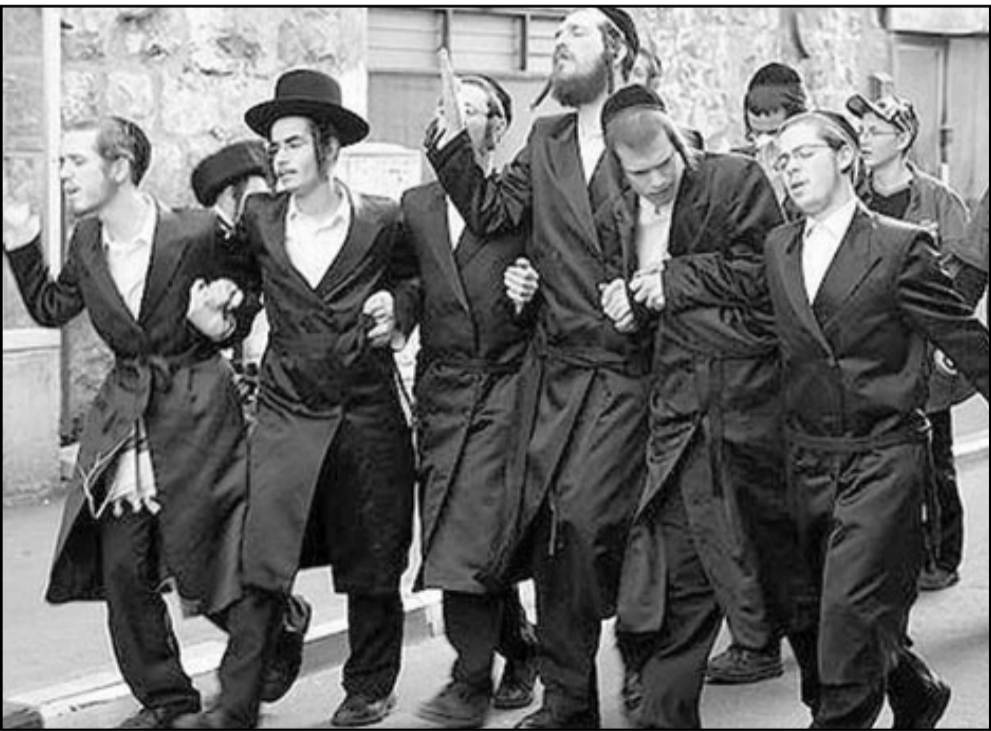
اسرائيل تريد دولة عنصرية يكون فيها غير اليهود رعايا

كانت الحقيقة عكس ذلك ففحّت امام اسرائيل التي تخشأ دولة ديمقراطية في حدود 1967 امكانات تحفيرة للاهتمام بنفسها مع تأييد عالمي واسع.