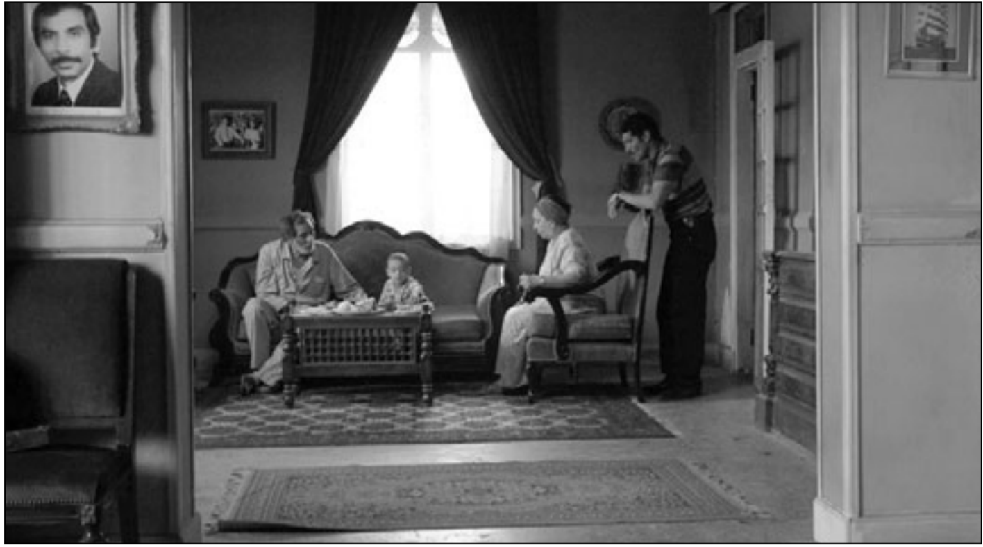
لقطة من فيلم «ساعة العصاري»