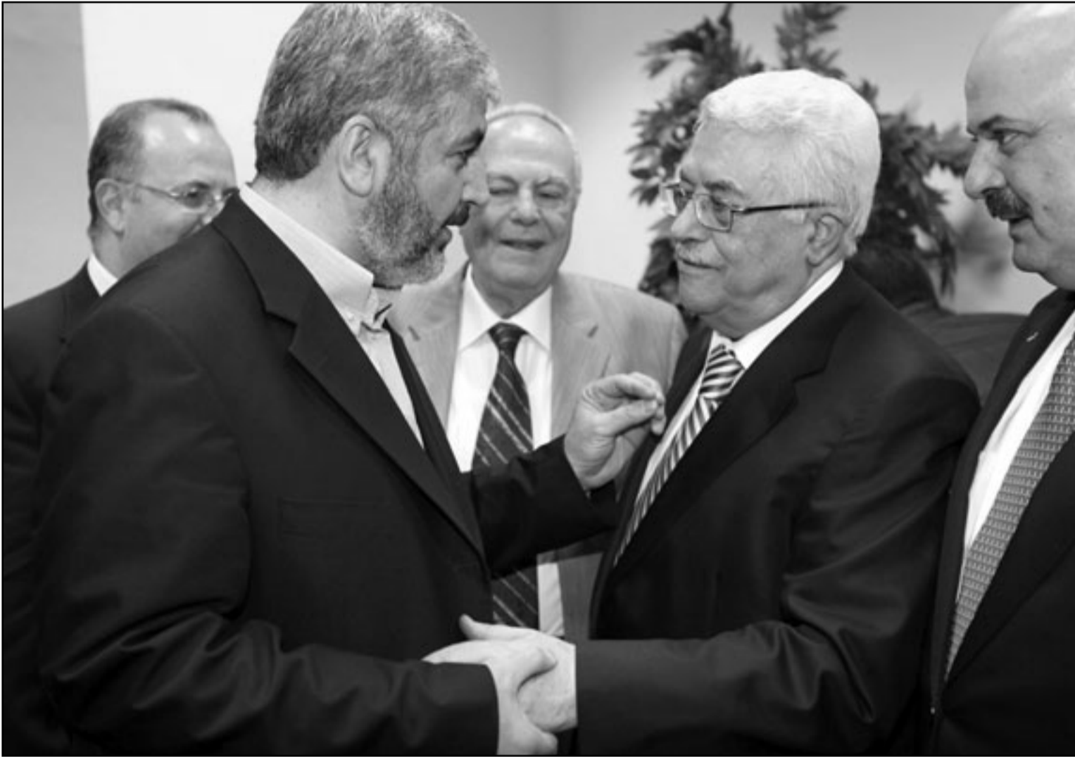
الرئيس الفلسطيني محمود عباس يصادف رئيس المكتب السياسي لحركة حماس خالد مشعل بعد احتفال توقيع اتفاق المصالحة في القاهرة

دبلوماسياً على حماس بعد أن فازت في الانتخابات الفلسطينية عام 2006، بسبب رفضها التحلي عن العنف وتنفيذ اتفاقيات سابقة بين الإسرائيليين والفلسطينيين والاعتراف بحق إسرائيل في البقاء. وفي المقابل الإذاعية تساءل شعث، الذي كان يتحدث قبل بضع ساعات من إقامة الاحتفال الرسمي بتوقيع اتفاق المصالحة في القاهرة، عما إذا كانت إسرائيل ستعترف بحماس أم لا. وقال رئيس الوزراء الإسرائيلي بنيامين نتنياهو ومسؤولون آخرون، «إنه لا يمكن أن تكون هناك أية مفاوضات مع حكومة حماس إذا لم تقبل الحركة الإسلامية بحق إسرائيل في البقاء».