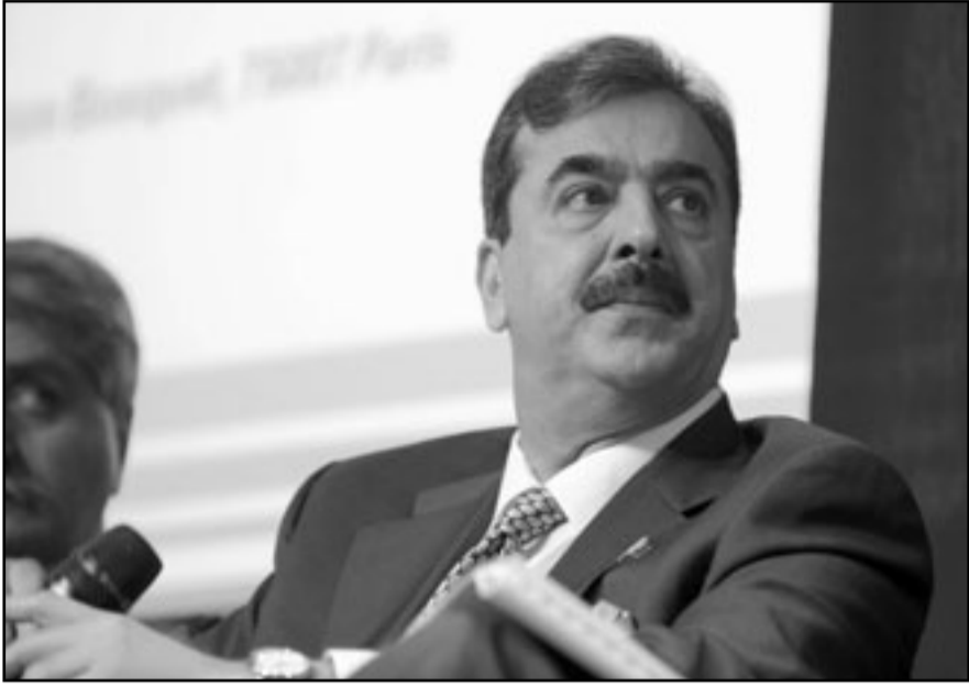
رئيس وزراء باكستان يوسف رضا جيلاني

في مكافحة «الارهاب»، مؤكدا بان هذا العدد اكبر بكثير من قتلى دول حلف الاطلسي مجتمعة. وقال مسؤولون استخباراتيون امريكيون كبار ان زعيم تنظيم القاعدة أسامة بن لادن كان يحمل ميغا من المال ورقي هاتف تمت خياطتها في ثيابه عندما باغتته قوة الكوماندوس الامريكية وهما دليان على انه كان مستعدا للفرار حال اشعاره بذلك. ونقل موقع «بوليتيكو» الامريكي عن ثلاثة مصادر شاركوا في جلسة استماع سرية في الكونغرس، ان مسؤولين كبار في أجهزة الاستخبارات الامريكية بينهم مدير وكالة الاستخبارات المركزية «سي آي ايه»، ليون باينيتا، ابلغوا اعضاء الكونغرس انه تم العثور على مبلغ 500 يورو في حوالي 740 دولارا امريكي مع بن لادن عند قتله اضافة الى رقي هاتف خيوط في ثيابه. وردا على سؤال عن خيوط وجود عدد كبير من الحرس حول بن لادن في منزله الفخم نوعا ما في بلدة عسكرية قرب اسلام اباد، اجاب باينيتا ان بن لادن يعتقد ان «شبكة كانت قوية بما يكفي لتخديره مسبقا» من اي هجوم امريكي ضده. وقالت المصادر ان دليل وجود خيوط بقدر من المال بحوزة بن لادن لحظة قتله ووجود ارقام هاتف معه، يدعم اعتقاد الادارة الامريكية بأنه كان يستعد للفرار فور تخديره من هجوم وشيك. وهذا الرأي ايضا يدعمه كشفه البيت الابيض عن ان بن لادن لم يكن مسلحا حين قتل الاهد.