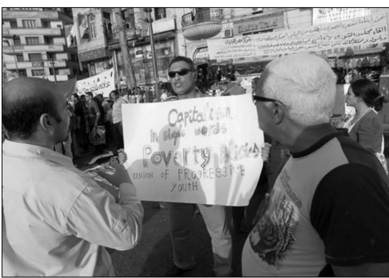
مظاهرة امام بائع الصحف الشيرفي في ميدان التحرير