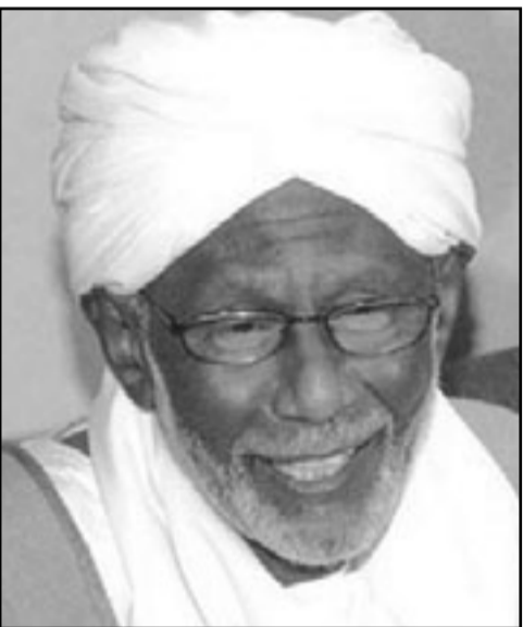
د. حسن الترابي