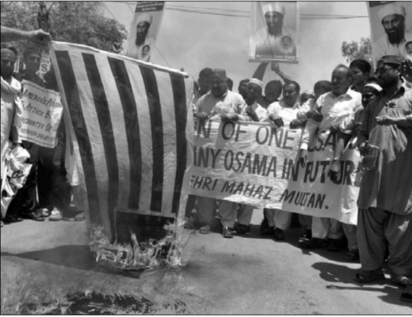
مظاهرات باكستانيون يحرقون علم امريكا في اسلام اباد امس

الساحل، حيث يحتج تنظيم القاعدة في بلاد المغرب الاسلامي اربعة فرانسيس رهاثن. وردا على سؤال حول امن رحلات اير فرانس قال الوزير «اتخذت تدابير خاصة في هذا الصدد. لدينا عناصر من الشرطة الفرنسية في المطارات الافريقية الأكثر حساسية لدعم زملائهم والحرس على اتخاذ اقصى التدابير الاحترازية».