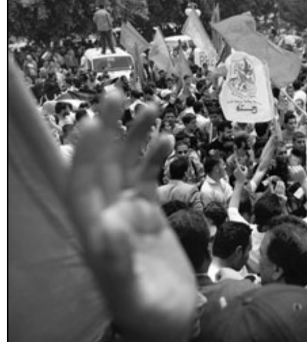
جانب من الاحتفالات في غزة أمس

والإعلان عن انتهاء الانقسام واستعادة وحدة الوطن ومؤسساته يعلمانا أمام لحظة تاريخية للخلاص من الاحتلال الإسرائيلي الذي طال أمده. فنحن إذ ننفض قداما نحو إنهاء الانقسام وتحقيق المصالحة، فإننا نعرّض بذلك جاهزيتنا الوطنية لإقامة الدولة ونضع المجتمع الدولي حتماً أمام مسؤولياته الأخلاقية والقانونية والتاريخية والمنمطة في تمكين شعبنا من تقرير مصيره وإقامة دولته المستقلة».