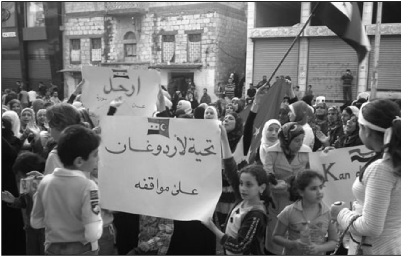
سوريون يتظاهرون في درعا مساء الثلاثاء

احتجزوا في العراق مئات من بينهم عدد من النساء الأسبوع الماضي، وتظاهر نحو ألف طالب في جامعة حلب الثلاثاء وقام آلاف بمسيرة في مدينة القامشلي الشرقية التي يغلب الأكراد على سكانها وهم يحملون الشموغ ويهتفون بالحرة.