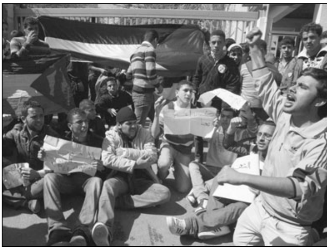
الطموح الى الحرية يربط المتظاهرين العرب بالفلسطينيين المقموعين

الارتدادات تفضل الهروب من الاسرائيليين. المصالحة الفلسطينية التي سيصدق في القاهرة اليوم، ان اختلط مرة اخرى، بين أبرز الصحافيين فأخذ الانطباعات، أرفع التقارير، اختطف محادثات، هذا