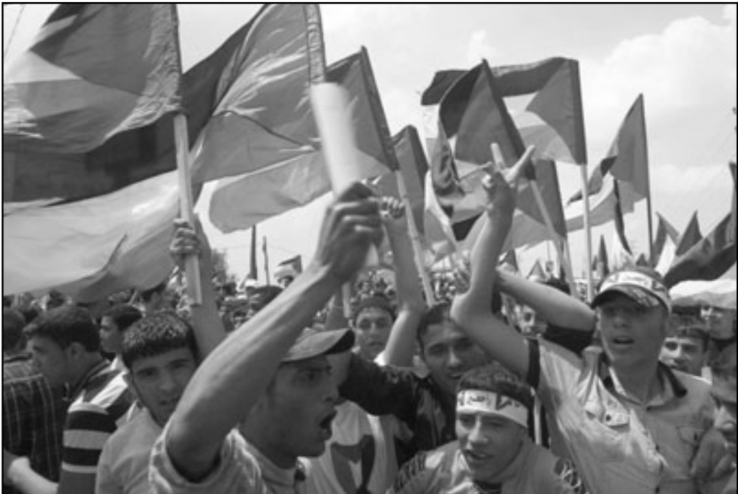
اصبح حق العودة علم الاحتجاج الفلسطيني

والسلطة الفلسطينية ستوقف مسيرات من ثلاثة اتجاهات مختلفة أخرى. ولكن هناك أيضا - ليس هناك ما هو مضمون تماما، كلما جرى الحديث أكثر عن تسوية سياسية أو القامة دولة فلسطينية، سيمسح حق يتنشرون على الكفاح الفلسطيني، هكذا بحيث ان المسيرات والاساطيل لتحقيق حق العودة ستستل المزيد فالزيد من الرخيم، ما الذي سنوقفه في وجههم؟ قانصة؟ ربما بنابق الوان، متلما في مرمره.