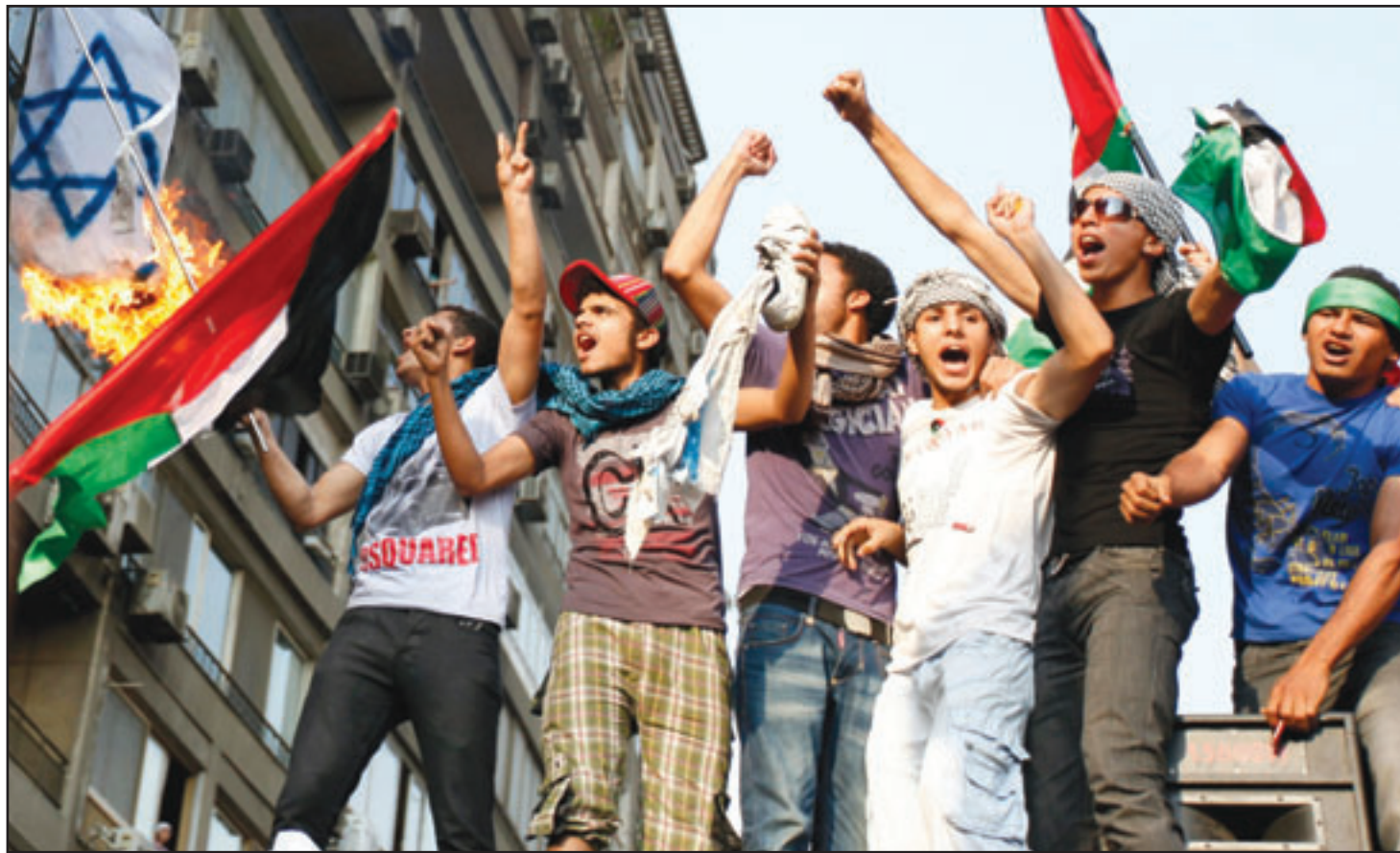
مظاهرون مصريون يرفعون العلم الفلسطيني ويحرقون العلم الاسرائيلي امام سفارة الدولة العبرية في القاهرة امس

وقعت العلاقات المصرية الإسرائيلية، وحقق الجيش المصري 186 شخصاً اثر مواجهات ليل الاحد الاثني بين قوات الامن ومظاهرين امام سفارة اسرائيل في القاهرة واسفرت عن 353 جرحاً بحسب وزارة الصحة. وكان المئات يتظاهرون احياء لذكرى النكبة الفلسطينية، واستخدم الجنود عناصر شرطة مكافحة الشغب الغاز المسيل للدموع واطلقوا عبارات نارية في الهواء لتفريق المظاهرين.