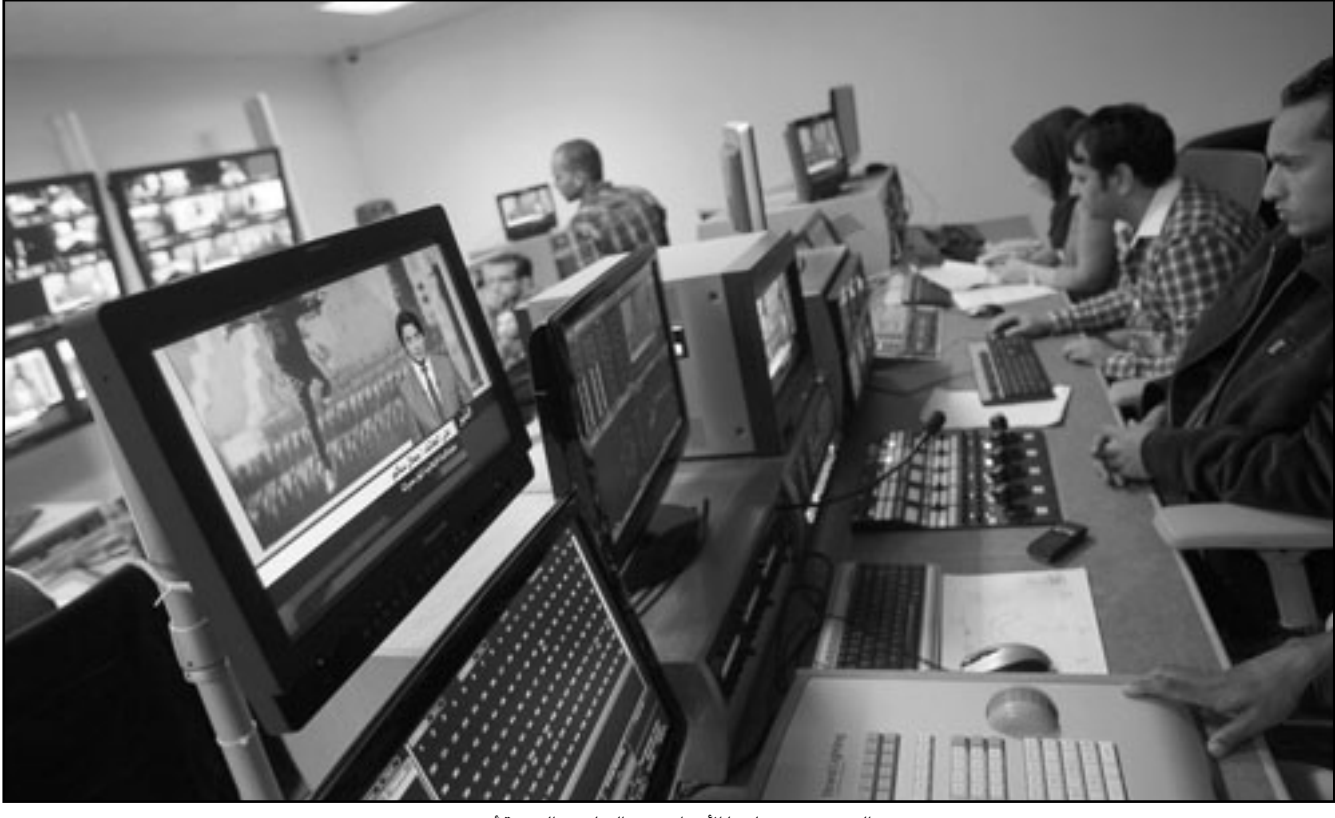
الصورة: تقنيو «ليبيا الاحرار» بمقر القناة في الدوحة أس

والعنف لتفريق المتظاهرين مما أسفر عن اصابات بالغة الخطورة في حق المواطنين. واكد انه «على اثر الزهمة الاحتجاجية»، التي دعت اليها حركة 20 فبراير المطالبة باغلاق مركز تمارة السري، عاين منددي الكرامة لحقوق الانسان هجوما عنيفا من طرف قوات الامن والقوة لتسامة وتوق التمثل العنيف ومجموعة من رجال الامن برز مدني، مما أسفر عن اصابات في صفوف المواطنين والمواطنات. وحصل بيان منددي الكرامة مسؤولة ما حصل من انتهاكات للمسؤولين عن الأجهزة الأمنية مسؤولة ما حصل من انتهاكات لعرفه حقيقة هذه الاعتداءات ومختلف الالامسات الخاطئة بها، كما يطالب بحماسة التورطين في هذه الانتهاكات، ويطلق سراح كافة المعتقلين على خلفية تظاهرة الاحد بالرباط. واعتبر وزير الاتصال الناطق الرسمي باسم الحكومة المغربية ان «المسيرة التي قام بها عدد من الأشخاص اليوم (الاحد) بتمارة كانت مخالفة بصفة كلية للقانون»، وأن «السلطات العمومية ابليت منظمي هذه المسيرة بانهم لم يمتلكوا القانون كما هو معمول به في جميع البلدان الديمقراطية». وقال الناصري ان «قوة القانون والمؤسسات تبتد باحترام التدبير للضوابط القانونية.. وأمل ان يلتزم الجميع بما يلزم من العقل لتجميع هذه الأمور». وحول ما تعرض له بعض الصحافيين خلال هذه المسيرة، من اعتداءات على يد قوى الامن العام وبشكل افضى لتكسبر عدد من أدوات