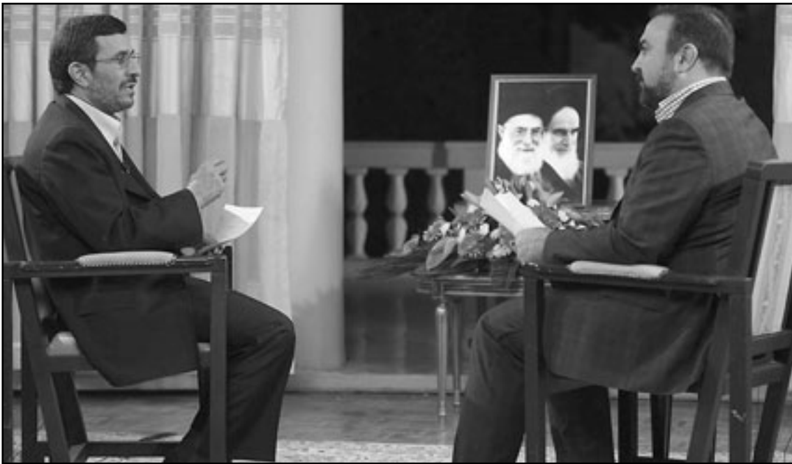
الرئيس الإيراني احمدي نجاد خلال المقابلة التلفزيونية في طهران امس

■ طهران - وكالات: نفى الرئيس احمدي محمود نجاد الاحد تكهنات بشأن وجود خلافات مع المرشد الأعلى آية الله علي خامنئي، وفي مقابلة مع التلفزيون الحكومي، لم يشر الرئيس إلى الصدر الرئيسي لهذه التكهنات وهو اقامة رئيس الاستخبارات الإيرانية حيدر مصلحي وهو الامر الذي اعترض عليه خامنئي واوقفه في نهاية المطاف. وقال احمدي نجاد «علاقتي مع القائد ليست مبنية على المعتد فقط لكنها أيضا علاقة شخصية، فهو بمثابة اب بالنسبة لي». ومنذ قيام الثورة الإسلامية عام 1979، تخضع إيران لنظام حكم يعرف بولاية الفقيه، وفيه