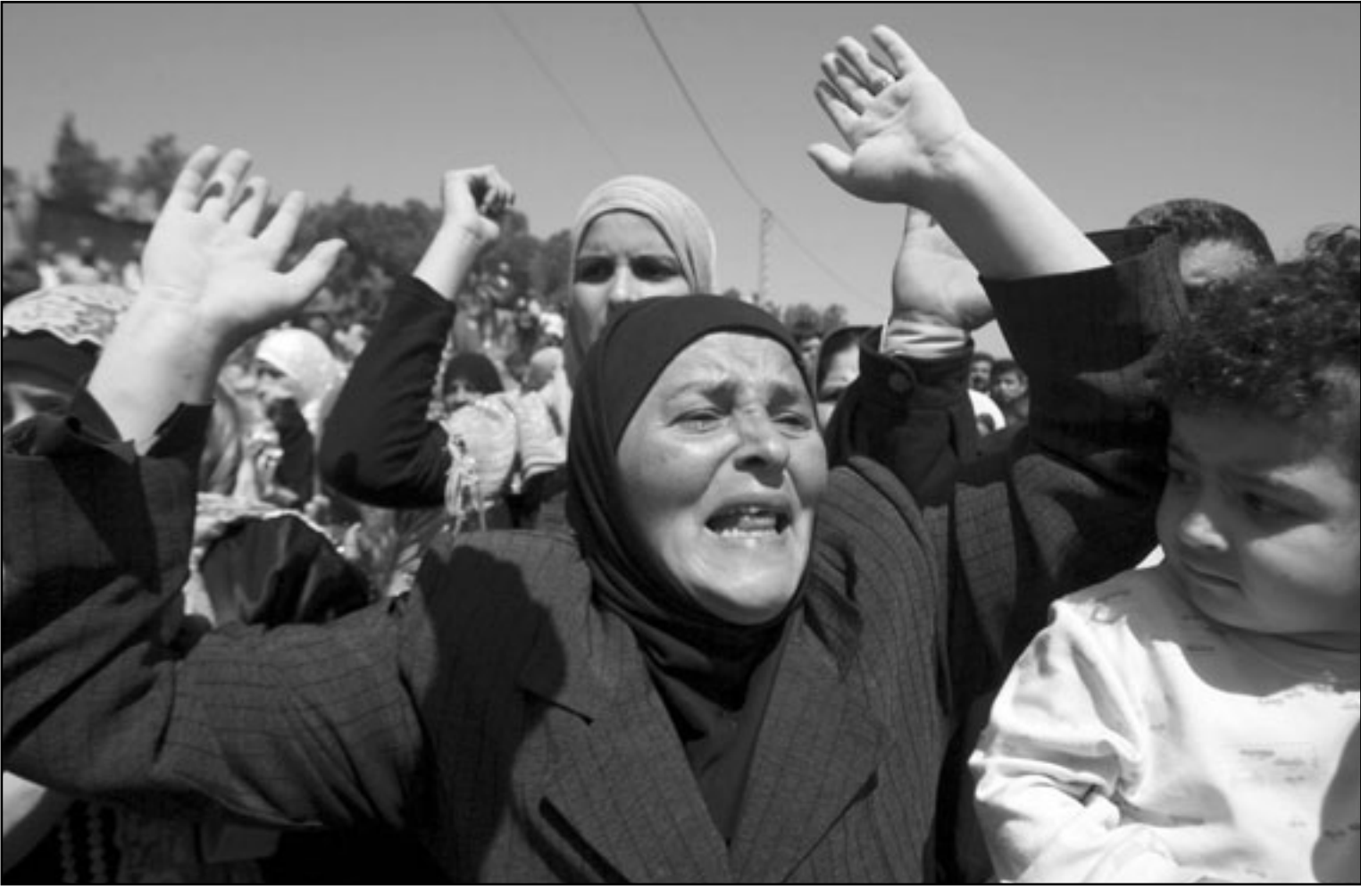
سورية تهتف ضد نظام الأسد بعد وصولها وعائلتها وادي خالد

والترهيب ضد المدافعين عن حقوق الإنسان». وأعرب البيان في الوقت نفسه عن ارتياح باريس لإطلاق سراح المعارض رياض سيف وأخزين من معتقلي الرأي، مشيراً إلى أن فرنسا طالما طالبت بالإفراج عن جميع السجناء السياسيين خصوصاً الذين اعتُقوا في التظاهرات في الشهرين الماضيين».