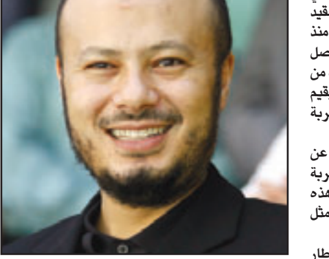
محمد معمر القذافي

عملت «القدس العربي» من مصادر متطابقة في العاصمة التونسية أن محمد معمر القذافي، نجل العقيد معمر القذافي موجود في جزيرة جربة التونسية منذ مساء الأحد. وقالت المصادر إن نجل القذافي وصل الى الجزيرة التي تبعد نحو 550 كلم الى الجنوب من العاصمة قادماً إليها من طرابلس بهدف العلاج، ويقدم نجل القذافي من زوجته الأولى منذ وصوله الى الجزيرة في فندق يخصص لحماية أمنية مشددة.