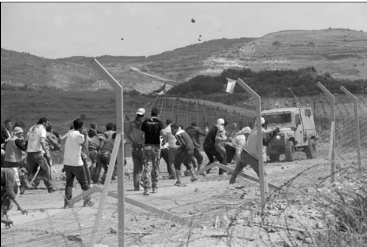
أذا نشبت انتفاضة ثالثة فسستكون أعنف من سابقتها

نجتحت سورية أمس في الاحتيايل على اسرائيل بأن وجهتها بالضبط الى الزاوية التي لا تريد ان تدفع تحقيق اولى للجيش الاسرائيلي، كان المظاهرون الذين اصيبيوا هناك قد اطلق جيش لبنان عليهم النار. مفهوم ان الحوادث أمس لم تكن عفوية، فلحاص وحزب الله ونظام الرئيس الاسد أكثر منهم جميعا مصلحة واضحة في صرف الانتباه الدولي ان ال قتل اسرائيل للمواطنين العرب.