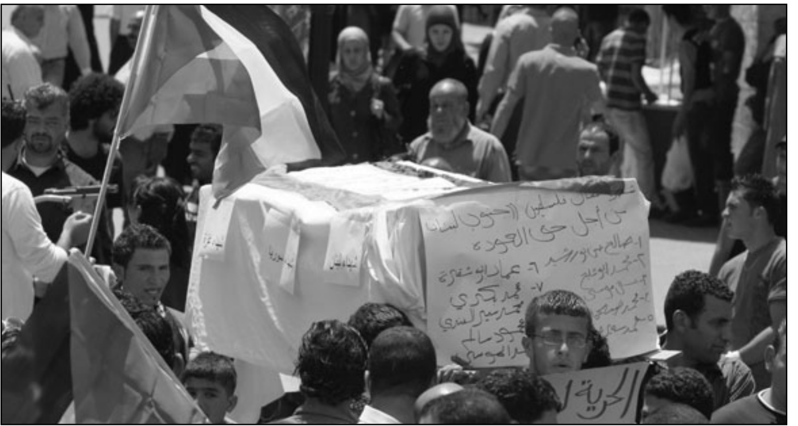
فلسطينيون يحملون كفنًا رمزيًا حدادا على أرواح الشهداء الذين سقطوا في ذكرى النكبة

وإنسانا، ونددت المؤسسة بالهجوم الإسرائيلي، قائلة أن منع الاحتلال دون وصول السفينة لغزة يعد «استكتمالا للحصار الجائر على قطاع غزة، واستمرارا في العدوان على غزة، وضربا بعرض الحائط لكافة القوانين والأعراف الدولية».