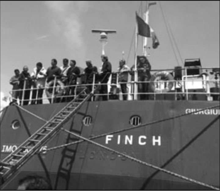
السفينة الماليزية قبل توجيهها إلى غزة

سفن شحن كانت ضمن «أسطول الحرية» الذي شارك فيه عدد من متضامنين أجانب ما أدى وقتها إلى مقتل تسعة متضامنين واعتقال وترحيل الباقين، وهدمهم يقو 700 ناطق، إضافة إلى مصادرة المساعدات التي كانت على متن السفن.