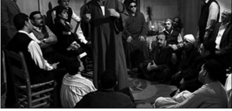
لقطة من فيلم «الفاجومي»

وأوضح المنتج أنه رأى من واجبه أن يؤرخ لشخصية الشاعر المصري الكبير وأن يكون فيلم «الفاجومي» باكورة إنتاج شركته التي تحضر حاليا لعلمين جديدين يتم البدء بتصويرهما خلال الشهر المقبل.