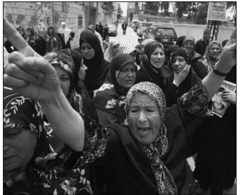
فلسطينية تنكي خلال تشييع جثمان شهيد في مخيم البص قرب صور... وفلسطينيون يشيعون جثمان أحد شهداء النكبة في مخيم عين الحلوة

جيش العدو فاستشهد العشرات وجرح المئات وصرخوا عاليا بصوت دماهم الكهده ليسمعوا العالم كله موقفهم الحاسم والقاطع والذي لن توهنه المجازر ولا تقادم السنين ولا قلة الناصر وكثرة المتأمر». وقال «انتقم أيها الشرفاء حولتم بالأمس يوم النكبة إلى يوم آخر وبدلت معانيها بمعان جديدة، وأنتم للعدو والصديق أن تتسكعم الكبري التي تشهدها المنطقة والمترافقة مع صورة الشباب العربي التواق للتحضر والتضبيب وان عودتكم إلى دياركم وحقوقكم وأرضكم والقدسات حق وهدف وغاية وامل ويقين تبدل من أجلها الدماء والنفوس والتضحيات الجسام». وتابع «سالتكم القوية للصديق أنك لم ترضون عن فلسطين وطننا بديلاً فلا يخافن أحد من التوطنين لأن قراركم الحازم هو العودة»، وأضاف الأمين العام لحزب الله «نحن معكم وإلى جانبكم فنرح فرحكم ووطنية بعض الشبان النذفين خدمة ثارها الخاصة بما كانت هذه الجهة مسؤولة معنوية وسياسية توازي المسؤولية الجنائية المباشرة التي تتحملها إسرائيل». ودعا البيان الدولية اللبنانية التي فرض تطبيق القرار 1701 ومنع أي طرف كان من العبث بأمن التشعب واللبنيانيين، بما يؤدي إلى استدراج ردود فعل عسكرية لا تحمد عقبائها على غرار ما حصل يوم أمس، وفي 12 تموز 2006ء.