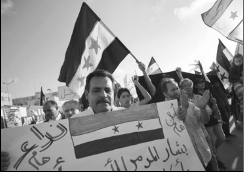
الاصلاحات هي اداة للحفاظ على الانظمة القديمة وليست لتصفيتها

الاول: دعمكم من الاصلاحات، اتخذوا الديمقراطية، لا معنى لطلب «الاصلاحات» من الاسد، عندما تكون الاصلاحات الوحيدة التي يجب ان تتخذ هي تقديم نفسه الى المحاكمة، مثلما في شرقي اوروبا حزب فلسطيني – اسلامي.