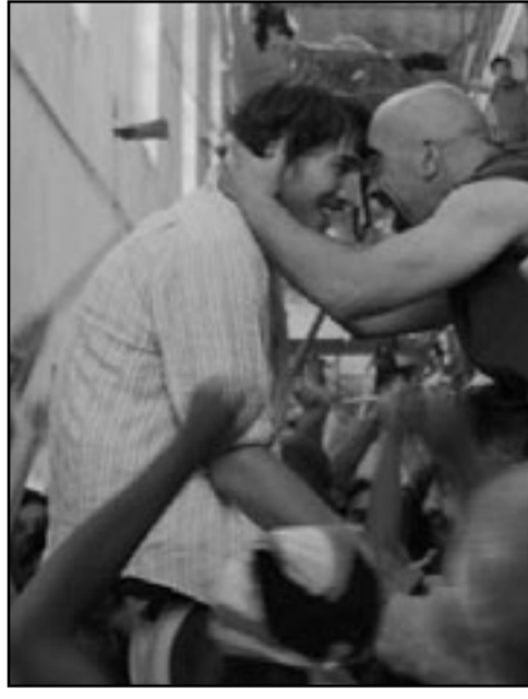
لقطة من فيلم «الزنازنة 211»

بأحد ومعماري بغير في لندن sayedwn@yahoo.co.uk عندما جلس لأول مرة على الكرسي، شعر بالقوة تدبّ في أوصاله، جعله سيطرا، خشني إن بقدها، بحث عن سر الطود، أشارت عليه حاشيته أنه سيجد مرامه عند كبير العرافين، استدعي هذا الأخير الذي امتلئ بين يديه، قال له: بلغني أنك تعرف شيئا عن سر الخلود؟ أجاب كبير العرافين: اللليل يا سيدي! هات ما عندك! كما هو معلوم أن الكواكب والمجرات كانت كتلة واحدة قبل أن تتكون، وذلك في قوله تعالى (وَأولم ير الذين كفروا أن السموات والأرض كانتا رتقا ففتقنهما وجعلنا من الماء كل شيء حي أفلا يؤمنون)!! تقول الأسطورة - والله أعلم - أن تلك الكتلة عقب ما انفجرت، تحولت إلى أواد مجبول في كوكب الأرض لم يقبضه أحد سوى الفراعنة الذين أطلقوا عليه اسم شريان الحياة، لأن به نهرا من الدم، يُقال إن من شرب منه يخلد، بوقت عيانه وهو يسأل: كيف السبيل إلى ذلك الوادي؟ - حسب ما ذكر في الأسطورة، عليك أن تسير باتجاه غروب الشمس في خط مستقيم لا اعوجاج فيه. ما دم تعرف كل هذا... لماذا لم تذهب إلى هناك؟ - لأنني يا سيدي لا أصدق حرفاً واحداً من هذه الأسطورة! - أما أنا فبلى! جمع حاشيته ورجاله، سار باتجاه العمارة مدة أسبوع، ليجد جبلا شاهقا يسد الطريق أمامه، تلفت يمينا وشمالا له وجد سبيلا لعبور الجبل، لكن دون جدوى، خيم الليل