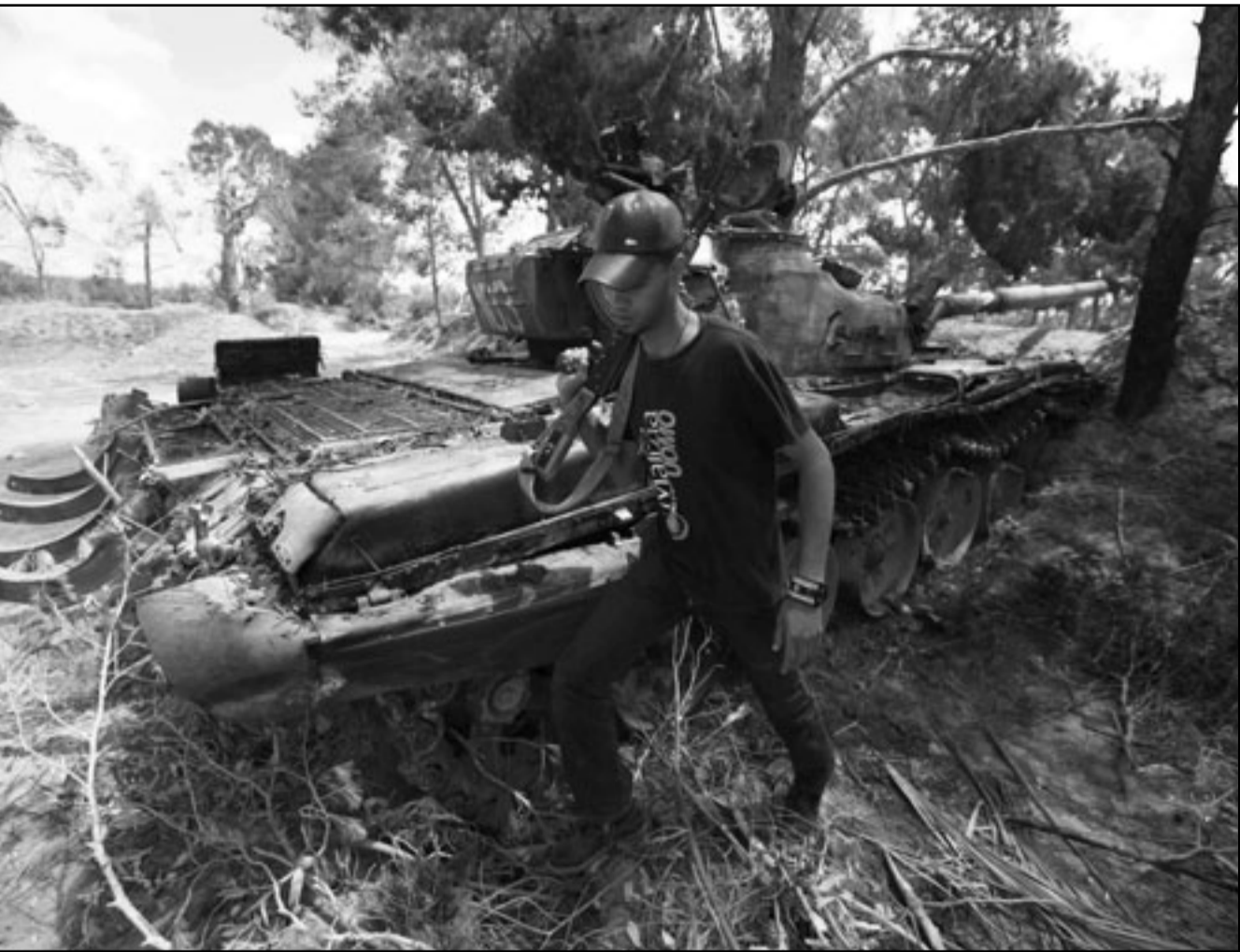
أحد الثوار الليبيين يمر من أمام بداية مدمرة تابعة لقوات القذافي في مدينة مصراته