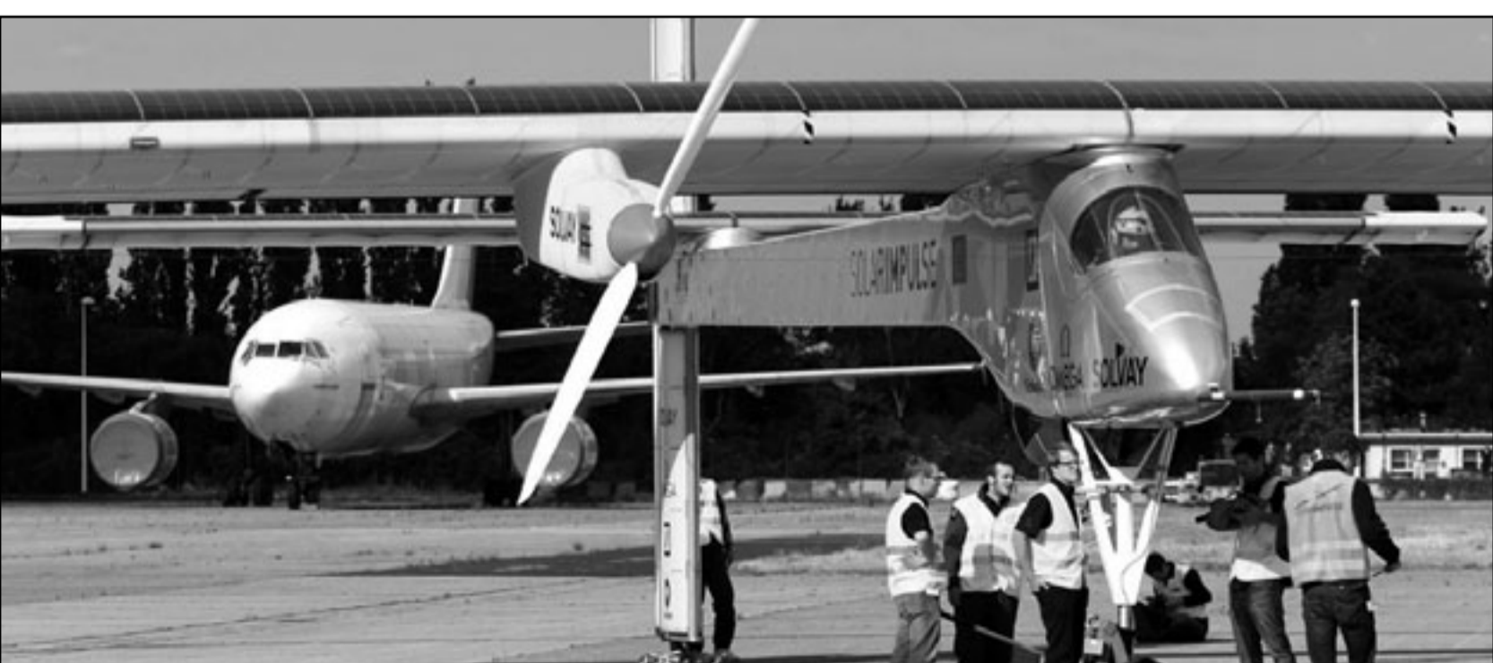
طائرة سولار امبلس قبيل اقلاعها من بروكسل في الرحلة التي لم يكتب لها النجاح

سولار امبلس أقلعت من مطار زانفليم القريب من بروكسل في ثاني رحلة دولية لها. ووفقا لهذه المصادر فإنه كان من المنتظر أن تصل الطائرة مع حلول منتصف ليل أمس إلى مطار لوبورجيه بالقرب من العاصمة الفرنسية باريس حيث ستشارك في معرض باريس الدولي لفنون الطيران الذي يقام خلال الفترة 20-26 حزيران/يونيو الجاري. ويبلغ طول جناحي الطائرة 64 مترا وترزن 1.6 طن، وهي مزودة بأربعة محركات إلكترونية