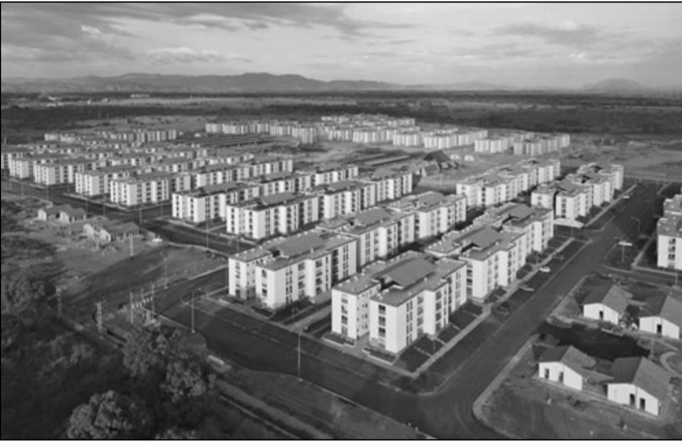
صورة بالكاميرا لمشروع مدينة جديدة قرب طهران

مدن أخرى غير طهران. لأن التضخم الذي يشهده الآن مرتفع بشكل زائد عن الحد وبهذا الدخل المتوسط وهذا المناخ الاقتصادي من المستحيل تماما شراء منزل». وارتفعت أسعار العقارات بنسبة تزيد على 100 في المئة عام 2007 بعد ارتفاعها بنسبة 65 في المئة عام 2006 وبنسبة تزيد على 50 في المئة عام 2005. وتشير بيانات أمكن الحصول عليها من رئيس اتحاد العاملين في القطاع العقاري في طهران إلى أن نسبة زيادة الأسعار في عامي 2010 و2011 تراوحت بين عشرة و20 في المئة.