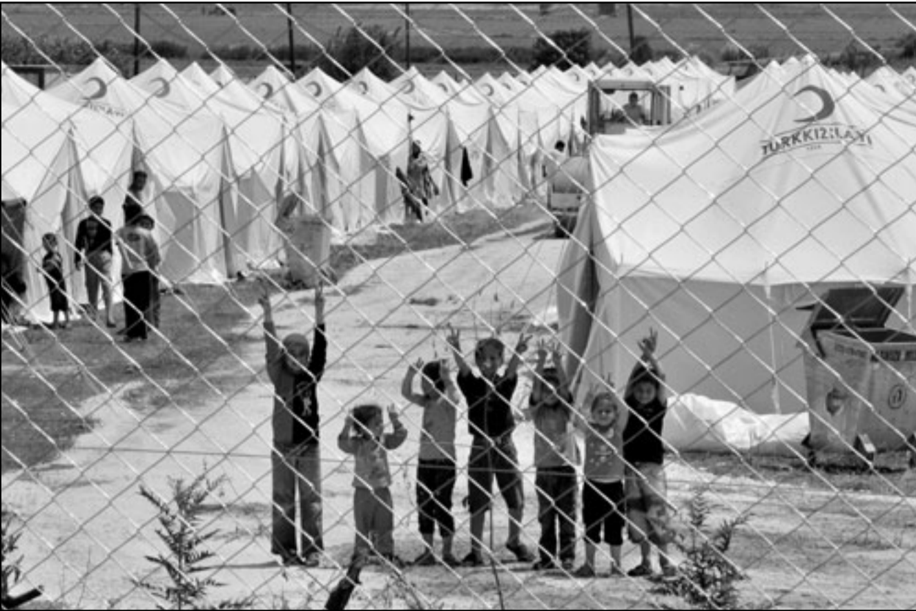
اطفال سوريون يلعبون في أحد المخيمات التابعة للصليب الاحمر على الحدود التركية

الضروي حضورهما، وقال دبلوماسي اخر «انها رسالة واضحة جدا»، وزاد انتقاد تركيا لاستخدام الاسد للقوة لاحساد الاحتجاجات مع انتقالها لمناطق قريبة من الحدود بين البلدين والتي تمت لسافة 800 كيلومتر.