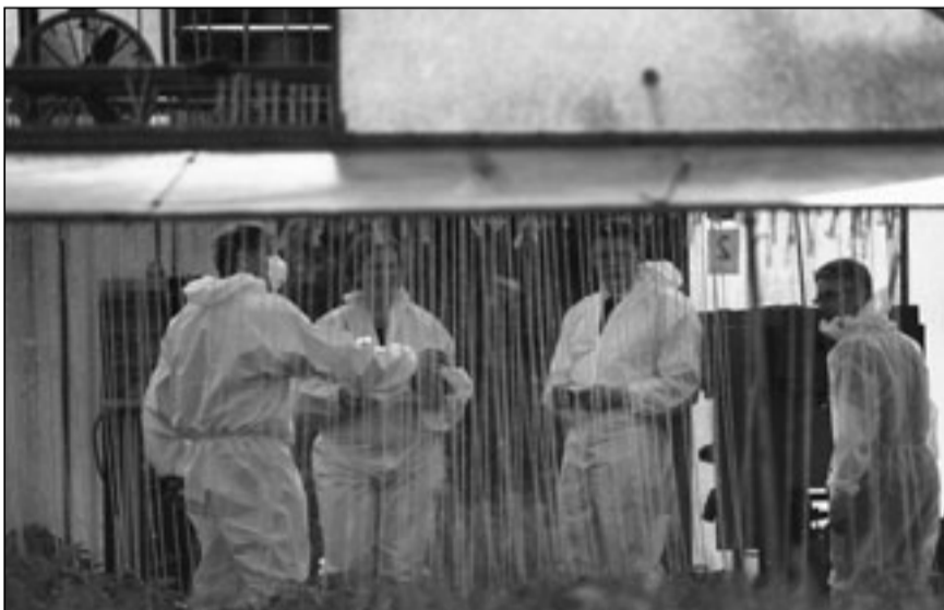
المياه في إحدى المزارع المشتبه بتلوثها بجرثوم اي كولاي