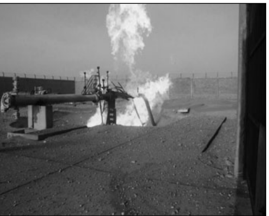
حريق في انبوب امداد غاز من مصر الى اسرائيل

وكان جهاز أمن الدولة الشرس عادة ما يتدخل في اختيار عمداء الكليات المصرية خلال العقود الأربعة الأخيرة ويستبعد أولئك المعروفين بمعارضتهم للنظام.