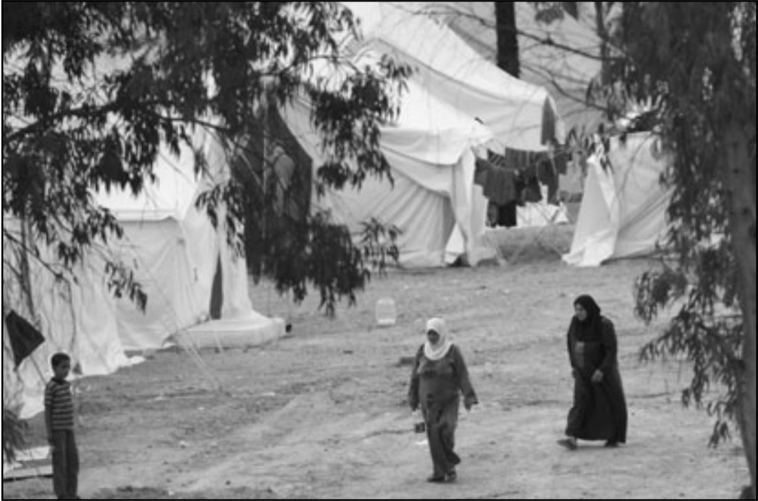
تركيا لا تنوي البقاء متفرجة في الصراع بين نظام الاسد وشعبه

غير قليل من دول اووروبية والولايات المتحدة التي ترى اردوغان ديمقراطيا يريد ان يعيد الجولات الاتراك الى معسكرات الجيش.