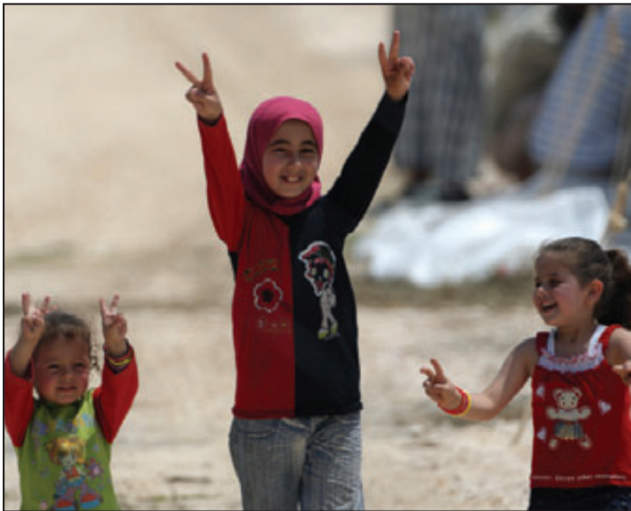
اطفال يرفعون شارة النصر في مخيم للاجئين السوريين في تركيا

وتفيد معلومات لـ «القدس العربي» ان دمشق شرعت وبادر سرية القصى الى بناء فرقة عسكرية شمالية كاملة يقارب تعدادها ما بين 10 الاف الى 12 الف جندي ستستخم ثلاثة ألوية محمولة مشاة تسمى ألوية (ميك) ولواء ديابات مضافا