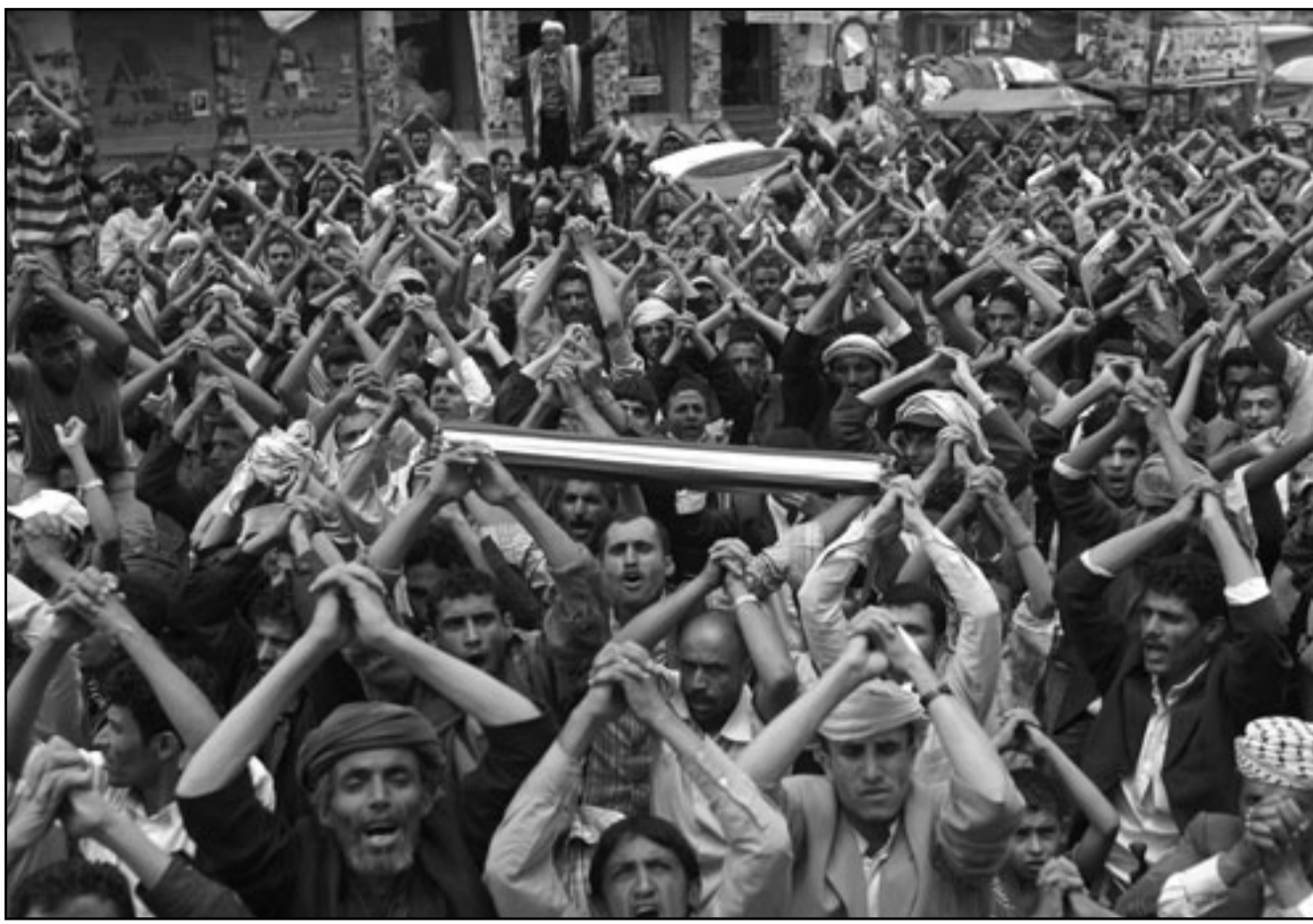
يعيرون معارضون يتظاهرون ضد الرئيس علي عبدالله صالح

■ صنعاء - وكالات: أدت المواجهات بين الجيش اليمني وعناصر مفترسين من تنظيم القاعدة منتصف ليلة السبت إلى مقتل 14 جندياً و22 من عناصر التنظيم بمحافظة أبين التي تمكنت عناصره من الاستيلاء على المحافظة منتصف شهر أيار (مايو) الماضي.