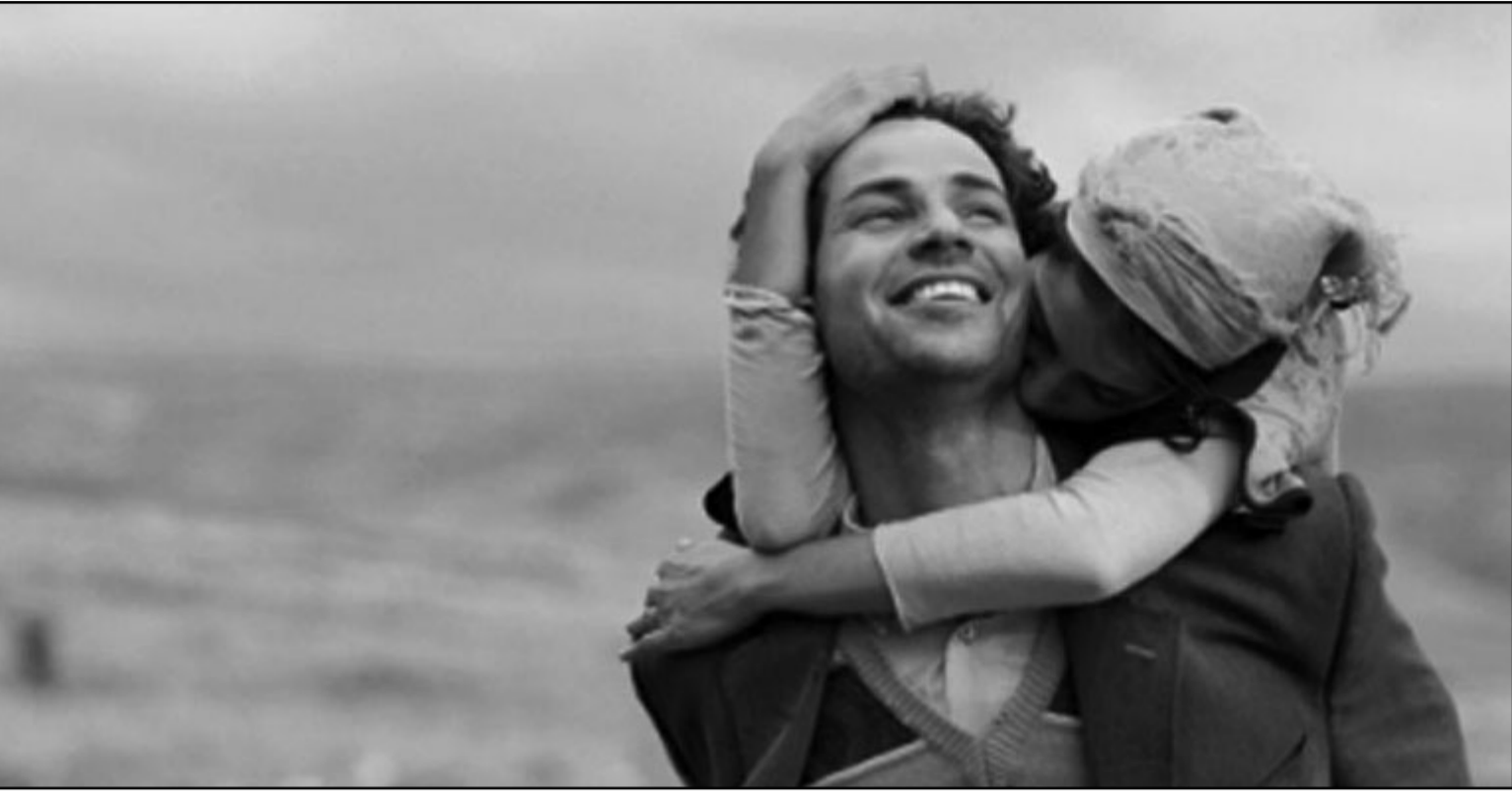
لقطة من فيلم «عين النساء»

وكما بينا في مقالة سابقة على اعمدة يومية «القدس العربي» فان مخرج فيلم «عين النساء» الإسرائيلي رادو ميهايلانو أخذ عمل المخرج الألماني فيت لممر، ونسبه اليه بالقول انه استمع لهذه القصة بنفسه (لا يقول لنا أين) وقرر كتابتها بالفريسية (هو الذي لا يجيد حتى التكلم باللغة