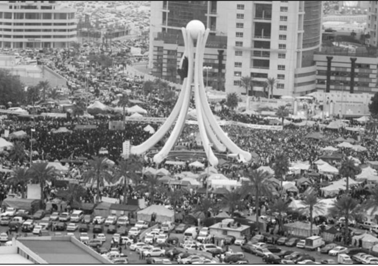
صورة ارشيفية لمظاهرة بحرينية في ميدان اللؤلؤة