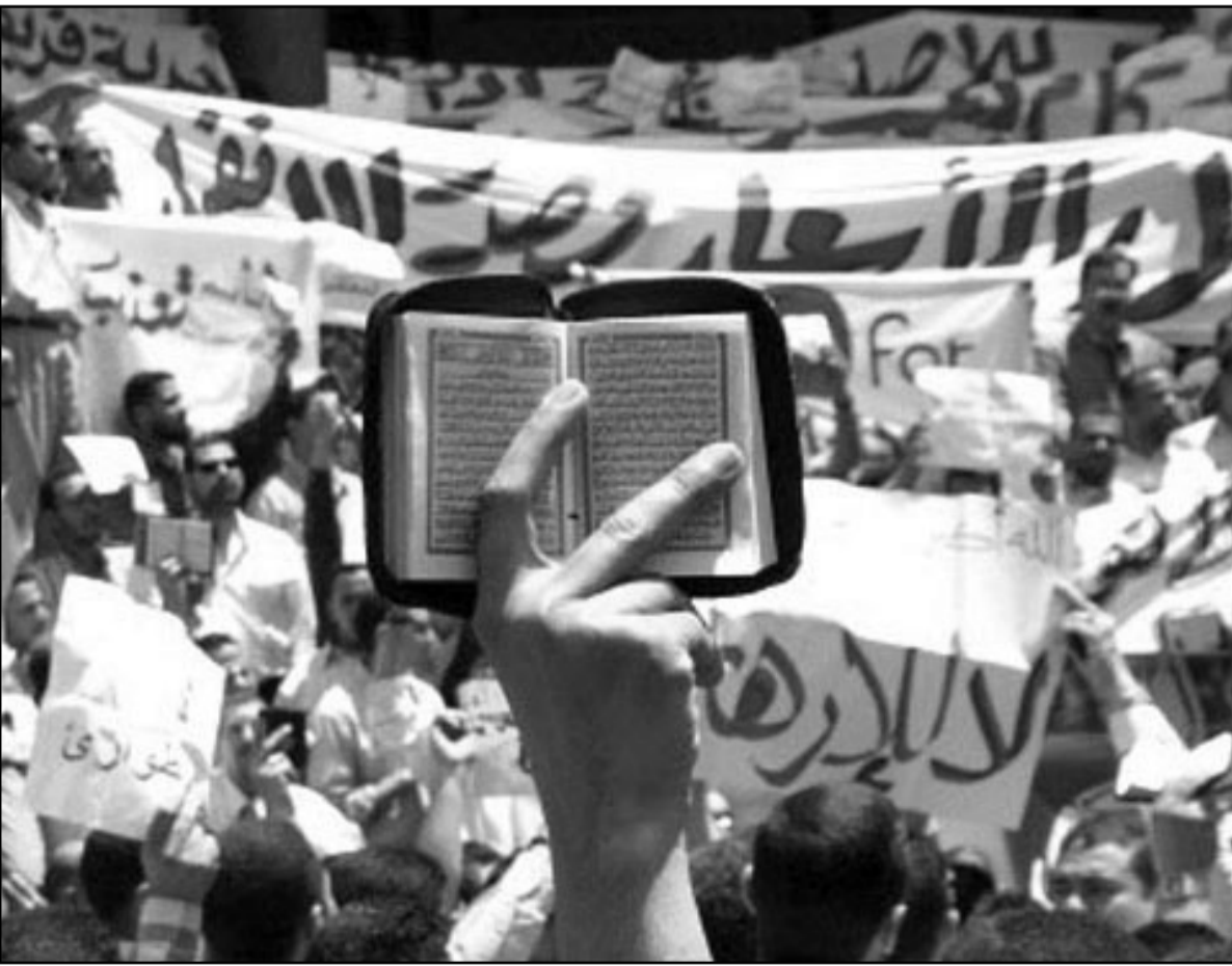
الاخوان المسلمون في مصر يحاولون تحسين صورتهم

يُسمح لهم بالمشاركة الرسمية في ادارة الدولة، اثناء سني حكمها للقطاع، وبنيت من وجهة نظر الاخوان طرازا ناجحا لادارة دولة اسلامية. في المدة الاخيرة توجه ناس الحركة الى اخوتهم في خطبة الجمعة، «نحرمنا الله من عطفه ونحرمنا من عطفه ونحرمنا من عطفه»، قال بديع لؤيديه، «انهم يعملون الليل والنهار لاحداث شقاقا بين المسلمين وتقسيمهم».