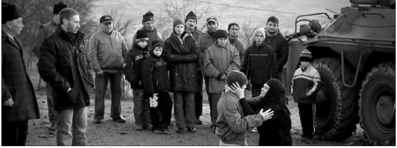
لقطة من فيلم «مدير شؤون العاملين»

مشكلتنا في الفترة الأخيرة أننا أصبحنا نتكفي بأنفسنا، نتحدث في قضايانا كأننا نتحدث إلى ذواتنا، أو إلى الذين يعرفون بالفعل ما نتحدث عنه، بينما إسرائيل تدرك تماماً أنها تتحدث إلى العالم، المتعاظم معها بالفعل وإن كانت هناك تلميحات تعامل مع مرض السرطان فإن عليك أن تعرف طبيعته وحمه وقر السرطان له، وهذه المعرفة لا تعني القول به والاستسلام له، وإنما تساعدك على مقاومته. كذلك إسرائيل، فما أنتصروه موفقاً صحيحاً هو معرفة أكبر وأعمق بها وما تنتجه من كل المجالات، وأن نتعرف، لا يعني أنك نتعرف، وعندما تعي قدر الخطر في وجود إسرائيل فإن هذا لا يعني أنك تقول إن هذا الوجود شرعي، بل ربما كان الخطوة الأولى في الاتجاه الصحيح نحو مقاومة هذا الخطر.