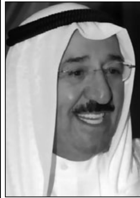
امير الكويت الشيخ صباح الاحمد الصباح

■ الكويت-رويترز: قال امير الكويت الاربعة ان الدولة «لن تتهاون» مع أي شخص يهدد أمنها وذلك بعدما نظمت المعارضة مظاهرات أسبوعية تطالب بتنحي رئيس الوزراء. وتواجه الكويت جمودا سياسيا منذ فترة طويلة واحتشدت المعارضة ضد رئيس الوزراء الشيخ ناصر المحمد الصباح عضو الأسرة الحاكمة والذي يتمتع بنفوذ كبير. وشارك عدة مئات في مظاهرات سلمية اسبوعية تطالب باستقالته. وقال امير الكويت الشيخ صباح الاحمد الصباح في كلمة نشرتها وسائل اعلام رسمية «طلب من وزير الداخلية موصلة اتخاذ كافة التدابير الكفيلة بحماية أمن الكويت واستقرارها وعدم التهاون ازاء كل من يحاول المساس بأمن البلاد وثوابتها الوطنية والتجاوب مع القوانين والانظمة». وشكا الأمير من ممارسات في البرلمان «تخرج عن اطار الدستور وتتجاوز مقتضيات الصلحة الوطنية تتسم بالتعسف وتسجيل المواقف وتصفية الحسابات والشخصانية المقيته». وكثيرا ما طلب نواب المعارضة في البرلمان استجواب رئيس الوزراء بخصوص قضايا تتراوح بين مزاعم باسءة استغلال الأموال العامة والاضرار بالامن الوطني والعلاقات مع البلدان العربية من خلال تفضيل العلاقات مع إيران. ورد الشيخ ناصر على بعض تلك الاستجوابات في جلسة مغلقة أمس الثلاثاء لكنه لم يرض المعارضة على ما يبدو حيث قدم نواب عنها مذكرة لحجب الثقة عن رئيس الوزراء مستمداً مناشدتها الأسبوع القادم. لكن مثل تلك المذكرات فشلت في السابق في حشد التأييد اللازم.