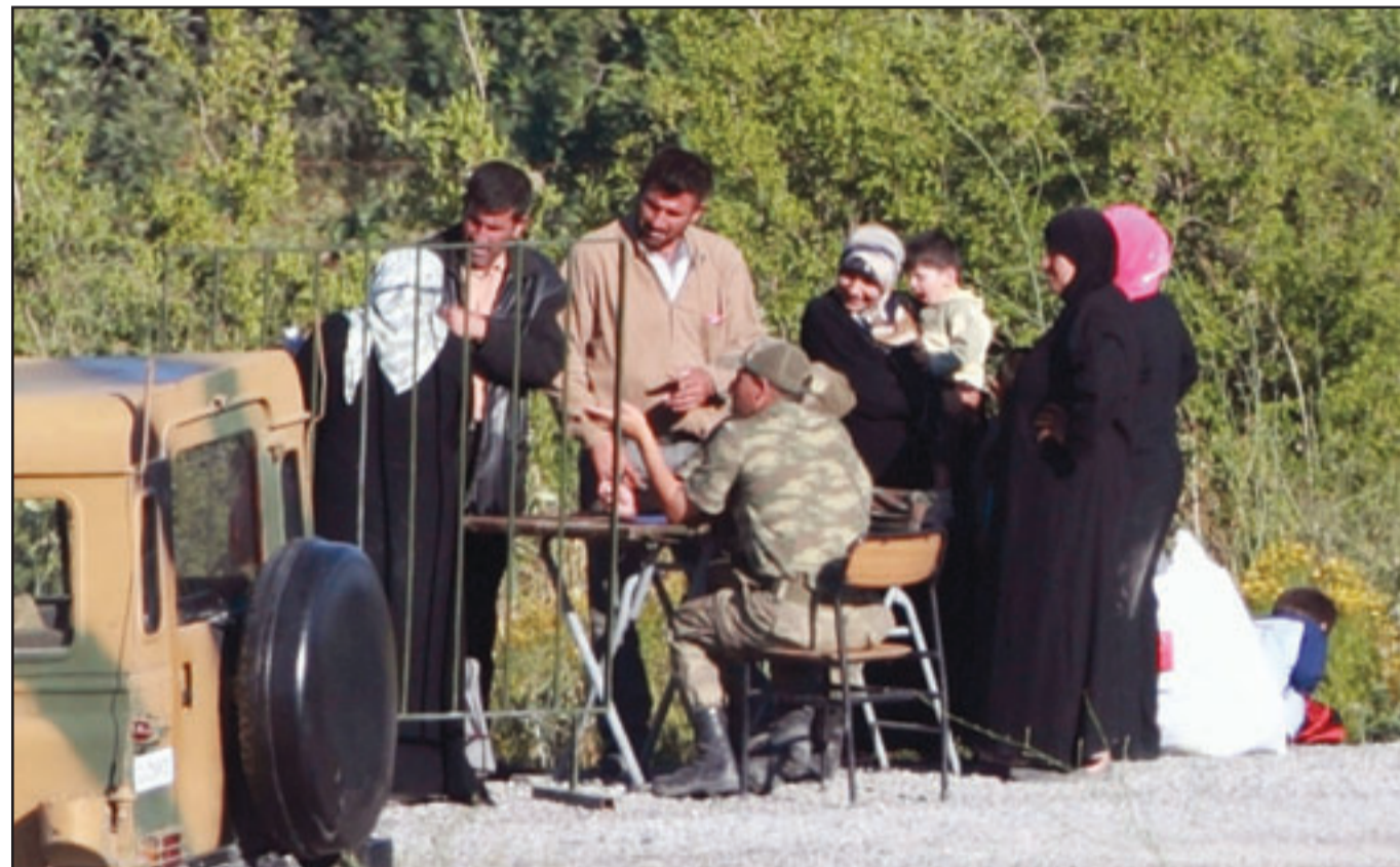
لاجئون سوريون ينتظرون الحصول على اذن لدخول تركيا امس