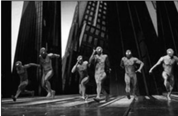
مسرحية «الرجل العنكبوت»

تم خلالها تغيير الموسيقى والحبكة والمخرج. وعلى الرغم من وصف الرئيس الأمريكي الأسبق بيل كلينتون للنسخة المعدلة بأنها «رائعة»، إلا أن معظم نقاد المسرح أعربوا عن نفس رأي الناقد بين برانتلي في صحيفة «نيويورك تايمز»