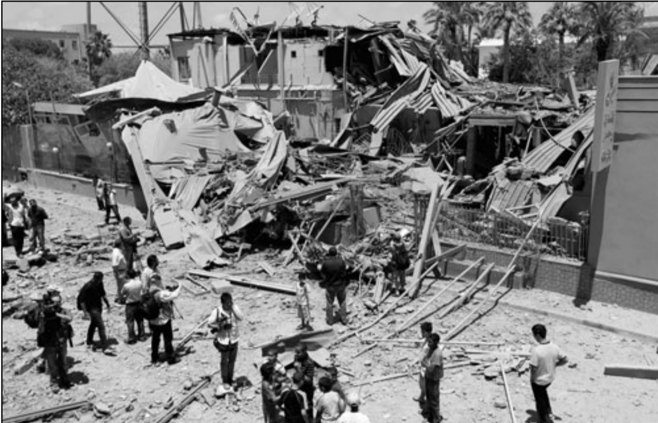
فندق بوسط طرابلس قالت السلطات الليبية انه تعرض لضغط حلف الأطلسي الليلة قبل الماضية

لكن رغم ذلك، رفع البلدان من وتيرة القصف الجوي واستعانوا بالطائرات المروحية لزيادة الضغط على كتائب القذافي لتسريع الحل إما عبر الحل العسكري دون استبعاد اغتيال القذافي في القصف أو دفع القربين منه إلى انقلاب عليه.