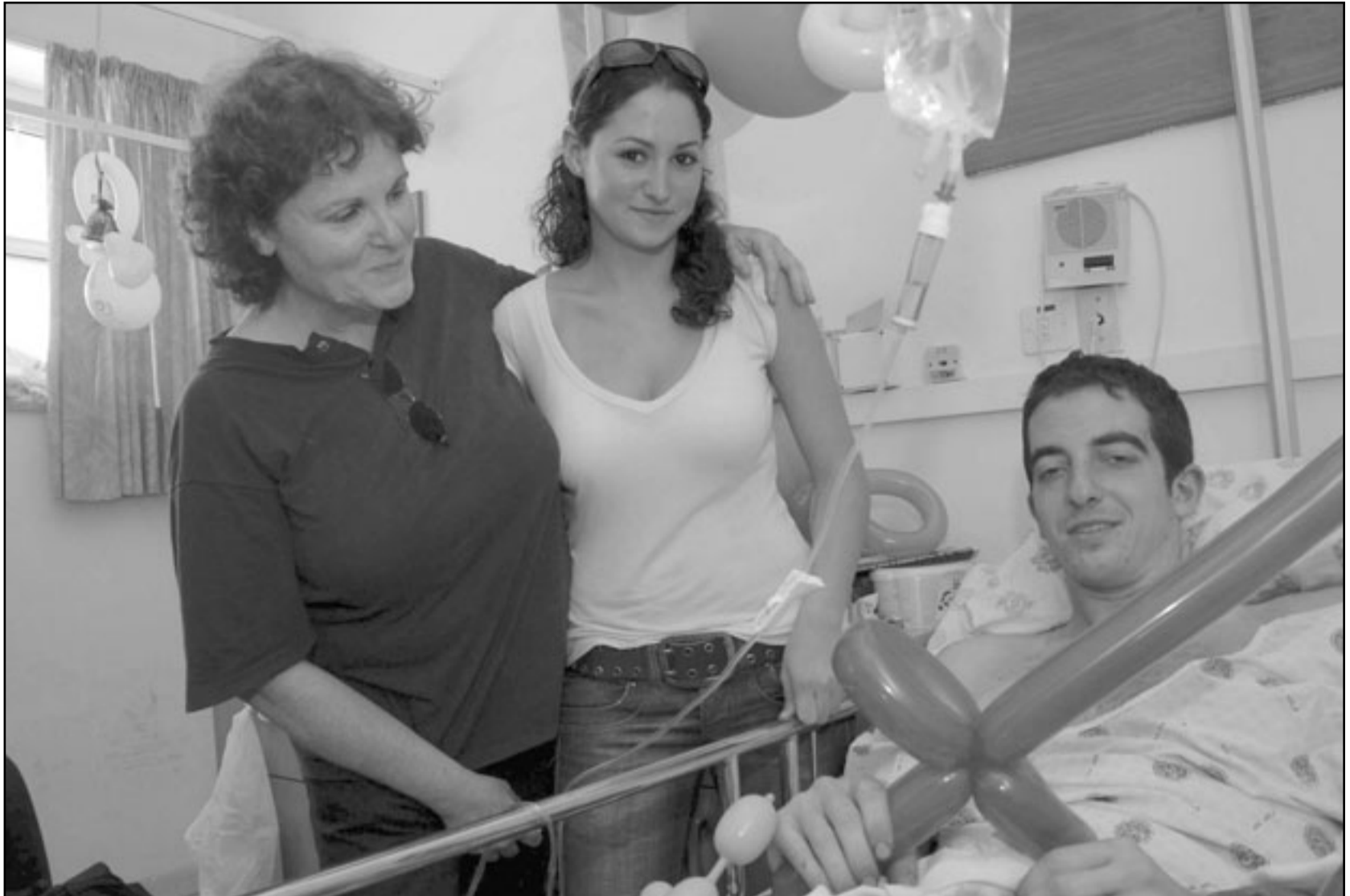
إيلان غرابيل لدى إصابته في حرب لبنان عام 2006

المصريين في سجون الاسرائيلي الخميس شباب الثورة المصرية والكوسمة العمل على اطلاق سراحهم من خلال صفقة تبادل اسرى لاطلاق سراحهم مقابل اطلاق سراح الجاسوس الاسرائيلي ايلان غرابيل الذي ألقى القبض عليه مؤخرا في القاهرة. وأوضح الاسرى المصريون القابعون في سجون الاحتلال الاسرائيلي بانهم اعتقلوا بعد مشاركتهم للفلسطينيين في تضالهم ضد الاحتلال. وقال الاسرى البالغ عددهم 21 أسيرا، في بيان صحفي لهم امس الخميس «نطالب بإجراء صفقة تبادل تضمن تحريرنا من سجننا نحن الذين شاركنا إخواننا الفلسطينيين في جهادهم ضد العدو الصهيوني». وأضاف البيان «نطالبكم يا أحرار مصر بلا تنسوا الاسرى والأسيرات الفلسطينيين، وأن تجعلوا همنا وهمهم هما يوميا لكم، يدفعكم لتحريرنا من سجوننا». وتابع الاسرى المصريون «إن اللحم