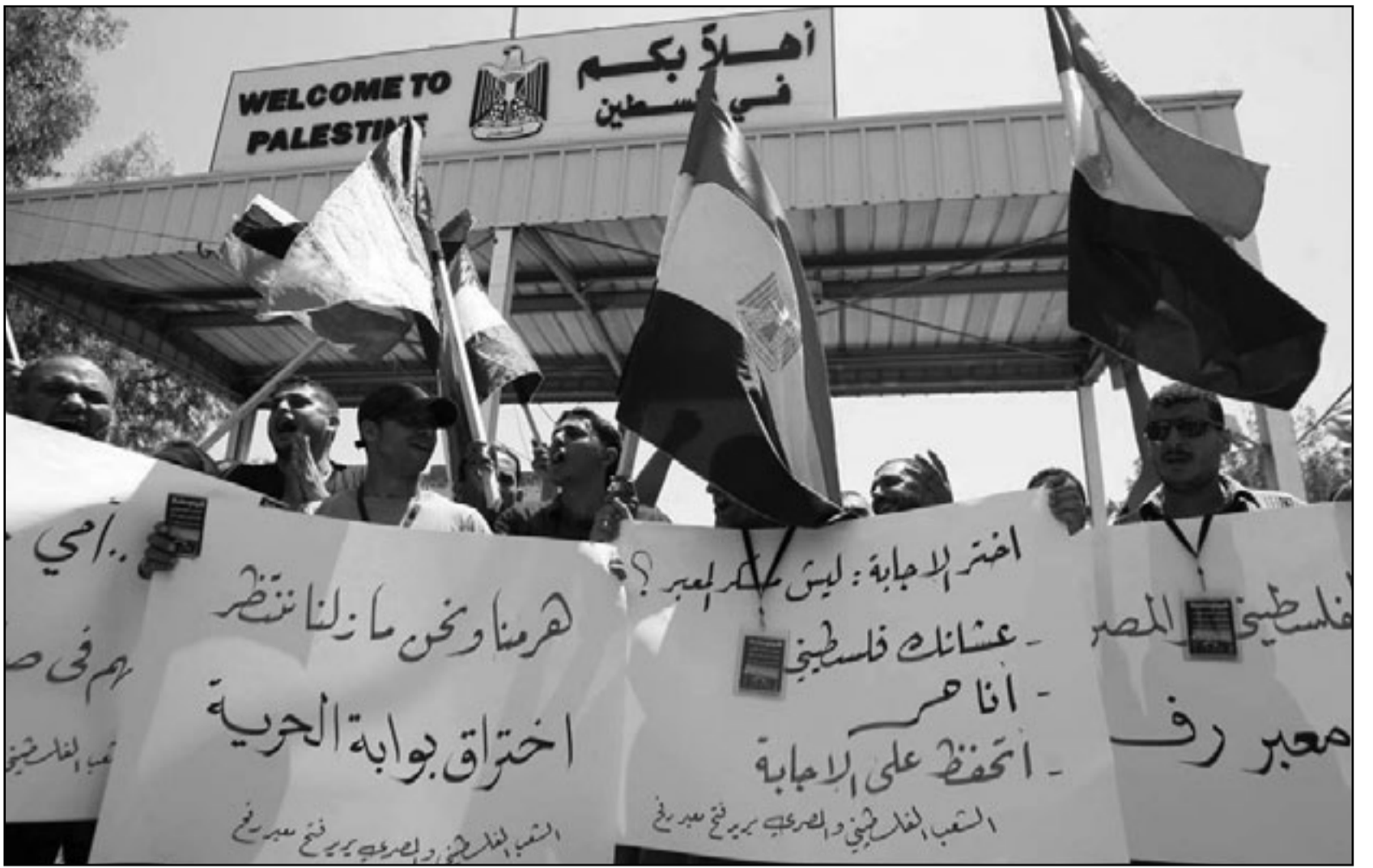
فلسطينيون يعترضون عند معبر رفح مطالبين بفتحته

نيويورك - د ب: قالت الأمم المتحدة امس الخميس إن العنف الدائر في العراق أسفر عن قتل وتشويه مئات الأطفال بينما يجري استخدام آخرين جواسيس وأدوات إغراء لقوات الأمن للوقوع في الكمائن. جاء ذلك في أول تقرير تصدره المنظمة الدولية عن وضع الأطفال العراقيين أثناء الصراع المسلح. وذكرت مجموعة شكلها مجلس الأمن الدولي تراقب الأطفال في الصراع المسلح أن 194 طفلاً على الأقل لقوا حتفهم وأصيب 590 آخرون في الشهور التسعة الأولى من عام 2010، وجاء في التقرير: «خلال الصراع في العراق،