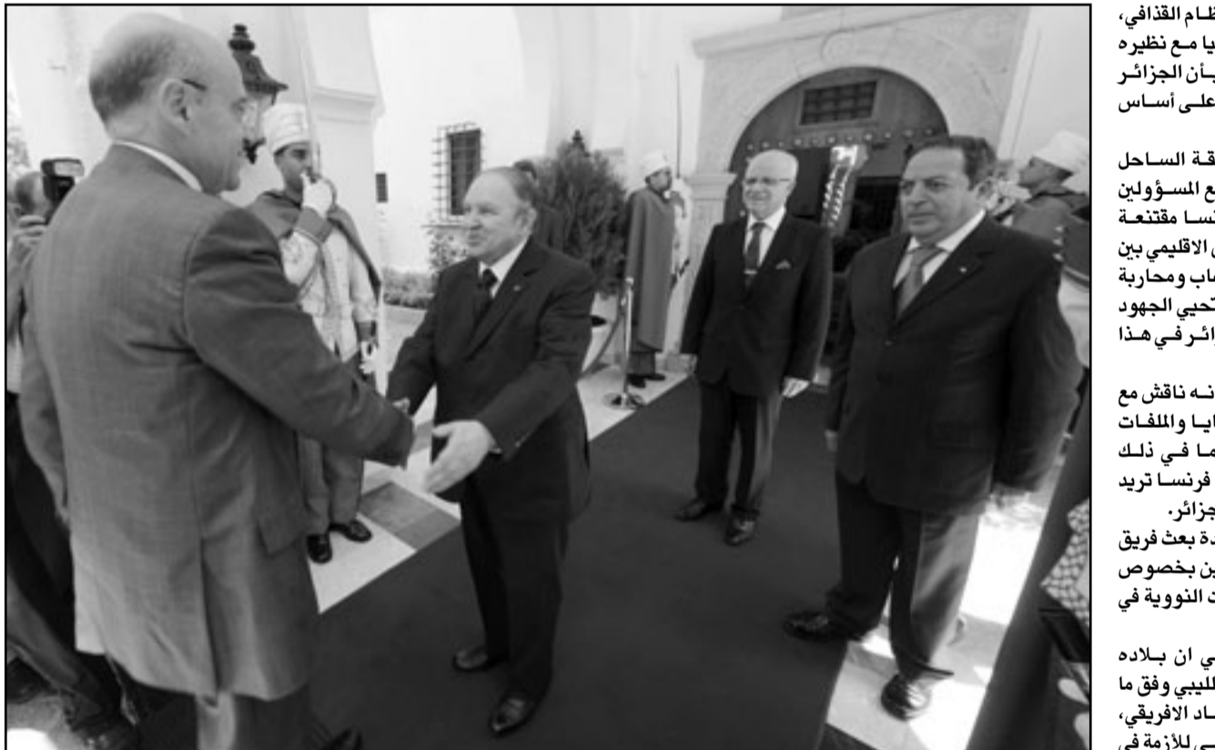
بوتليقة مستقبلا وزير الخارجية الفرنسي بالقصر الرئاسي أمس