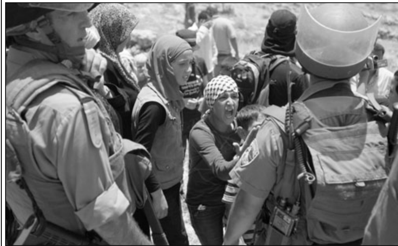
صيايا فلسطينيات يتجادن مع جنود الاحتلال الإسرائيلي خلال تظاهرة ضد الاستيطان في الضفة الغربية

في إشارة لعرقلة موضوع المصالحة الفلسطينية، وقال: «تخطر بخطرنا بالغة إلى تجاهر الاحتلال في هذه السياسات الإسرائيلية عندما تستخدم الاعتقال الإداري وتطالب به وتنتدح عنه لمنع تنفيذ مفاوضات ضد الاحتلال الإسرائيلي لا بل أصبحت تستخدمه لتحقيق أهداف وغايات سياسية كما تفعل اليوم