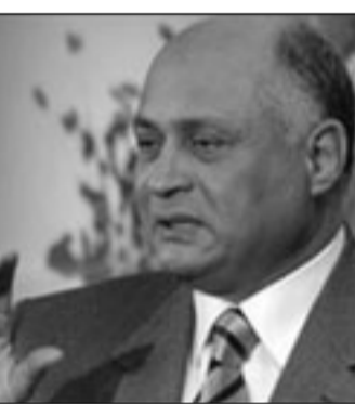
محمد ابراهيم سليمان

القاهرة - يو بي اي: قرر النائب العام في مصر امس الخميس، احالة وزير الاسكان الاسبق ابراهيم سليمان ورجلي اعمال الى المحاكمة الجنائية للمرة الثانية باتهامات فساد والتربح من المال العام. ومن المقرر ان يمثل سليمان، المسجون على ذمة التحقيق، واربعه من توابه خلال شغله منصبه، في 27 آب/أغسطس المقبل امام محكمة جنابات القاهرة في اتهامات بالتربح والاضرار العدي بالمال العام. وقال قرار الاحالة الصادر عن النيابة، ان سليمان ورجلي الاعمال يحيى الكومي وعمااد الحازق، حقوقاً ارباحاً قدرها 37 مليون جنيه مصري خلافاً للقانون باستخدام سلطة الوزير السابق.