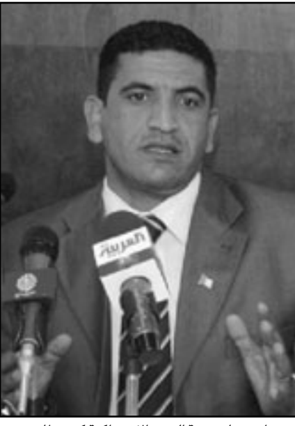
امين عام جبهة القوى الاشتراكية كريم طابو

وشدد الأمين العام لجبهة القوى الاشتراكية على أن عملية المشاورات السياسية مسرحية اختار السلطة من يشراف عليها ومن يشارك فيها، وحددت نتائجها سلفاً، في حين أن الواقع جامد. وادّعى عن موقف حزبه الذي قال إن المشاورات والإصلاحات جامدة، وقال إن موقفه من المشاورات والإصلاحات بناء على أساس معطيات واضحة، مشيراً إلى أنه رغم كل ما قيل، لا حد رأى في الميدان أن هناك إجراء ملموساً اتخذته السلطة، بدليل أنه على الرغم من أن رئيس الجمهورية قال في بيان أصدره مجلس الوزراء إن توجد تعليمات للتلفزيون الرسمي لإغلاق أبوابه أمام