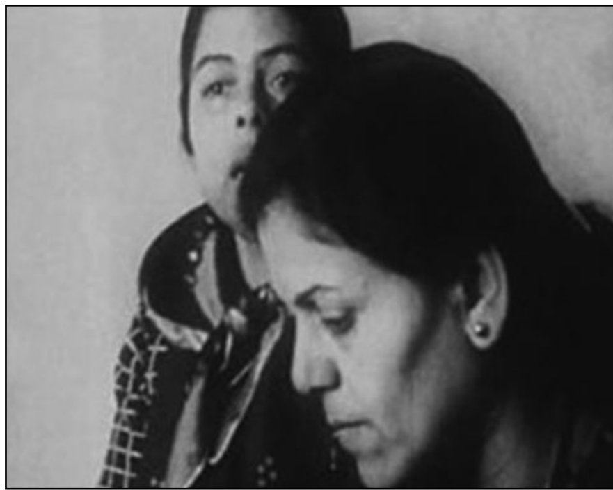
«لأن الجنود لا تموت» - قصة تل الزعتر

وأكمل فيلم (لأن الجنود لا تموت - قصة تل الزعتر) الذي اختار منظمو المهرجان ان يكون فيلم