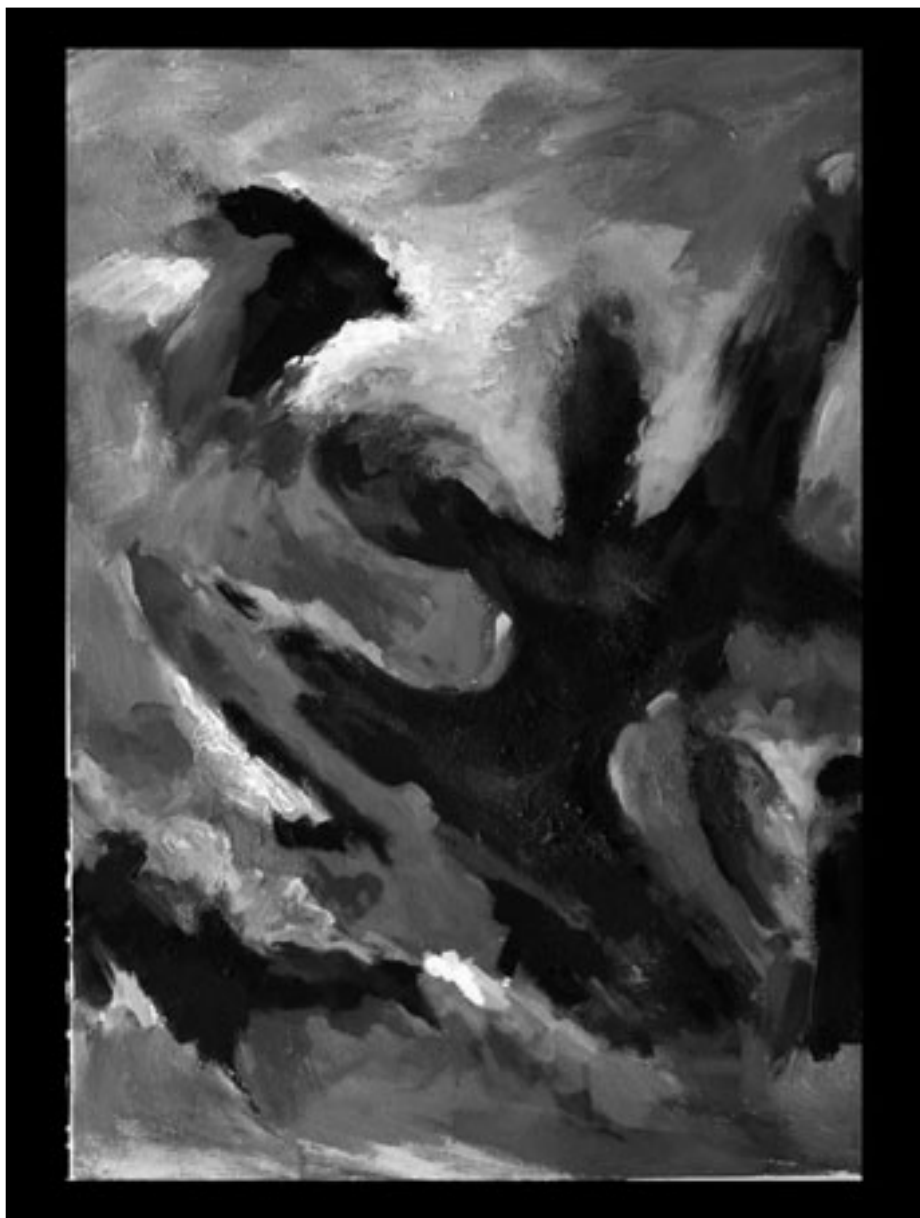
لوحة للفنان (القدس العربي)