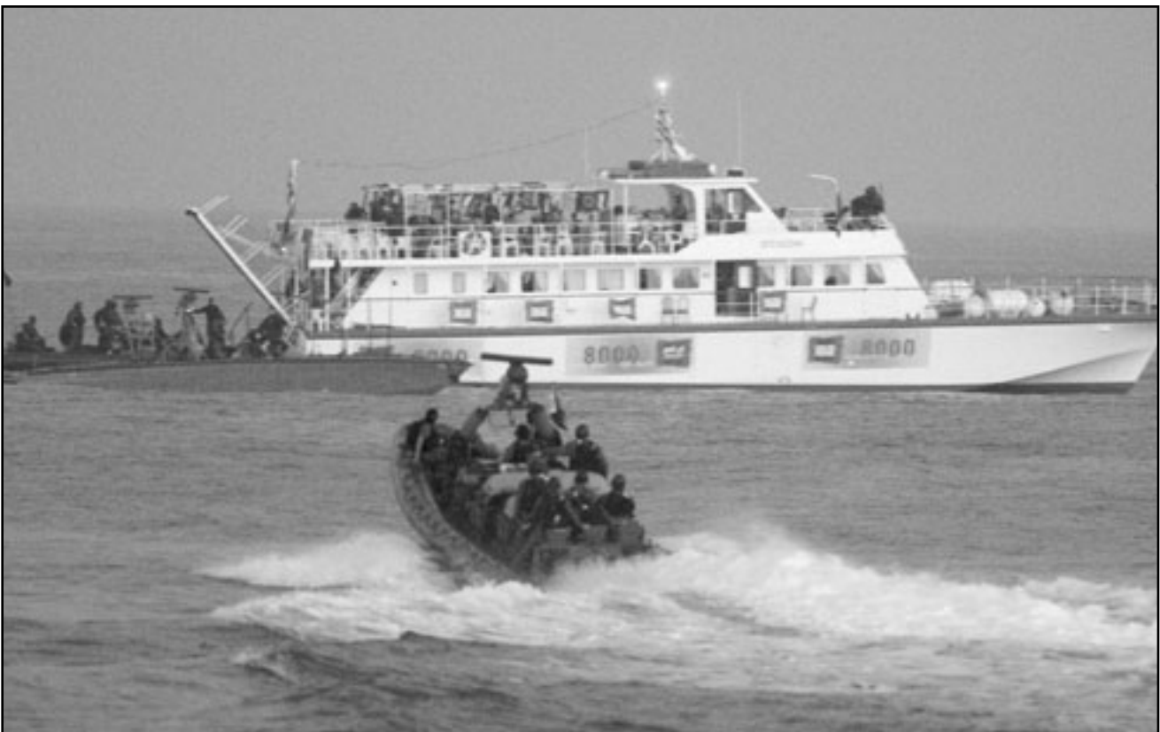
يجب الاستعداد لمواجهة عسكرية مع سفن اسطول غزة

هذه المرة، في حمل حكومتي اليونان وقبرص على منع - أو تأخير على الأقل - انطلاق السفن الي البحر. سفينة في الأصل، يتحدثون اليوم عن ست، ومن غير المستبعد ألا يكون التأجيل الحالي هو الأخير. في كل يوم يكتشف منظو الاسطول مشاكل جديدة.