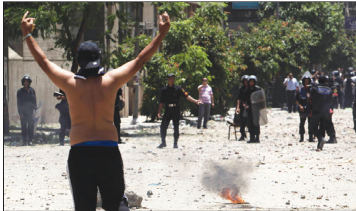
احد المتظاهرين في مواجهة قوات الشرطة في ميدان التحرير