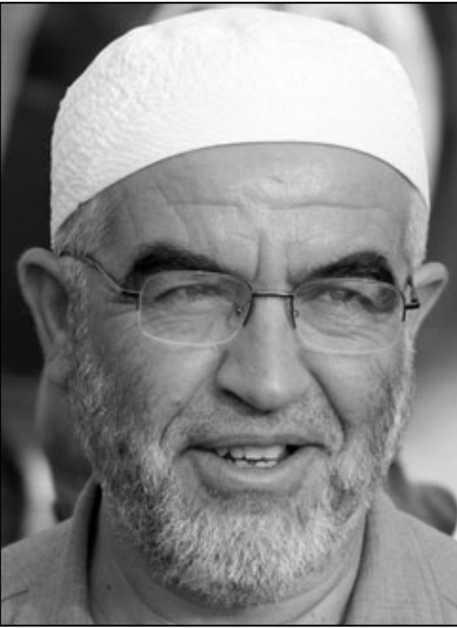
الشيخ رائد صلاح

وأضاف: كما كان الشيخ من المقرر أن يعقد صباح الأربعاء لقاء موسعا مع أعضاء البرلمان للحقوق والحريات وكذلك في ساعات المساء كان من المقرر أن يجتمع مع كبار محرري الصحف البريطانية، إلا أنه في تمام الساعة 23:00 من مساء أمس الأول، الثلاثاء، ولدى عودته من مدينة «بيستر» حيث عقد عدة لقاءات سياسية لاقت رواجاً ونجاحاً شعبياً وإعلامياً، كان في انتظاره مجموعة من رجال الشرطة والأمن البريطاني وطلبوا منه أن يرافقهم وهو معتقل، وعندما تدخل الدكتور حسن صنع الله، أحد أعضاء اللوف مع الشيخ صلاح، وقال إن الشيخ لا يتكلم بالإنجليزية فرد عليه أفراد الشرطة بفظاظة.