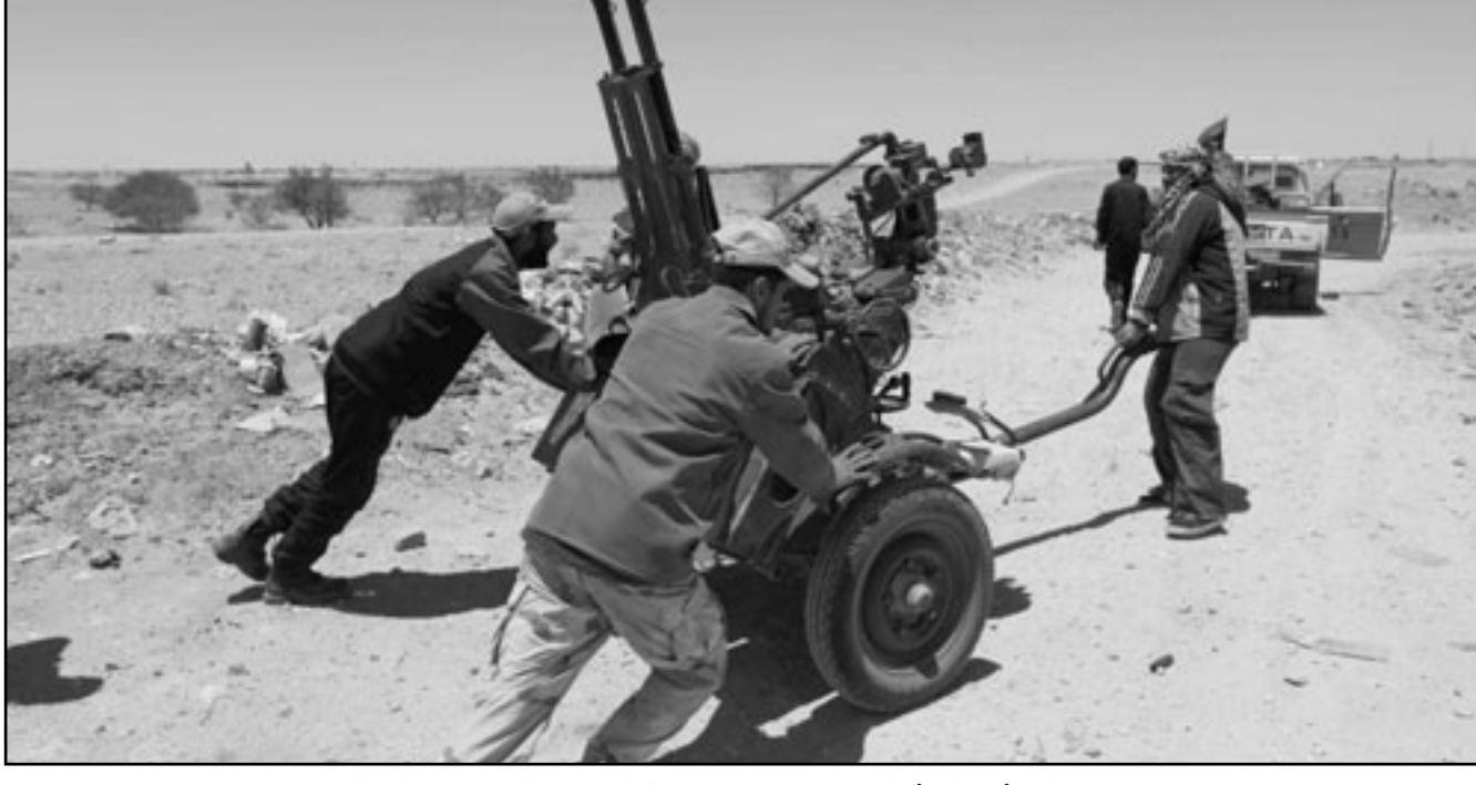
ثوار يستولون أسلحة ونذيرة هجرتها قوات القذافي قبل أيام قرب منطقة الزنتان

وجدد البيان تأكيد «أن طرح مشروع الدستور للاستفتاء لن يوقف نضالات حركة 20 فبراير»، لأنه «لا يتجاوز لا من حيث الشكل ولا المضمون مع طموح الحركة التي تشد دستورا ديمقراطياً يفتح الباب أمام بناء الديمقراطية بالمغرب».