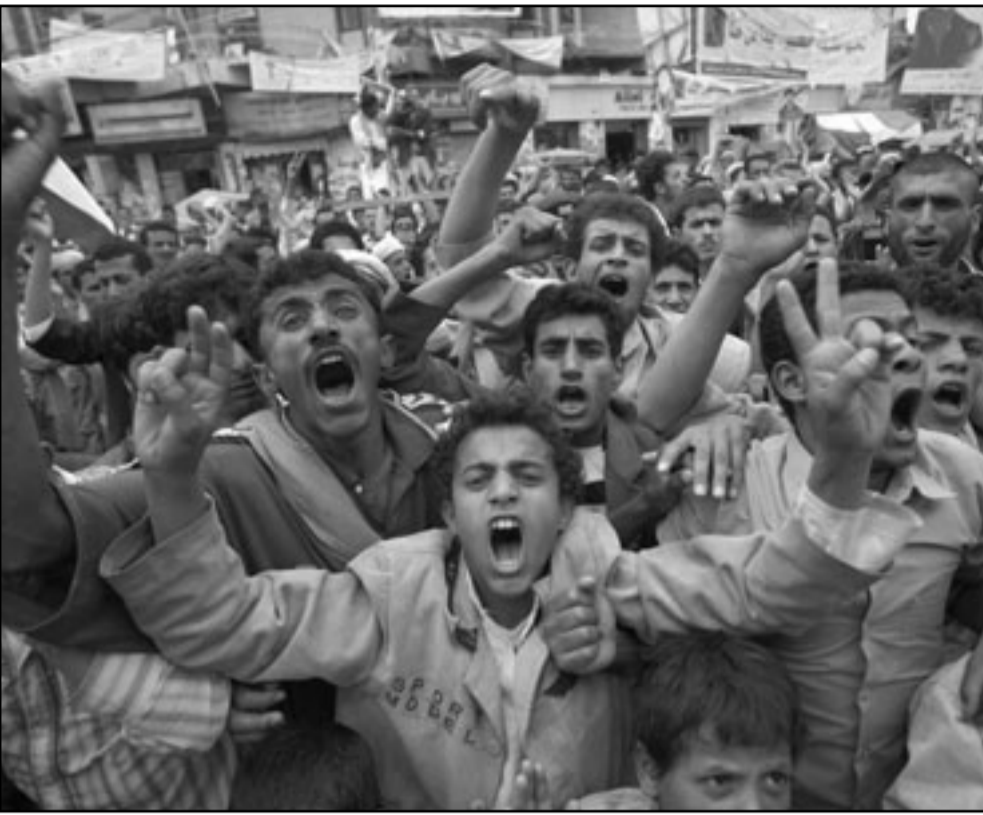
مظاهرات في صنعاء تطالب برحيل النظام

3 قتلى و10 جرحى في قصف مدفعي وصاروخي غير مسبوق على الأحياء السكنية في تعز