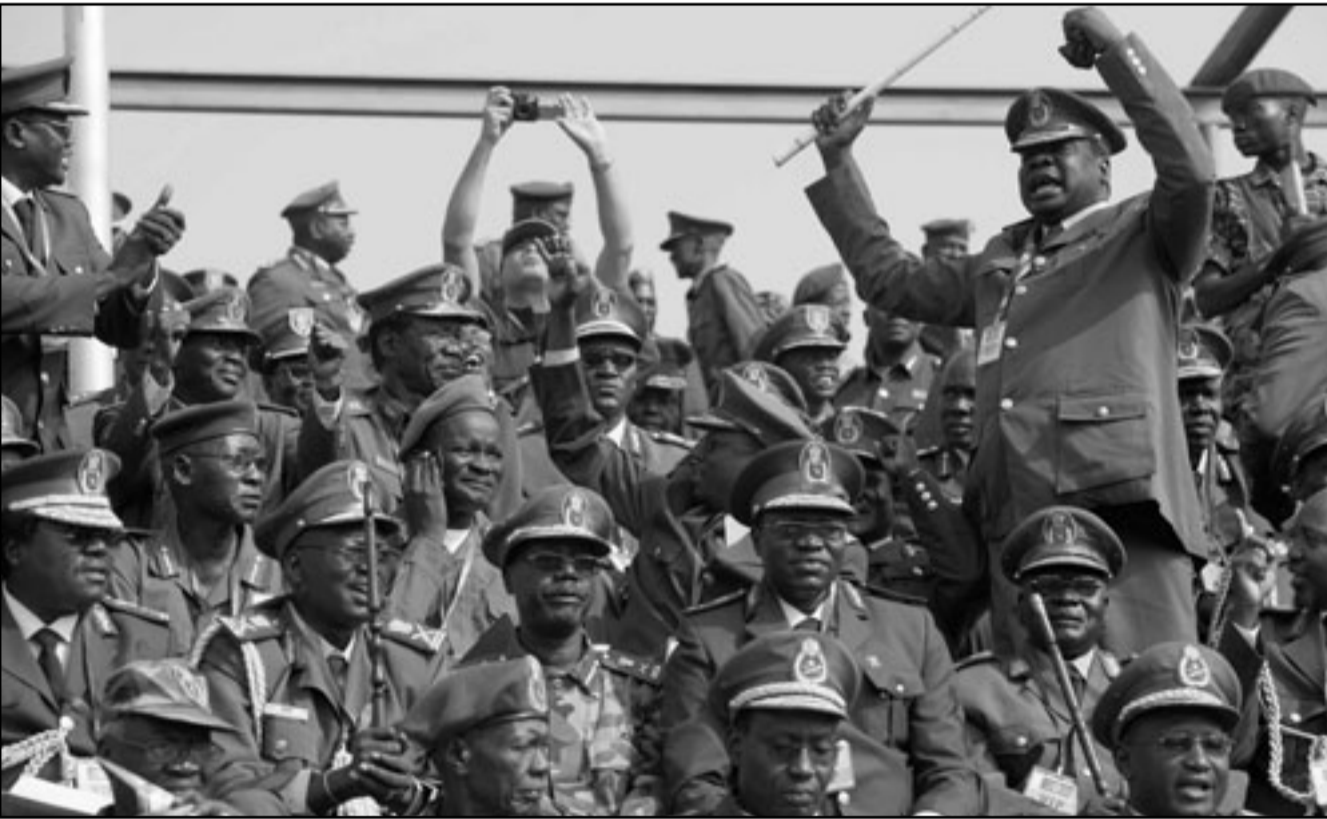
ضباط من جنوب السودان يحتفلون بأعلان دولتهم

صنعاء - يوبي اي: قال معارض يمني بان الغرب ضد إقامة دولة إسلامية يسيطر عليها رجل الدين عبد المجيد الزندانى ليصبح آية الله العظمى في اليمن. وقال صالح عام عزب الحق المعارض حسن محمد زيدى حوار مع اسبوعية «الشرايع»، امس الأحد «ام مدير المعهد الديمقراطي الأمريكي ليس كامل ابلغ احزاب المعارضة «لقاء المشرق» ان التجمع الدولي لن يسمح بان تحقق الثورة في اليمن وانتصاراً ذو يوصى الزندانى إلى الحكم». واضاف المعارض اليمني ان يسمح بان يوجد دولة جهادية في اليمن، ويعتقدون ان إذا ما انتقلت السلطة لنا كاحزاب معارضة فإن الزندانى سيكون هو آية الله العظمى». وأشار زيدى إلى ان «المشرك» رفض انتقال السلطة بسبب الخلل على مرشح لرئاسة الحكومة غير خاضع لقيادة الإحزاب باعتبار الزندانى احد قياداتها. والمع إلى ان الزندانى والغرب بشكل عام، لا يدركون التمايز بين احزاب «المشرك» وان المراقب الخارجي عندما