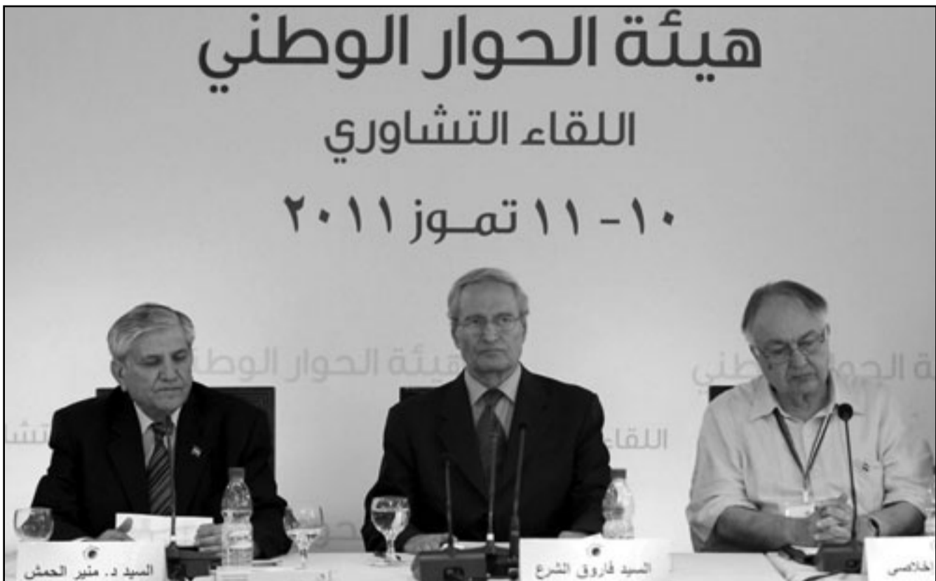
نائب الرئيس السوري فاروق الشرع يترأس اللقاء التشاوري للحوار الوطني في سورية

وطاولة الحوار هي النموذج الأمثل للحوار بالبلد من هذه الأزمة والانتقال السوري وان يعود ويساهم في بناء سورية بدلا من الذهاب الى الشارع».