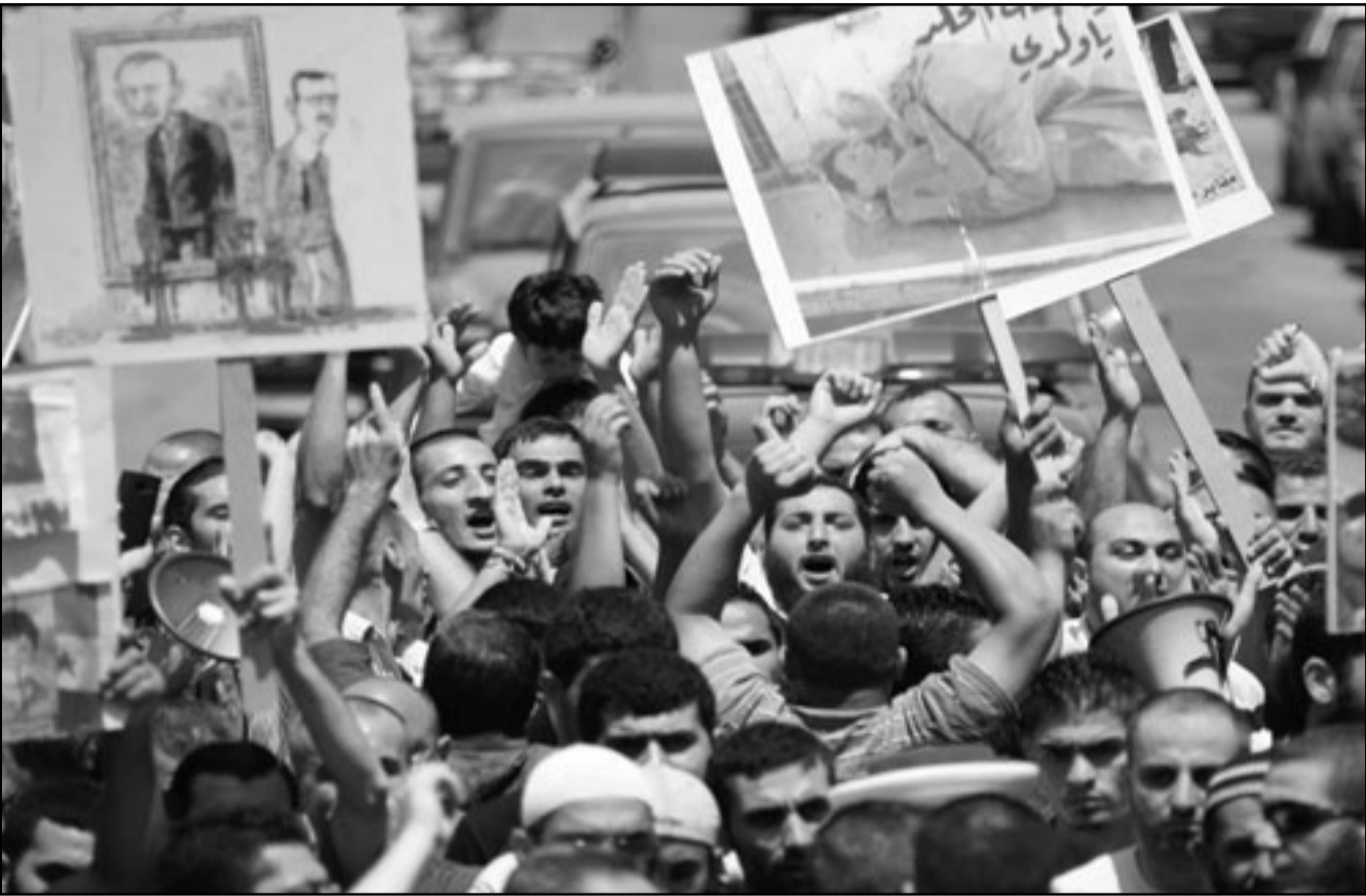
سوريون ولبنانيون يتظاهرون ضد النظام السوري في طرابلس