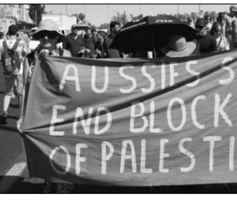
اسرائيليون وفلسطينيون يتظاهرون من اجل استقلال فلسطين

وقال الجيش في بيان إن قوات الجيش الإسرائيلي «بدأت تفصل بين المشاركين في المناوشات في محاولة لمنع المزيد من الاشتباكات». بدأت القوات تبعد المدنيين من المنطقة واتصلت بخدمة الإطفاء لإخماد الحرائق بالمنطقة. وقال الجيش في بيان إن قوات الجيش الإسرائيلي «بدأت تفصل بين المشاركين في المناوشات في محاولة لمنع المزيد من الاشتباكات». بدأت القوات تبعد المدنيين من المنطقة واتصلت بخدمة الإطفاء لإخماد الحرائق بالمنطقة.