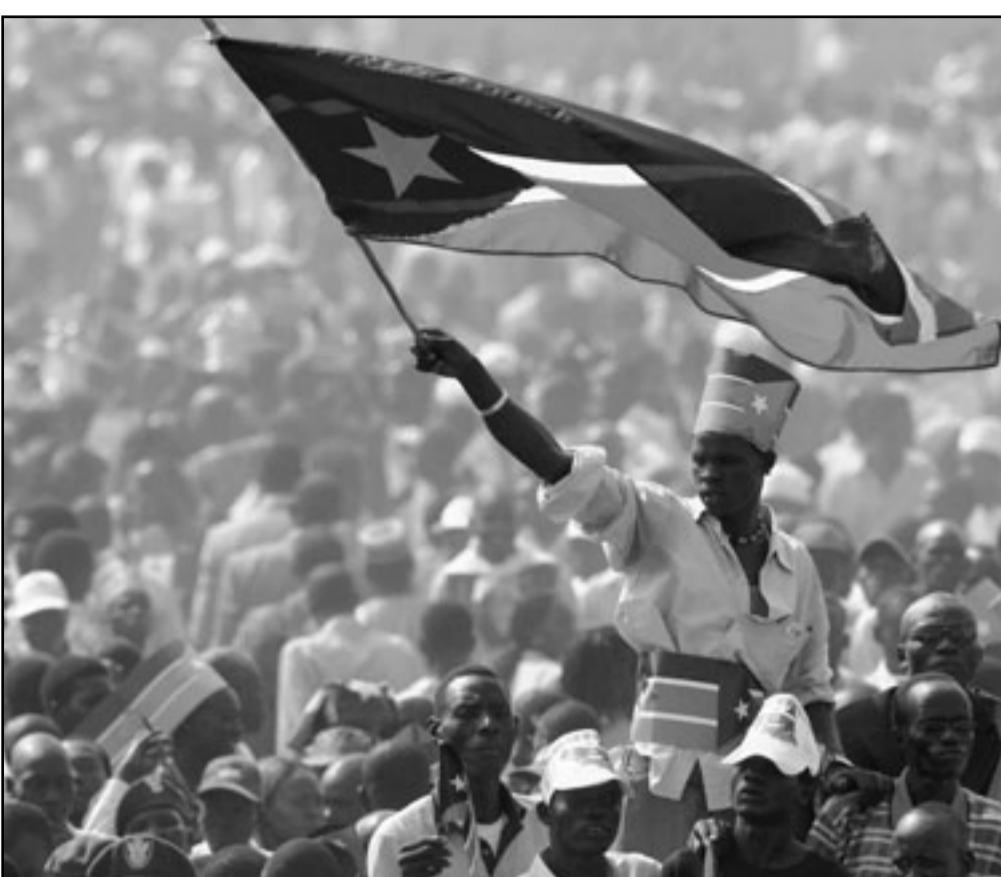
السودان الموحد تقدر بشكل متعسفي من قبل بريطانيان وفرنسا