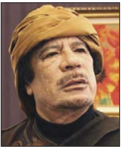
العقيد معمر القذافي

الليبي أرسل مبعوثين للتباحث في نهاية للصراع عبر التفاوض لكنه لا يزال على تحديه في العلق. واتفق اجتماع اسطنبول الذي شاركت فيه أكثر من 30 دولة وهيئة دولية على خارطة طريق يتنحى بموجبها القذافي عن الحكم وتشمل خططا لانتقال ليبيا إلى الديمقراطية تحت حكم المجلس الوطني الانتقالي.