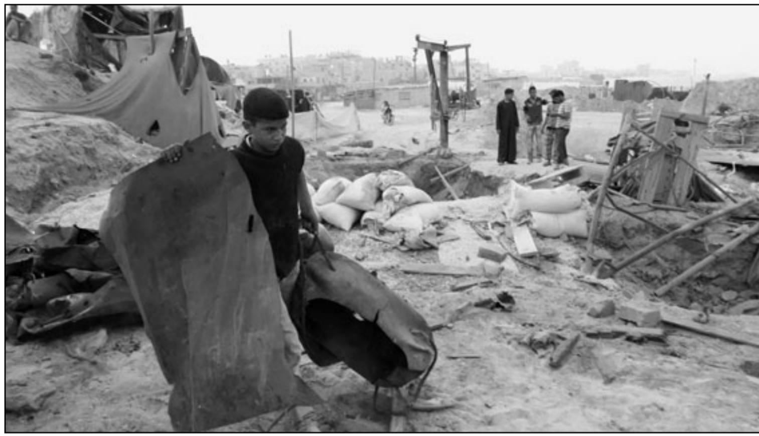
جانب من آثار العدوان الاسرائيلي على غزة