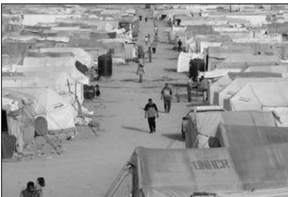
يمكن توطين اللاجئين في الدولة الفلسطينية الى جانب تعويضات وحلول انسانية