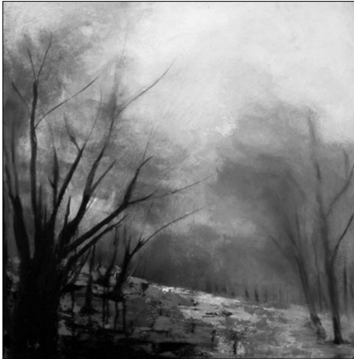
لوحة للفنانة