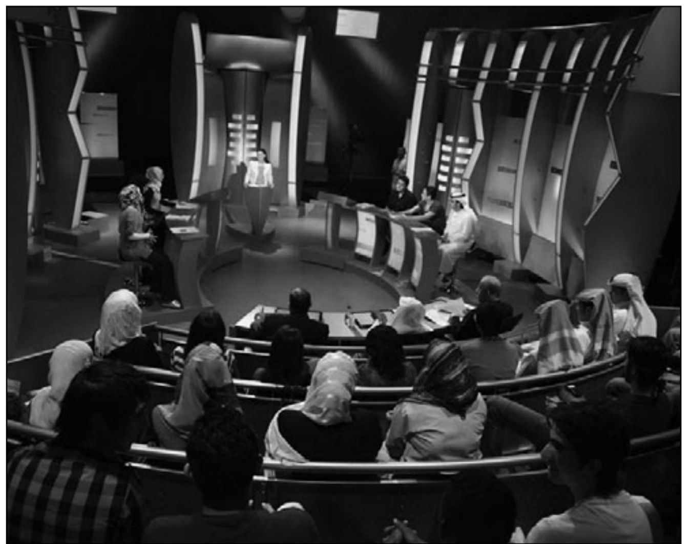
من برنامج «خير الكلام»