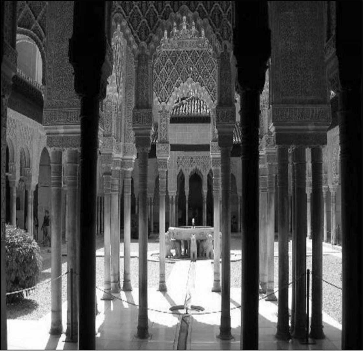
جانب من قصر الحمراء

غير أن نداء الحرية الذي هب في سوريا منذ الخامس عشر من آذار الماضي، كشف الحجاب عن المثقف أمام مجتمعه، لأن هذا النداء الذي لياه عديد من المثقفين فكانوا أول من هتف للحرية في سوق الحميدية بدمشق، دفع النظام