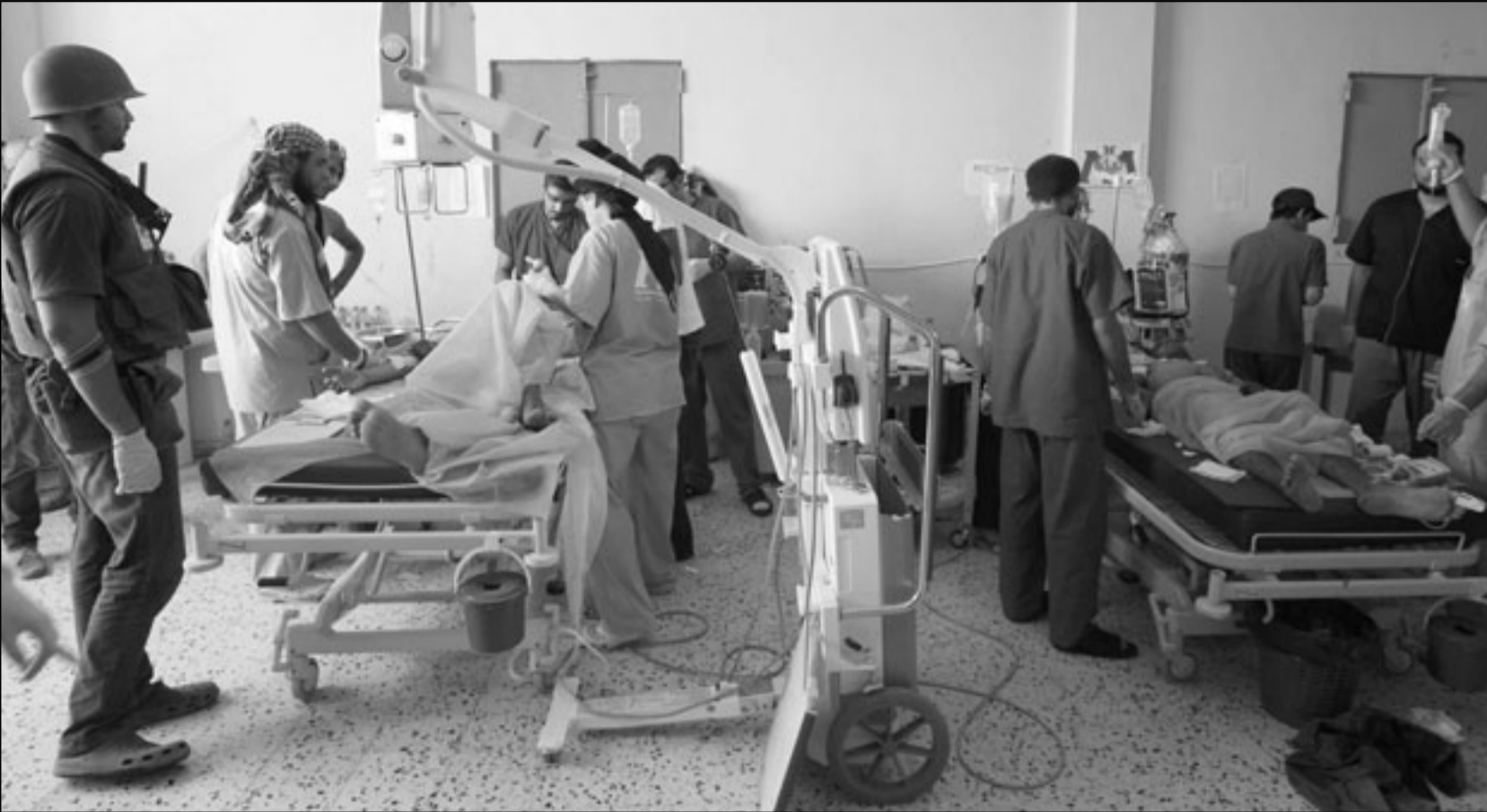
فرق طبية دولية تعالج أسرى في مستشفى ميداني قرب مصراتة مصابين من الثوار ومن كتائب القذافي أسروا في قتال قرب المدينة