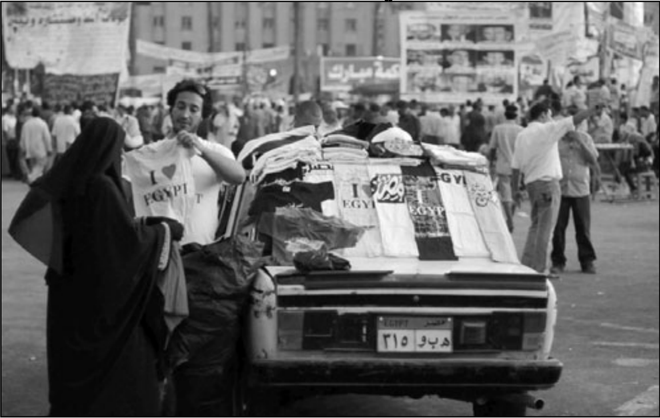
بانع في ميدان التحرير يعرض قصصاً عليها شعارات الثورة