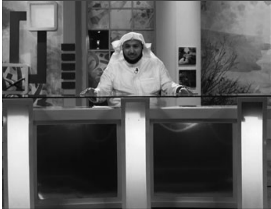
أحد البرامج الدينية على MBC1