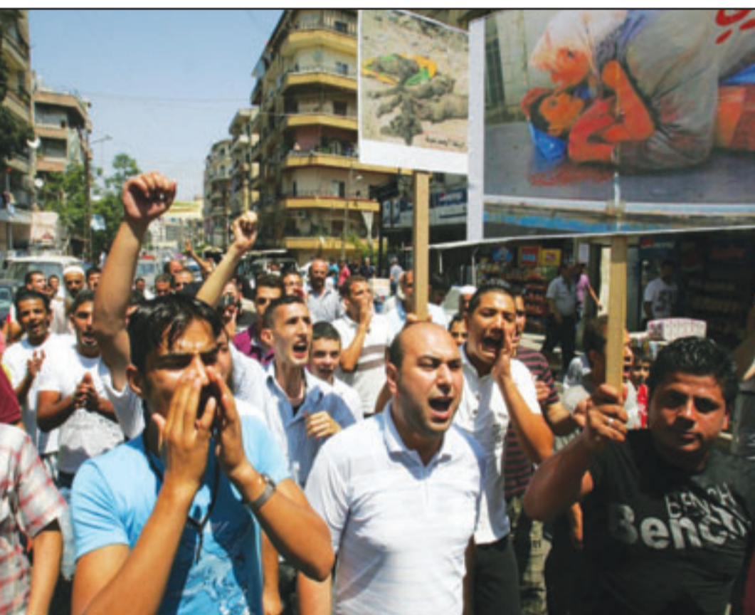
سوريون ولبنانيون يتظاهرون ضد نظام الاسد في طرابلس