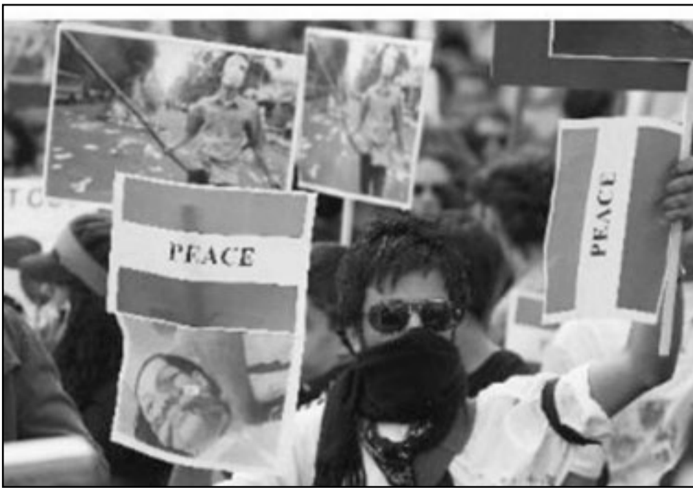
مظاهرات المعارضة الايرانية استهدفت احدي نجاد

■ نائب رئيس معهد ابحاث الامن القومي اسرائيل اليوم 20/7/2011