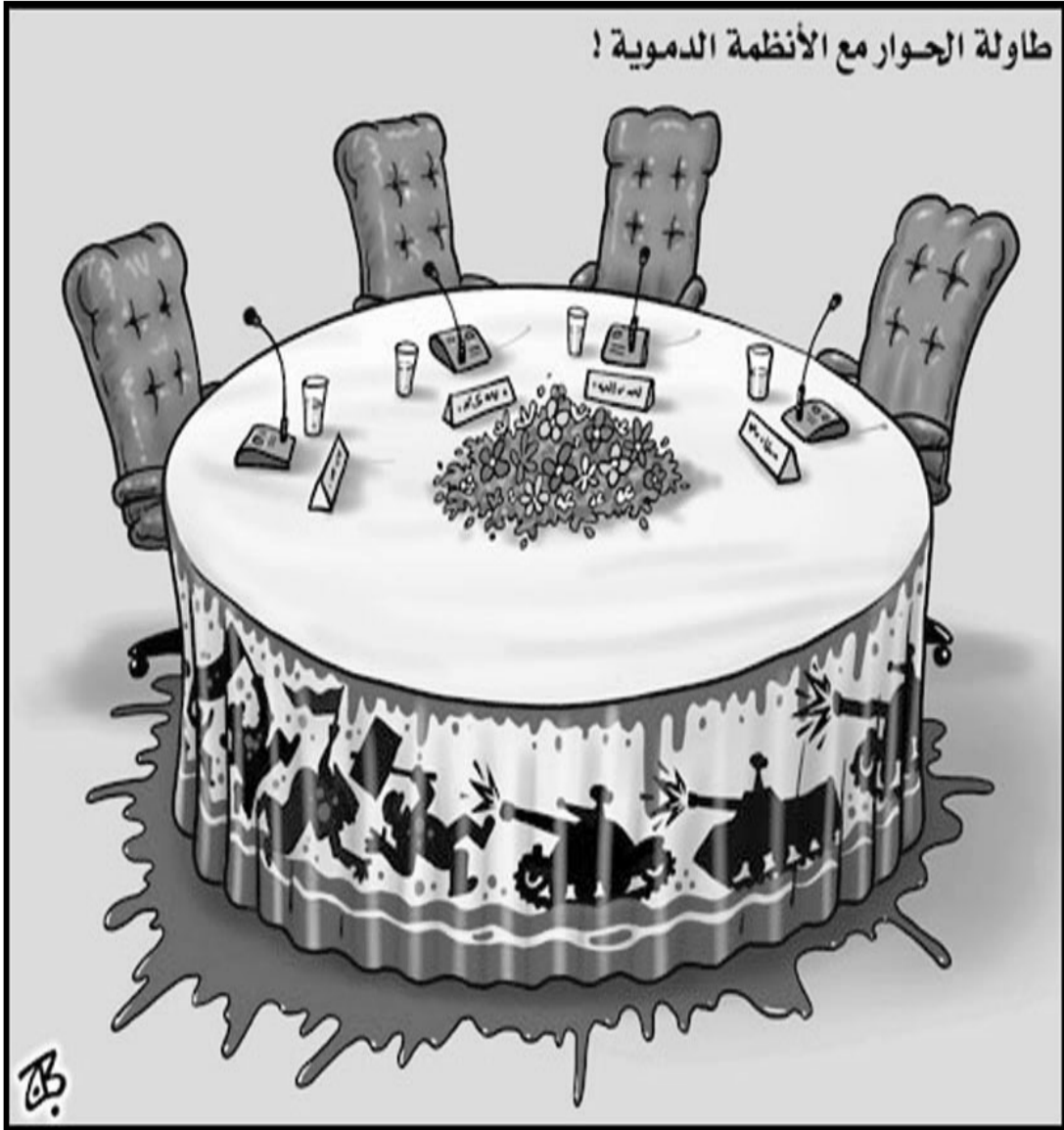
طاولة الحوار مع الأنظمة الدموية !

تطلبت إطاحة حكومة أحمد شفيق، التي عينها الرئيس مبارك في أيام حكمه الأخيرة، و لكن موجة ثانية من المظاهرات المؤلوية والاعتصامات، ولكن حكومة عصام عرف مشغولتها، والتي حمل رئيسها إلى موقعه على موجة غير سوية من الثورة، ولدت مفيدة، سواء لبروات سورية أو لرغبات سياسية لم تزل مبهمه، لم يتح لرئيس الوزراء الجديد أي قدر من الحرية في اختيار وزراء حكومته أو إدارة شؤونها. وفي صورة أو أخرى، عادت عناصر النظام السابق وعقليته للسيطرة على مقررات الدولة وتسيير شؤون البلاد، ثمة تهاون لا يخفي في محاسبة رموز الفساد المخلوطين، تشدد غريب في استخدام المحاكم