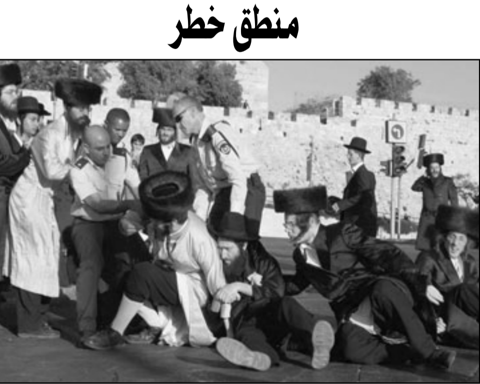
اليمين الاسرائيلي يتحدث بشكل عنصري عن خطر التزايد السكاني الفلسطيني

والتفكير والاخلاقية والاعتقاد الشخصي-أي كل ما هو روح العقيدة. يميل استبداد الاكثرية هذا الي ان يتنكر بلباس الضحية اكثر من مرة، يصعب عدم دوران العين في السماء ازاء وصف كريف مسدقت «صورة الدولة القومية الاصلية»، التي صاغتها الاكثرية على ايدي كتاب من الاقلية «سيطرة» على وسائل الاعلام والبريوقراطية. ان الاكثرية المسكينة التي تملك جميع الوسائل والسلطات لتجريد باسمي وباموال ضرايبي التي اكتسبت بدمي