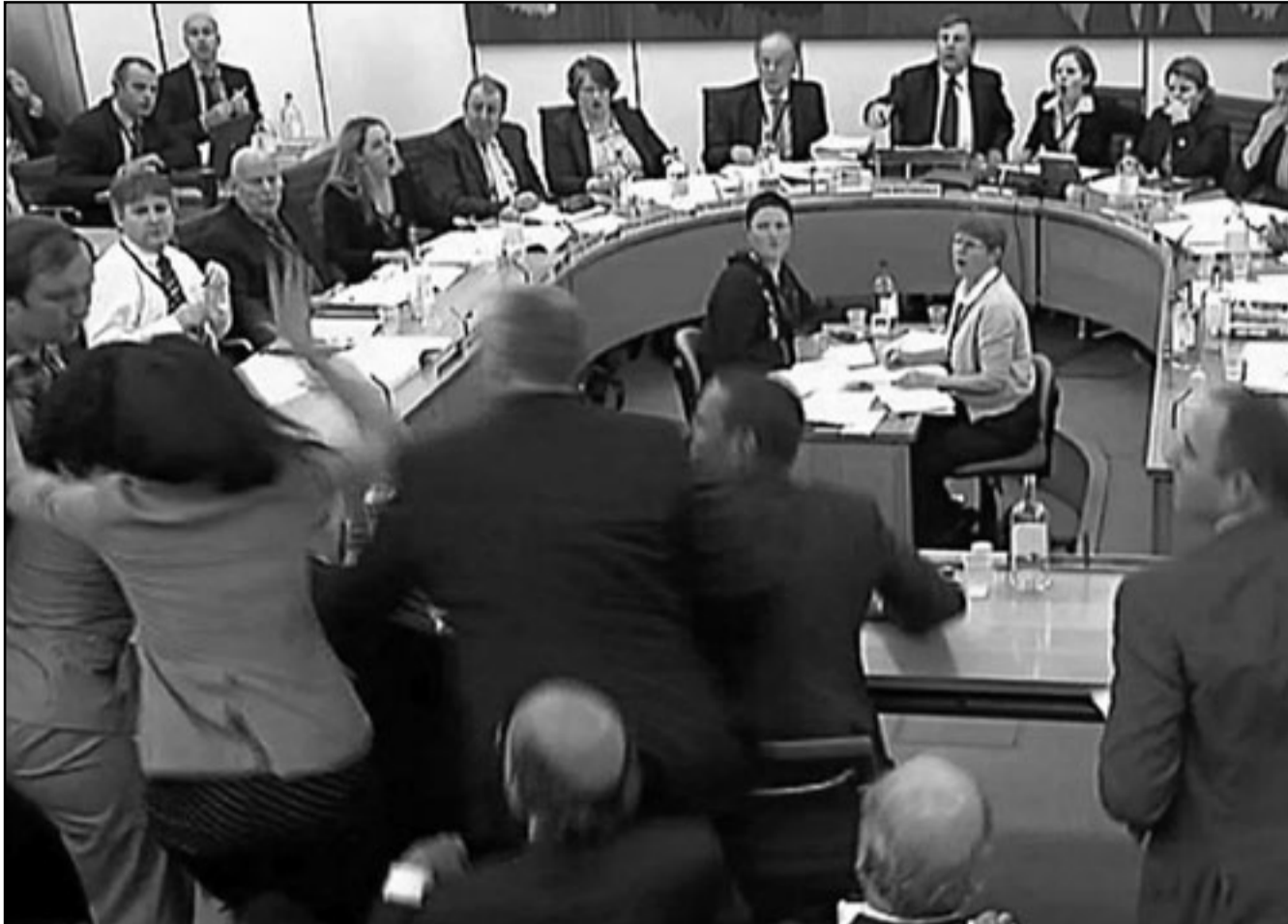
لحظة الهجوم على روبرت ميردوخ وتبدو زوجته الشابة وندي وهي تحاول الدفاع عنه

ما وصل اليه الحال من اعتماد الساسة على جمل منهم وعن مسؤولين لم يهتموا مسؤولياتهم، ولكنها لاحظت ان اللجنة البرلمانية وان حاولت ان تضغط على نوابهم الا انها لم تكن قوية بالشكل الكافي ولم تشمر عن ساعدها كما هو مطلوب. ورأت ان ميردوخ كان قادرا للحديث عن اهمية الاعلام الحر للدولة الحرة وهو ما رحبت به الصحيفة التي تناولت اعادته لتنظيم الاعلام. وانتهت ان الامر الآن في ملعب كاميرون الذي تحدث للبرلمان يوم امس، حيث تساءلت عن تأخر مكتب الحكومة في نشر المعلومات الخاصة بعلاقة كاميرون مع بروكس، وقيام نيل واليس، بتقديم الاستشارة لاندري كولسون - كلاهما محرران سابقان لنيوز أوف ذا وورلد - قبل الانتخابات العامة، حيث كان كولسون يعمل مستشارا اعلاميا للمحافظين قبل تعيينه مديرا للاعلام والاتصالات في مكتب كاميرون. كما ان هناك اسئلة تحتاج الحكومة للاجابة عليها عن السبب الذي دعا مدير طاقمه ايدليولوين نقل اليه التحذيرات القوية له من اجل ان لا يعين كولسون في مكتبه، وفي وصفه لجلسة يوم الثلاثاء «الندبندنت» ان اليوم كان يوم «المراوغة والذل»، بالعموم، ومع ذلك فاللجنة حسب الصحيفة فشلت في تحقيق ما امل منها وانتهاز فرصة عظيمة. ولكنها لا تنسى ان تذكر ان بعض الحقائق تم الكشف عنها من مسالة استمرت ساعتين منها الكشف عن تأثير سابع على السياسة، معلقة على ما قاله انه يضمني له تركه السياسيون بحاله، وهي عبارة تظهر