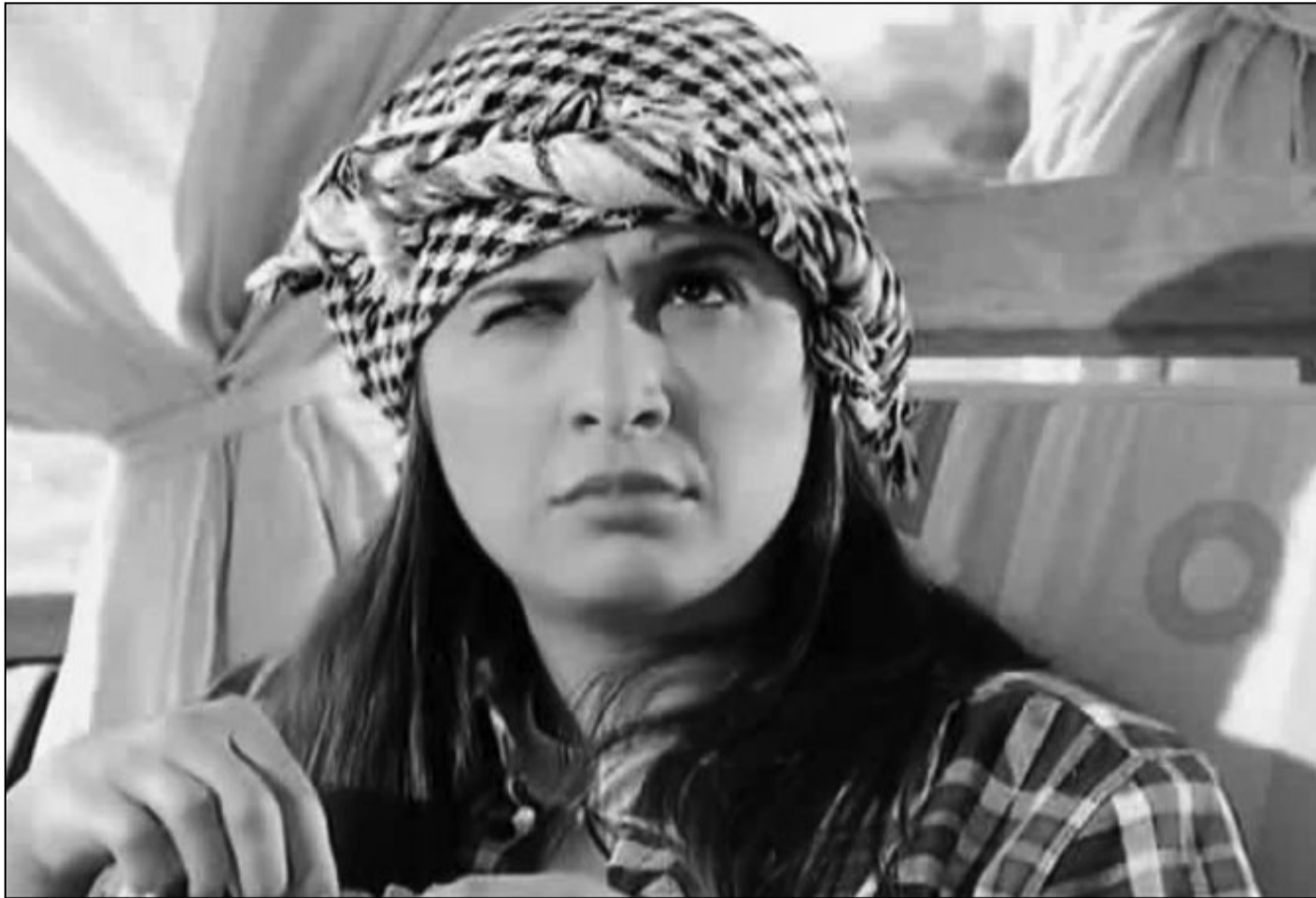
لقطة من فيلم «الثلاثة يشتغلونها»