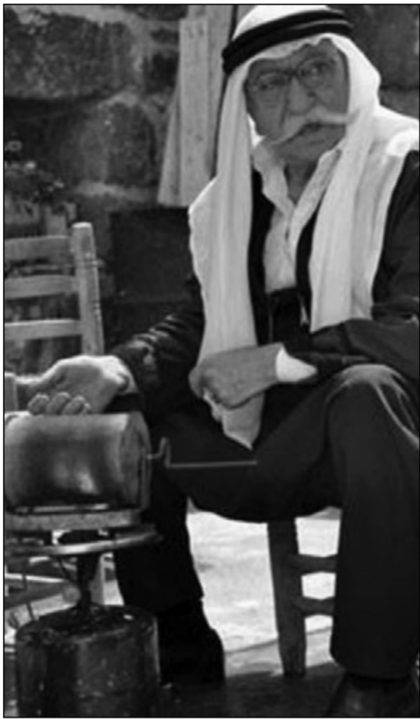
لقطة من مسلسل «الخربة»