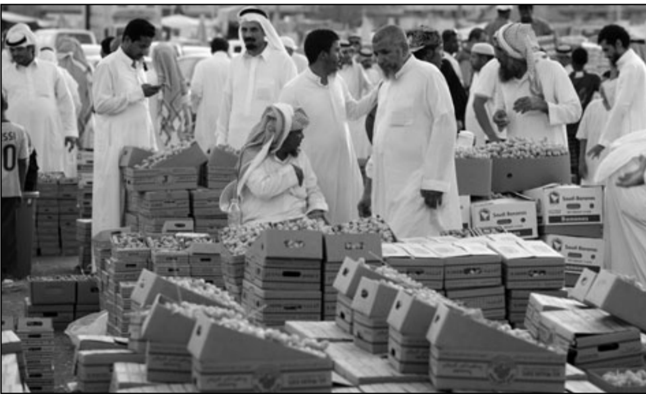
تجار سعوديون يشترون التمور عشية بدء شهر رمضان الكريم