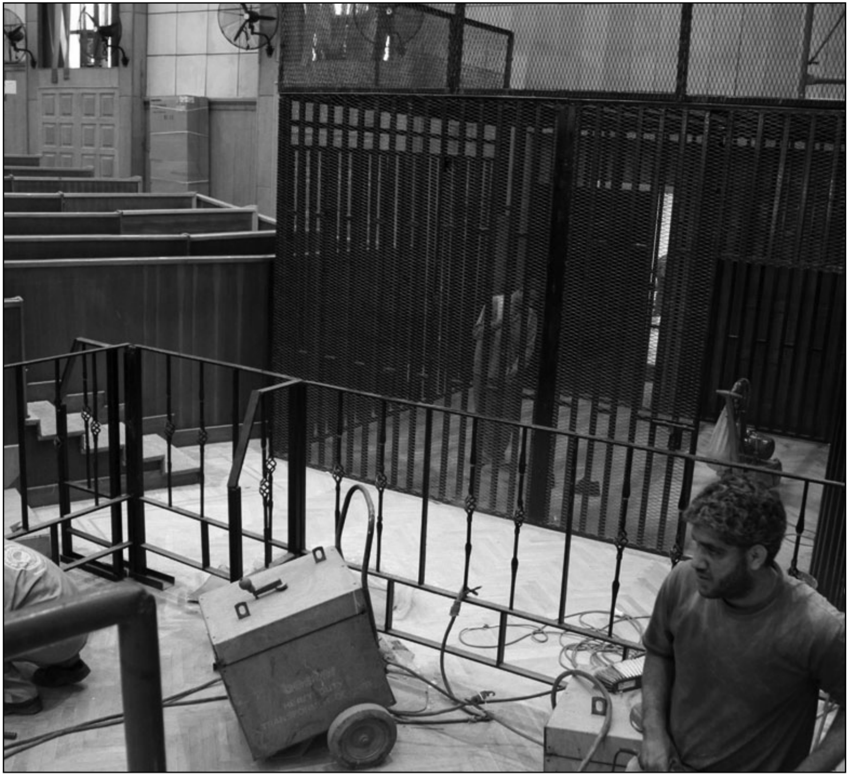
التجهيزات على قدم وساق في قاعة المحكمة التي يفترض ان يمثل مبارك فيها امام القضاء الاربعة

القاهرة - ا ف ب: أعلن الناشطون المصريون المعتصمون في ميدان التحرير الاحد عن تعليق اعتصامهم خلال شهر رمضان، الذي يبدأ في مصر الإثنين، مع العودة الى الميدان بعد عيد الفطر لمواصلة الضغط من اجل تحقيق مطالبهم، غير ان «أئتلاف شباب الثورة» أكد استمرار فعاليات سياسية خلال هذا الشهر، تشتمل «فضح وتشويه» الضباط المتهمين بقتل المحتجين خلال الثورة التي اطاحت بنظام مبارك في شباط/فبراير الماضي. ويتصم الناشطون في ميدان التحرير الذي مثل بؤرة الاحتجاجات منذ الثامن من تموز/يوليو للتنديد بطريقة تعامل المجلس العسكري الحاكم مع المرحلة الانتقالية. وفي بيان مشترك أعلن 26 حزبا سياسيا وحركة احتجاجية ان اعتصامهم الذي استمر ثلاثة اسابيع نجح في تحقيق بعض مطالبهم و«ان يتنزع عددا مهما من المكتسبات التي دفعت الثورة المصرية خطوة للامام». واضاف البيان «لكن ايماننا بان الاعتصام وسيلة وليس غاية.. قررت الاحزاب السياسية والمجموعات الشبابية تعليق اعتصامها بشكل مؤقت طيلة شهر رمضان».