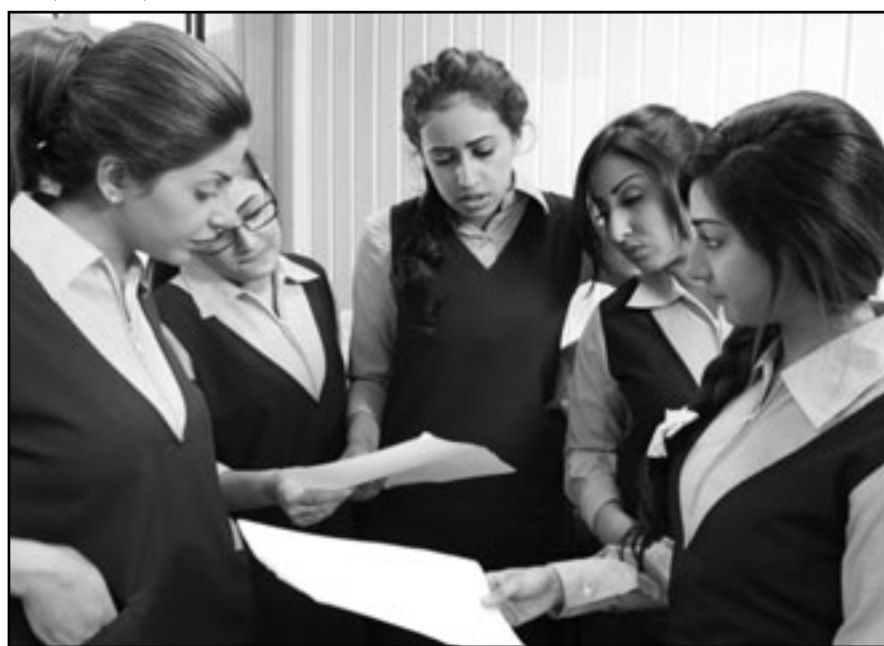
لقطة من مسلسل «بنات الثانوية»