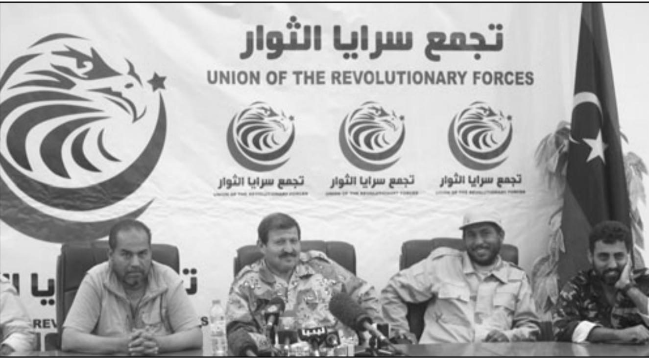
تجمع سرايا الثوار UNION OF THE REVOLUTIONARY FORCES