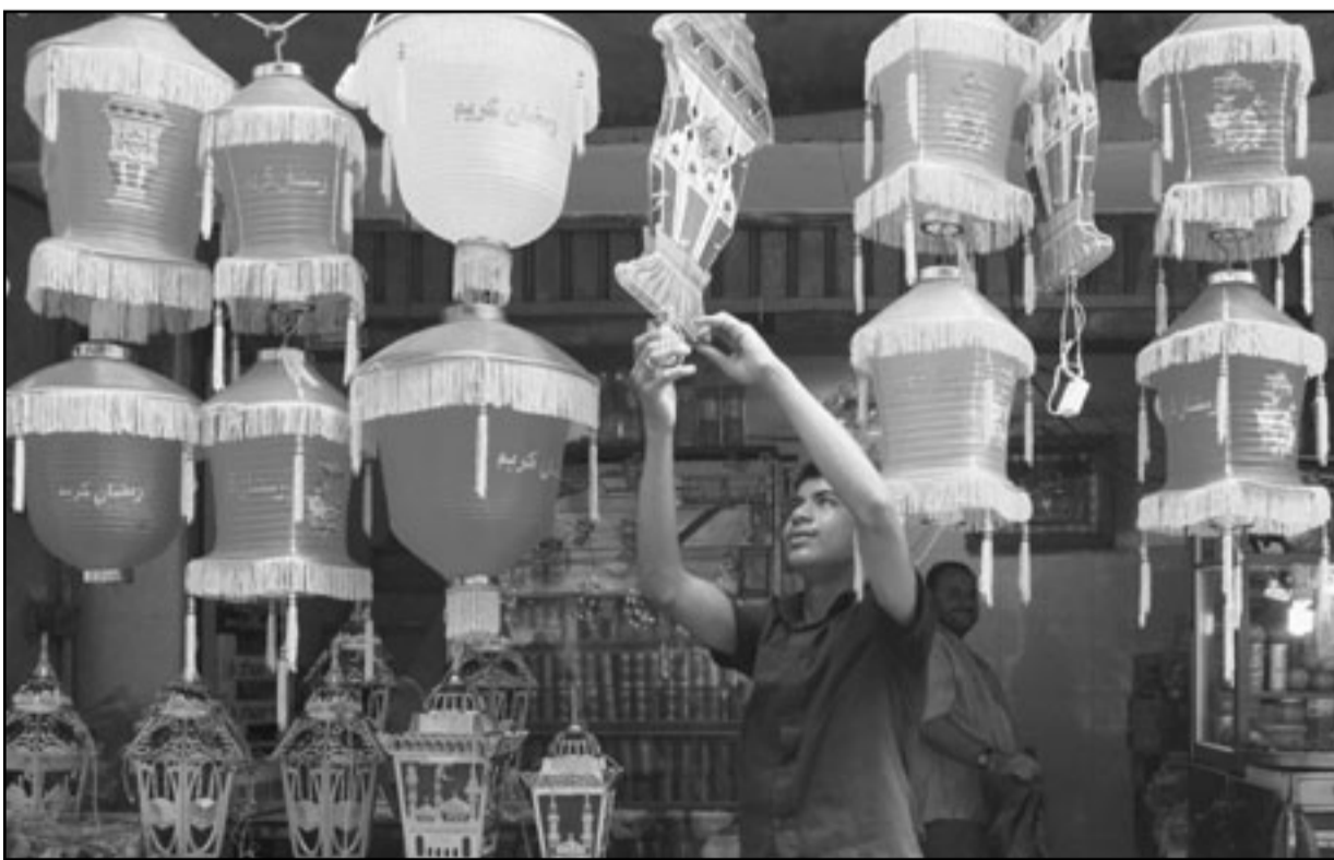
صاحب محل تجاري يعلق فوائيس الشهر الكريم في غزة

أكدت مصادر حقوقية فلسطينية الأحد بأن المرضى في قطاع غزة المحاصر منذ سنوات من قبل الاحتلال الإسرائيلي يعترضون للموت جراء نفاذ الكثير من الأدوية في القطاع. وحذر مركز سواسية لحقوق الإنسان من توقف القطاع الصحي في أي لحظة عن تقديم خدماته للمرضى في قطاع غزة بسبب نفاذ الأدوية وهو ما يعرض حياة هؤلاء المرضى للموت. وجاء تحذير مركز سواسية خلال متابعته الميدانية لمستودعات الأدوية في وزارة الصحة بغزة وإطلاعه على التقارير الصادرة منها، حيث أن القطاع الصحي يعاني من أزمة صحية صعبة للغاية منذ خمس سنوات وهي أزمة لم تشهدها المنظمة الطبية من قبل والتي وصلت ذروتها. وأصبح القطاع الصحي مهدداً بالانهيار. وأضاف المركز بأن مستودعات وزارة الصحة بغزة أصبحت شبه خالية من الأدوية والمستهلكات الطبية اللازمة بسبب نفاذ (180 صنفاً من الأدوية و149 صنفاً من المستهلكات الطبية إلى الآن) بالإضافة إلى (50 صنفاً من الأدوية و70 صنفاً من المستهلكات) ستنتفد خلال أقل من ثلاثة أشهر) وهي من الأدوية الضرورية واللازمة لمرضى السرطان والدم المرضى بالتلاسيميا، بالإضافة إلى أنواع عديدة من حليب الأطفال العلاجية. وأشار المركز في بيان صحفي إلى ان تقادم هذه الأدوية يأتي نتيجة تعنت الاحتلال الإسرائيلي ولتعمد إغراق المعابر والنفاذ على قطاع غزة وقرضه حصاراً ظلماً منذ أكثر من خمس سنوات وحرمان المواطنين الفلسطينيين من حقهم في الحياة والعلاج وتعهد تعريض حياتهم للموت، الأمر الذي يتنافى وكافة القوانين والمواثيق الدولية وخاصة الإعلان العالمي لحقوق الإنسان والعهد الدولي الخاص بالحقوق الاجتماعية