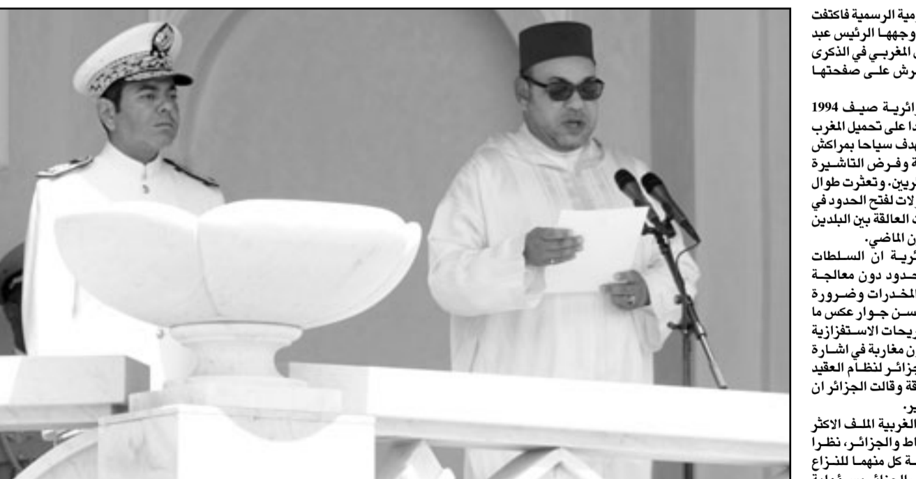
العاهل المغربي الملك محمد السادس أثناء لقاءه خطابه في المغرب امس

اما صحيفة «المجاهد» اليومية الرسمية فاقتعت بنشر رسالة التهئة التي وجهها الرئيس عبد العزيز بوتفليقة الى العالم المغربي في الذكرى الثانية عشرة لتوليه العرش على صفحاتها الاخيرة. واغلقت السلطات الجزائرية صيف 1994 الحدود البرية مع الجزائر ردا على تحميل المغرب مسؤولية هجوم مسلح استهدف سباحا براكش لاجهزة الامنية الجزائرية وفرص التاثيرية المسببة على المواطنين الجزائريين. وتعدت طوال السنوات الـ17 الماضية محاولات لفتح الحدود في اطار تسوية شاملة للملفات العالقة بين البلدين ويعود لسببنايات القرن الماضي. وقالت الصحف الجزائرية ان السلطات الجزائرية ترفض فتح الحدود دون معالجة شاملة لقضايا التهريب والمخدرات وضرورة التهاج الرباط لسياسة حسن جوار عكس ما يحدث حاليا من خلال التصريحات الاستفرازية 1994 في اعدادة نفذه متطرفون اسلاميون في احد فنادق مراكش (جنوب المغرب) ونسبته الرباط لاجهزة الاستخبارات الجزائرية. وأشارت الصحيفة على غرار ليربيته الى ان «ما هو جديد في المقابل، هي الارادة التي ابداهها (الملك) في المبادرة بسوية كافة المشاكل العالقة» وهو موقف الصريح الذي ما افادت الصحفقات. ان صحيفة الشرق اليومية رات في خطاب «محاولة اخرى لخياطة الجزائر امام الرباط العالم العالقي»، وهذه المرة الثانية في ظرف شهر يتطرق فيها العاهل المغربي الى فتح الحدود في اشارة الى رسالة الملك في الحد الصد في الحاسن من تموز/يوليو بمناسبة عيد الاستقلال بين البلدين.