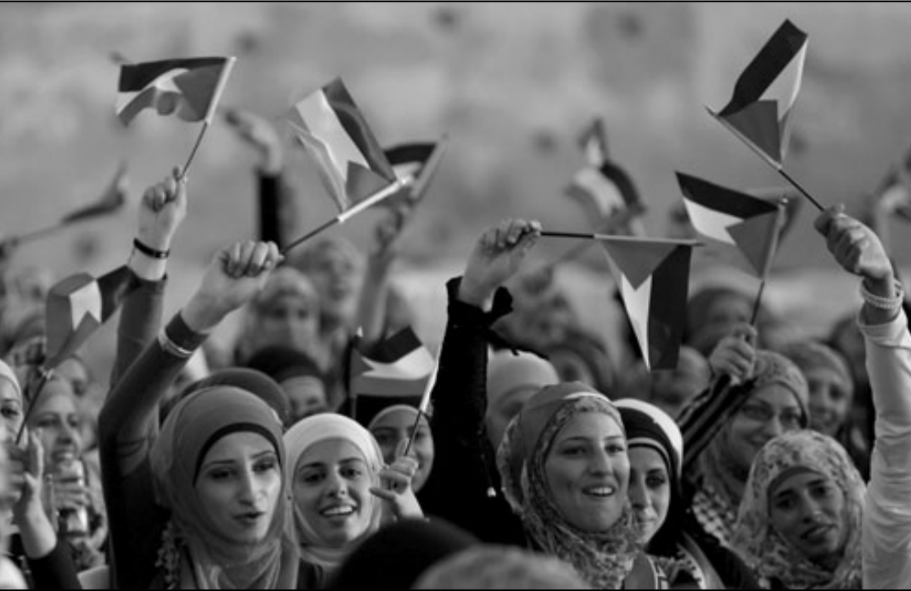
طالبات يولحن بأعلام فلسطينية خلال حفل تخرجهن في مدينة جنين

وقال «يجب إعادة طرح القضية الوطنية باعتبارها قضية تحرر وطني وقضية صراع مع الاحتلال بعد أن جرى تصوير عملية الصراع مع الاحتلال ومحاولات جادة من أجل واقع جديد لا يقدم للفلسطينيين أكثر من مجرد حذات ذاتي...» وأكد أن التوجه للامم المتحدة يعد «فرصة للتوحد