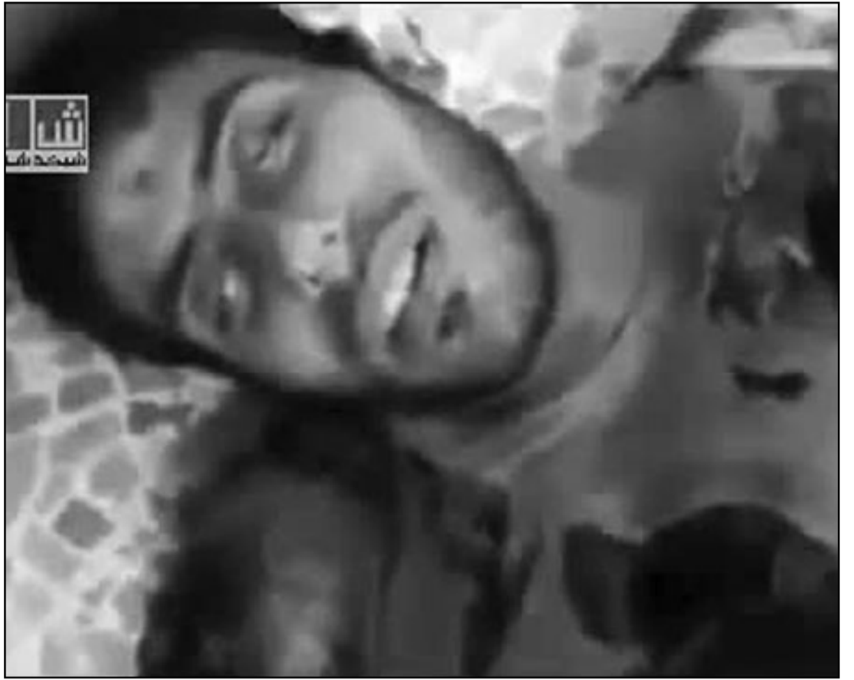
جمان شهيد بعد اقتحام القوات السورية لمدينة حماة

الامن اعتقلت أكثر من 300 شخص في هذه المدينة التي شهدت انقطاعا تاما للكهرباء والاتصالات.